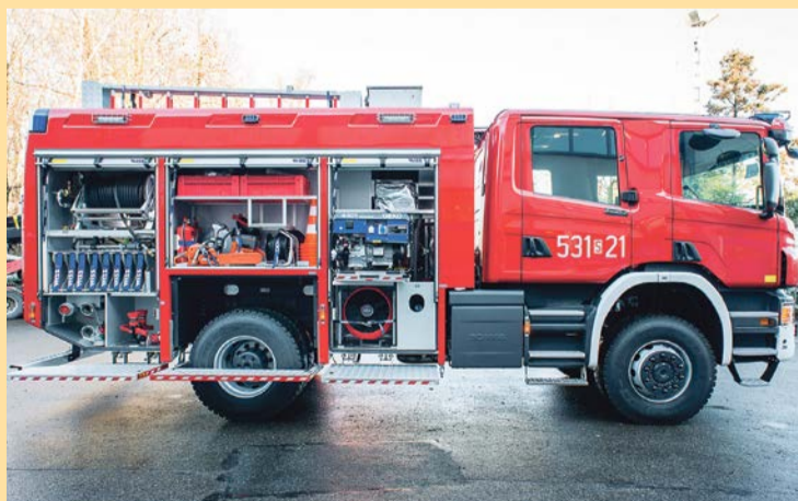
Tego typu samochód ratowniczo-gaśniczy będzie służył strażakom-ochotnikom ze Starej Wody

- Udało nam się uzyskać dofinansowanie w wysokości 85 procent ze środków Europejskiego