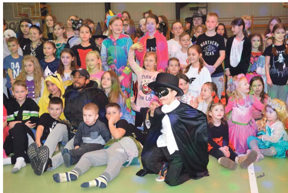
Niech nas zobaczą ci, którzy nie przyszli