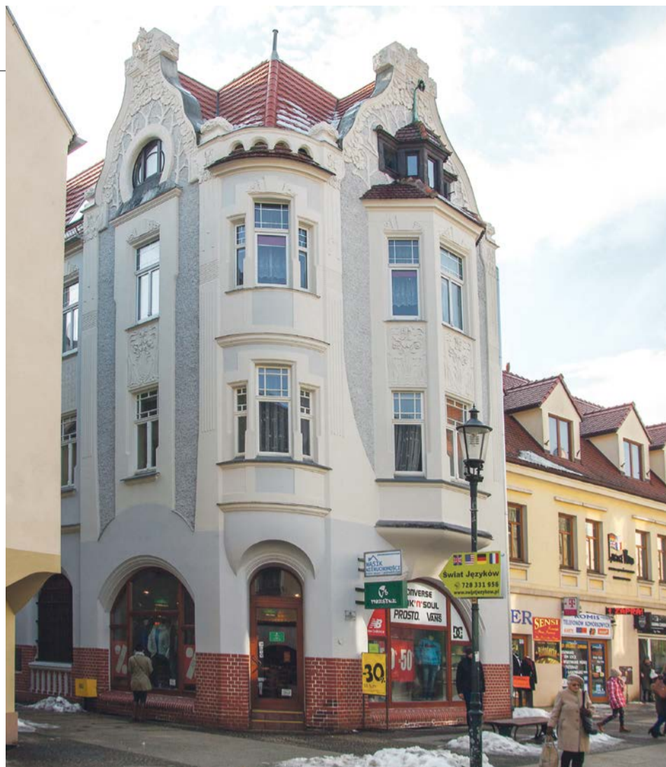
Piękna secesyjna kamienica przy ul. Chrobrego została odnowiona w ubiegłym roku dzięki dofinansowaniu z kasy miejskiej

Remont obiektu zabytkowego to nie to samo, co odnawianie budynków współczesnych. Te sprawy są zwykle o wiele bardziej kosztowne i wymagają opinii konserwatora zabytków. Bez dofinansowania z miasta