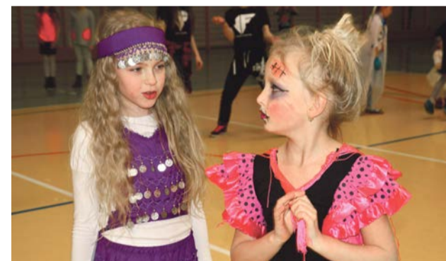
Nieźle wyglądasz w tym stroju