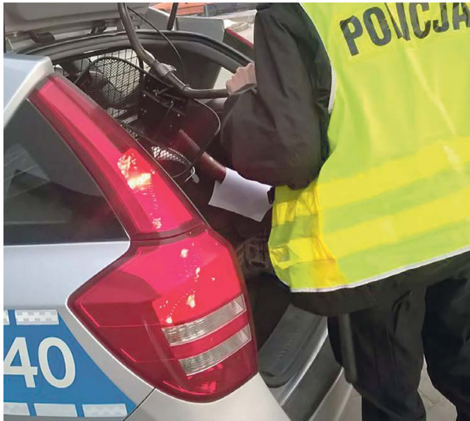
Złodziejowi nie udało się kradzież. Rower trafi do właściciela

Rower został zabezpieczony przez policjantów i czeka na prawowitego właściciela. Za kradzież roweru mężczyzna odpowie przed sądem. TEJ