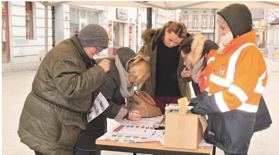
Mieszkańcy już zagłosowali. Teraz trzeba poczekać w realizację zwycięskich projektów

Kolejną inwestycją będzie kompleksowa modernizacja placu zabaw przy ul. Staffa. W ramach budżetu obywatelskiego wykonana zostanie renowacja drogi pomiędzy ulicami Łużycką i Robotniczą. Mieszkańcy ul. Wiśniowej ucieszą się z nowego chodnika oraz oświetlenia. Ostatni projekt przyjęty do realizacji dotyczy ul. Popławskiego. Tam wymieniona zostanie część nawierzchni ciągów pieszych z kostki granitowej na płyty granitowe. To zapewne ukłon w stronę pań w butach na wysokim obcasie. ATB