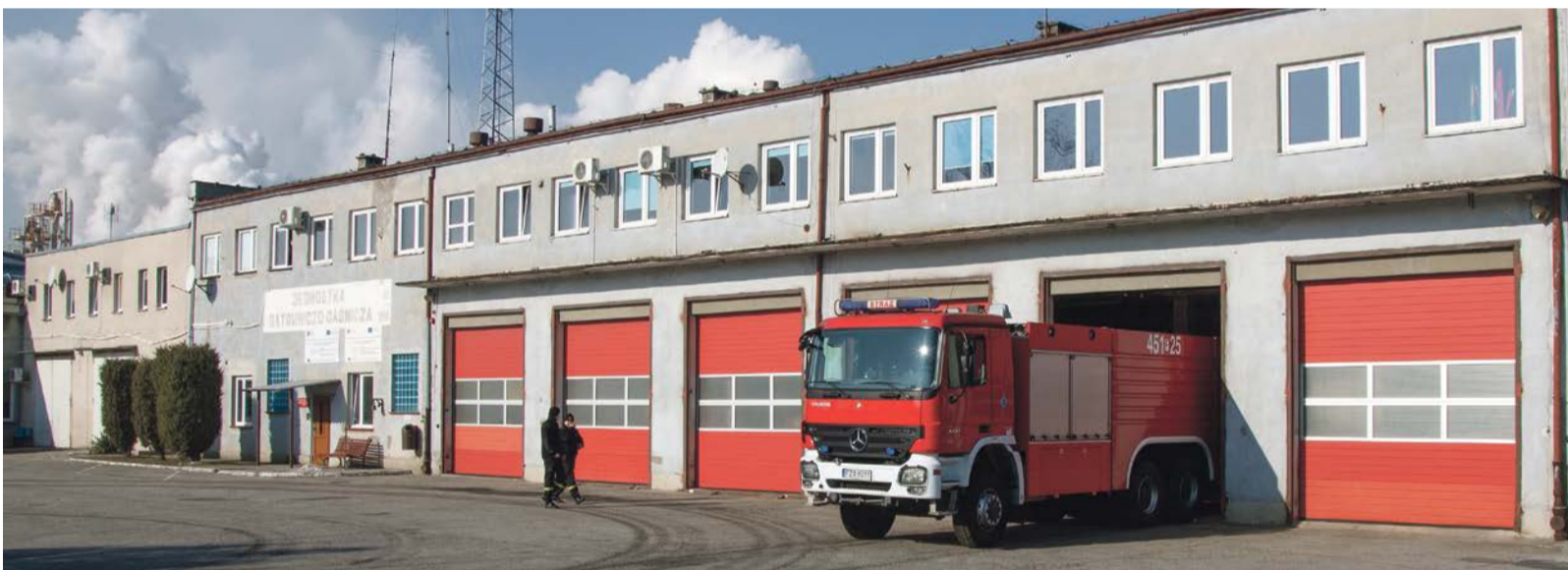
Budynek straży pożarnej przy ulicy Serbskiej pęka w szwach