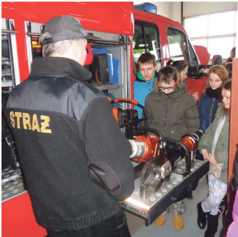
W lubskiej strażnicy można było obejrzeć między innymi specjalistyczny sprzęt do ratownictwa drogowego