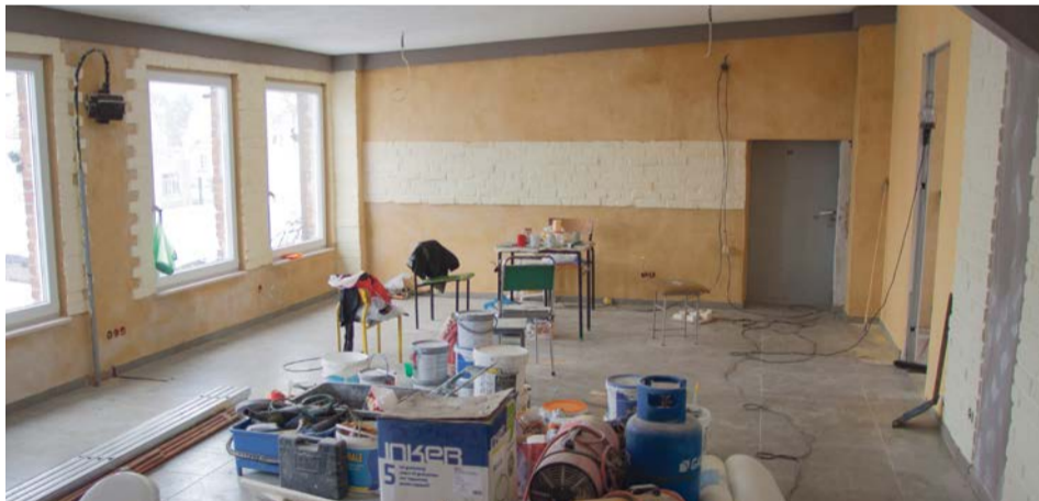
Tu była kiedyś kompletna ruina. Krok po kroku, pomieszczenie zmieniało swój wygląd