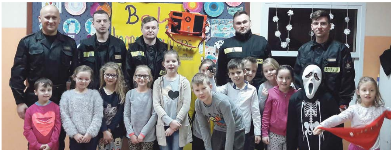
Wizyta strażaków w Szkole Podstawowej nr 2 w Lubsku

wową nr 2 w Lubsku oraz świetlice w Tucholi Żarskiej i Mierkowie. Dzieci w trakcie spotkań ze strażakami miały okazję obejrzeć sprzęt ratowniczy i zapoznać się z zasadami udzielania pierwszej pomocy. Z feryjnej oferty strażaków skorzystały też dzieci z Powiatowego Domu Dziecka w Lubsku, które zwiedziły lubską strażnicę. Na miejscu mogły obejrzeć wozy bojowe oraz przymierzyć stroje, w których strażacy wyruszają na akcje. ATB