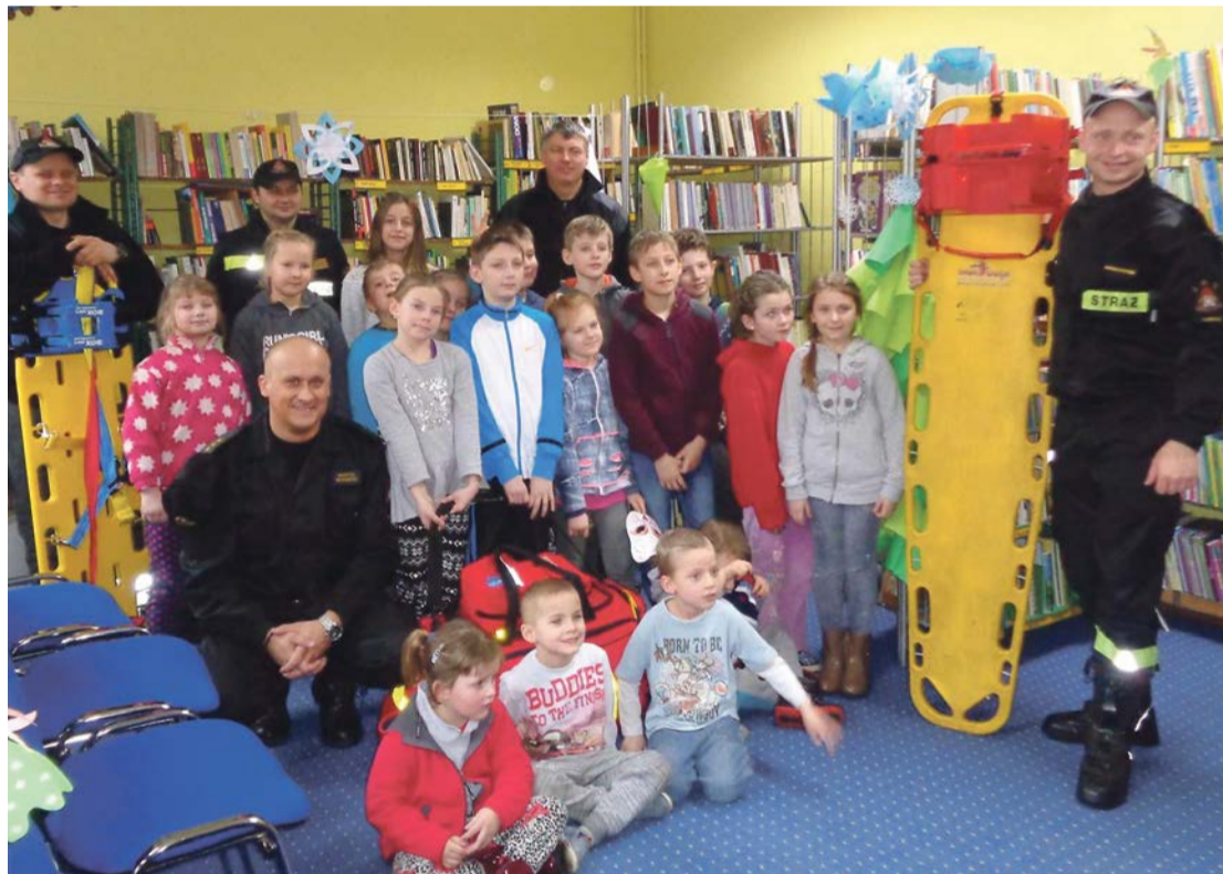
Dzieci w Mierkowie uczyły się podstaw pierwszej pomocy