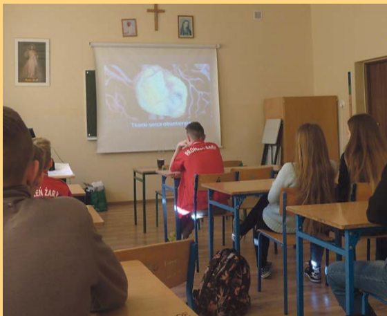
Uczniowie poszerzyli swoją wiedzę z zakresu cyberprzemocy

Bardzo ważne, aby przed umieszczeniem jakiegokolwiek komentarza dwa razy zastanowić się nad jego treścią i nie dać ponieść się chwilowym emocjom. TEJ