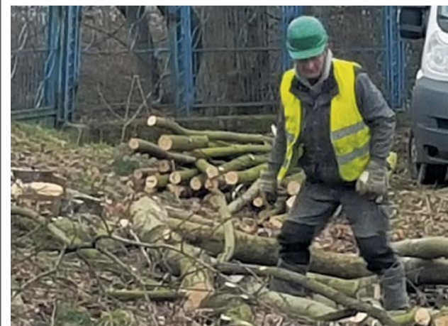
Nie każde drzewo można bezkarnie ścinać

Każdy, kto zechce usunąć drzewo lub krzew, które są położone na terenie wpisanym do rejestru zabytków układów urbanistycznych lub ruralistycznych także powinien uzyskać pozwolenie konserwatorskie. Jednak w tym przypadku uzyskanie pozwolenia będzie konieczne wyłącznie w konkretnym przypadku. Dotyczy tylko wycinki lub zabiegów pielęgnacyjnych zaprojektowanej zieleni, stanowiącej element historycznego układu urbanistycznego lub ruralistycznego, albo zieleni, która została wymieniona w decyzji o wpisie do rejestru. PAS