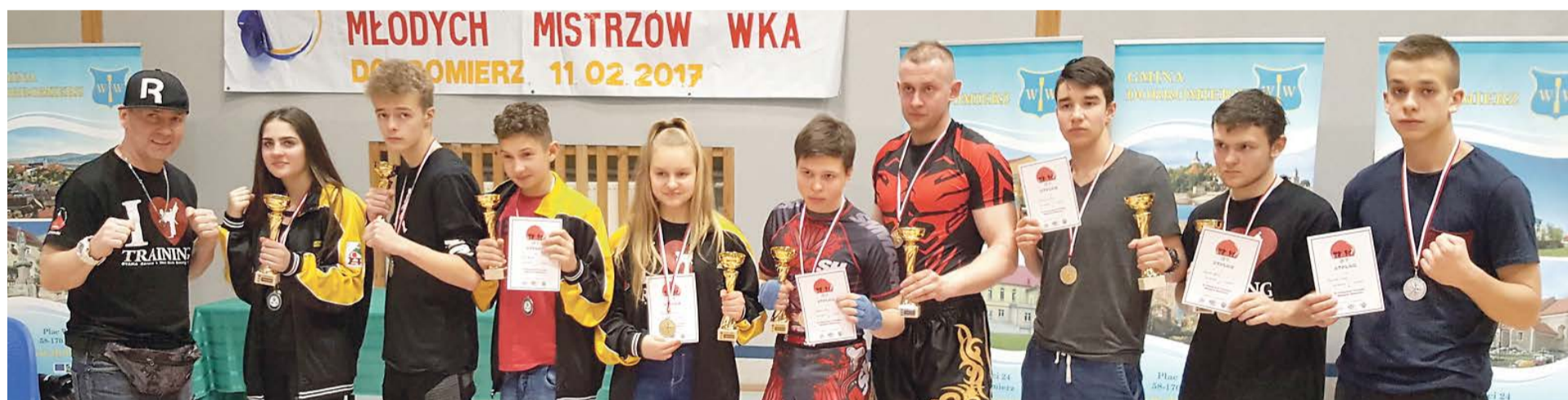
fot. Agnieszka Tomaszewska