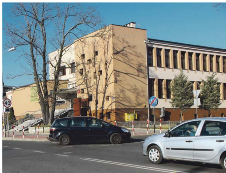
Klientom ZUS przepisy mają być przedstawiane w prosty sposób i najlepiej „własnymi słowami”

Urzednicy ZUS podkreślają, że badania opinii publicznej prowadzone przez firmę Millward Brown wskazują, że wprowadzane zmiany zyskują aprobatę klientów. W badaniach doceniono w szczególności nową grafikę, redukcję liczby informacji do wypełnienia, proste komunikaty i zrozumiały język, jakim operują nowe wnioski. PAS