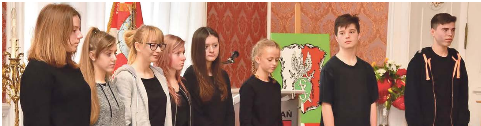
Program artystyczny przygotowali gimnazjaliści. Młodzież z Zespołu Szkół nr 1 otrzymała także dyplomy za udział w konkursie literackim i plastycznym