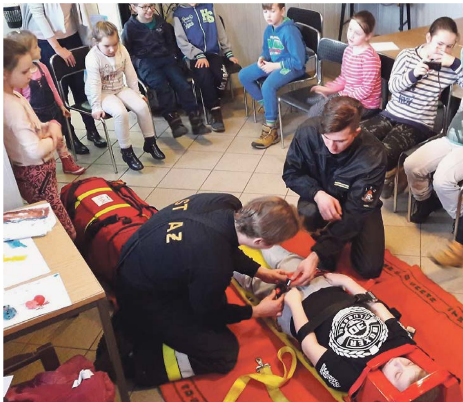
Niegdzy nie wiadomo, kiedy może przydać się wiedza na temat działań ratujących życie