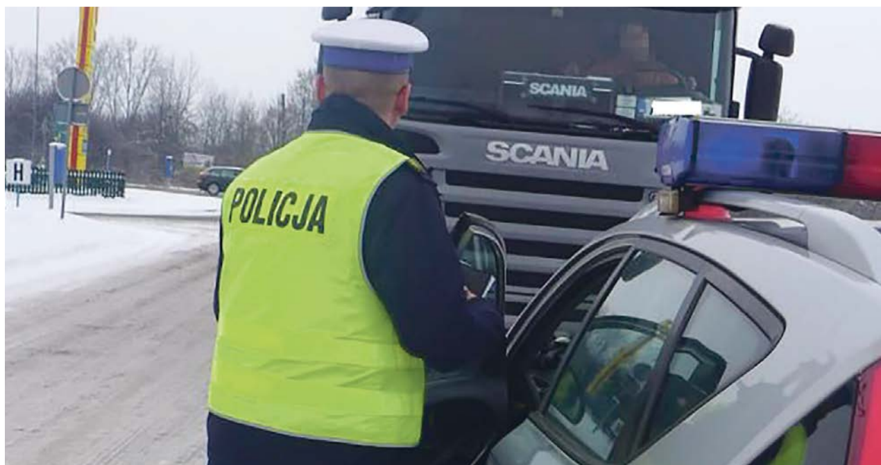
Rowerzyści muszą zachować szczególną czujność przy kontakcie z kierowcami tirów

Mundurowi w szczególności zwracali uwagę na wykroczenia popełniane przez kierujących wobec pieszych oraz wykroczenia popełniane przez pieszych i rowerzystów. Akcja, która realizowana jest cyklicz-