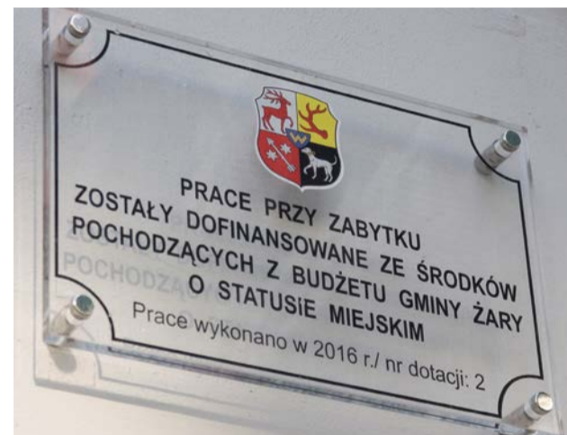
W mieście można natknąć się na coraz więcej takich tabliczek informacyjnych