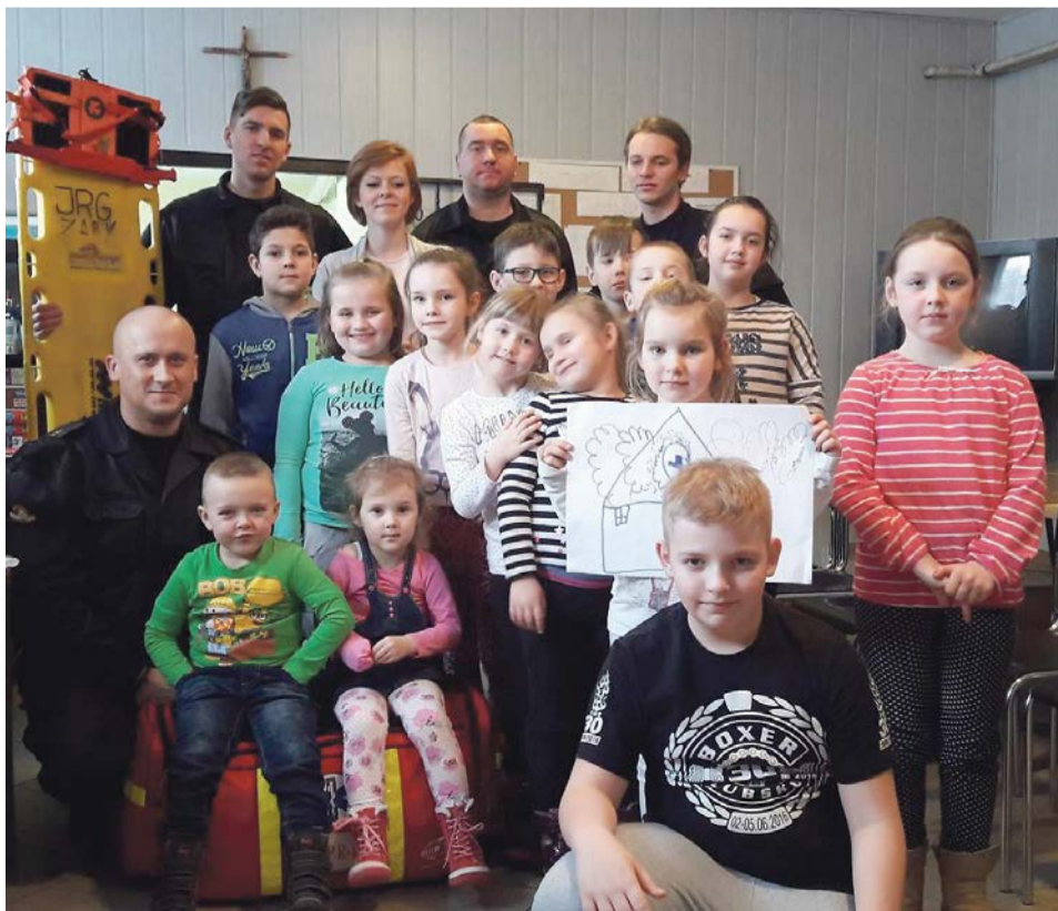
Strażacy zawitali również do świetlicy w Tucholi Żarskiej