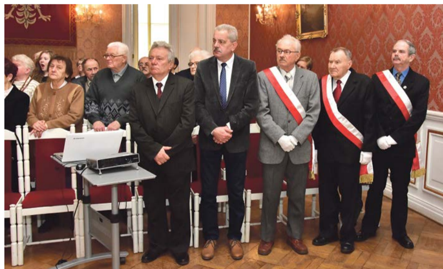
Sybiracy i zaproszeni goście wspólnie mogli powrócić do historii dzięki prezentacji multimedialnej