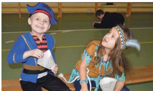
Prażona kukurydza poprawia humor

Bal był ukoronowaniem programu ferii zimowych, który przygotowały różne placówki, instytucje, organizacje i stowarzyszenia. PAS