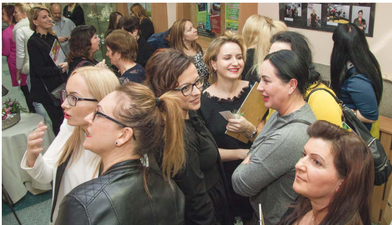
Zauważone i docenione. Podsumowanie akcji „Żarskie kobiety kobietom”