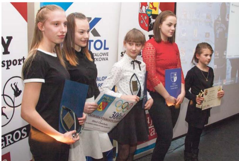
Najlepsze młode zapaśniczki Agrosu