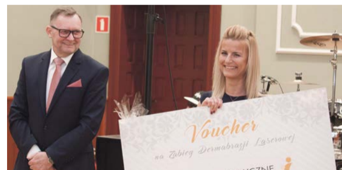
Prezenty - niespodzianki cieszą najbardziej