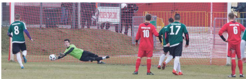
Nowosolski bramkarz nie obronił rzutu karnego fot. Andrzej Buczyński

Nowosolanie nie wykorzystali okazji pod bramką Promienia fot. Andrzej Buczyński