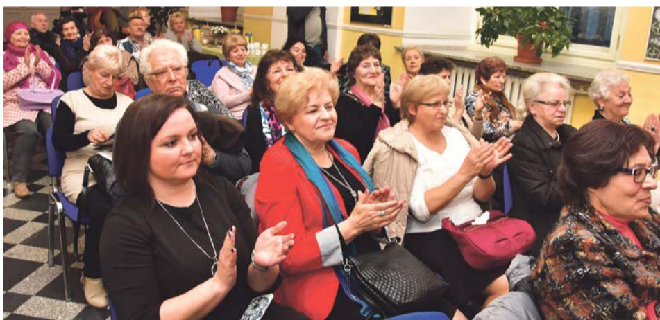
Publiczność dopisała. Nie zabrakło koleżanek i znajomych