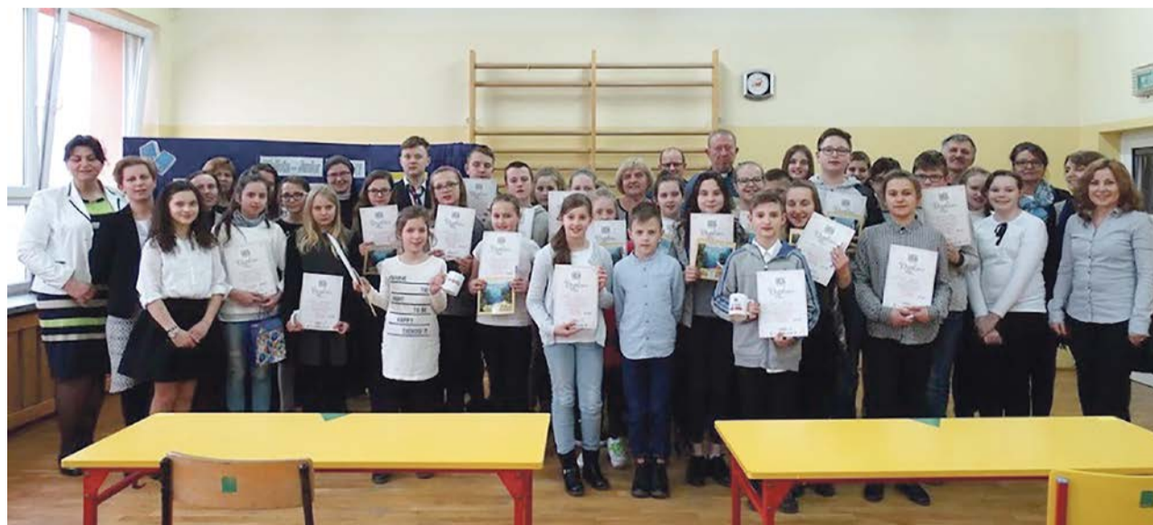
Prawdziwych znawców Ewangelii św. Jana nie brakuje

Spośród grona 30 uczestników wyłoniono 10 finalistów, któ-