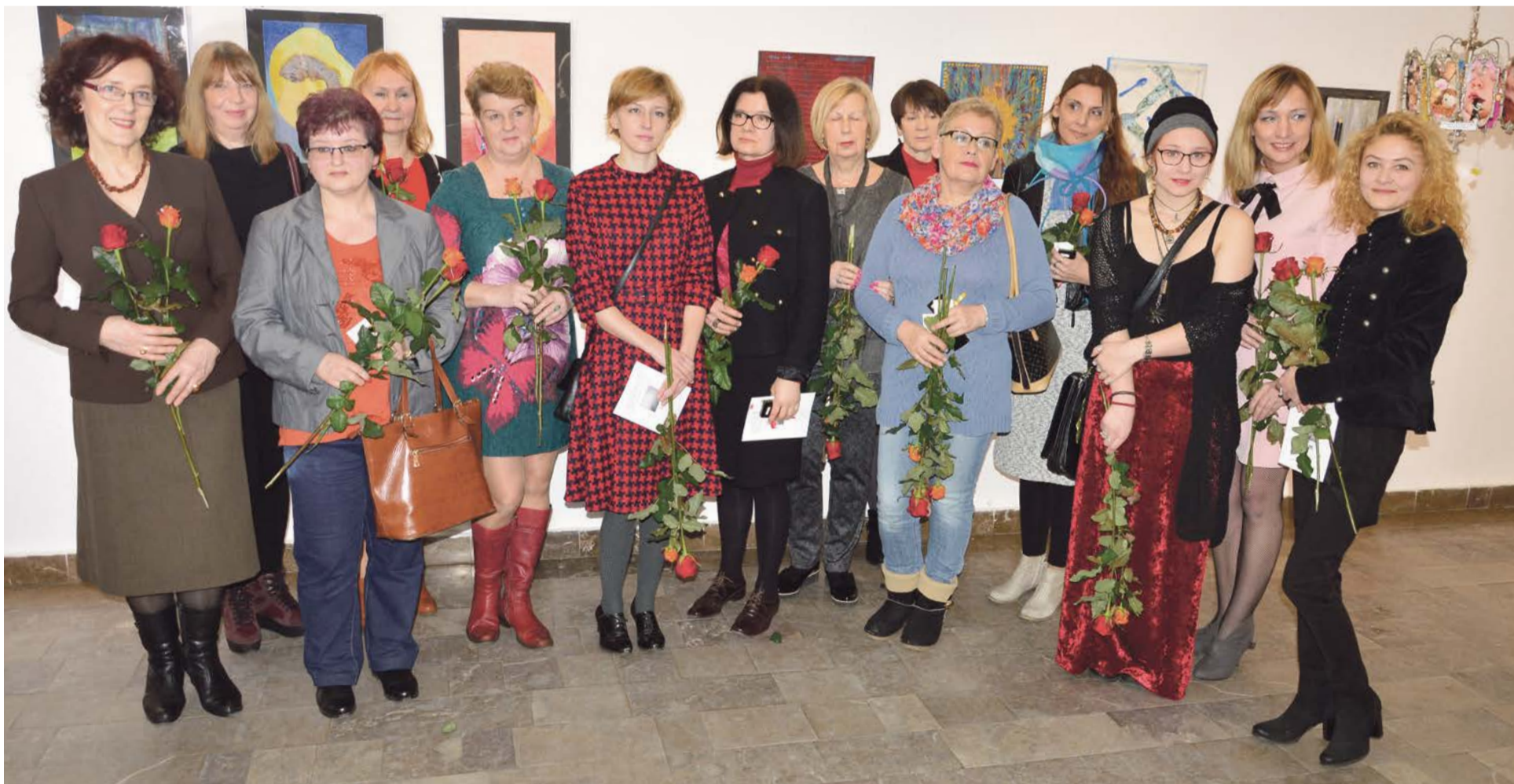
Doroczna wystawa twórczości żarskich artystek na trwałe wpisała się w kulturalną mapę miasta