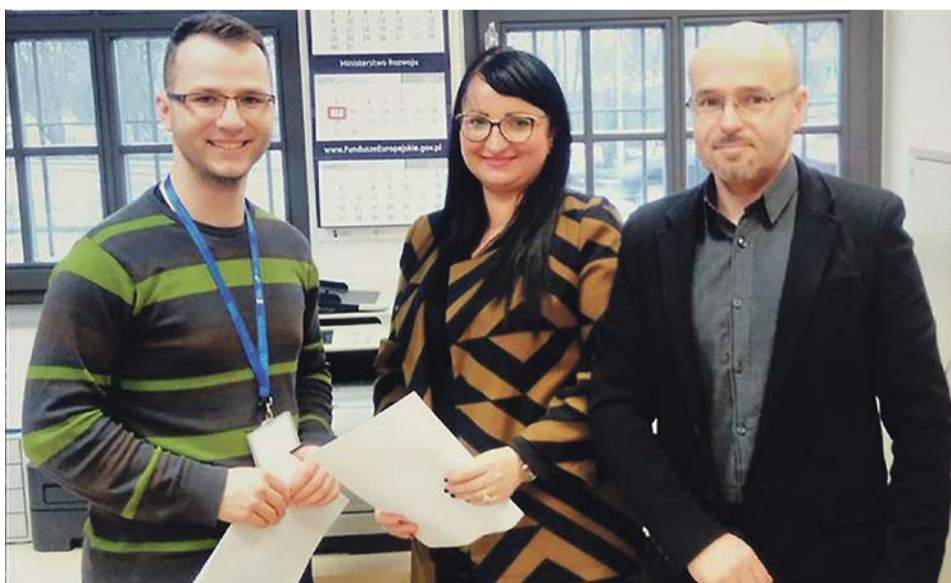
Przedstawiciele Fundacji podpisali umowę w Urzędzie Marszałkowskim w Zielonej Górze

Pierwsze szkolenia mogą się rozpocząć już w kwietniu, a wypłaty dotacji najprawdopodobniej w okresie wakacyjnym. ATB