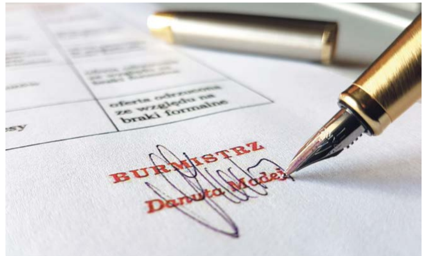
Burmistrz zdecydowała o przyznaniu dotacji dla organizacji pozarządowych

Dotacje w zakresie kultury, sztuki, ochrony dóbr kultury i dziedzictwa narodowego otrzymali: Towarzystwo Upiększania Miasta - XI Jarmark Miodu i Wina - 9.000,00 zł, Stowarzyszenie „Radość Życia” - Radosny teatr - 3.000,00 zł, Stowarzyszenie „DWUKROPEK” - Żary wczoraj i dziś - 5.000,00 zł, Hufiec Żary ZHP - Strażnicy Betlejemskiego Świata - 2017 - 1.200,00 zł, Kresowe Towarzystwo Turystyczno-Krajoznawcze - XIX Ogólnopolski Festiwal Polszczyzny i Pieśni Kresowej „Wielkie Bałakanie” - Żary 2017 - 18.000,00 zł, Klub Motocyklowy „ORZEL” - Rozpoczęcie sezonu motocyklowego. Festyn rodzinny pod nazwą „MOTOKREW” - 2.700,00 zł, ŁSAK „Żaranin” - Zajęcia dodatkowe dla mieszkańców Żar - „We LOVE ŻARY” - 24.000,00 zł, Stowarzyszenie 42. Pułku Zmechanizowanego i 11. Brygady Zmechanizowanej - Obchody