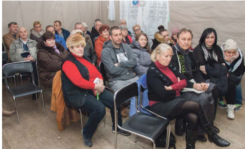
Mieszkańcy najbliższych okolic Brożką są zaniepokojeni skutkami pożaru i nie do końca ufają badaniom przeprowadzonym przez WIOŚ

Niemcy poczuli smród Sąsiedzi zza Nysy również niepokoją się ewentualnymi skutkami pożaru dla zdrowia i środowiska. Spotkanie w tej sprawie z udziałem władz powiatu Sprewa-Nysa odbyło się 9 marca w Forst. Zastępca wójta Brodów, Juliusz Dudziak poinformował tam o wszystkich podjętych działaniach. Strona niemiecka zawnioskowała o przekazywanie im cotygodniowej informacji o bieżącej sytuacji. Niemcy wskazywali na nieprawidłowości w składowaniu odpadów. Gdyby były podzielone na mniejsze hałdy, to nie byłoby mowy o pożarze