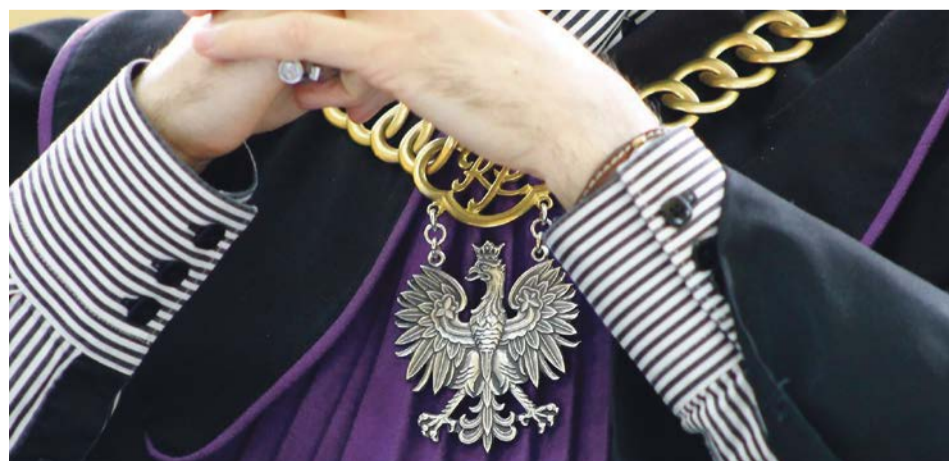
Gwałciciel poczeka w areszcie na proces