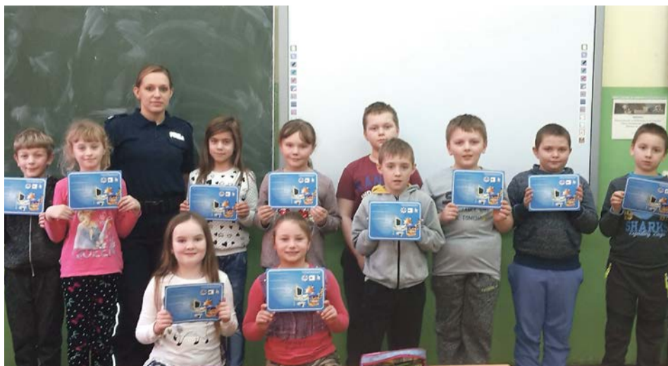
Tematyczne podkładki pod myszkę komputerową służą edukacji

Podczas spotkania dzieci zobaczyły kilkunastominutowy film dotyczący cyberprzemocy. Przedstawiał on uporczywe nękanie z wykorzystaniem wiadomości tekstowych oraz ciągłego dzwonienia na telefon komórkowy. Dzieci po obejrzeniu filmu wspólnie z policjantką omówiły jego treść i wskazały niewłaściwe zachowania oraz przykre odczucia, jakie towarzyszyły pokrzywdzonej osobie. Na koniec spotkania dzieci otrzymały tematyczne podkładki pod myszkę komputerową. PAS