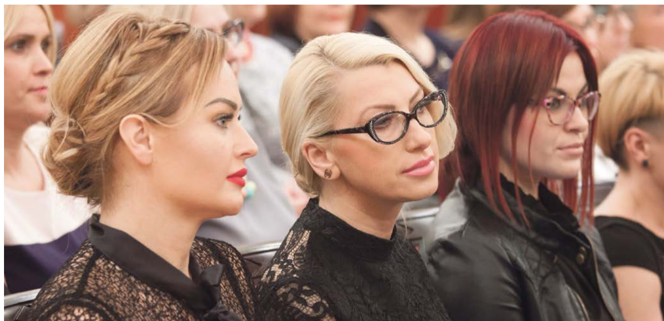
Żarskie kobiety sukcesu