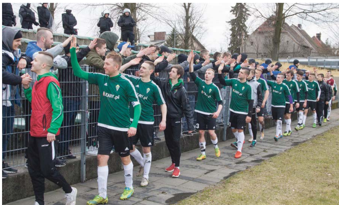
Zasłużone podziękowania dla kibiców