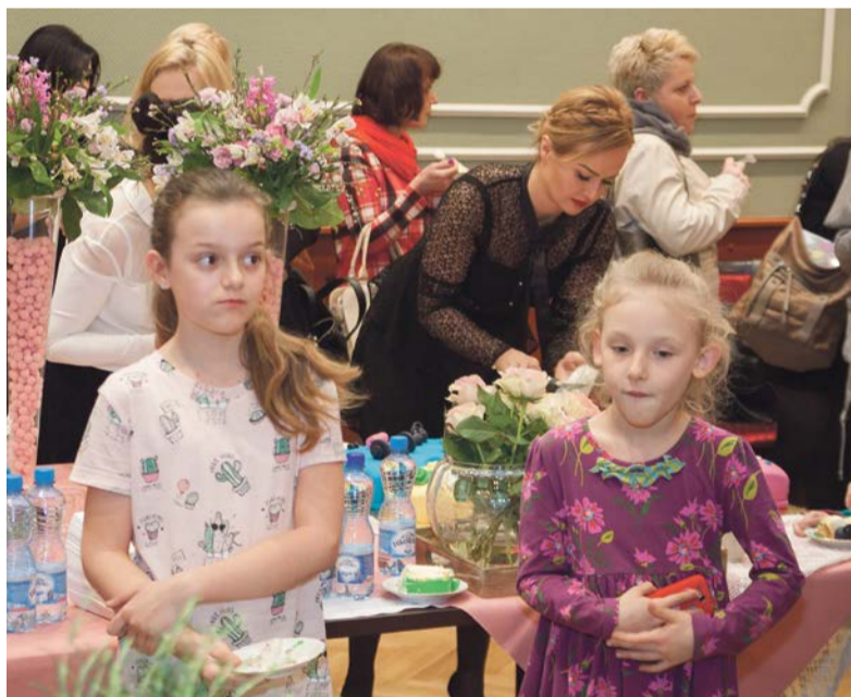
Dorastają kolejne pokolenia