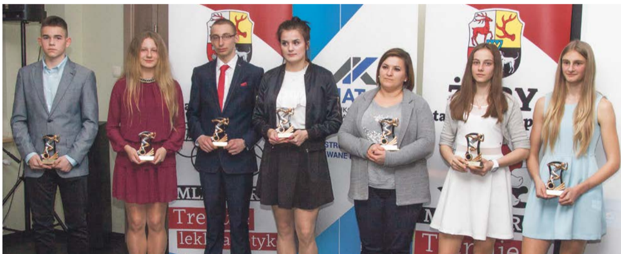
W całorocznej rywalizacji wyłoniono najlepszych lekkoatletów

Przy okazji chcę powiedzieć, że kończymy przetarg na Syrenę. Myślę, że na przetomie sierpnia i września będziemy mieć certyfikowany stadion lekkoatletyczny. Jeśli chodzi o zapaśników - w budżecie miasta mamy w tym roku 100 tys. złotych na projekt budynku sportów walki. Myślimy już o jego budowie w roku przyszłym.