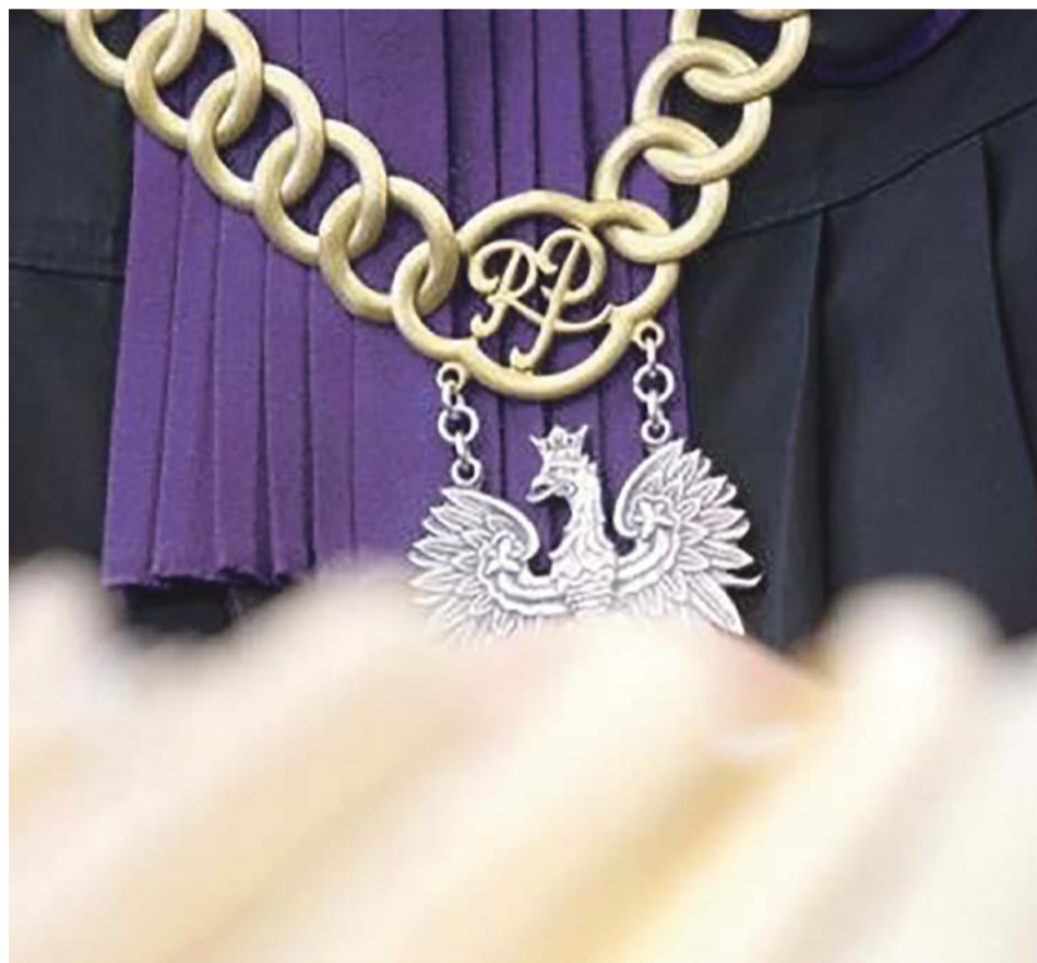
Były wójt Wiesław Polita i sekretarz Radosław Pogorzela na wyrok muszą poczekać jeszcze blisko dwa tygodnie. W mowach końcowych zapewnili, że są niewinni

Przypomnijmy. Chodzi o sprawę podatków, które powinni płacić małżonkowie Maciuszonek. Płacili mniejsze podatki, niż wynikało to z deklaracji. Na części nieruchomości pod Żarami prowadzili działalność gospodarczą, więc au-