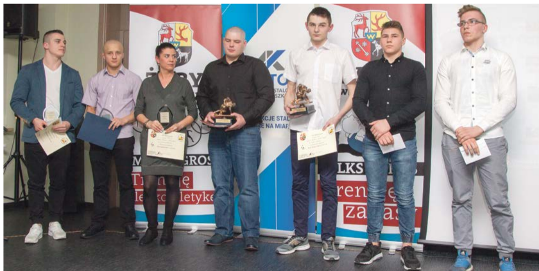
Wyręcono nagrody dla zapaśników