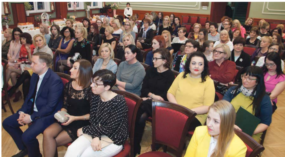
Sala konferencyjna urzędu miejskiego gościła wiele niezwykłych kobiet