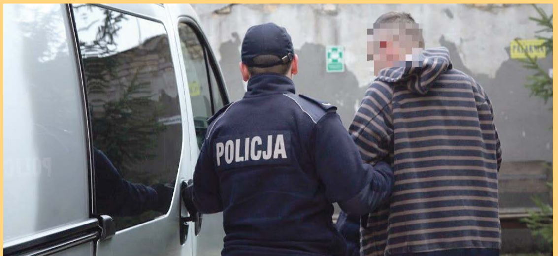
Chciał się wyłgać, podając fałszywe dane. Nie udało się