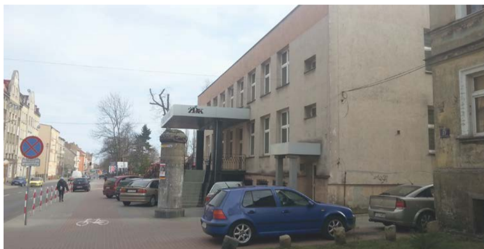
Budynek sali widowiskowej Żarskiego Domu Kultury nie jest kulturalną wizytówką miasta. Miasto potrzebuje nowego obiektu na miarę XXI wieku

Jednak żaden nowy obiekt, który byłby kulturalną wizytówką, na miarę