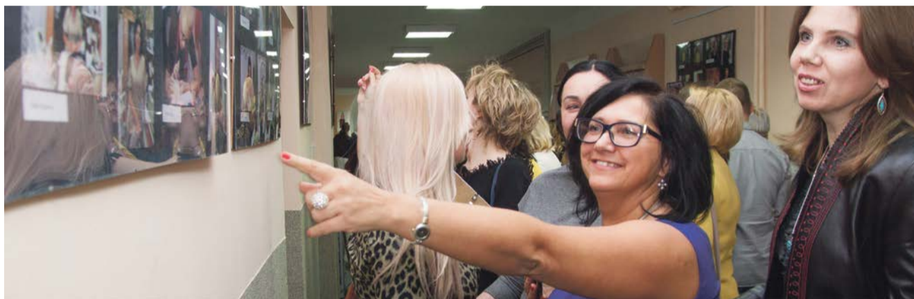
Wystawa fotografii w żarskim ratuszu była dla pań miłą niespodzianką