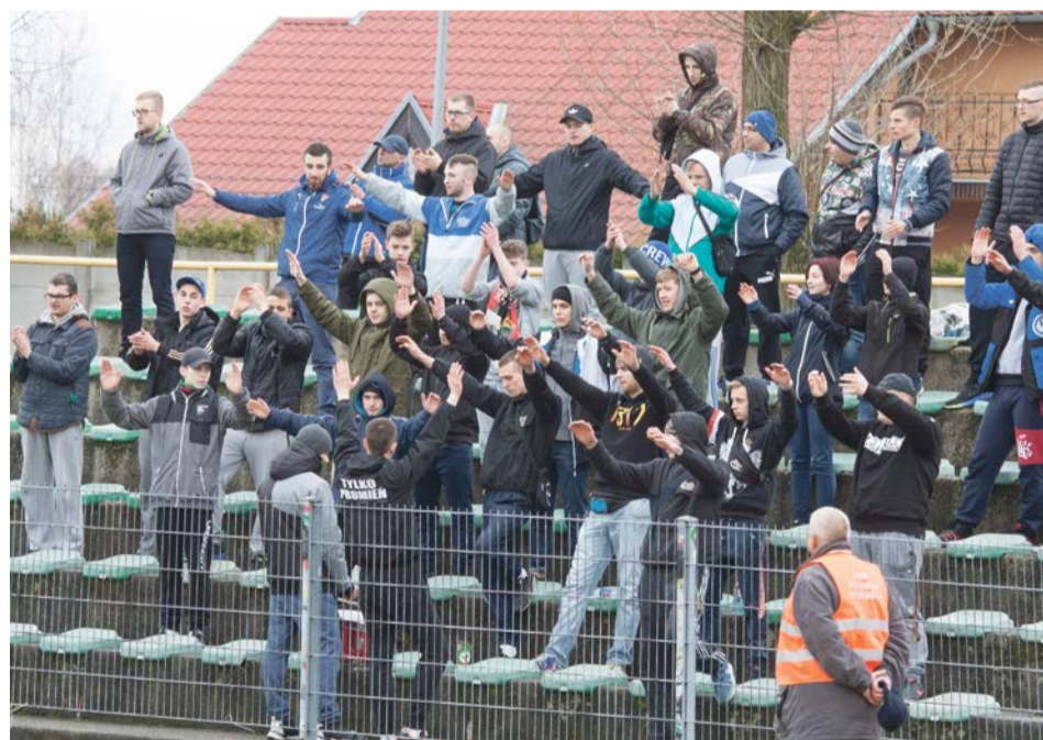
Kibice Promienia zagrzewali do walki