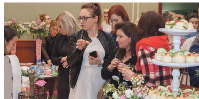
Kolorowy poczęstunek w eleganckiej oprawie