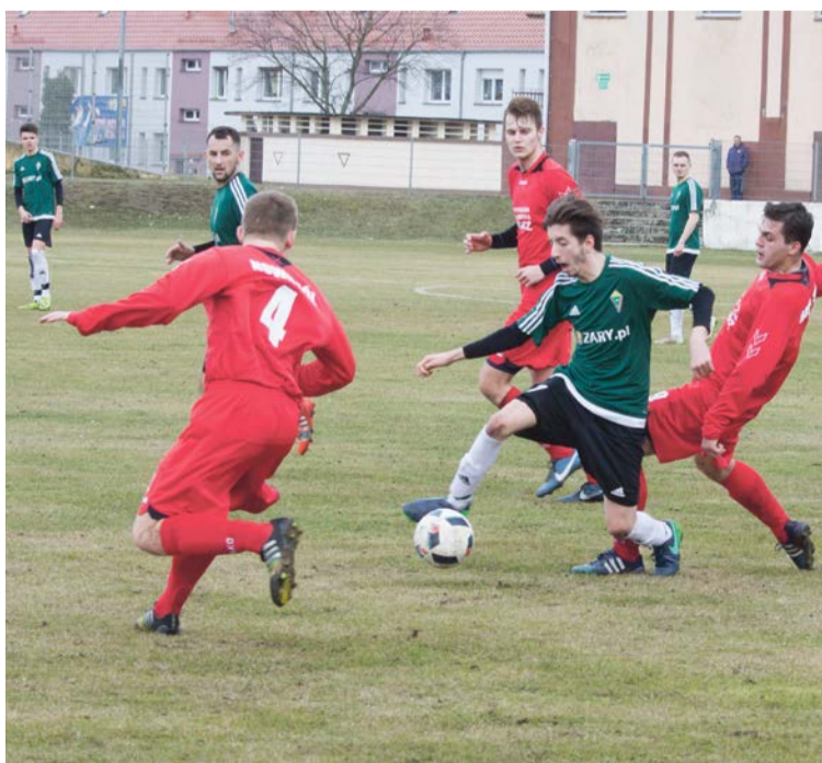
Piłkarze Promienia ciężko pracowali na zwycięstwo