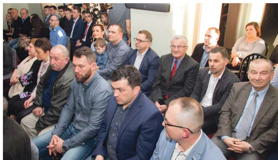
Na widowni zasiadły legendy żarskich zapaśników