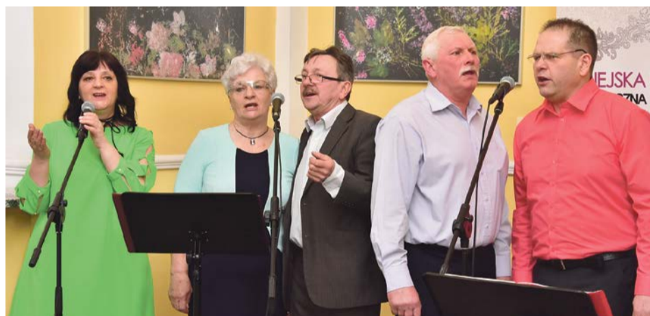
Jak wernisaż, to ze śpiewem na ustach