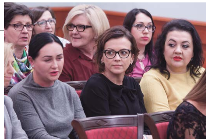
Działają na rzecz innych kobiet

Osiemdziesiąt pań zostało nominowanych w zorganizowanej przez burmistrza Danutę Madej kampanii pod hasłem „Żarskie kobiety kobietom”.