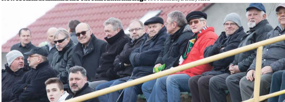
Na trybunach nie zabrakło zasłużonych działaczy i wiernych od lat kibiców