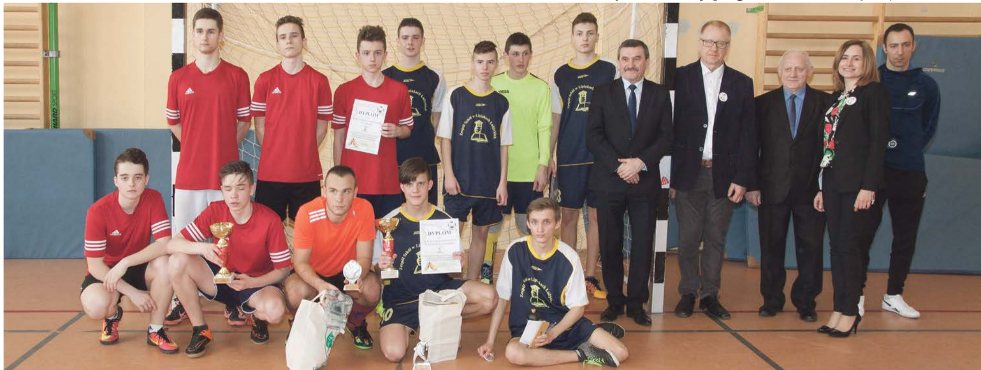
Dwie najlepsze drużyny turnieju