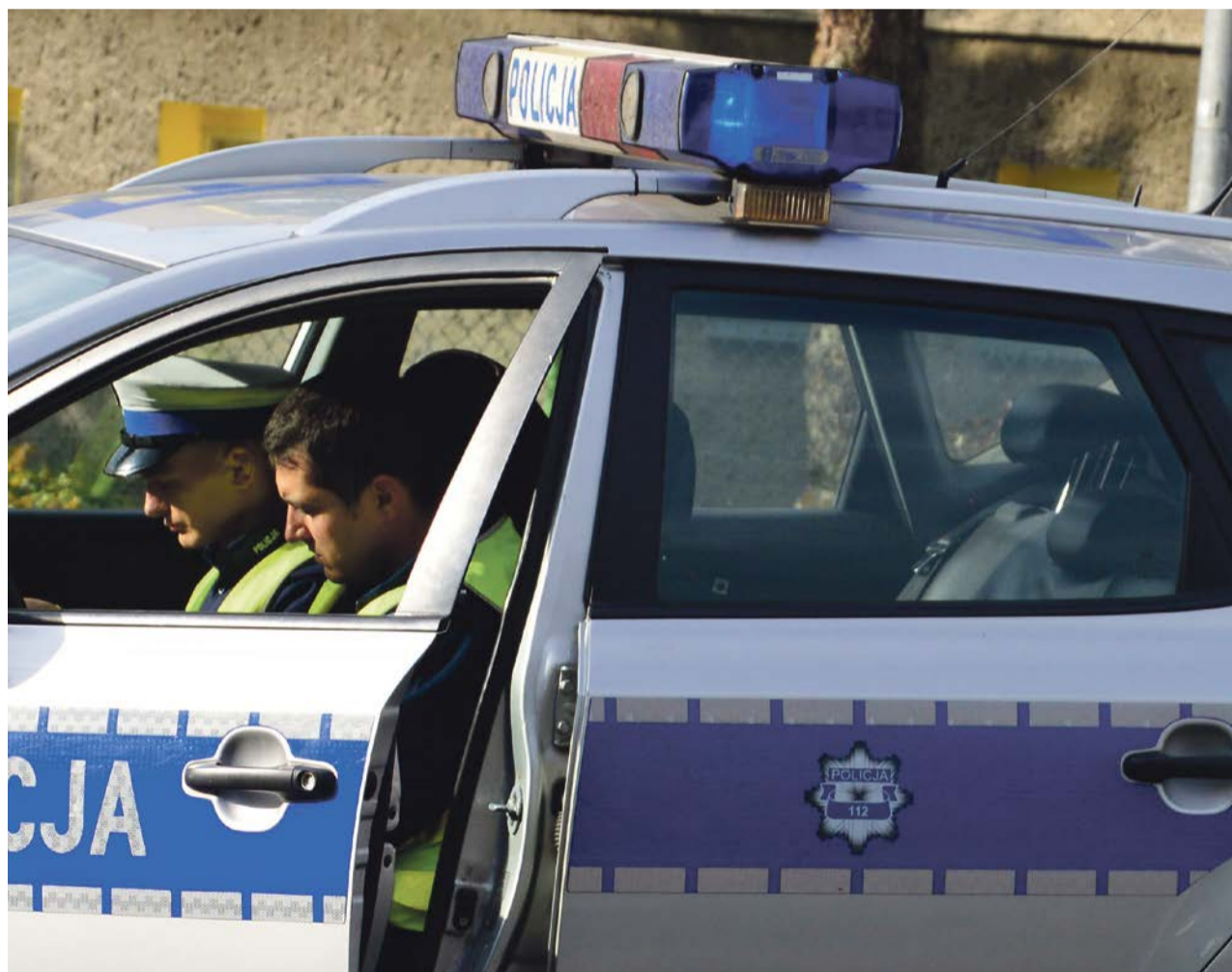
Policjanci musieli ścigać kierowcę fordą mondeo

miejsowości Klików. Do wsi jednak nie dojechał. Na drodze uszkodził samochód. Wówczas wraz z pasażerką zaczęli uciekać pieszo przez las. Na nic to się zdało. Po krótkiej chwili oboje zostali zatrzymani przez policjantów. Mężczyzna, to 29-letni mieszkaniec pow. żagańskiego. Tłumaczył, że nie zatrzymał się do kontroli drogowej, ponieważ zostały mu cofnięte uprawnienia do kierowania autem. Za wszystkie wykroczenia odpowie teraz przed sądem. PAS