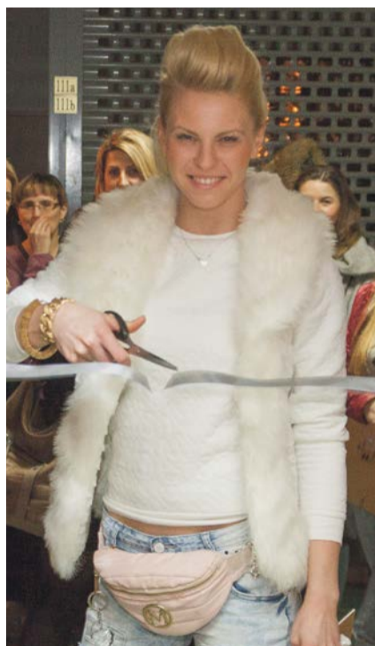
Przecięcie wstęgi - wystawa otwarta