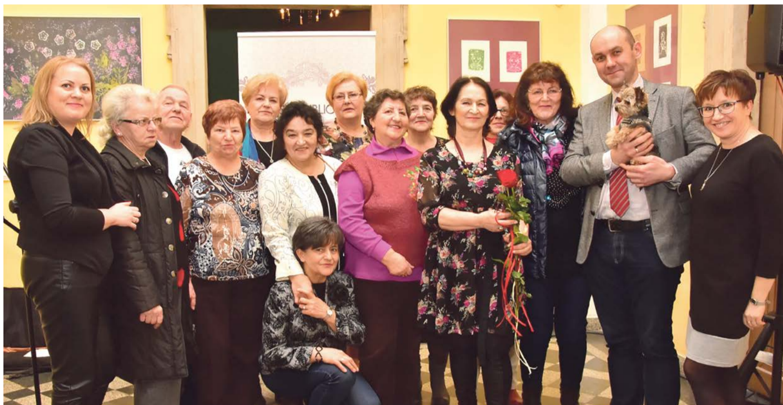
Grupa Artystyczna UTW w całej okazałości

W holu bibliotecznym Pałacu Książęcego otwarto wystawę Grupy Artystycznej Uniwersytetu Trzeciego Wieku działającej przy Centrum Kultury. W prezentowanych pracach plastycznych, czarno-biała fotografia, jako dokument mający wartość sentymentalną, została przeniesiona w czasy nam współczesne ... barwne. Twórcy chcieli pokazać, że wspomnienia o ludziach nam bliskich i minionych czasach nadal żyją w naszej pamięci. Wernisaż prac uświetnił występ zespołu „Żagańska Lutnia”. JM