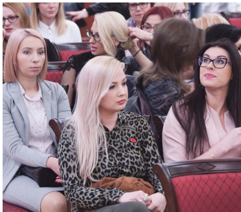
Wiele profesji, wiele pasji, ale z pewnością łączy je jedno - miasto Żary