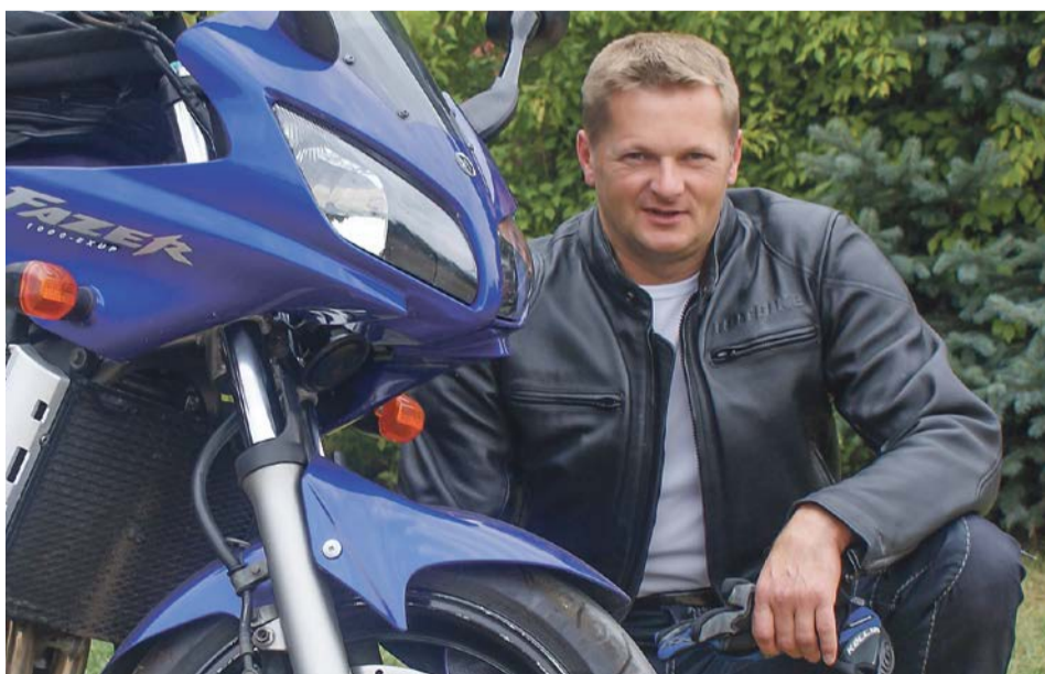
Po przerwie powróciła uśpiona miłość do motocykli (fot. archiwum Andrzeja Tomiałowicza)

- Od wielu lat mamy taką grupę pokazową, która na początku występowała przy okazji różnych lokalnych świąt. Ludzie chcieli zobaczyć, co to jest to karate. Udało mi