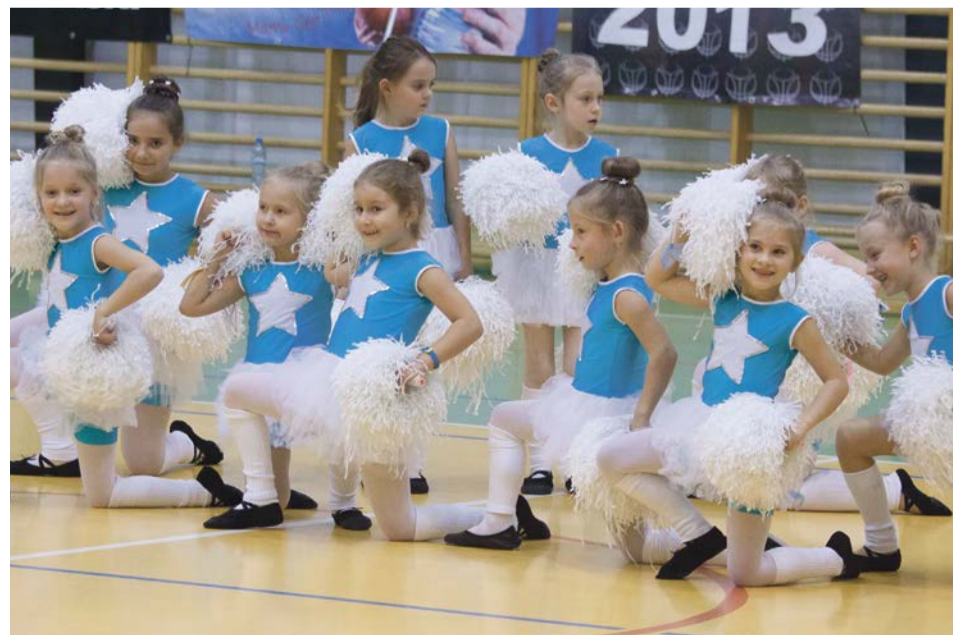
Nie każda drużyna ma taki doping