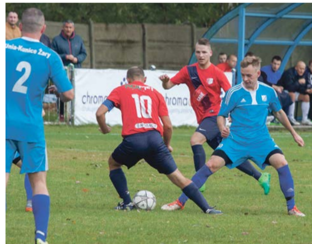
Delta wygrała na boisku Unii

Promień Żary i Piast Iłowa rywalizują o trzecie miejsce w tabeli z taką samą liczbą punktów. Tymczasem na piątej pozycji klasy okręgowej znalazł się beniaminek z Sieniawy.