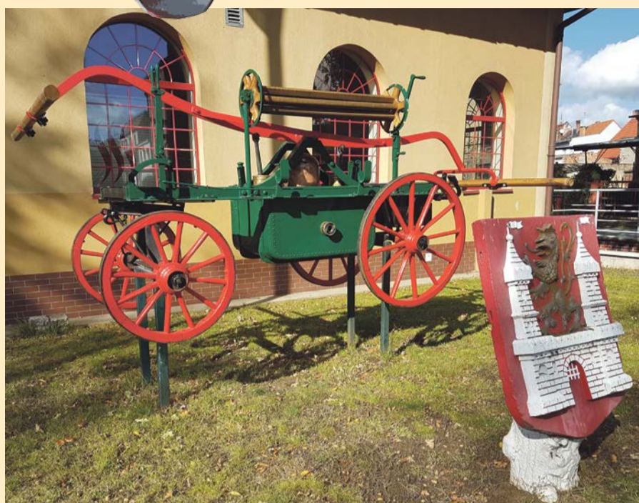
LUBSKO Na nasze szczęście, dziś wyposażenie strażaków znacznie odbiega od tego, jakim posługiwali się przed laty. Ten zabytkowy już wóz strażacki można obejrzeć przed jednostką PSP w Lubsku