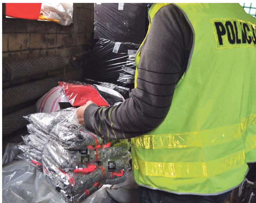
Policjanci z Komendy Powiatowej Policji w Żarach przeprowadzili skuteczną akcję

- To nie pierwsza w tym roku akcja żarskich stróżów prawa. Policjanci podrabianą odzież zabezpieczyli także w kwietniu, maju i wrześniu - informuje podkom. Aneta Berestecka, oficer prasowy KPP w Żarach. PAS