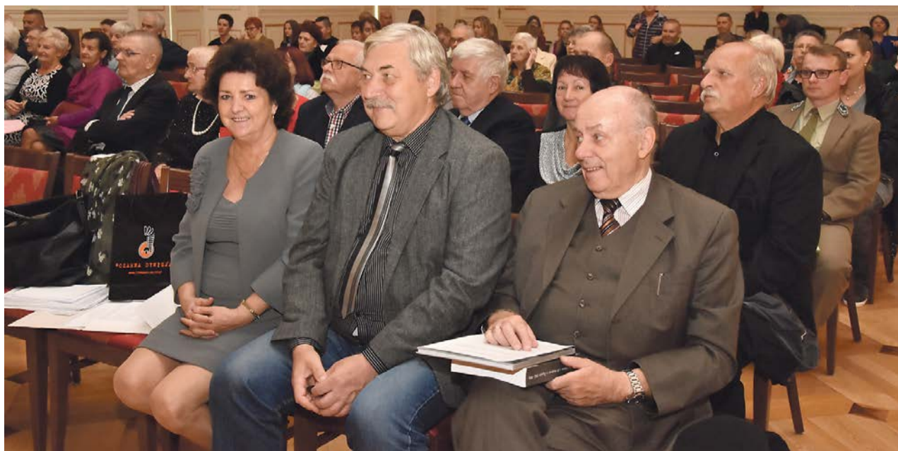
Wydarzenie cieszyło się sporą frekwencją