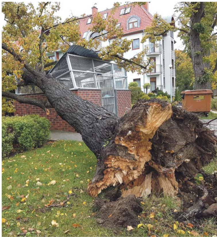
Drzewo przy ul. Spokojnej w Żarach zostało przez urzędników zakwalifikowane do usunięcia. Jak widać - słusznie

Drzewo na własnym podwórku możemy ścinać, jeśli obwód pnia mierzony na wysokości 5 centymetrów od gruntu nie przekracza 80 cm w przypadku topoli,