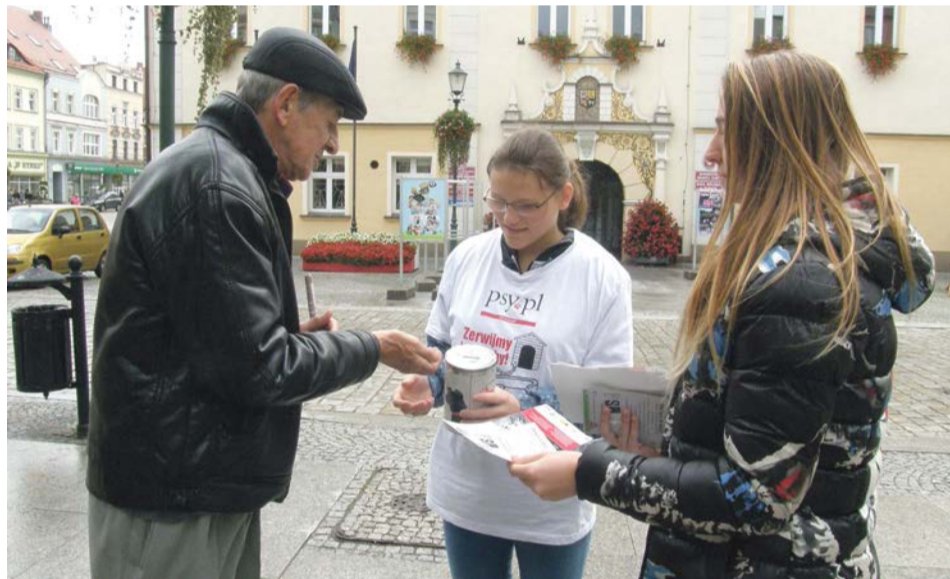
Mieszkańcy chętnie wspomagali organizatorów