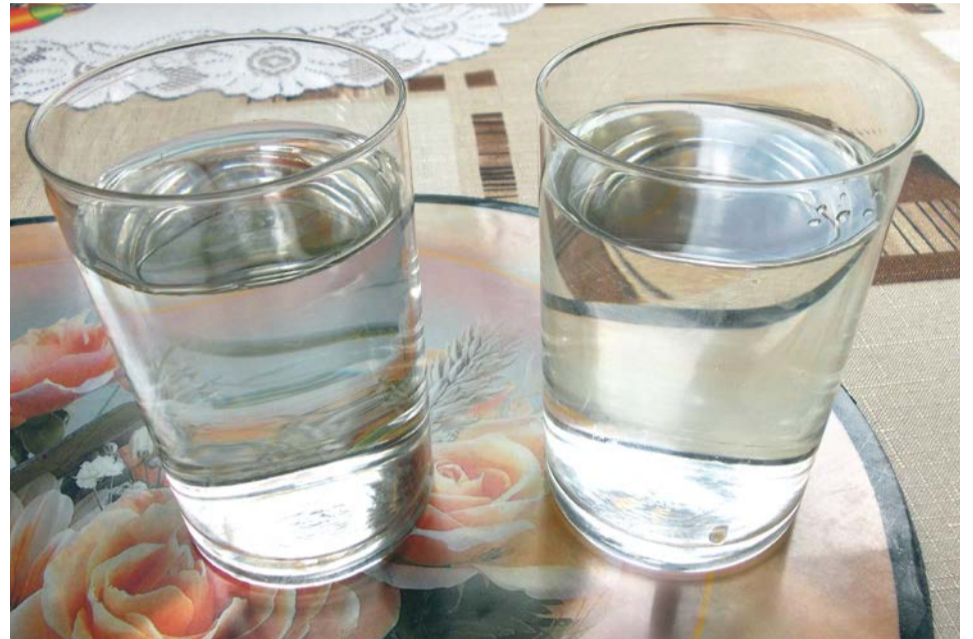
Wodę można już bezpiecznie pić

Dopiero w czwartek, 12 października zakaz można było odwołać. Pobrane