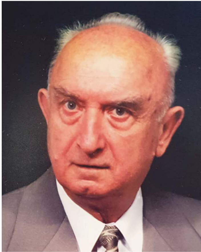
Zdzisław Liziniewicz

W protokole z posiedzenia czytamy, że „Kapituła rozpatrzyła wnioski złożone