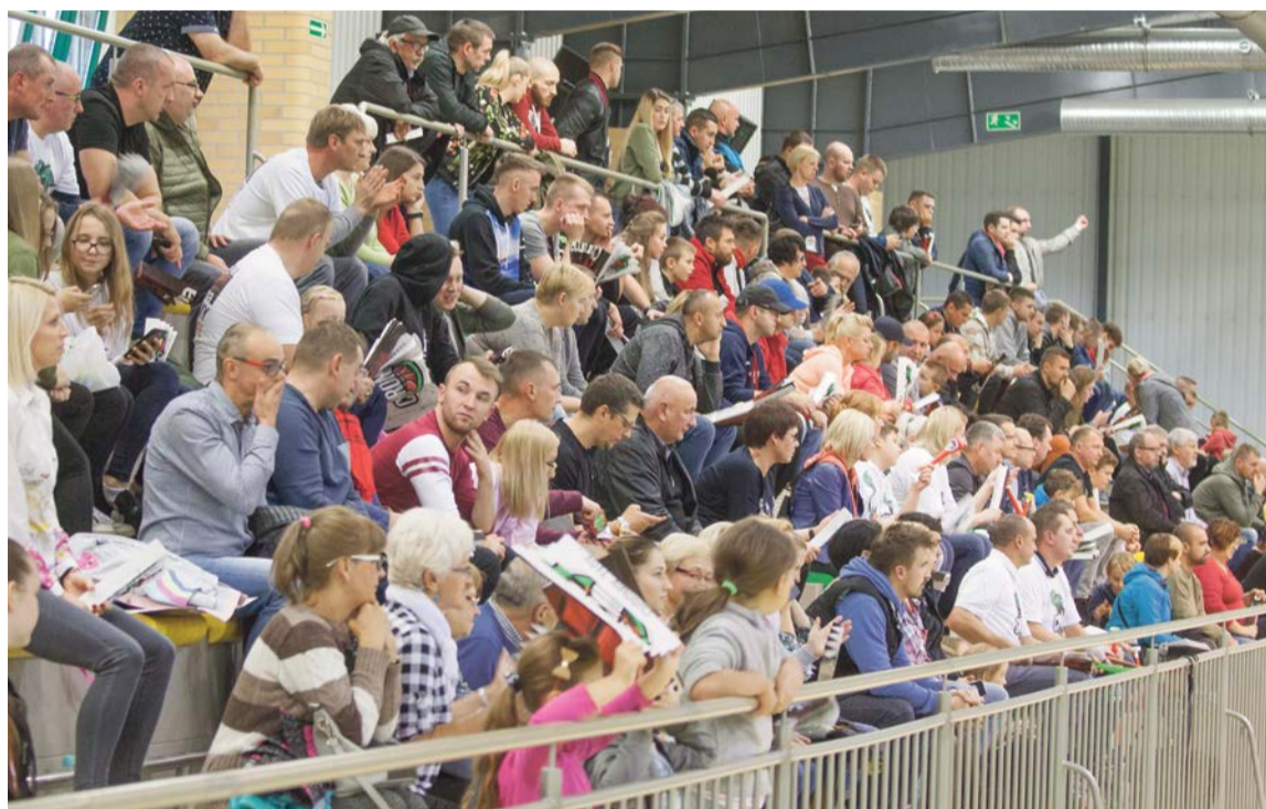
Żarska koszykówka ma swoich fanów