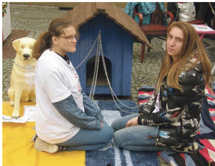
Co czułby człowiek przywiązany do budy?

- Akcja się udała. Ludzie są wrażliwi, mamy wielu przyjaciół. Dziękuję wszystkim za zaangażowanie i za wsparcie. Akcja przyczyniła się do budowania świadomości, a co ważne uwrażliwia też na problem małe dzieci - podsumowuje Jolanta Jureczko.