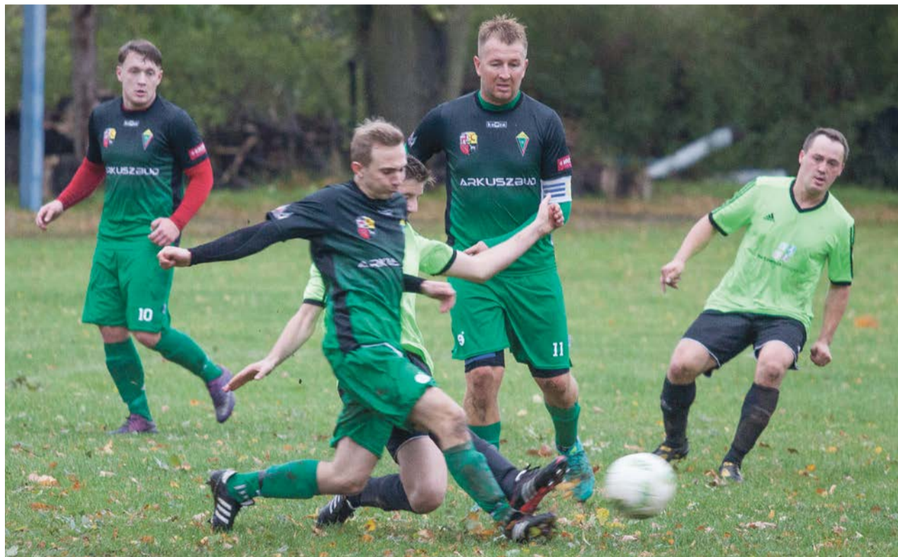
Promień II autorem pierwszej porażki Sparty