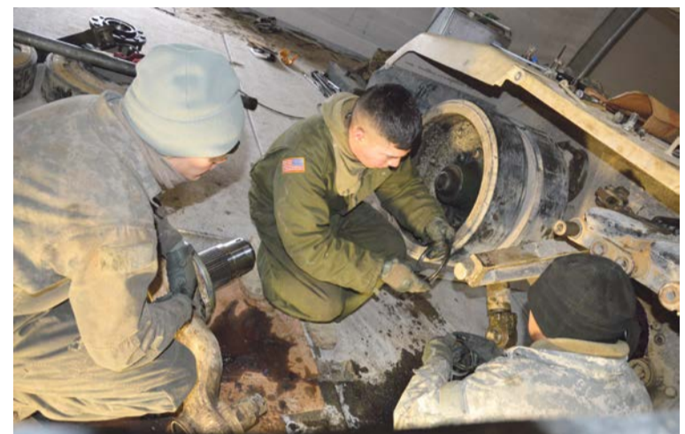
Trzeba się przygotować na kolejne ćwiczenia