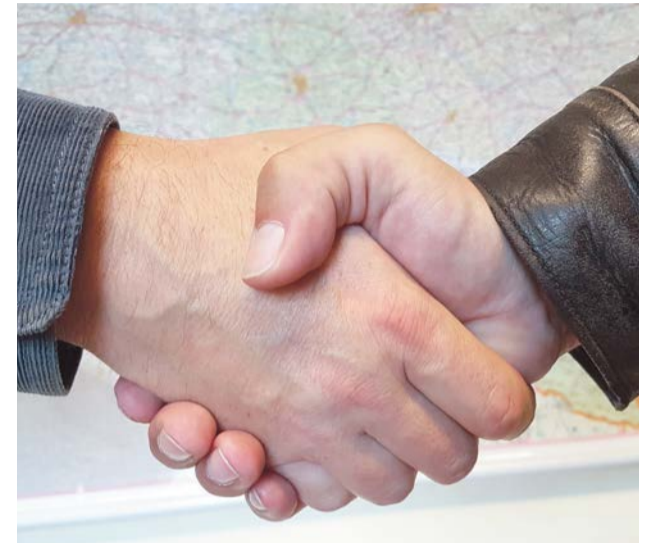
Sprzedawca dbający o swojego klienta będzie wolał się dogadać, zamiast poddawać spór pod sądowe rozstrzygnięcia