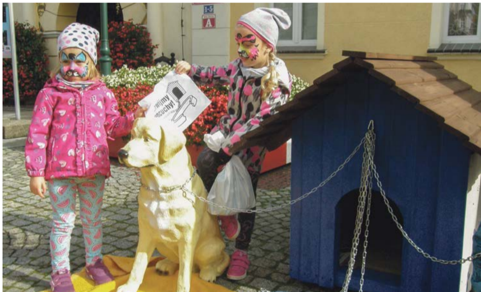
My też popieramy akcję