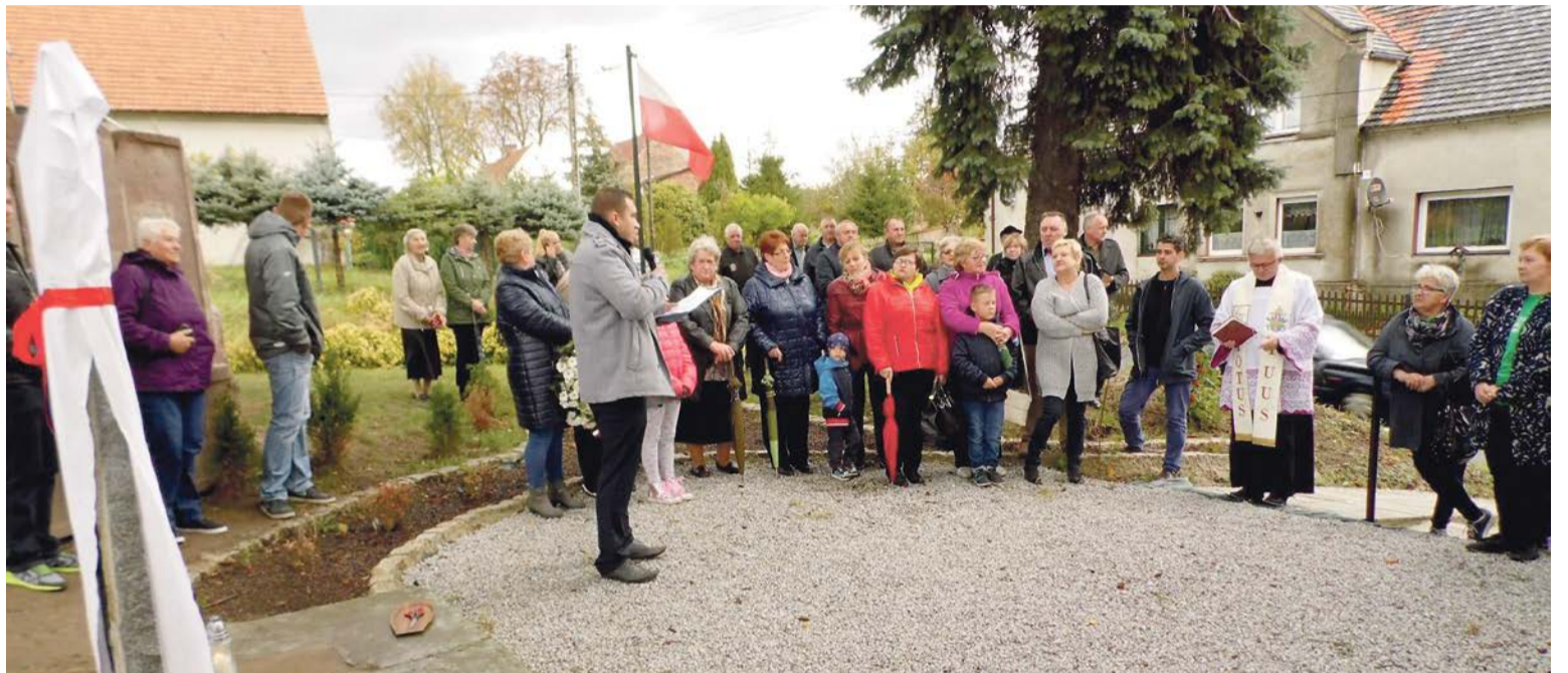
Na uroczystości stawilo się sporo mieszkańców i zaproszeni goście