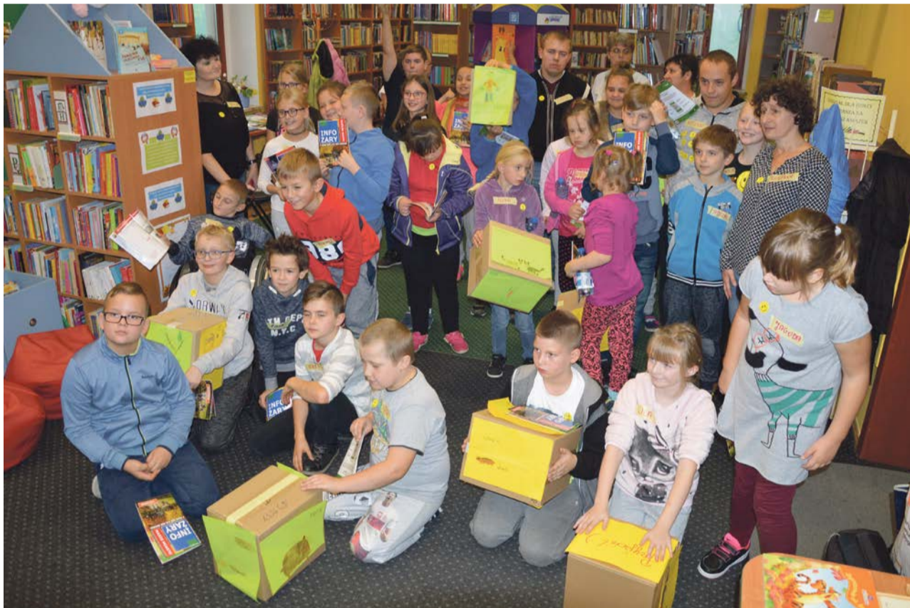
Dobry humor, luz, ale i wzajemny szacunek. To się udało