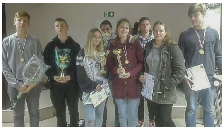
Uczniowie żarskich szkół katolickich dobrze sobie radzą na strzelnicy fot. KLO Żary

W czasie dekoracji zwycięzców odbyła się miła uroczystość.