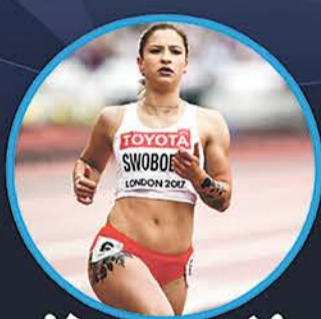
• EWA SWOBODA •

Brązowy medalista Młodzieżowych Mistrzostw Europy na dystansie 1500 metrów