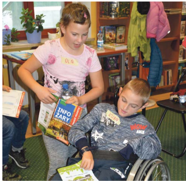
Celem warsztatów jest integracja

Warsztaty realizowane są w MBP w partnerstwie z Zespołem Szkół Specjalnych w ramach projektu „Kultura Tędy”. Operatorem projektu jest Regionalne Centrum Animacji Kultury PAS