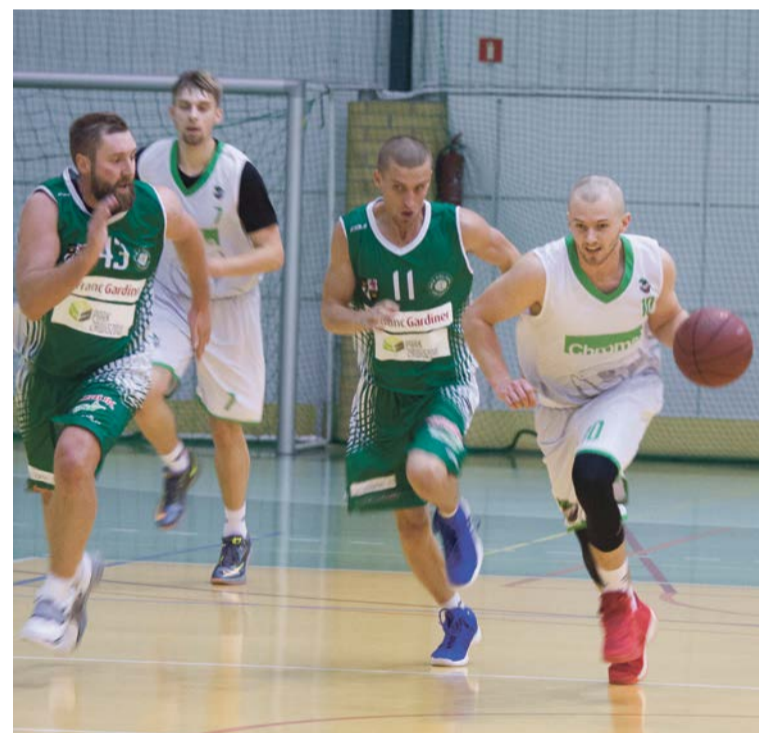
Pomimo starań, Polonia nie dogoniła Chromika