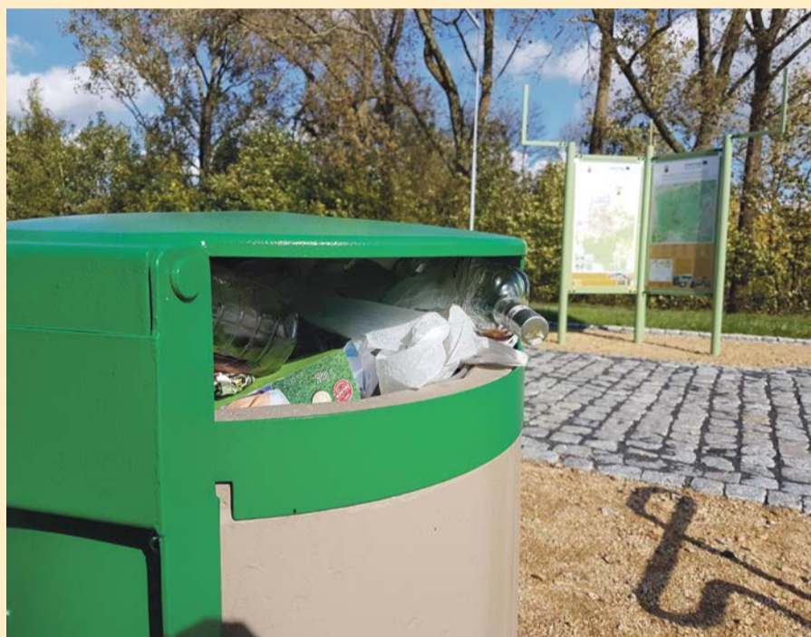
ŻARY Jak widać na przykładzie ulicy Piastowskiej, jeden z nowych parkingów zbudowanych przy wjeździe do miasta cieszy się sporym powodzeniem. Jest gdzie się zatrzymać, obejrzeć mapy turystyczne i... wyrzucić śmieci. Teraz miejskie służby porządkowe będą miały więcej pracy. Dobrze, że śmieci trafiają do śmietnika, a nie w krzaki, czy do rowu