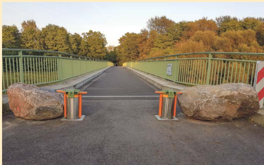
SIEDLEC (GMINA TRZEBIEL) Most Doliny Nysy, pieszo-rowerowy, łączy miejscowości Siedlec i Zelz. Został oddany do użytku w 2008 roku. Zamontowane po obu stronach zapory miały uniemożliwić ruch samochodowy za wyjątkiem pojazdów służb ratunkowych. Chyba jednak takie blokady okazały się niewystarczające, ponieważ po stronie niemieckiej zostały wzmocnione wielkimi głazami. Teraz już nikt na pewno nie przejdzie