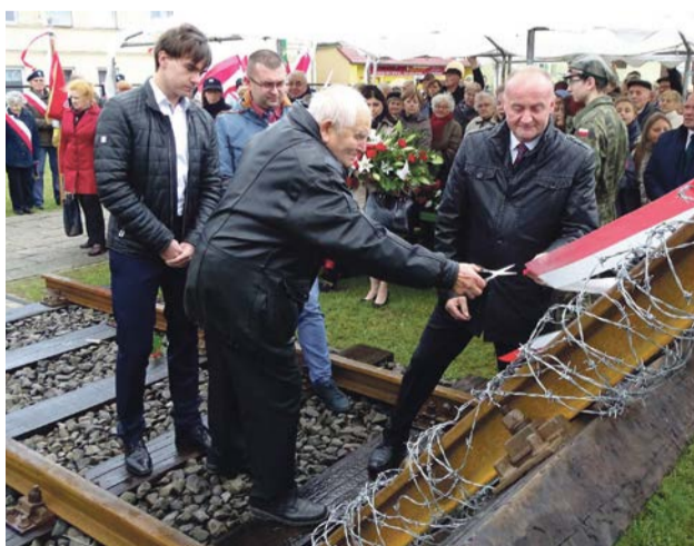
Uroczyste przecięcie wstęgi

W uroczystości odsłonięcia udział wzięły liczne poczty sztandarowe, przedstawiciele środowisk kombatanckich i sybirackich, władz samorządowych oraz mieszkańców. ATB