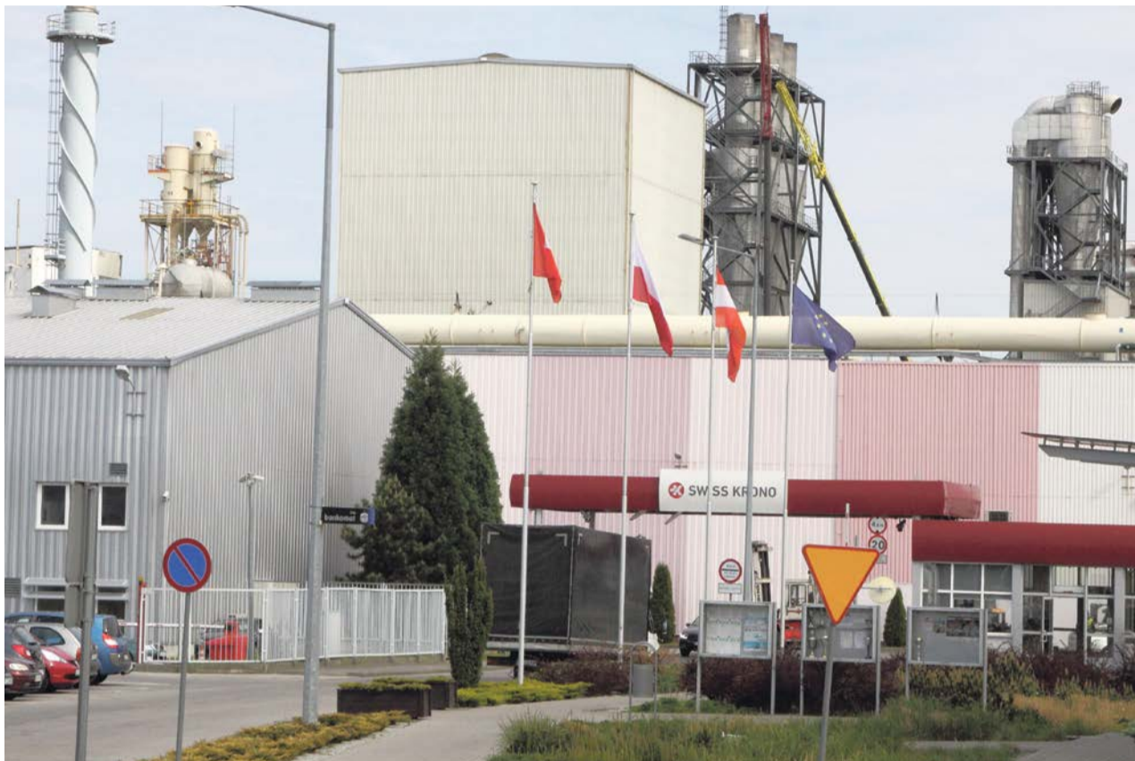
W fabryce doszło już do kilku śmiertelnych wypadków