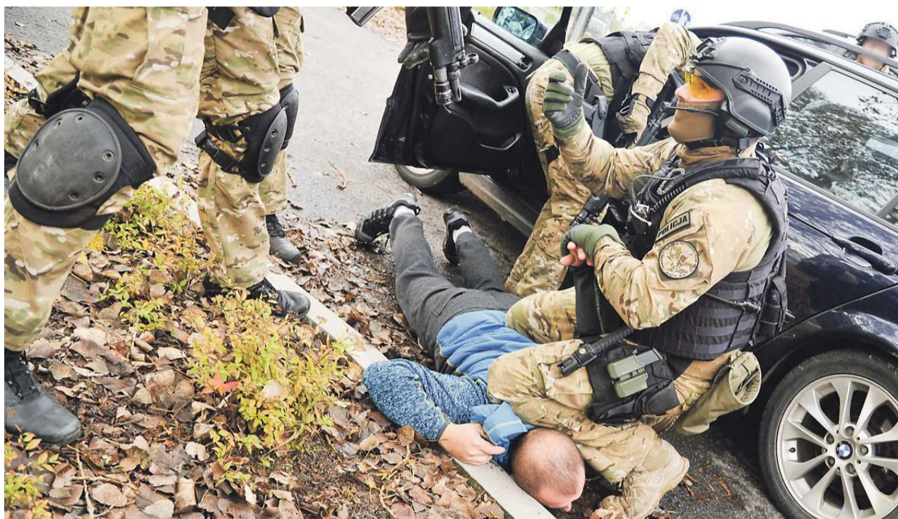
Akcja była bardzo niebezpieczna, stąd udział grupy antyterrorystycznej

W ukrytym pomieszczeniu w powiecie żagańskim rosło aż 350 krzewów marihuany. Wejście do pomieszczenia możliwe było przez szafę. Do sprawy, we współpracy z lubuskimi antyterrorystami, zatrzymano cztery osoby. Wszyscy usłyszeli już zarzuty i są w areszcie.