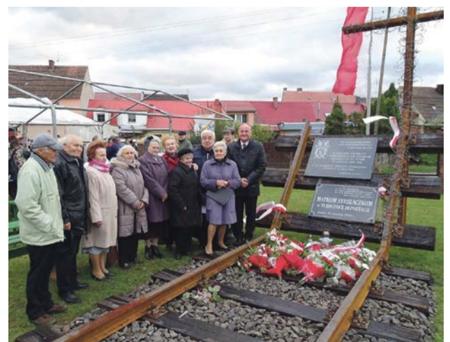
Miejsce pamięci poświęcone Zesłańcom Sybiru