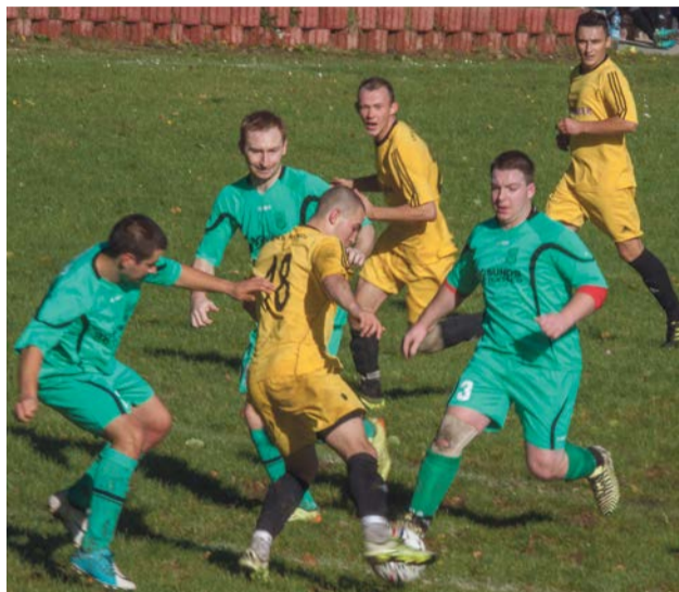
WKS Łaz podarował 3 punkty łękniczynom

W poprzedniej kolejce rozgrywek Sparta Grabik zremisowała po raz pierwszy po paśmie spek-