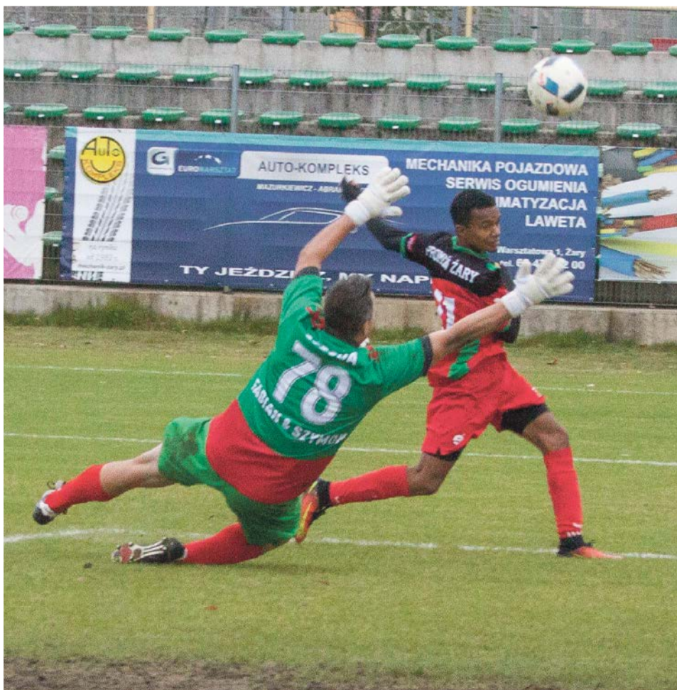
Bramkarz Amatora Bobrowniki kapitulował trzykrotnie

CARINA GUBIN 2:1 KORONA WSCHOWA ODRA NIETKÓW 1:3 BŁĘKITNI OŁOBOK PIAST IŁOWA 5:1 UNIA KUNICE ŻARY ZORZA OCHŁA 3:1 SCHNUG CHOCIULE PIAST CZERWIEŃSK 1:3 MIESZKO KONOTOP PROMIENŃ ŻARY 3:0 AMATOR BOBROWNIKI DELTA SIENIAWA ŻARSKA 6:1 STAL JASIEŃ UKS „CZARNI” ŻAGAŃ 3:1 ZRYW RZECZYCA