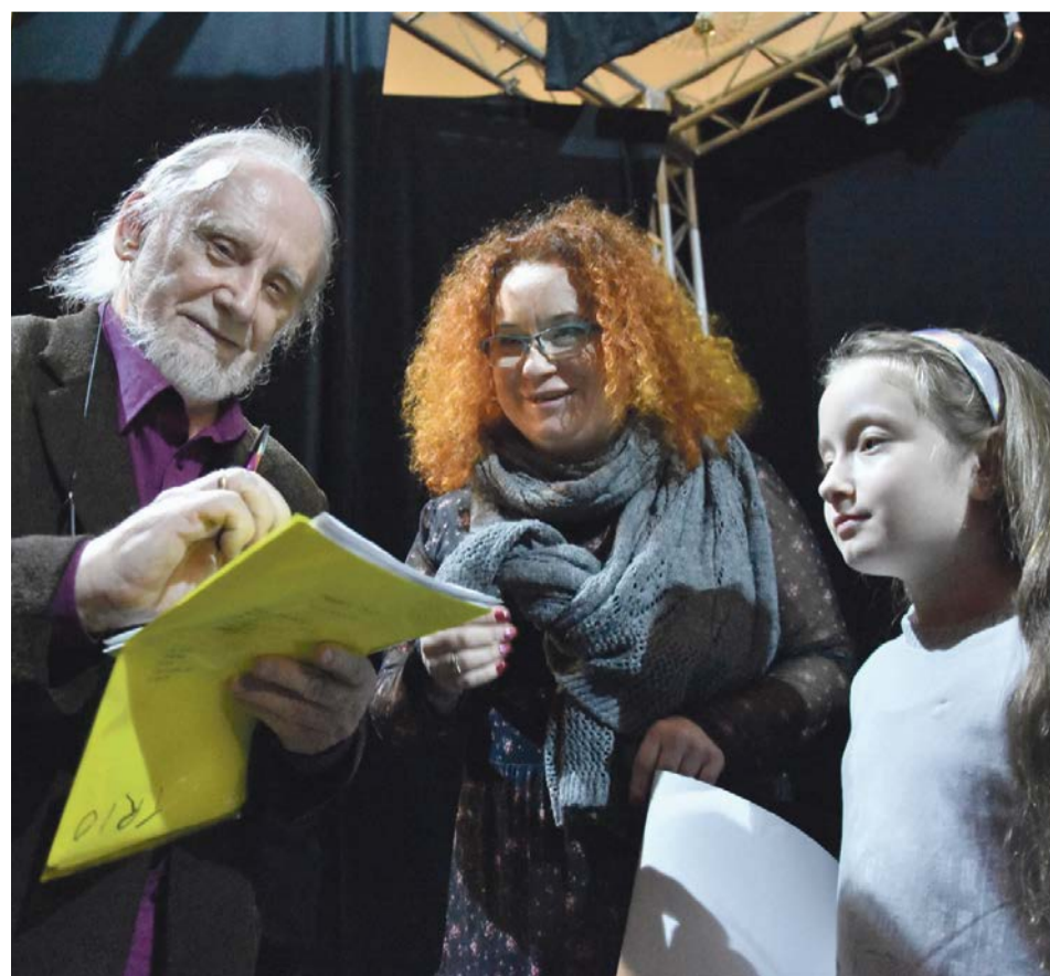
Nie mogło obyć się bez autografów. Nie wiadomo jak prędko i czy w ogóle powtórzy się taka okazja