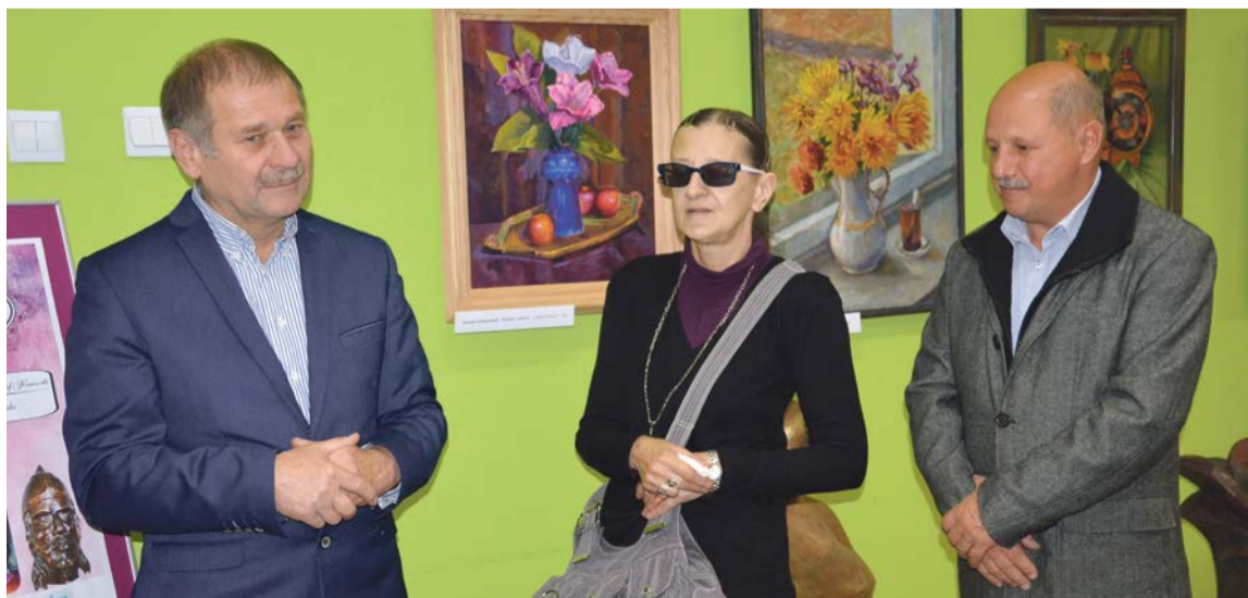
Prace lubuskich artystów można podziwiać a także kupić w bibliotece

Rozmowy i poczęstunek były zwieńczeniem tej udanej imprezy. oprac. PaS