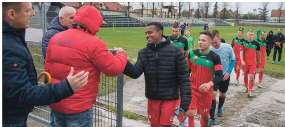
Zasłużone gratulacje dla zawodników i trenera