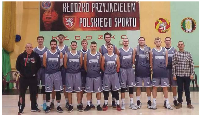
Rywale nie lekceważą sobie spotkań z żarskim Chomikiem

W sobotę 4 listopada Chromik podejmować będzie u siebie Koszykarski Klub Sportowy Kobierzyce. Mecz rozpocznie się o godz. 17 w sali sportowej przy ul. Okrzei 19 w Żarach. Organizatorzy jak zwykle zapowiadają wiele atrakcji dla kibiców. ATB