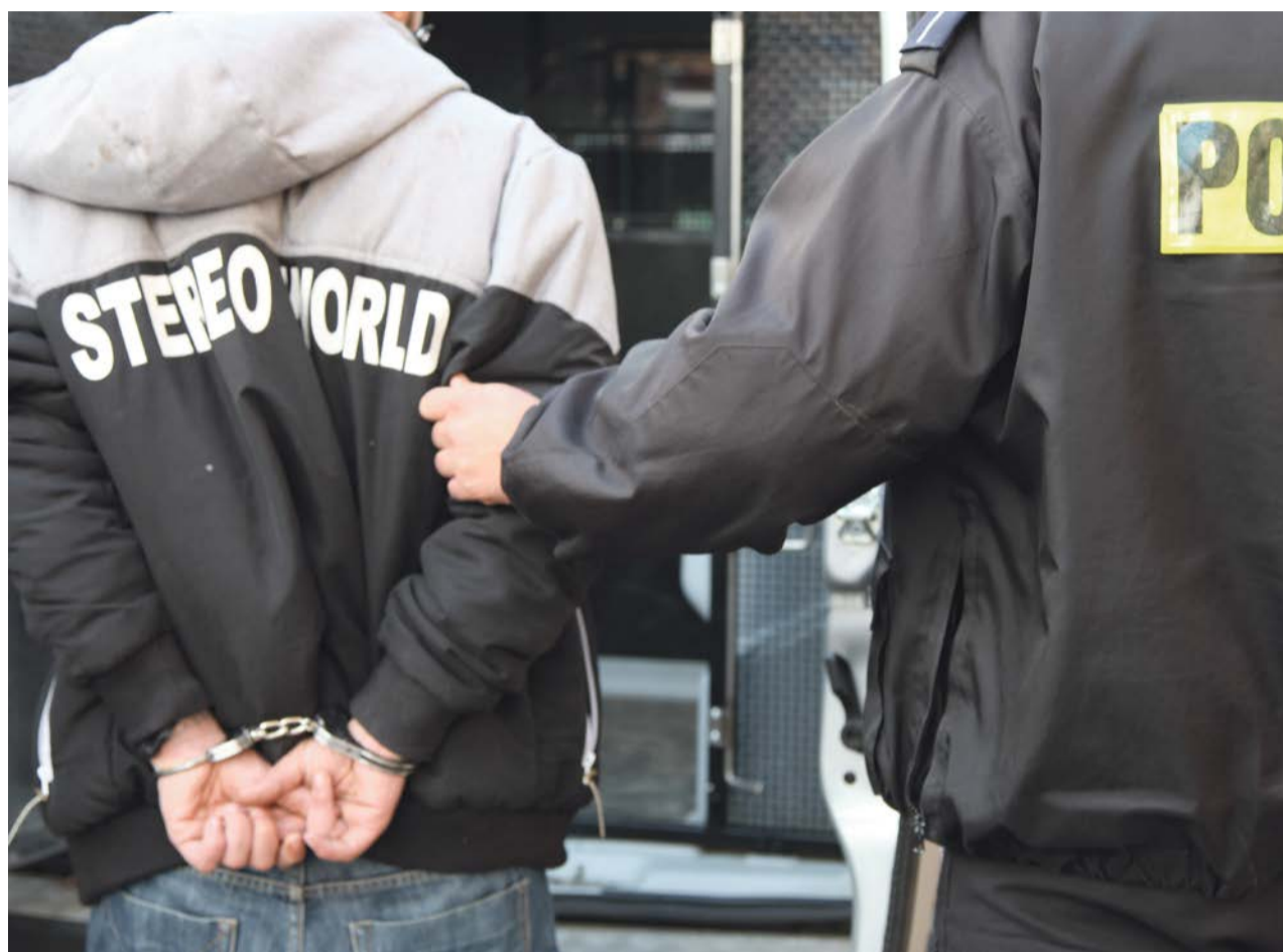
Poszukiwany listami gończymi miał przy sobie narkotyki. W zakładzie karnym może więc spędzić więcej czasu

W wypadku mniejszej wagi, sprawca podlega grzywnie, karze ograniczenia wolności albo pozbawienia wolności do roku.