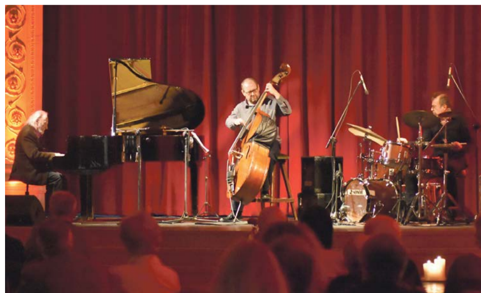
W nastrojowym klimacie, przy świecach na stołach, publiczność wsłuchiwała się w jazzowe nuty

roku wykonuje kompozycje jazzowe swojego lidera, inspirowane muzyką poważną. Podczas koncertu nie zabrakło specjalnie opracowanych wersji instrumentalnych przebojów Włodzimierza Nahornego, m.in. „Jej Portret” i „Księżyc nad Kościeliskiem”. Na zakończenie koncertu publiczność podziękowała artystom oklaskami na stojąco. JM