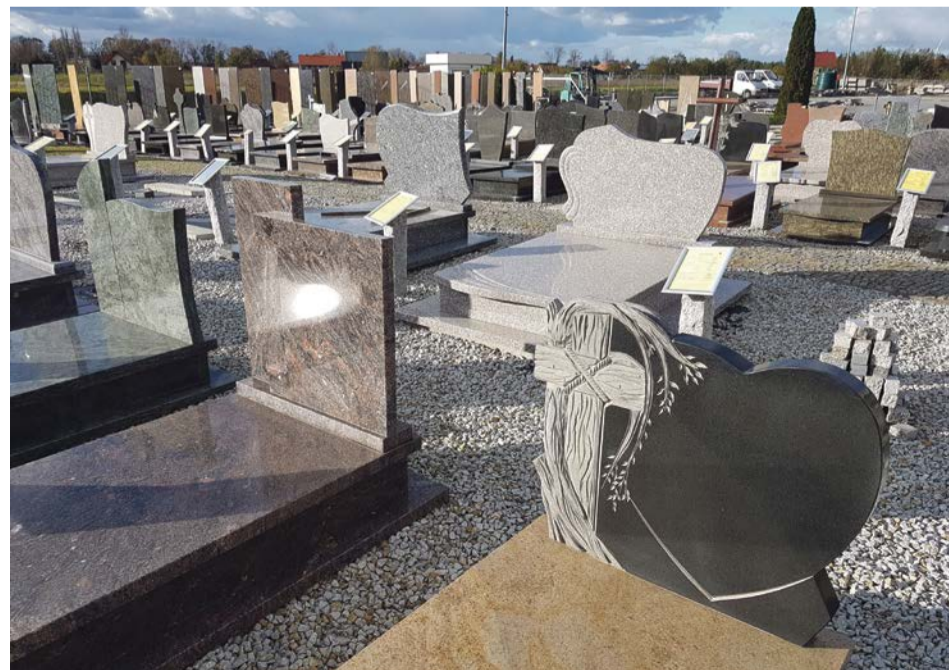
Oferta bogata i jakże różna od tego, jak wykonywało się nagrobki przed laty