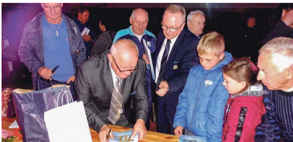
Chętnych do zdobycia autografu autora nie brakowało