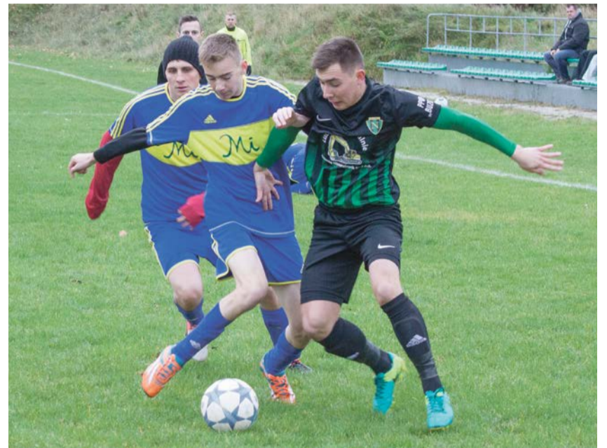
Nysa Przewóz zaczęła spotkanie z przewagą, ale to Mirostowiczanka ostatecznie wygrała spotkanie