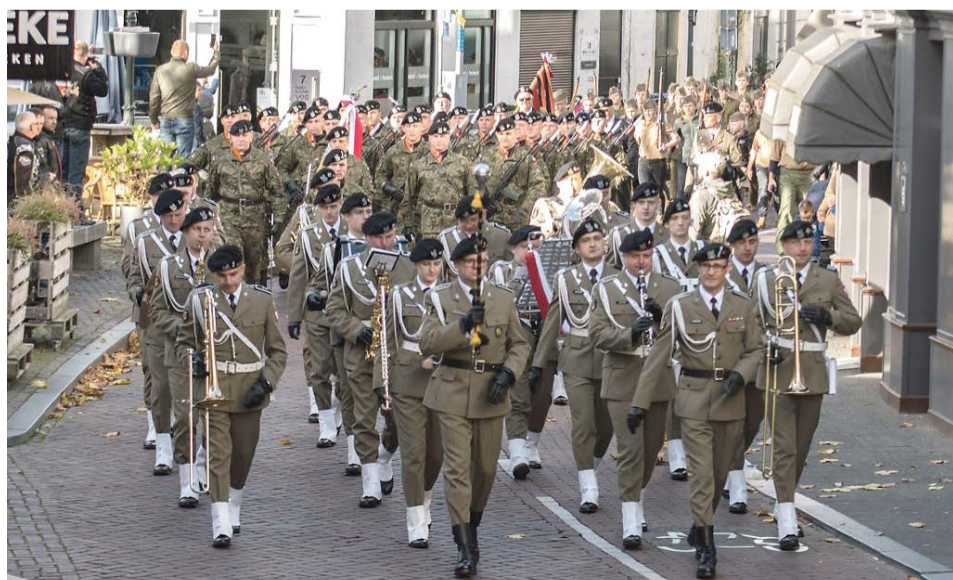
Marsz ulicami miasta wyglądał imponująco. Polskie wojsko prezentowało się znakomicie