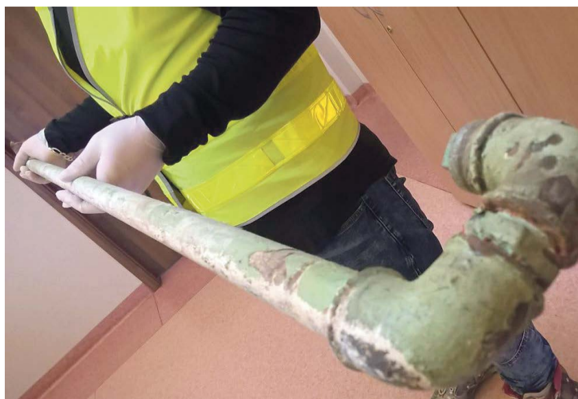
Wyrwana rura została zabezpieczona jako dowód

Do zdarzenia doszło w budynku wielorodzinnym przy ul. Włókniarzy. Policja otrzymała zgłoszenie, że bardzo mocno czuć woń gazu. Na miejsce zostały natychmiast skierowane służby ratownicze. Okazało się, że na klatce schodowej jest wyrwana rura głównego pionu instalacji gazowej. Wydobywał się z niej gaz ziemny. Stężenie gazu było tak duże, że bezpośrednio zagrażało bezpieczeństwu mieszkańców i samej kamienicy. Z sześciu mieszkań budynku trzeba było ewakuować łącznie dziewięć osób dorosłych i jedno dziecko. Strażacy, do czasu przyjazdu pracowników gazowni, zabezpieczyli wyciek gazu. Po usunięciu zagrożenia mieszkańcy mogli bezpiecznie wrócić do swoich domostw. Policjanci zatrzymali do wytrzeźwienia i wyjaśnienia sprawy 52-letniego mężczyznę, podejrzewanego o celowe uszkodzenie – wyrwanie ze ściany rury z głównego