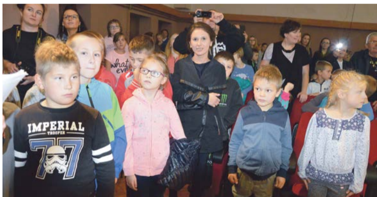
Świadkami byli rodzice i uczniowie