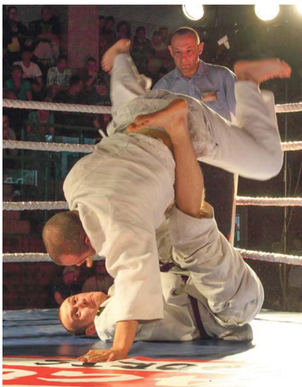
Lubskie gale są świetnym widowiskiem