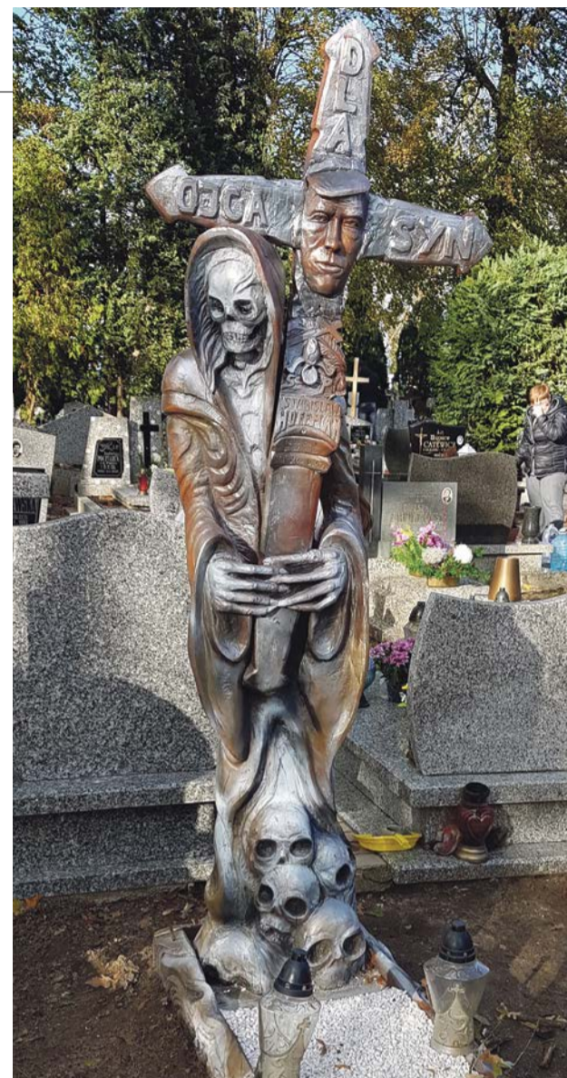
To bardzo indywidualne dzieło artysty może wzbudzać różne odczucia i oceny. Niewątpliwie wyróżnia się wśród otaczających go nagrobków

Część osób bazuje na „modzie cmentarnej”, która funkcjonuje w innych kra-