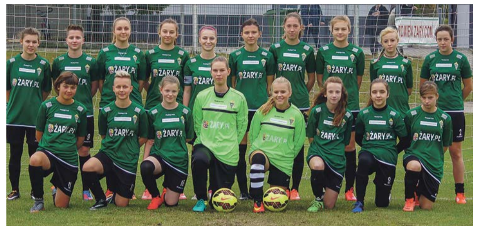
Dziewczyny z żarskiego Promienia na pierwszym miejscu w tabeli

Ostatnie spotkanie ligowe z MUKS 11 Zielona Góra zakończyło się bezpramkowym remisem. Tak więc po trzech meczach podopieczne Roberta Dziadula nadal bez porażki. Paniom gratulujemy wyników i woli walki. ATB