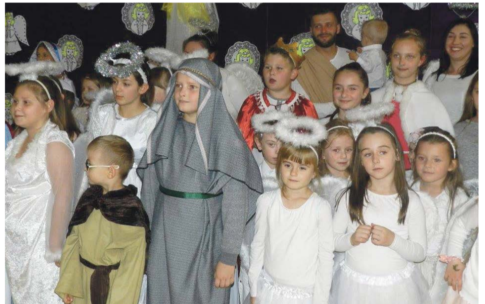
Od razu widać, że to Bal Wszystkich Świętych