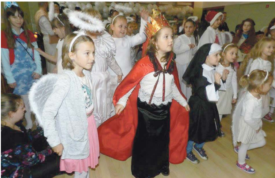
Fantazyjne stroje i dobra zabawa