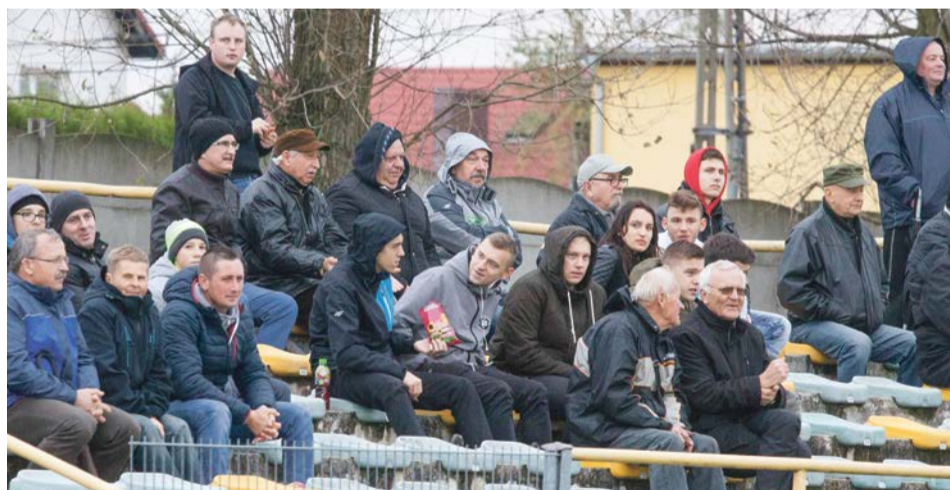
Wszyscy, którzy pomimo zimna przyszli na stadion, mogli obejrzeć interesujące widowisko sportowe