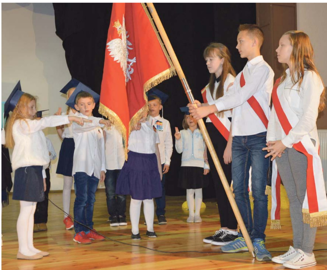
Ślubujemy, ślubujemy, ślubujemy