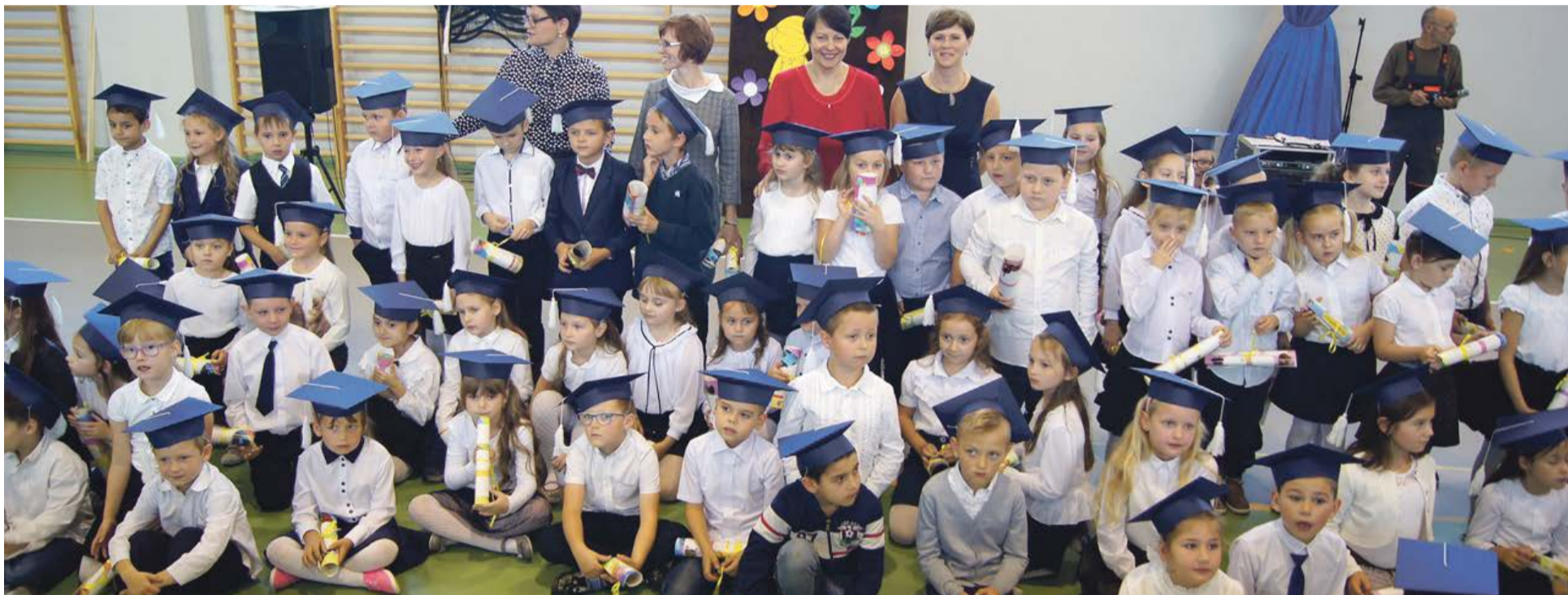
No i po wszystkim. Ślubowanie złożone, odwrotu nie ma - trzeba się pilnie uczyć