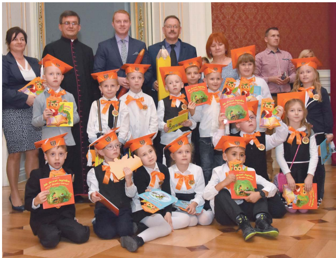
Jeszcze tylko fotka do kroniki naszej szkoły i już