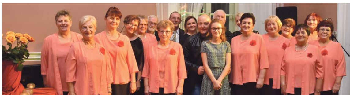
Organizacja koncertów upamiętniających nieżyjących koleżanek i kolegów stała się już w zespole „Pod Różą” tradycją