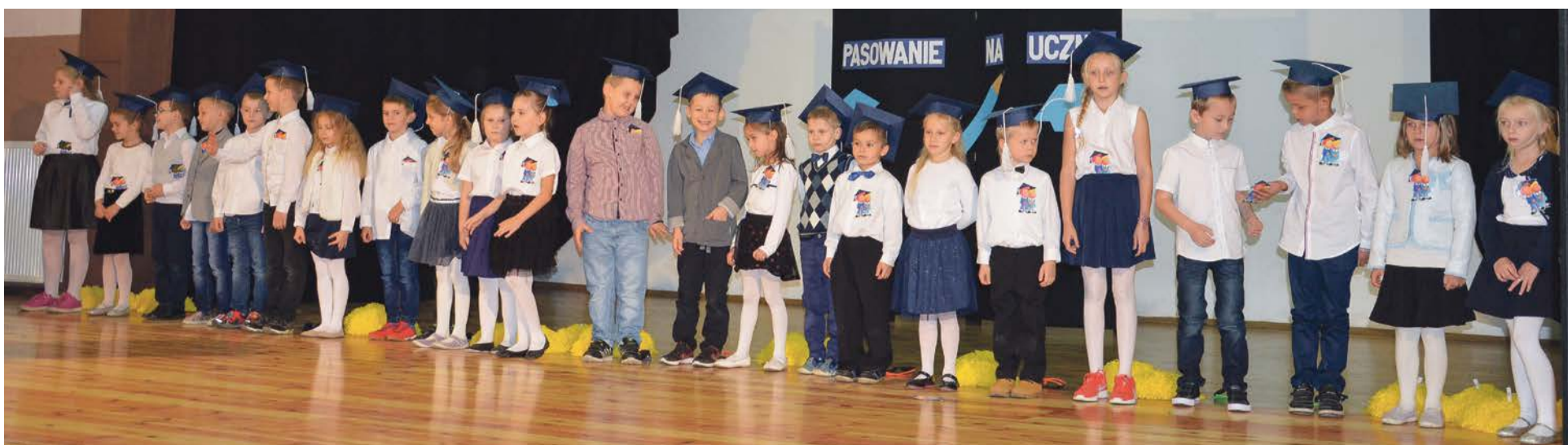
Uczniowie z nas jak się patrzy. Teraz pokażemy na co nas stać