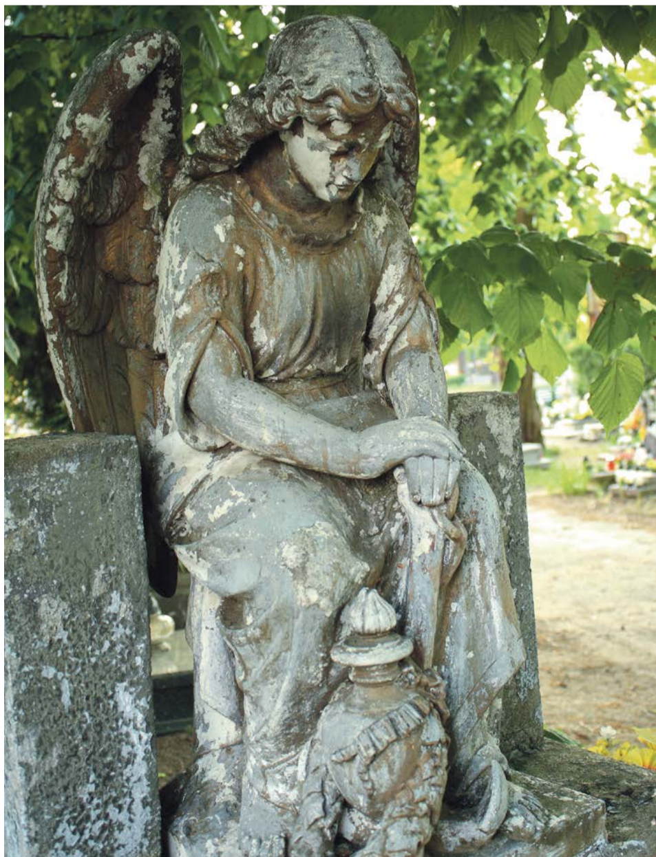
Jedna z nielicznych rzeźb, jakie można zobaczyć na żarskim cmentarzu