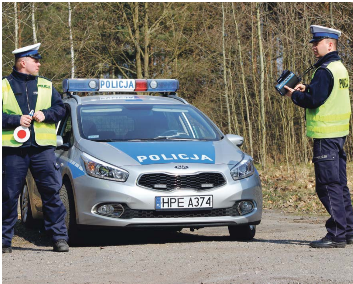
Dobrze jest wiedzieć, jak się zachować w przypadku policyjnego zatrzymania do kontroli

Obowiązki kierowcy są zapisane w rozporządzeniu Ministra Spraw Wewnętrznych i Administracji w sprawie kontroli ruchu drogowego. Uczestnik ruchu jest obowiązany stosować się do poleceń i sygnałów oraz wskazówek wydawanych przez kontrolującego. To podstawa. Jeśli zobaczymy więc sygnał do zatrzymania pojazdu,