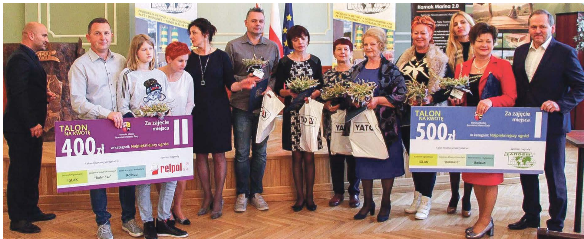
W ratuszu wręczono nagrody i wyróżnienia