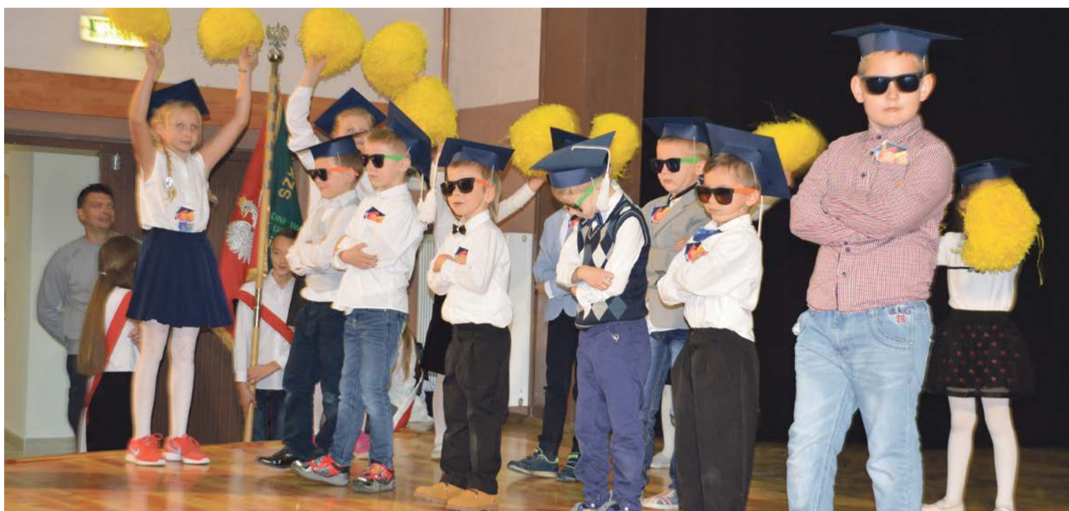
Ślubowanie poprzedził program artystyczny

Zanim jednak to nastąpiło, to najpierw na scenie miejscowej filii Żarskiego Domu Kultury można było podziwiać specjalnie na tę okazję przygotowany program artystyczny. Pierwszoklasiści, zarówno podczas programu artystycznego i ślubowania udowodnili, że mają prawo być pełnoprawnymi uczniami. Wydaje się, że większą treść mieli rodzice, którzy z dumą fotografowali swoje pociechy. Przed pierwszoklasistami czas wyťažonej nauki i nawiązywania szkolnych przyjaźni. Trzymamy za wszystkich kciuki. PAS