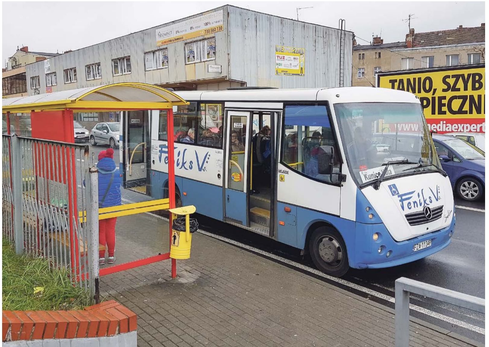
Podstawowa problem jest taki, aby dzięki darmowej komunikacji miejskiej udało się zmniejszyć liczbę samochodów na żarskich ulicach

Nie chodzi o to, żeby do autobusów przekonać już przekonanych. Ci, którzy dziś korzystają z takich środków transportu, nadal będą z nich korzystał. Ważne, aby zaczęli korzy-