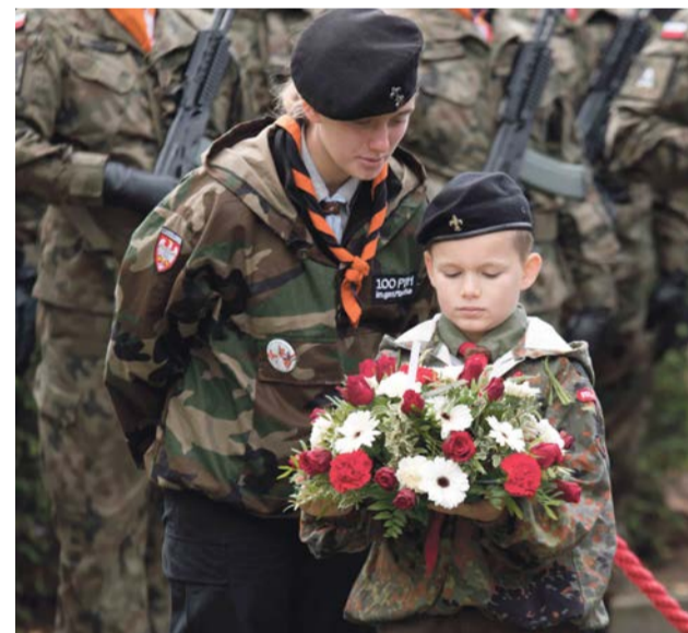
Młode pokolenie uczy się szacunku