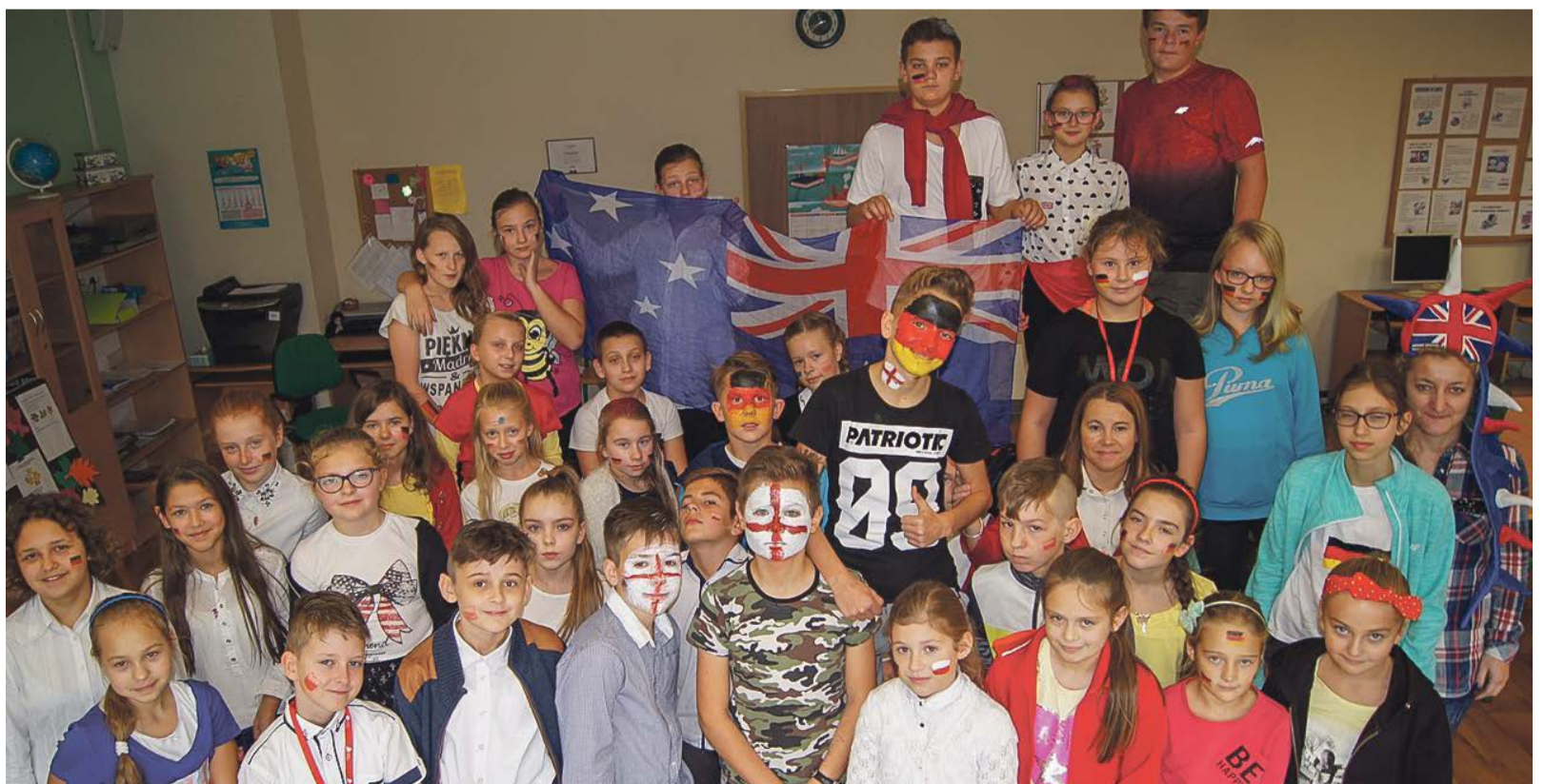
Organizacja Dnia Języków Obcych to dobry pomysł na poszerzenie wiedzy o krajach, gdzie na co dzień rozmawia się po angielsku lub niemiecku

Nauczyciele języka angielskiego i niemieckiego przygotowali dla uczniów wiele ciekawych atrakcji. Uczniowie klas IV-V wykonali interesujące prace artystyczne, których tematyka dotyczyła wiedzy o kulturze, geografii i historii - głównie krajów europejskich. Wszystkie prace zostały zaprezentowane w głównym holu szkoły. Następnym etapem było głosowanie na najpiękniejszy plakat. Ponadto, wybrani uczniowie z klas VI-VII, rozwiązywali quiz kulturowy sprawdzający wiedzę o krajach anglo- i niemieckojęzycznych. oprac. PaS