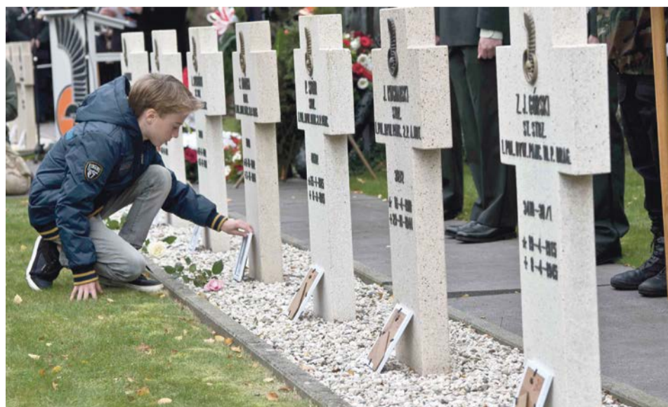
Polscy żołnierze spoczęli w holenderskiej ziemi. Pamiętamy o ich czynie