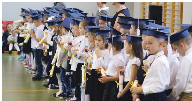
Jest nas całkiem sporo

było uroczyste ślubowanie i pasowanie pierwszoklasistów. Po złożeniu przyrzeczenia każde dziecko zostało pasowane na ucznia poprzez symboliczne dotknięcie lewego ramienia dużym ołówkiem, który jest znaczącym atrybutem tego ceremoniału w szkole. Na zakończenie, bohaterowie uroczystości otrzymali pamiątkowe dyplomy. Uwieńczeniem imprezy był poczęstunek dla pierwszaków przygotowany przez rodziców. oprac. PaS