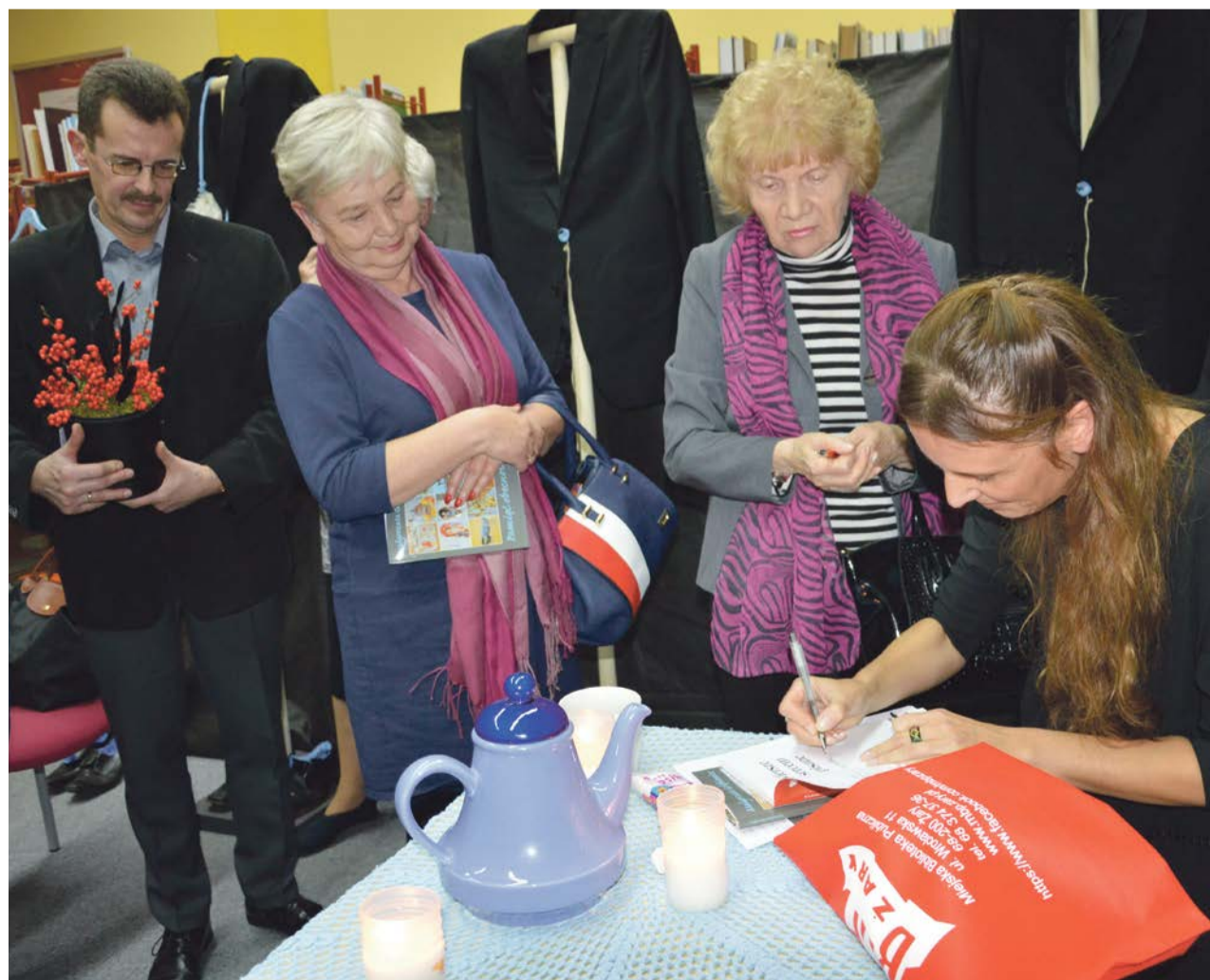
Po wpis autorki ustawiła się kolejka uczestników spotkania