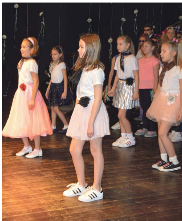
Tańczymy, śpiewamy, gramy