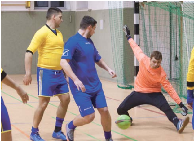
Bramkarze mają pełne ręce i nogi roboty