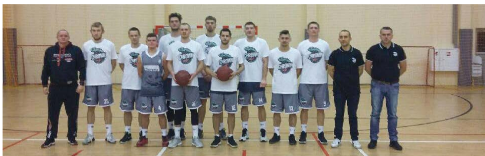
Żary na czele tabeli trzecioliigowej koszykówki

Szczawno Zdrój. UKS Chromik na meczu wyjazdowym pokonał lidera 85:75. Już w pierwszej kwarta zakończyła się 15-punktową przewagą, a trzecia aż 20-punktową. Wynik meczu zdetronizował Szczawno Zdrój i od tego momentu pierwszą lokatę objęli koszykarze z Żar. Obydwie drużyny mają na swoim koncie po 15 punktów, 7 zwycięstw i po jednej porażce. Na trzecim miejscu jest KK Oleśnica z jednopunktową stratą. ATB