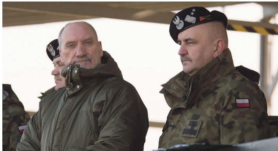
Minister Macierewicz podkreślił, że ćwiczenie stworzyło możliwość, aby zobaczyć po raz pierwszy w praktycznym funkcjonowaniu bojowym armatohaubicę Krab oraz moździerz samobieżny Rak - jedne z najlepszych systemów bojowych

Tegoroczna edycja ćwiczenia BORSUK odbywała się od 20 listopada na trzech poligonach: w Wędrzynie, Żaganii i Świętoszowie. Szkoliło się ponad 3000 żołnierzy, w tym żołnierze amerykańscy z 2 Pancernej Brygadowej Grupy Bojowej (ABCT) stacjonującej w Żaganii. Podczas ćwiczenia zaangażowanych było blisko 600 jednostek sprzętu wojskowego, m.in. kołowy transporter opancerzony Rosomak, wyrzutnia raketowa Langusta,