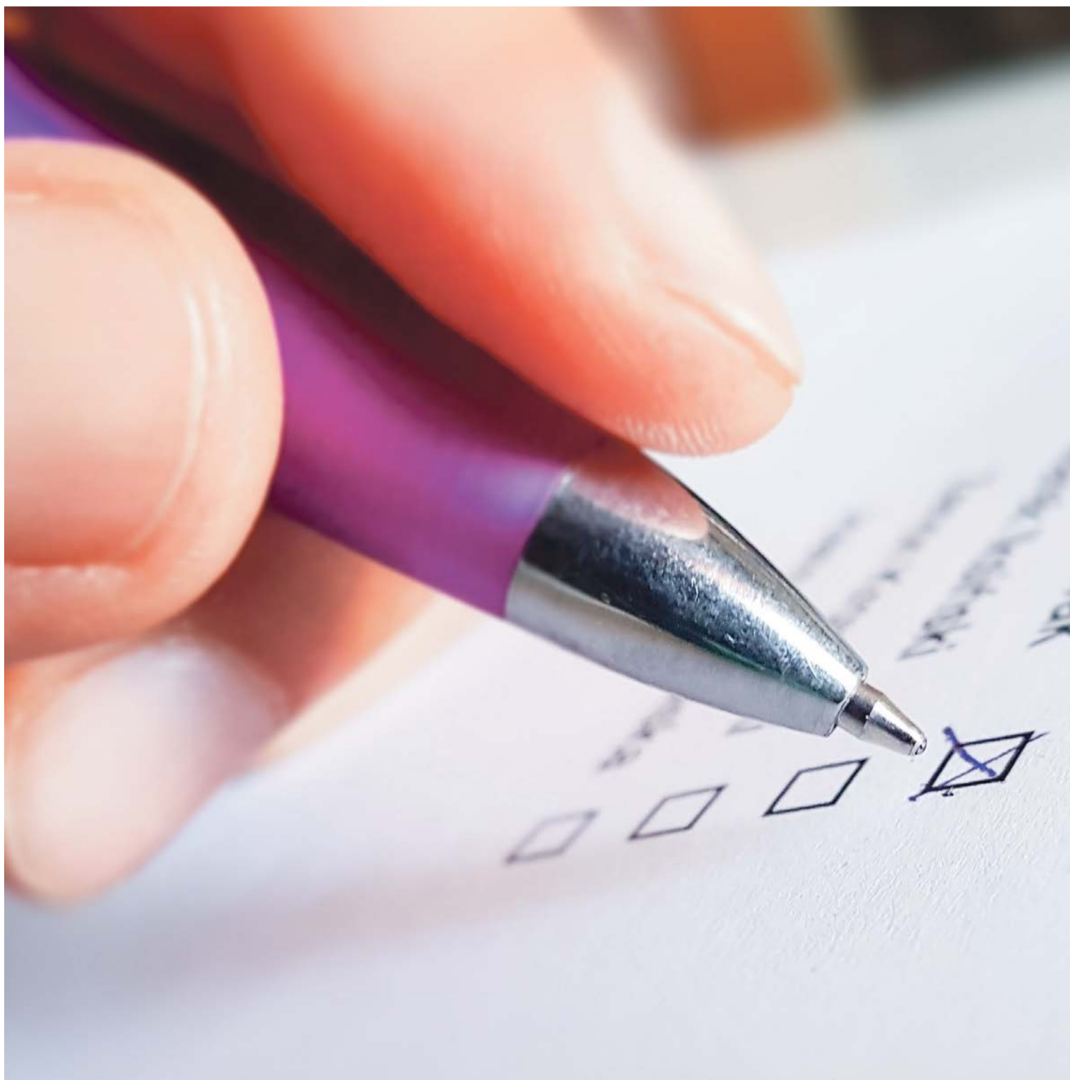
W przyszłorocznych wyborach samorządowych pewne jest tylko jedno - idziemy do lokalu wyborczego i oddajemy głos na swoich kandydatów. Cała reszta może się zmienić. Pożyjemy, zobaczymy

Podobnie w założeniach prosty system wyborczy zaczął trzy lata temu obowiązywać radnych gminnych. W okręgu składającym się z kilku ulic, lub dzielnic, wybieraliśmy jednego przedstawiciela do rady miasta. Nie ważne ilu było chętnych, wolne miejsce