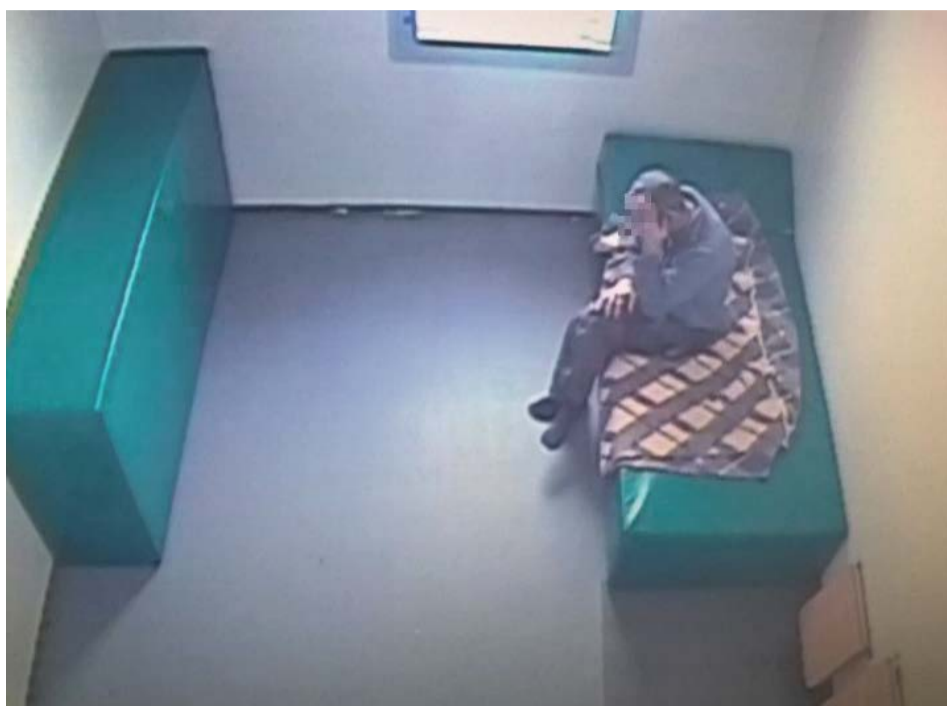
Pięć lat może spędzić za kratami kierowca, który nie dość, że był pijany i agresywny, to miał jeszcze zakaz prowadzenia samochodu

Policjanci z Ognia Patrolowo-Interwencyjnego z Komendy Powiatowej Policji w Żaganiu zauważyli na ul. Kożuchowskiej jadący z naprzeciwka samochód osobowy m-ki VW. Tor jazdy auta wskazywał, że kierowca może być pijany. Policjanci natychmiast zawrócili radiowóz - włączyli sygnały świetlne i dźwiękowe, aby zatrzymać auto. Mężczyzna kierujący samochodem nie