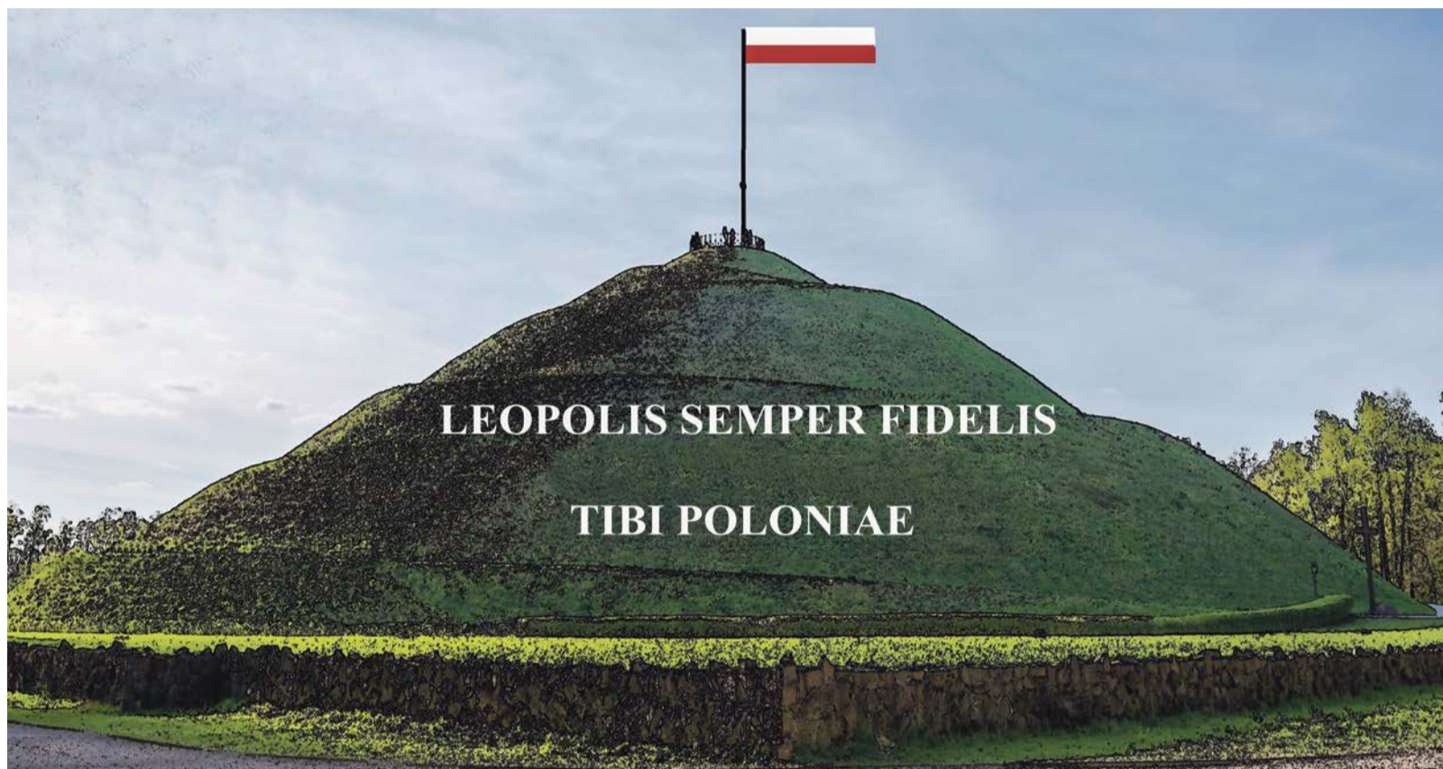
Tak może wyglądać Kopiec Obrońców Lwowa