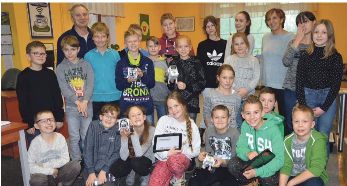
Nie tylko same warsztaty były ciekawe i emocjonujące - wspólne zdjęcie też wywołało dużo emocji

m.in. na zwiększanie prędkości robota, zmiany kierunku obrotu silników, co z kolei pozwalało skręcać, wymijać przeszkody, driftować. Roboty posiadały również liczne programowalne czujniki np. zatrzymujące pojazd przed przeszkodami, rozpoznające kolory, reagujące na dotyk. Następnie każdy zespół musiał przygotować program dzięki któremu robot wykonywał określone zadania. Na koniec, kiedy wszystkie ekipy były już dobrze przeszkolone, odbyły się wyścigi robotów. PAS