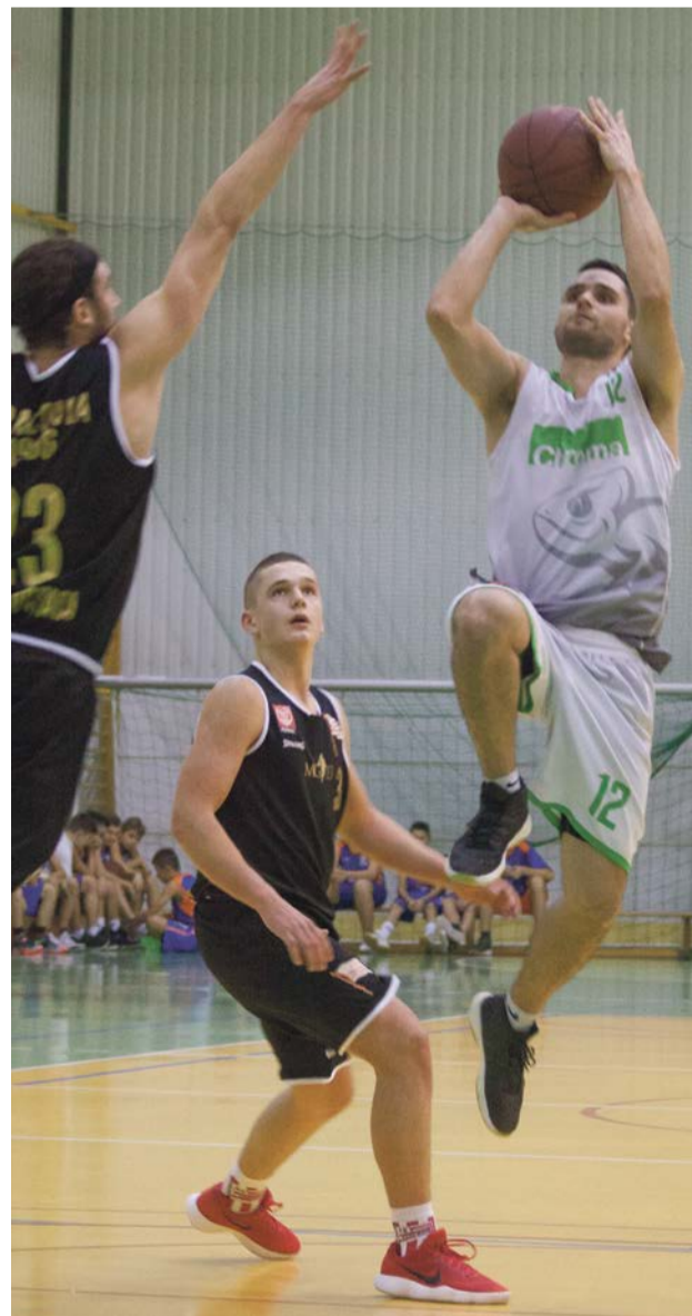
Cracovia zapamięta wizytę w Żarach