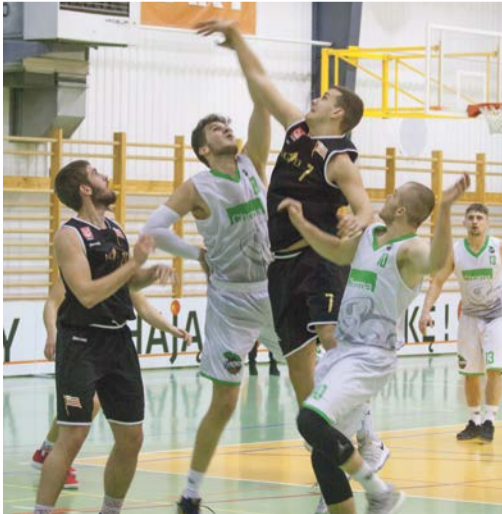
O piłkę trzeba było powalczyć