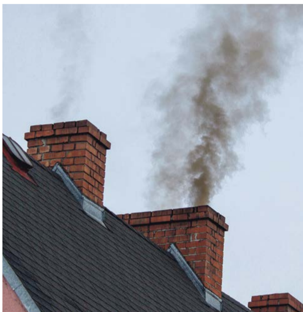
Urzednicy podkreślają, że najważniejszym celem udzielanych dotacji jest uzyskanie jak najlepszego efektu ekologicznego

Nowością wprowadzoną na rok przyszły jest umożliwienie ubiegania się o dofinansowanie do kwoty 20 tys. złotych przez wspólnoty mieszkaniowe, które posiadają jedną wspólną kotłownię.