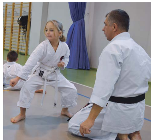
To się nazywa postawa