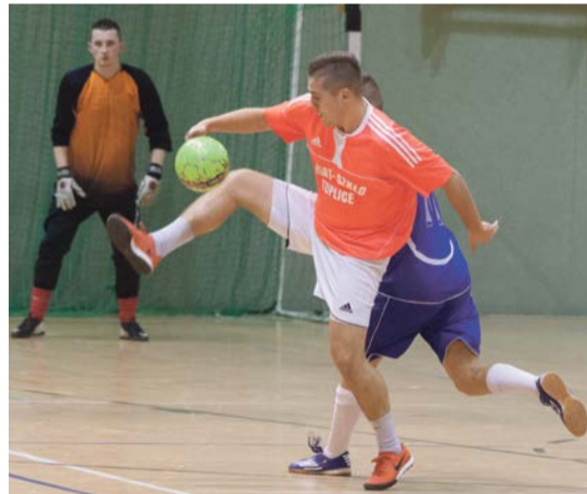
Dynamiczne akcje mogą podobać się kibicom