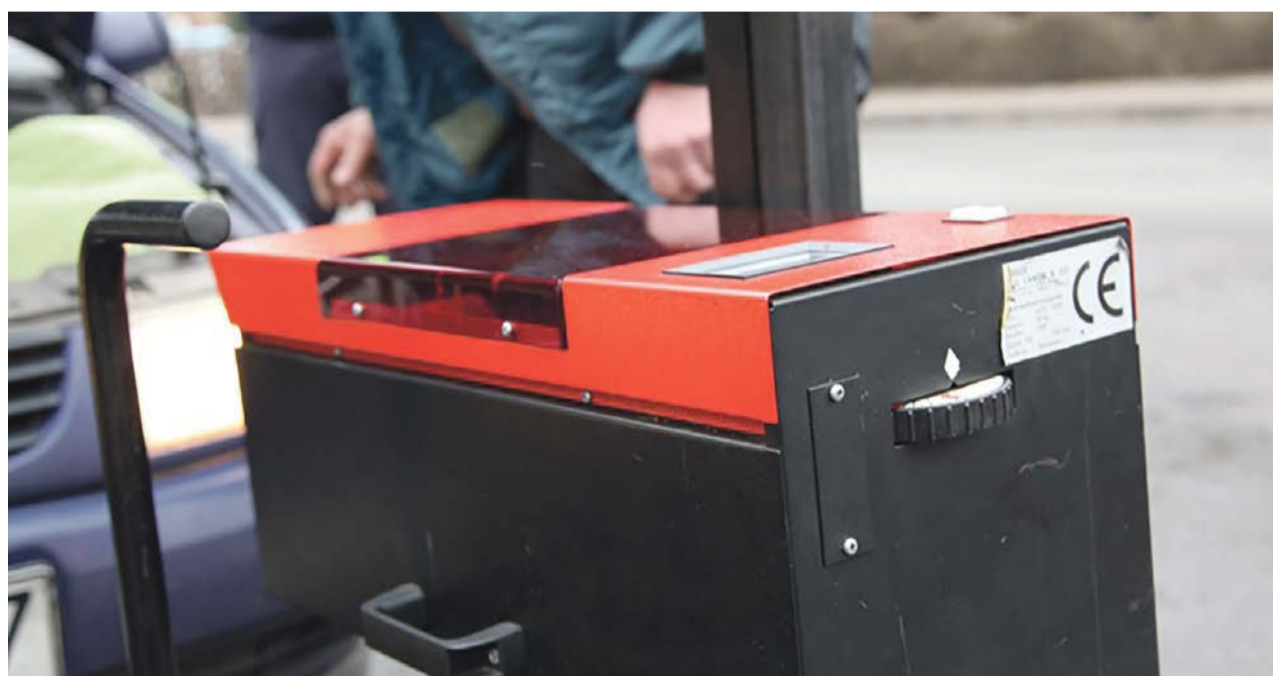
Prawidłowo ustawione światła to gwarancja bezpieczeństwa

REGION Żarska drogówka włączyła się w akcję pn. „Twoje światła - Twoje bezpieczeństwo”. Policjanci uświadamiają kierowcom, jak ważne dla bezpieczeństwa jest sprawne i prawidłowo działające oświetlenie pojazdu.