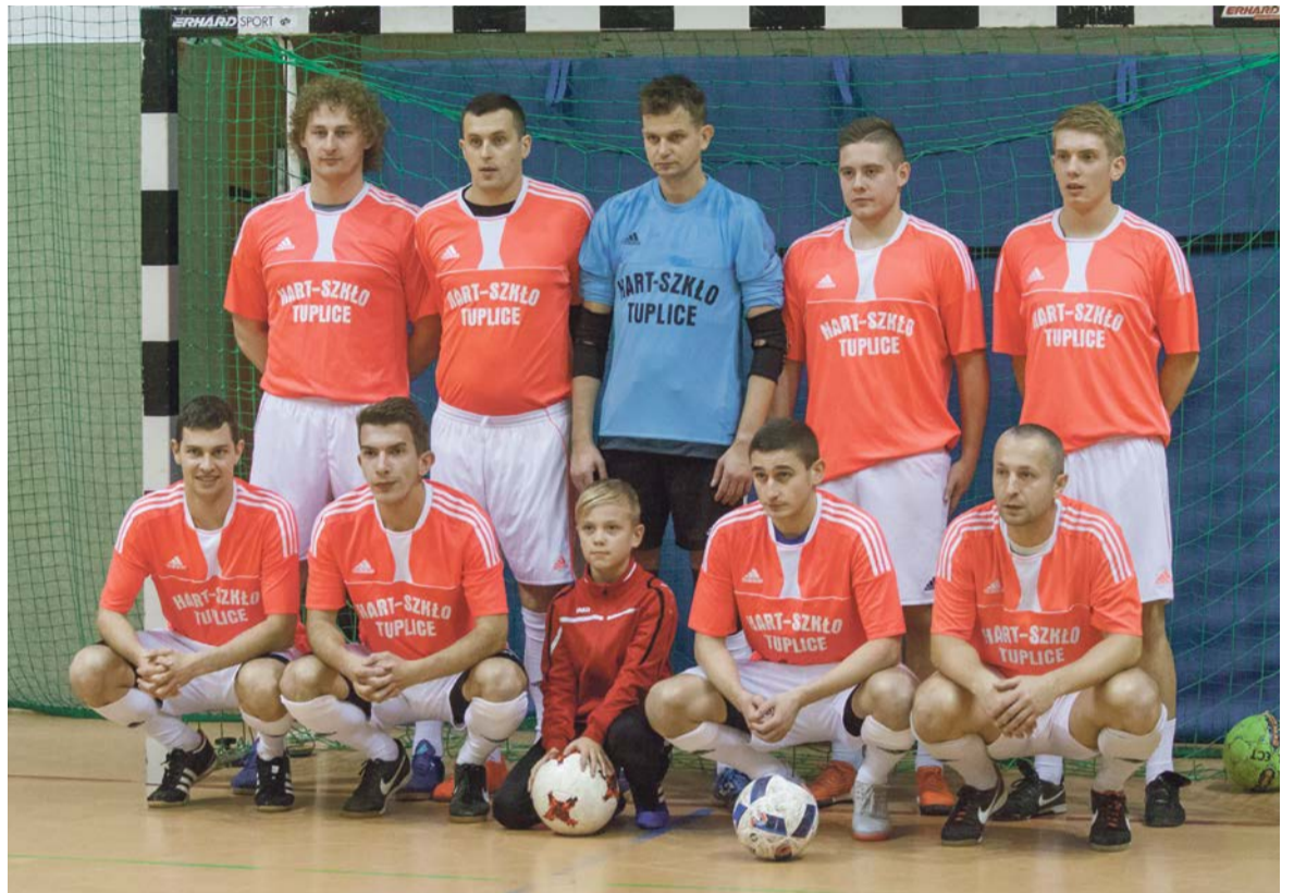
Reprezentacja Hart Szkło Tuplice wygrała poprzedni sezon Żarskiej Ligi Futsal. Tuż za nimi uplasowała się Unia Kunice, a na trzeciej pozycji była Mirostowiczanka

Z uwagi na brak dostępności hali, w najbliższy weekend zostaną rozegrane tylko dwa mecze. ATB