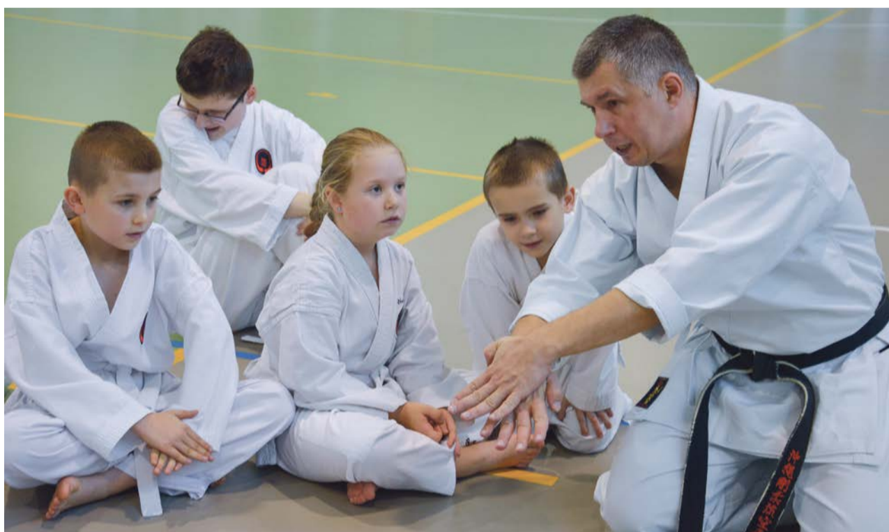
Najmłodszy adepci z zacięciem słuchali mistrza

Najmłodszy adepci mieli okazję przekonać się, jak wymagający jest sensei Tomasz. Byli jednak na tyle dobrze przygotowani, że pomyślnie zdali egzamin. PAS