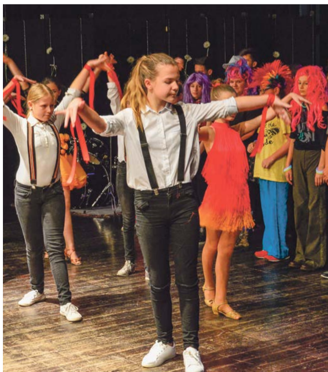
Uczniowie przygotowali bogaty program artystyczny