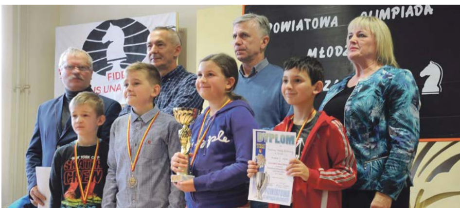
Najlepszych udekorowano medalami

W „Licealiadzie” zwyciężyło Społeczne Liceum Ogólnokształcące w Żarach. Na drugiej pozycji znalazł się Zespół Szkół Ekonomicznych w Żarach, na trzeciej - Zespół Szkół Ogólnokształcących i Ekonomicznych w Lubsku. Katolickie Liceum Ogólnokształcące w Żarach było czwarte, natomiast piąte miejsce przypadło Zespołowi Szkół Technicznych w Lubsku. ATB