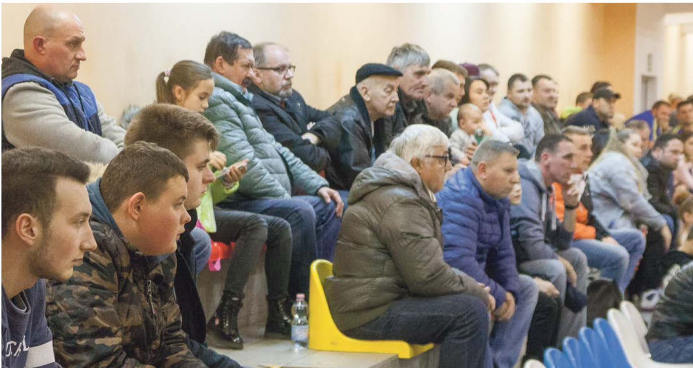
Po zakończonych rozgrywkach ligowych piłki nożnej, kibice przesiadli się na cieplejsze trybuny