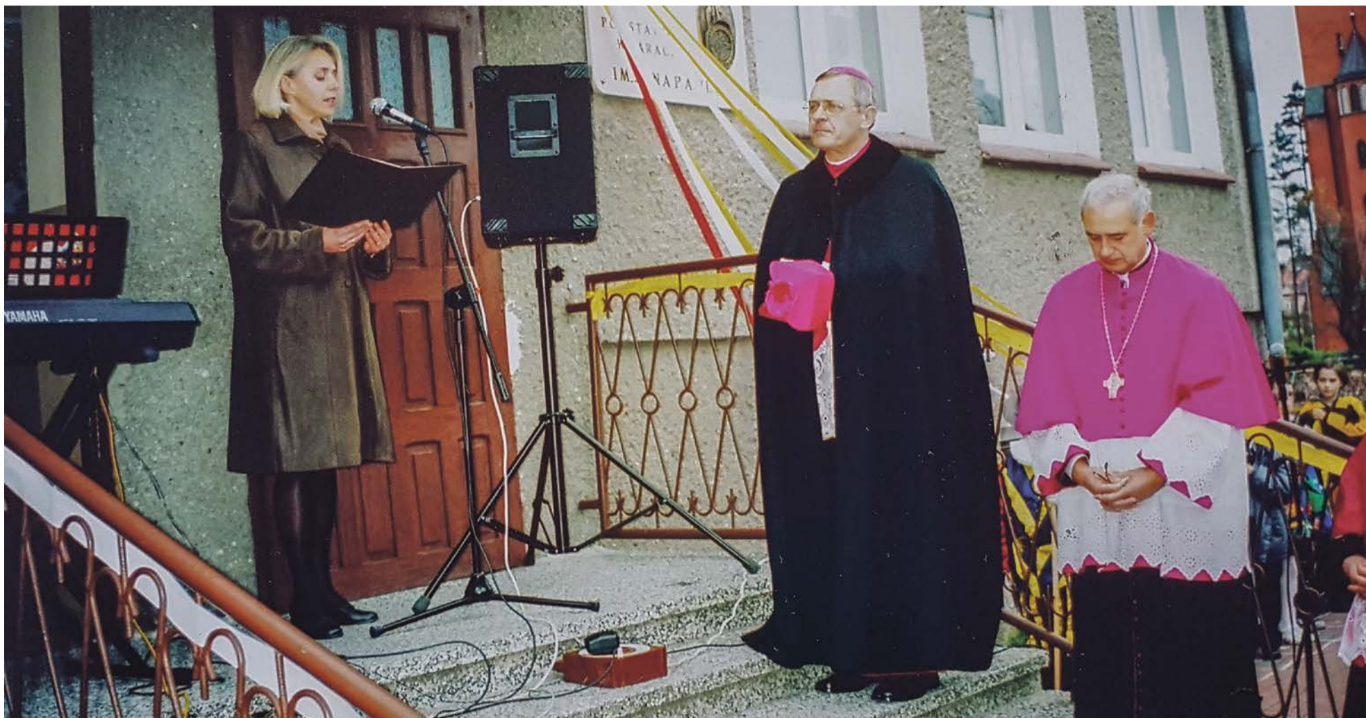
Szkoła katolicka ruszyła dwadzieścia lat temu