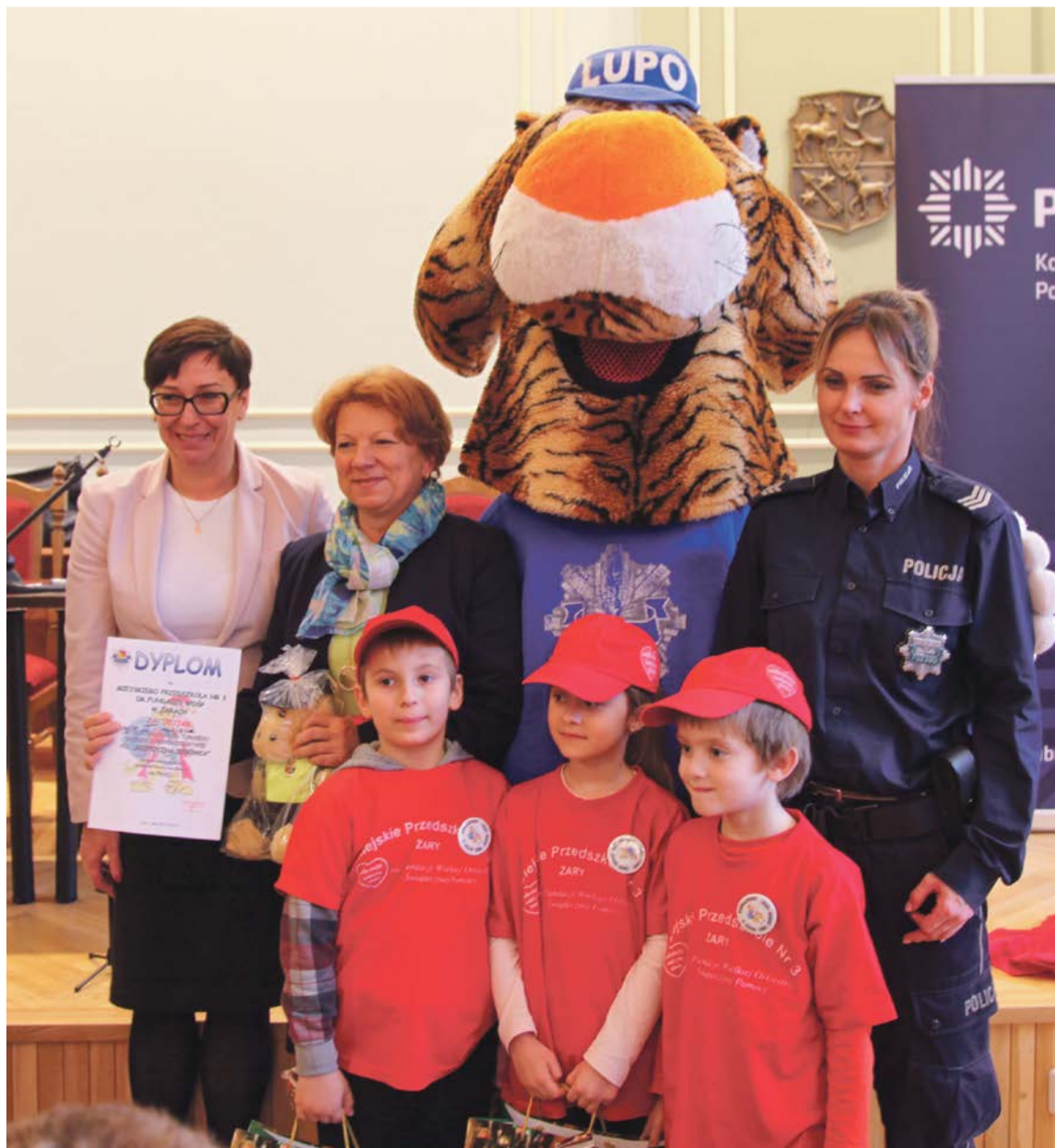
Pamiątkowe zdjęcie z tygrysem „Lupo” to prawdziwa frajda

I miejsce - drużyna z Miejskiego Przedszkola nr 3 w Żarach II miejsce - drużyna z Oddziału Przedszkolnego w Złotniku III miejsce - drużyna z Niepublicznego Przedszkola w Mierkowie