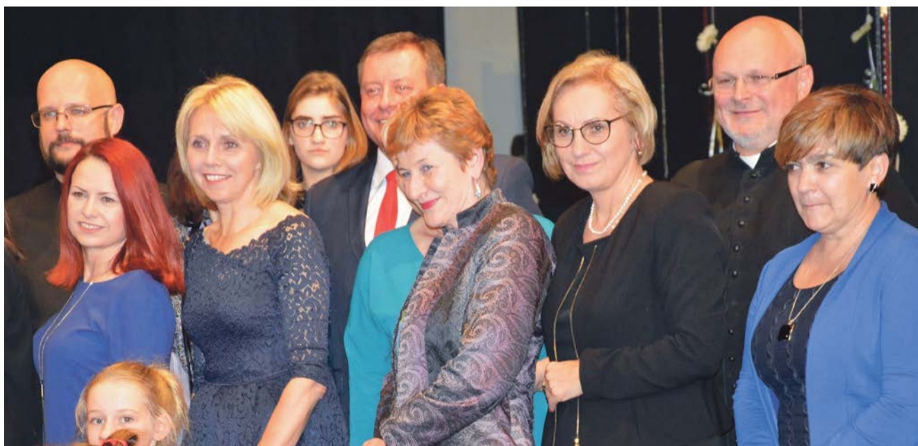
Po dwudziestu latach szkoła ma wielu przyjaciół. Podczas uroczystego jubileuszu w sali „Luna” były tłumy