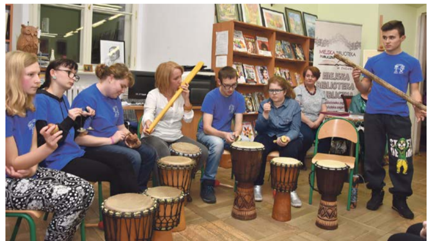
Wernisażowi towarzyszyła muzyka na żywo