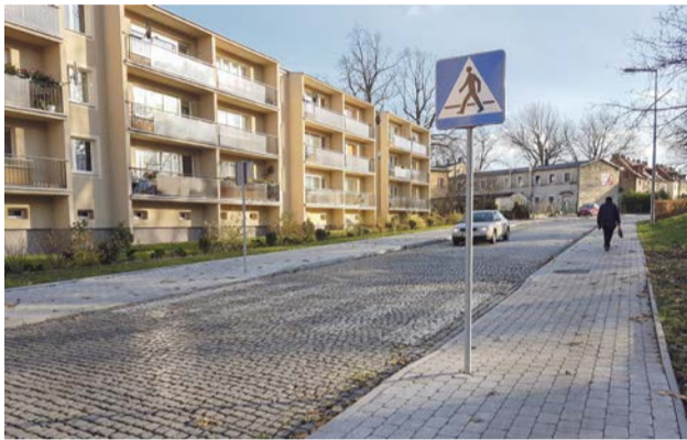
Nowe chodniki przy ul. Zakopiańskiej zupełnie zmieniły obraz tej ulicy

kom na podstawie umowy polecenia wykonania bieżącego utrzymania, jak i przebudowy oraz remontów dróg gminnych wykonała prace na łącznej powierzchni prawie 12 tysięcy metrów kwadratowych - mówi Rafał Fularski, naczelnik wydziału infrastruktury urzędu miejskiego w Żarach. - Myślę, że w znaczący sposób poprawiła się jakość tych dróg, co na pewno wpłynie na bezpieczeństwo.