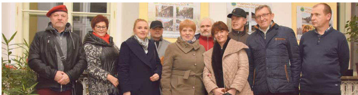
Przed członkami „Ogniwa” kolejny rok turystycznych wojaży

imprezy cykliczne takie jak: Rajd Rowerowy po Ziemi Żagańskiej, Dzień Turystyki oraz Rajd Rowerowy Odra Nysa. Uczestnicy spotkania obejrzeni bogatą dokumentację fotograficzną i filmową z organizowanych imprez i ustalili plany wyjazdów turystycznych na nadchodzący rok. JM