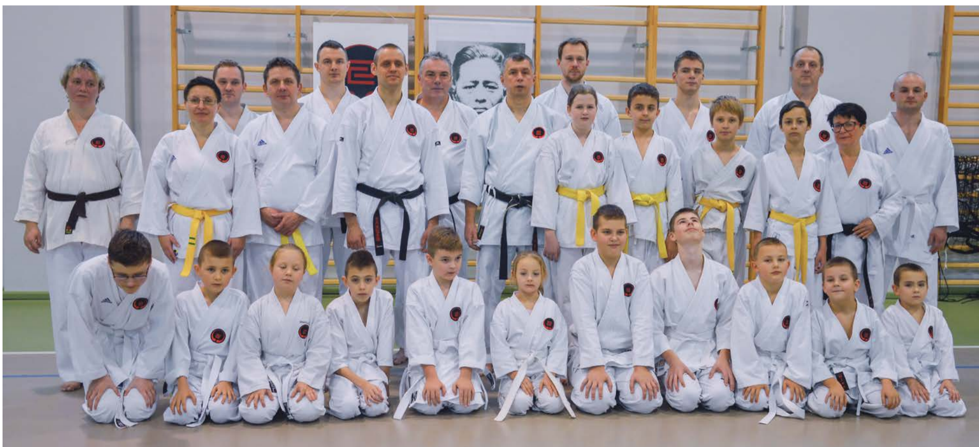
Po zgłębieniu tajników sztuki oraz pomyślnym egzaminie przyjdzie czas na doskonalenie umiejętności