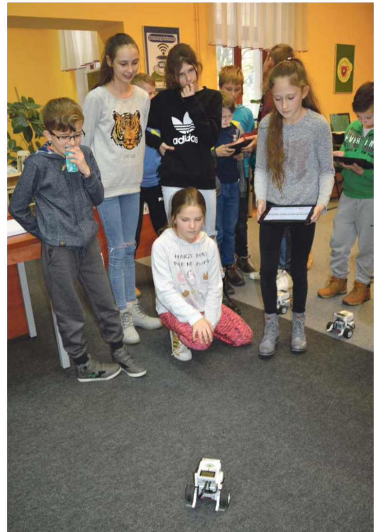
Uczniowie mogli sprawdzić w praktyce efekty swojej pracy