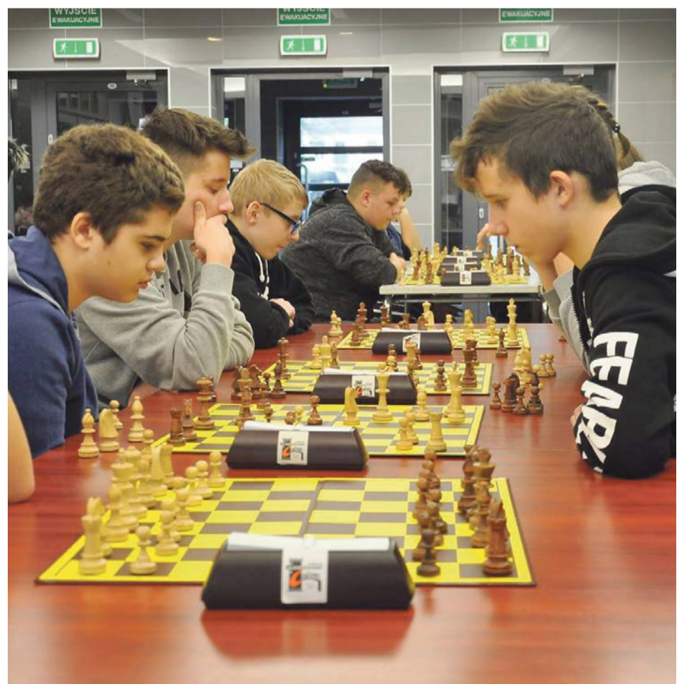
Rywalizacja w ciszy i skupieniu