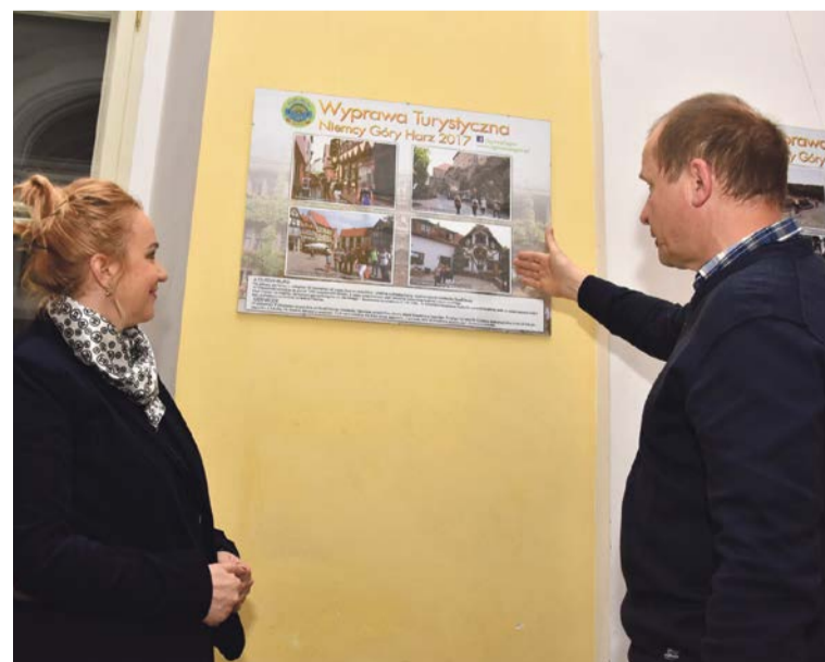
Wystawa fotograficzna była okazją do wspomnień