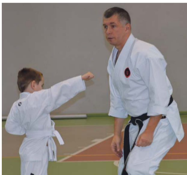
Mniejszy może pokonać większego