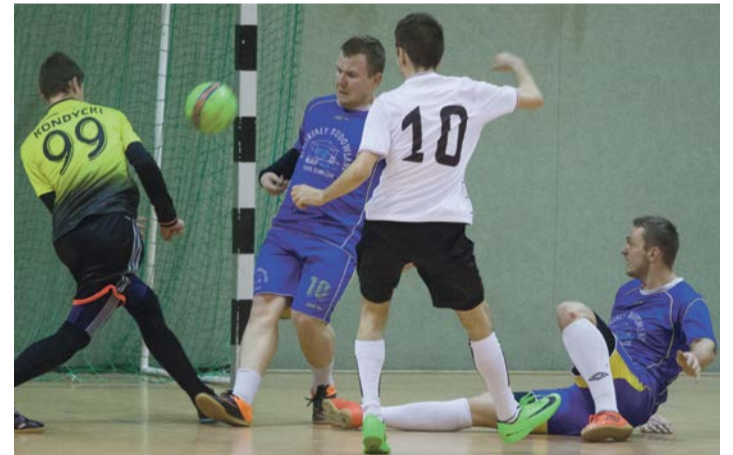
W turnieju wpada sporo bramek, to specyfika futsalu