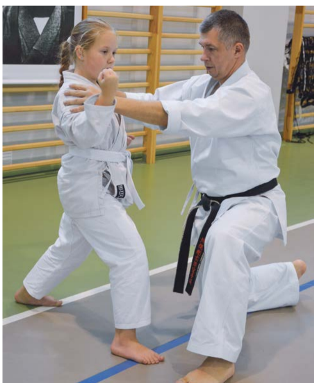
Tak. Dobrze, dobrze