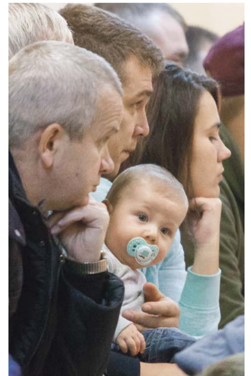
Najmłodsi kibicują