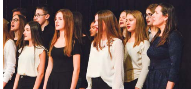
Edukacja i wychowanie poprzez odwołanie się do nauki kościoła katolickiego