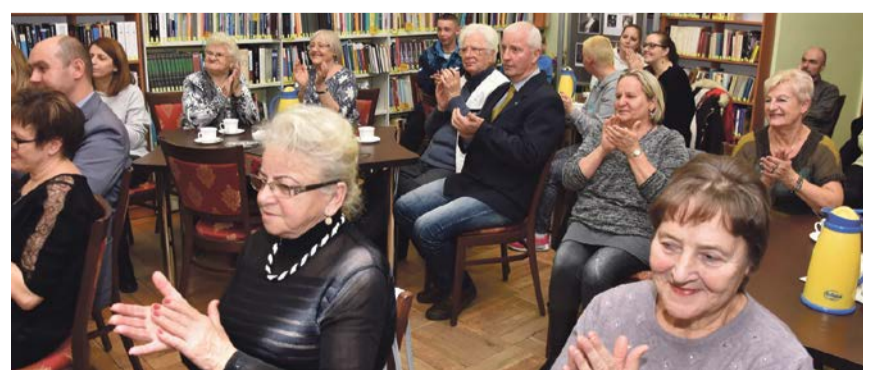
Nie brakowało przyjaciół i miłośników sztuki