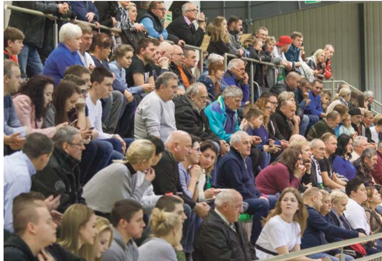
Kibice w napięciu do ostatniej sekundy