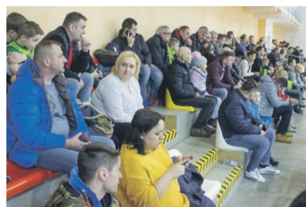
Na brak kibiców Mundial nie narzeka