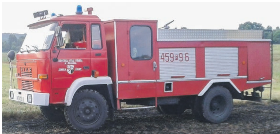
Taki samochód można kupić za mniej niż 10 tys. zł

Jak informuje Leszek Mrozek, wójt gminy Ża-