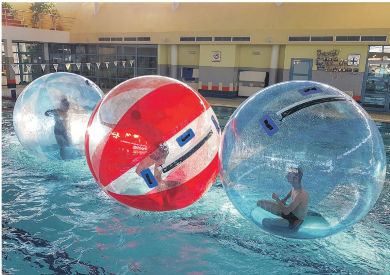
Testy wypadły pomyślnie. Będzie zabawa

To nowa atrakcja zakupiona przez miejski Ośrodek Sportu, Rekreacji i Wypoczynku. Po feriach zniknie z Wodnika i pojawi się dopiero w czerwcu na otwartym basenie przy ulicy Źródlanej. Specjalnie do tego celu zakupiony zostanie dodatkowy płytki basenik, aby nie przeszkadzać w pływaniu i wodnej rekreacji. Jednak póki co, w pierwszą i drugą środę ferii będzie można sprawdzić, jak to działa. Zajęcia sportowo-rekreacyjne na Wodniku w dniach 12-15 i 19-23 lutego rozpoczynają się zawsze o go-