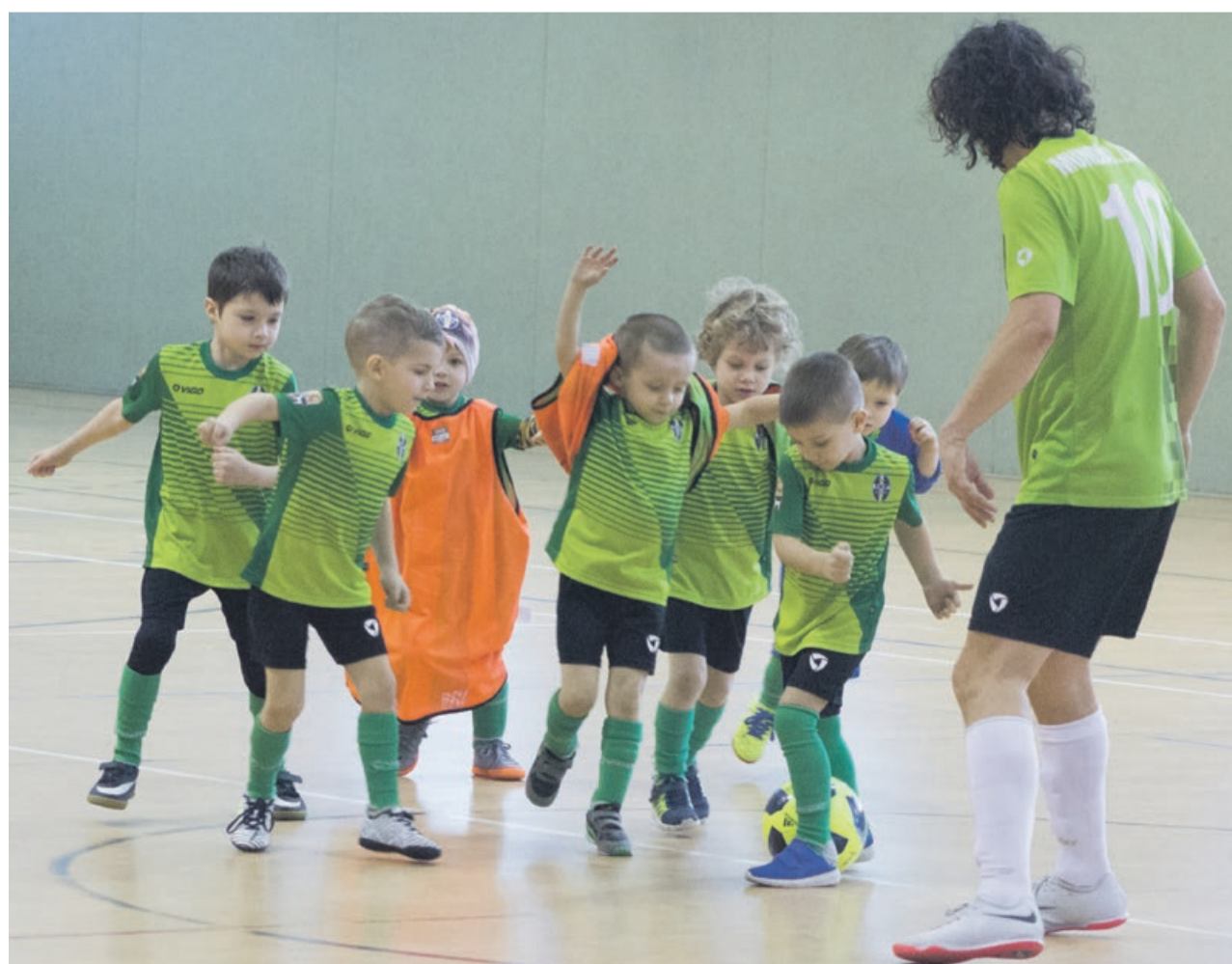
W przerwie ostatniego meczu na boisko wyszli najmłodsi piłkarze