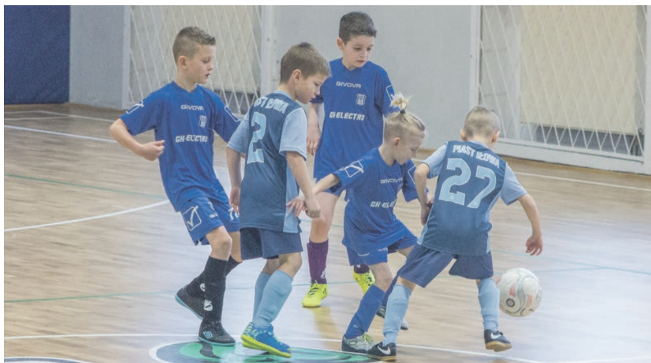
Woli walki nie brakowało