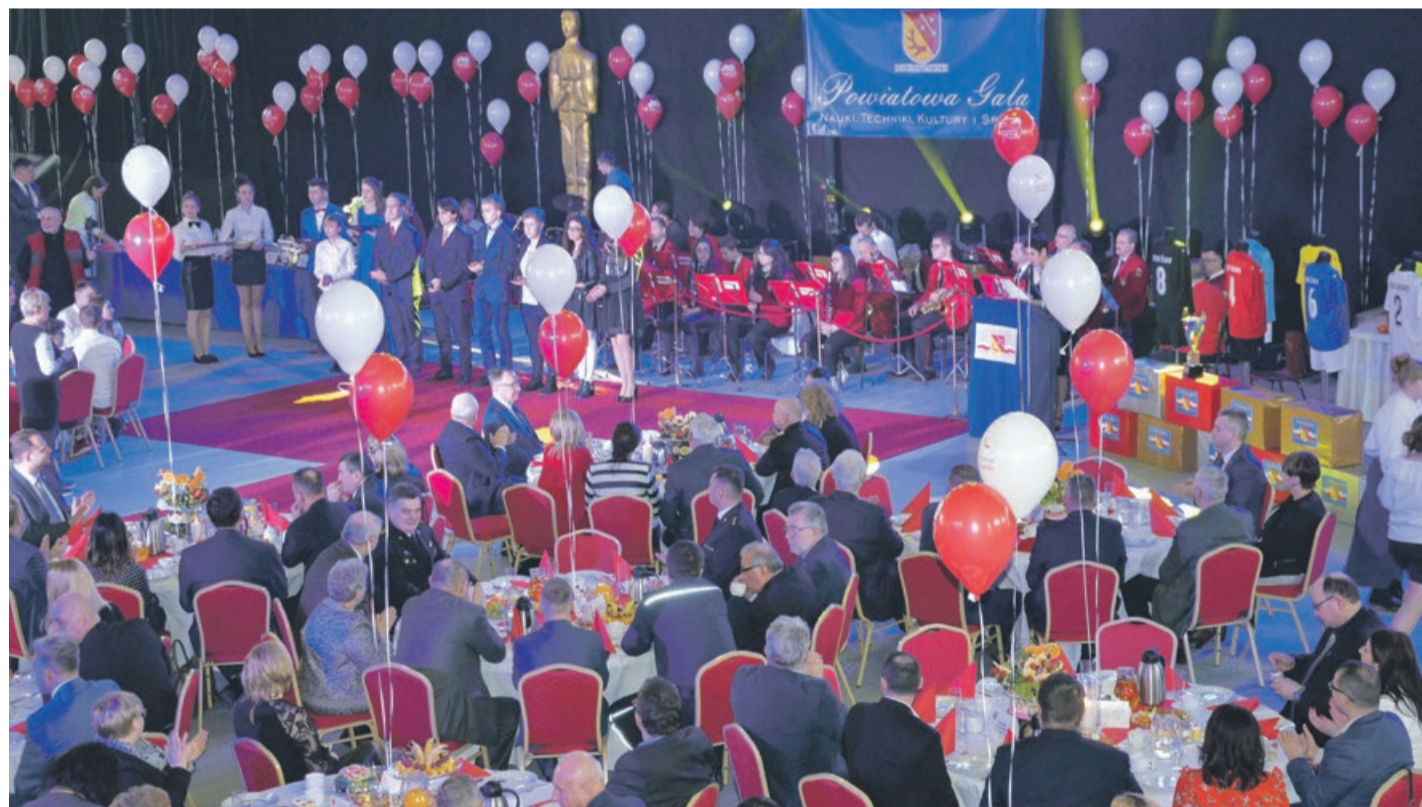
Hala Powiatowego Centrum Sportu była profesjonalnie przygotowana na obsługę uroczystości