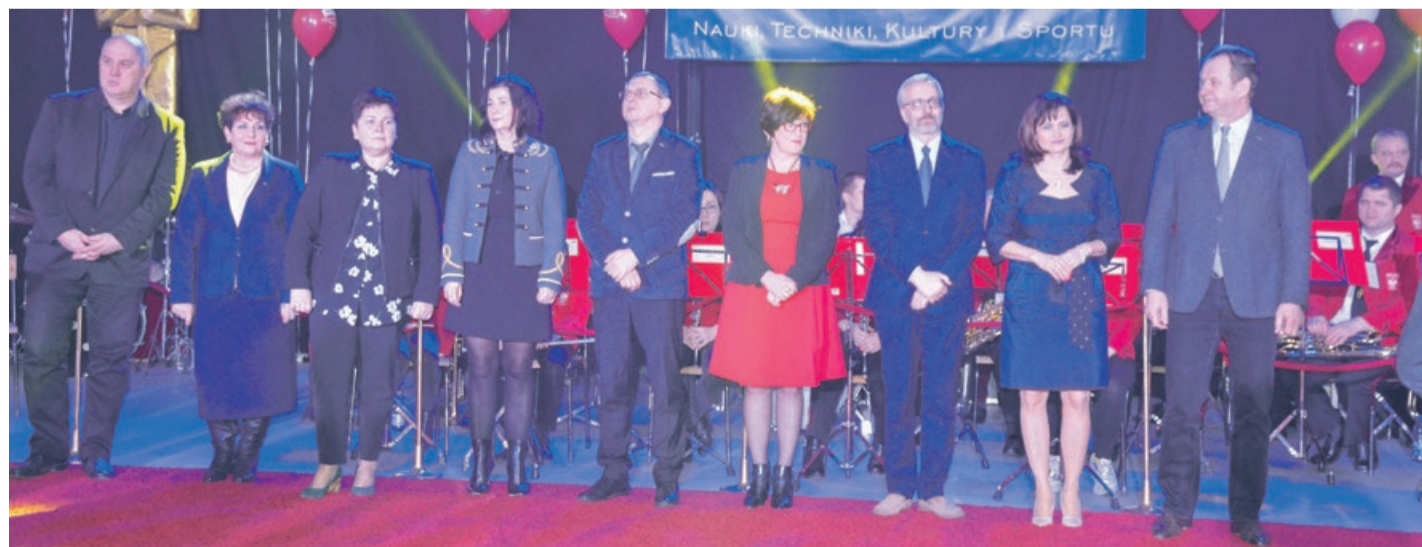
Dyrektorzy wyróżnionych szkół odebrali laury Powiatowej Olimpiady Młodzieży 2016/2017