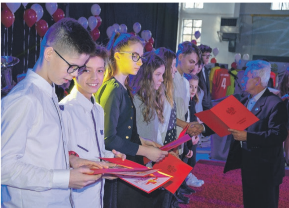
Warto było się przyłożyć, żeby teraz odebrać nagrody