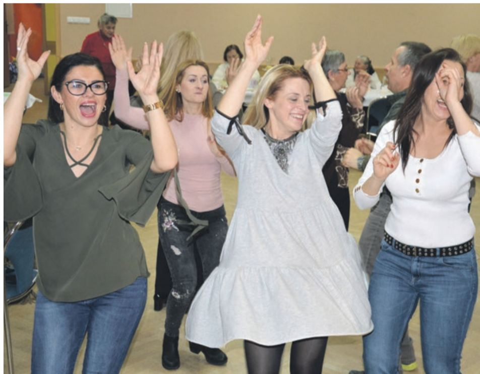
Jak się bawić, to się bawić