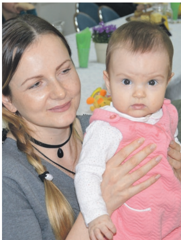
My też się dobrze bawimy