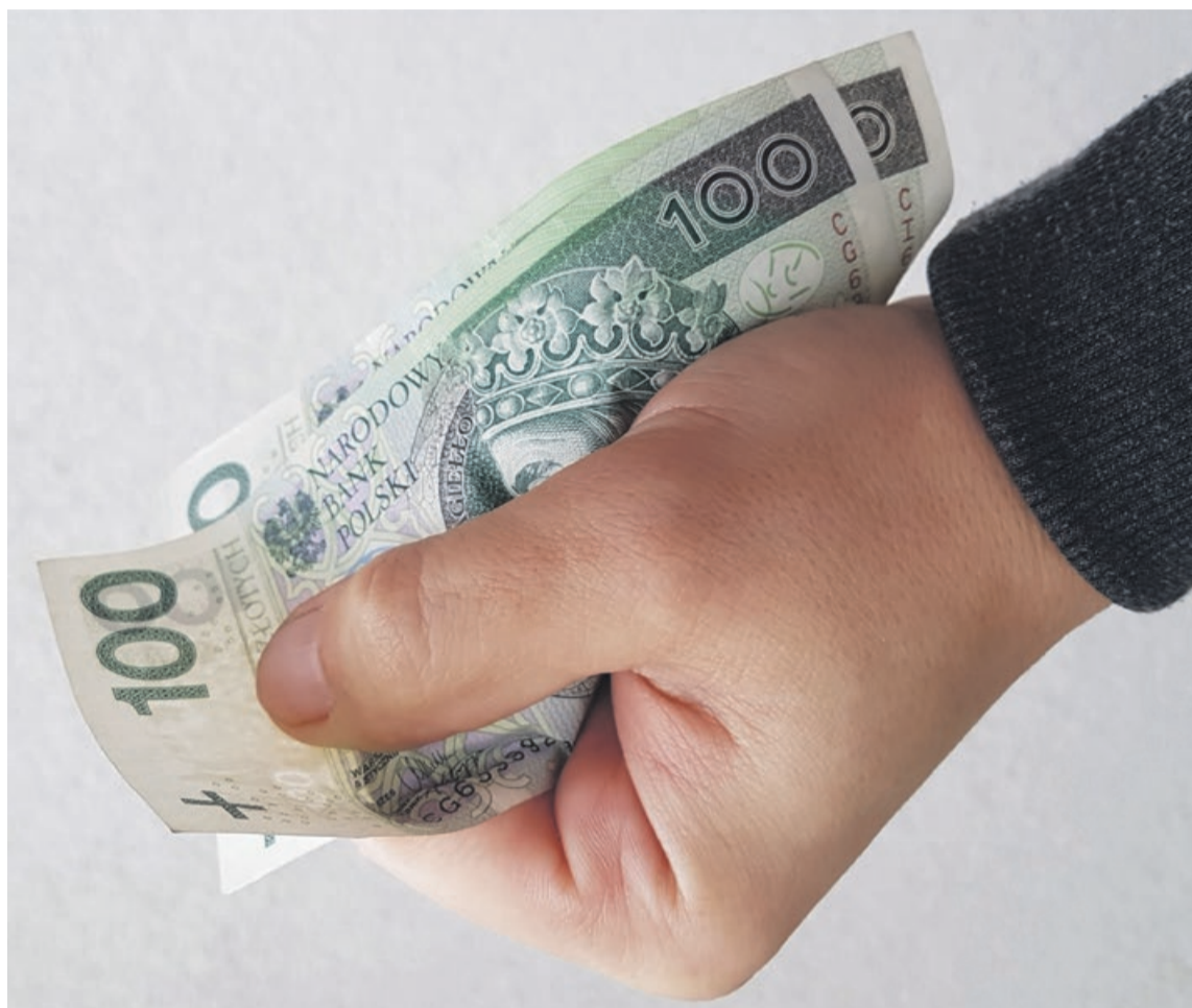
Nie tylko czynsze i zakupy w sklepach, ale i podatki lokalne wpływają na zawartość naszych portfeli

W przypadku podatku od nieruchomości nadal obowiązują stawki zapisane w uchwale rady miejskiej nr XXIII/102/16 z 28 października 2016 roku. Podobnie w przypadku podatku od środków transportowych - obowiązuje uchwała nr XIII/146/15 z dnia 27 listopada 2015 roku. Jeszcze starsza uchwała dotyczy opłat za posiadanie psa. Ta została podjęta 24 października 2013 roku.