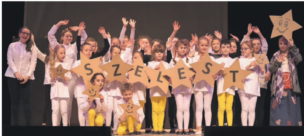
„Szelest” ma na swoim koncie liczne sukcesy na szczeblu powiatowym i wojewódzkim