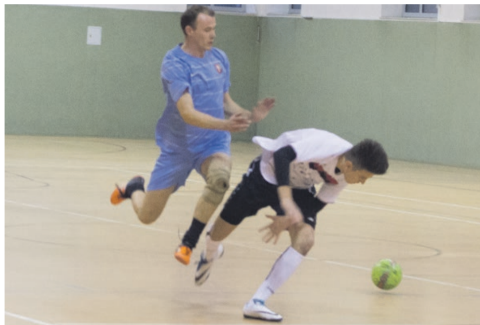
Czasem dzieją się ciekawe rzeczy