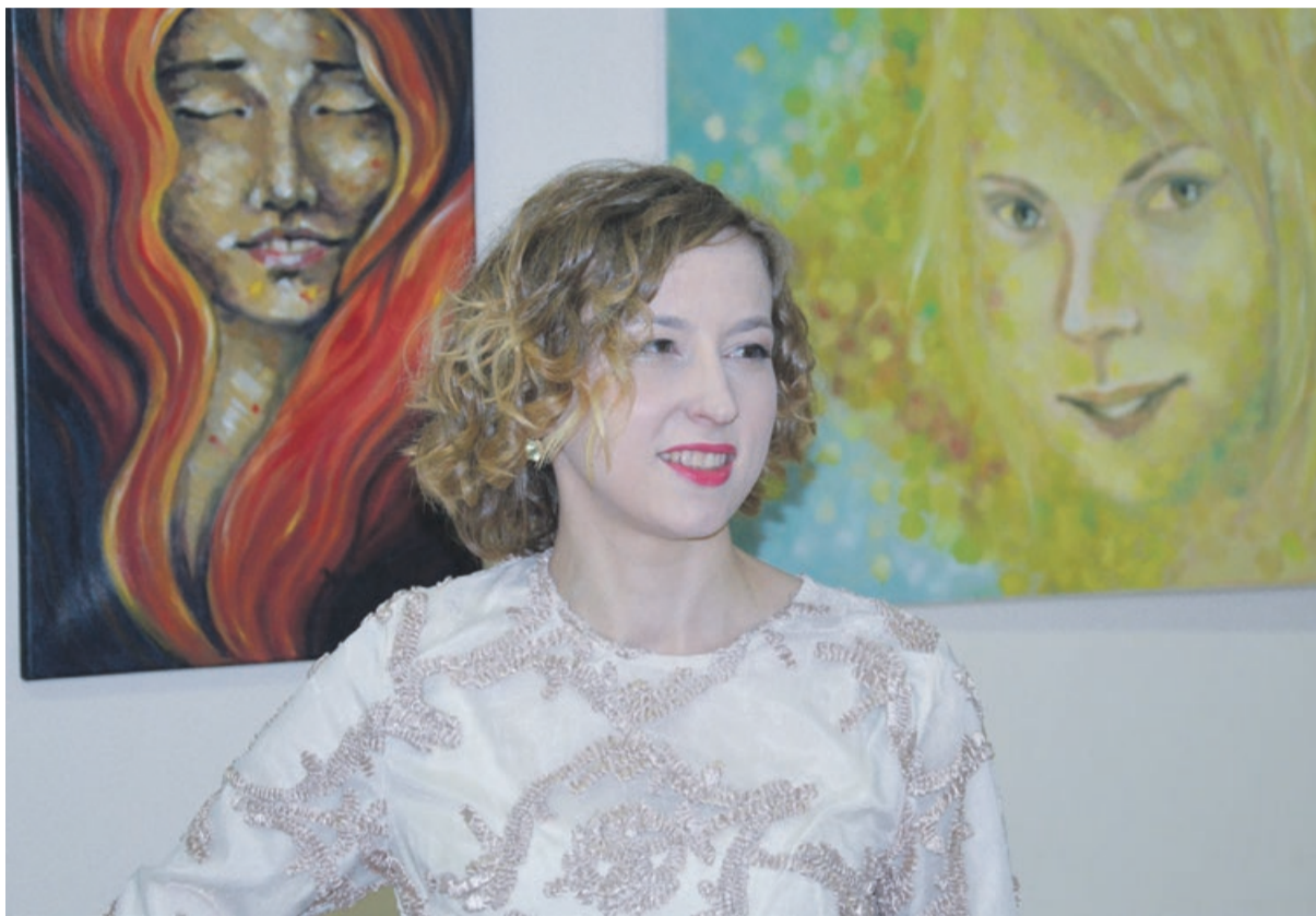
Artystka lubi tworzyć portrety, ale martwa natura i zwierzęta też są motywami jej prac

Artystka się tym nie zraża. Robi swoje. Na razie planuje wyjazd do Maroka. Ma zamiar malować plenery na plaży. Mąż obiecał, że zajmie się w tym czasie dziećmi: 5-letnią córką i 3-letnim synem. Zapisala się też na plener graficz-