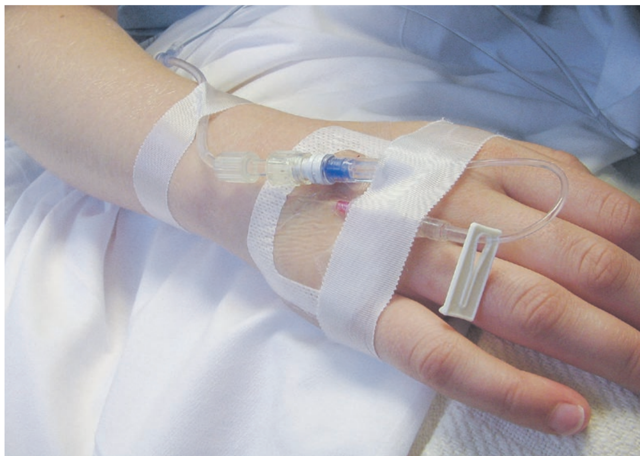
Łatwy dostęp do nocnej i świątecznej opieki medycznej ułatwia życie pacjentom

Po wprowadzeniu tak zwanej sieci szpitali, obowiązek zapewnienia takiej pomocy pacjentom spadł na lecznice powiatowe - w przypadku powiatu żarskiego jest to „Szpital na Wyspie”. Jednak Narodowy Fundusz Zdrowia podzielił ten teren na dwa obszary - żarski i lubski. W pierwszym przypadku pieniądze na ten cel otrzymuje żarski szpital. Jeśli chodzi o Lubsko, to NFZ ogłosił dodatkowy konkurs na takie świadczenia. Od piętnastu lat zajmowała się tym „Pogotowie