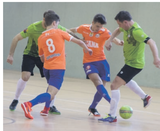
Spotkanie z Acaną było dla Mundialu okazją do rewanżu