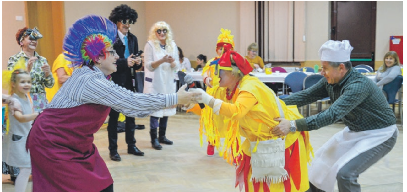
Kabaret z Dobrochowa podbił publiczność