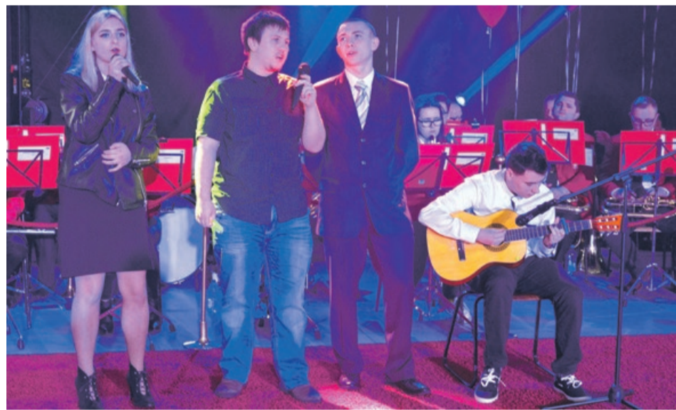
Przeboje polskich piosenkarzy i zespołów z powodziem wykonywali uczniowie szkół ponadgimnazjalnych

Stypendia Rady Powiatu Żarskiego w dziedzinach: nauki, nauki zawodu, kultury i sztuki oraz sportu dla najlepszych uczniów ze szkół ponadgimnazjalnych, na wniosek dyrektorów szkół, otrzymali: