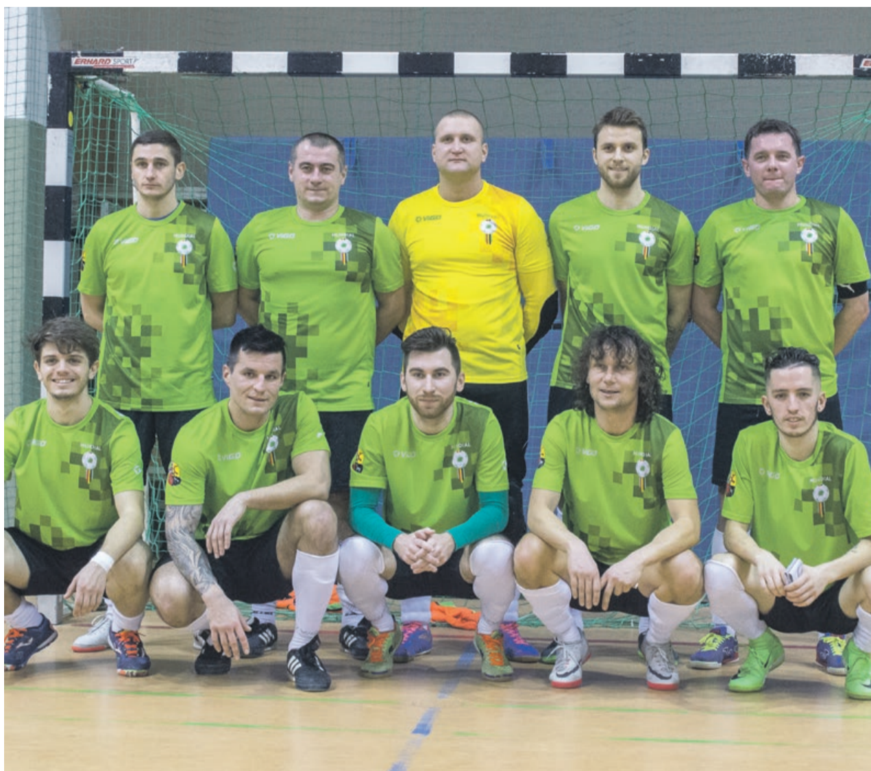
Piłkarze Mundialu Żary po ostatnim ligowym meczu