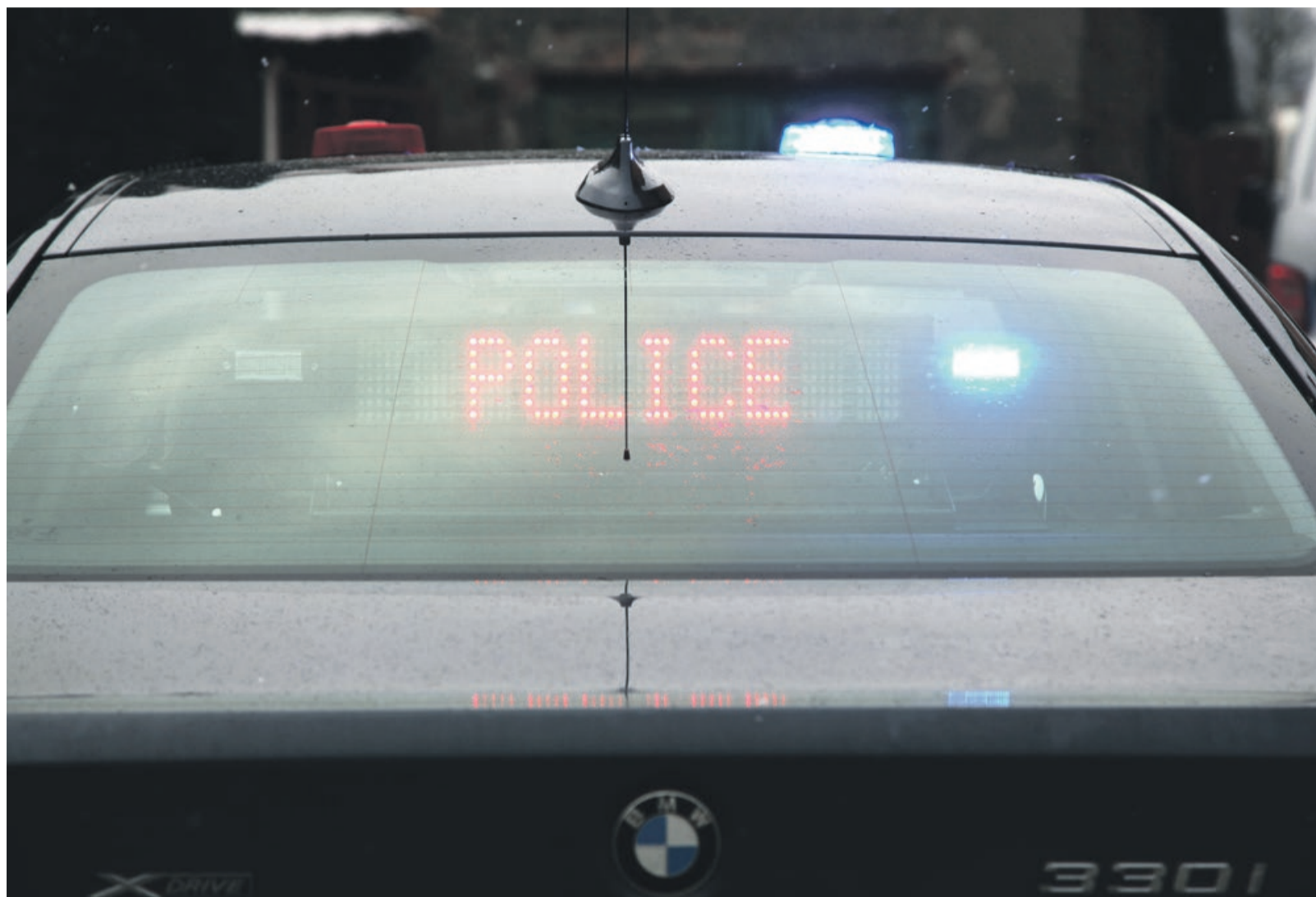
Piraci drogowi mogą już się bać. Przebaczania nie będzie

Nieoznakowane bmw 330i xDrive wyposażone w wideorejestrator trafiło do żarskiej drogówki. Teraz będzie służyło na rzecz poprawy bezpieczeństwa w ruchu drogowym. Samochód posiada atrybuty, pozwalające na skuteczną - miejmy taką nadzieję - walkę z piratami drogowymi. Cóż to za atrybuty? Samochód ma zamontowaną kamerę z przodu i z tyłu, dwulitrowy silnik benzynowy o mocy 252 KM oraz napęd na cztery koła. PAS