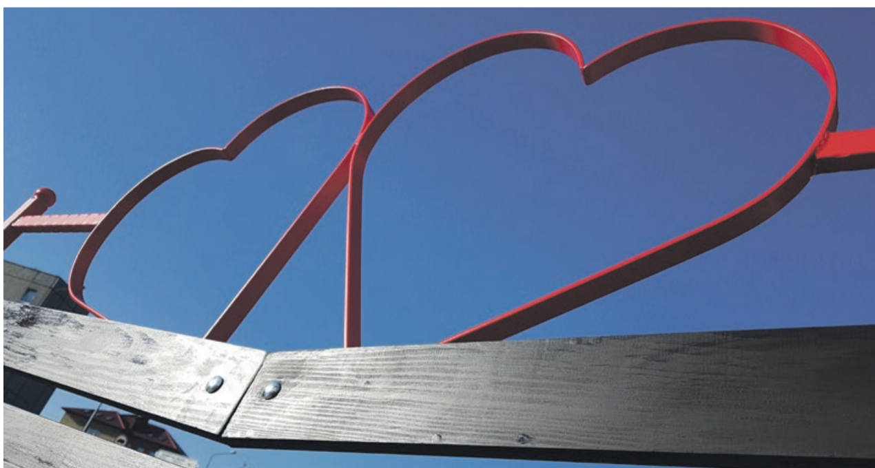
Ławeczka z serduszkami postawiona zostanie przed żarskim ratuszem w środę, 14 lutego

13 lutego o godzinie 19 w sali widowiskowej Luna odbędzie się koncert Tomasza Dolskiego, na który obowiązują karty wstępu wydawane od 5 lutego w Żarskim Domu Kultury. W dzień zakochanych, o godzinie 19 w kinie Pionier wyświetlany będzie film pod tytułem „Podatek od miłości”. Bezpłatne bilety dostępne były do odbioru w ratuszu. Miasto zafundowało również mieszkańcom darmo-