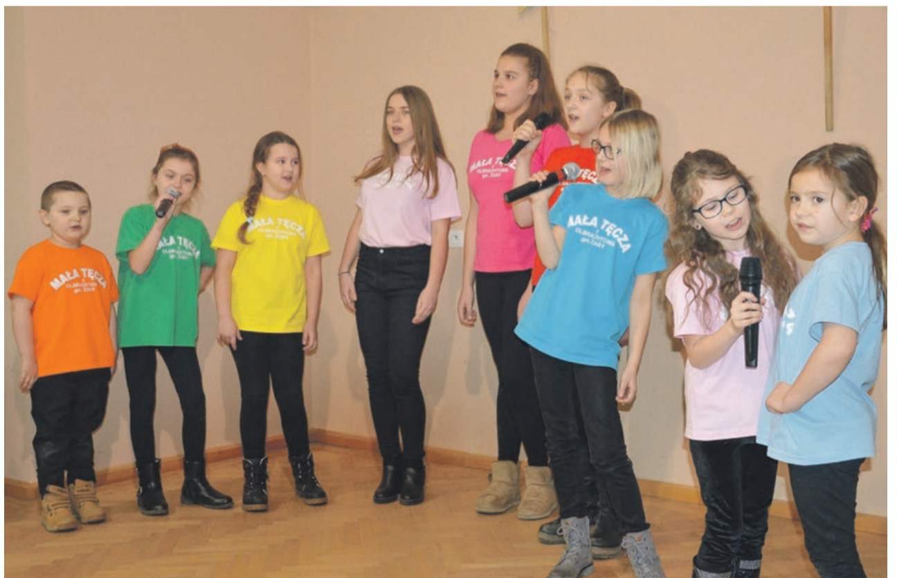
W „Małej Tęczy” same talenty