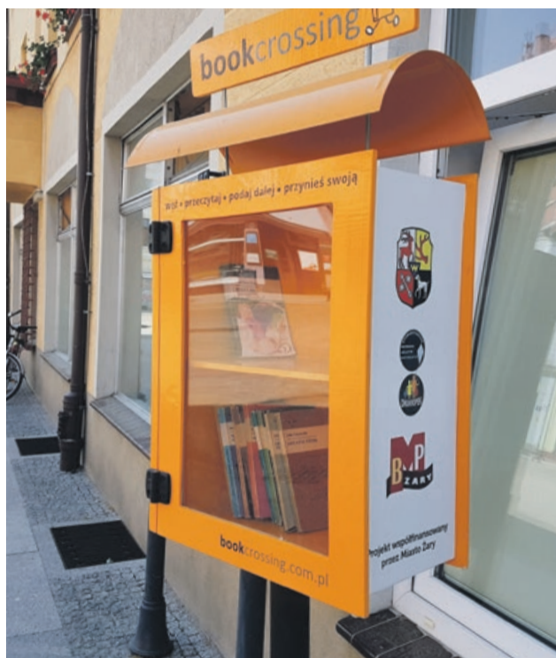
Gdy tylko się ociepli, książka znów wyjdzie na żarskie ulice