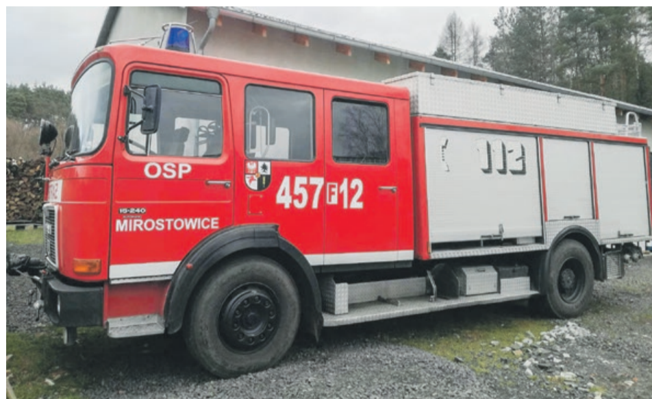
Strażacy z Miostowic dostali pojazd prosto z fabryki. Ten jest teraz na sprzedaż

ry, do urzędu zgłaszali się już pierwsi zainteresowani. Jednak do tej pory nikt się jeszcze ostatecznie nie zdecydował.