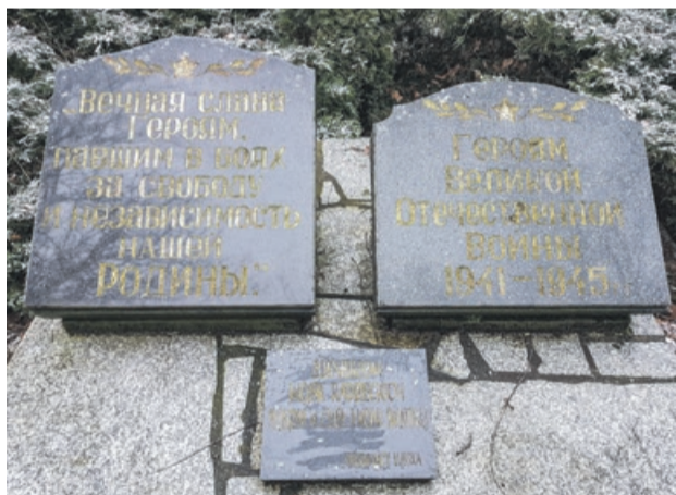
Niegdyś dwie górne tablice przyozdabiałały czerwone gwiazdy. Dziś wszystko pomalowano na złoto