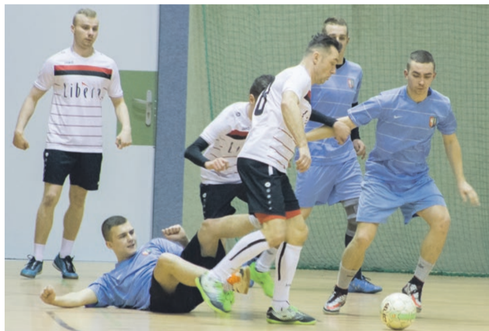
Niby liga towarzyska, ale każdy chce wygrać

Hart-Szkło Tuplice - Magicy 3:0 Ninjago - Viessmann Team Żary 4:1 Zieloni - Hasztasz 5:4 Pit Stop Łęknica - Libero 1:7 Dynamit Team - Łużyczanka 5:6 Hooligans - Mirostowiczanka 4:5 Saint Gobain - Futsal Team 3:3 1% dla Kacperka - Sage 5:0 ATB