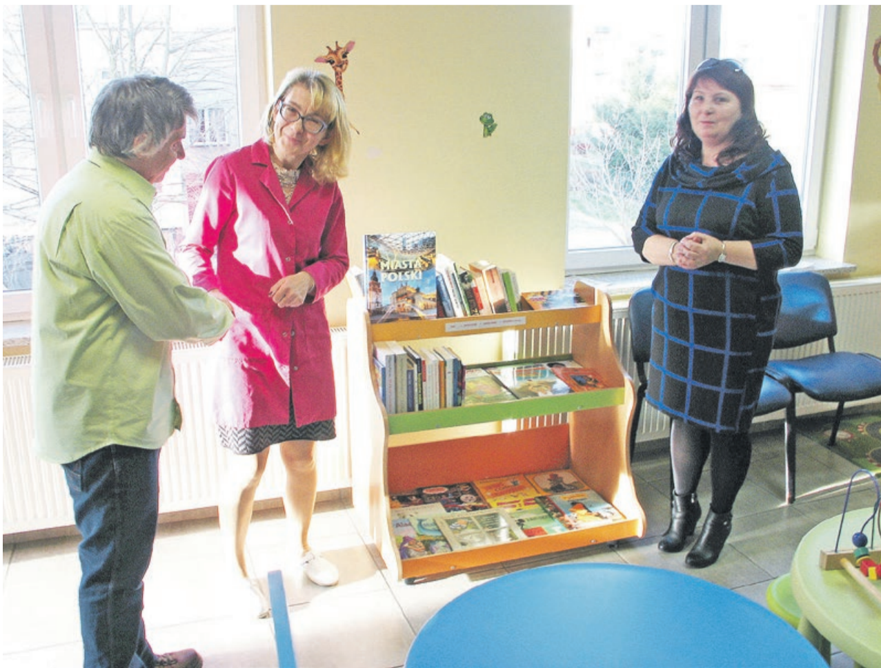
Pierwszą z trzech szafek z książkami ustawiono w żarskiej przychodni Primus

Mieszkańcy Żar spotkali się już z szafkami wypełnionymi książkami. W sezonie wiosenno-jesiennym można je spotkać pod ratuszem, w parku przy Al. Jana Pawła II, czy chociażby na terenie kąpieliska przy ul. Źródła-