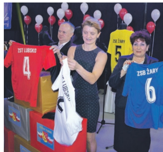
Do szkół ponadgimnazjalnych trafiły stroje sportowe