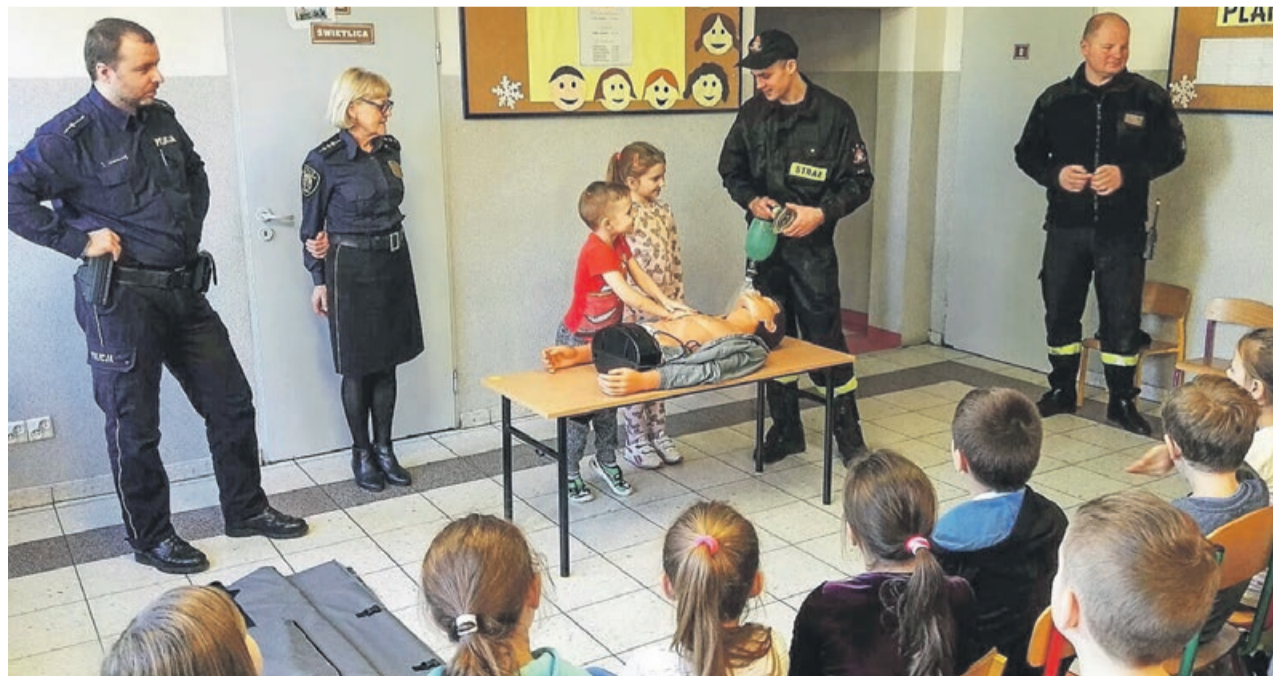
Wiedzy o tym, jak udzielić pomocy przedmedycznej i zachować ostrożność w różnych sytuacjach, nigdy za wiele

miętać o podstawowych zasadach bezpiecznego poruszania się po drodze, jaką rolę pełnią odbłaski, jak zachować się w przypadku ataku groźnego psa, kiedy obcy częstuje nas słodyczami albo proponuje, że podwiezie nas do domu. Podczas ferii policjanci będą kontrolowali miejsca zorganizowanego wypoczynku, oraz rejon stawów i jezior, wszystko po to, aby dzieci po zimowej przerwie bezpiecznie, całe i zdrowe powróciły do szkoły. PAS