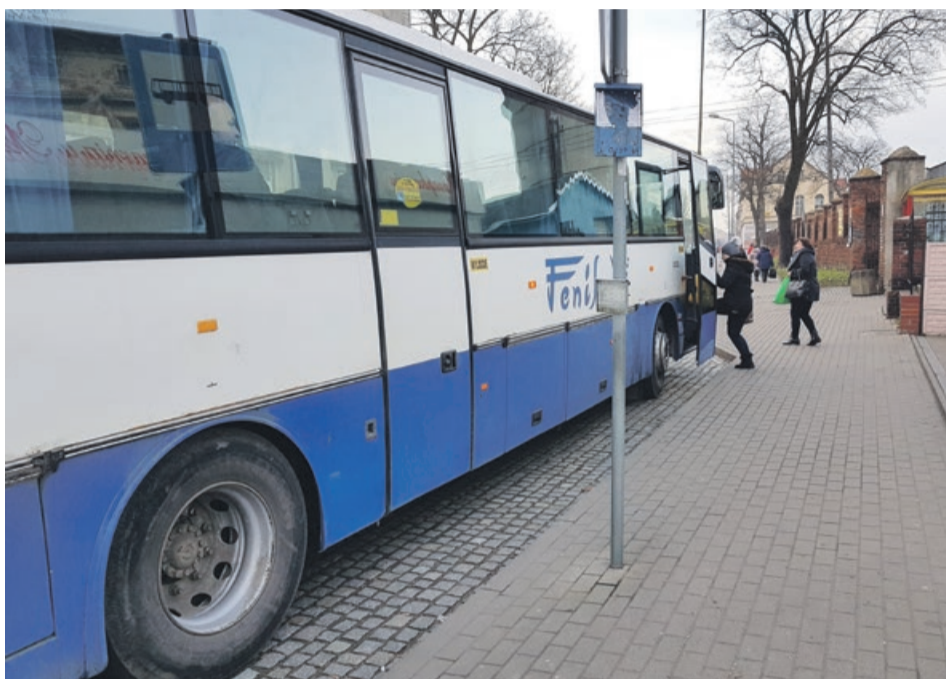
Pamiętajmy, w każdy pierwszy poniedziałek i wtorek miesiąca autobusami po Żarach możemy jeździć za darmo

- Chcemy w ten sposób zachęcić mieszkańców do korzystania z transportu zbiorowego - mówi Rafał Fularski, naczelnik wydzia-