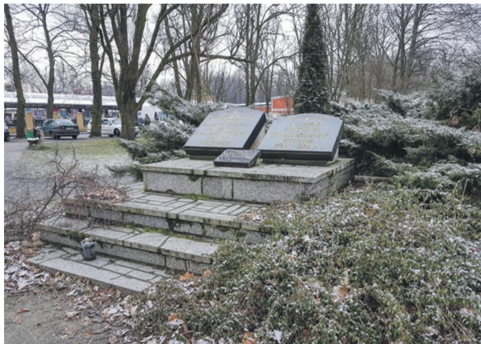
Czy to miejsce wkrótce zniknie z lubuskiego placu?

Może czasem ktoś zapali świeczkę, tak jakby na grobie nieznanego radzieckiego żołnierza. Czasem ktoś taki pomnik obleje farbą i umieści napis „czerwona zaraza”. W większości przypadków jednak ludzie przechodzą obok obojętnie, zajęci swoimi sprawami. Nie