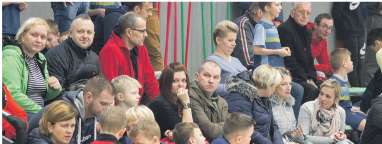
Rodzice to najwierniejsi kibice