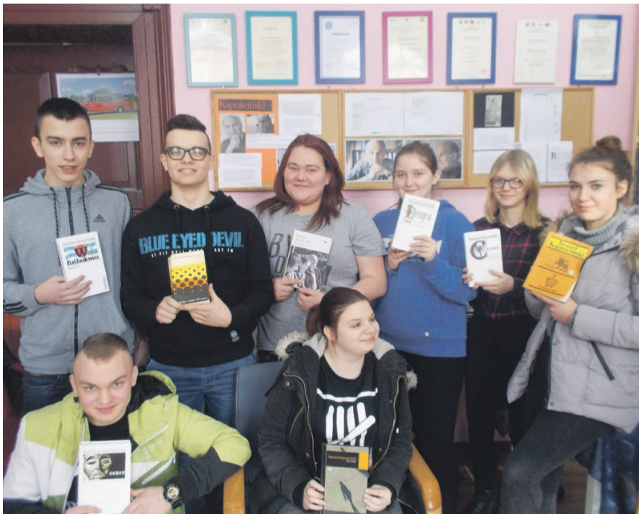
Problemy poruszane w książkach Ryszarda Kapuścińskiego są nadal aktualne