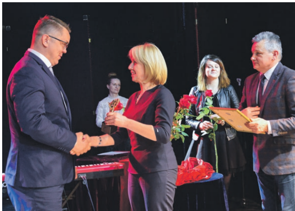
Nagrodę Specjalną Burmistrz Miasta Żary otrzymała Firma M&J Sp. z o.o