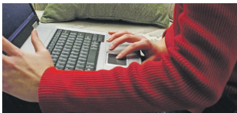
Dziś coraz więcej spraw możemy załatwić przez internet

REGION Takie czasy. Coraz więcej spraw załatwiamy przez internet. Staje się to coraz bardziej powszechne, a i granica wieku korzystających z takich rozwiązań stale się poszerza.