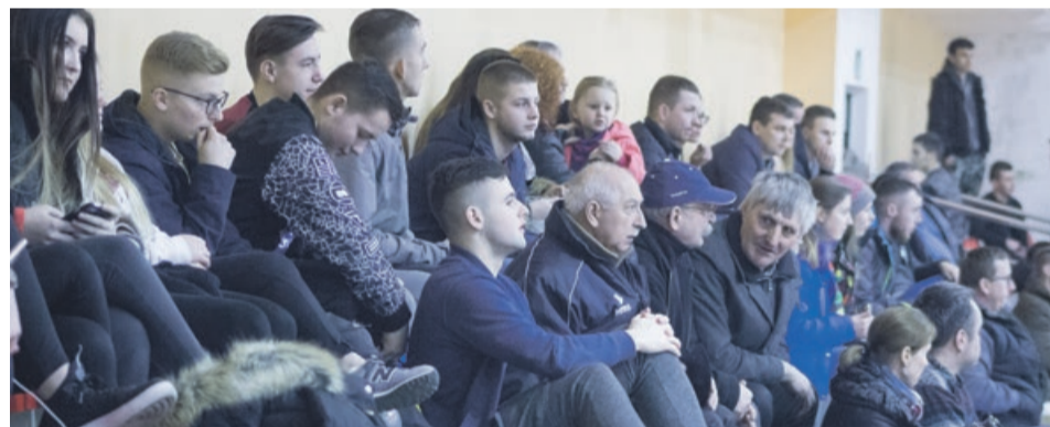
Niedziela z futsałem w Żarach