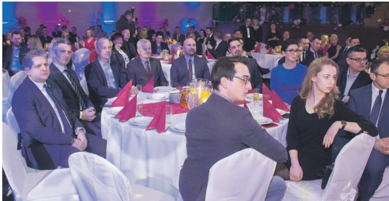
Wiele osób przybyło do Lubuska, aby pogratulować sportowych osiągnięć