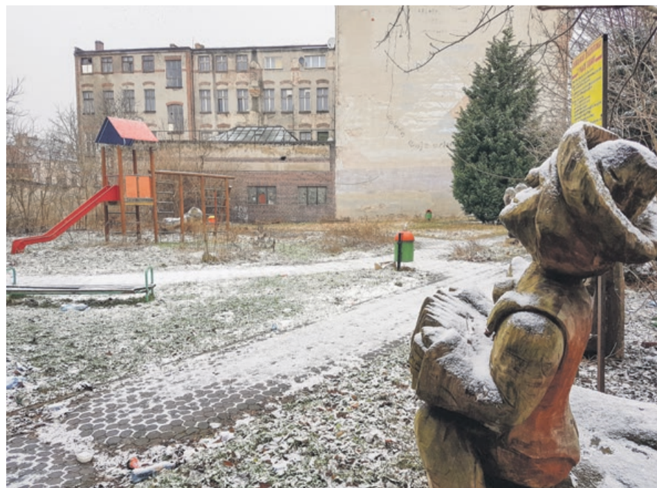
To miejsce jeszcze dzisiaj odstrasza, ale w najbliższych miesiącach zmieni swój wygląd