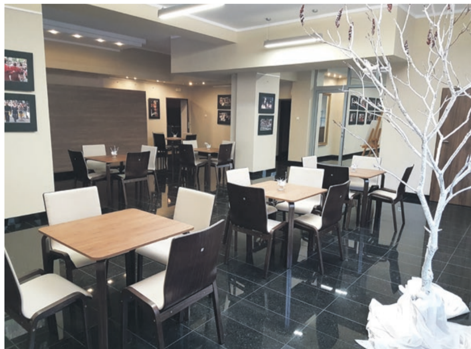
Odnowiony hol w „Lunie” prezentuje się elegancko