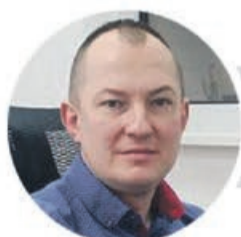
Anatol Kałasznikow AK ANATOL

Uzbrojenie strefy inwestycyjnej „Lotnisko” Planowana kwota to około 6 mln złotych. Dofinansowanie z Regionalnego Programu Operacyjnego Lubuskie - 2020