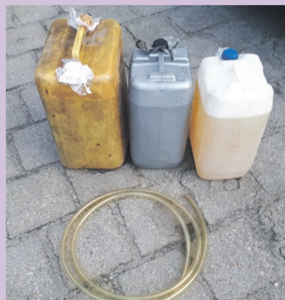
Ukradzone paliwo warte 600 zł zostało odzyskane

Dwóch mężczyzn poruszających się samochodem osobowym marki Audi 80 podjechało na stację paliw w Iłowej. Zatankowali ponad 50 litrów oleju napędowego i uciekli nie płacąc. Skradzione paliwo przepompowali do beczek, po czym tym samym pojazdem udali się ponownie na zakupy, na inną stację benzynową. Tym razem do miejscowości Czerna. Udało się im zatankować ponad 56 litrów paliwa. Sprawcy ponownie odjechali spod dystrybutora bez płacenia. Pracownicy obu stacji o kradzieży po-