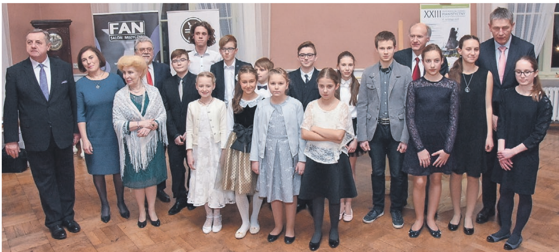
Turniej jest świetną okazją do zaprezentowania swoich umiejętności i zmierzenia się z najlepszymi pianistami w odpowiednich grupach wiekowych