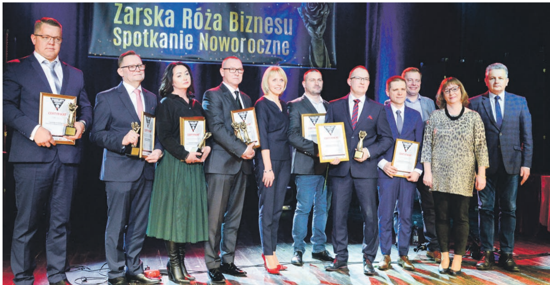
Przedsiębiorcy już nagrodzeni. Chwile chwały są krótkie, przed nimi kolejny rok prowadzenia biznesu - inwestowania, borykania się z przepisami i płacenia podatków

Nagrodę Specjalną Burmistrz Miasta Żary otrzymała: Firma M&J Sp. z o.o