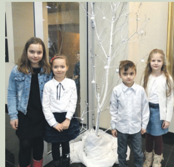
Uczniowie żarskiej Jedynki spisali się znakomicie

ŻARY Uczniowie Szkoły Podstawowej nr1 im. F. Chopina po raz czwarty brali udział w Ogólnopolskim Konkursie Ekologicznym „Pan Sprzątański”.