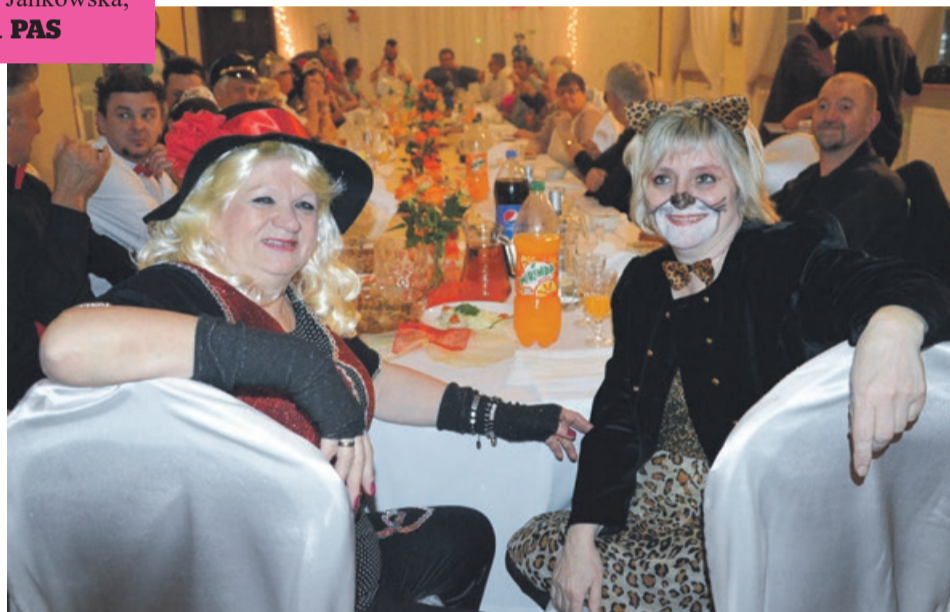
Stoły zastawione, stroje zmyślne i kolorowe, można się bawić