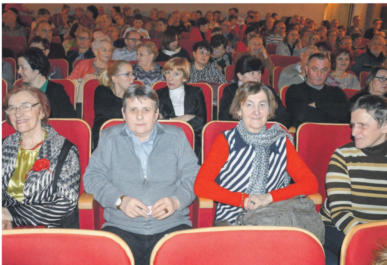
Publiczność dopisała