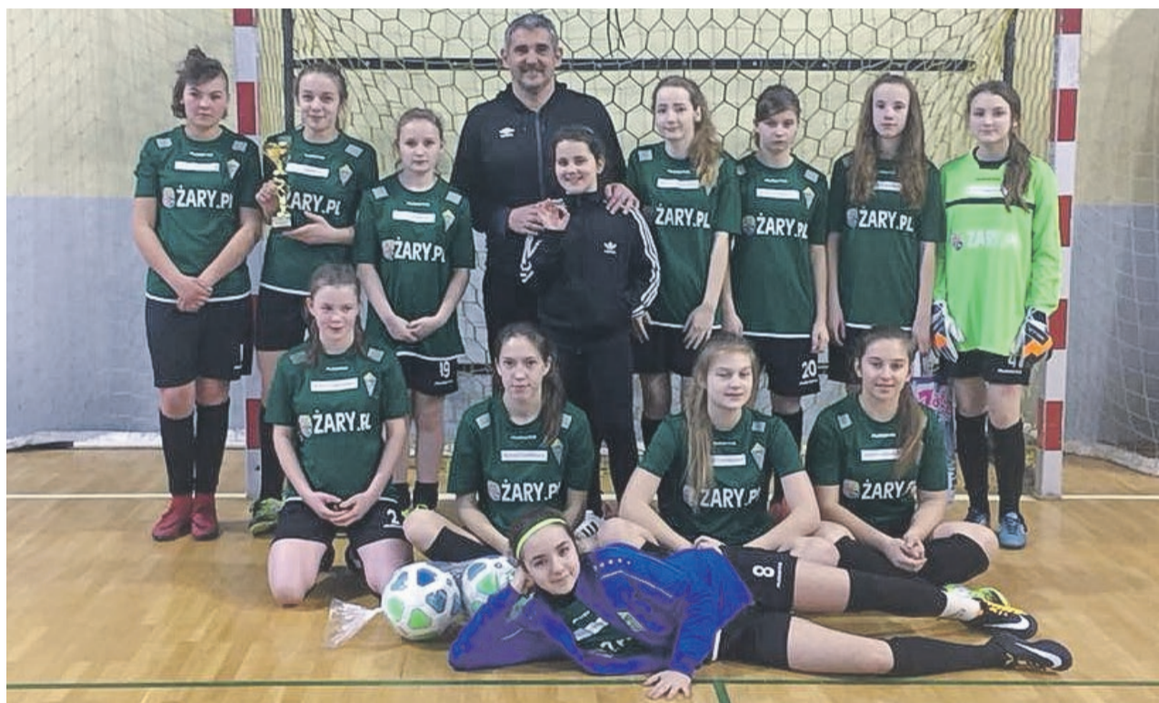
Trzecioligowy debiut podobał się kibicom. Ciekawe, jak będzie wyglądała piłkarska wiosna