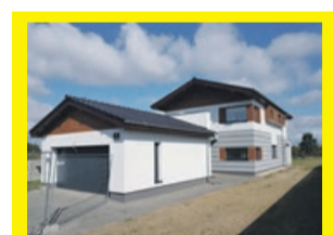
Sprzedam DOM, NOWO wybudowany, do wpro- wadzenia w atrakcyj- nej dzielnicy w Żarach, wszystkie media, gaz, 180m2, solidnie wyko- nany tel. 501312198

► Posiadamy atrakcyjne, pięknie położone działki budowlane w: Żarach, Kunicach, Siodle, Drożkowie, Olbrachtowie. Atrakcyjne ceny sprzedaży!! cena od 30 zł/m2 Tel. 606 705 480