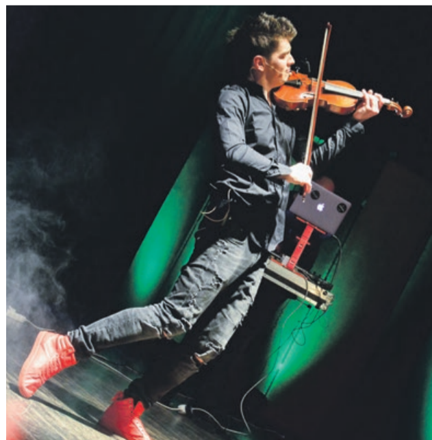
Żywiolowe wykonania znanych utworów mogły się podobać

wspierał didżej. To nie był pierwszy występ młodego artysty w Żarach. Bezpłatne karty wstępu rozeszły się momentalnie. PAS