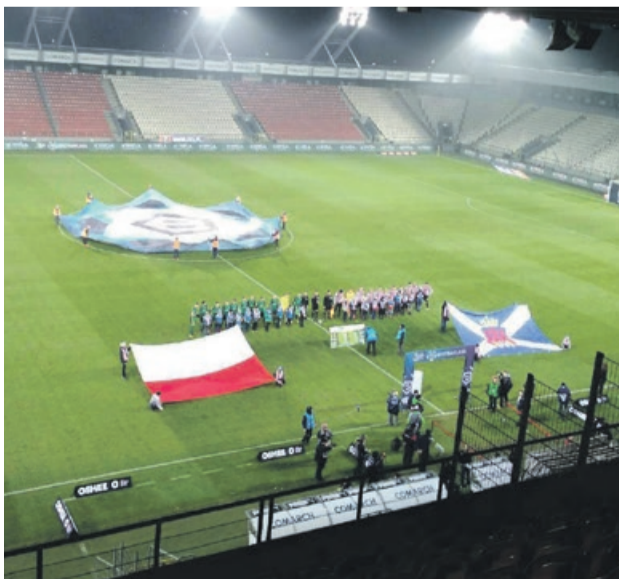
Brak kibiców na trybunach nie buduje pozytywnej, sportowej atmosfery. Mecz powinien być piłkarskim świętem. Przez wybrki nielicznych tracą wszyscy, łącznie z piłkarzami