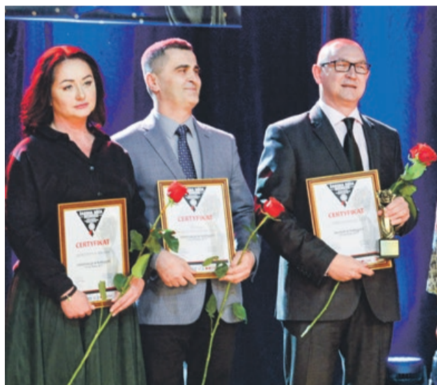
Kategoria: Firma Roku 2017. Wentor Piotr Wentlant - Nominowani, Poli-Eco Tworzywa Sztuczne Sp. z o.o. - Nominowani, Urban Polska Sp. z o.o. - Laureat