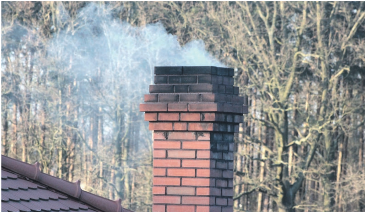
Na pierwszy rzut oka trudno ocenić, czy komin nie zagraża bezpieczeństwu i nie stanie się źródłem pożaru. Dlatego tak ważne są regularne wizyty kominiarza

To zadanie dla kominiarzy, ale - jak się okazuje - niektórzy wolą zaoszczędzić na takim wydatku. Tyle tylko, że taka pozorna oszczędność może doprowadzić do tragedii, a koszty pożarowych zniszczeń będą znacznie wyższe, niż kominiarska usługa. Statystyki wskazują, że tego typu pożarów jest mnóstwo i mogą dotknąć wszystkich, którzy zaniedbali stan swojego komina. W ostatnim czasie na przykład takie zdarzenia miały miejsce na ulicy Pomorskiej w Żarach, w budynkach prawie że sąsiadujących ze sobą. Złudna oszczędność na okresowych przeglądach to ryzyko. W dodatku straty poniesione w wyniku pożaru dotyczą nie tylko właścicieli budynków. Trzeba pamiętać, że każdy wyjazd strażaków opłacany jest z budżetu państwa, a więc tak naprawdę za lekceważenie