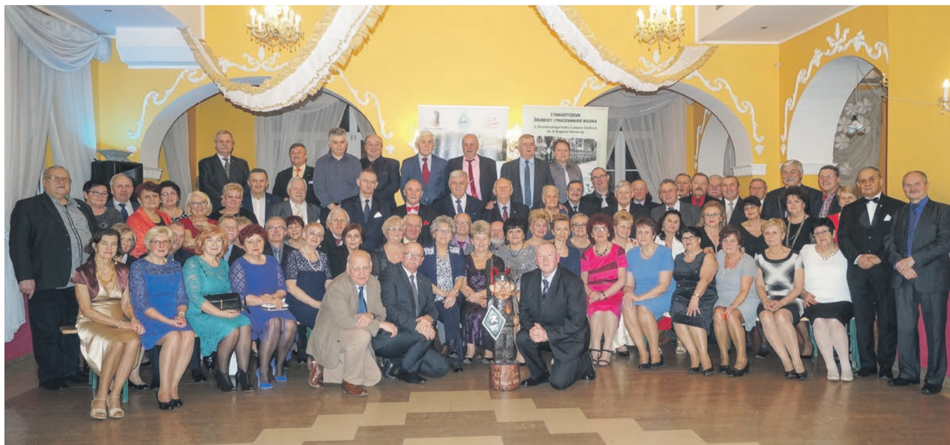
Spotkania integracyjne są okazją do podtrzymywania relacji towarzyskich pomiędzy członkami, przyjaciółmi i sympatykami stowarzyszenia