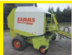
Prasa do słomy Claas Rollant 250, rok 2002, stan bardzo dobry, Tel. 699-932-056

► Bogaty zbiór znaczków pocztowych z literaturą, meble Swarzędzkie, szafa metalowa dwudrzwiowa. Tel. 73896405