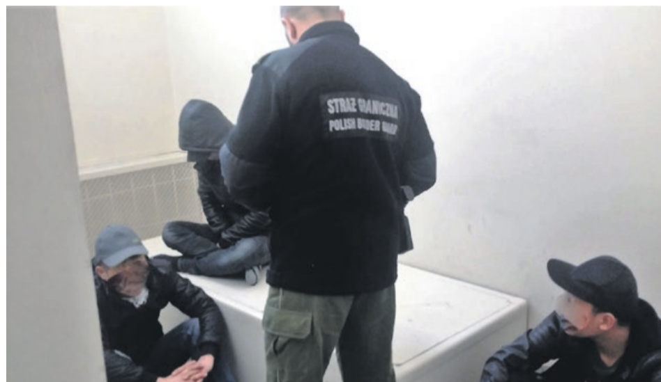
Młodzi obywatele Wietnamu wpadli w ręce Funkcjonariuszy Straży Granicznej zaraz po przekroczeniu polskiej granicy

Podczas trwających czynności, okazało się, że jeden z zatrzymanych obywateli Wietnamu posiada polską kar-