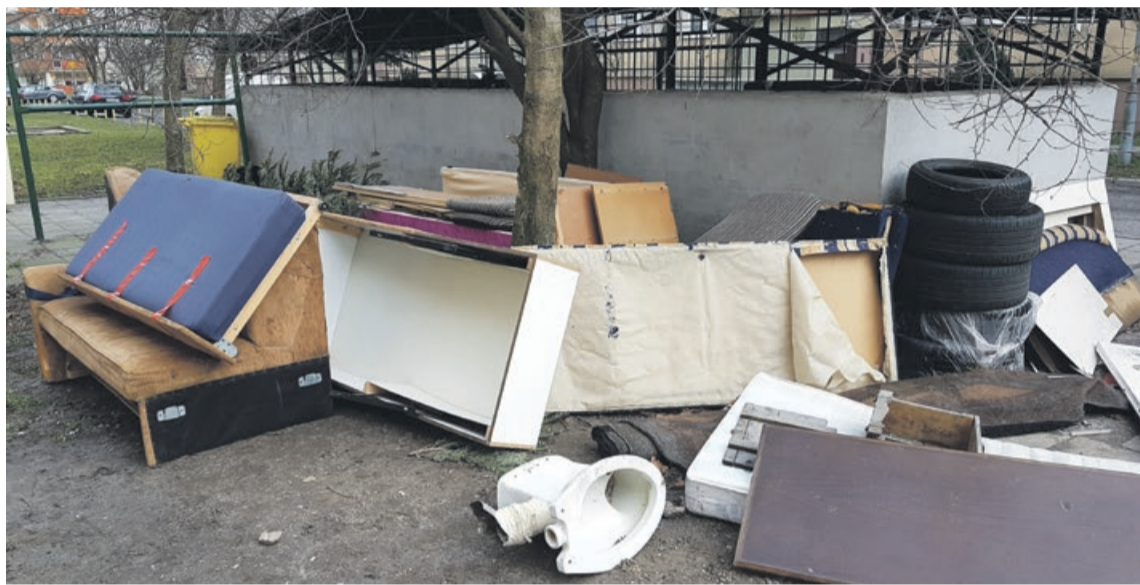
Tak wyglądał teren przy jednym ze śmietników na osiedlu muzyków przeszło dwa tygodnie przed terminem odbioru tych odpadów przez Pekom

Problem ten opisywaliśmy już na łamach Mojej Gazety. Wracamy do tematu, a powodem jest nowa umowa zawarta pomiędzy ratuszem a spółką Pekom, która zajmuje się wywozem nieczystości z terenu miasta. Przypomnijmy, dotychczas stare meble, pralki, opony i tym podobne odpady pozostawiane przez mieszkańców obok śmietników, wywożone były raz na kwartał. Części osób nie obchodzi fakt, że ktoś jest zmuszony oglądać wysypisko pod swoim balkonem. Wywala się stary mebel i „po problemie”. Nie pomagały apele, aby robić to tuż przed termi-