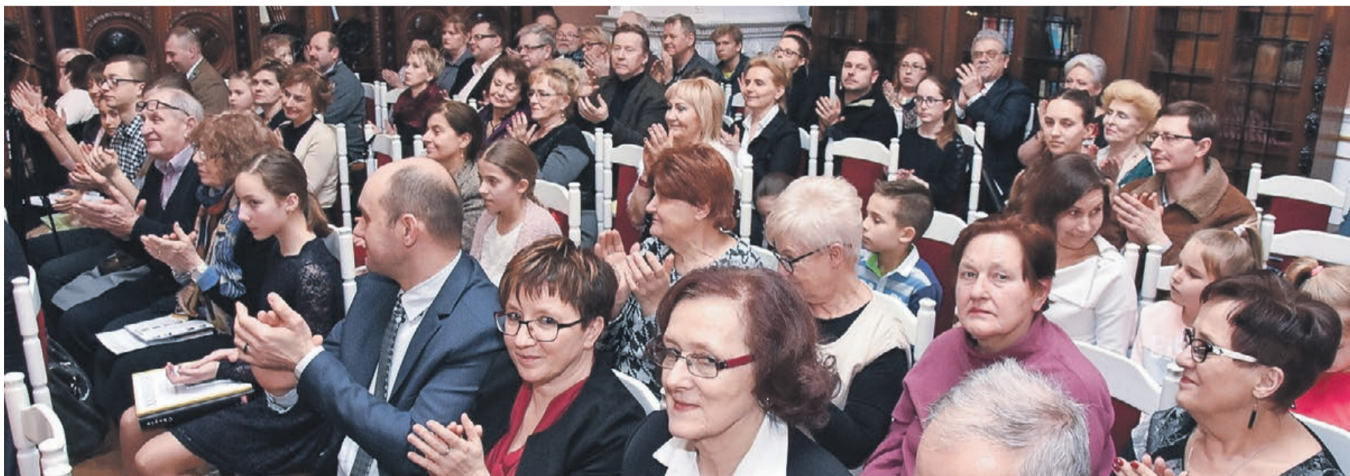
Młodych pianistów oklaskiwała publiczność nie tylko z Żagania