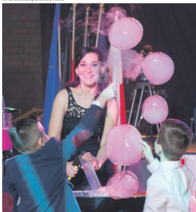
Bańkowe show