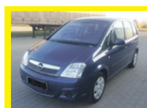
Opel Meriva rok 2007, pojemność 1700 Cd- ti, klimatyzacja, tempo- mat, elektryka. Tel. 602-738-351

► Miostowice Grn. Mieszkania dla pracowników Tel. 690 411 006