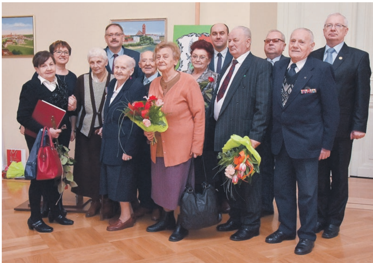
Doroczne spotkanie to żywa lekcja historii