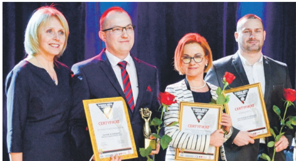
Kategoria: Mecenat Sportu-Kultury 2017. AK Anatol Kałasznikow - Laureat, Saint-Gobain Innovative Materials Polska Sp. z o.o. Oddział Sekurit Transport Division w Żarach - Nominowani, RO&JA CARS s.c. - Nominowani