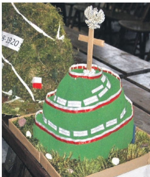
Wyróżniona praca przedstawia kopiec porośnięty trawą ze spiralną drogą prowadzącą na szczyt, droga opasana jest białą - czerwona flagą a wchodzący po niej zwiedzający na ścianie mogą przeczytać nazwiska poległych w obronie Lwowa, które umieszczone zostały na specjalnych tabliczkach