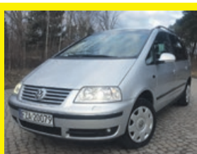
Volkswagen Sharan rok 2007, pojemność 1998 TDI, ksenony, grzane fotele, elektryka, navi- gacja, 6-biegów, park- troniki, tempomat Tel. 602-738-351

► Zdun - wykonam prace zdunskie, piece, kuchnie kafłowe i przystawki. tel. 530 908 452 Tel. 68 451 17 70