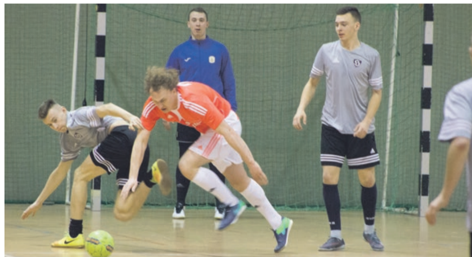
Drużyny Hart-Szkło Tuplice i Hooligans zakończyły mecz remisem 4:4