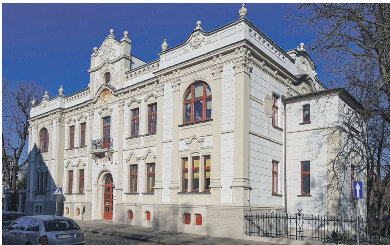
Prace przy budynku biblioteki prowadzono pod ścisłym nadzorem konserwatora zabytków

Ten remont to tylko część dużego projektu obejmującego zagospodarowanie terenu pomiędzy bi-