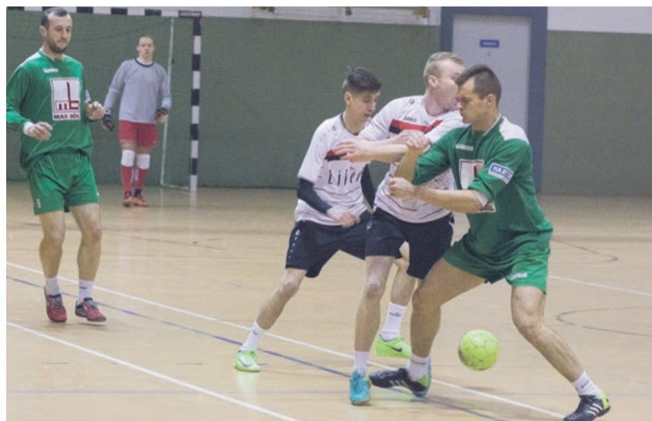
Dynamit Team pokonał Libero 4:1