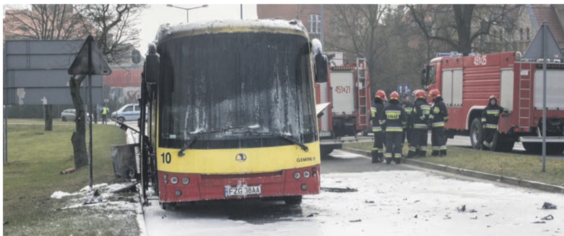
Gaszenie pianą płonącego autobusu trwało ok. pół godziny