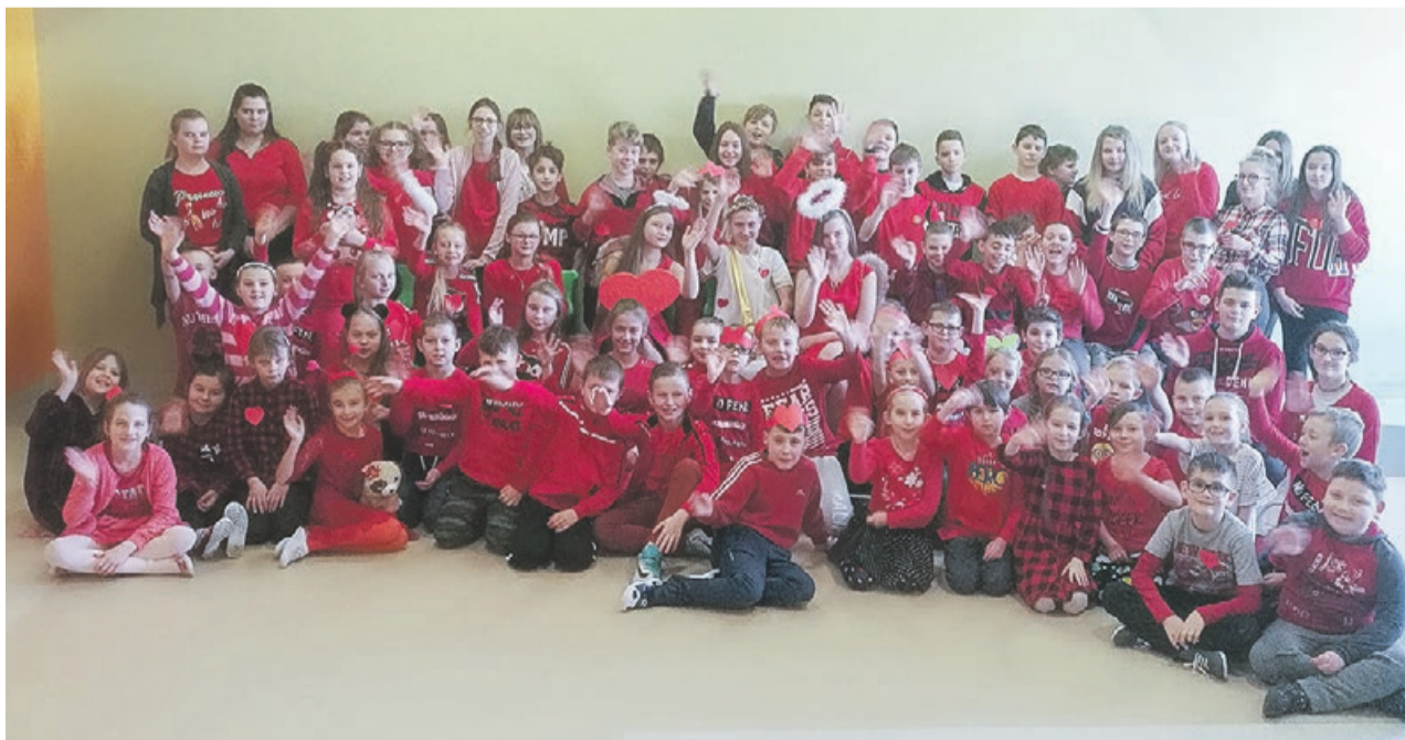
W walentynkowym nastroju na koniec karnawału