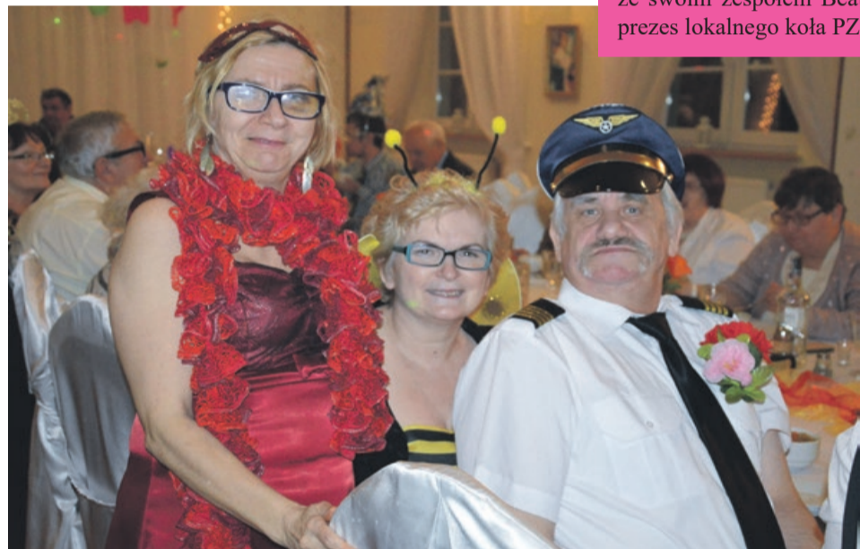
„Za mundurem panny sznurem”. Stare powiedzenie trzeba umieć wykorzystać i założyć odpowiedni strój