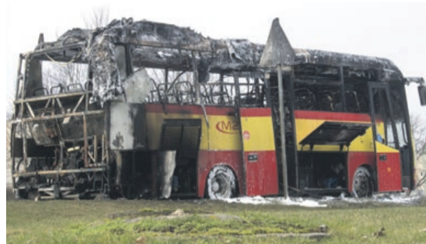
Autobus spłonął prawie doszczętnie

Przejazd częścią al. Jana Pawła II. był niemożliwy. Policjanci zamknęli na jakiś czas drogę do ruchu. Na miejscu oprócz strażaków i funkcjonariuszy pojawili się także przedstawiciele spółki MZK z Żagania. PAS