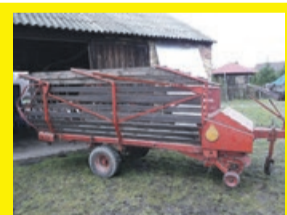
Przyczepa samozbie- rająca, rok 2001, Tel. 699-932-056

► Zegar z mosiądzu, obudowa z mosiądzu, sztucze posrebrzane. Żary, ul. Górnośląska 1/4a Tel. 668921509