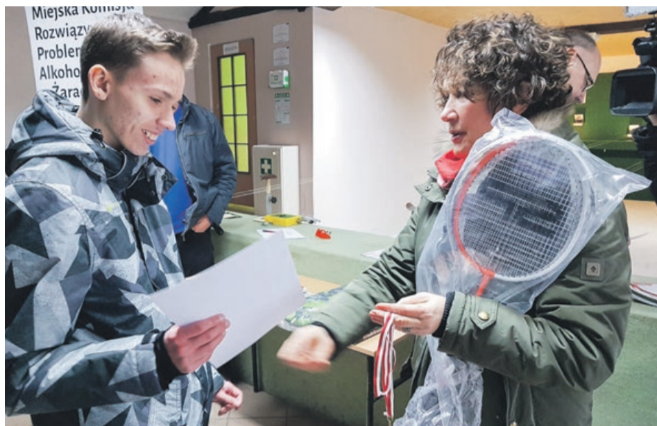
Na najlepszych czekały medale i nagrody