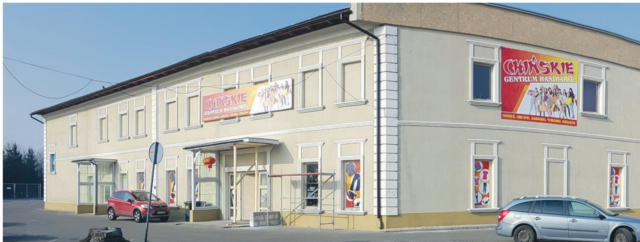
Pomimo niedawnej tragedii, ocalała część obiektu cały czas działa, a handlowcy zapraszają na zakupy