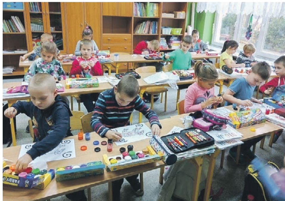
Uczestnicy projektu korzystali nie tylko wyjazdów do Wrocławia, ale i zajęć prowadzonych na miejscu