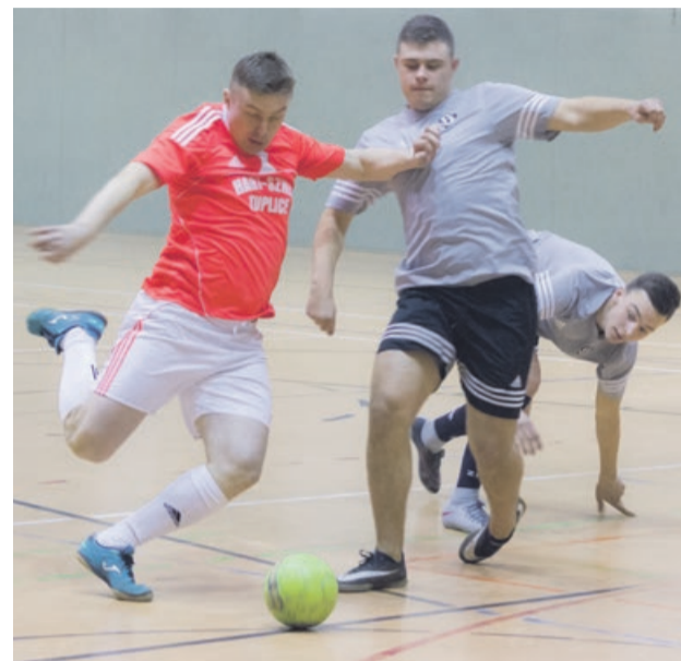
Więcej bramek na koncie drużyny Hart-Szko Tuplice. Hooligans na drugim miejscu