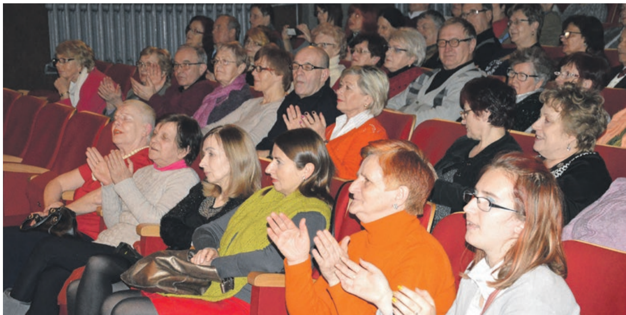
Chór prezentuje się publiczności nie pierwszy raz. Słuchacze wiedzą na jaki repertuar mogą liczyć