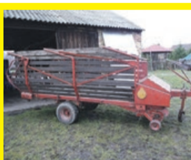
Przyczepa samobierająca, rok 2001, Tel. 699-932-056

► Sprzedam ciągnik rolniczy i maszyny rolnicze: obciążniki, szyby, pług, brony, kultywator, siewnik, opryskiwacz, przyczepę samobierającą, dmuchawę, wał uprawowy i prasę Tel. 699 932 056