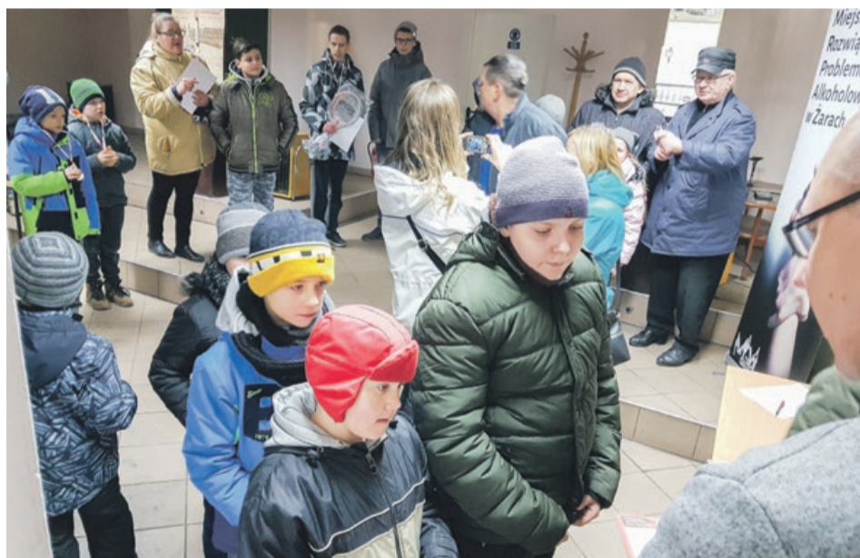
Pamiątkowe upominki dla wszystkich