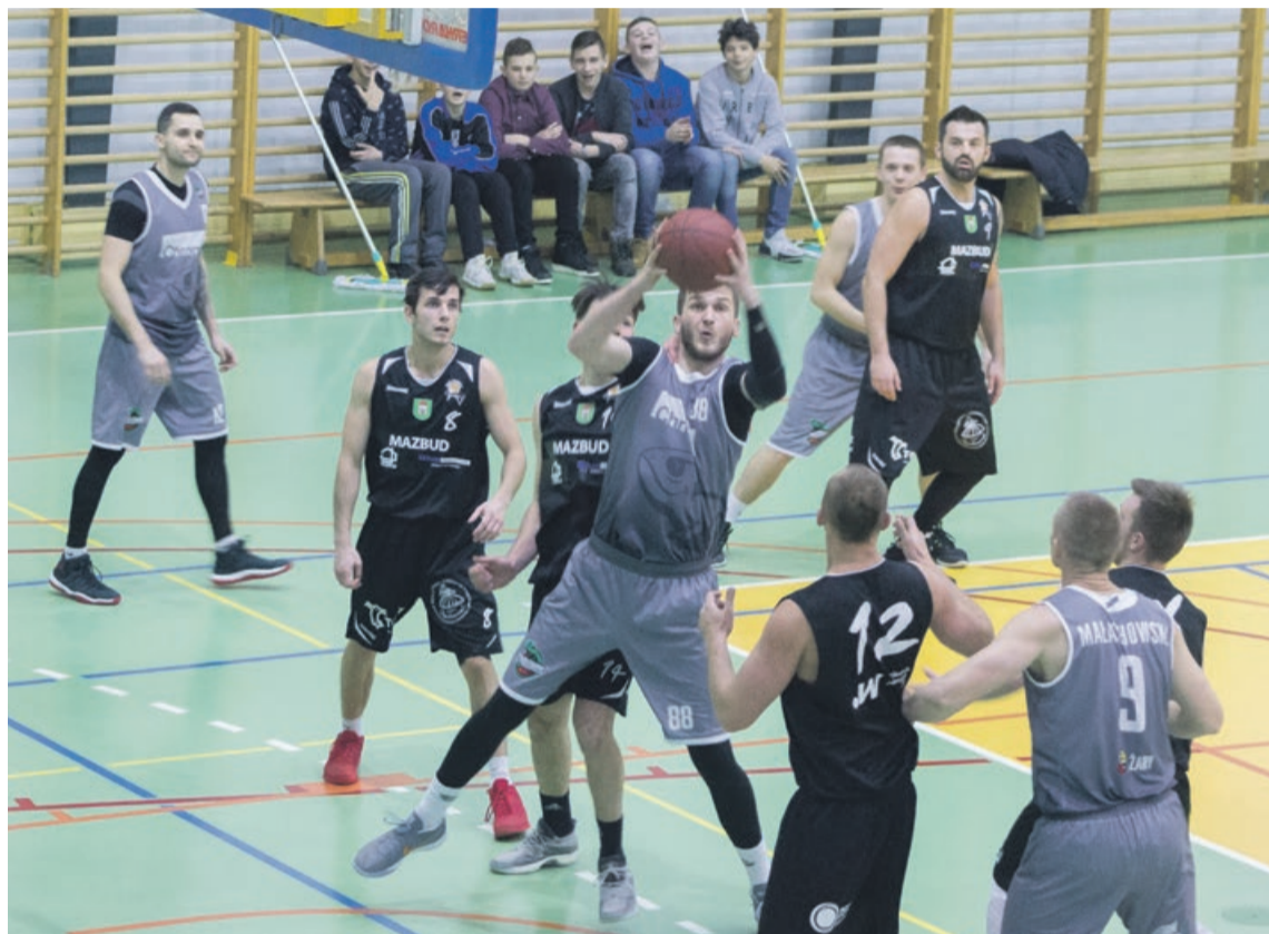
Ostatnie dwa mecze zapewniły Chromikowi pierwsze miejsce w tabeli

Przed trzecioligowcami jeszcze dwa mecze, które odbędą się na wyjeździe. 3 marca Chromik zagra ze Wschową, a dzień później z Koberzycami. Rezultaty tych spotkań nie mają większego zna-