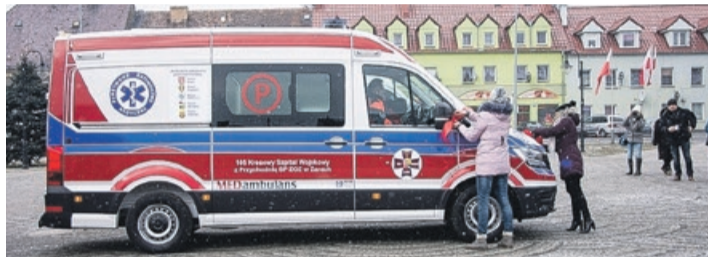
Podstacja ratownictwa medycznego z ambulansem to efekt długich starań burmistrzów, wójtów i starosty powiatu żagańskiego oraz wójta Gminy Przewóz w powiecie żarskim

Ambulans został zakupiony na potrzeby otwieranej w tym samym dniu nowej, podstacji ratownictwa medycznego w woj. lubuskim.