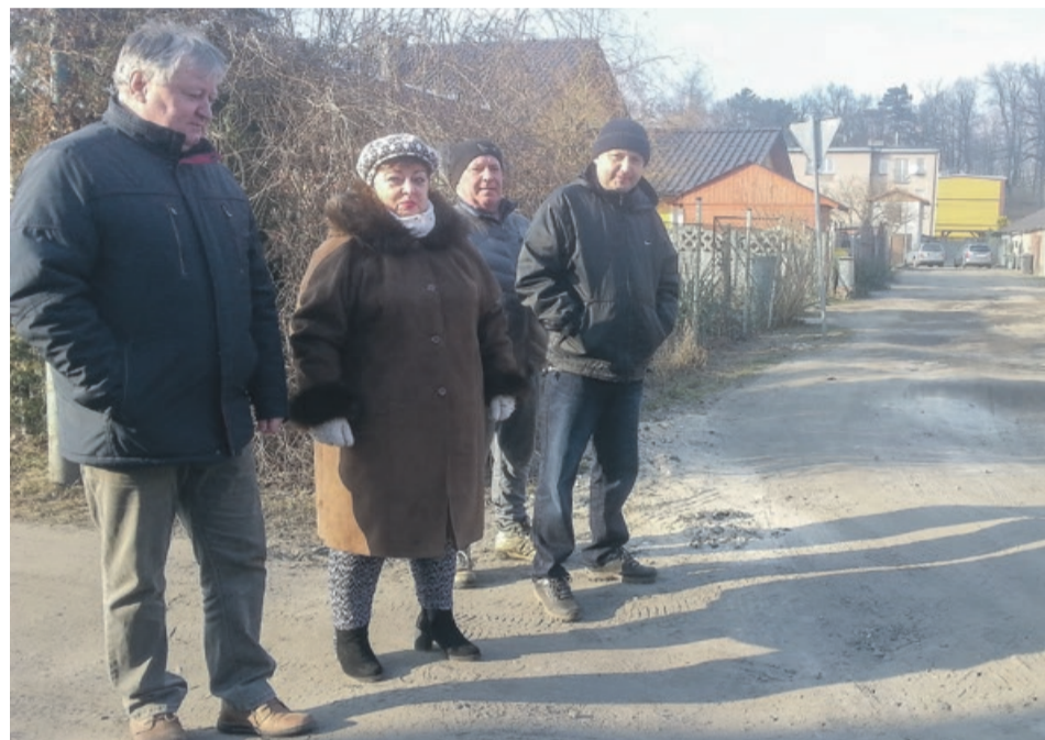
Mieszkańcy borykają się z problemem od lat. Stracili już prawie nadzieję, ale nie poddają się i walczą. Podkreślają, że wybory samorządowe już niedługo

Heleny Sagasz ulica była jeszcze od czasu do czasu zaorana i wyrównana.