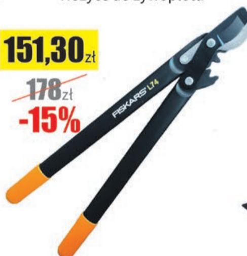
Sekator nożycowy PowerGear L74