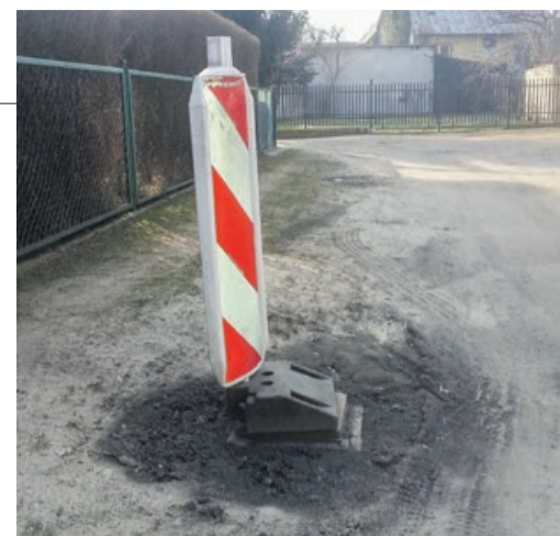
Urzędnicy postawili w największej dziurze słupki ostrzegawcze

- Muszę pokonać wszystkie dziury. Najgorzej jak spadnie deszcz. Wyjście z samochodu jest sztuką.