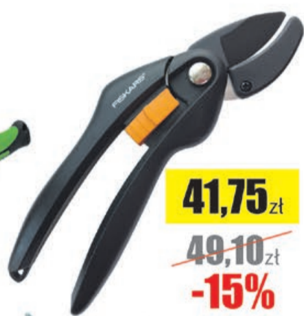
Sekator kowadełkowy SINGLESTEP