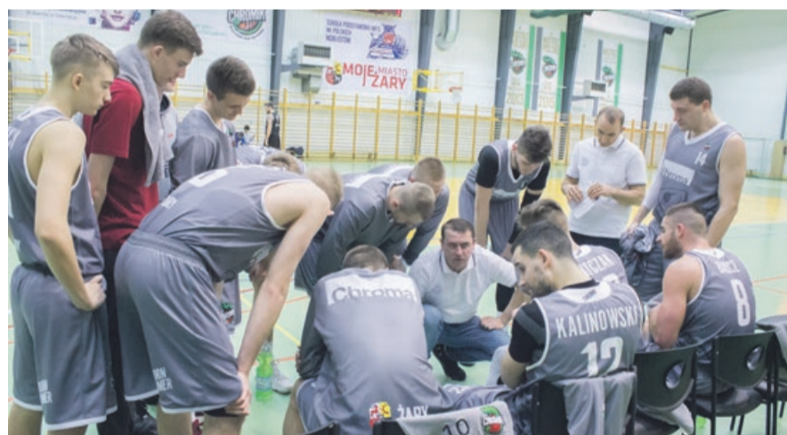
Kilka wskazówek trenera, a reszta w rękach zawodników