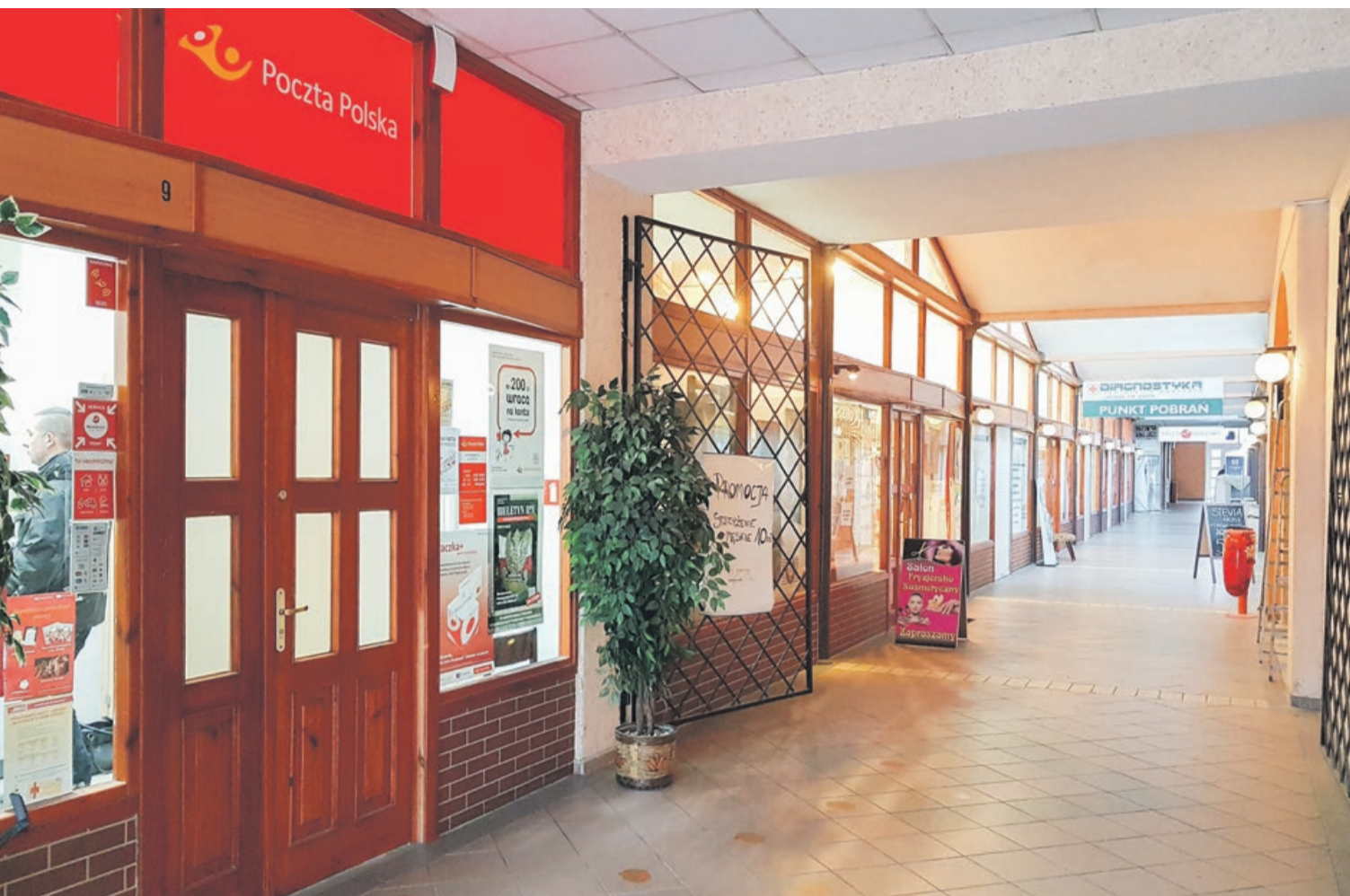
Wnętrze pasażu przed pożarem. Po remoncie będzie tu trochę inaczej