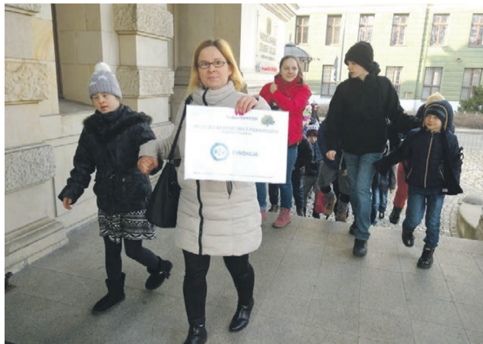
Podczas wizyty w Teatrze Lalek dzieci obejrzały przedstawienie „Czarodziejski flet”