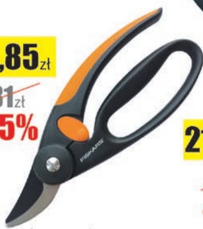
Sekator nożycowy FINGERLOP 195mm