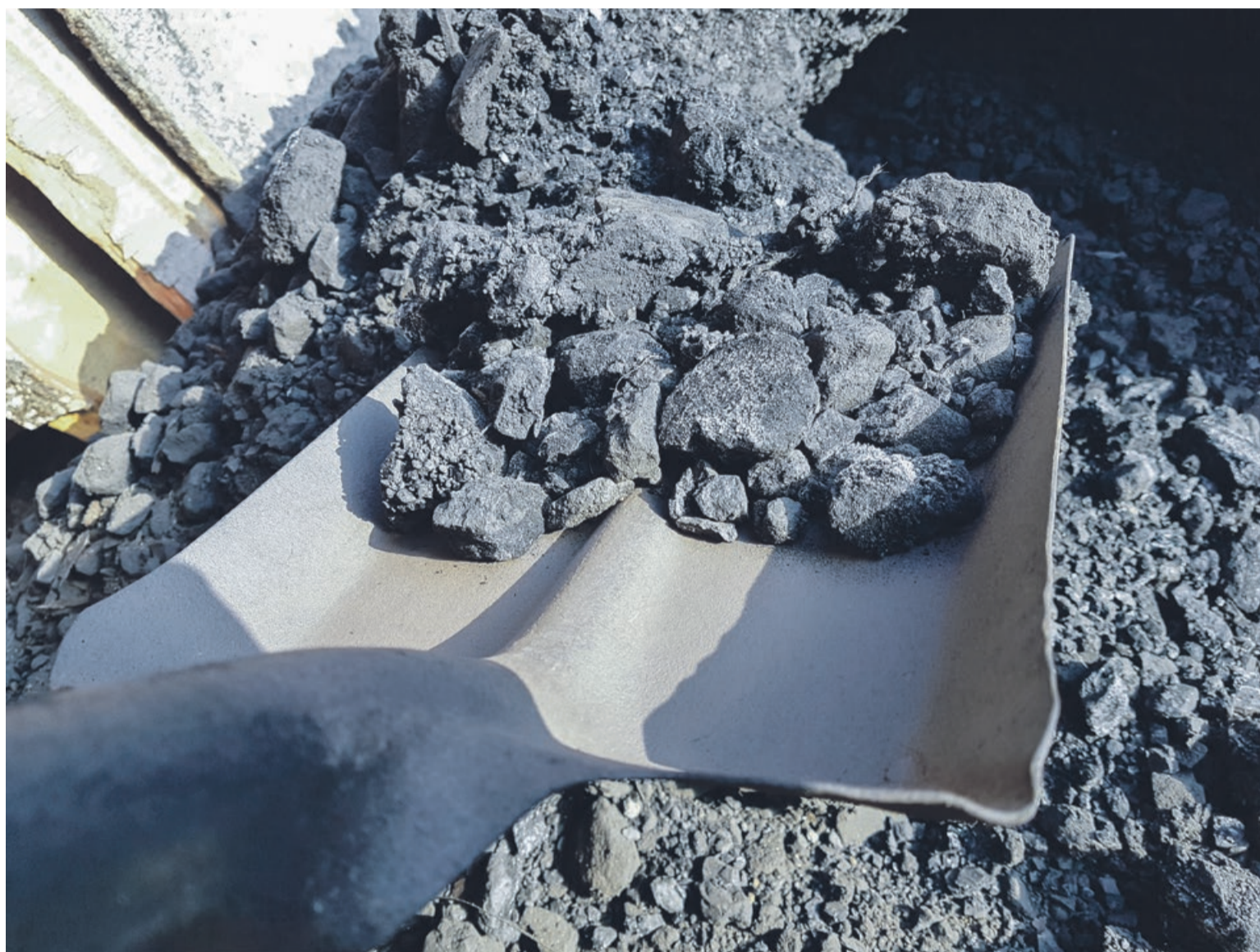
Urzędnicy miejsca propagują zmianę sposobu ogrzewania na bardziej ekologiczny

Teraz komisja przeanalizuje złożone dokumenty pod względem formalnym. Wtedy dopiero okaże się, ile podań zostanie zakwalifikowanych do dalszego etapu. Przeprowadzone będą również wizje lokalne i sprawdzenie na miejscu, co tak naprawdę dany właściciel chce wymienić. Już wiadomo, że nie wszystkie podania zostaną rozpatrzone pozytywnie. Nie można na przykład wymienić starego ogrzewania gazowego na nowsze gazowe.