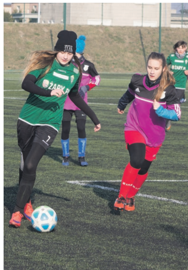
Mróz jakby nie zupełnie nie przeszkadzał