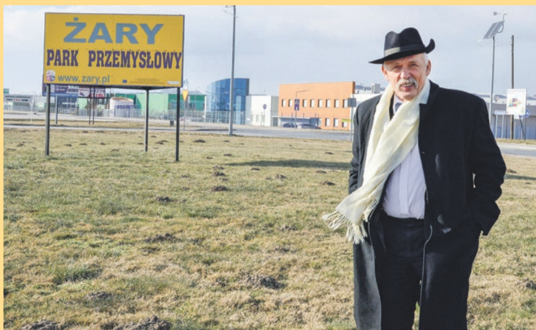
Janusz Korwin-Mikke przekonuje, że gospodarkę można naprawić w pół roku. Wie, że przedsiębiorcy czekają na zmiany, przede wszystkim na uproszczenie i obniżenie podatków