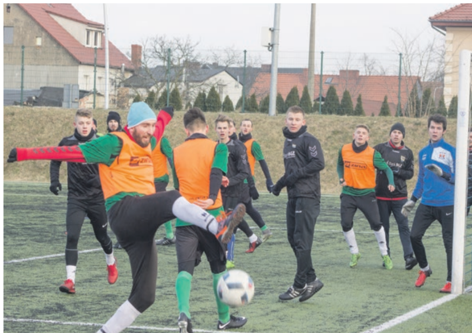
Promień wygrał z Arką 3:1

ku Odrę Bytom Odrzański. Mecz, który rozpocznie się o godzinie 15.00 będzie ostatnim sparingiem przed rozpoczynającymi się już niebawem wiosennymi ligowymi rozgrywkami zielonogórskiej klasy okręgowej. ATB