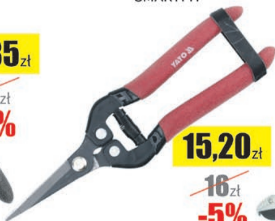
Sekator do zawiązków 190mm