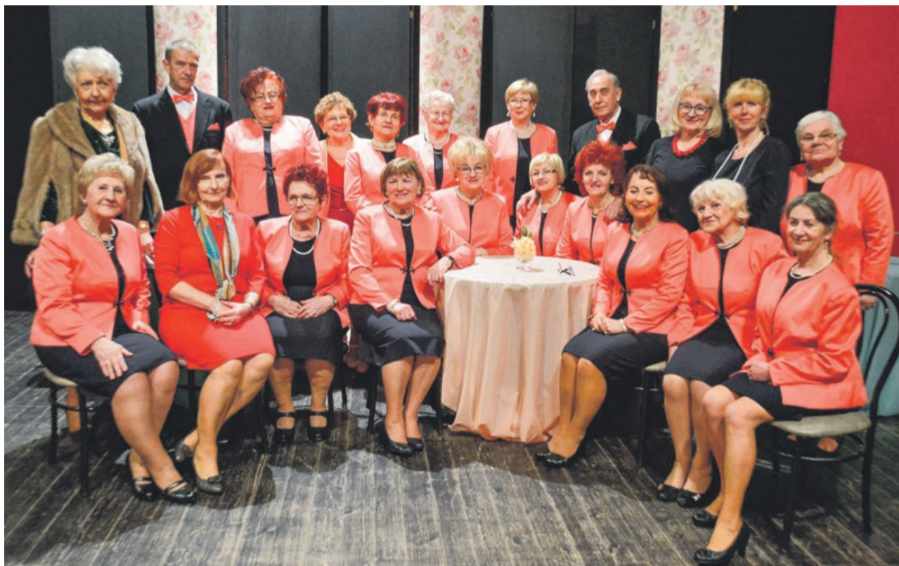
„Żaranie” od lat uświetniają swoimi występami różne uroczystości i imprezy miejskie