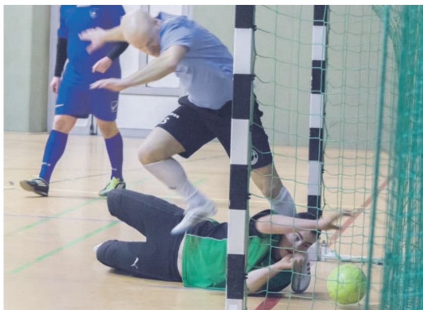
Walka zawsze do końca