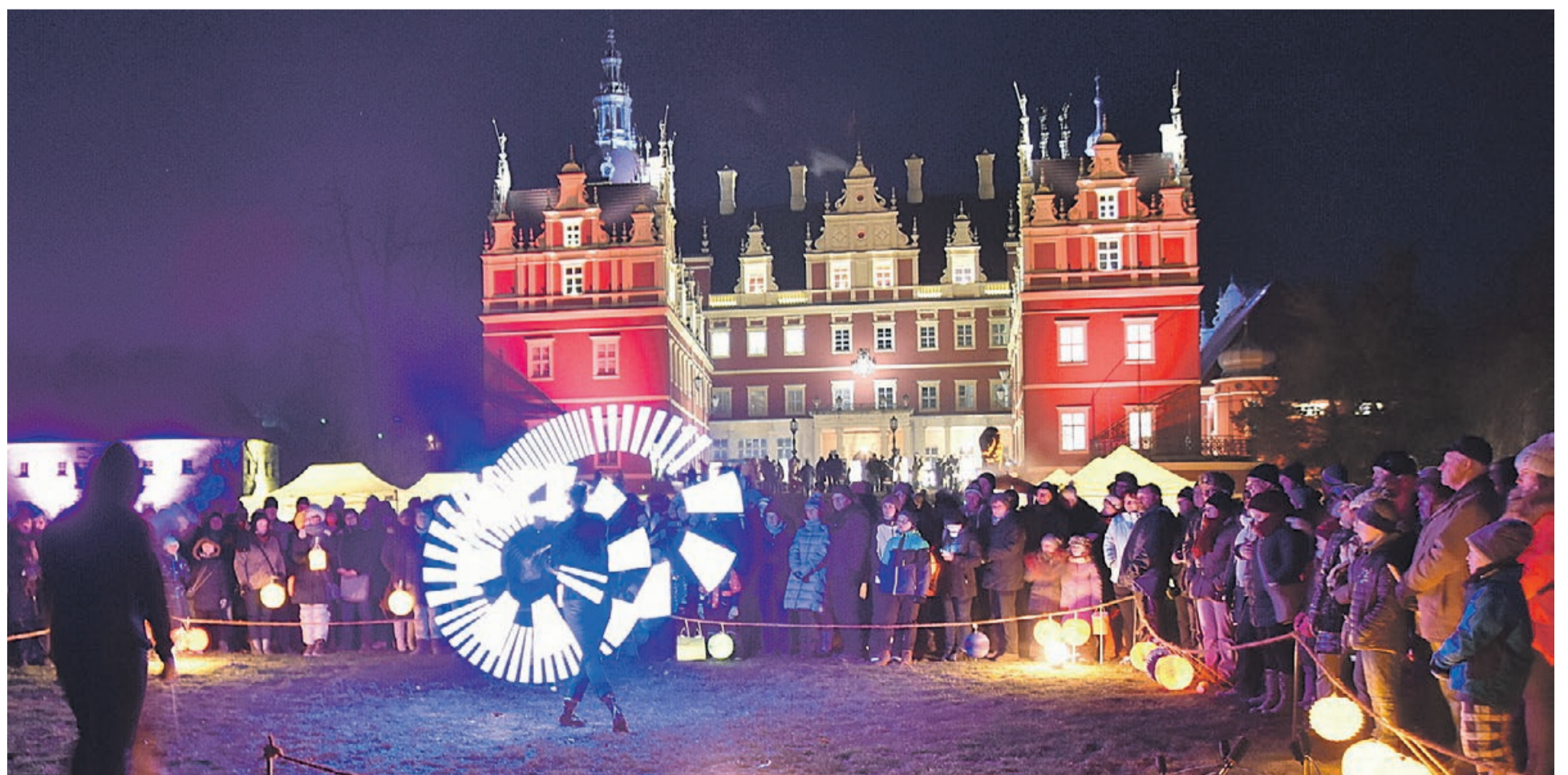
Pomimo mrozu impreza przyciągnęła kilkuset uczestników