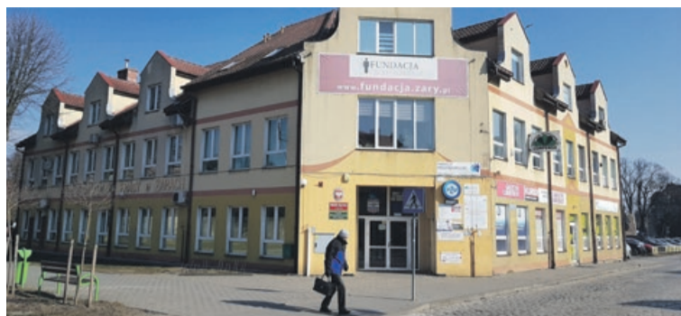
Warto odwiedzać siedzibę Fundacji Przedsiębiorczość przy ul. Mieszka I. Listę ciekawych ofert znajdziemy też w internecie

Obecnie trwa rekrutacja pracowników firm, którzy są zagrożeni utratą pracy oraz osób, które straciły zatrudnienie nie z własnej winy do pół roku wstecz. Mogą wziąć udział w szkoleniu na inspektora danych osobowych, a przy okazji objęci zostaną dodatkowo pośrednictwem i doradztwem zawodowym. Oferta obejmuje całe województwo lubuskie. Osoba z certyfikatem inspektora ochrony danych osobowych przyda się na pewno w wielu firmach. Wszystko to w związku z nowym rozporządzeniem, które wchodzi w życie pod koniec maja. Nowe przepisy dotyczą nawet małych firm, które przetwarzają dane osobowe. Wystarczy posiadać zwykłą bazę danych kontrahentów i tu już mamy do czynienia