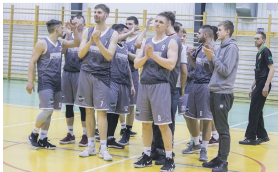
Są powody do radości