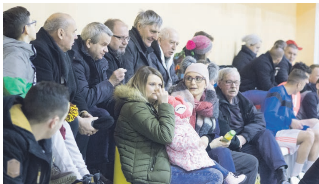
Niezależni ligowi obserwatorzy zgodnie twierdzą, że było na co popatrzeć