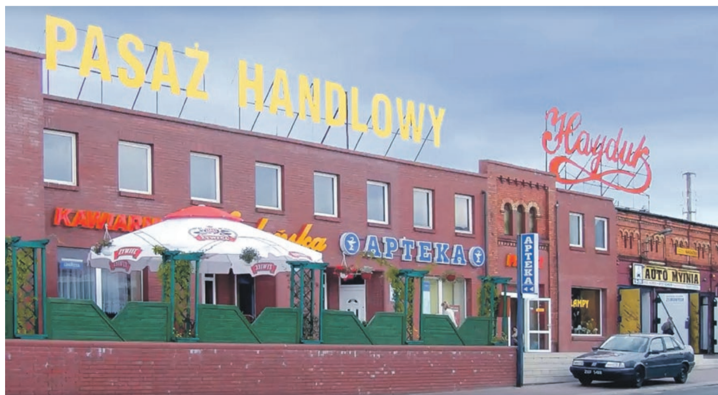
Czy ktoś jeszcze pamięta pasaż w takiej odsłonie? Po remoncie będzie jeszcze inaczej