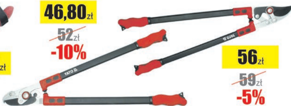
Sekator do gałęzi 700mm 35mm D