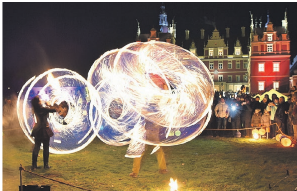
Fantastyczna gra światel i ognia