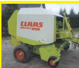
Prasa do słomy Claas Rollant 250, rok 2002, stan bardzo dobry, Tel. 699-932-056

► Sprzedam krowę czarno-białą, cielna na czerwiec, cielak jałoweczka Tel. 699 932 056