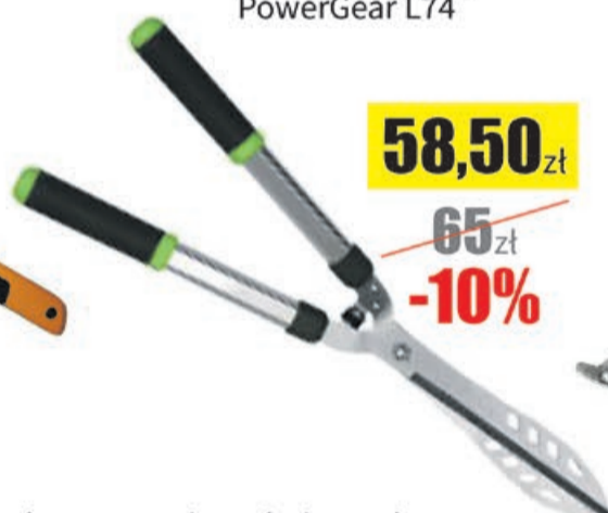
Nożyce do żywopłotu 660mm