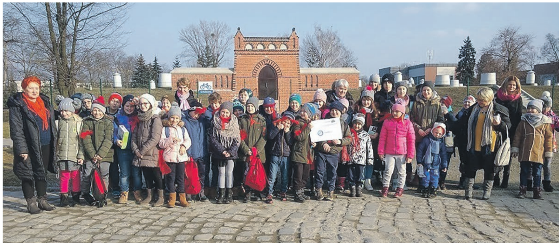
Dzięki wsparciu Fundacji PZU oraz Fundacji Pięknolesie dzieci mogły miło spędzić czas, zdobyć wiedzę i poszerzyć horyzonty myślowe