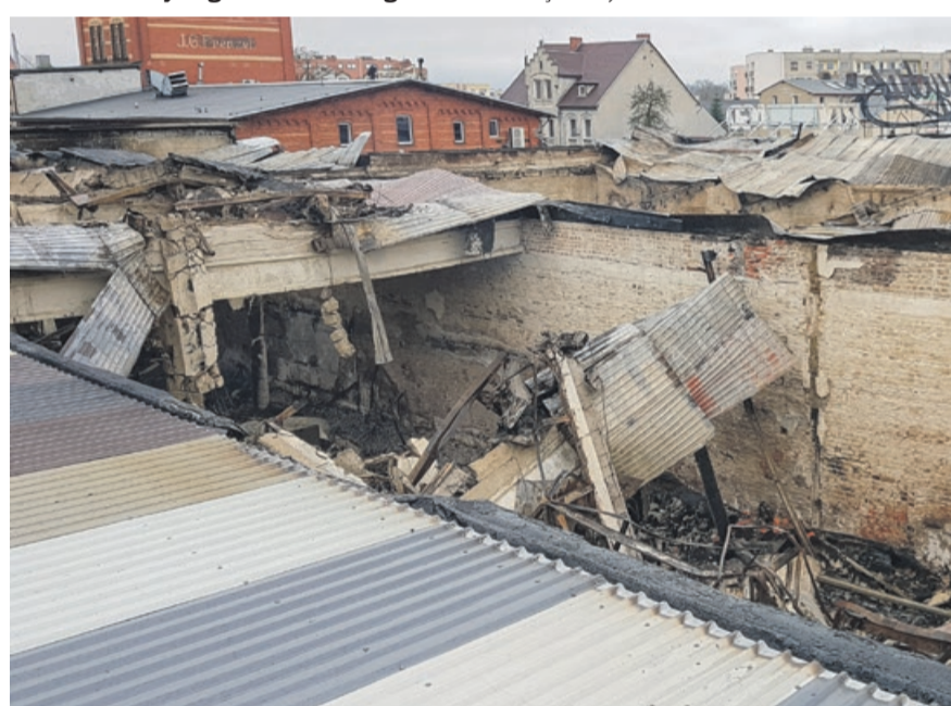
Aż trudno uwierzyć, jakiego spustoszenia dokonał szalejący pożar