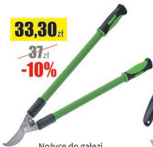
Nożyce do gałęzi