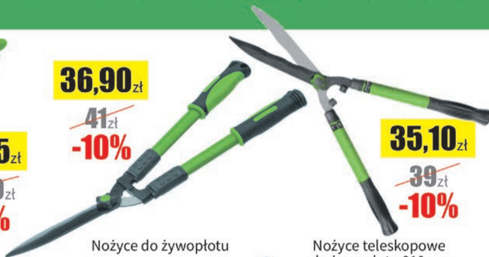
Nożyce do żywopłotu