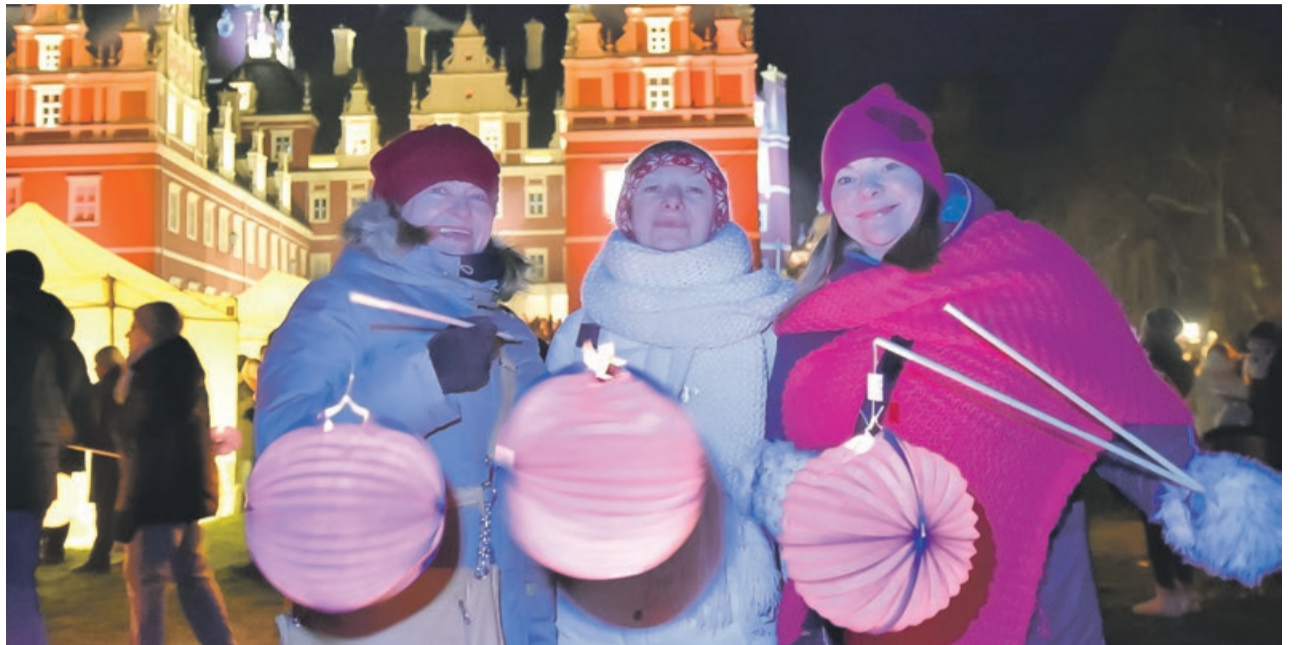
Lampiony przygotowali i zapewnili uczestnikom organizatorzy

parkowego. Każdy uczestnik mógł posmakować grzanego wina i tradycyjnych potraw niemieckich. Atrakcją wieczoru była inscenizacja świetlna w wykonaniu Teatru Ognia oraz koncert zespołu muzycznego. Festiwal zimowy światła odbywa się w ramach Ogrodów Światła i jest realizowany równocześnie w Łazienkach Królewskich w Warszawie, Muzeum Carskie Siołto w Sankt Petersburgu, Rezydencji Księcia Gongga w Pekinie, Zamku w Lunneville we Francji oraz w Zamku Frederiksborg w Hillerød, w Danii. JM