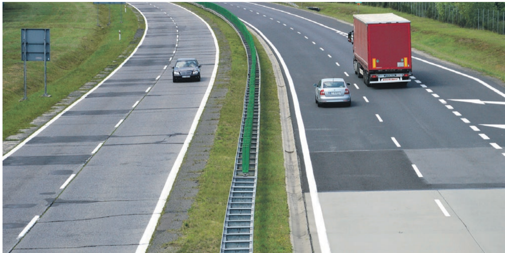
Do interwencji doszło na krajowej osiemnastce w kierunku Olszyny

Mężczyzna, mieszkaniec powiatu jaworskiego, poruszając się krajową „osiemnastką” w kierunku Olszyny, zauważył przed sobą nissana. Nie byłoby w tym nic nadzwyczajnego, ale kierujący nissanem nie dość, że jechał wolno, to jeszcze zygzałkiem. Stwarzał w ten sposób zagrożenie dla innych kierujących. Jadący za nim mężczyzna zorientował się, że kierowca nissana jest prawdopodobnie nietrzeźwy lub otumaniony środkami odurzającymi. Natychmiast podjął więc decyzję o wyeliminowaniu tego kierowcy z ruchu. Aby ograniczyć ryzyko zderzenia się innych pojazdów z nissanem, spowodował ruch jadąc w sposób uniemożliwiający wyprzedzanie oraz włączył światła