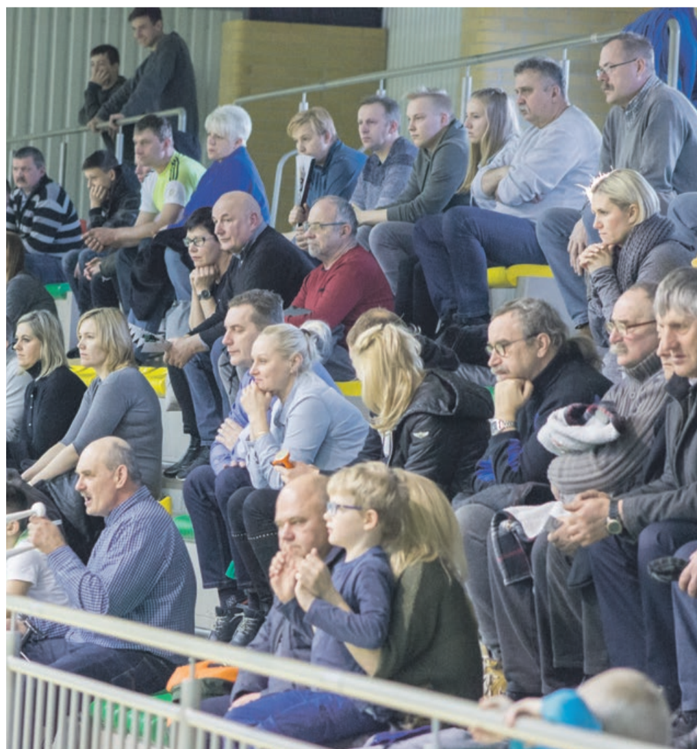
Kibice bacznie obserwują każdy ruch na boisku