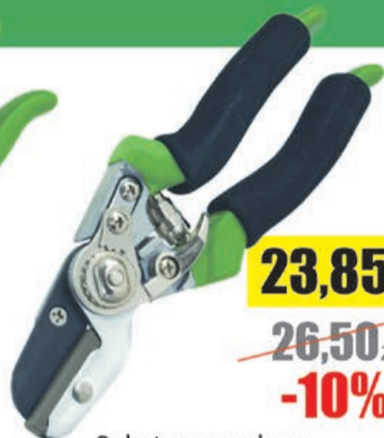
Sekator ogrodowy z kowadełkiem