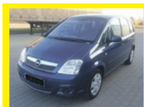
Opel Meriva rok 2007, pojemność 1700 Cdti, klimatyzacja, tempomat, elektryka. Tel. 602-738-351