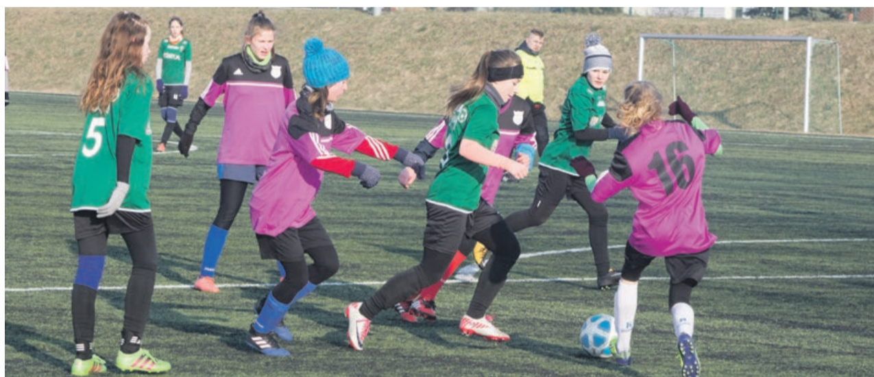
Reprezentantki Lubsko nie były w stanie nawiązać równorzędnej walki

Przed dziewczynami kolejny sprawdzian. Tym razem na żarskim „Okraślaku” przy ulicy Zwycięzców zagrają z drużyną Lejdis Team MCWR Chrobry Głogów. To spotkanie już w sobotę, 3 marca o godzinie 11.00. ATB