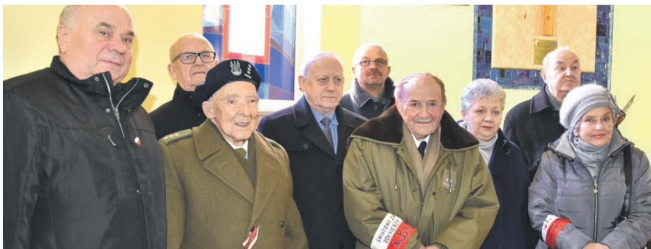
W uroczystości, oprócz mieszkańców Żagania, wzięli także udział goście z Żar i Lipinek Łużyckich

odstąniono tablicę pamiątkową, poświęconą pomordowanym i poległym żołnierzom Armii Krajowej. W uroczystościach wzięli udział mieszkańcy miasta, kombatanci, zaproszeni goście i władze samorządowe. W lutym minęło 76 lat, od kiedy powstała Armia Krajowa, która zapisała się w dziejach narodu polskiego poprzez cierpienie i bezinteresowną ofiarnością swoich żołnierzy. JM