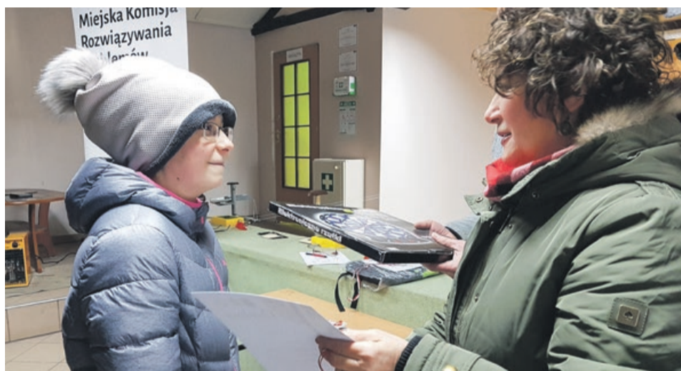
Dziewczęta udowodniły, że mają celne oko i pewną rękę