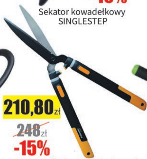
Nożyce teleskopowe do żywopłotu SMARTFIT