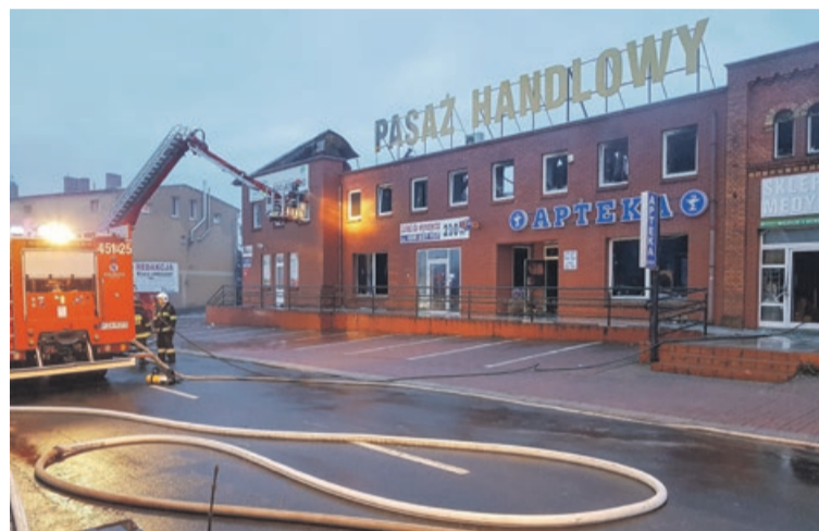
Sylwesterowy wieczór. Cały świat szykował się do hucznej zabawy, a w tym czasie strażacy dogaszali resztki ognia