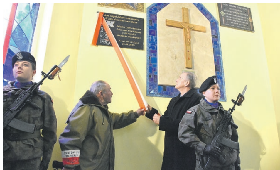
Tablica została odsłonięta w uroczystej asyście