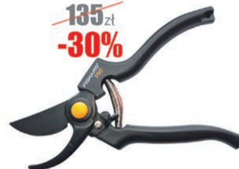
Sekator profesjonalny 230mm