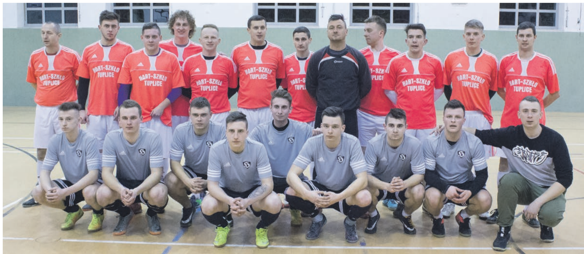
Finałiści „Ligi mistrzów”. Hart-Szko Tuplice górą