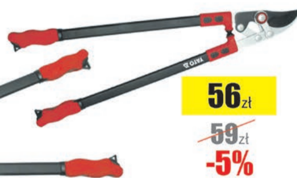
Sekator do konarów 780mm 44mm