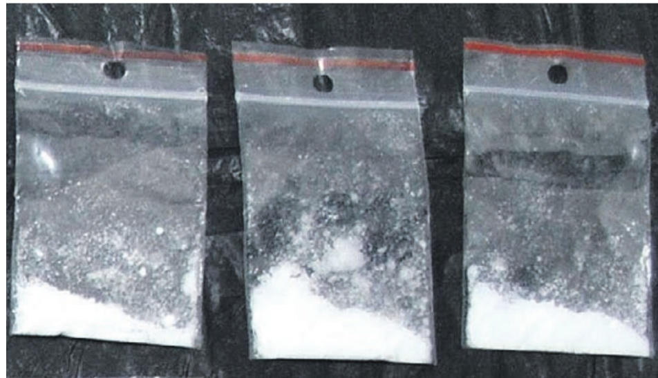
Policjanci co rusz zatrzymują osoby, które mają przy sobie narkotyki

Policjant z Ognia Patrolowo-Interwencyjnego KPP w Żaganiu patrolując ul. Wałową zauważył trzech mężczyzn, z których jeden, na widok policjanta, próbował coś schować do kieszeni. Ponadto zachowywał się nerwowo, trzęsły mu się ręce. Podczas sprawdzania odzieży policjant znalazł przy nim woreczek strunowy z marihuaną.