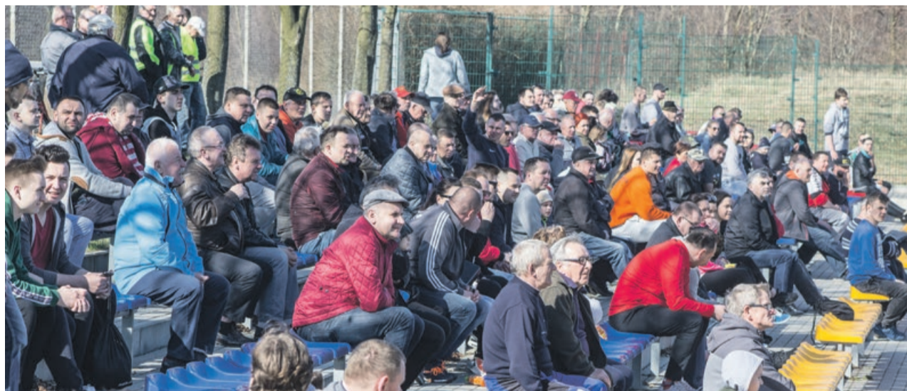
Piłkarze z Lubka nie mogą narzekać na puste trybuny