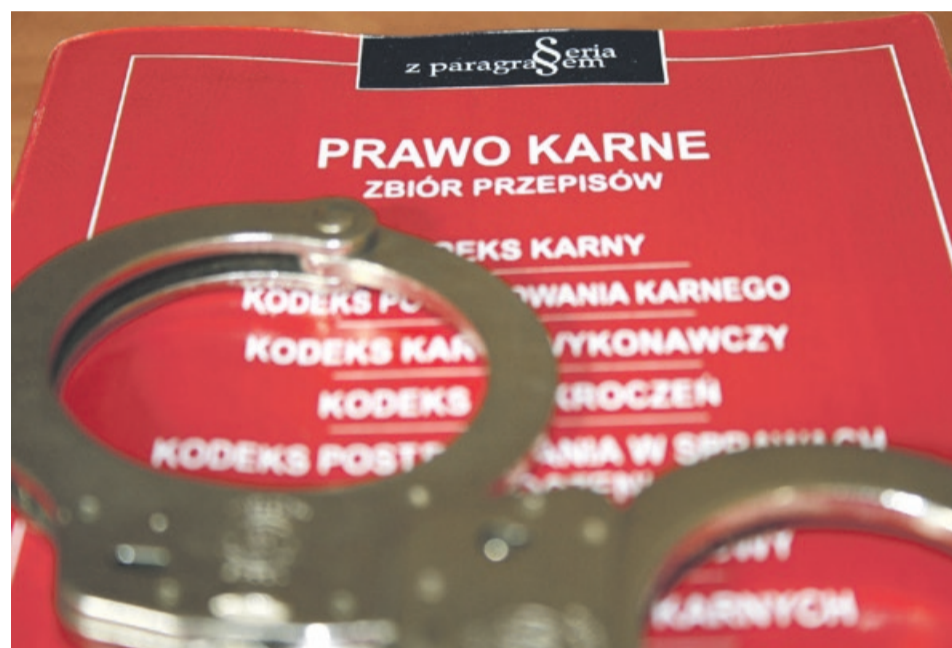
Wykorzystywanie wizej niezgodnie z deklaracją i agresywne zachowanie grożą grzywną, pozbawieniem wolności i powrotem na Ukrainę

Kobiecie postawiono zarzut naruszenia nietykalności cielesnej funkcjonariusza za co grozi jej kara grzywny, ograniczenia wolności lub pozbawienia wolności do lat 3. Oprócz procedury karnej Komendant Placówki SG w Tuplicach wszczął postępowanie administracyjne w celu zobowiązania cudzoziemki do powrotu. PAS