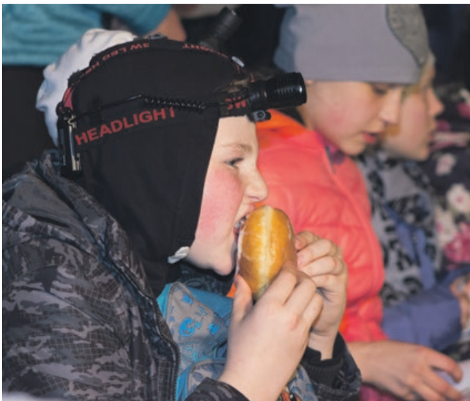
Pączki smakowały wybornie