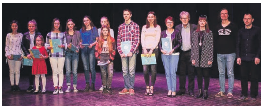
Swoje umiejętności wokalne trzeba zaprezentować i udowodnić na kolejnych szczeblach eliminacji. Być może też w finale?