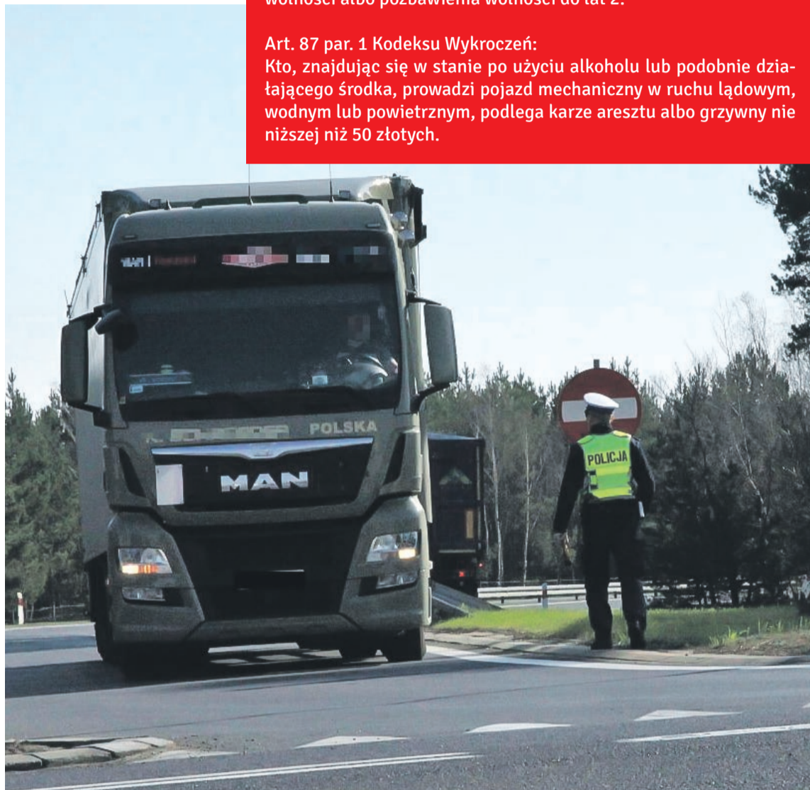
Udało się wyeliminować z ruchu kilku nieodpowiedzialnych kierowców wielotonowych ciężarówek

W czwartek (12 kwietnia) policjanci kolejny raz zorganizowali „Trzeźwego kierowcę”. W ciągu niecałych trzech godzin wpadło trzech kierowców ciężarówek, którzy byli pod wpływem alkoholu. Jeden z nich miał blisko jeden promil alkoholu. PAS