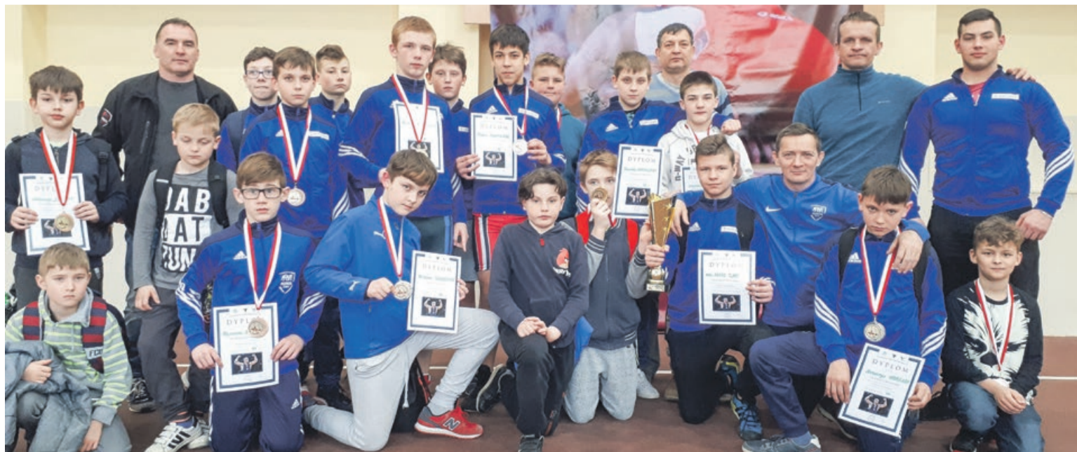
Zapaśnicy żarskiego Agrosu bardzo dobrze zaprezentowali się na turnieju w Wałbrzychu