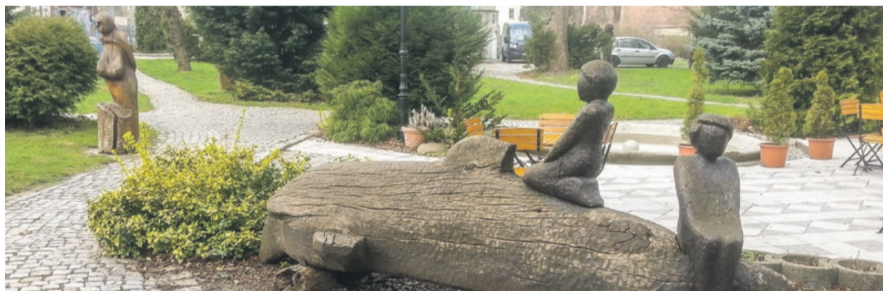
Ta rzeźba prawdopodobnie zostanie usunięta