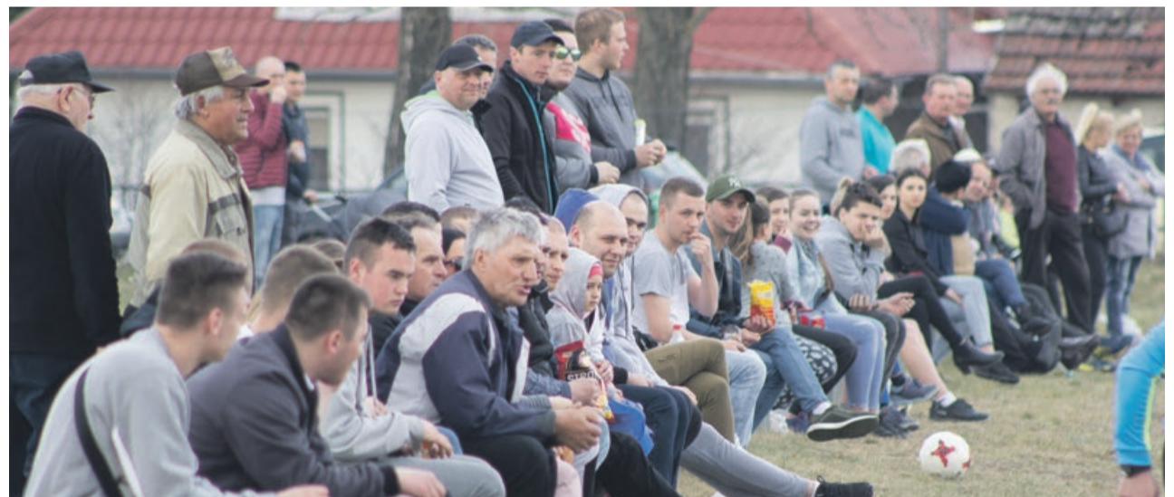
Cztery bramki w czasie jednego meczu to całkiem dobre widowisko sportowe