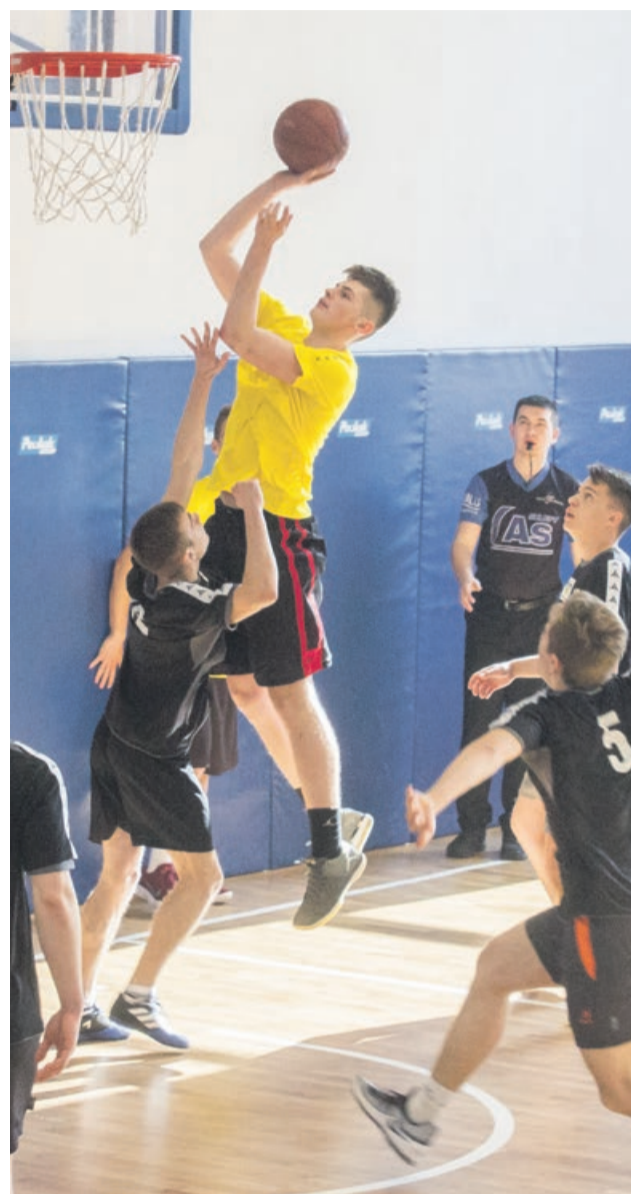
Mistrzowie powiatu żarskiego nie mieli problemów z pokonaniem rywali