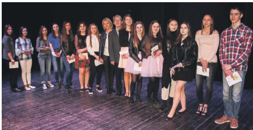
Nie tylko talent, ale i ciężka praca pod okiem instruktorów w końcu przyniesie efekty

Na zakończenie wszyscy wykonawcy eliminacji powiatowych otrzymali pamiątkowe dyplomy uczestnictwa, a laureaci nagrody w postaci albumów muzycznych. PAS