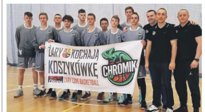
Ćwierćfinały to już sukces

Zaszli naprawdę daleko, ale trafili na mocnych. Chromik Żary - Politechnika Szkoła Gortata Gdańsk 70:84. Wilki Morskie Szczecin Akademia Basketu - Chromik Żary 97:59. ATB