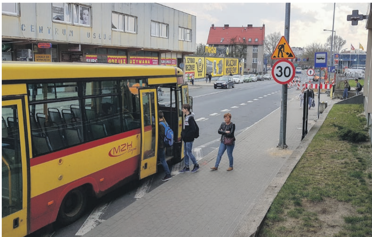
Na czas budowy przystanki zostaną przesunięte w stronę ulicy Artylerzystów oraz ulicy Podchorążych

Z przystanku w pobliżu ulicy Artylerzystów