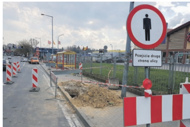
Prace przy ul. Ułańskiej ruszyły pełną parą

będą odjeżdżać autobusy w kierunku Zgorzeleckiej, natomiast drugi od strony ulicy Podchorążych będzie przeznaczony dla jadących w kierunku Kunic i Zawiszy Czarnego.