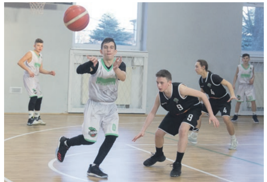
Młodzicy Chromika nie dali rady swoim rywalom