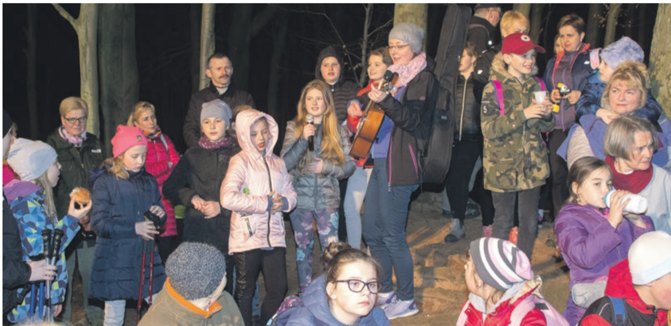
Uczestnikom marszu towarzyszyła muzyka