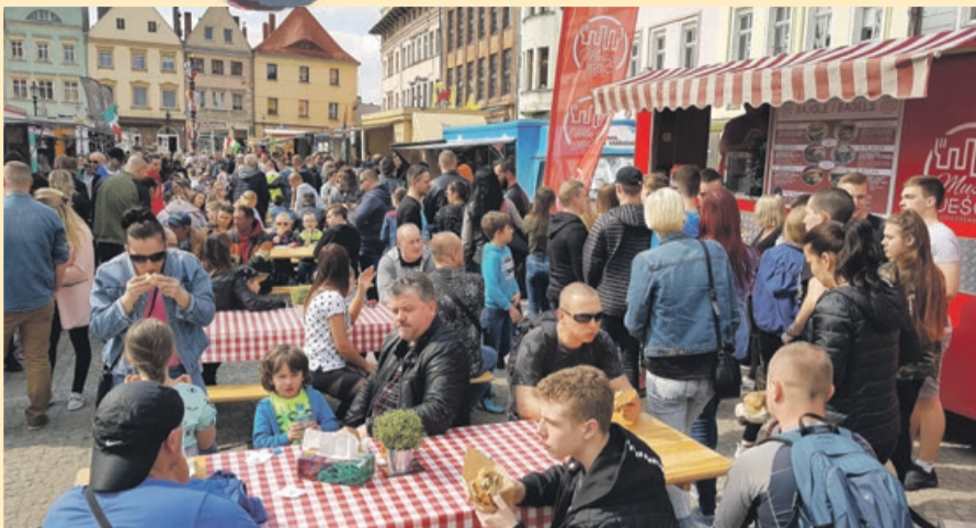
ŻARY Tłumy mieszkańców zajadają się różnościami z jadłodajni na kółkach, które zajęły na żarski Rynek. Pomimo, że ceny do najniższych raczej nie należały