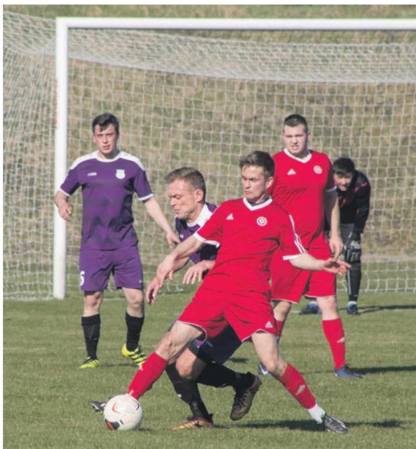
Budowlani nie poradzili sobie z rywalem na własnym boisku

Budowlani niezmiennie zajmują przedostatnią pozycję w tabeli. Niżej raczej nie spadną, ponieważ ostatni Piast Karnin jest raczej trudny do zdetrzonizowania. Natomiast piłkarze z Lubka cały czas mają szansę podskoczyć w górę. ATB