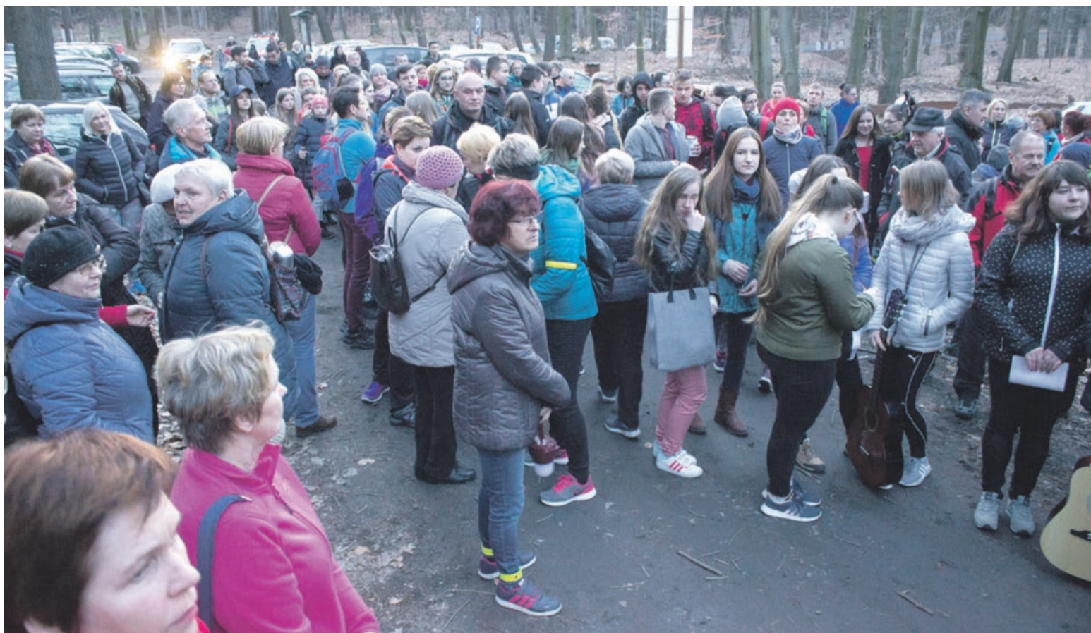
Uczestników marszu było tylu, że na leśnym parkingu zabrakło miejsca na samochody

Na starcie stawili się zarówno seniorzy, jak i dzieci, dla których niewątpliwą atrakcją było spacerowanie po lesie w ciemnościach. Ale to też swoista lekcja historii o wielkim i zasłużonym Polaku. ATB