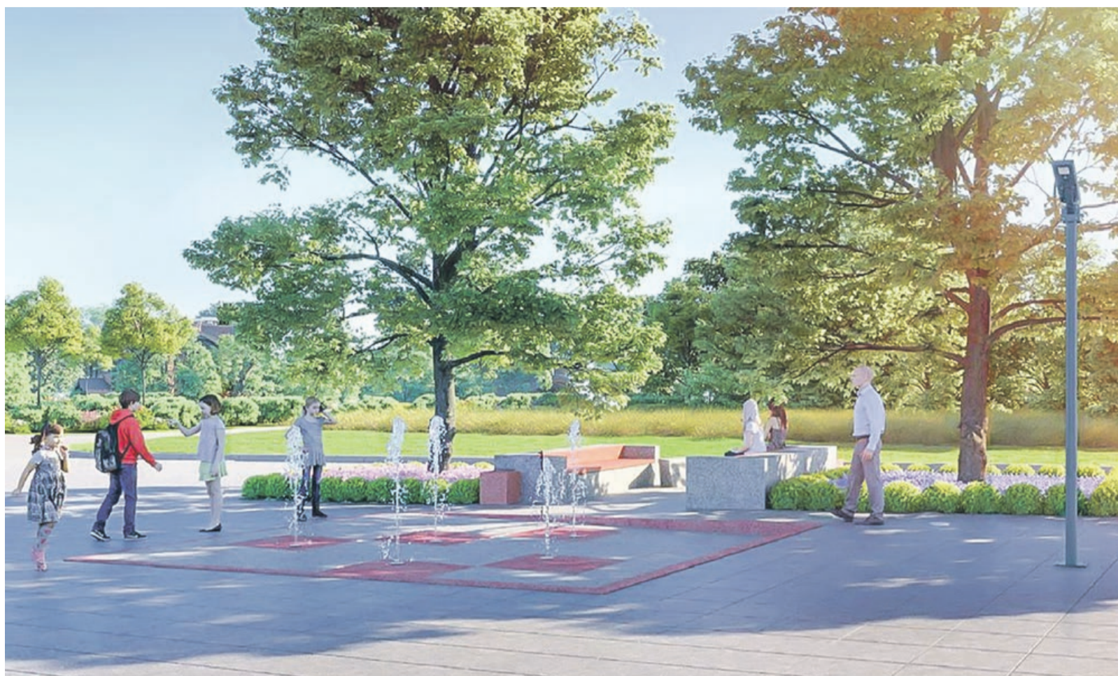
Wizualizacja projektu fragmentu rynku w centrum Trzebiela

Powstał program rewitalizacji, który obejmował siedem obszarów w gminie: Trzebiel, Nowe Czaple, Bronowice, Niwica, Żarki Wielkie, Dębinka i Przewoźniki. W lipcu 2016 roku Urząd Marszałkowski ocenił przygoto-