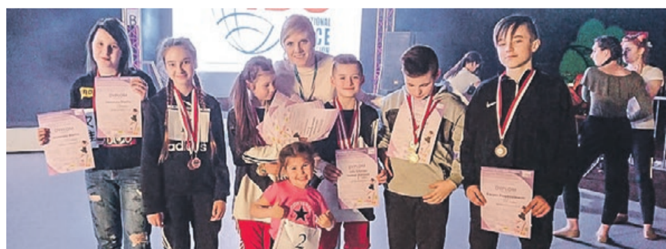
Sukcesy można odnosić niezależnie od wieku fot. nadesłane