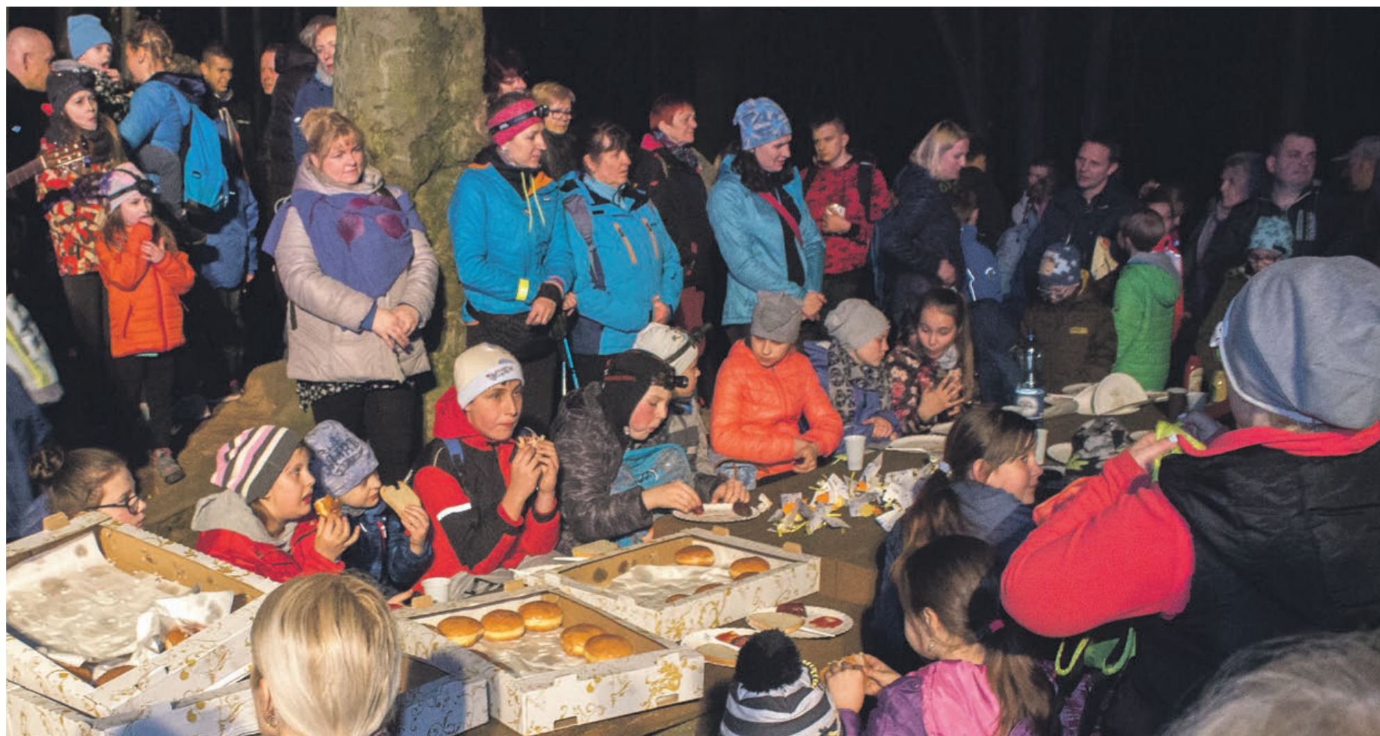
Odpoczynek i posiłek po nocnym marszu w Zielonym Lesie