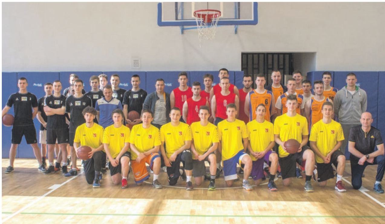
Reprezentacja Zespołu Szkół Ekonomicznych, w żółtych strojach, awansowała do półfinałów LOM