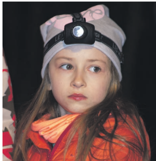
Nie da się chodzić po ciemnym lesie bez odpowiedniego ekwipunku