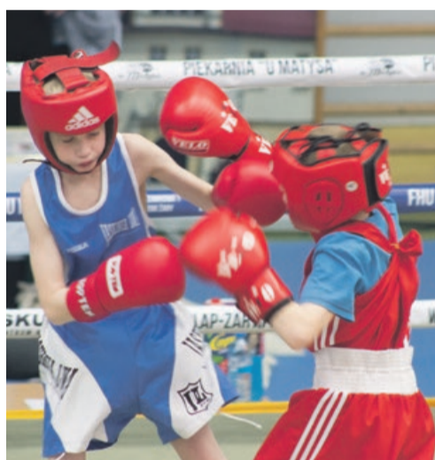
Kolejne pokolenia boksu