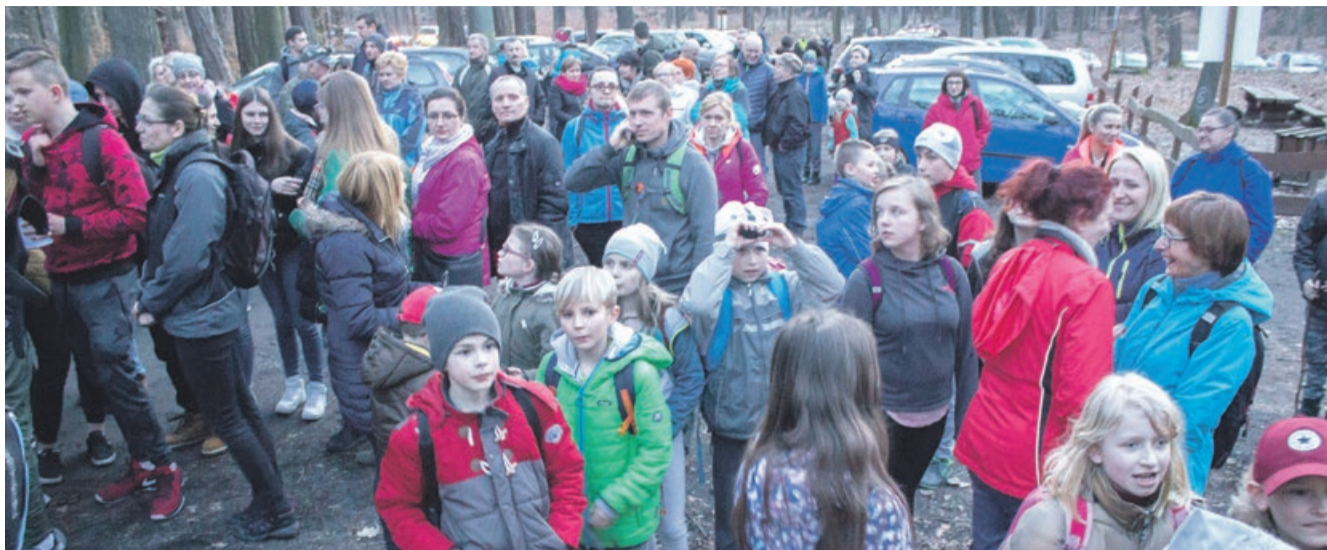
Modsi, starsi, dzieci. Marsz papieski łączy wszystkie pokolenia