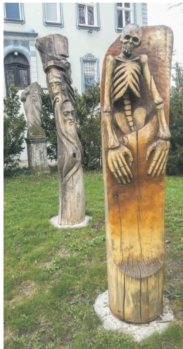
Trzeba będzie dokonać przeglądu