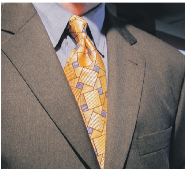
Nie wszyscy potrafią się dobrze ubrać

Dress code to najogólniej rzecz ujmując zbiór zasad odpowiedniego dopasowania ubioru do okazji. Jak się ubrać na spotkanie biznesowe, na oficjalną kolację, w co się ubierać na co dzień do pracy? Okazuje się, że nie wszyscy sobie z tym radzą. Nie chodzi