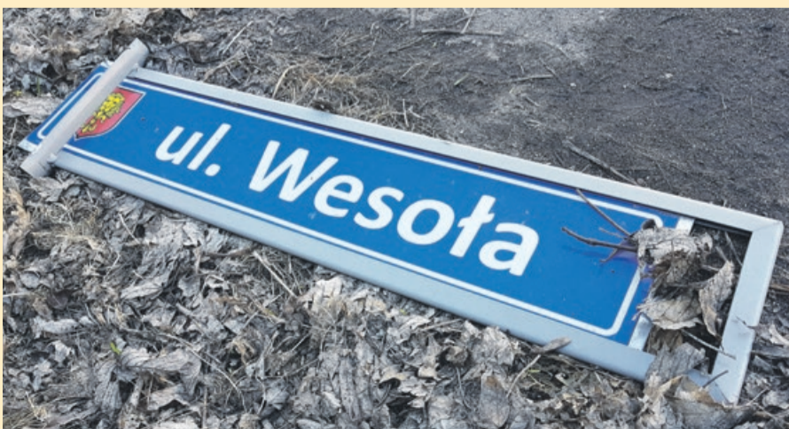
ŻARY Można długo i bezskutecznie zastanawiać się, jaką drogę przebyła ta tabliczka z ulicy Wesolej w Jasieniu w okolicy ulicy Skarbowej w Żarach. Kto jej w tym pomógł i przede wszystkim... po co?