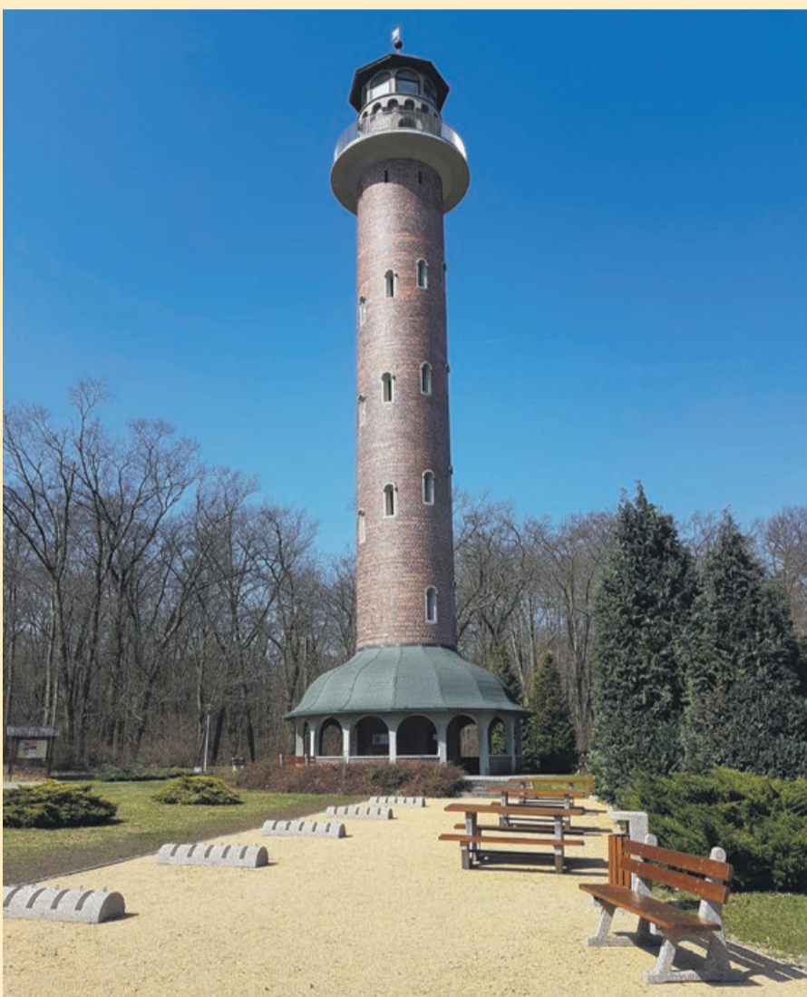
ŻARY Wieża widokowa przy Ośrodku Edukacji Przyrodniczo-Leśnej w Jeziorach Wysokich czeka na turystów i zwiedzających okolice. Przy wieży zamontowano nowe ławki i stojaki rowerowe