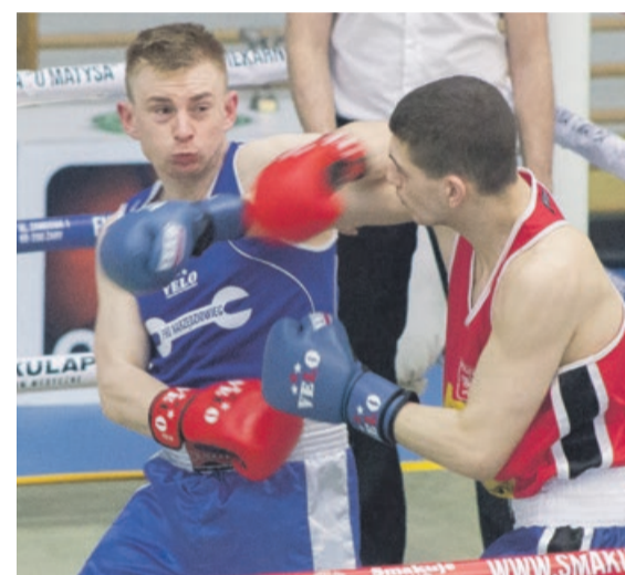
Jeden cios może być decydującym