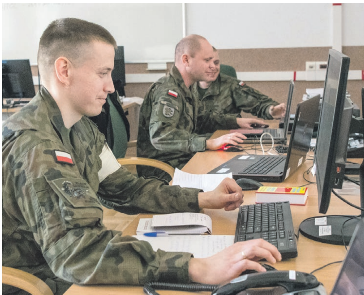
W ćwiczeniu brało udział kilkuset żołnierzy nie tylko z dowództwa i sztabu Czarnej Dywizji oraz jednostek podległych. Ważnym elementem szkolenia był udział reprezentantów układu pozamilitarnego, przedstawicieli władz i instytucji państwa

Ćwiczenie odbywało się w Centrum Symulacji i Komputerowych Gier Wojennych Akademii Sztuki Wojennej w Warszawie, instytucji powołanej do prowadzenia tego typu ćwiczeń. Podczas ćwiczenia wykorzystano system symulacji pola walki JTLS (ang. Joint Theater Level Simulation). System jest przeznaczony do szkolenia dowództw od szczebla brygady (pułku) wzwyż. PAS