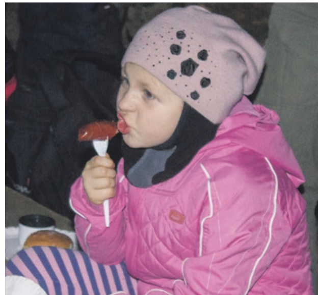
Kielbaska z ogniska w sam raz na leśną, nocną przygodę