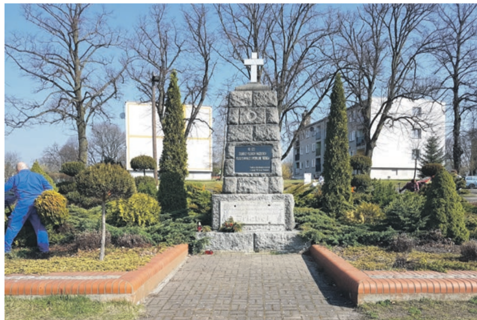
Pomnik kilkakrotnie przenoszony znów zmieni lokalizację

- Miejmy nadzieję, że zagospodarowanie rynku zmobilizuje właścicieli przyległych nieruchomości do poprawienia wizerunku budynków i otocze-