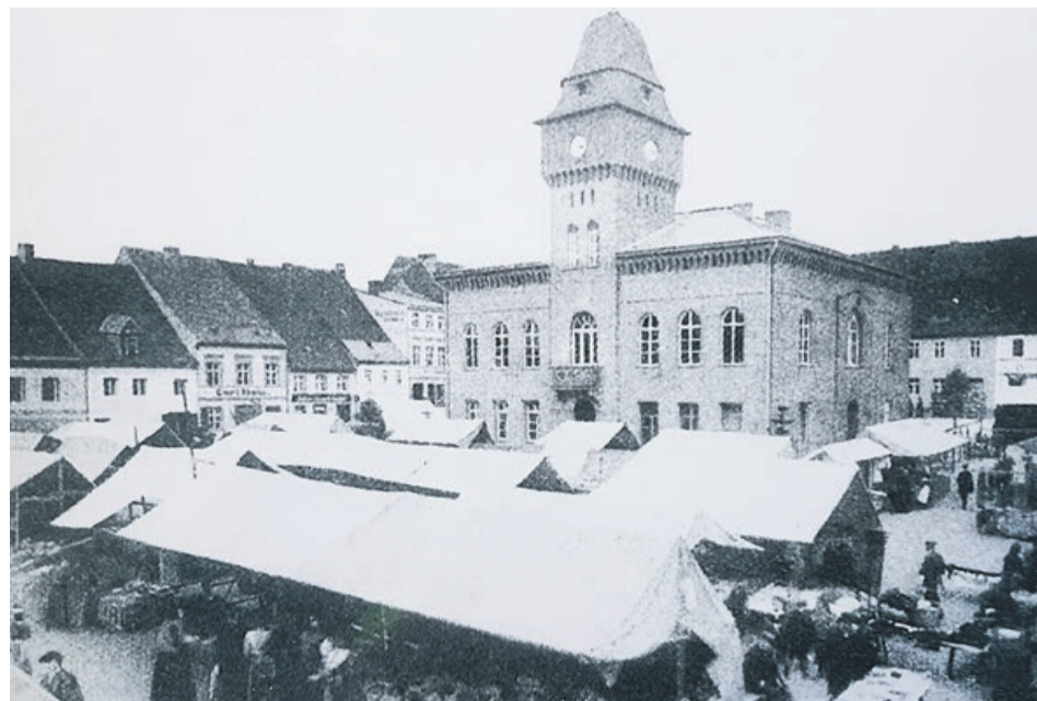
W centralnym punkcie rynku stał tuplicki ratusz. Nie został zniszczony przez działania wojenne, lecz rozebrany po jej zakończeniu