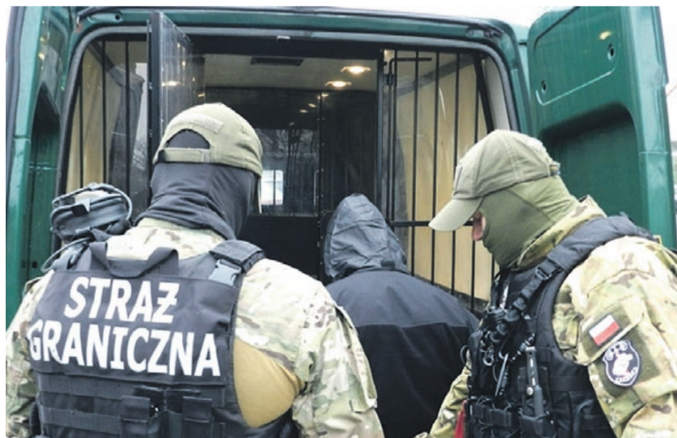
„Wagarowicz” wpadł w ręce funkcjonariuszy, w prosty sposób

Wspólny Polsko-Niemiecki patrol funkcjonariuszy Straży Granicznej zatrzymał do kontroli na terenie byłego drogowego przejścia granicznego w Olszynie, wjeżdżający do naszego kraju samochód marki ford. W trakcie legitymo-