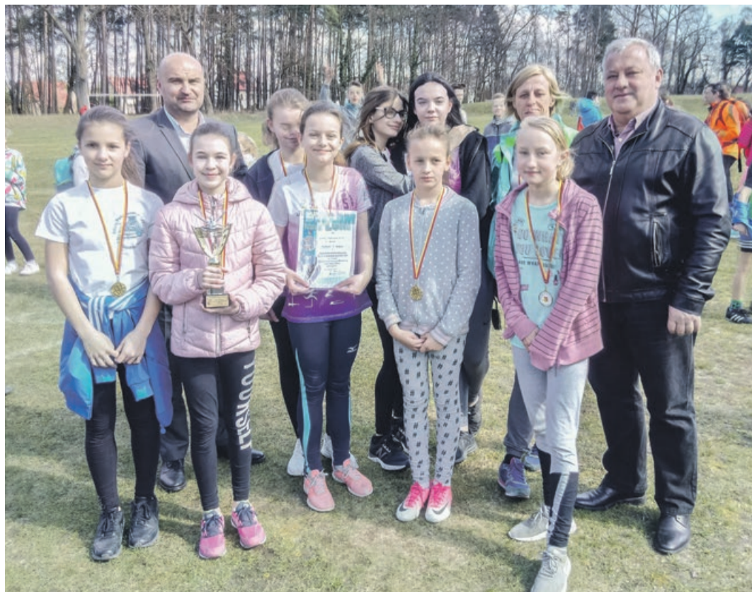
Medalowa reprezentacja dziewcząt ze Szkoły Podstawowej nr 5 w Żarach

Wśród chłopców najlepsze było Centrum Kształcenia Zawodowego i Ustawicznego. Dalej kolejno: Zespół Szkół Ekonomicznych, Zespół Szkół Budowlanych, Społeczne Liceum Ogólnokształcące, Zespół Szkół Ogólnokształcących i Ekonomicznych ATB