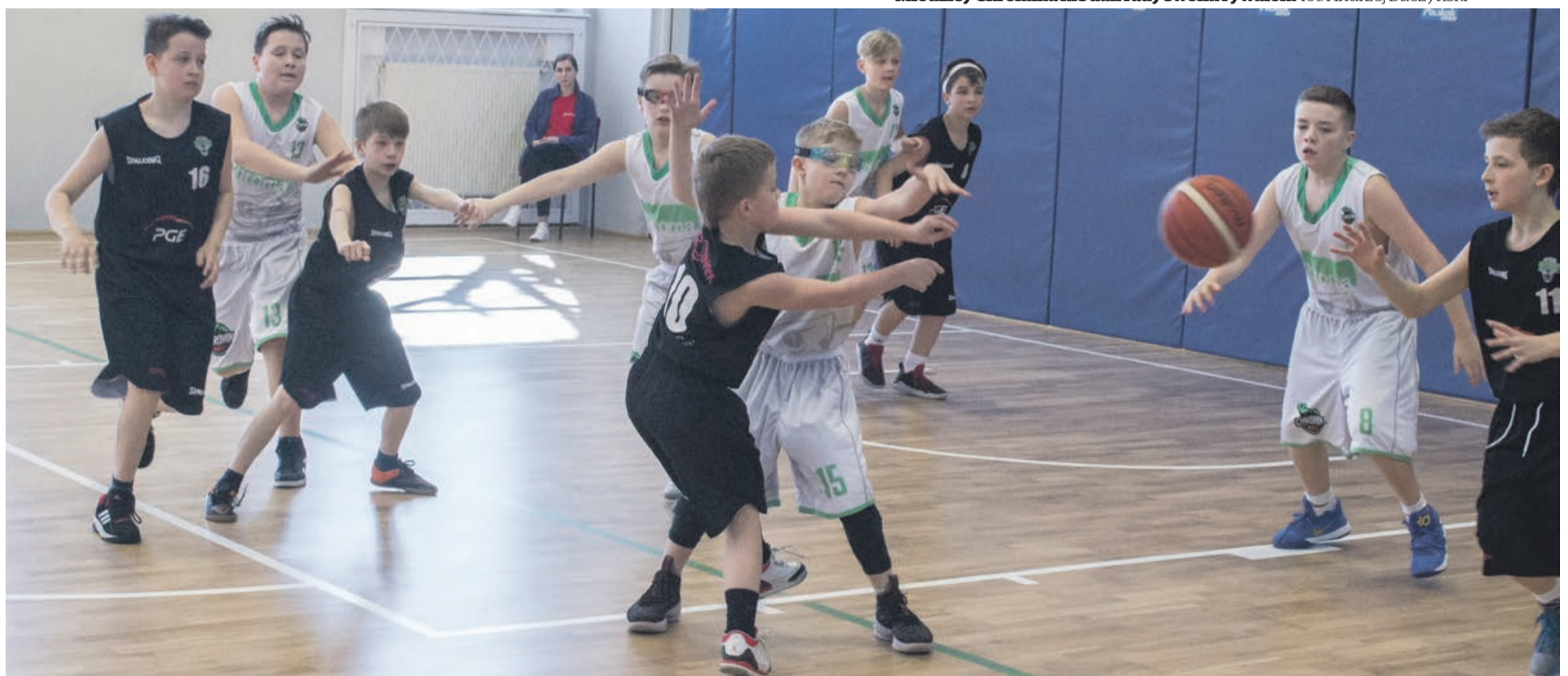
Wzrostu może jeszcze brakuje, ale woli walki z pewnością nie