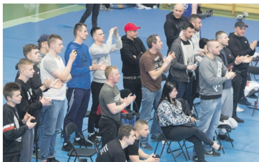
Jest sport, są i kibice