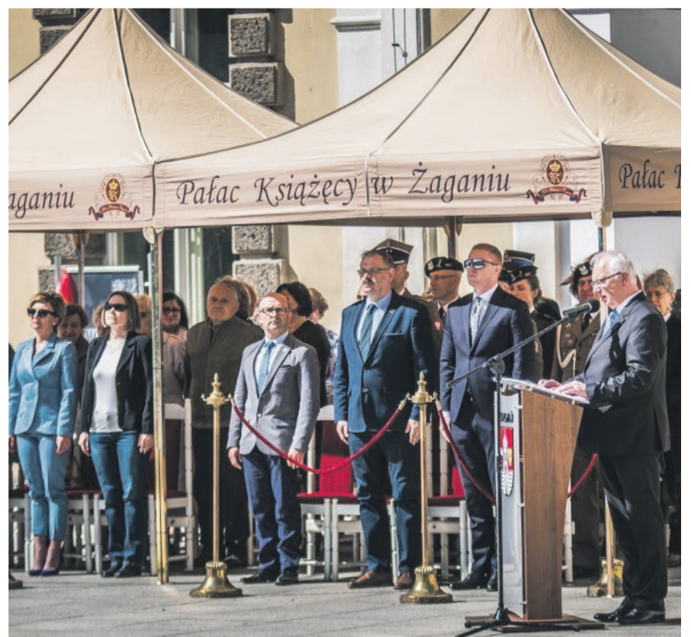
W jednym szereg, prócz żołnierzy spod znaku husarskiego skrzydła stanęli również przedstawiciele władz samorządowych, środowisk kombatanckich, reprezentanci służb mundurowych oraz młodzież żagańskich szkół