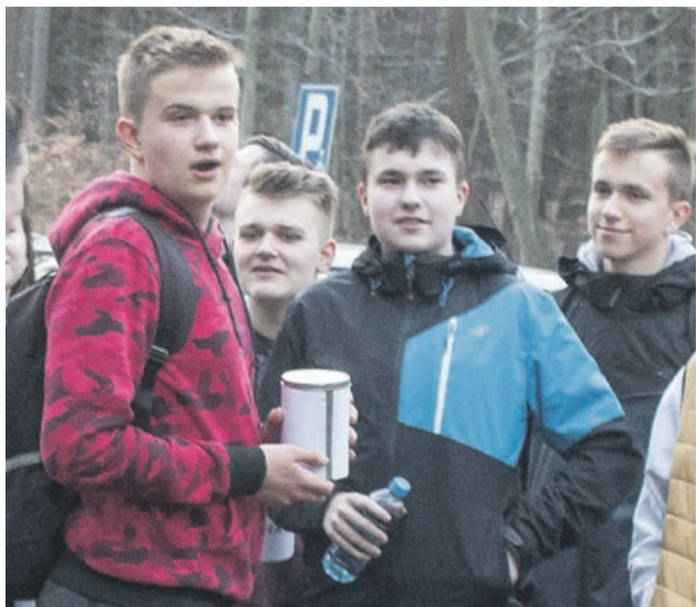
W zbiórce pieniędzy pomagali uczniowie żarskiej szkoły katolickiej