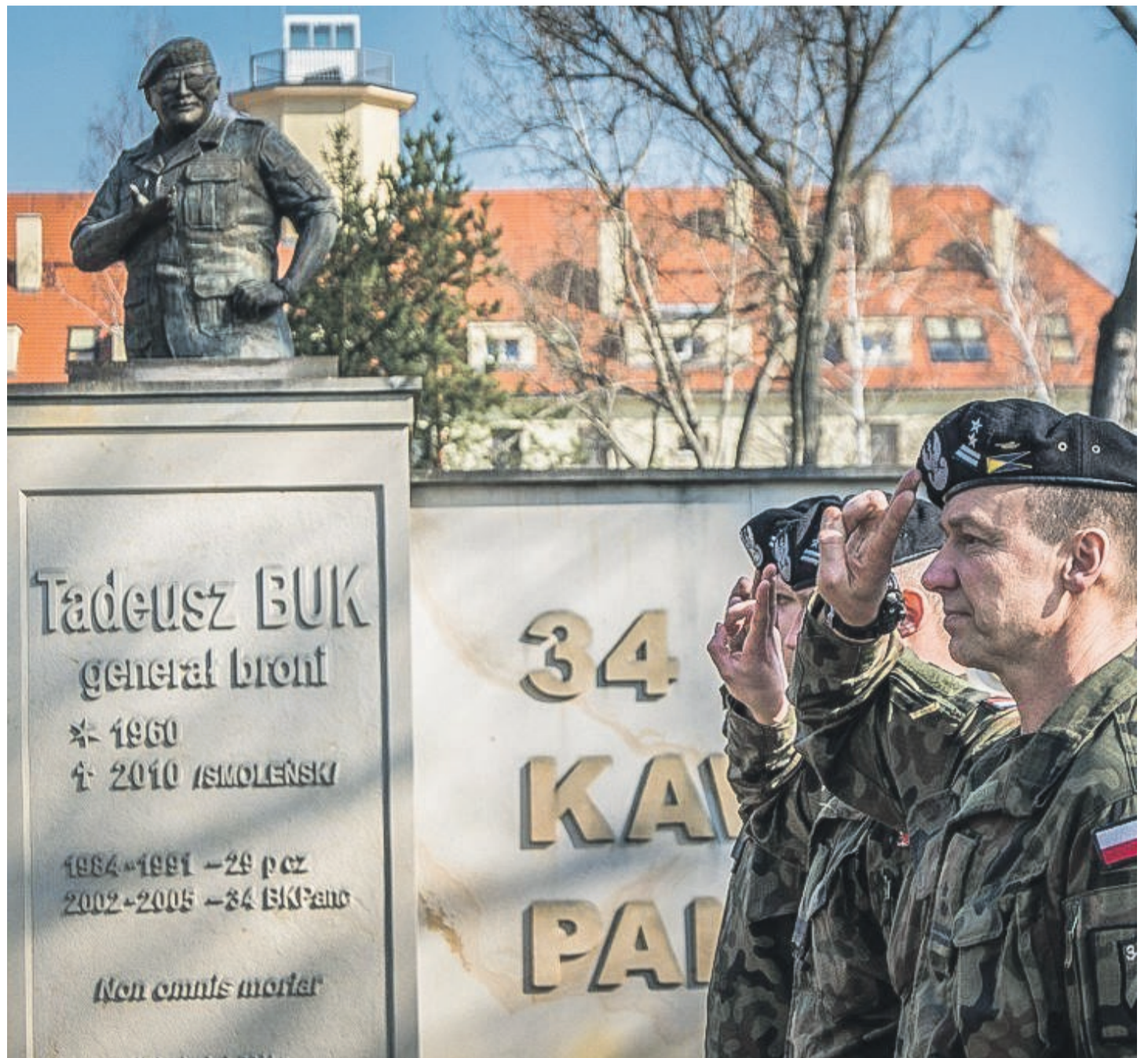
Żołnierze przyszli ze zniczami pod pomnik generała broni Tadeusza Buka, który zginął w katastrofie smoleńskiej

Dorocznym uroczystościom towarzyszy od ośmiu lat sztafeta żołnierskich serc, która startuje ze Spawy, a kończy się w Żaganiu. Jest ona poświęcona generałowi broni Tadeuszowi Bukowi, który z dumą przez lata służby nosił czarny namamiennik. PAS