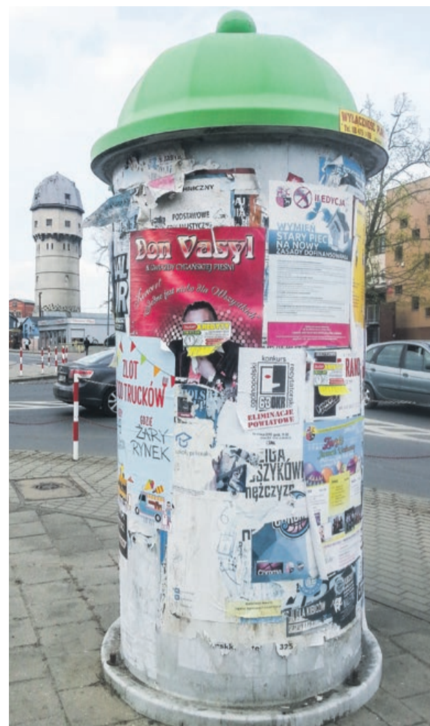
Czasem widok obdartych słupów nie przysparza miastu estetyki. W ZGM-ie mają na to zwrócić większą uwagę