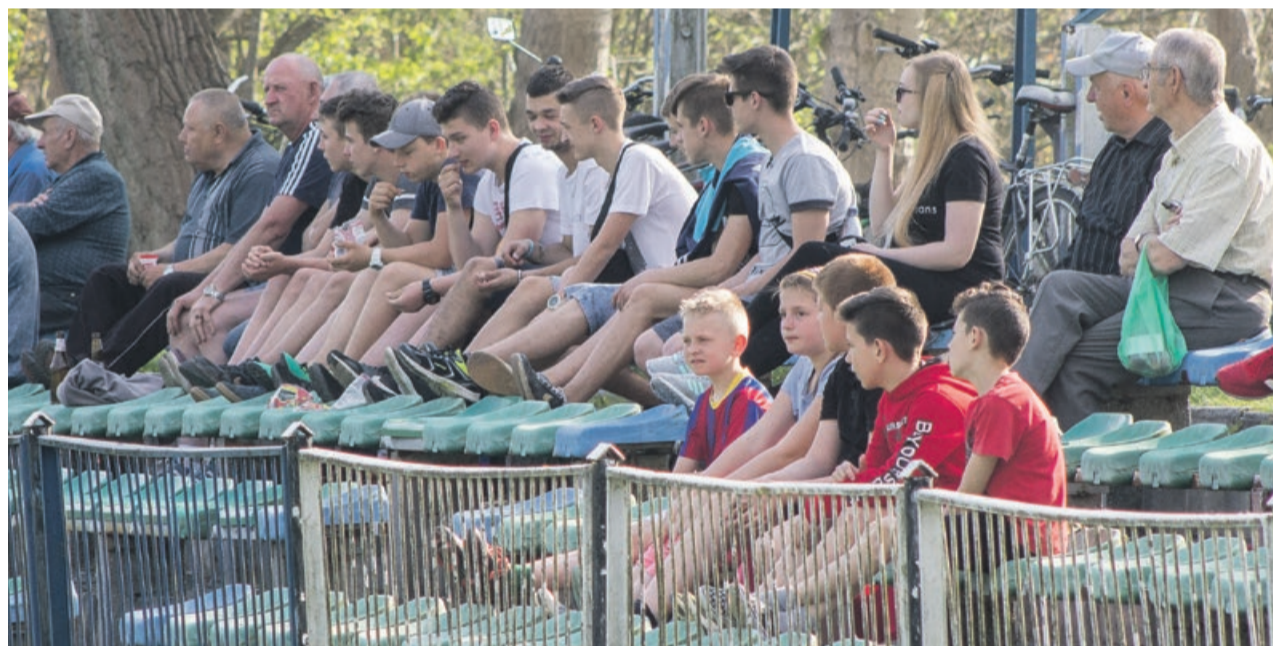
Piękna pogoda sprzyja frekwencji na trybunach