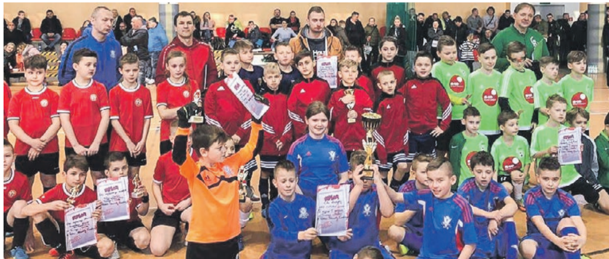
Na turniejach piłkarze Victorii czują się jak ryba w wodzie