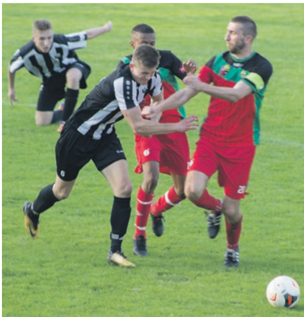
Mecz w Żaganiu nie był spokojnym, sobotnim spacerkiem przez park