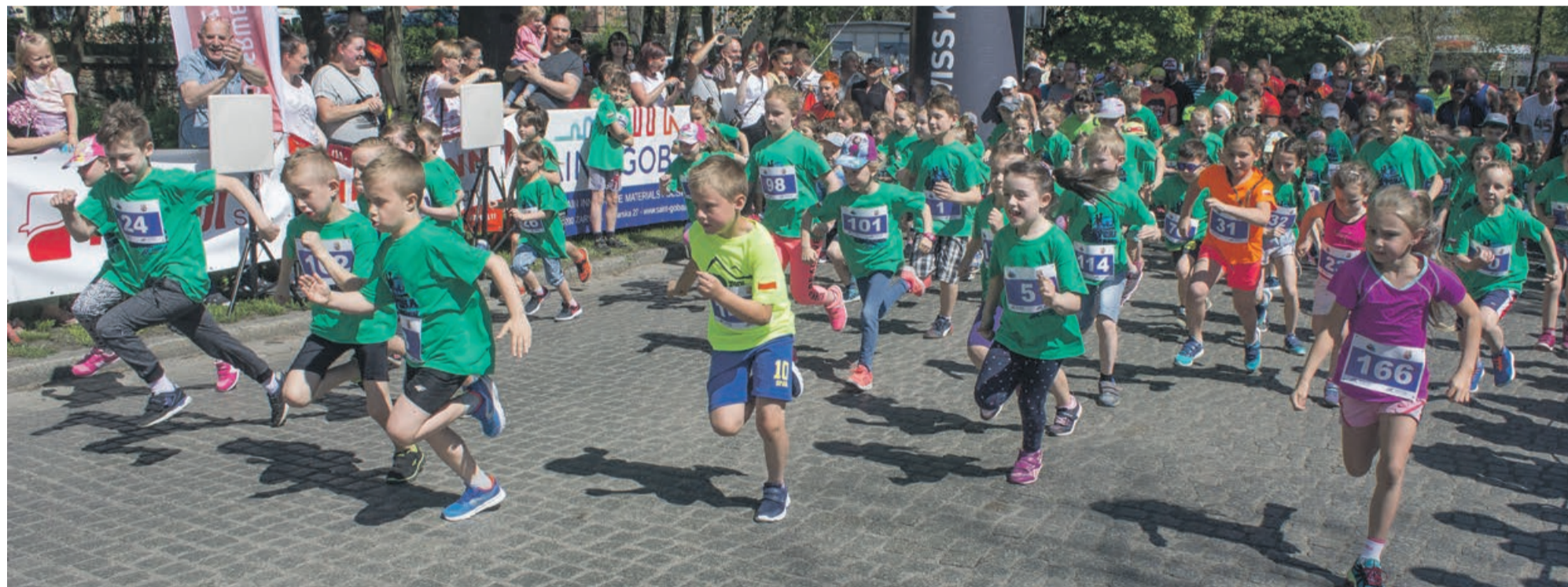
Wszystkie dzieci wygrywają, ale niektóre aż się wyrywały, żeby to zronić szybciej od innych