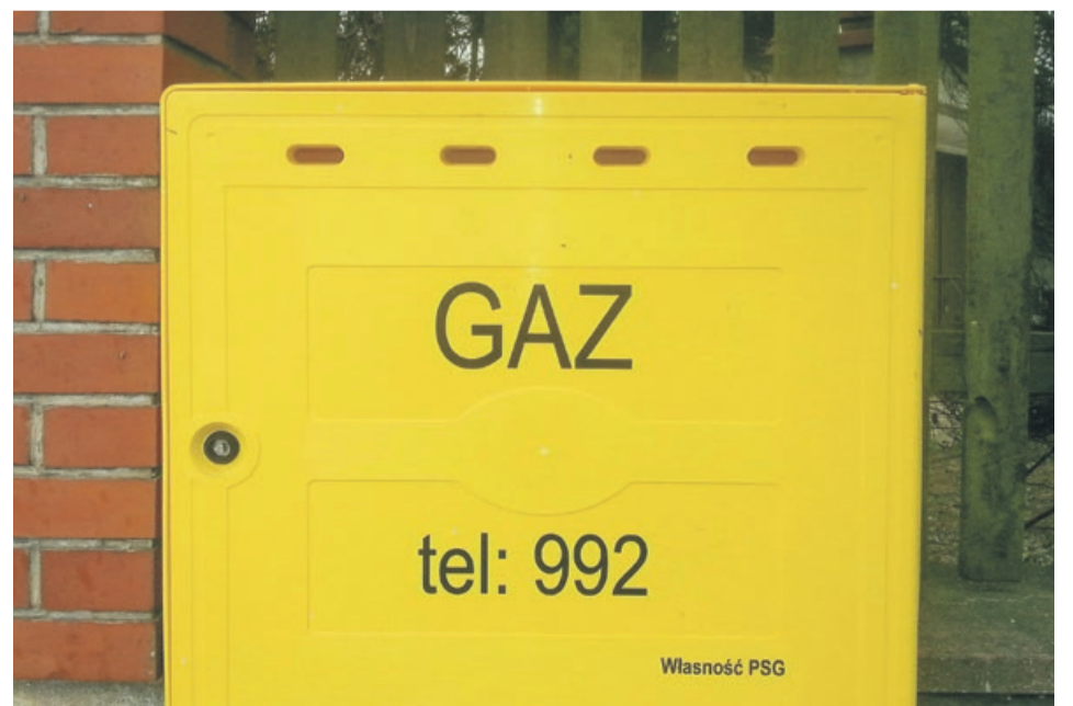
Właściciele gospodarstw domowych, przedsiębiorcy i inwestorzy nie powinni mieć problemów z dostawami i ciśnieniem gazu