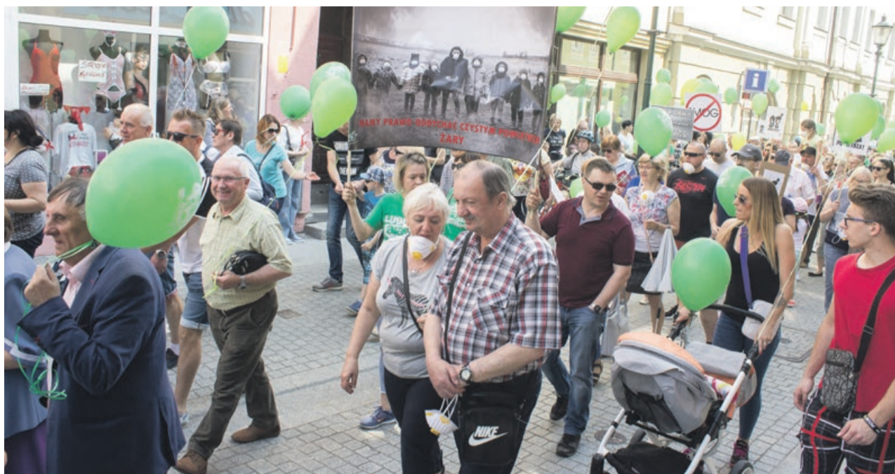
Idziemy razem - łączą nas wspólna sprawa

dzieci, dla swoich rodzin. Jeżeli w rodzinie nie zdarzy się jakiś tragiczny przypadek, to ludzie wtedy nie myślą. Dopiero jak zaczyna się coś dziać, to dopiero wtedy szare komórki zaczynają się odblokowywać i ludzie zaczynają myśleć - apelowała.