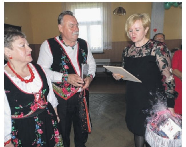
Życzenia, miłe słowa, gratulacje, prezenty