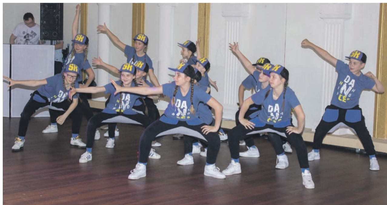
Występy bardzo się podobały

Spotykamy się dwa razy w tygodniu, ale to zbyt rzadko, żeby coś więcej osiągnąć tylko na zajęciach. Dlatego ważna jest dyscyplina i indywidualne treningi. Zawsze lepiej poćwiczyć kroki i układy taneczne, niż spędzać czas przed komputerem, czy siedząc na ławce pod blokiem. Żeby zrobić salto, trzeba się rozwijać fizycznie, robić pompki, brzuszki. Taneczne akrobacje wymagają sprawności. Podobnie jak w każdej innej dyscyplinie sportu, żeby coś osiągnąć, trzeba trenować, trenować i jeszcze raz trenować.