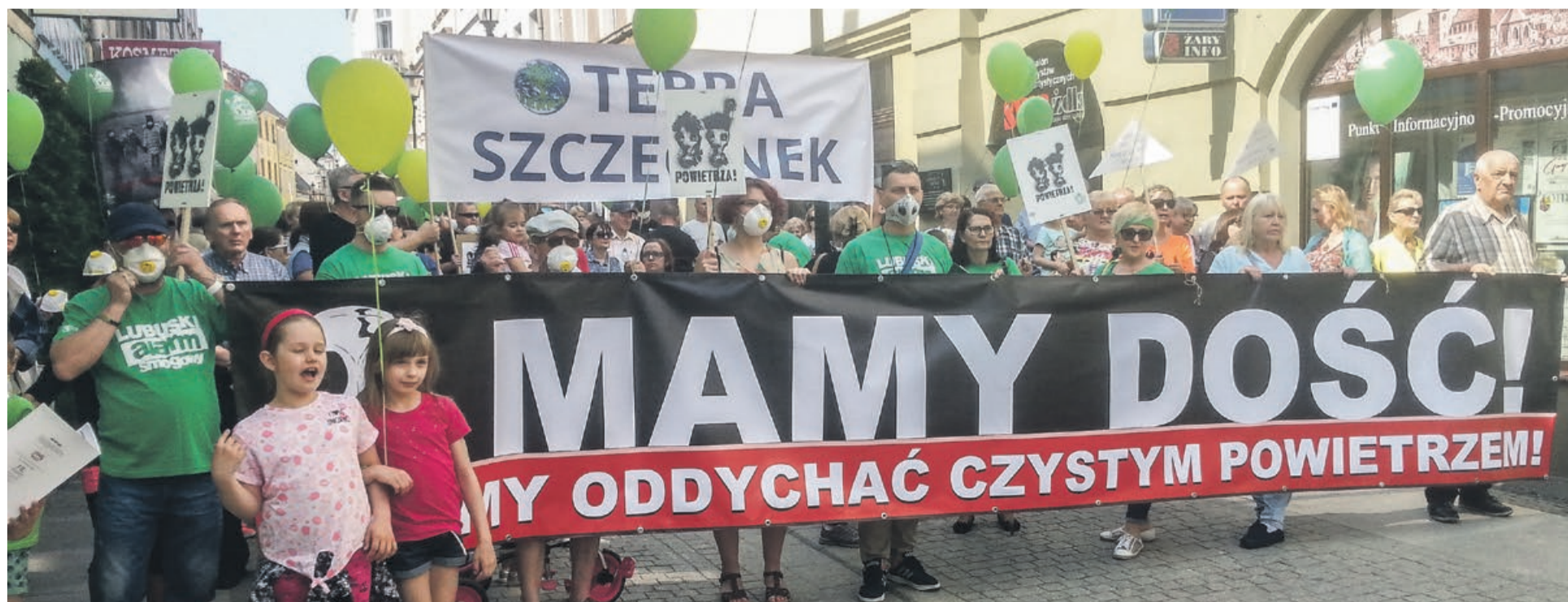
Marsz był dobrze zorganizowany i przygotowany

- Ja nie wierzę, że ten marsz nam dużo da, ale myślę, że jeżeli państwo jesteście świadomi, że jesteśmy truci, to dziękuję Wam za przybycie i popieranie takich akcji. Takie akcje są naprawdę potrzebne. Jeżeli my nie wyjdziemy na ulice, nie wyjdziemy z domu i będziemy narzekać siedząc na krzeselkach, to to dopiero nic nie da. Myślmy! Róbmy to dla siebie, dla swoich