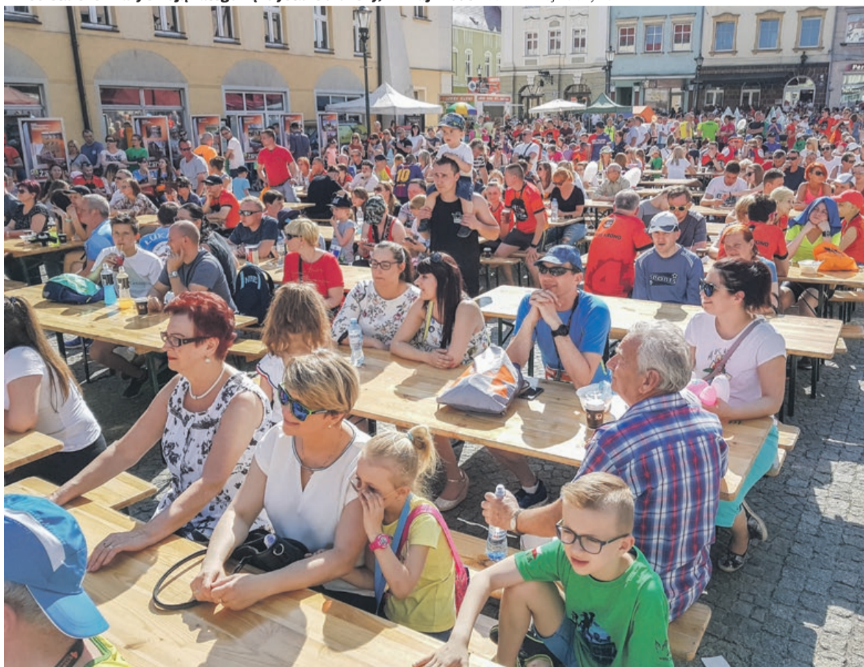
Dawno nie było takich tłumów na żarskim Rynku