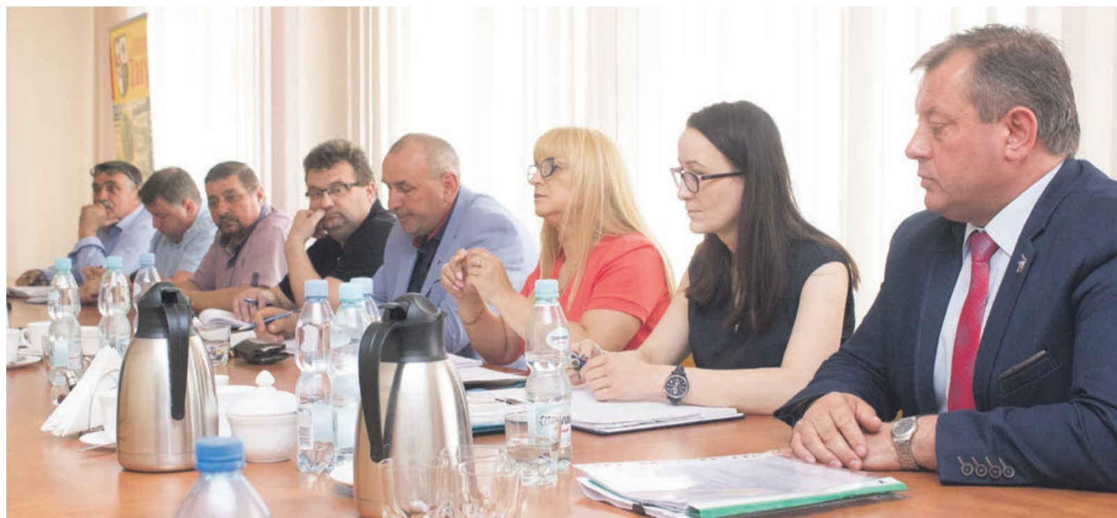
Gmina Żary gotowa do rozmów, ale na spotkaniu zabrakło miejskich samorządowców

W opinii wójta, cena za ścieki powinna być ta-