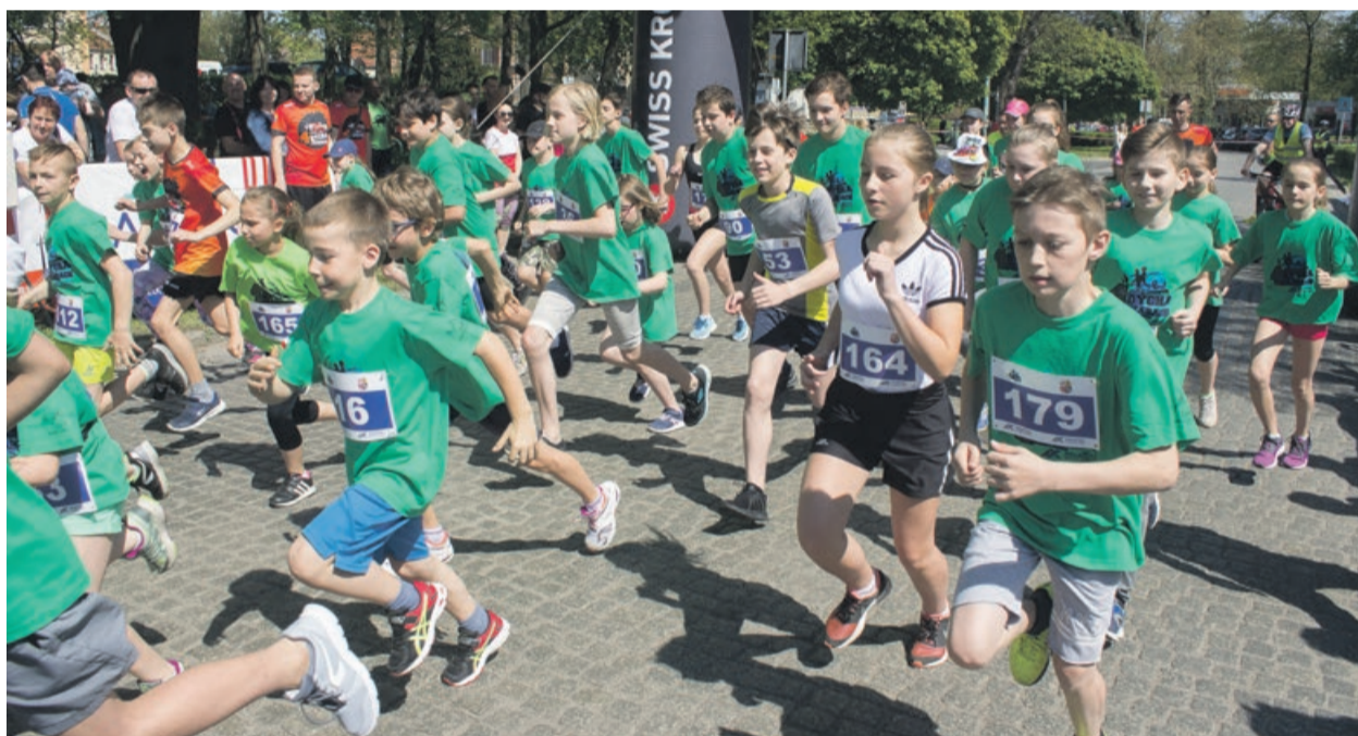
Dzieci starsze miały swoją kategorię i dystans dłuższy, niż najmłodsi