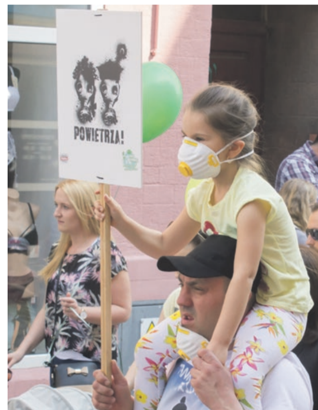
Chcemy czystego powietrza

cie na czystą stronę powietrza! Niech czyste powietrze będzie z nami! - zapewniał do burmistrz Danuty Madej i radnych miejskich.