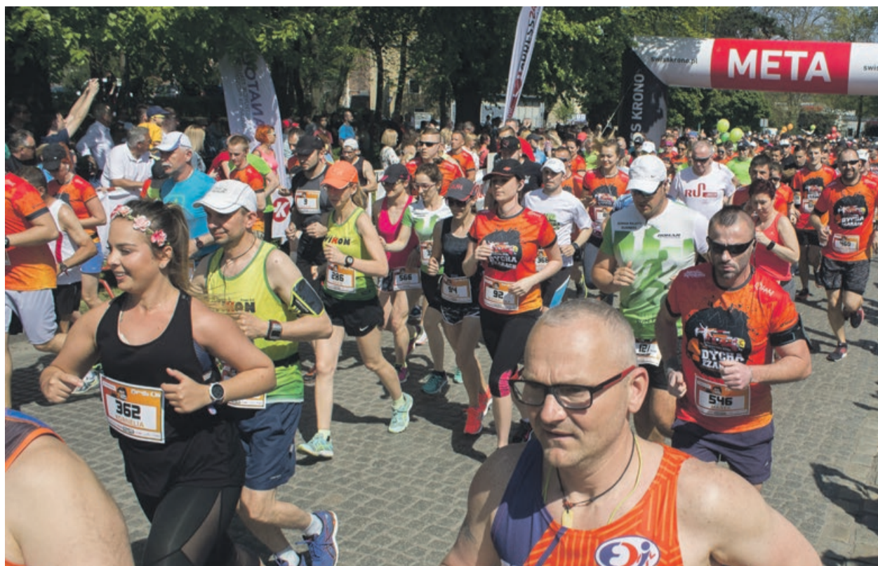
670 osób ukończyło dziesięciokilometrowy uliczny bieg w Żarach