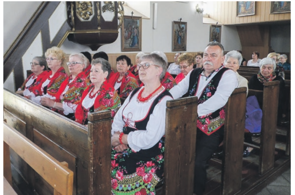
Jubileusz poprzedziła msza św. w miejscowym kościele

Z różnego rodzaju przeglądów i festiwali „Żurawianki” rzadko wracały bez nagrody czy wyróżnienia, co jest nie tylko motywacją do dalszej pracy, ale także stanowi świadectwo poziomu artystycznego zespołu.