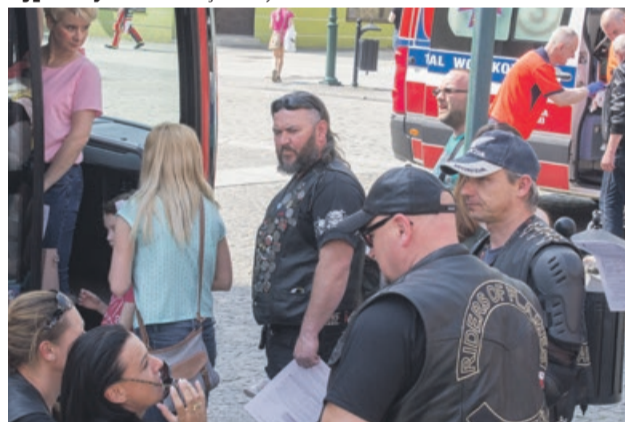
Do autobusu z poborem krwi ustawiała się kolejka