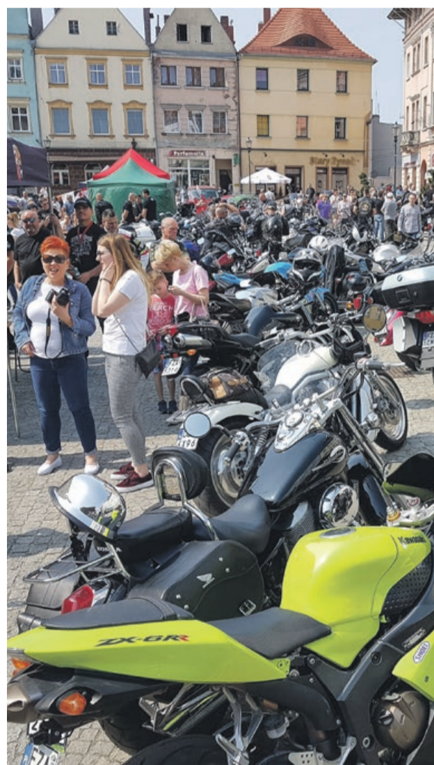
Żarski Rynek zappełnił się motocyklami