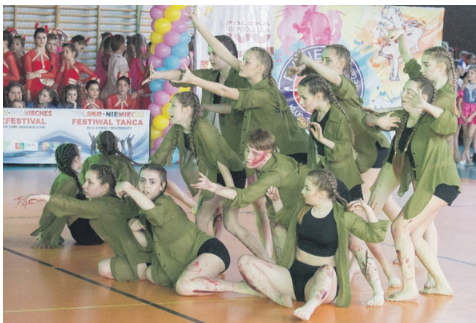
Historia opowiedziana tańcem

Oprócz wielu nagród w poszczególnych kategoriach, rada artystyczna lubuskiego festiwalu przyznała sześć nagród Grand Prix. Otrzymali je: Zespół Tańca Współczesnego Brax IV i Brax V z Bydgoszczy za całokształt; „Activus Noname” ze Skórzewa za choreografię pt. „Ciało”; „Icecubes” z Hoyerswerdy za choreografię pt. „Flinstones - Eiszeit”; „Piruet Eks” z Żar za choreografię pt. „Ostatnia podróż”; Studio Tańca Lets Dance” z Zielonej Góry za całokształt oraz „Mufins” z Lubuska za choreografię pt. „Inspirations”. ATB