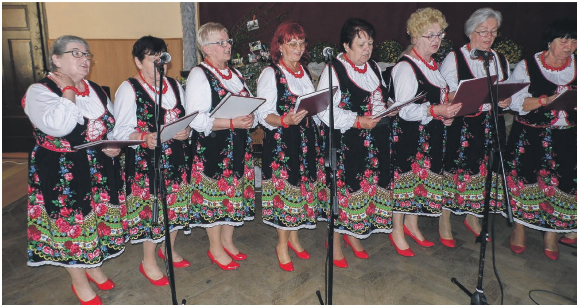
W pełnej krasie, zawsze eleganckie i pełne uroku