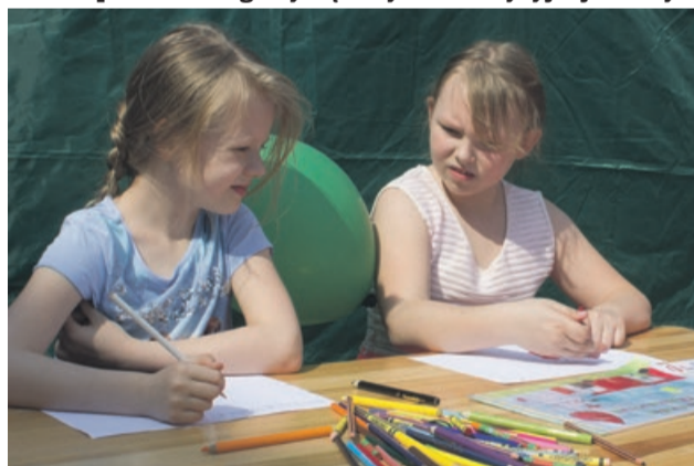
A dla dzieci zajęcia plastyczne