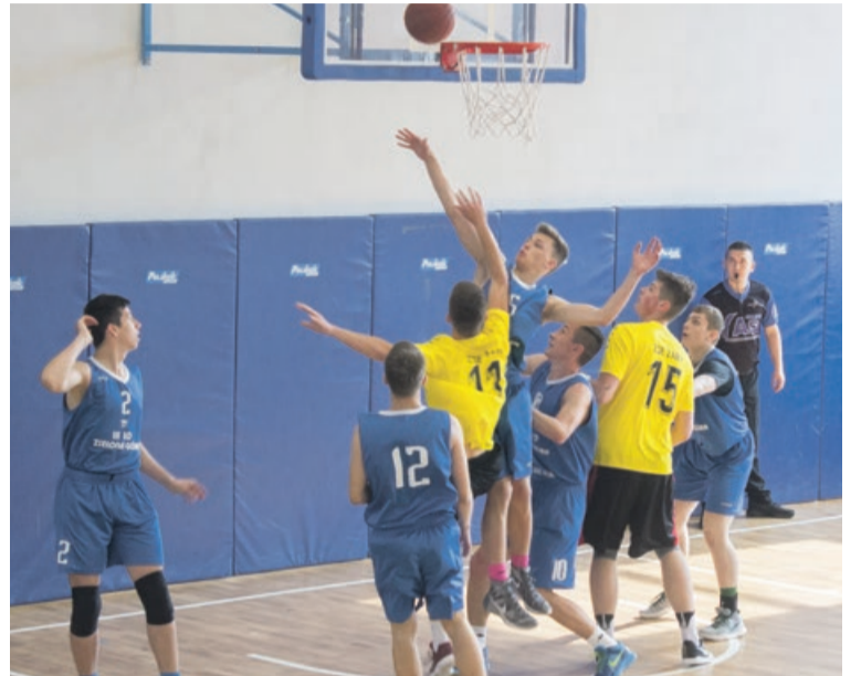
W drodze do finału Ekonomik pokonuje między innymi III LO z Zielonej Góry

LO wynikiem 80:59. W kolejnym meczu trafia na zwycięzcę drugiego spotkania - VII LO Zielona Góra. I tu niestety przegrana 51:77. W ostatnim spotkaniu, decydującym o awansie do finału, żaranie grają z LO Nowa Sól - drużyną, z którą spotkali się już w eliminacjach rejonowych. Wygrywają 73:34 i w ten sposób można odnotować historyczny awans Ekonomika do Finałów Województwa Lubuskiego. TG, ATB