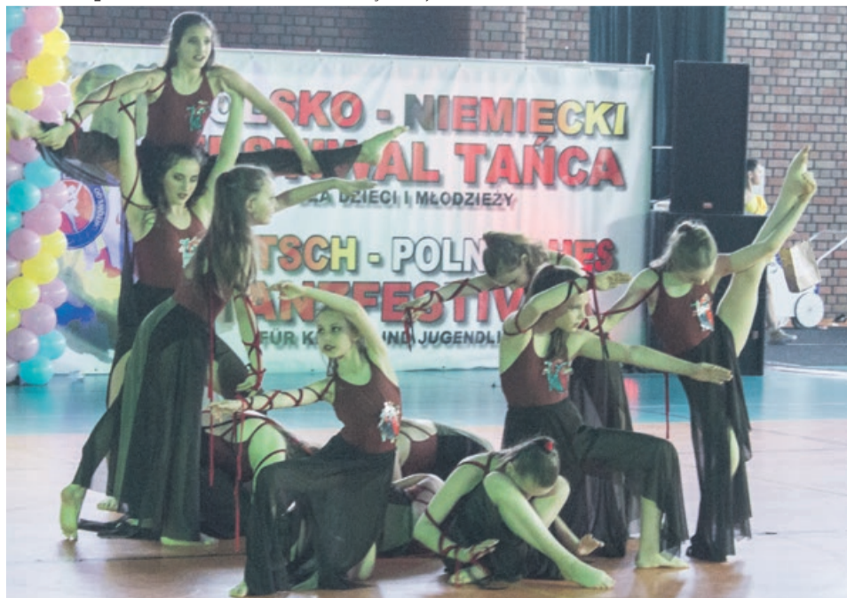
Tancerki w różnych układach prezentowały swoją sprawność fizyczną