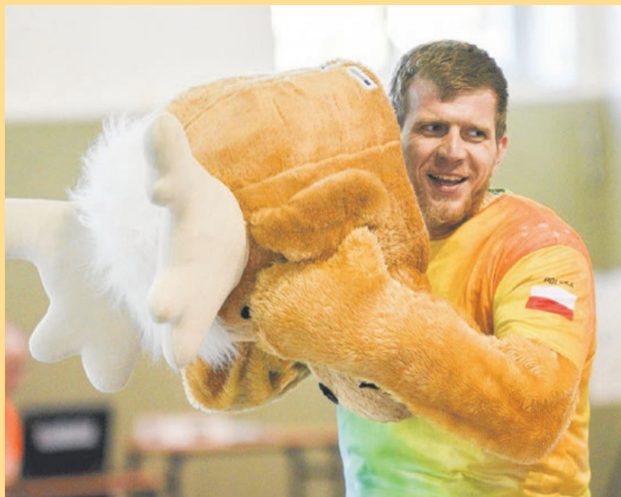
Żarus przebiegł 10 kilometrów i dostał medal

ŻARY Na zewnątrz miłutka pluszowa maskotka miasta, a w środku niezłomny biegacz, który pokonał dziesięciokilometrowy dystans biegu ulicznego „Dycha po Żarach” w upale i bardzo nietypowym stroju.