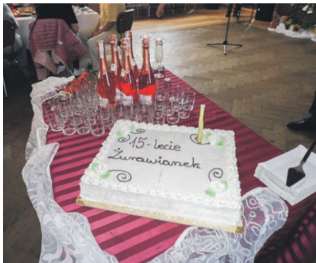
Nie mogło obyć się bez okolicznościowego tortu