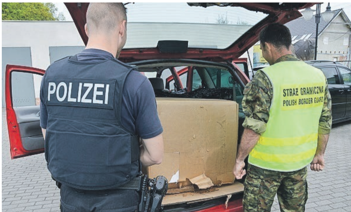
Kierowca volkswagena nie miał szczęścia. Lewy towar wpadła w ręce polskich i niemieckich funkcjonariuszy

Łącznie zabezpieczono 288 kg suszu tytoniowego bez znaków akcyzy skarbowej o wartości 130 tysięcy zł. Kierowca samochodu osobowego przewoził nielegalnie wyroby tytoniowe z Niemiec do Polski. 42-letni obywatel naszego kraju przyznał się do popełnionego czynu, za co został ukarany grzywną. Ponadto kierowca nie posiadał dowodu rejestracyjnego pojazdu, którym podróżował oraz obowiązkowej polisy OC, za co nałożono na niego mandat karny. PAS