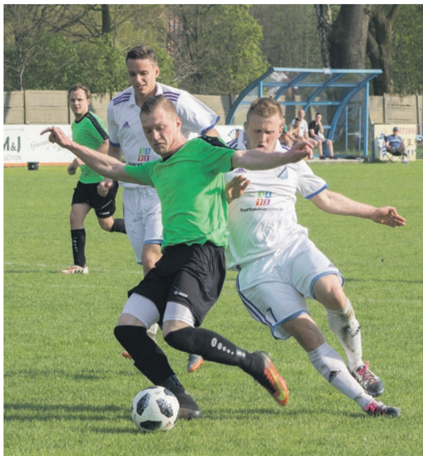
Unia Kunice nie poradziła sobie z trudnym przeciwnikiem

Unia niezmiennie na 13 pozycji i w następnej kolejce jeśli się to nie zmieni, to grozi jej raczej spadek na 14, niż marsz w górę tabeli. ATB