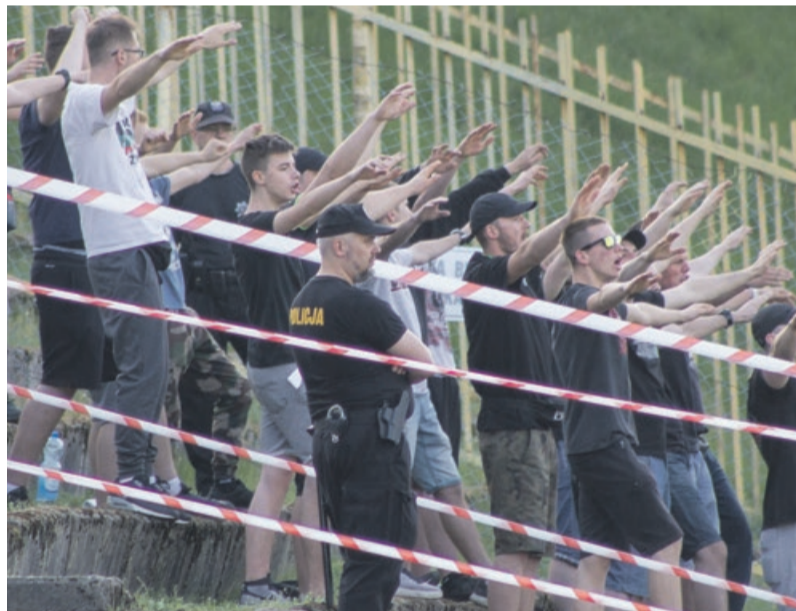
Mocno pilnowani kibice Promienia głośno dopingowali swoją drużynę