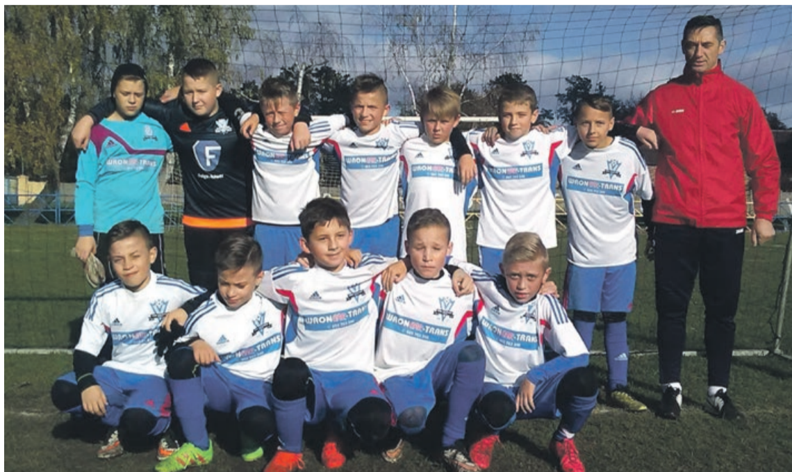
Mają wspólną pasję, chcą grać w piłkę nożną. Do tego mają swój klub

że mało kto wie, oczywiście poza dziadkami i rodzicami samych piłkarzy. A tymczasem okazuje się, że klub jest widoczny i rozpoznawalny w środowisku piłkarskim.