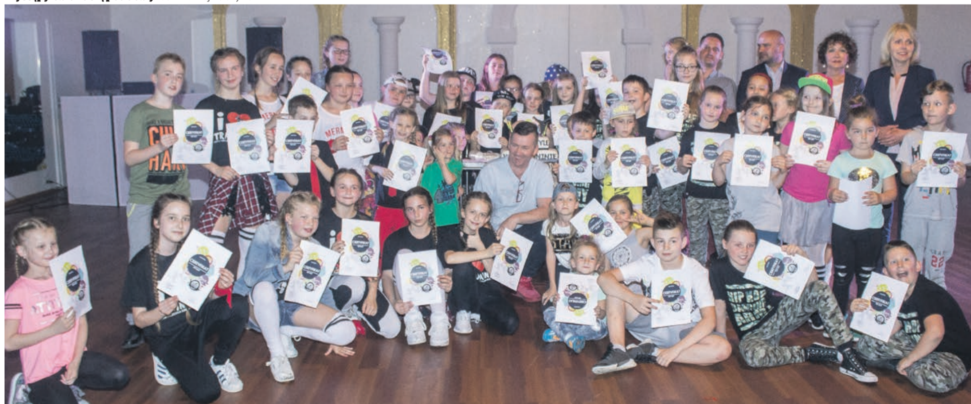
Młodzi tancerze wspólnie obchodzili ten jubileusz