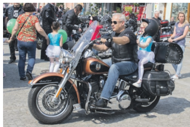
Krótką, powolną przejażdżką, a dla dziecka wielką frajdą