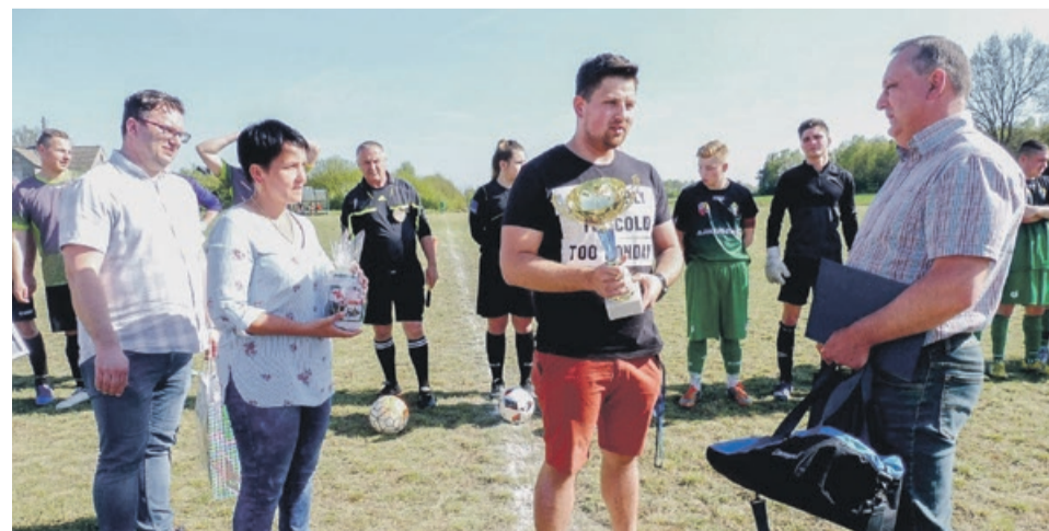
Do prezesa ustawiła się kolejka dziękujących

Ster w klubie przejęło młode pokolenie, ale wszyscy miłośnicy piłki nożnej mają nadzieję, że pan Henryk długo jeszcze będzie służył dobrymi radami i kibicował swojej drużynie. JW