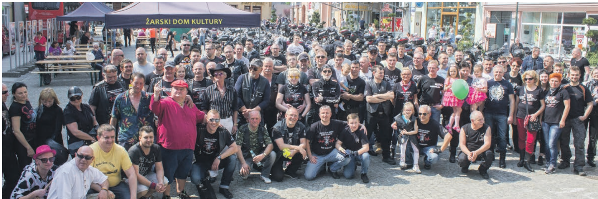
Pamiętkowa fotografia uczestników żarskiego rozpoczęcia sezonu motocyklowego