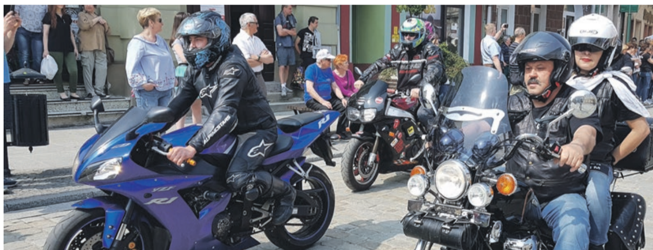
Taka impreza nie mogłaby się odbyć bez tradycyjnej motocyklowej parady