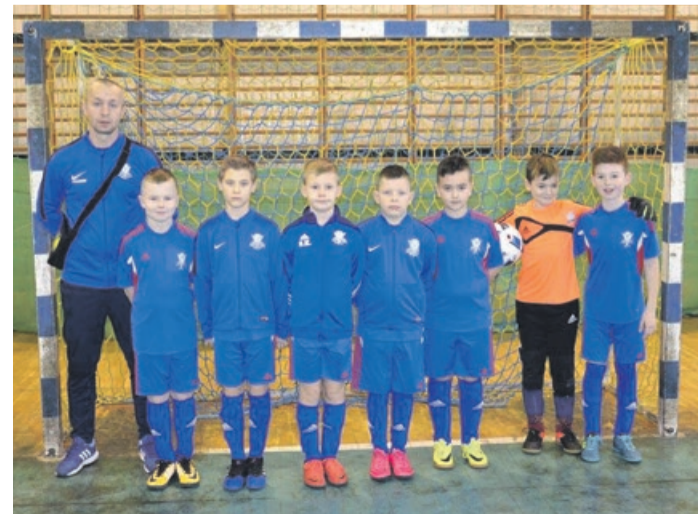
Czy wśród młodych piłkarzy jest następcą Lewandowskiego?