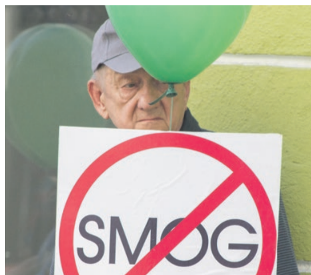
Smog nas zabija