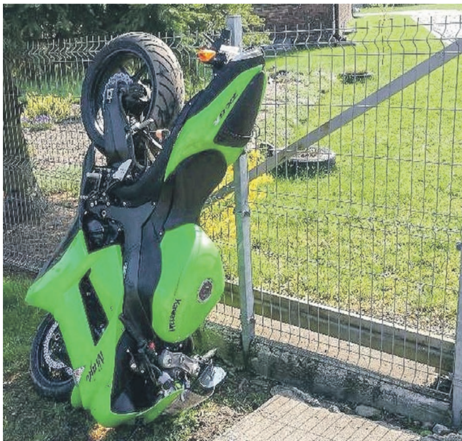
Motocyklista wylądował na ogrodzeniu w miejscowości Straszów

- Zgodnie z regulacjami prawnymi - kierowca, który świadomie zmusi funkcjonariuszy do pościgu i nie zatrzyma się mimo wydawanych mu poleceń w postaci sygnałów świetlnych i dźwiękowych, popełnia przestępstwo zagrożone karą pozbawienia wolności do lat 5. - informuje podkom. Aneta Berestecka, oficer prasowy KPP w Żarach. PAS