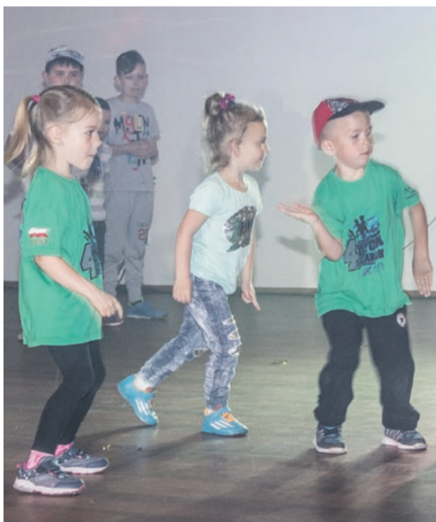
Przygodę z tańcem zaczynają od najmłodszych lat

Liczba uczestników zajęć w trzech grupach o różnym stopniu zaawansowania waha się obecnie między 70 a 90. Jedni odcho-