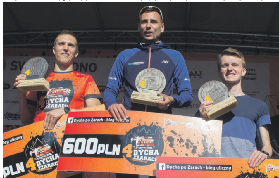
Najlepsi biegacze 4. Dychy po Żarach