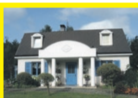
Chcesz mieć dworek jak na zdjęciu? W Olbrachtowie mam rozpoczętą budowę: podpiwniczenie ze stropem, na działce 3000 m2 (możliwy podział na dwie). Cena: teren 40 zł/m2, podpiwniczenie 52 tys. zł. tel. 512 209 363