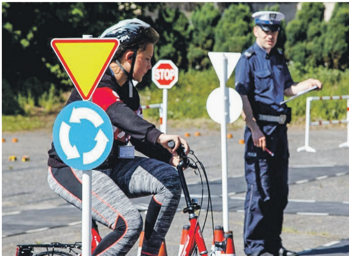
Turnieje oraz konkursy są doskonałą okazją, aby utrwalac wiedzę o bezpieczeństwie wśród dzieci i młodzieży, a tym samym poprawiac ich bezpieczeństwo

Uczestnikom i zwycięzcom gratulujemy! PAS