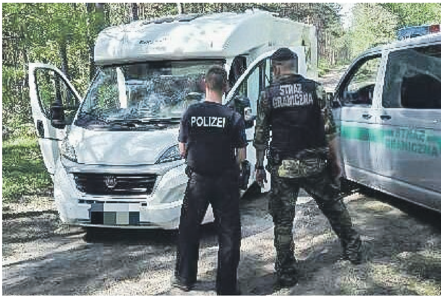
Kamper wróci do prawowitego właściciela

Pomimo wyraźnych sygnałów do zatrzymania, kierowca pojazdu pojechał w kierunku Żar. Do pościgu włączyli się również funkcjonariusze Policji. Kiedy kierowca fiata skręcił w kierunku pobliskiego lasu funkcjonariusze utracili kontakt wzrokowy z pojazdem. Po chwili zauważyli ścigany samochód. Stał porzucony w lesie. Poszukiwania kierowcy w pobliskiej okolicy przyniosły rezultat. Sprawdzenia dokonane przez Polsko-Niemieckie Centrum Współpracy Służb Granicznych Policyjnych i Celnych potwierdziły, że samochód został skradziony na terytorium Niemiec. Wartość odzyskanego kampera wynosi 270 tysięcy złotych. Pojazd przekazano policjantom z Żar, którzy dalej poprowadzą sprawę. PAS