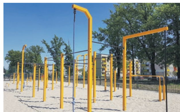
Już dziś to miejsce budzi spore zainteresowanie