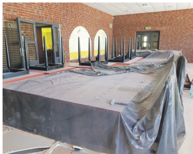
Remontowane pomieszczenia kawiarni Lubskiego Domu Kultury

- Myślę, że takim początkowym okresem tej naszej działalności będą wakacje. Pierwszą imprezą, którą zorganizowałam, była lubska majówka. Myślę, że cieszyła się ogromnym zainteresowaniem i to chyba można uznać za taki początek powrotu kultury do Lubskiego Domu Kultury.