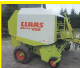
Prasa do słomy Claas Rollant 250, rok 2002, stan bardzo dobry, Tel. 699-932-056

► Sprzedam ciągnik rolniczy i maszyny rolnicze: obciążniki, szyby, pług, brony, kultywator, siewnik, opryskiwacz, przyczepę samozbierającą, dmuchawę, wał uprawowy i prasę Tel. 699 932 056