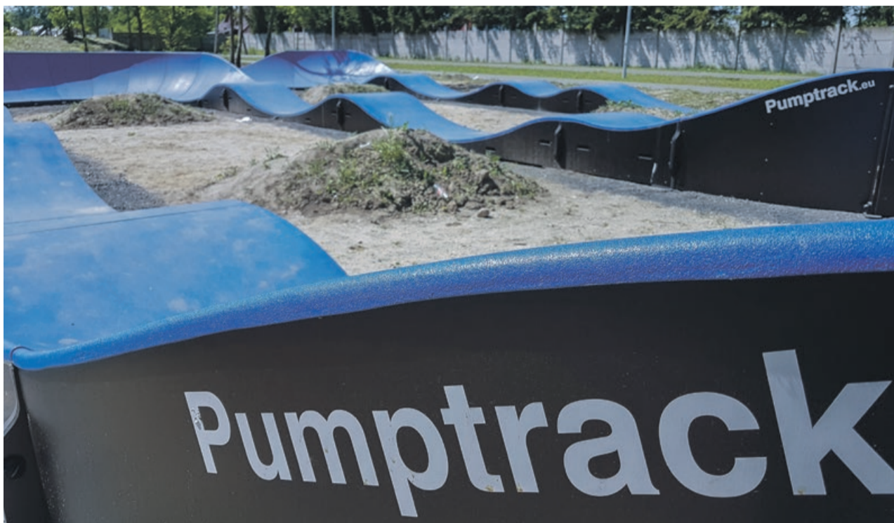
Nowość w Żarach. Nietypowy tor rowerowy