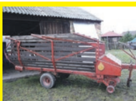
Przyczepa samozbierająca, rok 2001, Tel. 699-932-056