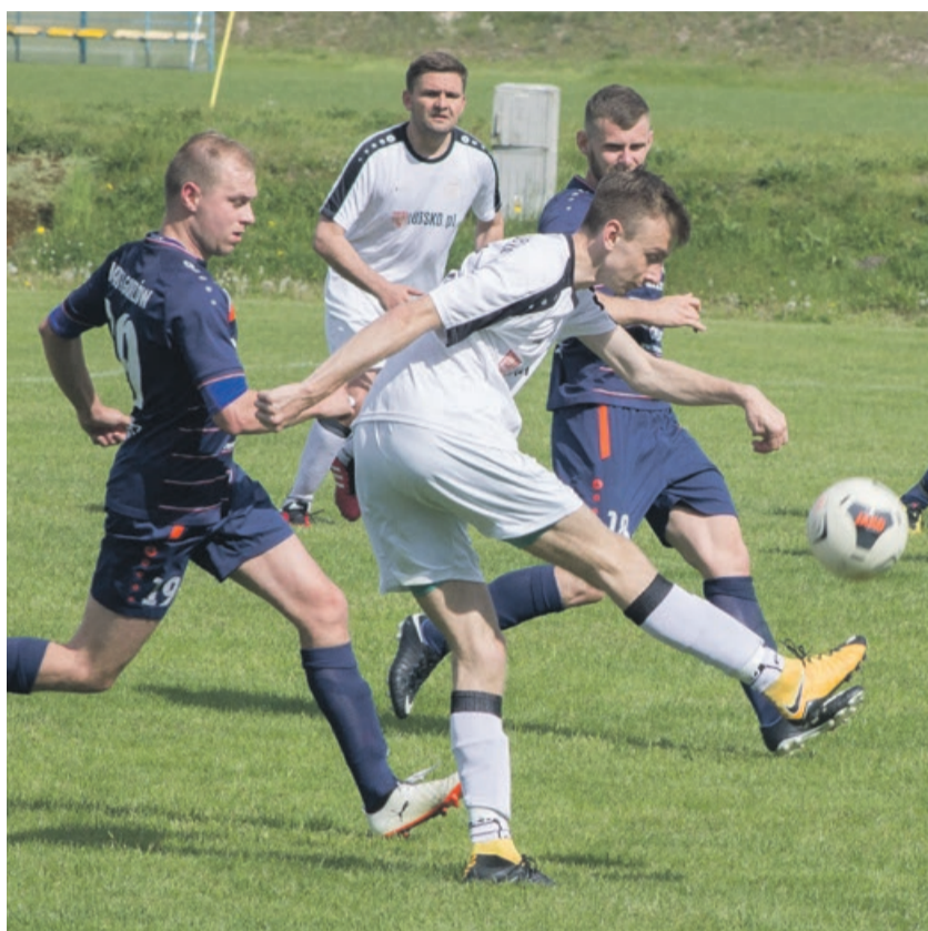
Budowlani zagraли bardzo dobry mecz

Jednak w pod koniec meczu, w 81 minucie, gorzowianom udaje się w końcu zdobyć rozstrzygającą bramkę. Dla Warty te 3 punkty oznaczają III liga. ATB