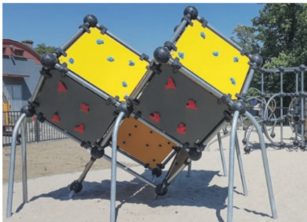
Bedzie można się powspinać. Dziś place zabaw to nie tylko piaskownica z huśtawką