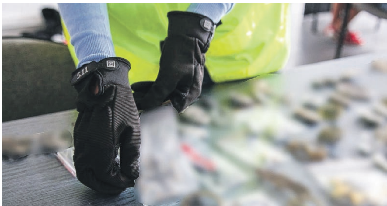
Osoby trudniące się handlem przedmiotami z symbolami nazistowskimi nie mogą czuć się bezkarne

- W kwestii zabezpieczonych rzeczy wypowie się biegły. Już samo posiadanie takich przedmiotów w celu rozpowszechniania zagrożone jest karą pozbawienia wolności do lat dwóch - tłumaczy podkom. Aneta Berestecka, oficer pasowy KPP w Żarach. - Propagowanie faszystowskiego ustroju jest w Polsce przestępstwem podobnie w przypadku, posiadania, utrwalania, prezentowania, przechowywania, czy nabywania przedmiotów zawierających treści faszystowskie - dodaje. PAS