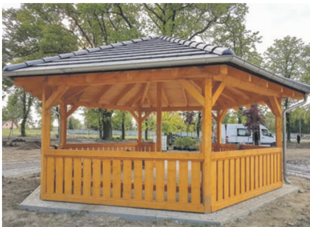
Duża altana będzie miejscem spokojnym i zacienionym