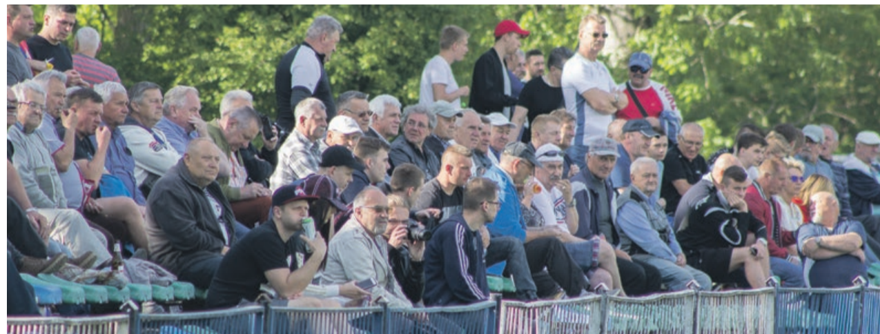
Jedynym pocieszeniem dla kibiców to możliwość obejrzenia dziewięciu bramek w dziewięćdziesiąt minut