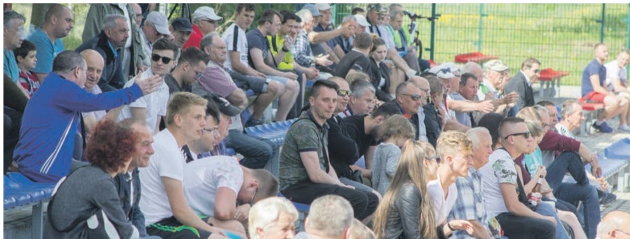
Kibice nie mogli uwierzyć, jak dobrze ich drużyna radziła sobie z gorzowskim liderem