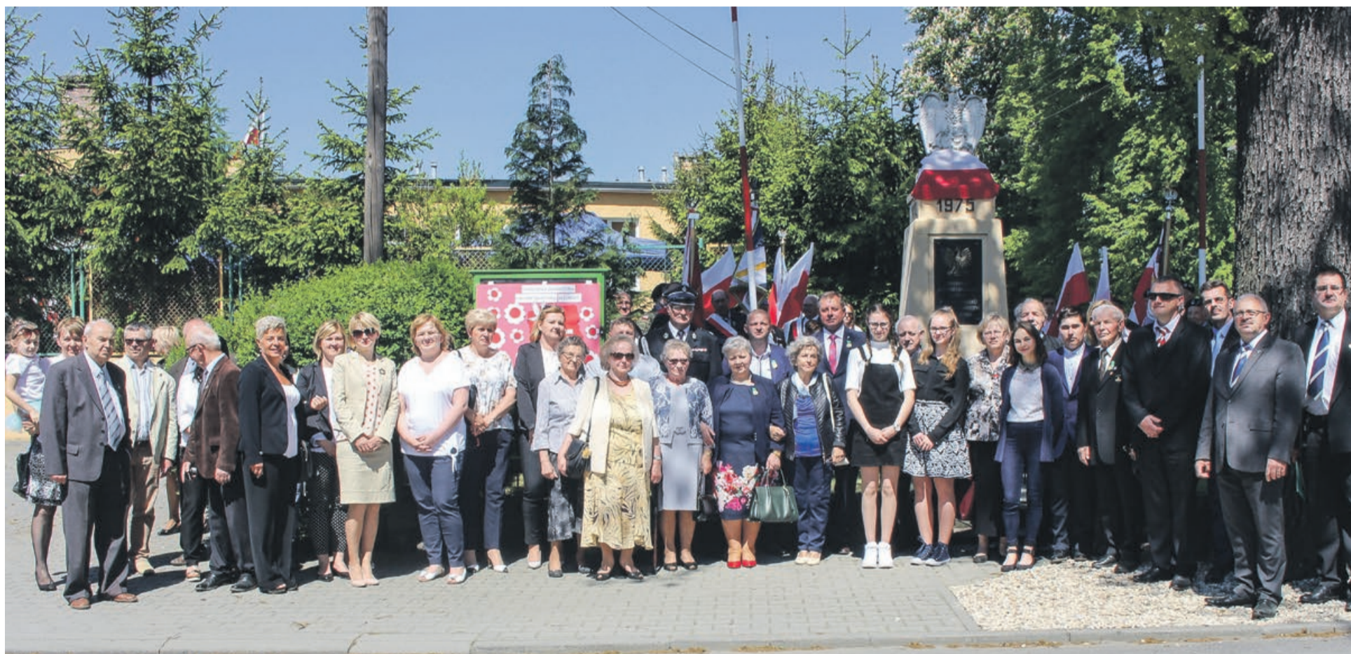
Historyczne wydarzenia są w wielu rodzinach wciąż żywe, a kolejne pokolenia niosą o tym pamięć