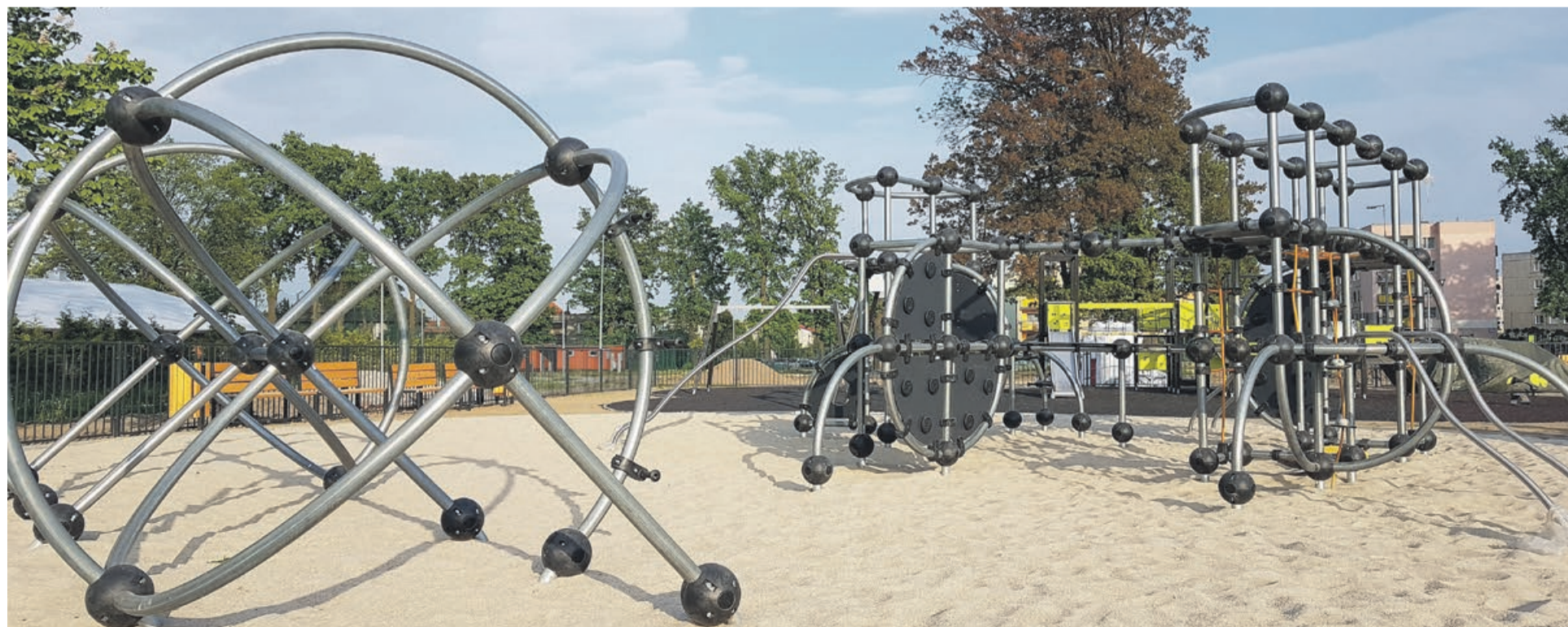
Na terenie parku zamontowano wiele ciekawych i nowych urządzeń. Z frekwencją na placach zabaw nie będzie problemu