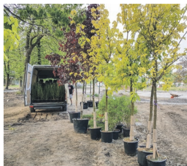
Rozpoczęły się nasadzenia

- Bardzo się cieszę, że realizacja tego projektu zmierza ku końcowi. Chciałbym przypomnieć, że jest to przede wszystkim zasługa mieszkańców. Pomysł zagospodarowania parku, który złożyłem jako projekt do budżetu obywatelskiego, jest dzisiaj realizowany tylko i wyłącznie dzięki wielu głosom oddanym przez mieszkańców. Dzięki ich zaangażowaniu udało się zdobyć na ten cel aż 800 tysięcy złotych. Takie miejsce na największym osiedlu w mieście jest bardzo potrzebne, bo brakuje tam terenów rekreacyjnych. Przeprowadzone były również konsultacje społeczne. Projekt został wykonany w oparciu o zgłaszane propozycje. Każda grupa wiekowa ma swoje potrzeby. Dla matek z dziećmi ważny był plac zabaw. Dla młodzieży pumptrack i plac do ćwiczeń siłowych. Osoby starsze potrzebują strefy ciszy. I te właśnie rzeczy się pojawiają. Teraz ten zaniedbany przez lata teren będzie w końcu tętnił życiem.