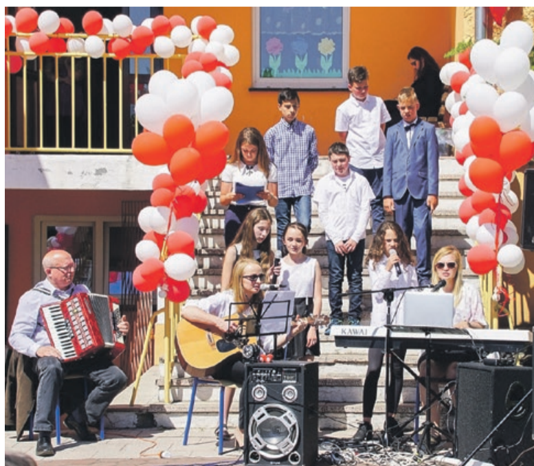
Uroczyste spotkanie uświetniły występy artystyczne fot.nadesłane