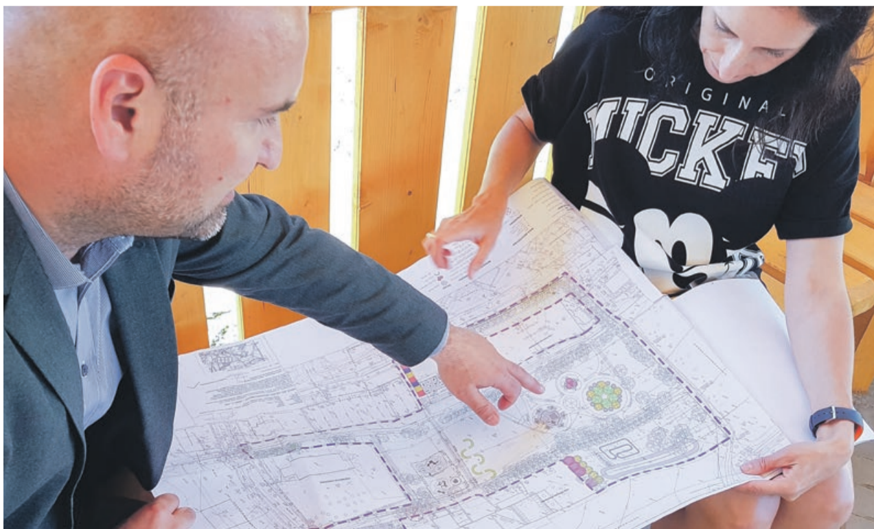
Plany zagospodarowania parku obfitują w wiele różnorodnych elementów