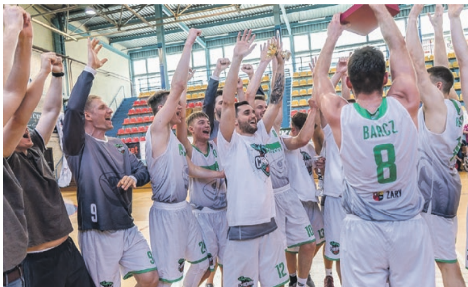
Radość z zasłużonego zwycięstwa barażowego turnieju w Szczecinie

Drugiego dnia turnieju przeciwnikiem Chromika był gospodarz - Ogniw