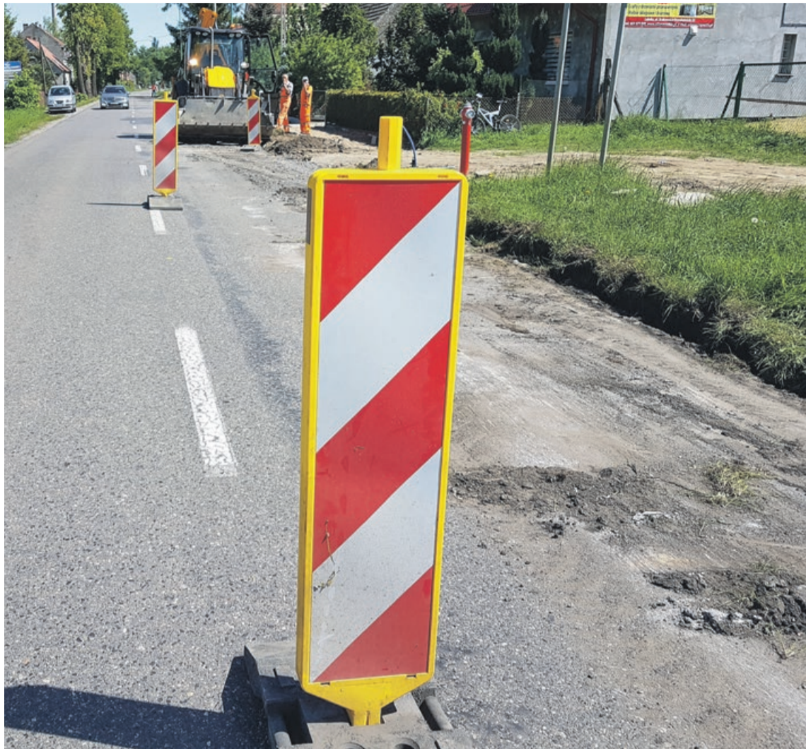
Trwają prace przy przebudowie ulicy Przemysłowej w Lubsku

W ubiegłym roku do budżetu wpłynęło niecałe półtora miliona złotych ze sprzedaży majątku. Co ciekawe, tegoroczne wpływy już na koniec pierwszego kwartału wyniosły 1,6 miliona.