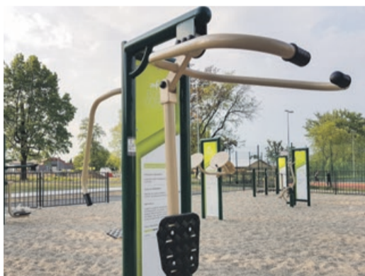
Nie mogło zabraknąć siłowni pod chmurką