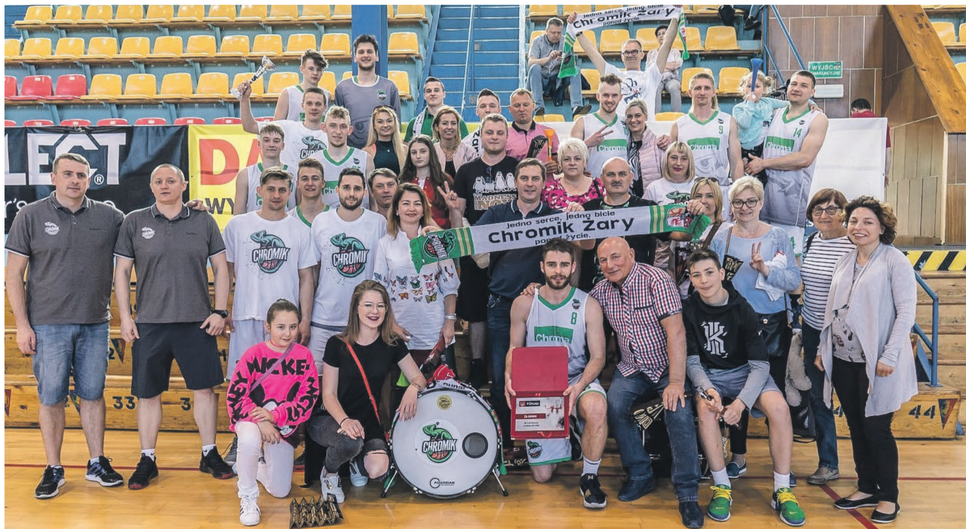
Historyczny moment. Chromik w II lidze koszykówki mężczyzn