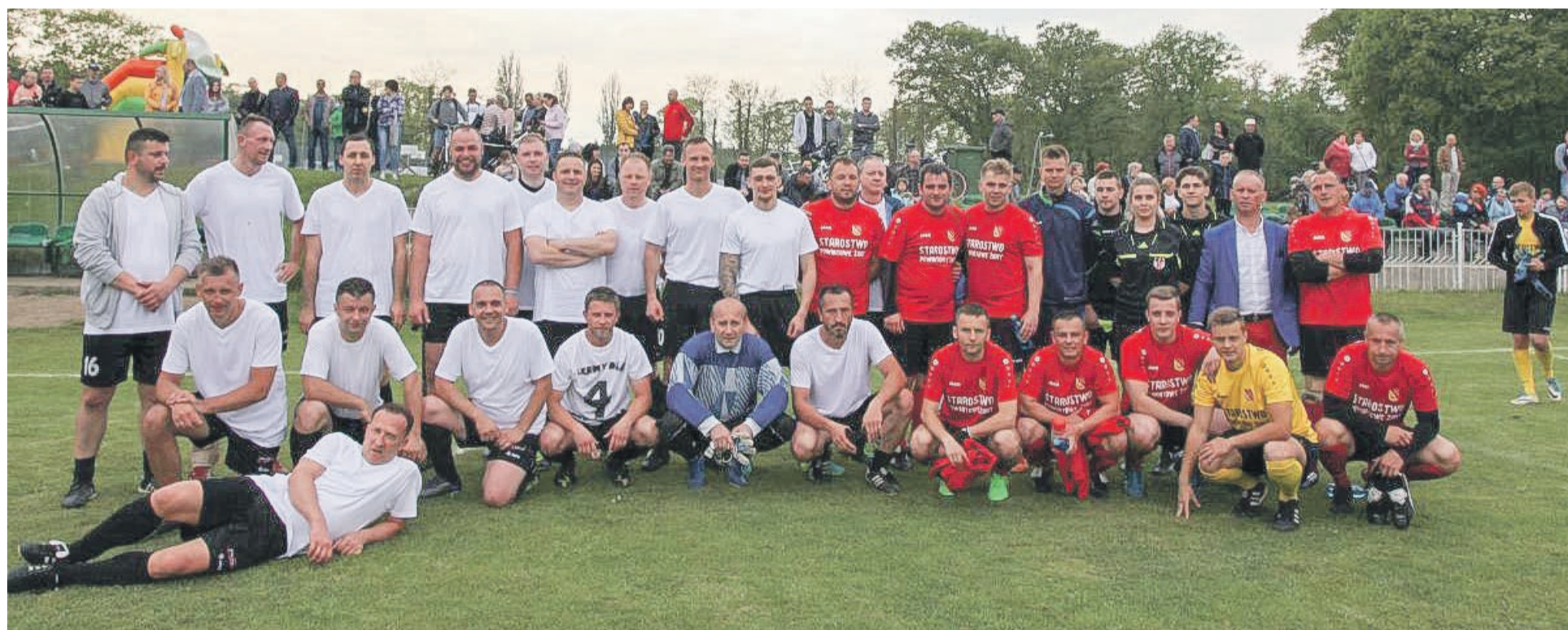
Wynik sportowy nie był istotny - w tym przypadku wszyscy wygrali

Fundacja Dzieciom „Zdążyć z Pomocą”, ul. Łomiańska 5, 01-685 Warszawa konto nr.: 41 1240 1037 1111 0010 1321 9362 tytułem: 29953 - Walasek Mikołaj - darowizna na pomoc i ochronę zdrowia