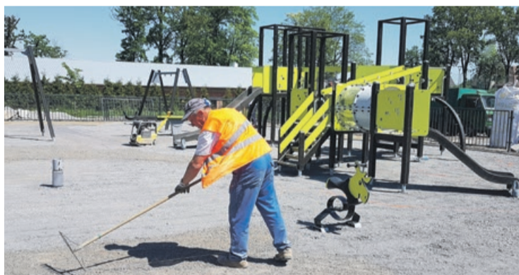
Prace przy nawierzchni placu zabaw