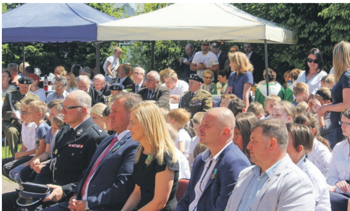
Młodzież szkolna, samorządowcy, kombatancki, przedstawiciele różnych organizacji i mieszkańcy - wszyscy upamiętnili zakończenie wojny fot.nadesłane