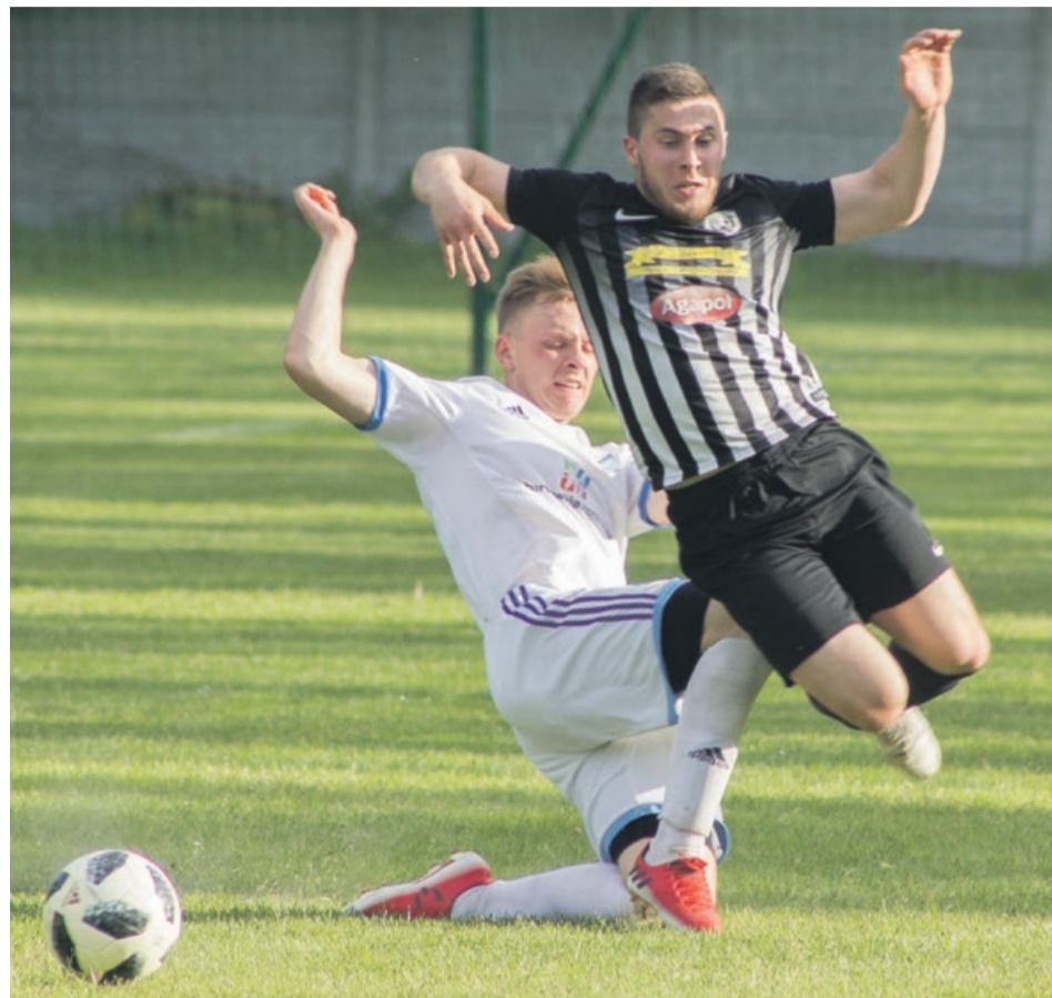
Piłkarzom Unii nie udało się dokopać Carinie. Było wręcz odwrotnie