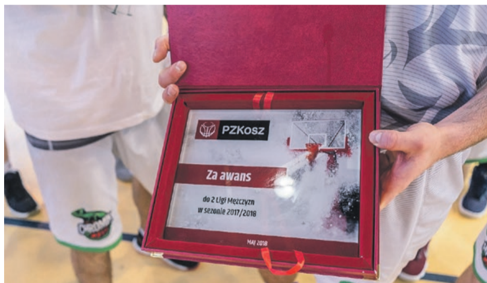
Na to od dawna czekali żarscy kibice koszykówki

Szczecin. Pierwszą kwartę Chromik przegrał 19:16, a po dwóch kwartach Szczecin prowadził 34:31. Był moment, że gospodarze uzyskali trzynastopunktową przewagę. Obie drużyny walczyły do końca, jednak i tym razem szala zwycięstwa przechyliła się w stronę żarskich koszykarzy, którzy zakończyli to spotkanie pomyślnym dla siebie rezultatem 71:65. Skuteczna obrona i pomyślnie przeprowadzone ataki musiały przynieść zamierzony efekt.