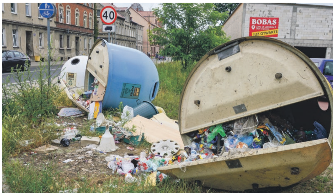
Przewrócenie pełnych pojemników na śmieci wymaga energii