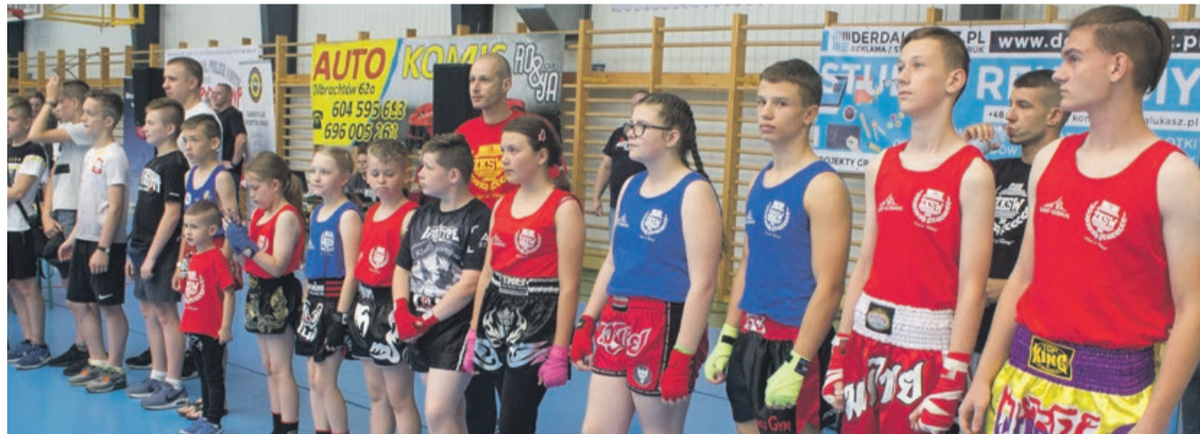
Ekipa gospodarzy - ŻKSW