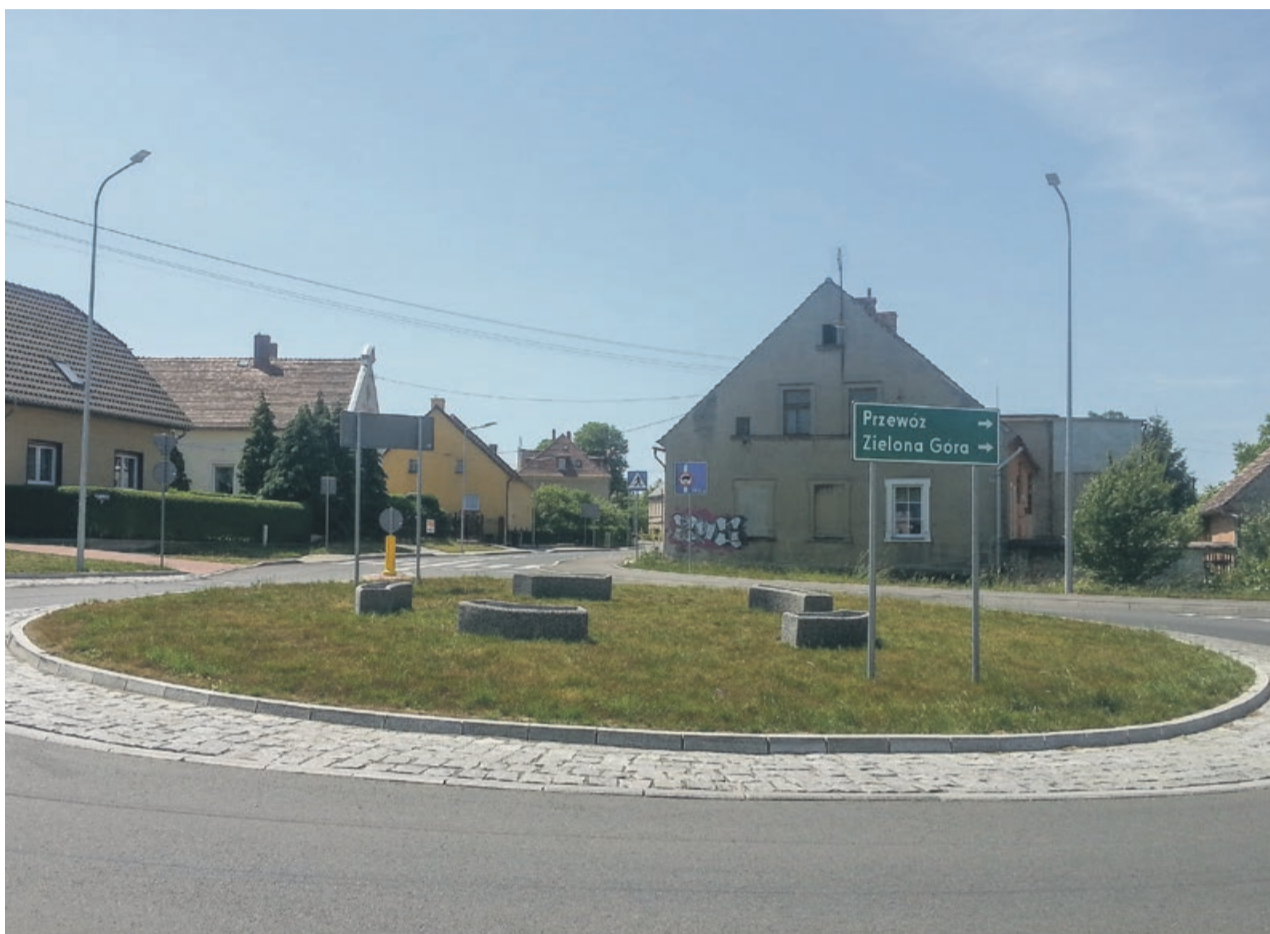
Rondo na „Zatorzu” będzie przypominać o nauczycielu szkoły położonej w tej samej dzielnicy miasta

Rondo na skrzyżowaniu ul. Moniuszki, Lotników i Wieniawskiego będzie nosić nazwę: „Rondo im. 100-lecia Odzyskania Niepodległości”. Z wnioskiem o nadanie takiej nazwy zwrócił się Zarząd Powiatu Żarskiego. Uchwałę intencyjną przyjęli radni powiatowi, którzy podkreślili, że ważnym jest, aby istota obchodów 100-lecia odzyskania niepodległości miała charakter zarówno lokalny jak i ogólnokrajowy. Rondo właśnie doczekało się nasadzeń kwiatów w kolorze biało-czer-