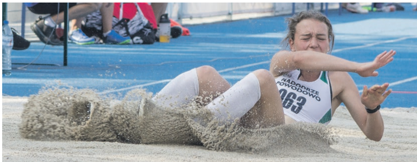
Tuż przed samymi trybunami przeprowadzono konkurs skoków w dal