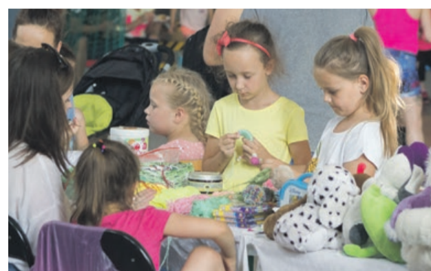
Dzieciaki znalazły coś dla siebie