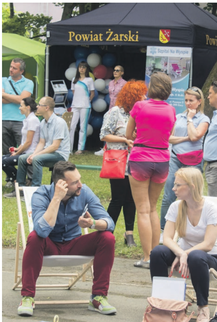
Swoje stoiska miały między innymi żarskie szpitale

Rozmowy o sprawach ważnych dla kobiet zapewne zainteresowałyby większą rzeszę pań, jednak chyba trochę niefortunnie wybrano miejsce tego wydarzenia. Pikniku właściwie nie było nawet widać, nawet z ulicy. A szkoda, bo wiele osób mogłoby skorzystać z darmowych badań, zajrzeć do licznych namiotów rozstawionych przez różne instytucje. Nawet dla dzieci przygotowano miejsce do zabawy i dmuchane zamki. Zabrakło chyba też odpowiedniej reklamy, z odpowiednim wyprzedzeniem.