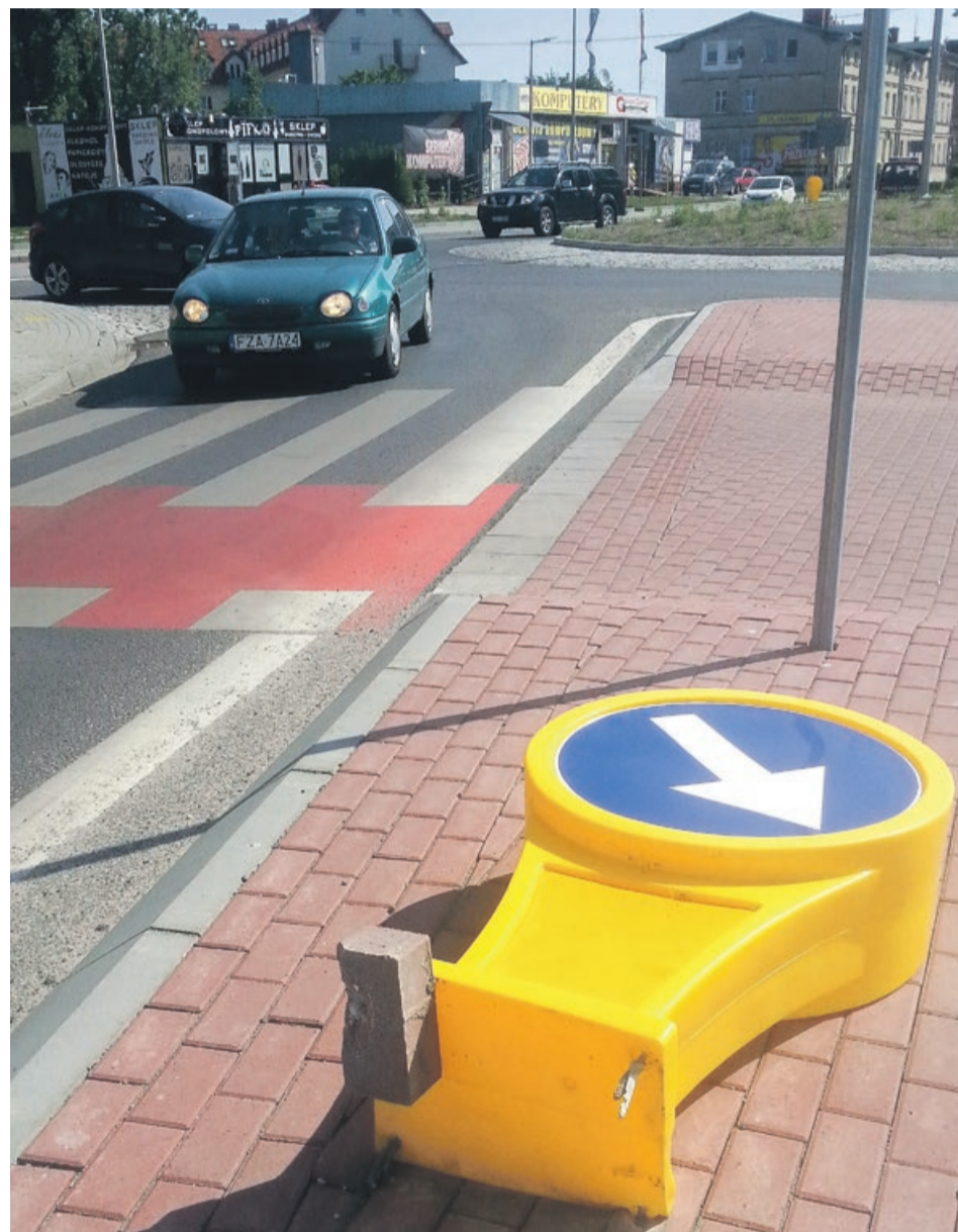
Wyrwanie kierunkowskazu wymagało trochę siły. Być może, na przyszłość, potrzebują lepszego zamocowania