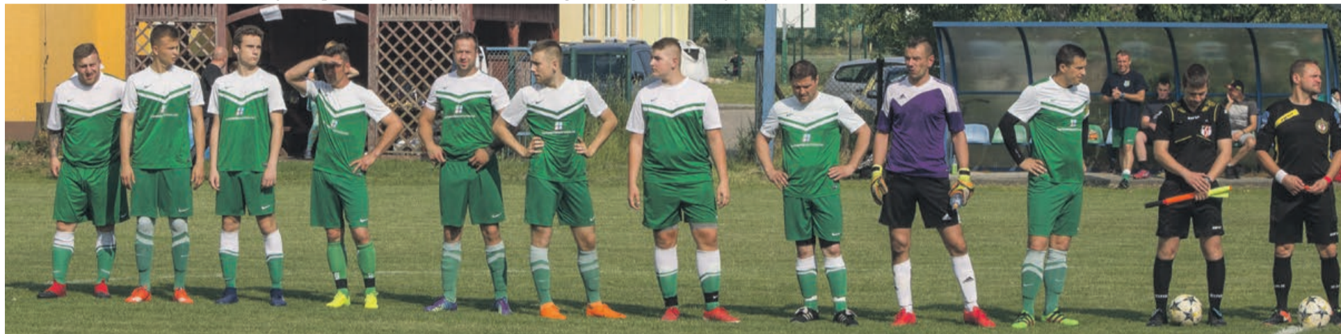
Sparta Grabik przegrywa ostatni mecz sezonu z KS Lipna 0:1, ale to w żaden sposób nie zagroziło jej pozycji wicelidera tabeli żarskiej klasy B

Oficjalnie awanse zostaną ogłoszone po zakończeniu wszystkich kolejek, ale już teraz gratulujemy udanego sezonu zarówno piłkarzom z Łęknicy, jak i z Grabika. ATB