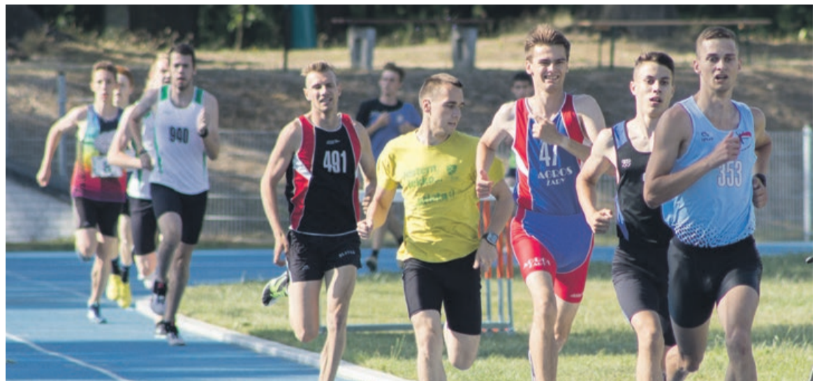
Konkurencje biegowe rozgrywano na wielu różnych dystansach