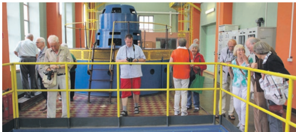
Jednym z punktów programu była wizyta w elektrowni wodnej