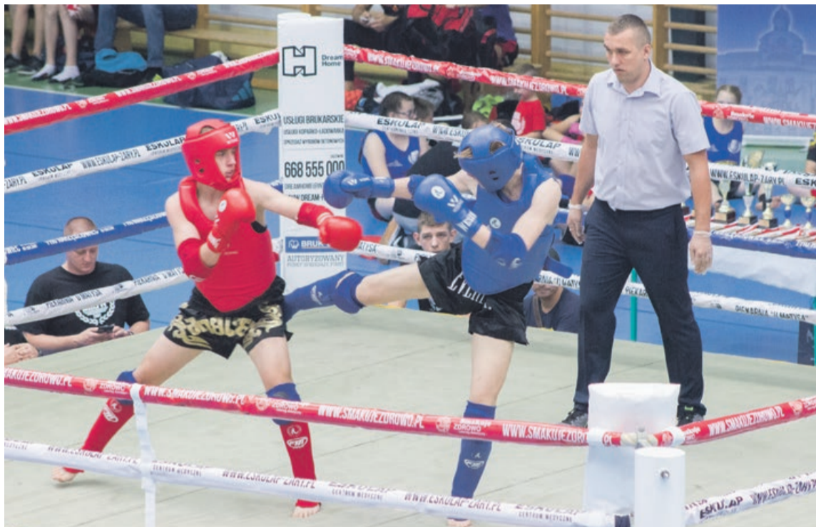
Młodzi wojownicy prezentowali swoje umiejętności