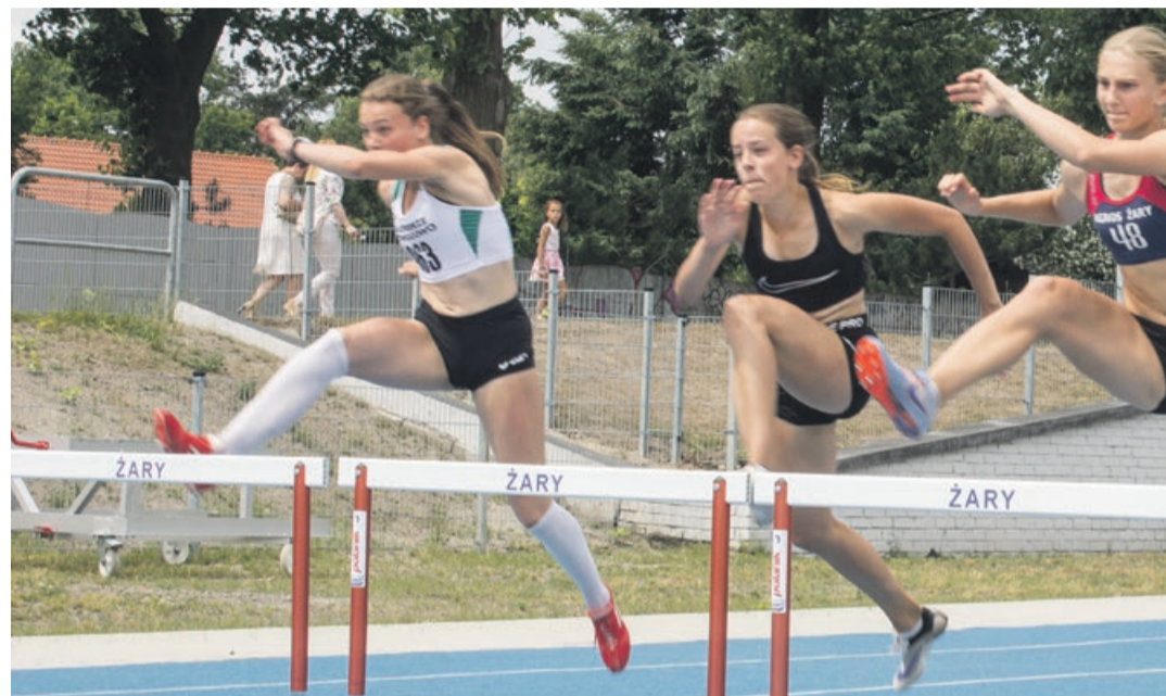
Biegi przez płotki to jedna z bardziej widowiskowych dyscyplin w lekkiej atletyce