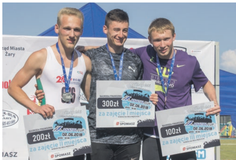
Finaliści emocjonującego sprintu na 100 metrów