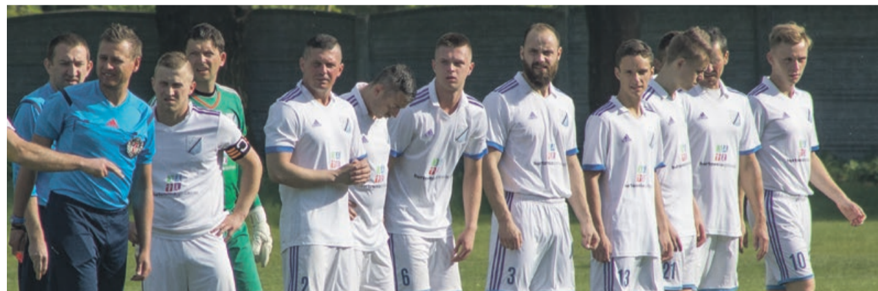
Unia Kunice straciła nadzieję na utrzymanie w klasie okręgowej

Unia ma spokojną, rodzinną wręcz atmosferę na własnym stadionie. I to zapewne się nie zmieni, bez względu na to, w jakiej klasie będą grać piłkarze w kolejnym sezonie. IV liga na pewno jest poza zasięgiem Unii. Pytanie, czy okręgówka nie jest dla tego klubu za mocna. Na pewno radzili sobie lepiej, niż jasińska Stal, która po awansie z A klasy wypadła w tym sezonie fatalnie. ATB