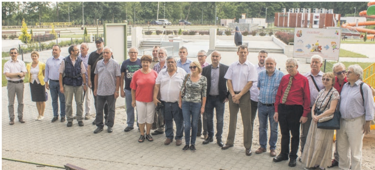
Kompleks rekreacyjny przy ul. Źródlanej dobrze współgra z atrakcjami Zielonego Lasu

W ocenie geoparku bardzo liczy się organizacja i działania na rzecz regionu, a nie tylko walor przyrodniczy. Możemy popaść w przesadę i uznać Łuk Mużakowa, czy obszar żarski, za Yellowstone, czy wodospady Niagara, bo takie skojarzenie szybko by się nasuwało, że jak jest znak UNESCO, to musi być jakaś niesamowita przyroda. Ta przyroda jest po prostu specyficzna dla tego miejsca i jest wartościowa.