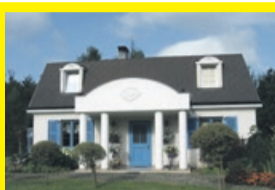
Chcesz mieć dworek jak na zdjęciu? W Olbrachtownie mam rozpoczętą budowę: podpiwniczenie ze stropem, na działce 3000 m2 (możliwy podział na dwie). Cena: teren 40 zł/m2, podpiwniczenie 52 tys. zł. tel. 512 209 363