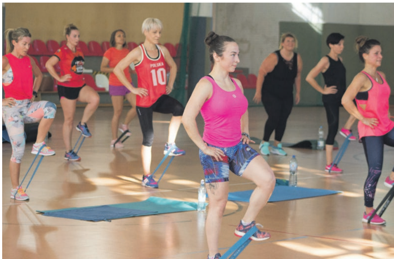
Można ćwiczyć i jednocześnie pomagać. Idealne połączenie