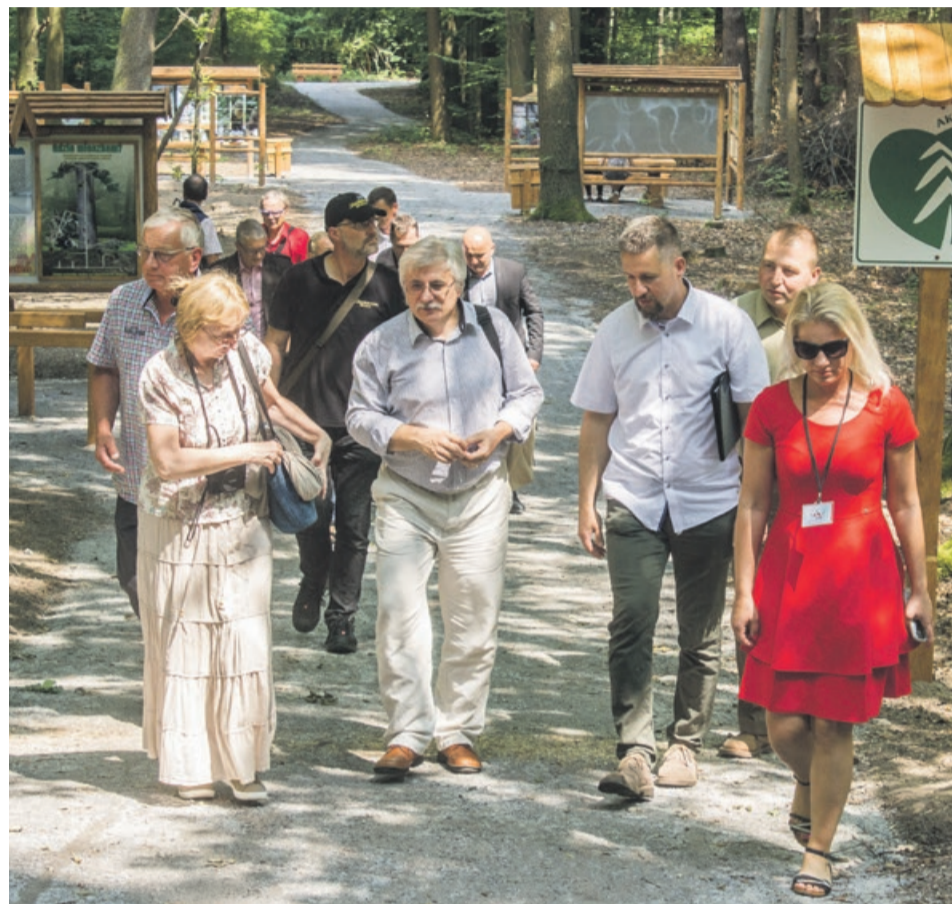
Uczestnicy konferencji obejrzeli między innymi nową ścieżkę edukacyjną w Zielonym Lesie

Na ukształtowanie tych terenów miał wpływ nie tylko lodowiec, ale i górnicza działalność człowieka. Kopalnie węgla brunatnego oraz ilów ceramicznych funkcjonowały w okolicach Łęknicy do lat siedemdziesiątych ubiegłego wieku. Być może niewiele osób spacerujących po Zielonym Lesie zdaje sobie sprawę, że tam niegdyś także działała kopalnia. Niewprawne oko nie jest w stanie tego dostrzec,