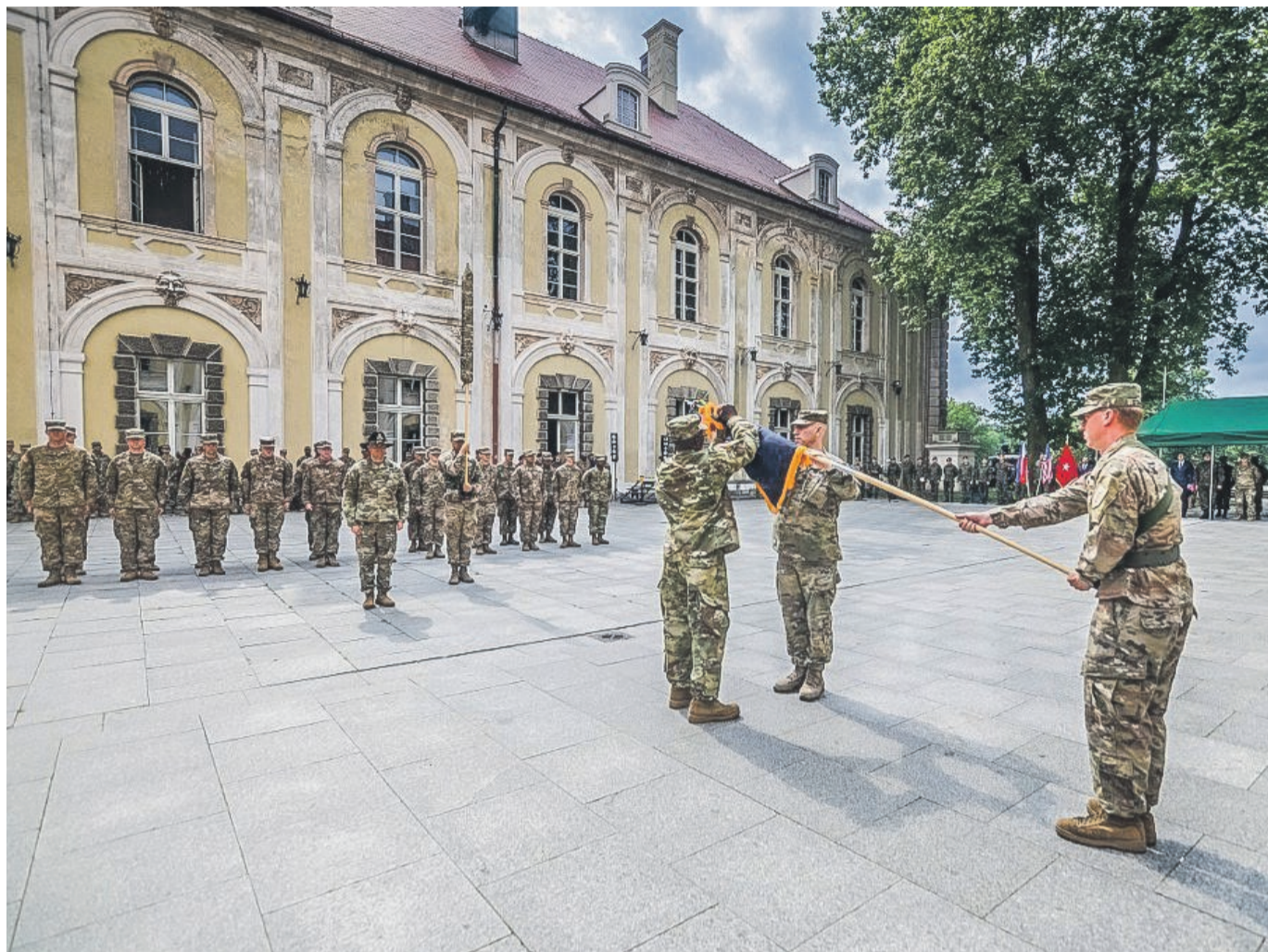
Ceremonia rozwinięcia i zwinięcia sztandarów jest celebrowana od dnia powstania wojsk lądowych amerykańskiej armii, czyli od roku 1775

„Jesteśmy tu dziś, by uhonorować dokonania 2ABCT i powitać 1ABCT. Podczas swej zmiany Brygada Sztyletów – 2ABCT zrealizowała ponad 250 ćwiczeń na terytorium 8 państw, wykorzystując czołgi M1 Abrams, opancerzone transportery piechoty M-2 Bradley oraz haubice samobieżnymi M109A6 Paladin. W szkoleniu wykorzystano ponad 2 miliony pocisków. Logistyczne dokonania Brygady są równie imponujące. Drogami i torami kolejowymi żołnierze Brygady pokonali 160 tys. kilometrów (ok. 100 tys. mil). Z drugiej strony przybyła do Polski „Iron Horse Brigade” i zapewniam, że jest ona gotowa do działania, jako element odstraszania”. – w swym przemówieniu mówił gen. dyw. Richard R. Coffman, dowódca Dywizyjnego Centrum Dowodzenia Amerykańskich Sił Lądowych w Europie. PAS