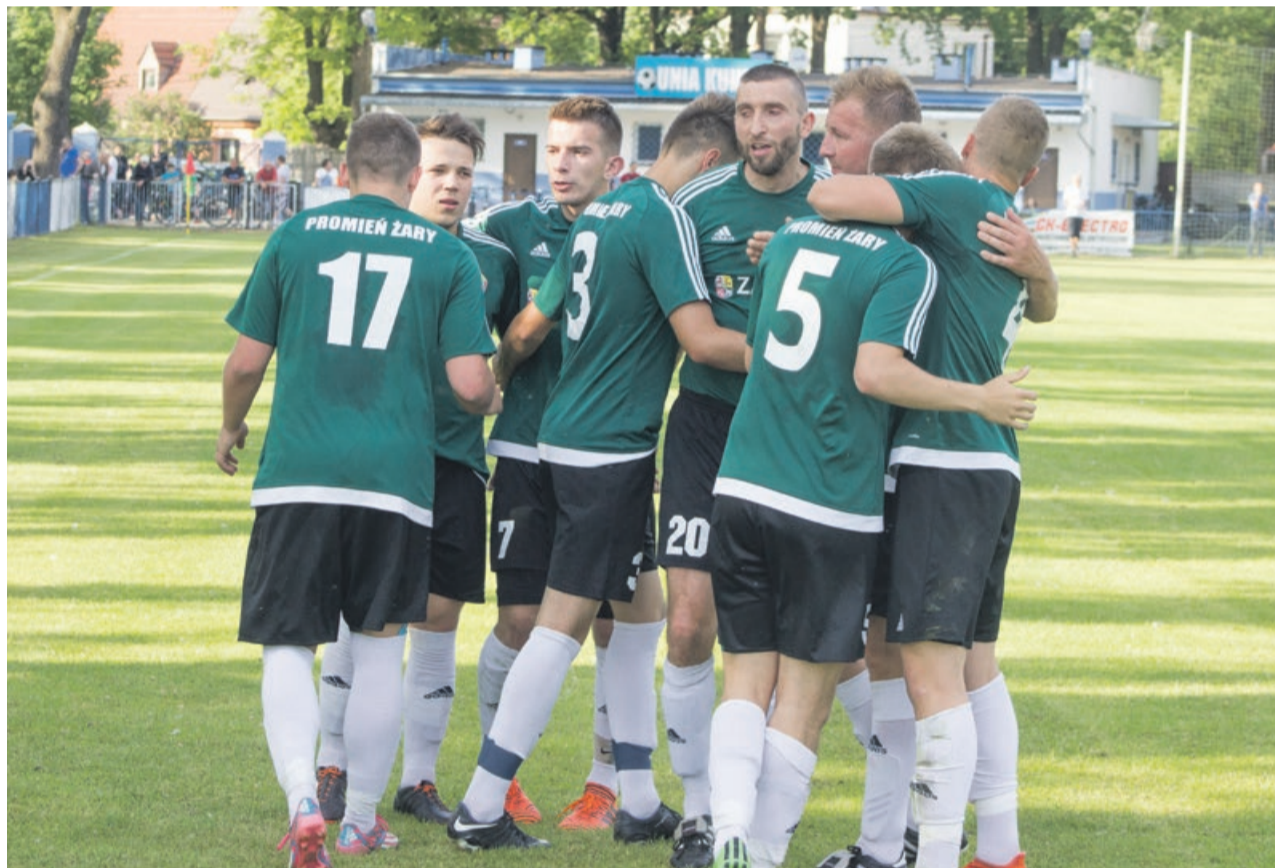
Promień Żary ma szansę zdobyć upragniony awans do IV ligi

Wielu kibiców wybiera się do Gubina na najważniejsze spotkanie sezonu. Czy przy dopingu własnych kibiców Promień wywalczy awans? ATB