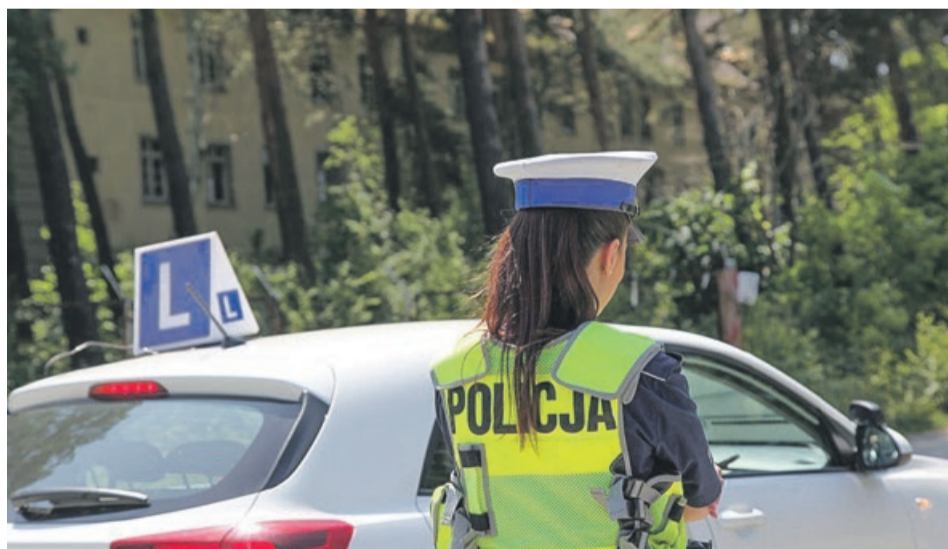
Kontrola nie wykazała większych nieprawidłowości

Funkcjonariusze sprawdzali m.in. stan techniczny i wyposażenie pojazdów, którymi prowadzone było szkolenie, a także czy instruktor i pojazd spełniają wymogi określone przepisami. Mundurowi pod lupę wzięli również czas trwania szkolenia, liczbę osób w pojeździe, czy nie ma w nim osób postronnych, oznakowanie i wyposażenie pojazdów. Głów-