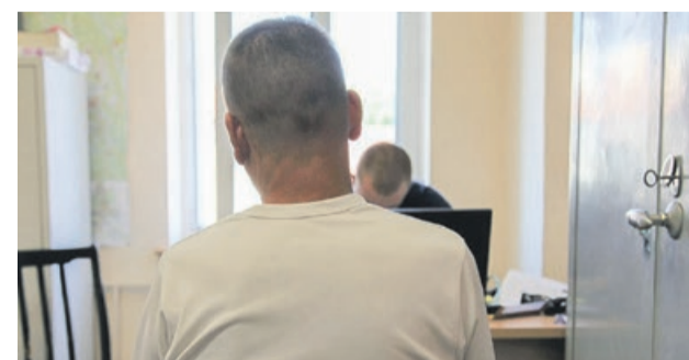
Wandal został zatrzymany i przyznał się do winy