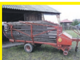
Przyczepa samozbie- rająca, rok 2001, Tel. 699-932-056