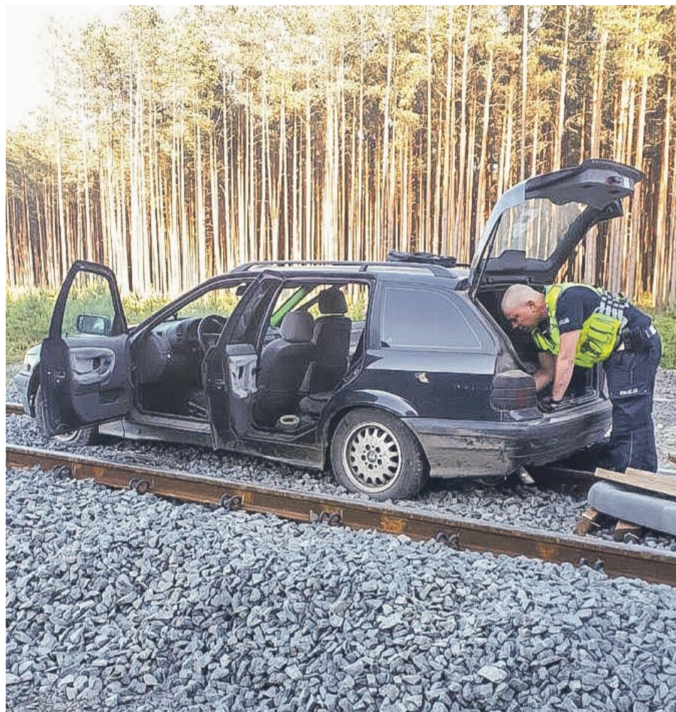
Kierowcy grozi za popełnione przestępstwa nawet kilka lat pozbawienia wolności

Policjanci z Posterunku Policji w Przewozie pełnili służbę patrolową. Przejeżdżając przez Straszów zauważyli samochód marki BMW, którego kierowca poruszał się z dużą prędkością. Funkcjonariusze natychmiast włączyli sygnały świetlne i dźwiękowe, aby zatrzymać kierującego pojazdem. Mężczyzna jednak je zignorował i kontynuował ucieczkę w kierunku miejscowości Silno Małe. Wielokrotnie zajeżdżał drogę policjantom, uniemożliwiając im wyprzedzenie go i zatrzymanie. Funkcjonariusze wykorzystali moment i zatrzymali 26-latką, kiedy ten wjechał na torowisko i chciał uciekać wzdłuż torów. Nie był sam, „podróżował” z nim 26-letni pasażer. Zachowanie kierowcy wskazywało na to, że może być pod wpływem narkotyków. Wobec tego mundurowi przeprowadzili test narkotykowy. Jego wynik był pozytywny i potwierdził podejrzenia. Po sprawdzeniu w bazach policyjnych okazało się również, że mężczy-