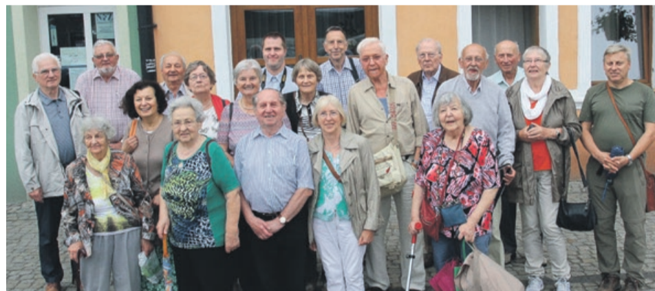
Wizyta w rodzinnym mieście sprawiła turystom z Niemiec wiele radości