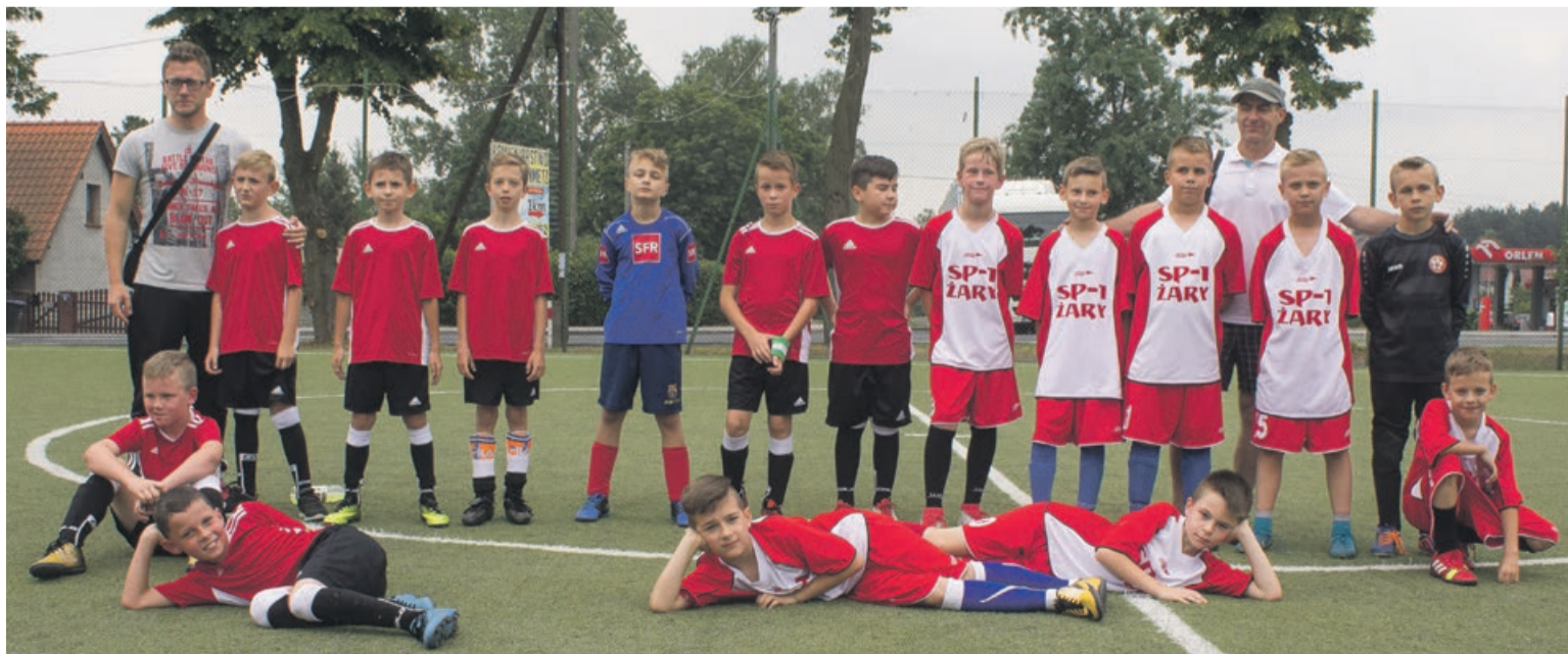
W meczu ćwierćfinałowym Francja (SP1 Żary) pokonała Maroko (SP Tuplice) wynikiem 5:1

W rywalizacji pozostały już tylko cztery drużyny. W półfinałach Peru (SP2 Żary) spotka się z Belgią (SP Brody). W drugim meczu zagrają Niemcy (SP3 Gubin A) oraz Francja (SP1 Żary). Mecze te rozegrane zostaną w poniedziałek, 11 czerwca, o godz. 9.30 na orliku w Lipinkach Łużyckich. Finał trzy dni później w Trzebielu. ATB