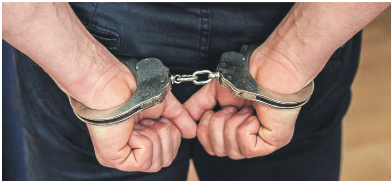
Na razie złoczyńca siedzi w areszcie. Może powędrować za kratki nawet na dziesięć lat

ŻARY Kradzież i przemoc. Złoczyńca był bezczelny. Okazało się, że ma inne grzechy na sumieniu.