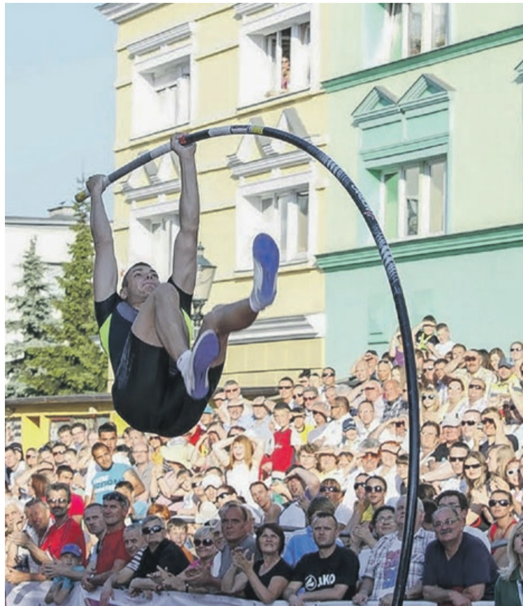
Na żarskim konkursie kibiców nigdy nie brakowało

Termin imprezy podyktowany był możliwością startu w Żarach dwóch najlepszych obecnie polskich skoczków - Piotra Lisaka i Pawła Wojciechowskiego. Już same te nazwi-