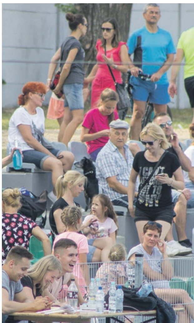
Impreza przyciągnęła sporo kibiców