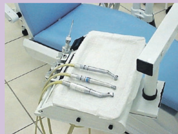
Złe zabezpieczenie pilnika stało się przyczyną tragicznego wypadku

Co gorsza, dentysta nie wystawił niezwłocznie skierowania do szpitala. Naraził w ten sposób pokrzywdzonego na bezpośrednie niebezpieczeństwo utraty życia lub ciężkiego uszczerbku na zdrowiu. Oskarżonemu grozi kara pozbawienia wolności od 3 miesięcy do 5 lat. PAS