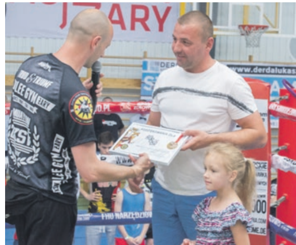
Podziękowania dla głównego sponsora