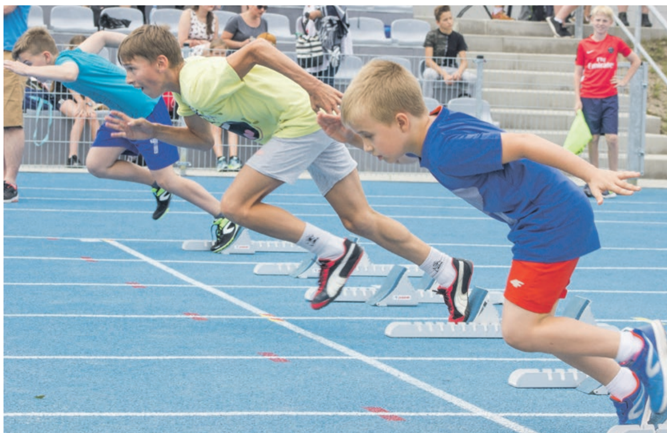
Najmłodszy rywalizowali zupełnie na poważnie