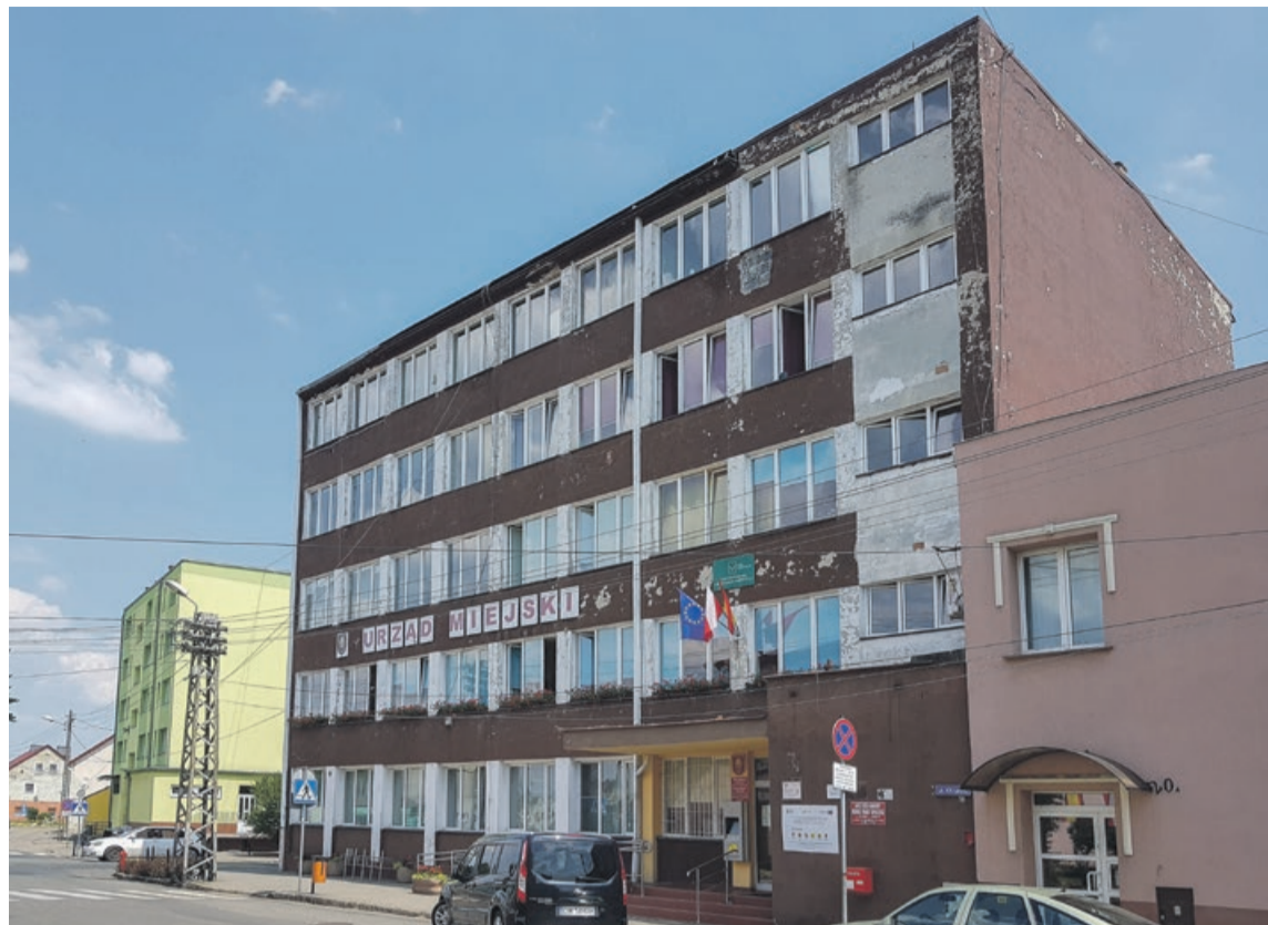
W takiej siedzibie władz samorządowych to chyba nawet trochę wstyd kogoś przyjmować. Jedna z mieszkanek zapytała wprost: - Naprawdę podoba się panu ten budynek, że robi pan zdjęcie?

- W tej kadencji nie było żadnych podwyżek, od śmieci począwszy, poprzez wodę, ścieki, podatki. Wręcz przeciwnie, niektóre podatki obniżyliśmy. Po zrobionej kalkulacji jest obniżka wody i ścieków o 20 groszy. Jak na raz, to jest