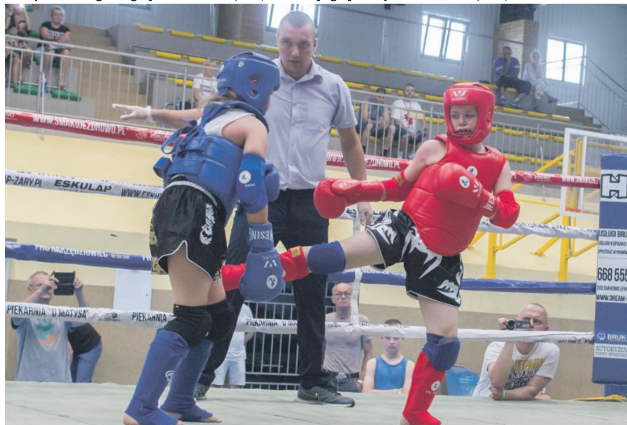
Przyszłość polskiego muaythai