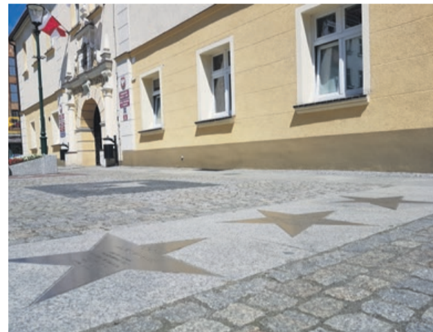
Przed ratuszem pojawi się nowa gwiazda