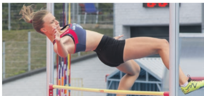
Jedną z rozgrywanych dyscyplin lekkoatletycznych był skok wzwyż