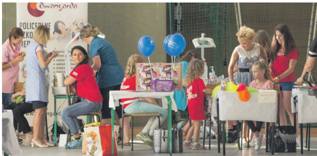
Przygotowano sporo atrakcji, nie tylko ruchowych

w tytule wpisując: darowizna na cele statutowe, Więcej informacji na stronie internetowej zarserca.pl