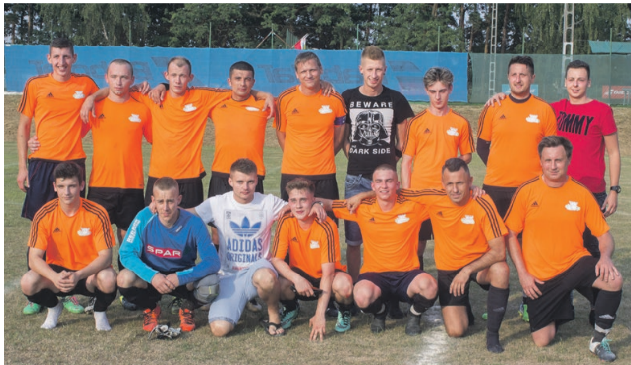
ŁKS Łęknica po bardzo dobrym sezonie awansuje do klasy A

Druga w tabeli Sparta Grabik zgromadziła w sezonie 55 punktów wygrywając 18 razy i jeden mecz kończąc remisem. Zielonogórskie klasy A rozgrywane są w czterech grupach, natomiast klas B jest aż sześć. Ta