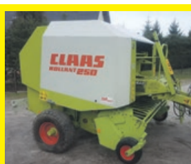
Prasa do słomy Claas Rollant 250, rok 2002, stan bardzo dobry, Tel. 699-932-056