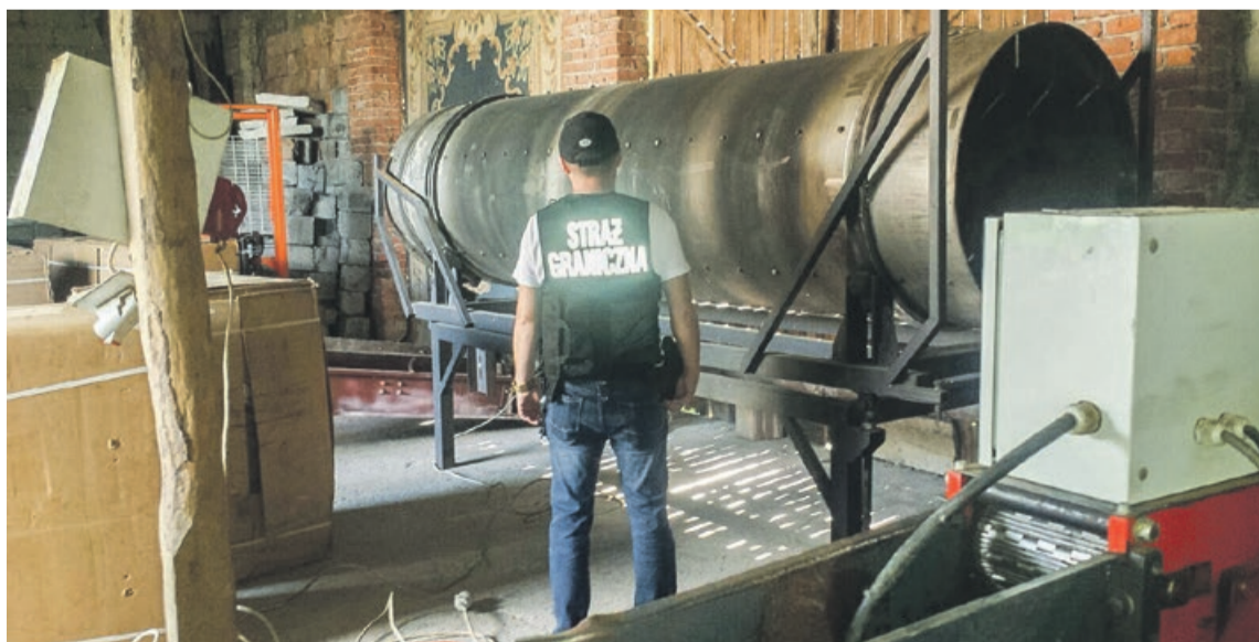
Funkcjonariusze Straży Granicznej z Tuplic przyczynili się do likwidacji nielegalnej krajalni tytoniu

W budynkach gospodarczych ujawniono ponad 3 tony suszu