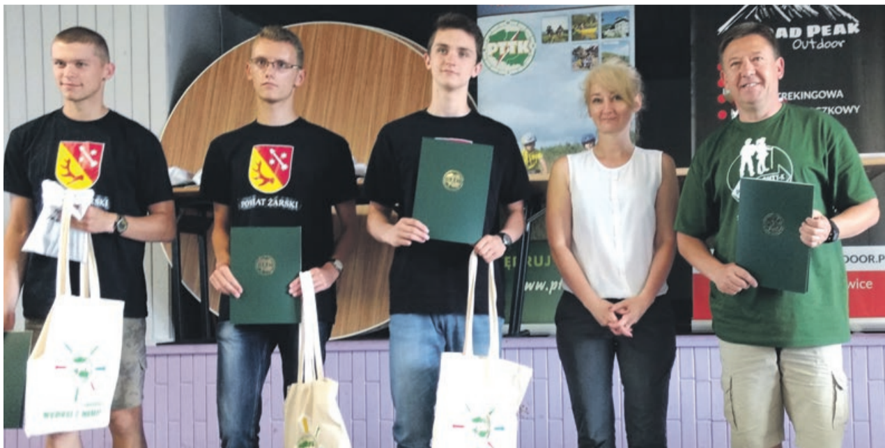
Niezwykle wymagający i prestiżowy turniej, do którego przystąpiły najlepsze drużyny z całej Polski, był dla żarskiej grupy bardzo udany

Do finałowej rozgrywki w Wadowicach, miejscowości w której urodził się jeden z największych miłośników turystyki - Karol