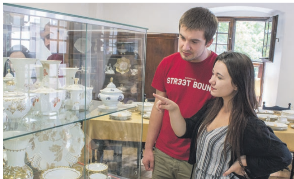
Kolekcja żarskiej porcelany budzi spore zainteresowanie