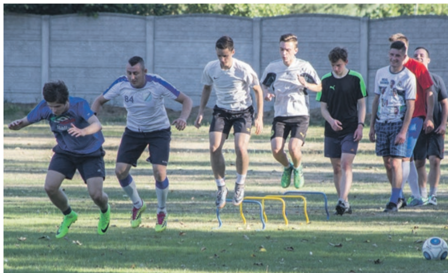
Na boisku Unii Kunice trwają przygotowania kondycyjne