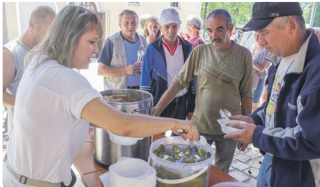
Średniowieczna kasza z ogórkiem smakowała wszystkim