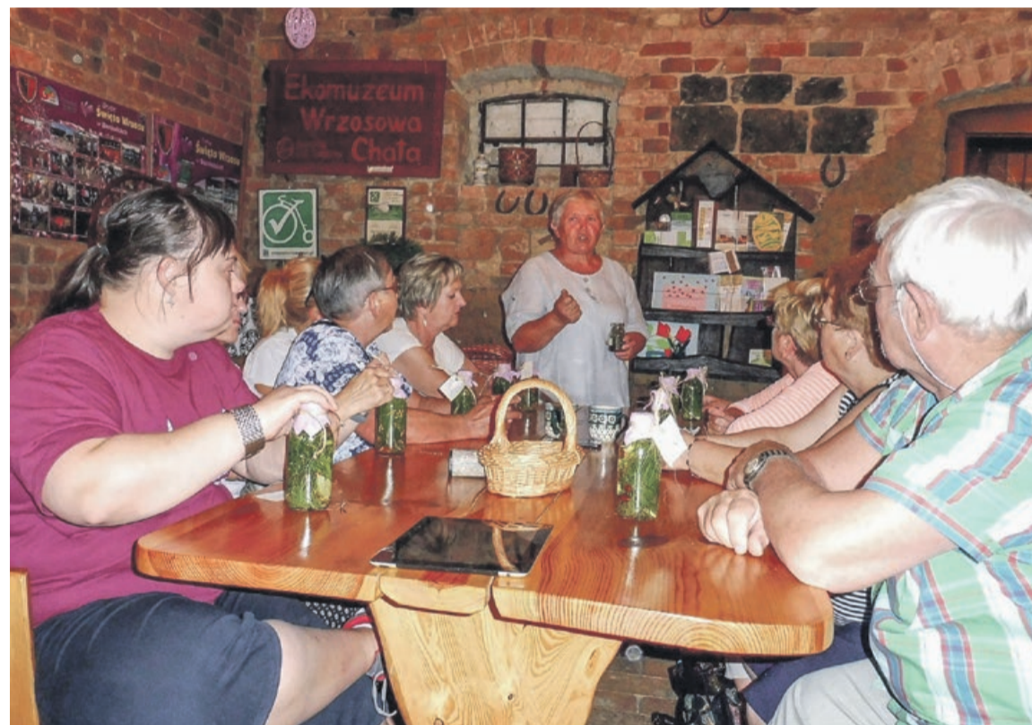
Gawęda, połączona z prezentacją, może być pomysłem, który można realizować we wsiach gminy Żary