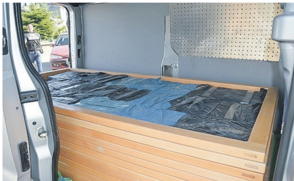
Po zdjęciu górnego skrzydła, funkcjonariusze odkryli zawinięte w folię paczki papierosów