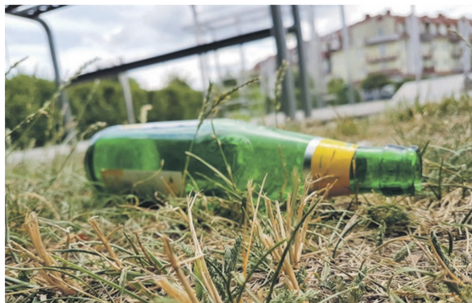
Skatepark. Butelka leży tuż przy śmietniku. Widocznie ciężko było trafić