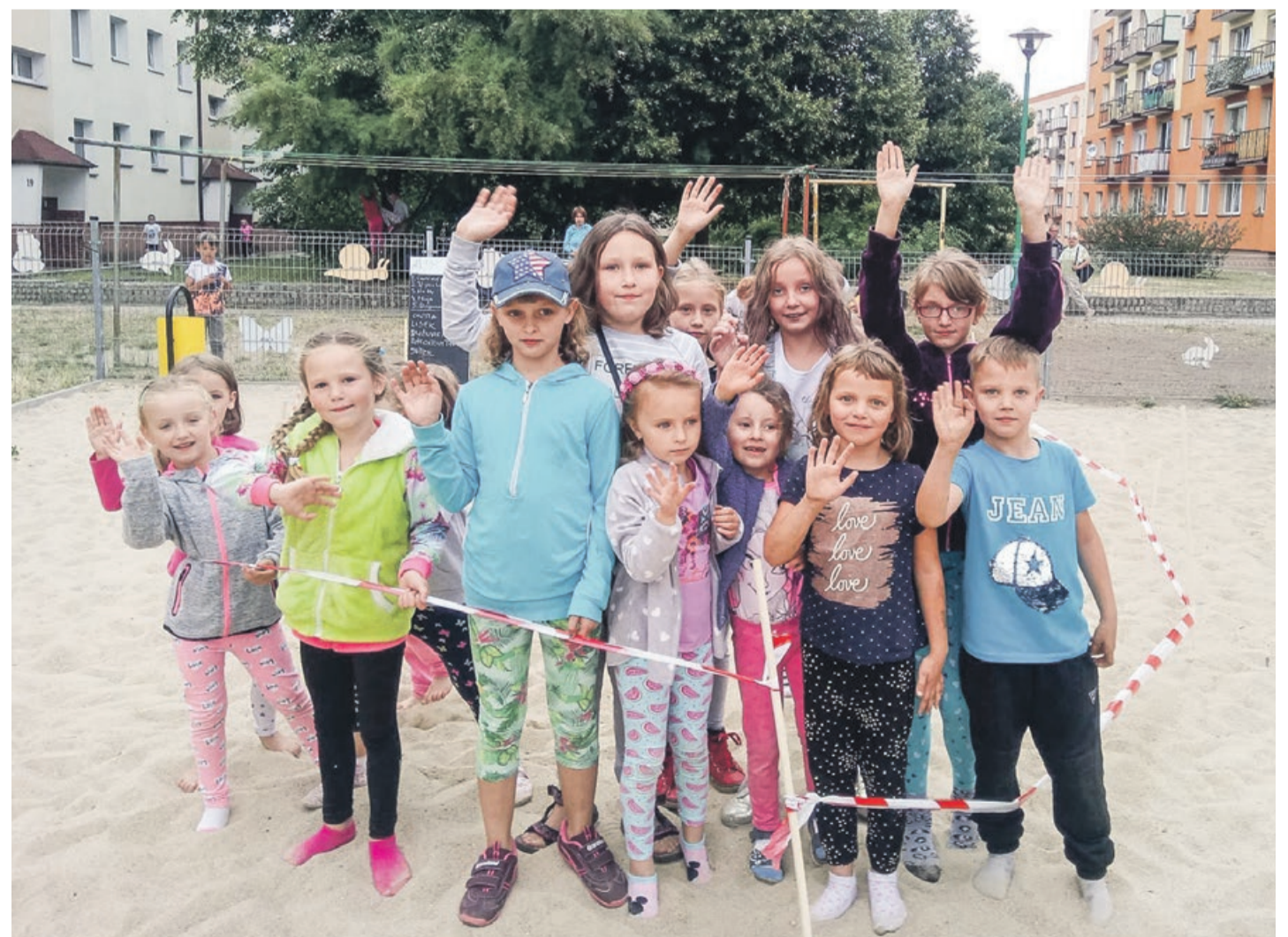
Animatorzy z Lubuskiego Domu Kultury wychodzą w plener i prowadzą ciekawe zajęcia dla najmłodszych - zajęcia plastyczne, animacje, zajęcia kuglarskie, gry i t.p.

14 lipca (sobota) godz. 20.00 - KONCERT PURE INSTINCT 20 lipca (piątek) godz. . 22.00 - KONCERT OLEJ 27 lipca (piątek) godz. 19.00 - 22.00- KARAOKE 28 lipca (sobota) godz. 20.00 - KONCERT EASY LOVERS 10 sierpnia (piątek) godz. 19.00 -22.00 - KARAOKE 18 sierpnia (sobota) godz. 20.00 - KONCERT ETA 25 sierpnia (sobota) godz. 19.00 - DANCING 30+ 01 września (sobota) godz. 20.00 - KONCERT FREE TRIP