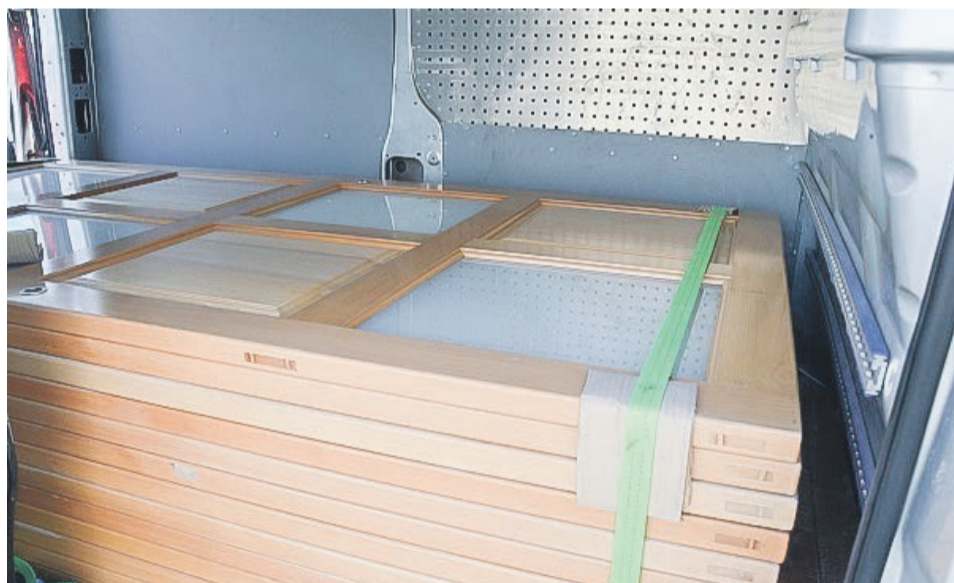
Wszystko wyglądało na pierwszy rzut oka w porządku