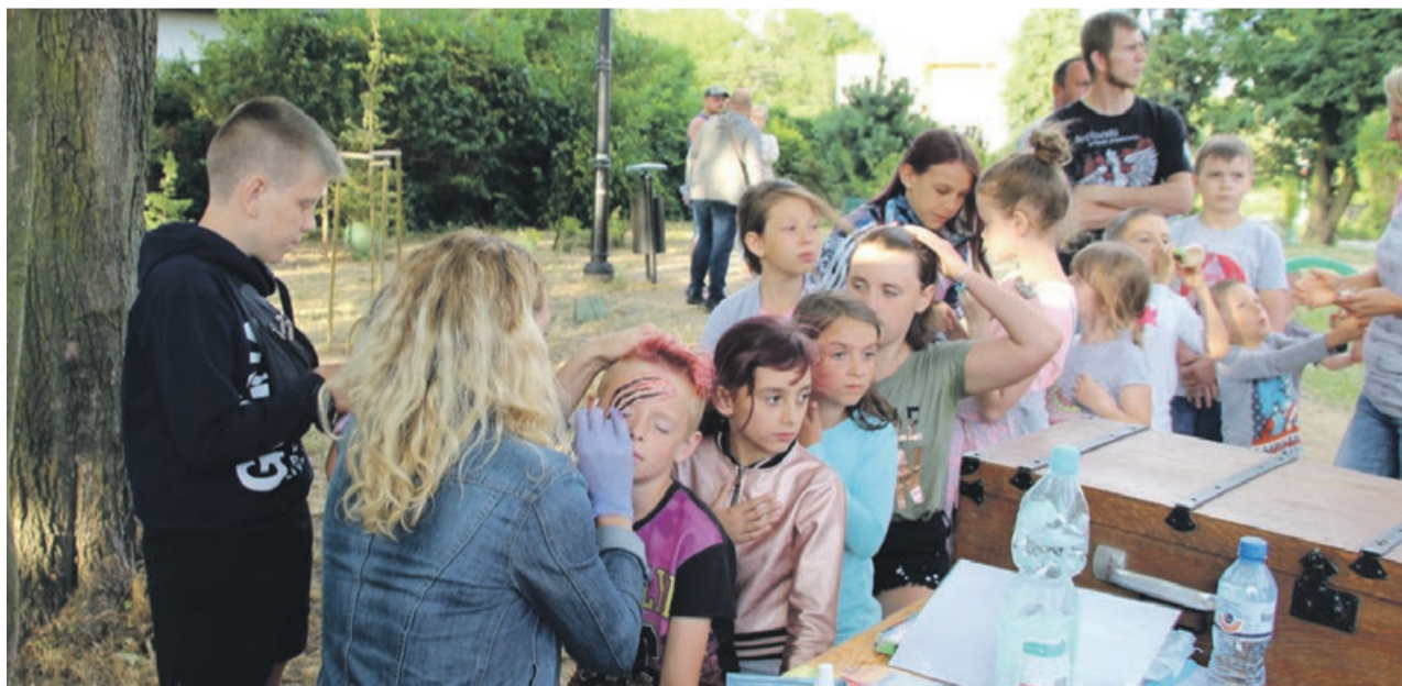
Można przy okazji pomalować twarz fotUM Żary

Kolejne trzy seanse zaplanowane są w sierpniu. PAS