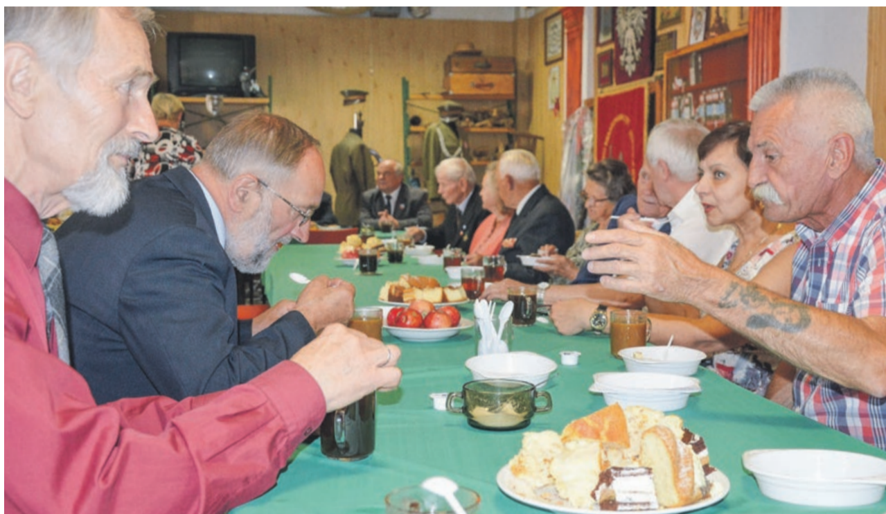
Dyskusja w siedzibie kresowian trwała jeszcze długo po uroczystości

Dokładnie 75 lat temu, 11 lipca 1943 r. doszło do kulminacyjnego punktu ludobójstwa na polskiej ludności cywilnej, na Wołyniu, dokonanego przez Organizację Ukraińskich Nacjonalistów i Ukraińską Powstańczą Armię, wspieranych przez ukraińską ludność cywilną. Wydarzenia te nazywane są „Krwawą niedzielą”. Tego dnia zaatakowanych zostało 99 miejscowości, masakrowano Polaków podczas mszy w kościołach, mordowano i palono całe wsie. Masakry były kontynuowane w kolejnych dniach.