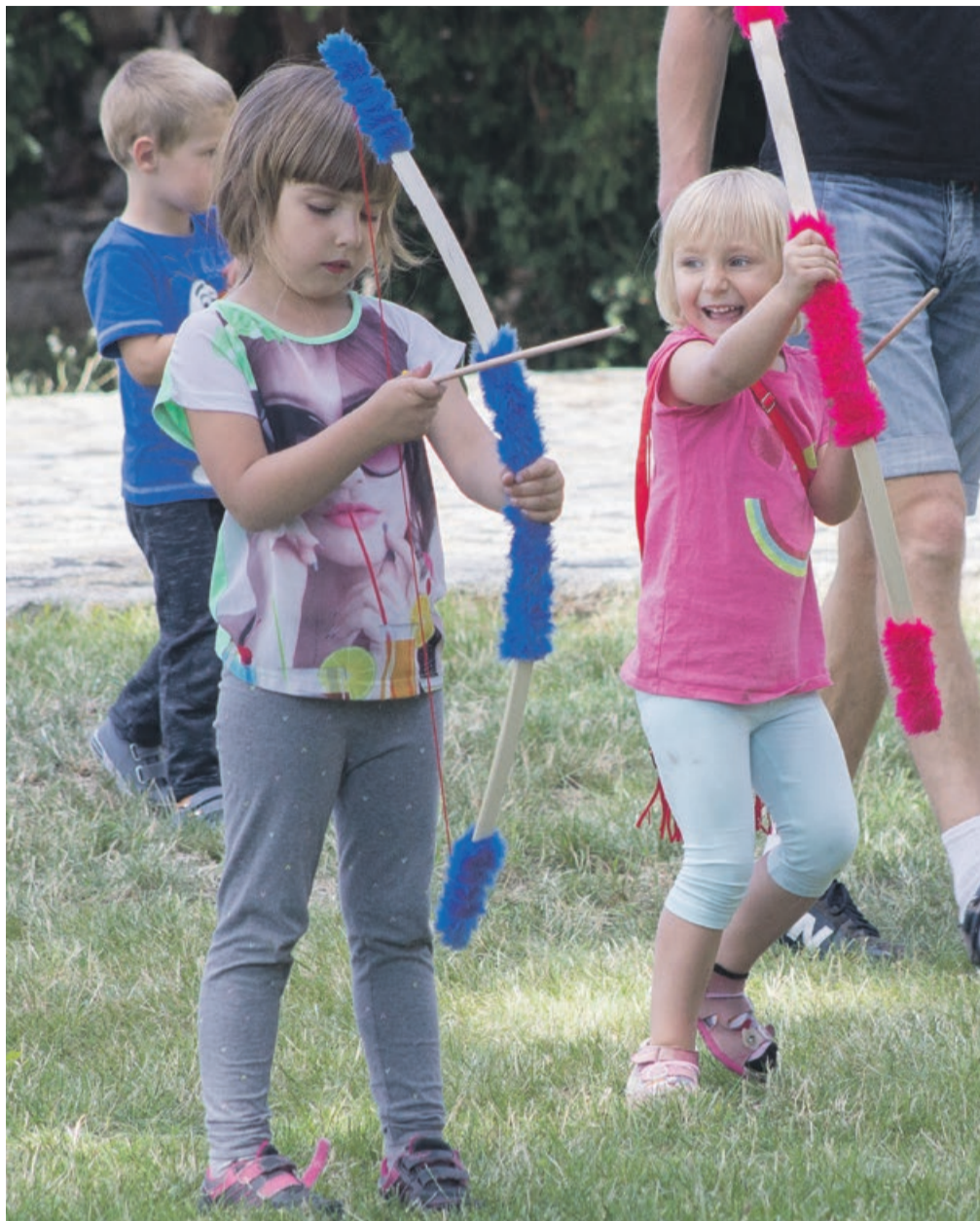
Jak się okazuje, nie tylko tablet daje dzieciom sporo frajdy