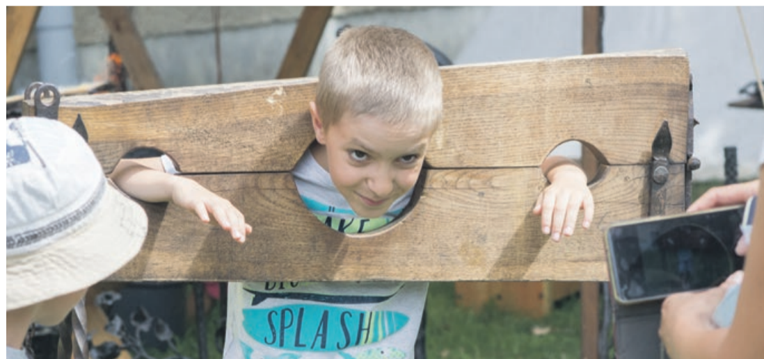
Wakacyjna fotka, inna niż wszystkie