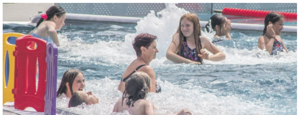
Każdy znajdzie tu coś dla siebie