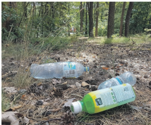
Okolice ul. Źródlanej