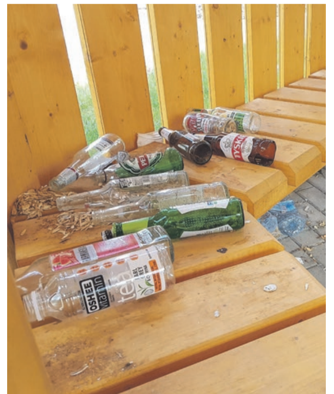
Wspomnienie po plenerowej zabawie