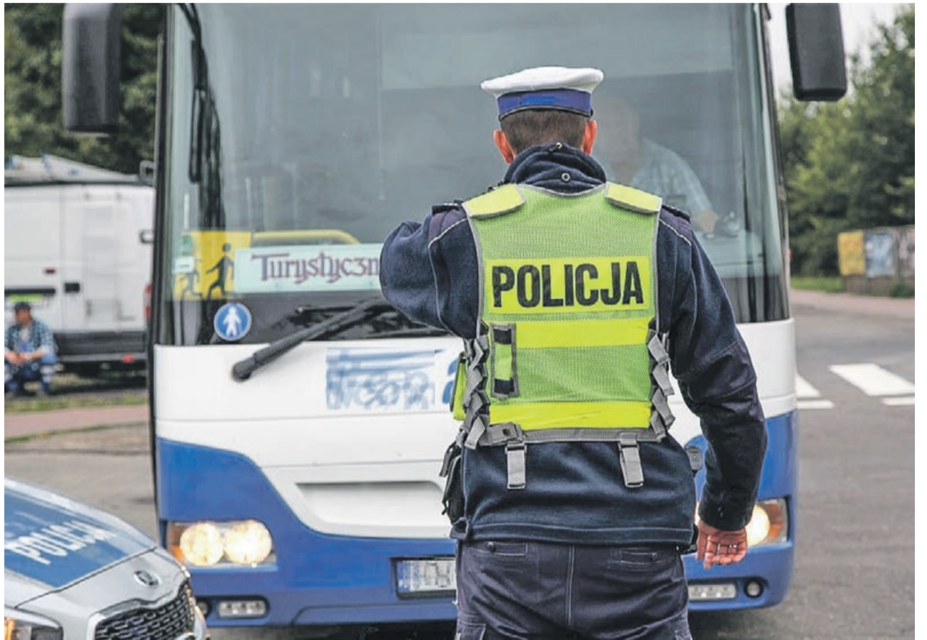
Kontrola nie zajmuje dużo czasu, a warto mieć poczucie bezpieczeństwa

- W nagrodę po wycieczce otrzymają odblaskowe gadżety, które policjant przekazał na ręce pań przedszkolank. Zakup odblasków sfinansowany został ze środków przekazanych przez Gminę Żary o Statusie Miejskim - informuje podkom. Aneta Berestecka, oficer prasowy KPP w Żarach. PAS