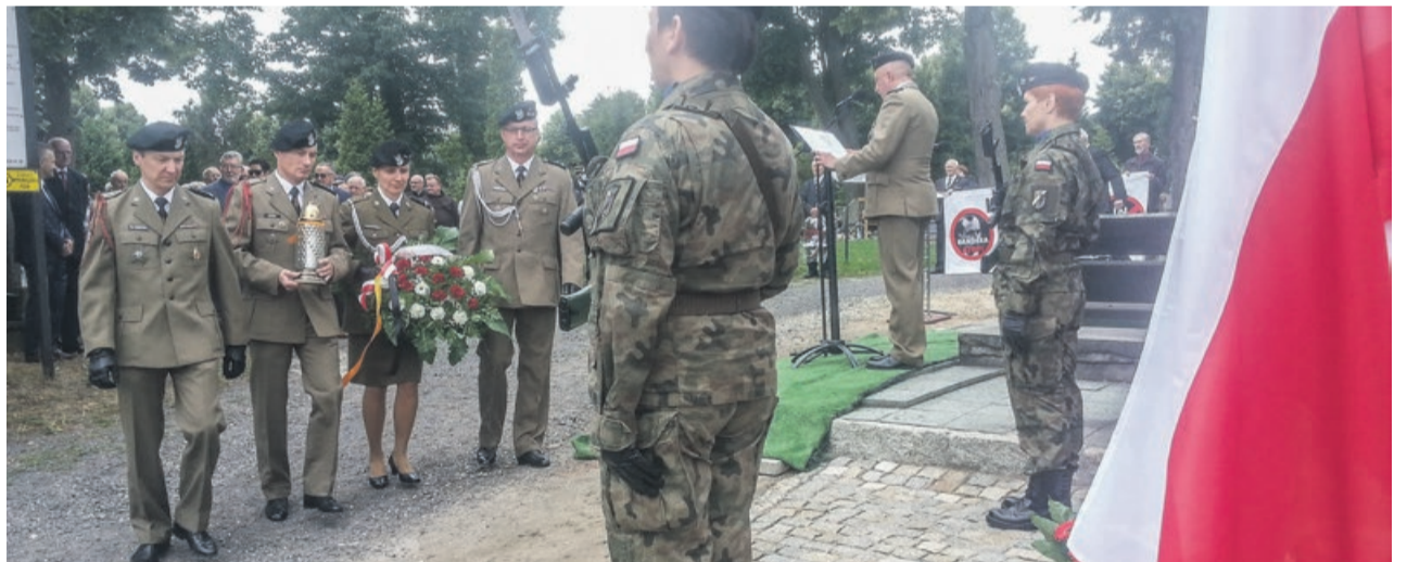
Uroczystość na cmentarzu miała godną rangi oprawę