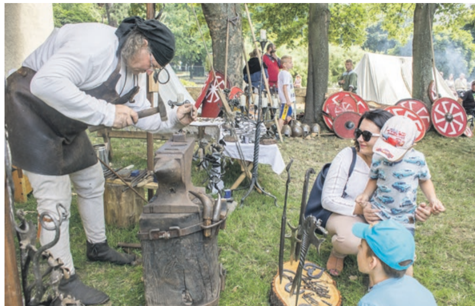
Tak wyglądała praca kowala. Tego na co dzień nie da się zobaczyć