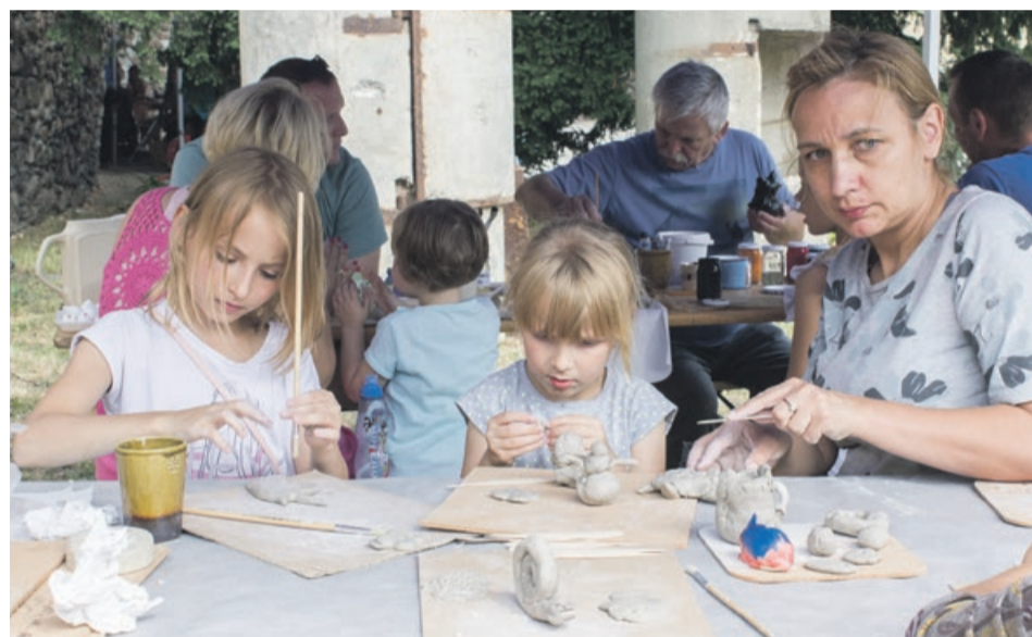
Balwanek, czy dzbanek. Ulepić można prawie wszystko