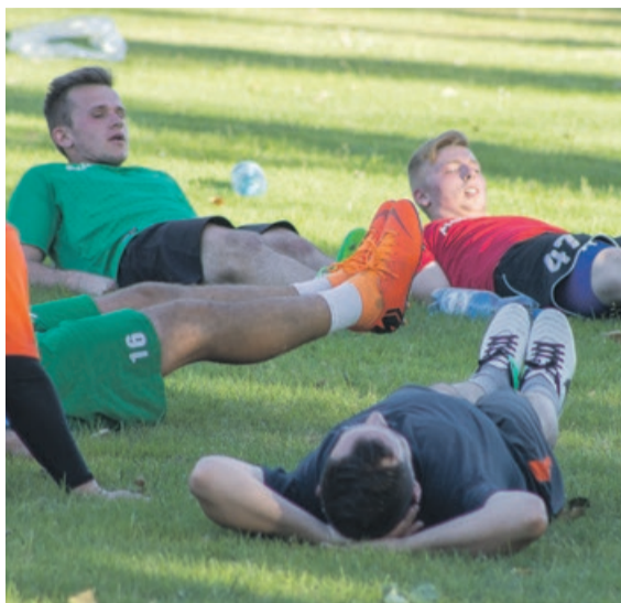
Piłkarze nie odpoczywają

Efekty tej pracy zobaczymy już wkrótce. Wtedy się okaże, jak zawodnicy przykładali się do treningów. ATB