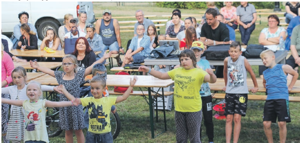
Przed seansem przyda się rozgrzewka fotUM Żary