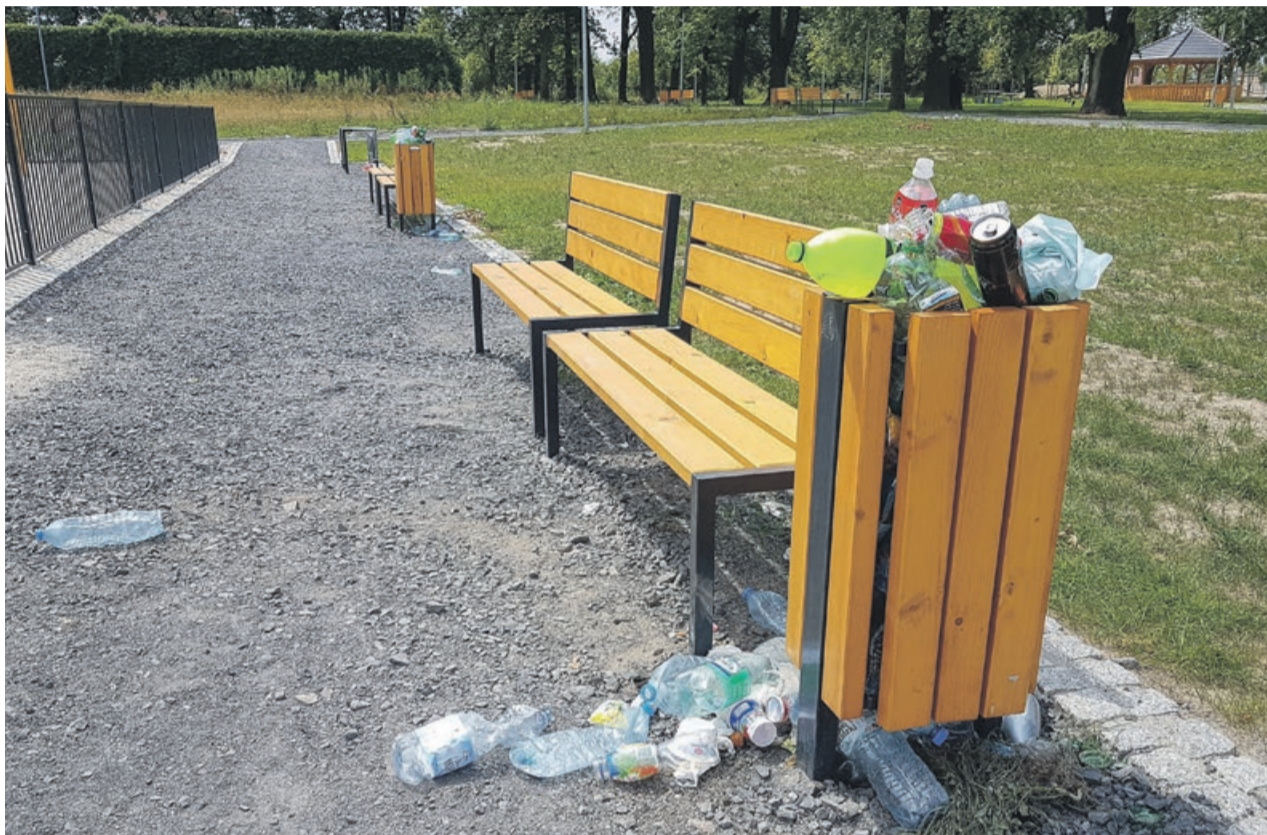
Teren parku przy ul. Paderewskiego pięknieje z każdym dniem, ale też jest coraz bardziej zaśmiecony

Praktycznie przez cały rok śmieci wywalane są na terenach leśnych, przy drogach, ale teraz doszedł jeszcze jeden problem - śmiecenie "rekreacyjne".