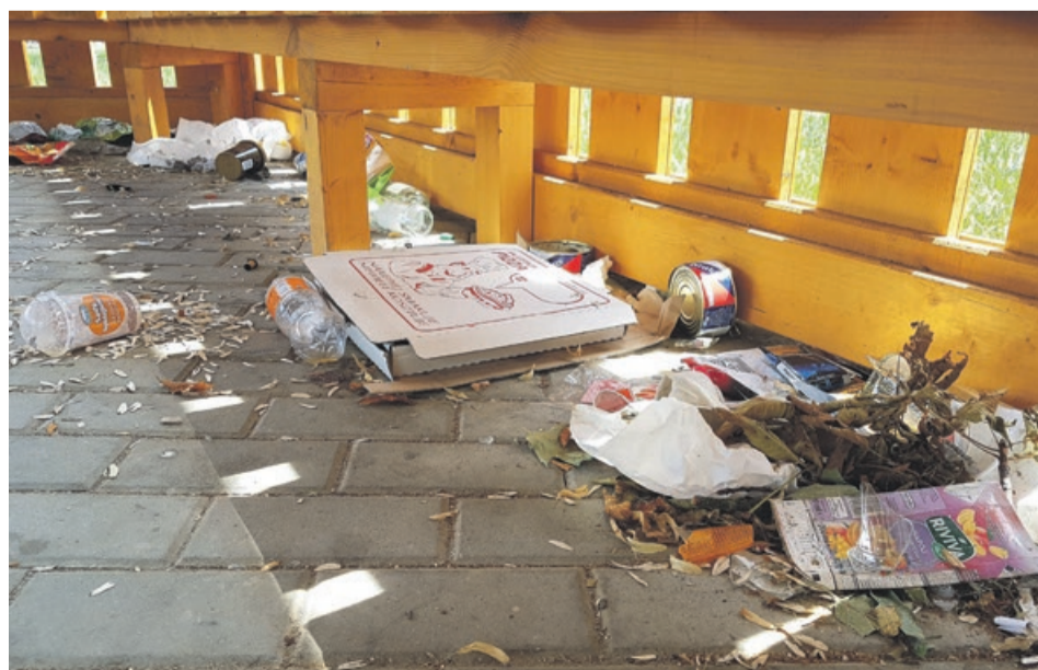
Wiata w parku przy ul. Paderewskiego. Opakowania po jedzeniu pod ławką