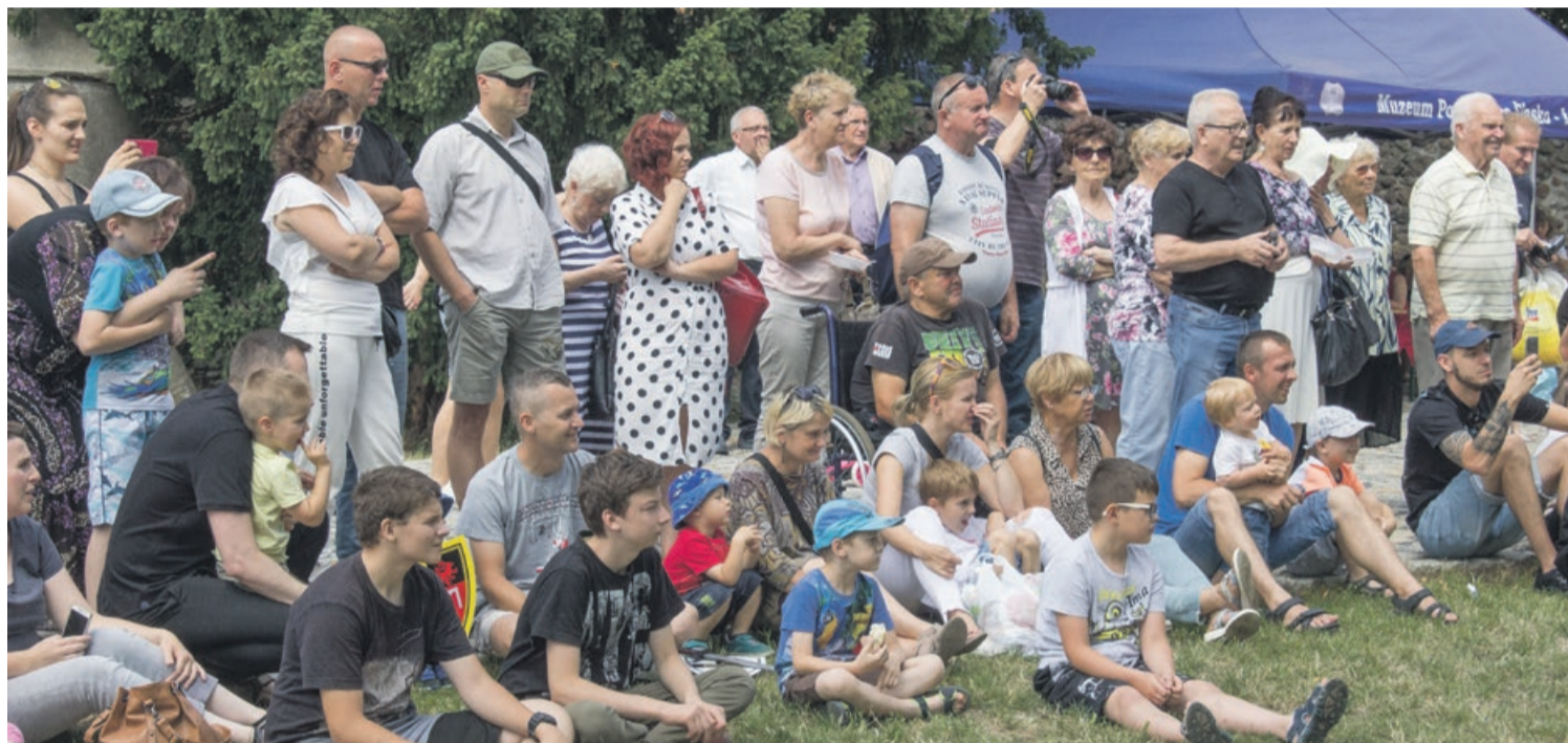
Plac przy muzeum tętnił życiem. Jubileuszowe atrakcje przyciągnęły wielu mieszkańców nie tylko z Żar

Przypominamy, że żarskie muzeum, mieszczące się przy pl. Kardynała Stefana Wyszyńskiego czynne jest od wtorku do piątku w godz. 10-16, w soboty od 12 do 16 oraz w niedziele od 14 do 18. ATB