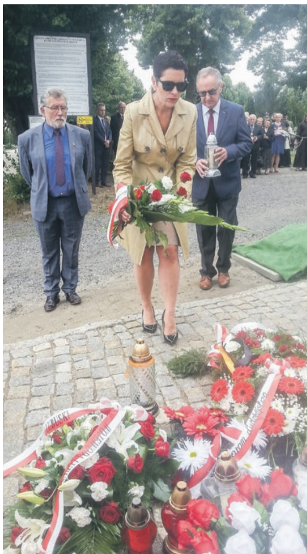
Pod Krzyżem Wołyńskim złożyli kwiaty i zapalili znicze przedstawiciele samorządu powiatowego, wywodzący się z różnych środowisk politycznych