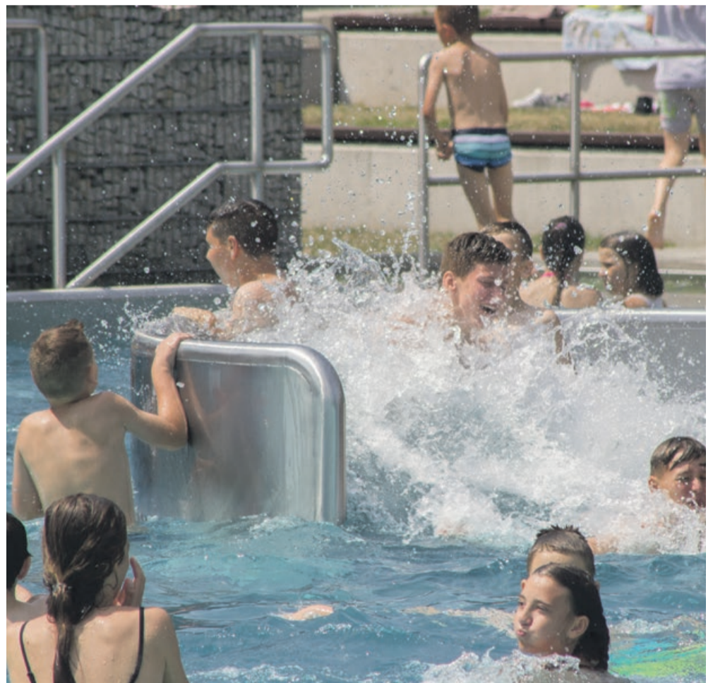
Na kąpiących się czeka sporo wodnych atrakcji