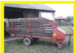
Przyczepa samobieżna - rok 2001, Tel. 699-932-056

◆ Wynajmę kawalerkę w domu jednorodzinnym z osobnym wejściem. Tel. 790 612 302