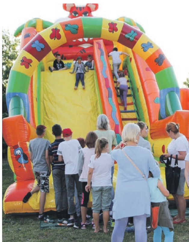
Kino z atrakcjami