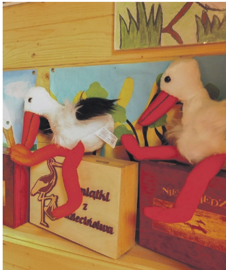
W sklepiku, w Niedźwiedzicach można kupić różne, tematyczne gadżety