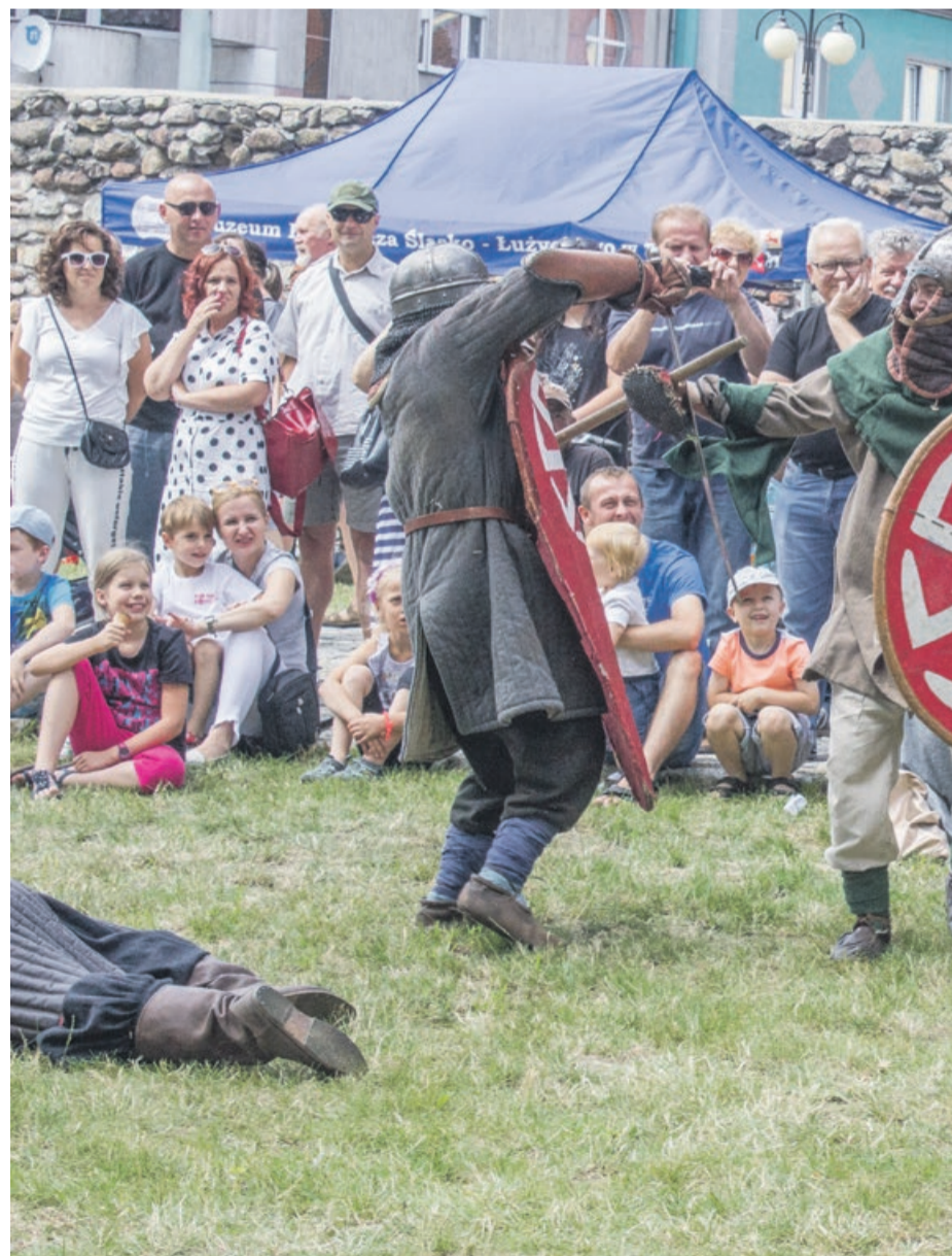
Zwycięzców pojedynków nagradzano oklaskami