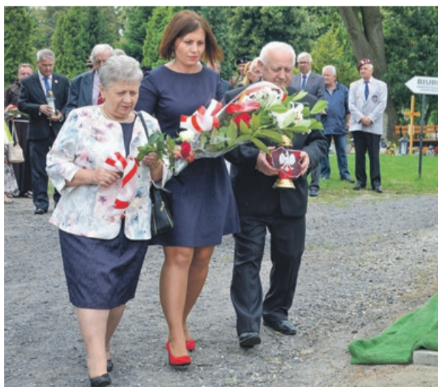
Kwiaty składali przedstawiciele samorządów, działacze kresowi, przedstawiciele Wojska Polskiego, Straży Pożarnej i mieszkańcy powiatu