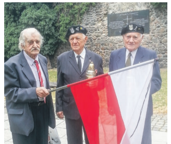
Pod tablicą upamiętniającą Sprawiedliwych Ukraińców stawili się świadkowie tragicznych wydarzeń sprzed kilkudziesięciu lat