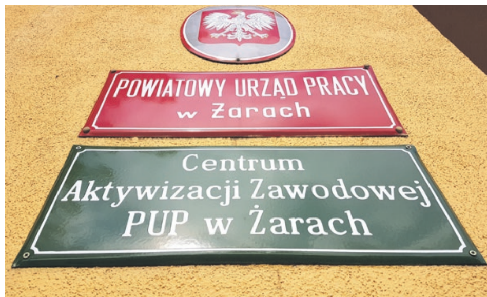
W urzędzie pracy podsumowano miniony rok

- Barrierami większej aktywizacji zawodowej Polaków są także: brak tanich mieszkań do wynajęcia, brak skomunikowania licznych małych miejscowości, w których mieszkają potencjalni pracownicy z miejscami, gdzie mogliby pracować i potrzeba wyższych refundacji dla pracodawców. Problemy te zauważyło też Ministerstwo Rodziny, Pracy i Polityki Społecznej, które w przygotowanej nowelizacji ustawy o zatrudnieniu zamierza pomóc samorządom w dalszym ułatwianiu zatrudnienia.