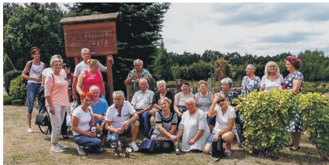
Wiedza zdobyta podczas wyjazdu z pewnością się przyda