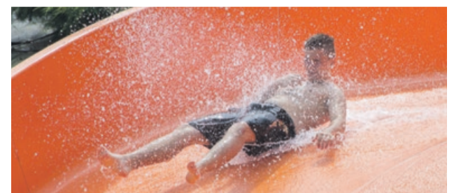
Zjeżdżalnie dają dużo frajdy