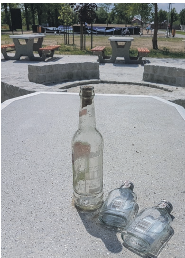
Po co to zostawili?

- Myślę, że zwrócimy na te miejsca więcej uwagi. Ale nie w tym jest problem, żeby sprzątać po wszystkich, co tam śmiecą. Tutaj trzeba zwrócić uwagę na tą naszą - ogólnie rozumianą - kulturę. Wszyscy powinniśmy na to reagować. Za każdym razem, jak widzę takie sytuacje, to osobiście zwracam uwagę. Inaczej tego problemu nie rozwiążemy. A dotyczy on wszystkich mieszkańców Żar, bo to też są czyjeś dzieci, pod czyjąś opieką. Samo sprzątanie nic nie da. Widzimy, jak to wygląda przy wiatkach śmietnikowych, przy wielu naszych obiektach rekreacyjnych. Wszyscy musimy z tym walczyć. Musi zmienić się mentalność zarówno tych, którzy śmiecą, jak i ludzi mieszkających wokół. Takie zachowania powinniśmy napiętnowywać za każdym razem.