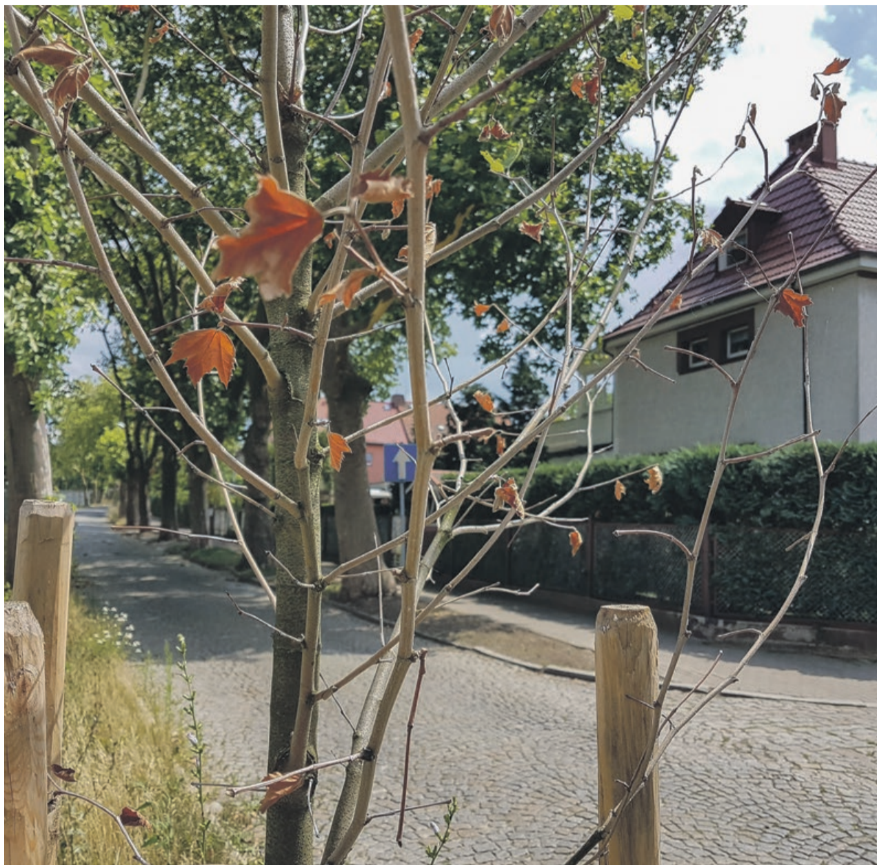
Czy nowe drzewa przy ulicy Słowackiego już umarły?

Do widoku drzew na tych terenach jesteśmy przyzwyczajeni. To wręcz normalne, że drzewa stanowią nieodłączny element krajobrazu. Co ciekawe, to co dla mieszkańców okolic jest "normalnością", dla przyjezdnych może być atrakcją, a wręcz budzić zachwyt. Wystarczy jednak pojechać trochę na północ, a szczególnie w rejon Polski centralnej, aby zobaczyć typowe leśne pustynie. Wtedy może bardziej docenia się to, co jest w naszej okolicy.