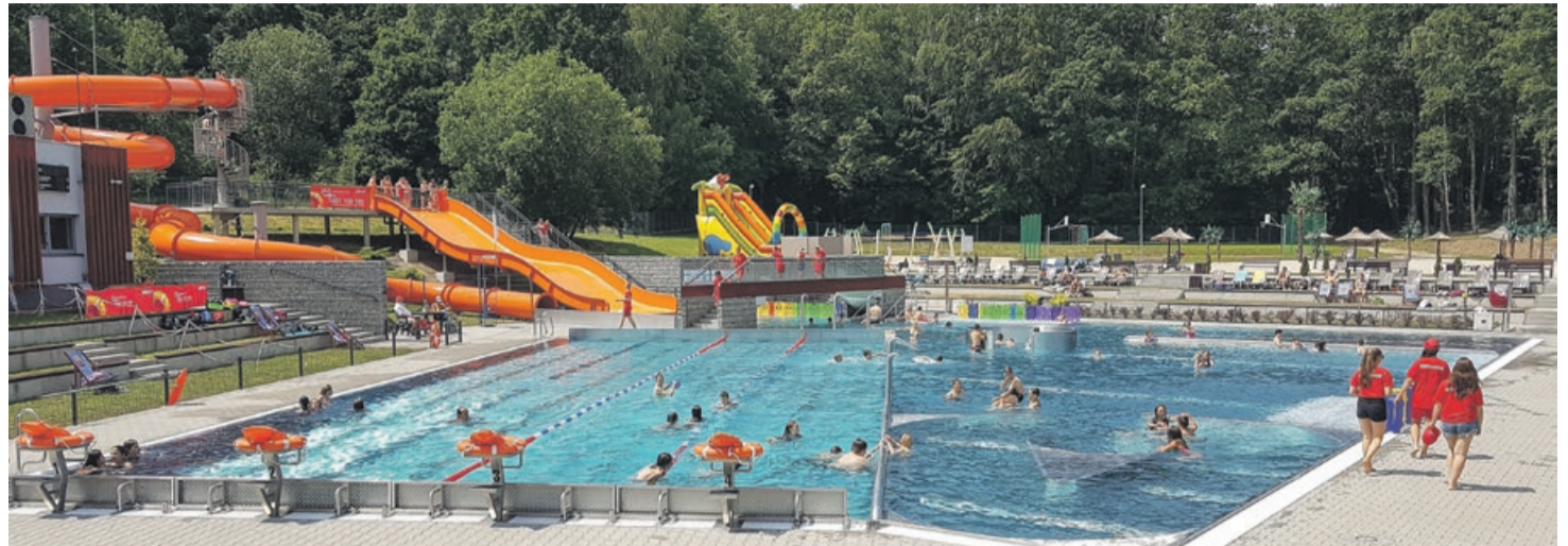
Wakacje w mieście można spędzić na terenie kompleksu rekreacyjnego przy ul. Źródlanej

Poniżej publikujemy rozkład jazdy. Można się przydać w sezonie wakacyjnym, a także później, bo przypomnijmy, że żarski basen czynny będzie do 15 września z możliwością przedłużenia sezonu kąpielowego do 30 września - oczywiście, jeśli pogoda na to pozwoli. ATB