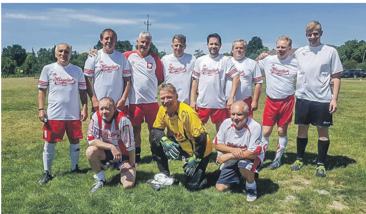
Oldboje Hayduka zdobywcami Pucharu Mirostowic Górnych 2018

Mirostovia Mirostowice Górne - Mirostowiczanka Mirostowice Dolne 0-1. ATB