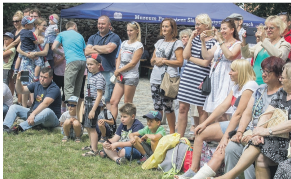
Wśród publiczności byli też mali rycerze