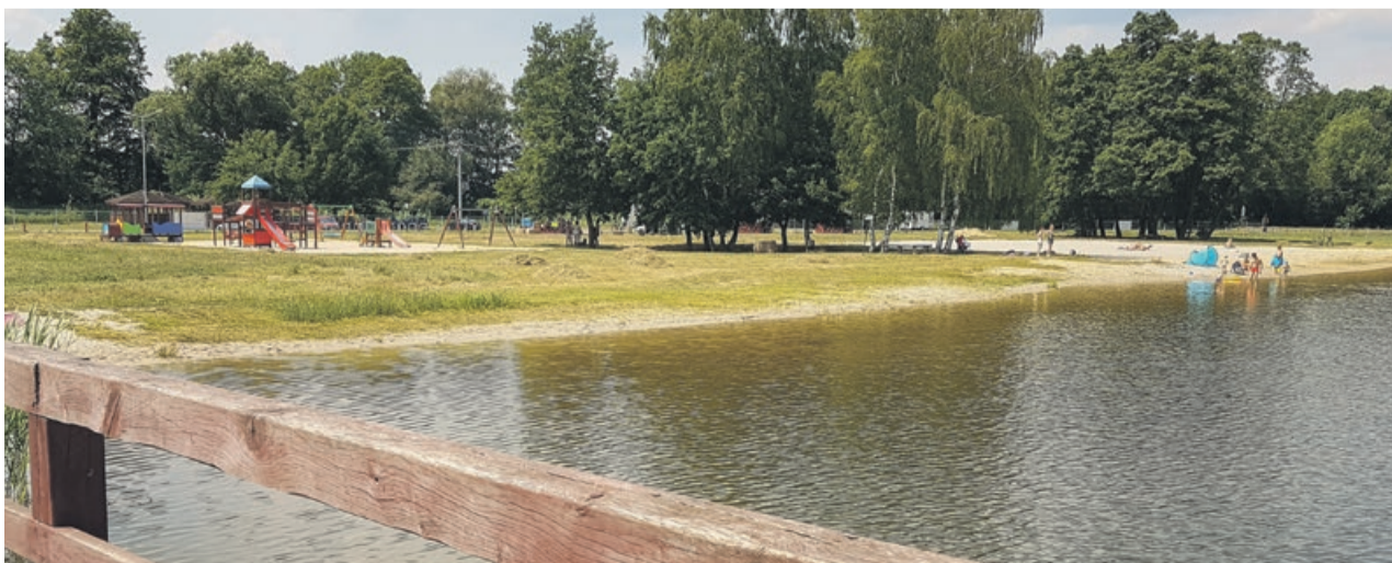
Okoliczni mieszkańcy korzystają z uroków zalewu również poza sezonem

Sezon na Nowińcu potrwa do 8 sierpnia. Po tym terminie korzystanie z zalewu będzie możliwe, ale już tylko na własną odpowiedzialność. ATB