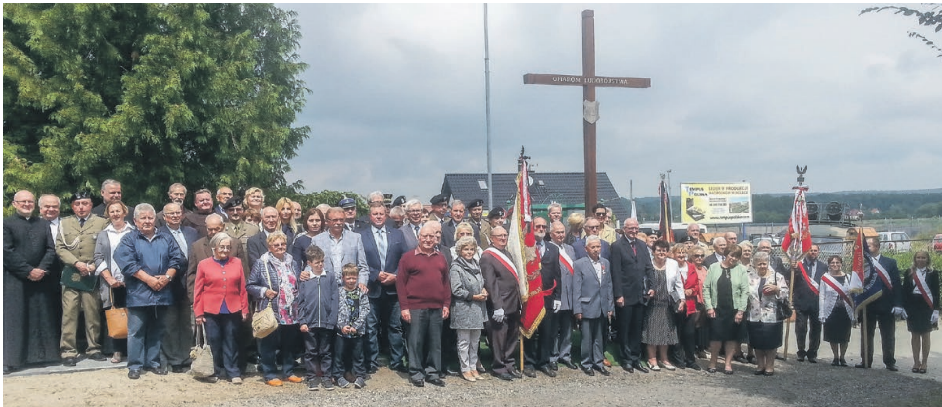
Pamięć o pomordowanych Polakach przetrwa dzięki zaangażowaniu wszystkich ludzi dobrej woli