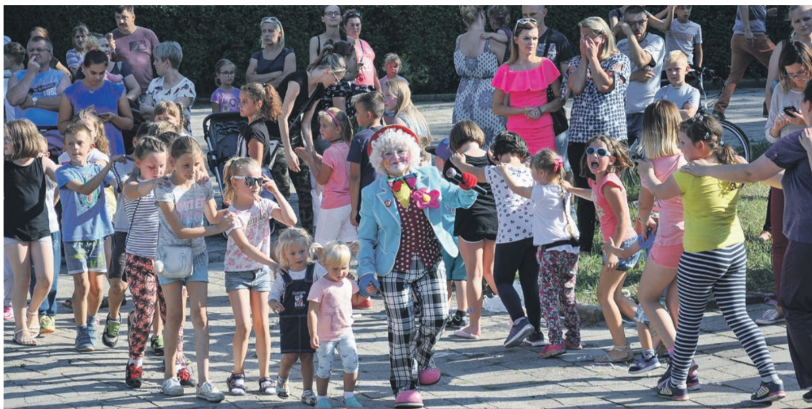
Lewa, lewa! A rodzice niech patrz!

Duet klaunów, oprócz śpiewów i tańców, zaprezentował dzieciom i ich rodzicom dymy pirotechniczne, kolorowe konfetti i animacje z użyciem baniek mydlanych. Maluchy zmagaly się również w konkursach, a ich włosy ozdobiły barwne farby i brokat. Nie zabrakło też innych atrakcji - były dmuchańce, popcorn, zaplatanie włosów i zajęcia plastyczne. Mieszkańcy Lubka mogli też po raz pierwszy skorzystać z nowych leżaków w strefie chillu. PAS