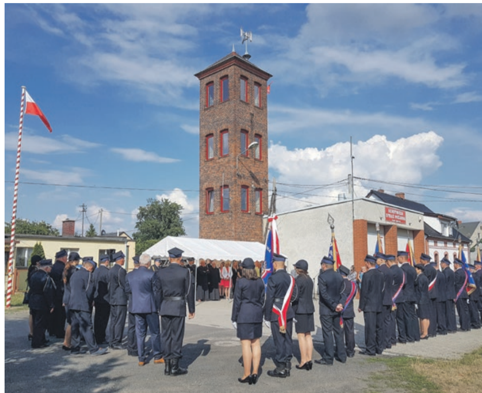
Kunicka remiza przy ul. Strażackiej