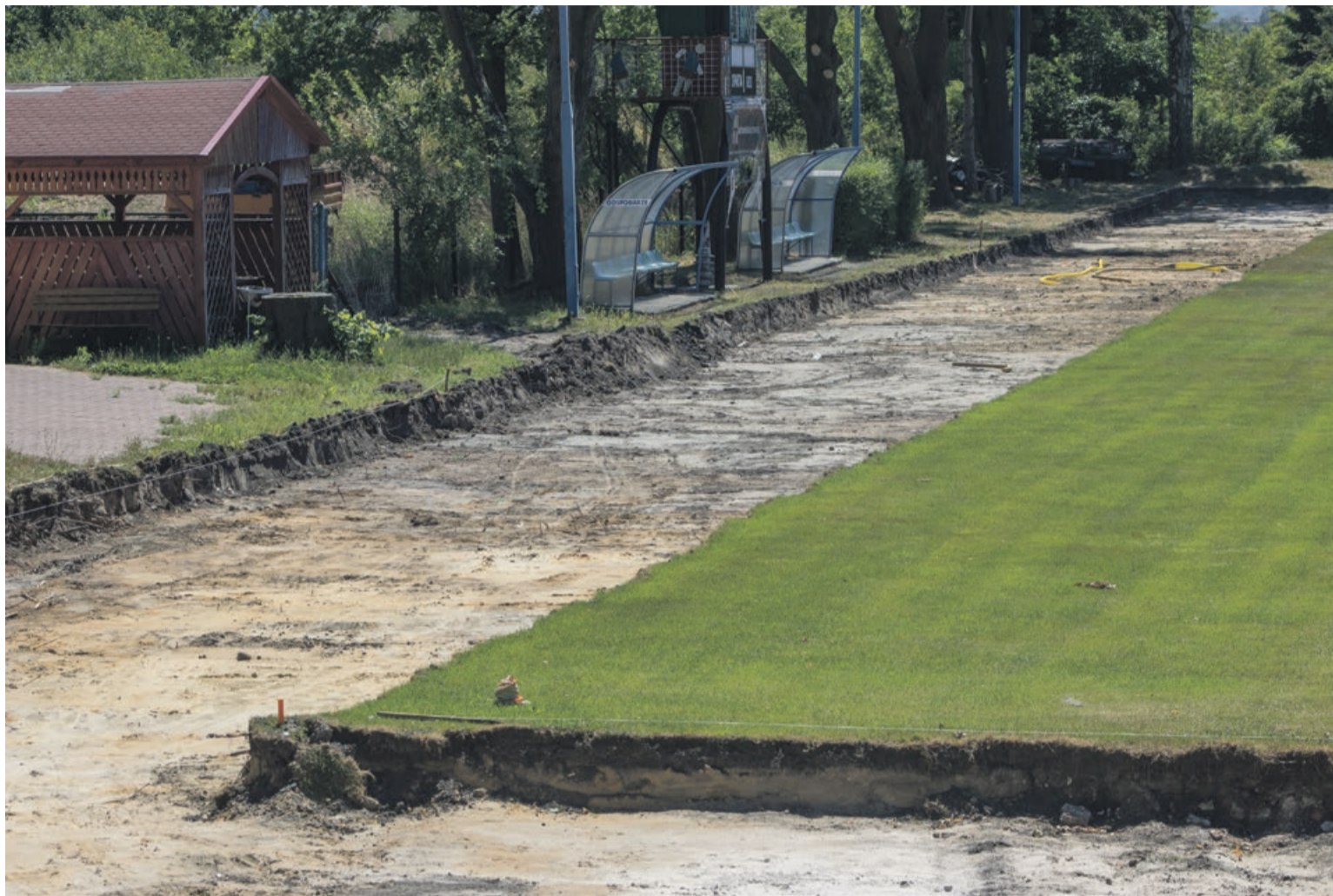
Boisko Sparty Grabik nabierze też trochę lekkoatletycznego charakteru

Wokół boiska klubu piłkarskiego Sparta Grabik trwają prace przy budowie sztucznej nawierzchni do uprawiania konkurencji lekkoatletycznych, takich jak biegi na 60 i 100 metrów, skok w dal, skok wzwyż i pchnięcie kulą. Bieżnia nie otrzyma certyfikatu zgodnego z polskimi normami, bo odpowiednio zakrzywienia łuków wy-