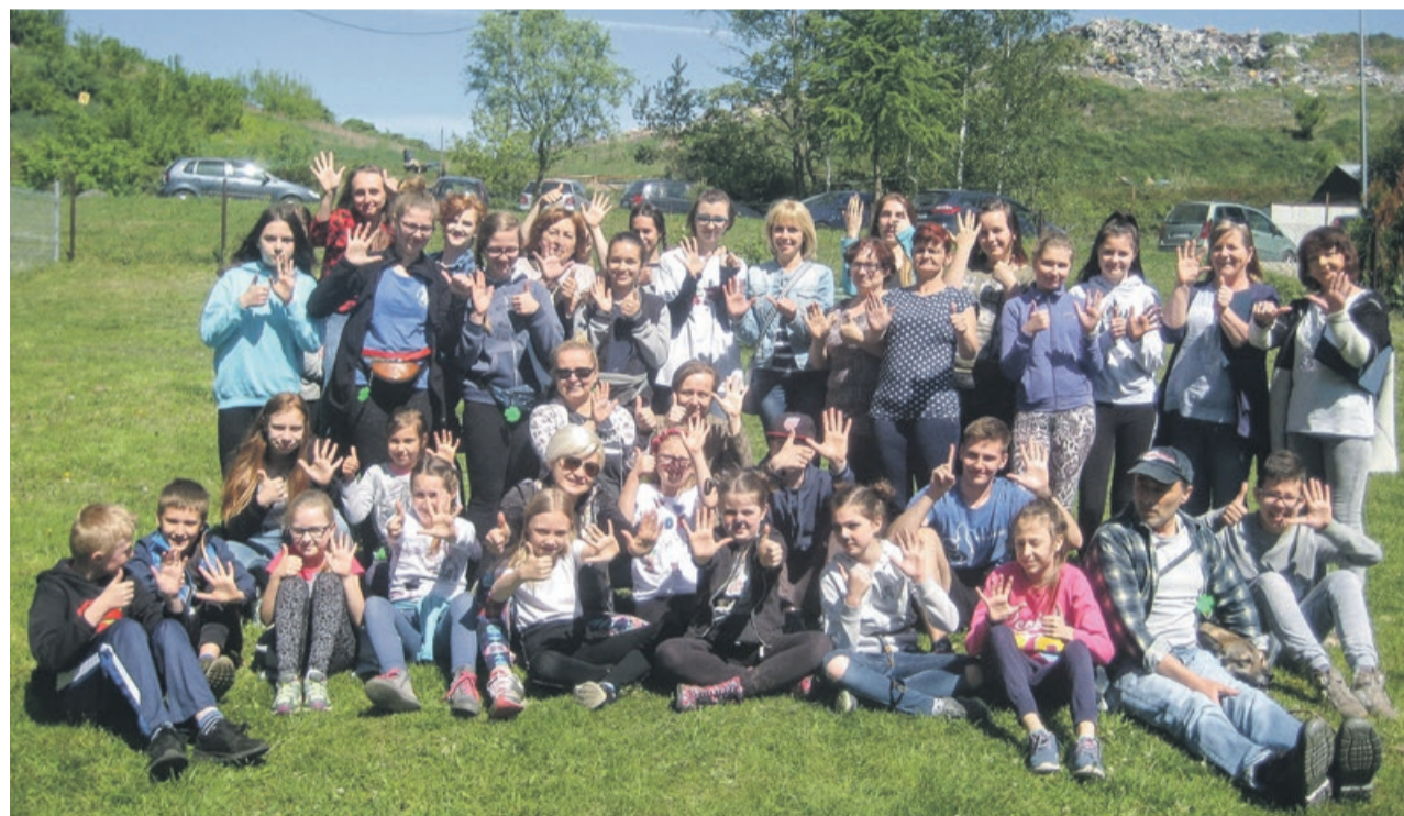
Członkowie, wolontariusze i sympatycy Żarskiego Stowarzyszenia Ochrony Zwierząt „APORT” mogą czuć satysfakcję - pomysł budowy kociarni jest na prostej drodze do realizacji

Trzeba było się zmobilizować, zorganizować, włożyć w to sporo wysiłku. Do ludzi trzeba dojść, tłumaczyć, zachęcić. Dziękuję wszystkim, którzy zbierali podpisy i nas wsparli. Wygrała pasja, serce i zaangażowanie. Nasuwają się słowa piosenki Czesława Niemena: „ludzi dobrej woli jest więcej”. Dziesięć lat minęło od budowy schroniska. Nie pomyślano wówczas o kociarni, wszystko jest zrobione dla psów. A przecież koty też chorują, też się gubią. Jak się odnajdą, to muszą gdzieś poczekać na właściciela. Jak wykonuje się sterylizację kotów bezdomnych, to też muszą po operacji dwa, trzy dni gdzieś pomieszkać. Schronisko zaadaptowało wprawdzie małe pomieszczenie, ale mieszkają tam stare koty z młodymi, chore ze zdrowymi. Koty są niezwykle wrażliwe na choroby, czasem padają, nawet po kilka dni. W pomieszczeniu jest też lodówka ze zwłokami zwierząt, czekającymi na utylizację. Kilka lat temu w Zielonej Górze miejscowe stowarzyszenie napisało w Budżecie Obywatelskim projekt i wygrało. Myślimy się tym zasugerowali. Nie mogliśmy patrzeć, jak to wygląda w Żarach. To przecież jest partyzantka. Do budynku głównego żarskiego schroniska zostanie dobudowana kolejna część z przeznaczeniem dla kotów z podziałem na osobne pomieszczenia dla chorych i zdrowych, zgubionych, młodych i starych. Dopilnujemy teraz, żeby wszystko zostało porządnie zbudowane.