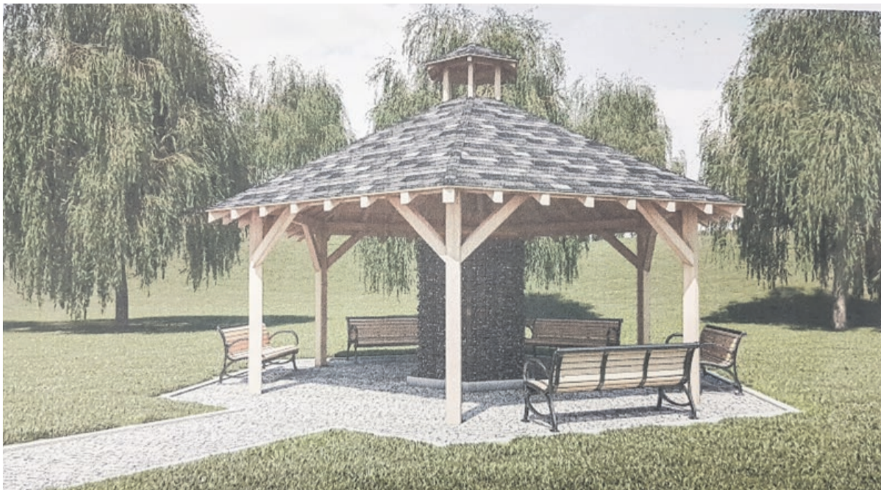
Podobnie będzie wyglądała tężnia, która stanie w Żarach