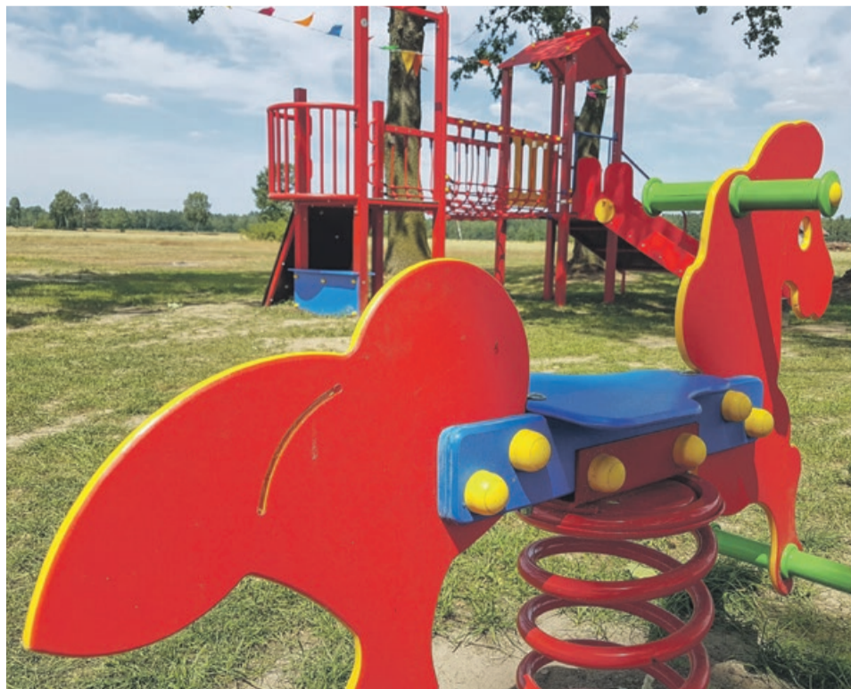
Atrakcje dla najmłodszych w Złotniku