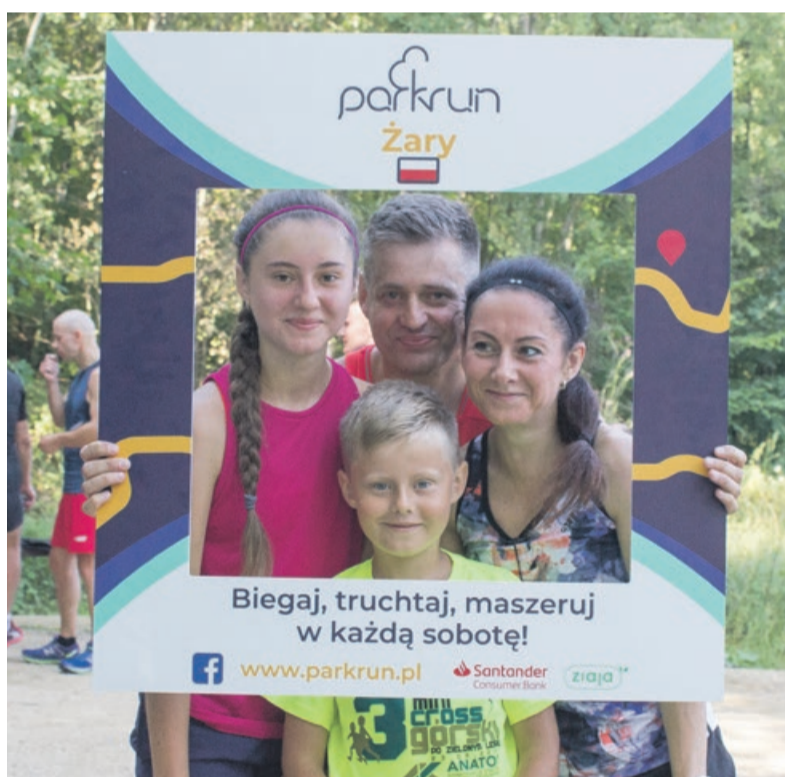
Wspólnie spędzony sobotni poranek w Zielonym Lesie