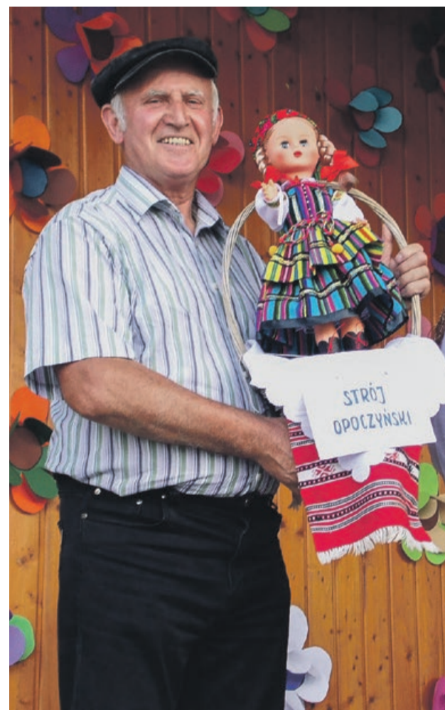
Piękne stroje można zaprezentować i w taki sposób