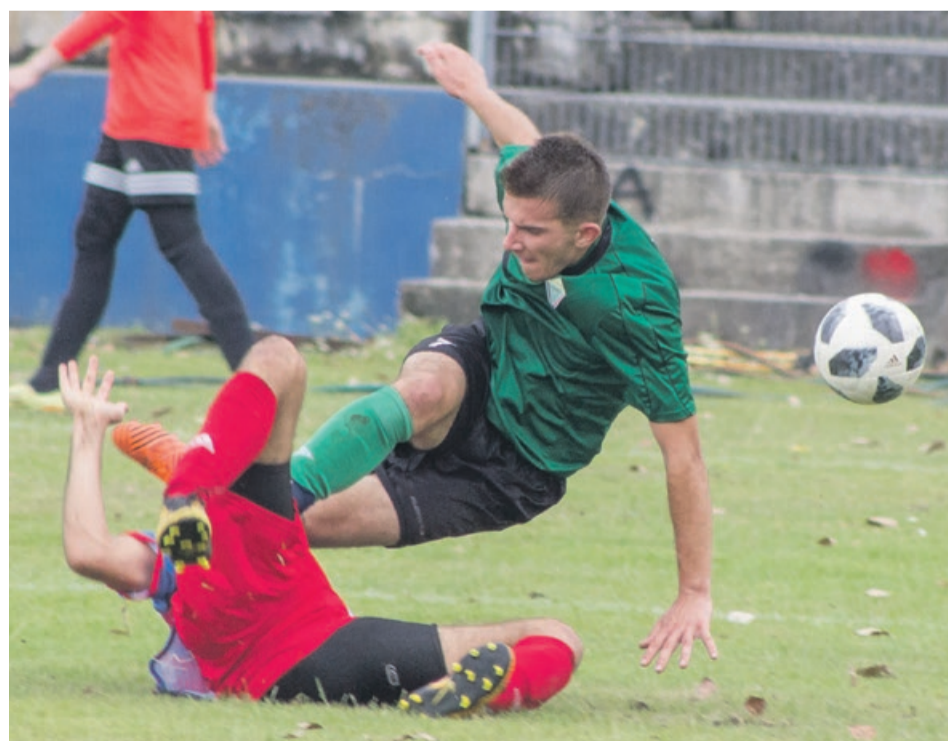
Migawka z żarskiego boiska