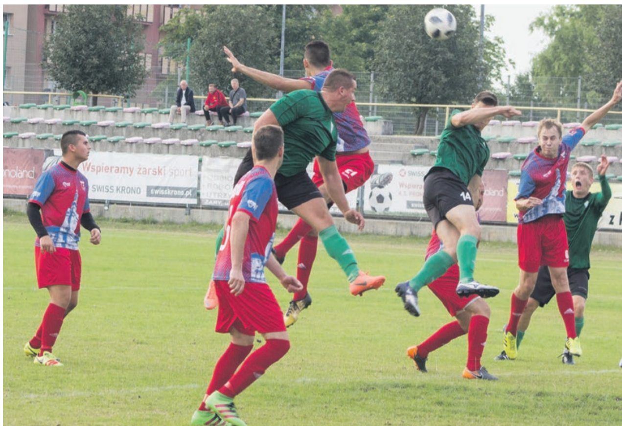
Promień wygrywa ze Szprotawą 1:0