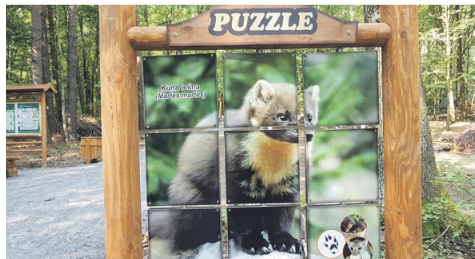
Obrazek kuni leśnej, przedstawiony na stronie TiM jako bubel, nie został w międzyczasie naprawiony. Jest po prostu ułożony z odpowiedniej strony