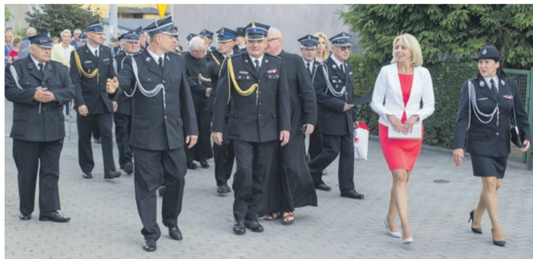
Do Kunic przyjechało wielu zaproszonych gości