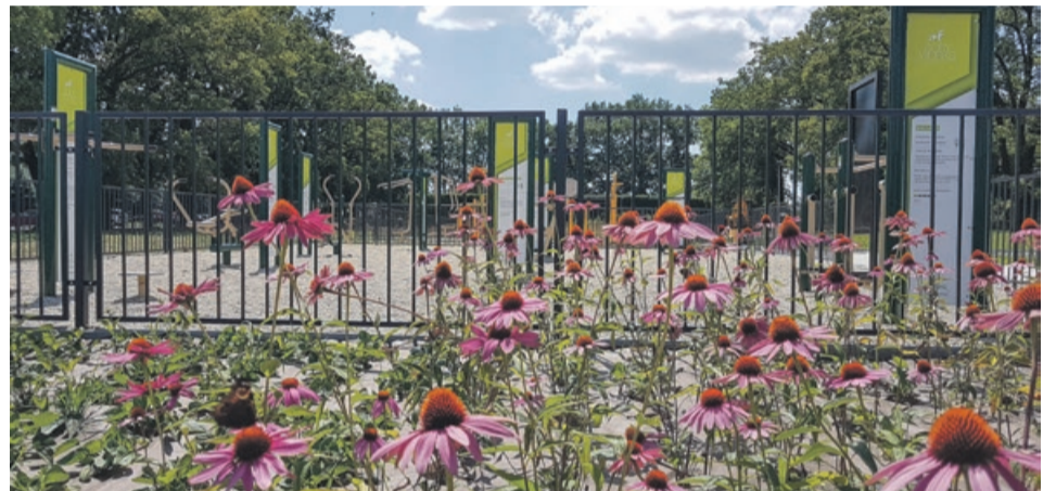
Pojawiło się wiele nowych drzew, krzewów i kwiatów