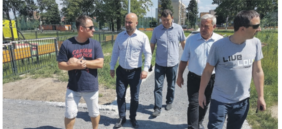
Omówiono sprawy organizacyjne przed wielkim otwarciem