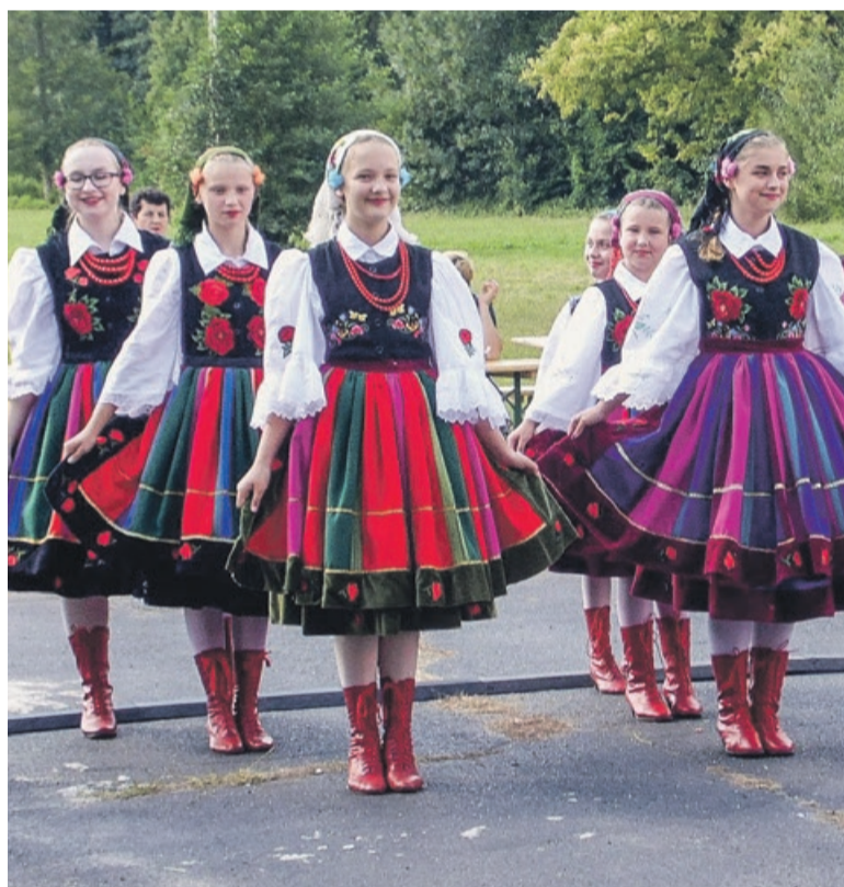
Kolorowe stroje dziewcząt z „Małej Tęczy” budziły zachwyty