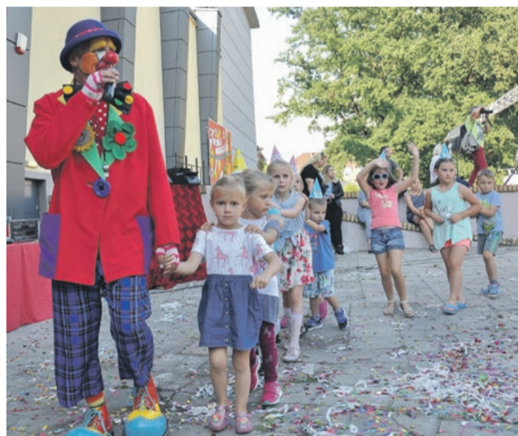
Za mną marsz! Konfetti i brokat już pod nogami