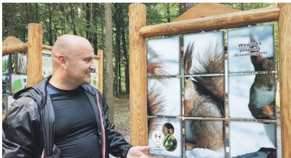
Jednak układanki z wiewiórką nie da się dobrze poskładać, jeśli przejdziemy na drugą stronę tej samej tablicy