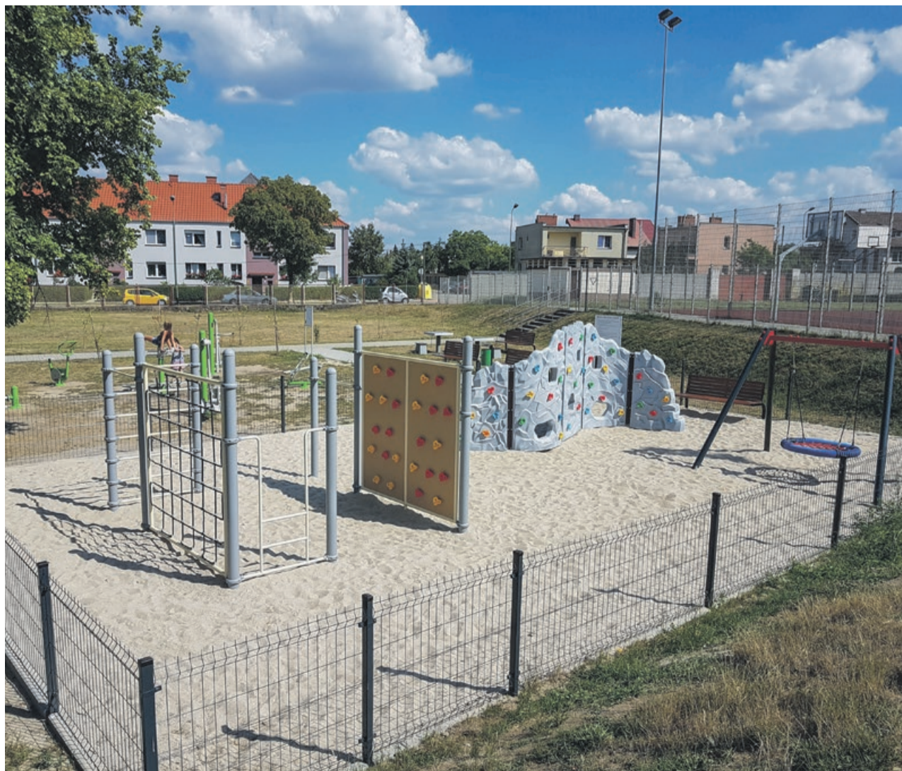
Nowy teren rekreacyjny jest już dostępny dla mieszkańców. Tam też stanie tężnia solankowa

chowych, a nawet przy ogólnym wyczerpaniu organizmu. Jak podają producenci tego typu tężni, oddychanie przez godzinę powietrzem nasyconym mikroelementami z solanki, odpowiada trzem dniom spędzonym nad morzem.