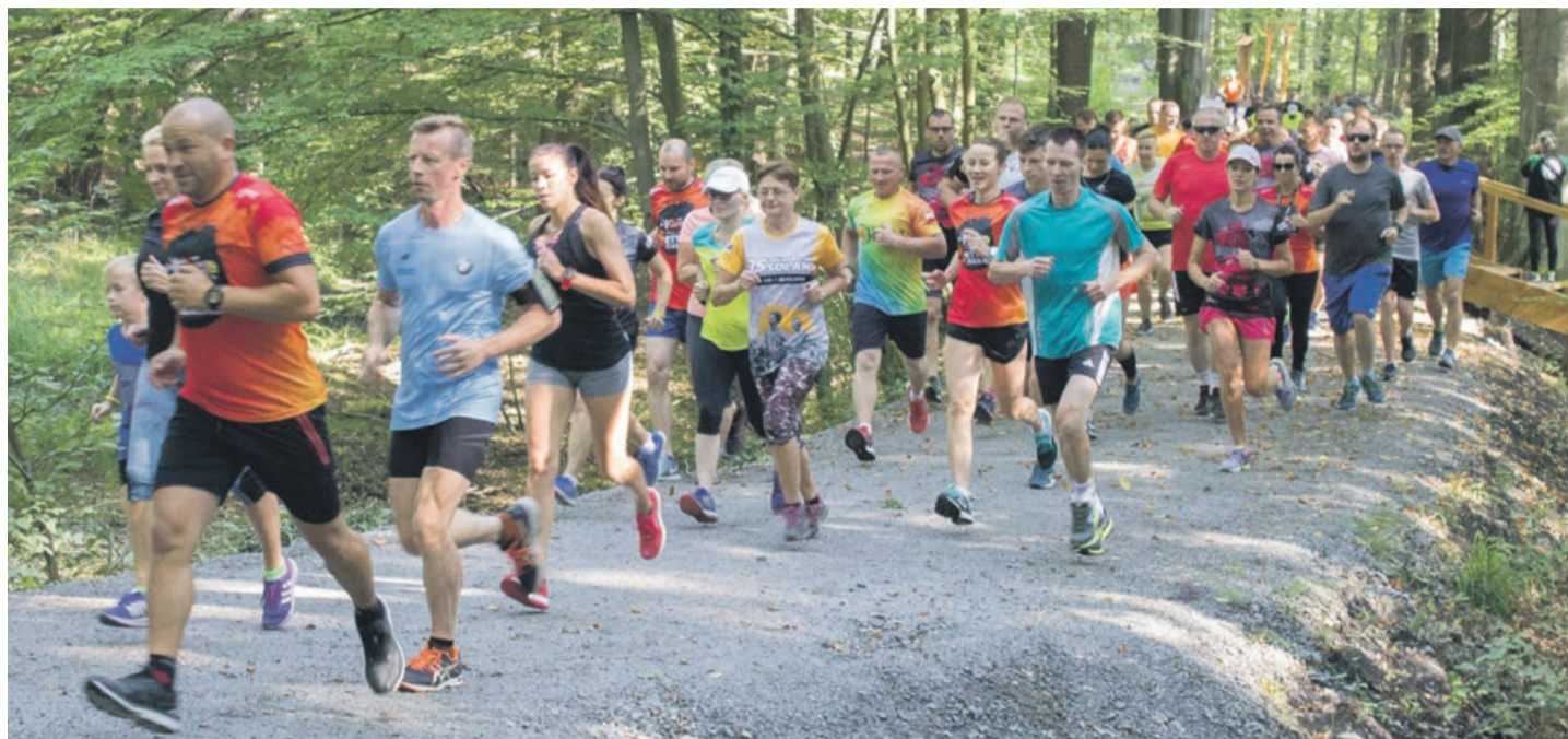
Jubileuszowy start