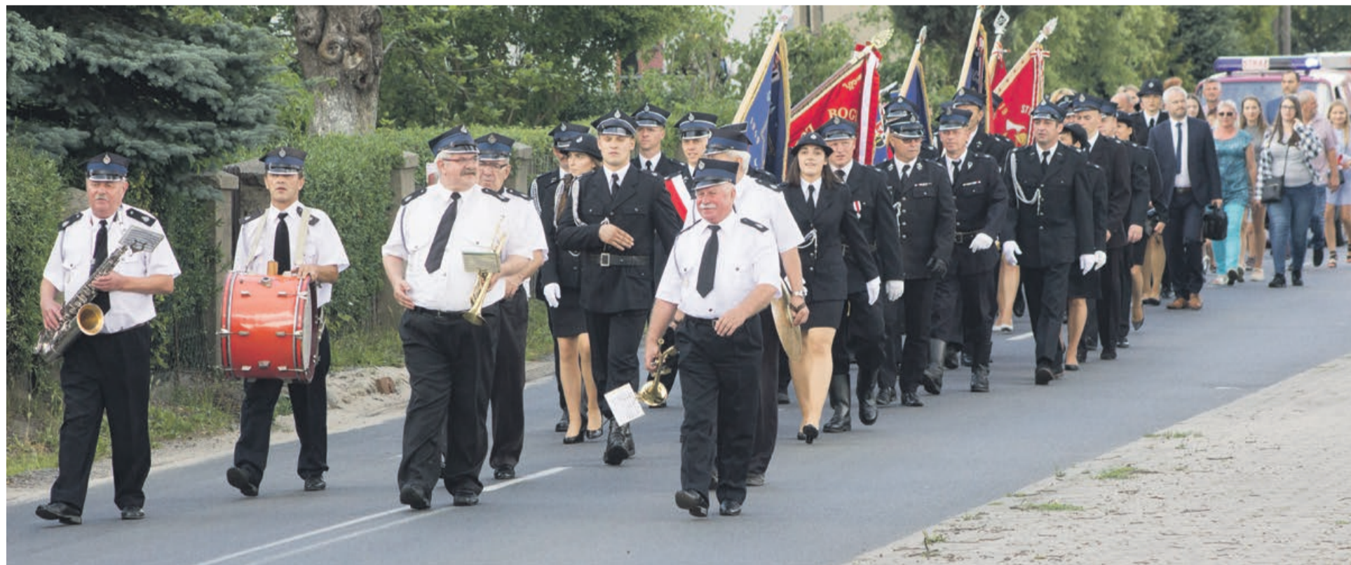
Strażacy dumnie przemaszerowali ulicami Kunic