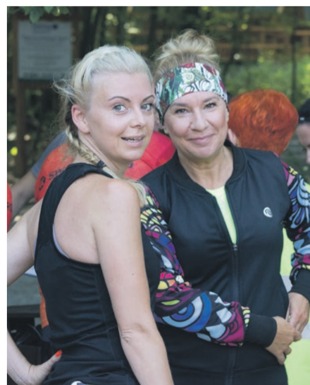
Dobry nastrój przed biegiem, ale i na mecie