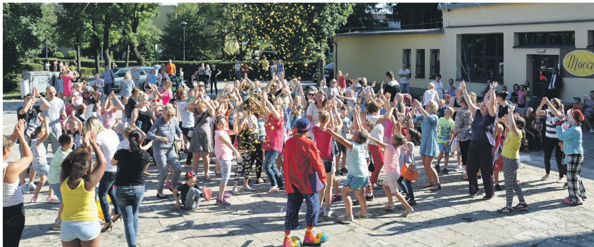
Wszyscy razem, na całego