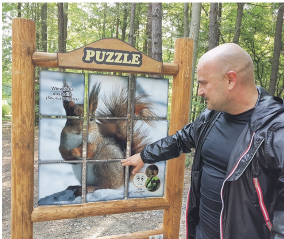
Wiceburmistrz demonstruje, że wiewiórkę rzeczywiście można ułożyć