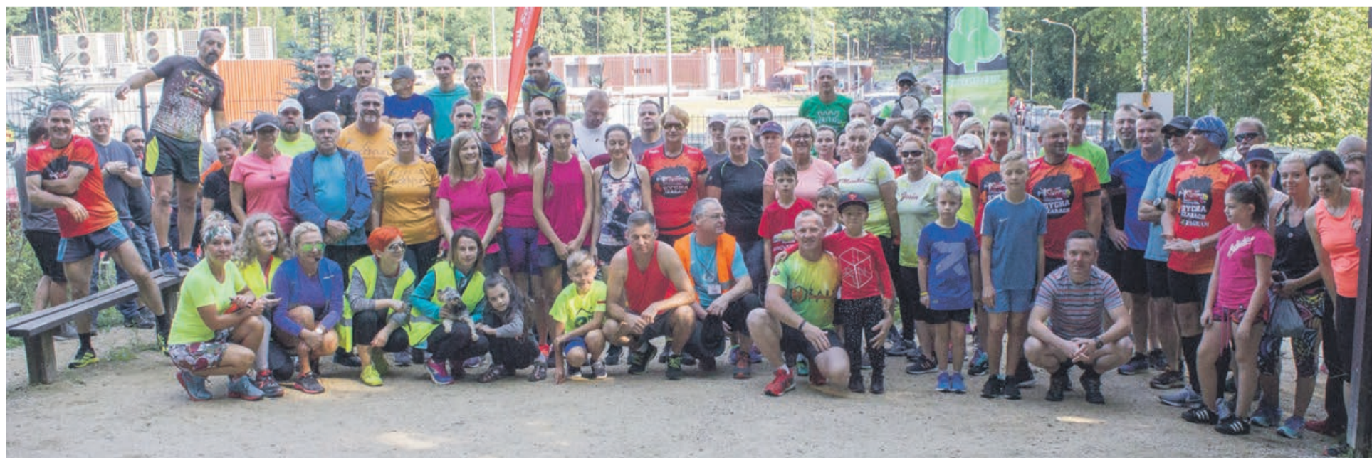
250. żarski parkrun zgromadził przeszło stu biegaczy