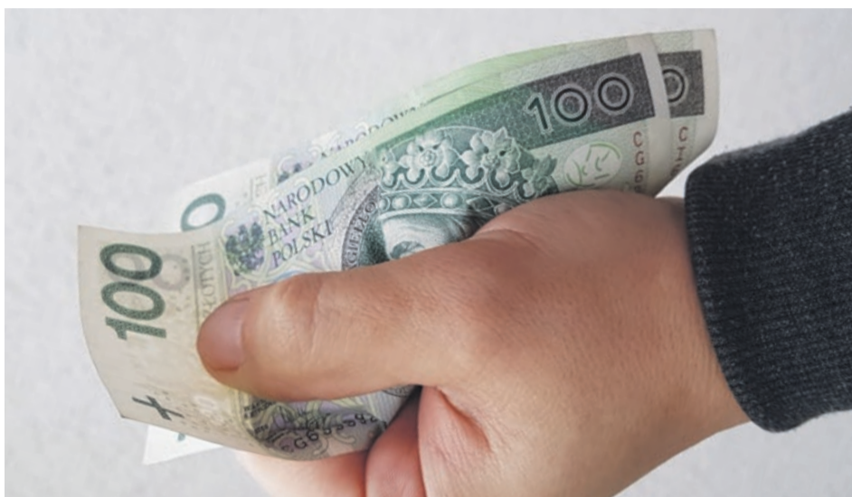
Finansowanie działań związanych z zapobieganiem wypadkom przy pracy i chorobom zawodowym to ustawy obowiązek ZUS. Dofinansowane mogą być te działania płatników, które dążą do utrzymania zdolności do pracy osób zatrudnionych przez cały czas ich aktywności zawodowej

padku procent dofinansowania będzie największy. Firmy zatrudniające od 1 do 9 osób mogą otrzymać 90 proc. dofinansowania, przedsiębiorstwa które zatrudniają od 10 do 49 pracowników nie więcej niż 80 proc., zatrudniający od 50 do 249 – maksymalnie 60 proc., a duże firmy mogą otrzymać dofinansowanie w wysokości 20 proc. Należy pamiętać, że wnioski mogą składać jedynie pracodawcy, którzy nie zalegają z opłatą składek na ubezpieczenia społeczne i zdrowotne, opłatą podatków oraz nie znajdują się w stanie upadłości, pod zarządem komisyjnym, w toku likwidacji lub postępowania układowego z wierzycielem. Merytoryczną oceną wniosków zajmie się Centralny Instytut Ochrony Pracy – Państwowy Instytut Badawczy, który będzie także odpowiedzialny za