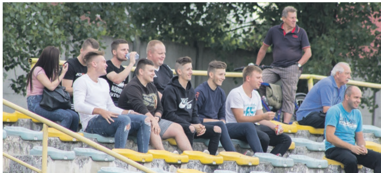
Kibice obserwują przygotowania do sezonu