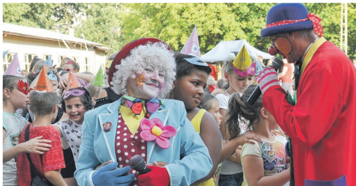
Z uśmiechem na twarzach