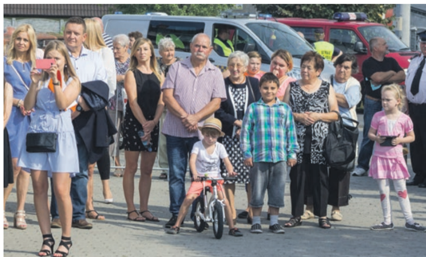
Przebiegowi uroczystości przyglądali się mieszkańcy