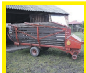
Przyczepa samozbiierająca, rok 2001, Tel. 699-932-056

◆ Psychoterapia, bioenergoterapia, kartomancja. Tel. 57 607 83 03