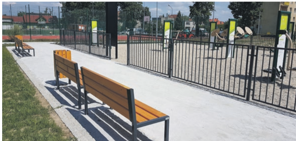
Alejki wyglądają estetycznie