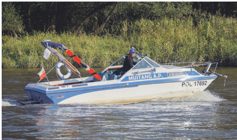
Łodzie to jakby też motoryzacja

może mam inną wyobraźnię, niż wszyscy (śmiech).