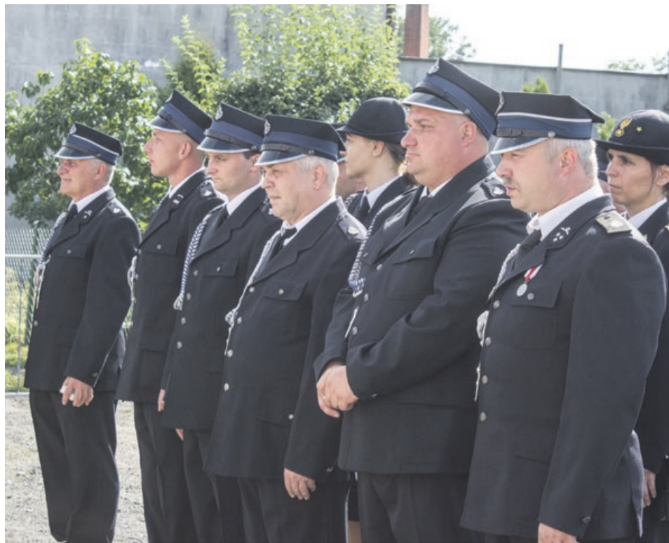
Dla strażaków to wyjątkowa chwila