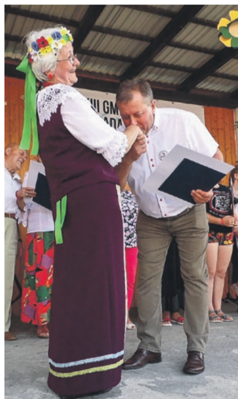
Wójt docenił wykonawców