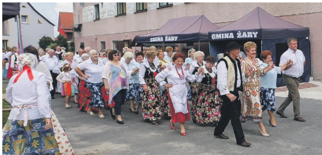
Biesiadowanie uczestnicy rozpoczęli Polonezem

Jury po wysłuchaniu wszystkich wykonawców przyznało: