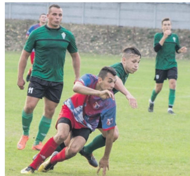
Nie odpuścić żadnej piłki