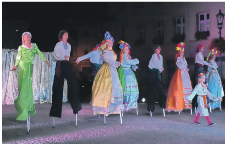
Kijowski Teatr Uliczny Highlights zrobił furorę wśród publiczności. Barwne, pełne humoru i energii widowisko bardzo się podobało