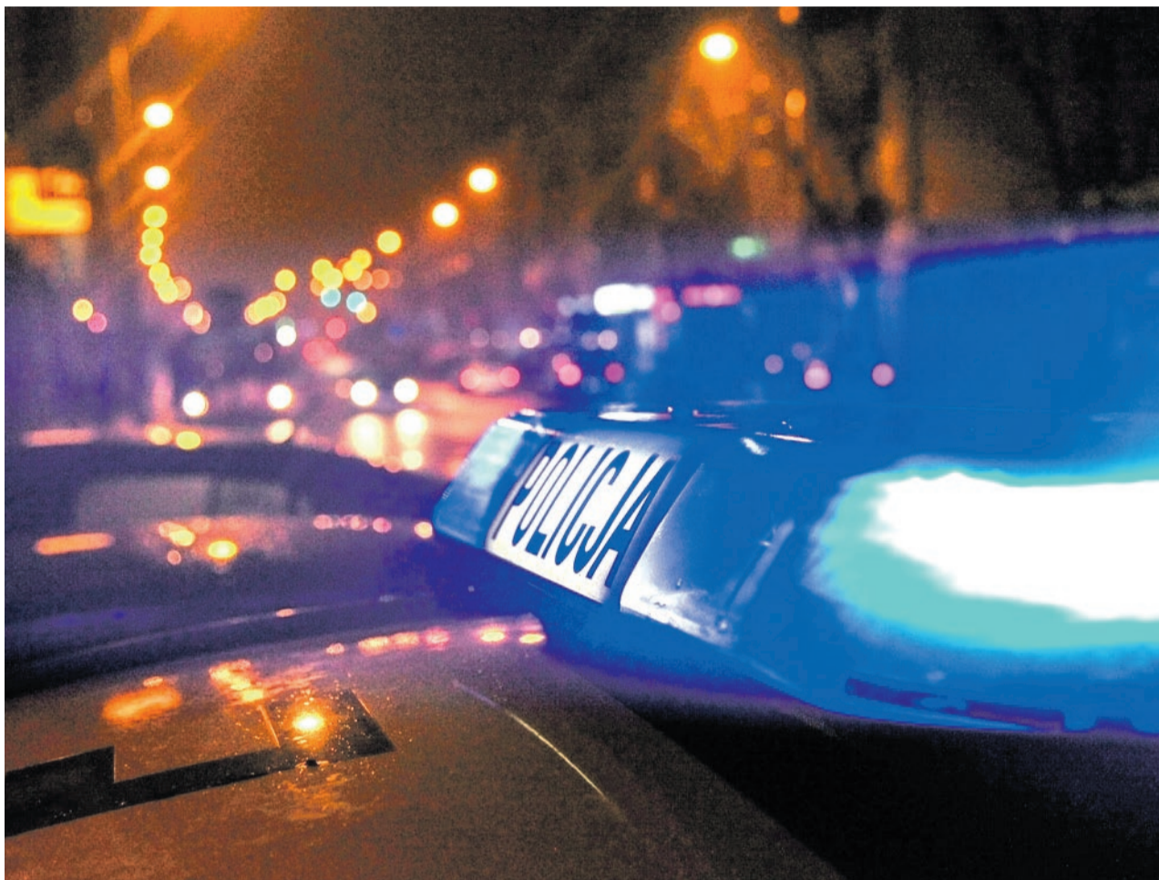
Trwają czynności zmierzające do ustalenia sprawcy

Do wypadku drogowego doszło około godziny 4:40 w miejscowości Budziechów. Pieszy, 45 - letni mężczyzna, mieszkaniec Jasienia, w towarzystwie innego mężczyzny wracał pieszo z Lubsku do Jasienia. Przechodząc przez jezdnię w niedozwolonym miejscu, został potrącony przez samochód. Kierowca nie zatrzymał się i nie udzielił pomocy poszkodowanemu. Odjechał w kierunku Lubsku. Na miejsce przyjechało pogotowie ra-