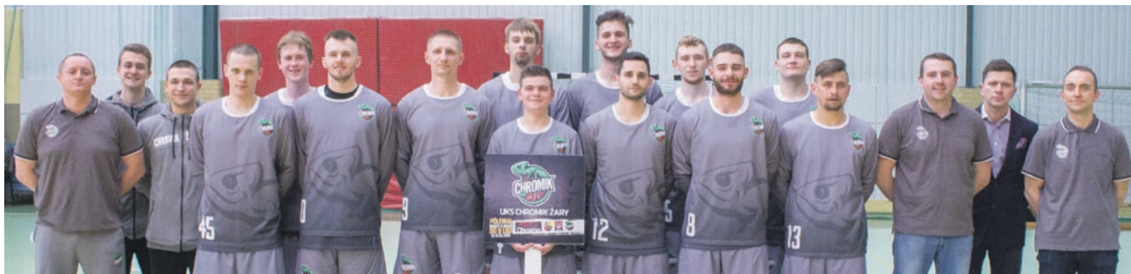
Ta ekipa wywalczyła awans Chromika Żary do II ligi

Za nieco ponad miesiąc zobaczymy w Żarach pierwszy mecz, w którym przeciwnikiem gospodarzy będzie drużyna z Jeleniej Góry. Dziś publikujemy koszykarski rozkład jazdy na nadchodzący sezon. Kibice już mogą planować sobie czas na mecze. ATB