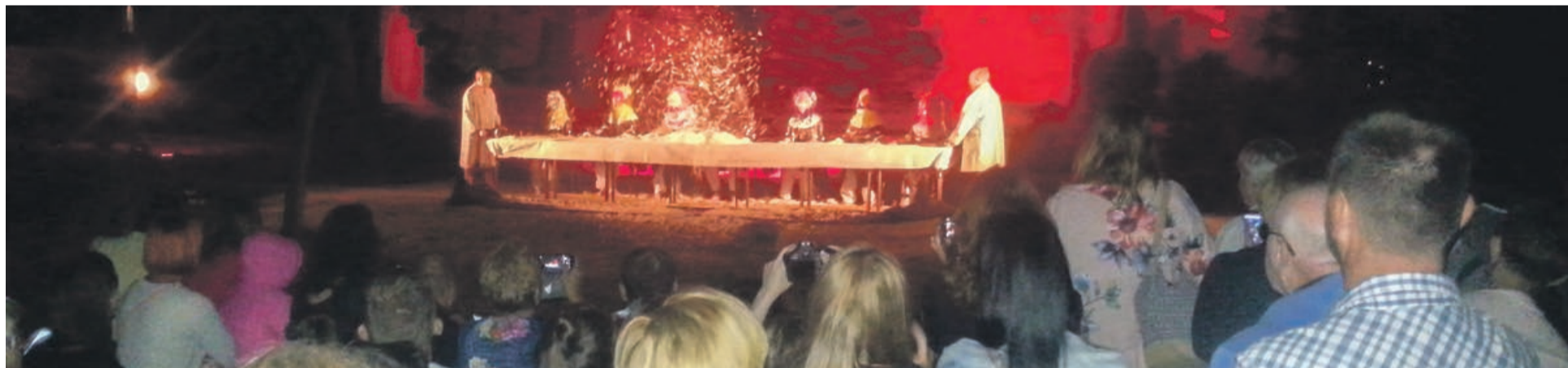
Magia kolorów, muzyka, scenografia