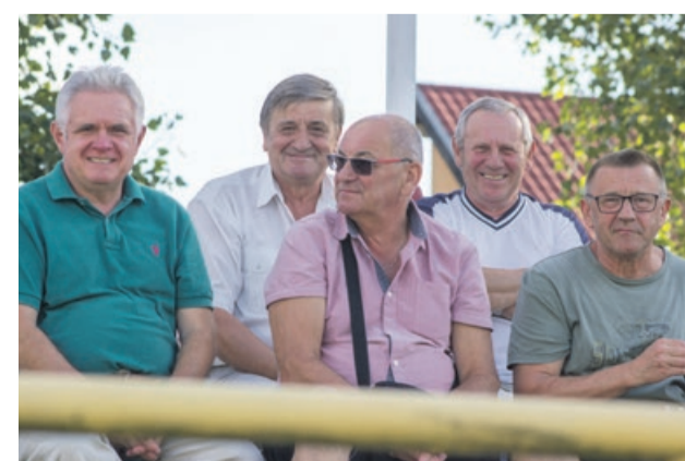
Drużyna wygrywa - kibice zadowoleni