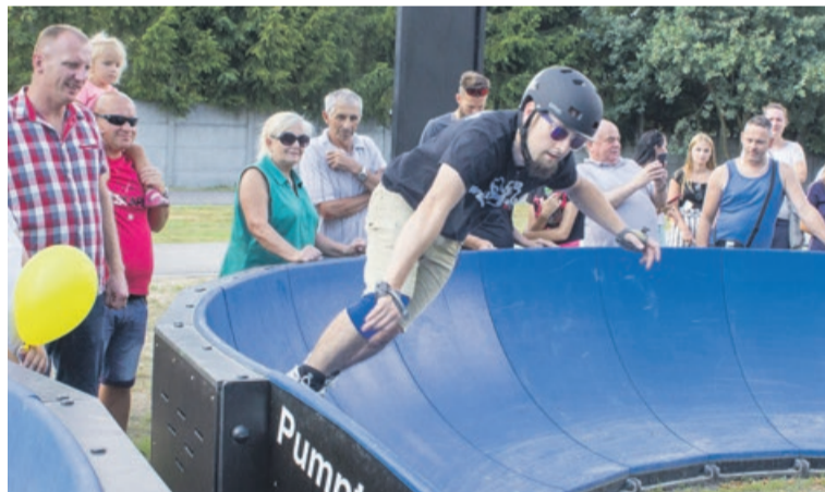
Jazda dla zaawansowanych