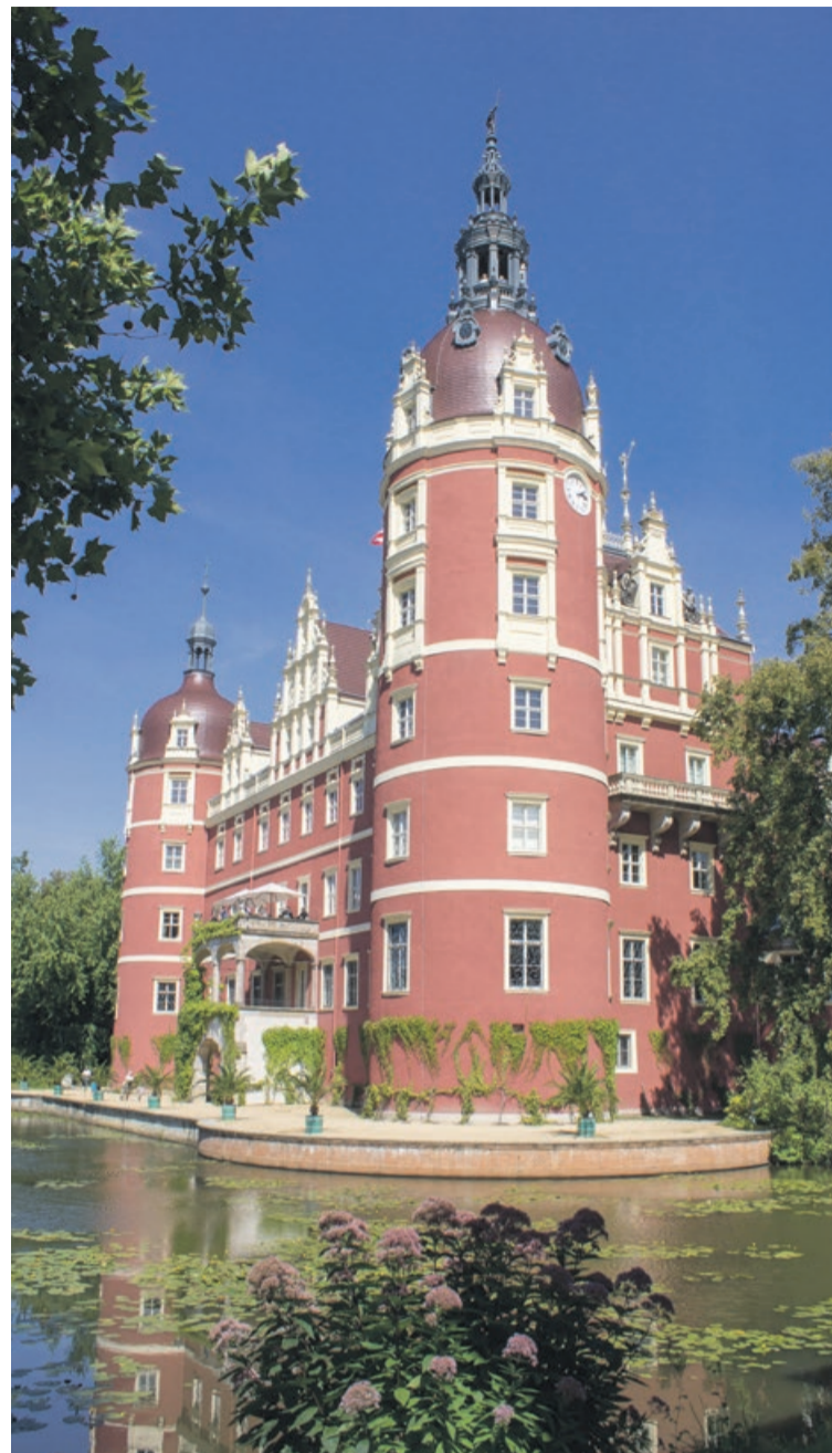
Setki tysięcy turystów z całego świata odwiedzają co roku Park Mużakowski po polskiej i niemieckiej stronie Nisy Łużyckiej

Ale nie ma co narzekać. Problemy są po to, aby je rozwiązywać, więc się z nimi uporam. ATB