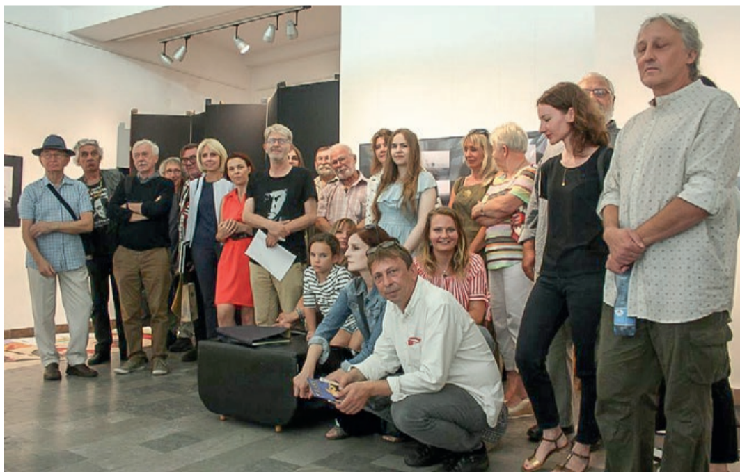
Kilkudniowe plenery plastyczne zakończyły się podsumowaniem w Salonie Wystaw Artystycznych