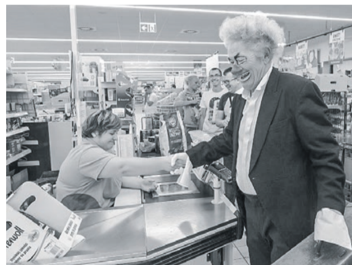
Klowna Koncept przez dwa dni chodził po ulicach miasta, spotykając się z mieszkańcami