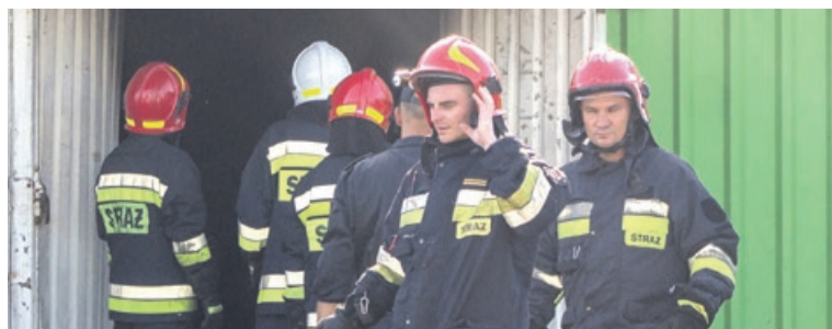
Działania trwały 15 godzin

Spytaliśmy o potwierdzenie powyższego Policję. Zostaliśmy odesłani do rzecznika Prokuratury, który nie potwierdził informacji, odsyłając nas jedynie do lakonicznego komunikatu, wydane go przez Prokuraturę. PAS