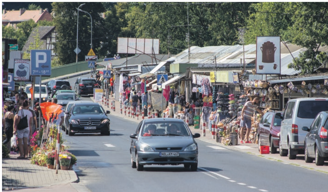
Łęknicki bazar nadal funkcjonuje, choć już nie z takim rozmachem, jak przed laty