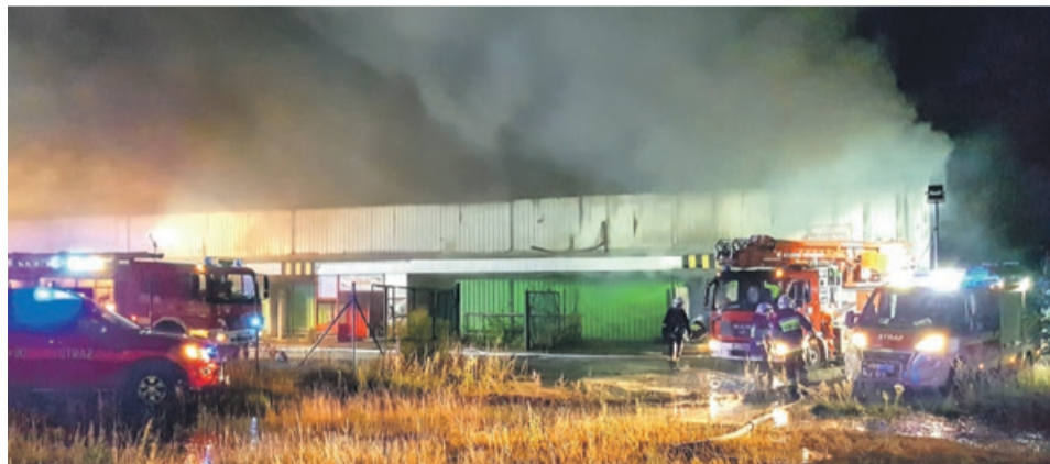
Duże zadymienie utrudniało akcję gaśniczą