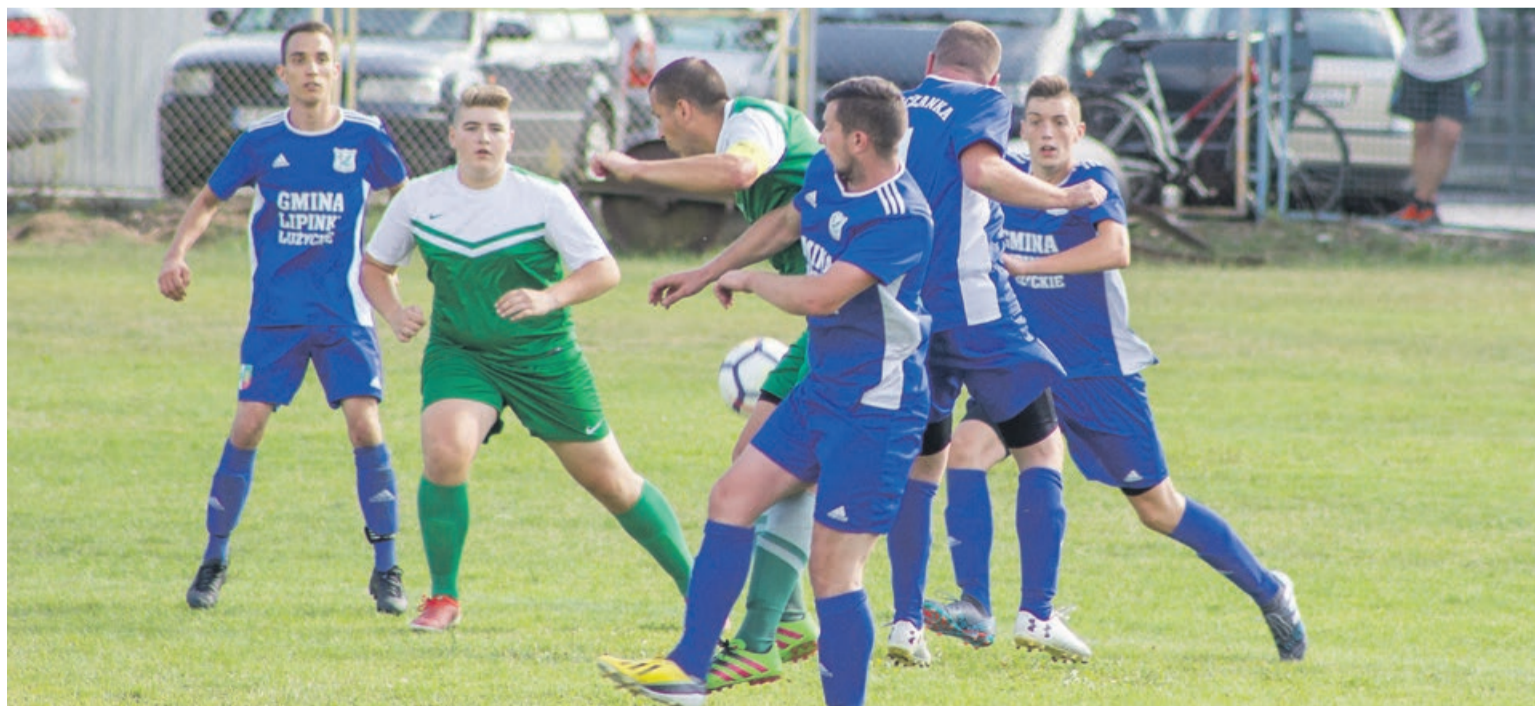
W Lipinkach lepszy był Grabik

Piłkarze z Grabika mecz ten wygrali z wysokim prowadzeniem 6:1, czym udowodnili, że klasa A im nie straszna. Wprawdzie jedna jaskółka wiosny nie czyni, niemniej jednak poczynania Sparty w rundzie jesiennej mogą być interesujące. ATB