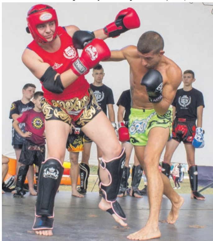
Pokaz sztuk walki w wykonaniu utytułowanych zawodników Żarskiego Klubu Sportów Walki