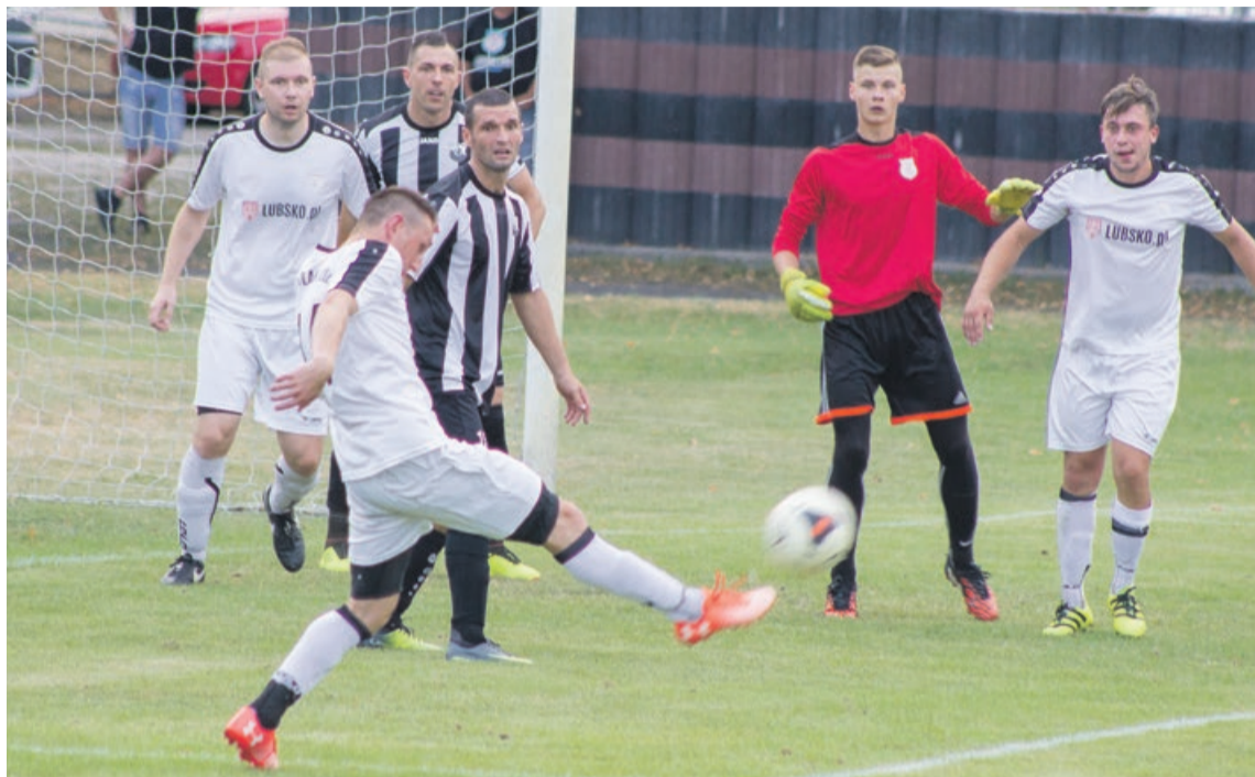
Druga połowa rozgrywała się praktycznie pod bramką Budowlanych

W najbliższą sobotę Budowlani jadą do Małomicy na mecz z miejscową Iskrą. ATB