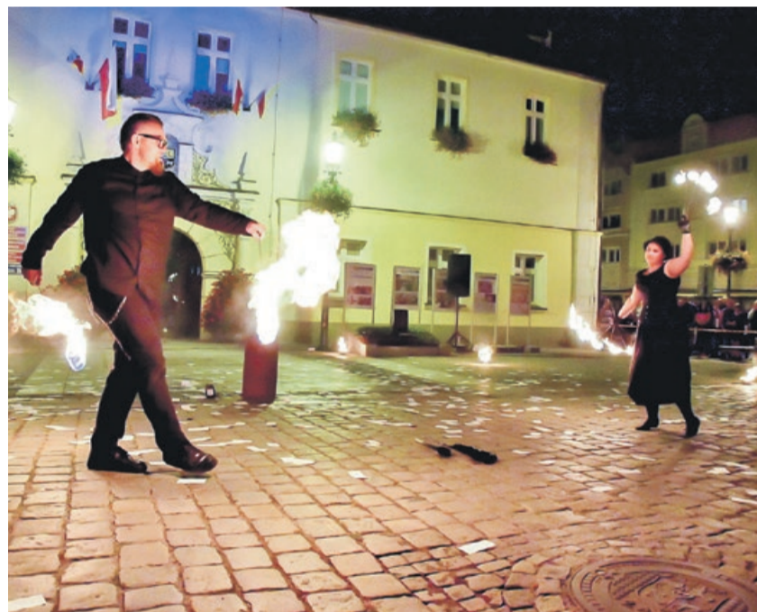
Żarska grupa Sarovia Art zaprezentowała się w nocnym przedstawieniu „Pozostał tylko ŻAR”