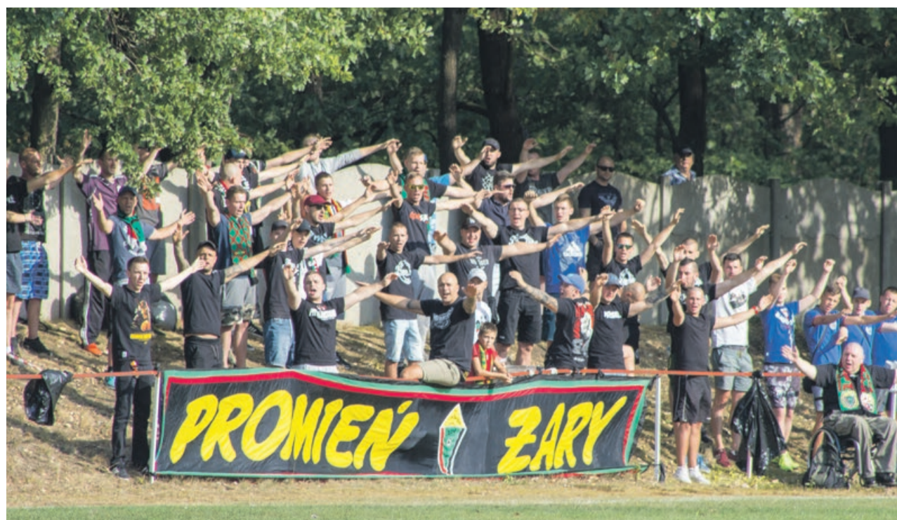
Zawsze głośny doping kibiców żarskiego Promienia