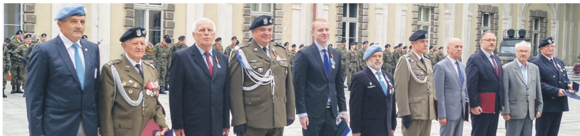
Uroczystość była okazją do wręczenia medali o odnaczeni