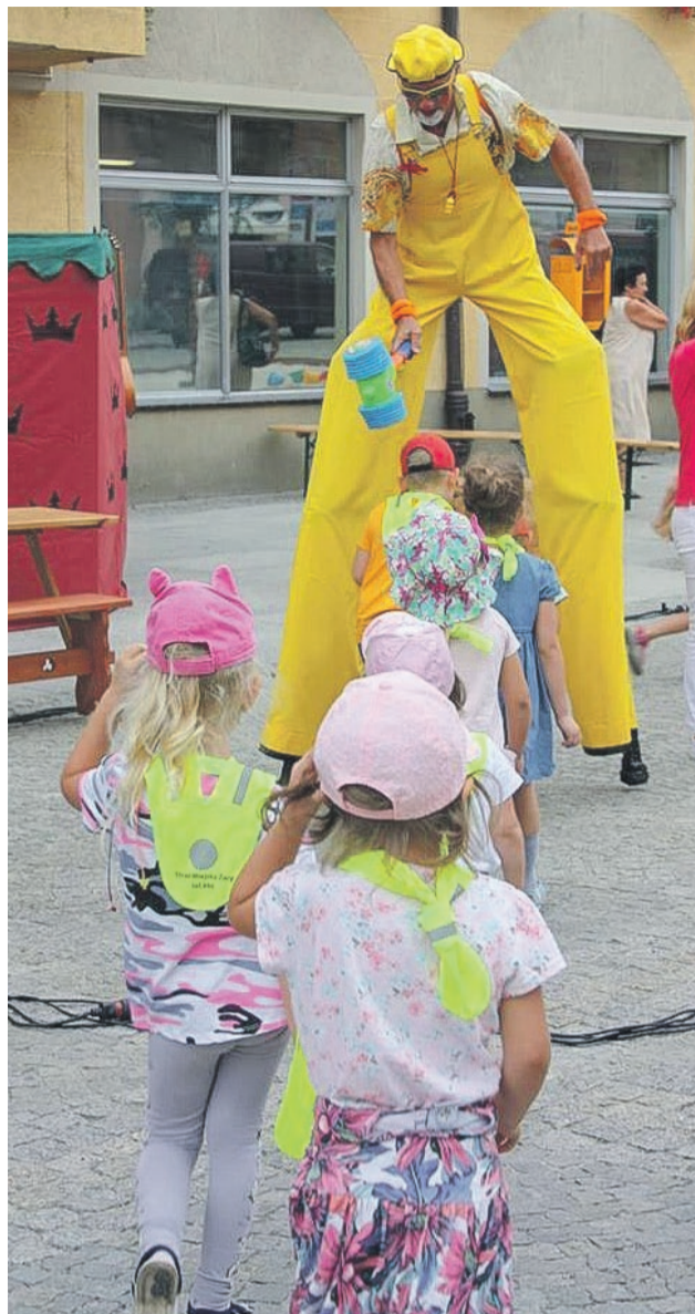
Dzieci miały dużą frajdę - przez trzy dni nie brakowało atrakcyjnego programu dla najmłodszych