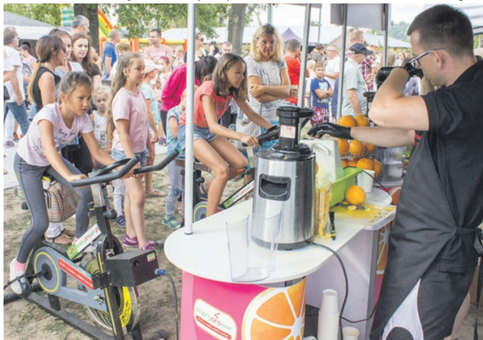
Można było się przekonać, jak wycisnąć sok jadąc na rowerze