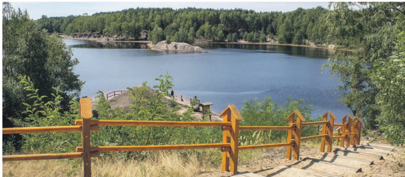
Geościeżka „Dawna kopalnia Babina”. Warto wybrać się tu na spacer lub rowerową wycieczkę

- Kolejna kwestia wynika z tego, o czym wspominałem wcześniej. Łęknica ma bardzo mały zasób terenów inwestycyjnych, które znajdują się obecnie w posiadaniu gminy. Bardzo znaczna część terenów gminnych została już sprzedana, a nowi właściciele tych gruntów nie za wiele z nimi robią. No cóż, mają do tego prawo. Jedynymi gruntami, na których gmina mogłaby zrealizować pewne inwestycje, jest teren po byłej hucie szkła, teren naprzeciwko szkoły podstawowej pomiędzy ulicami Wojska Polskiego i Nad Nysą oraz tereny przy ulicy Polnej, które obecnie są podzielone na działki pod zabudowę jednorodzinną. Te sprzedajemy je sukcesywnie. Są także działki pod budowę małego osiedla mieszkaniowego, składającego się - o ile dobrze pamiętam - z sześciu bloków. Wskazaliśmy ten teren przy ewentualnej budowie mieszkań w ramach programu Mieszkanie+ i czekamy na odpowiedź w tej sprawie. To