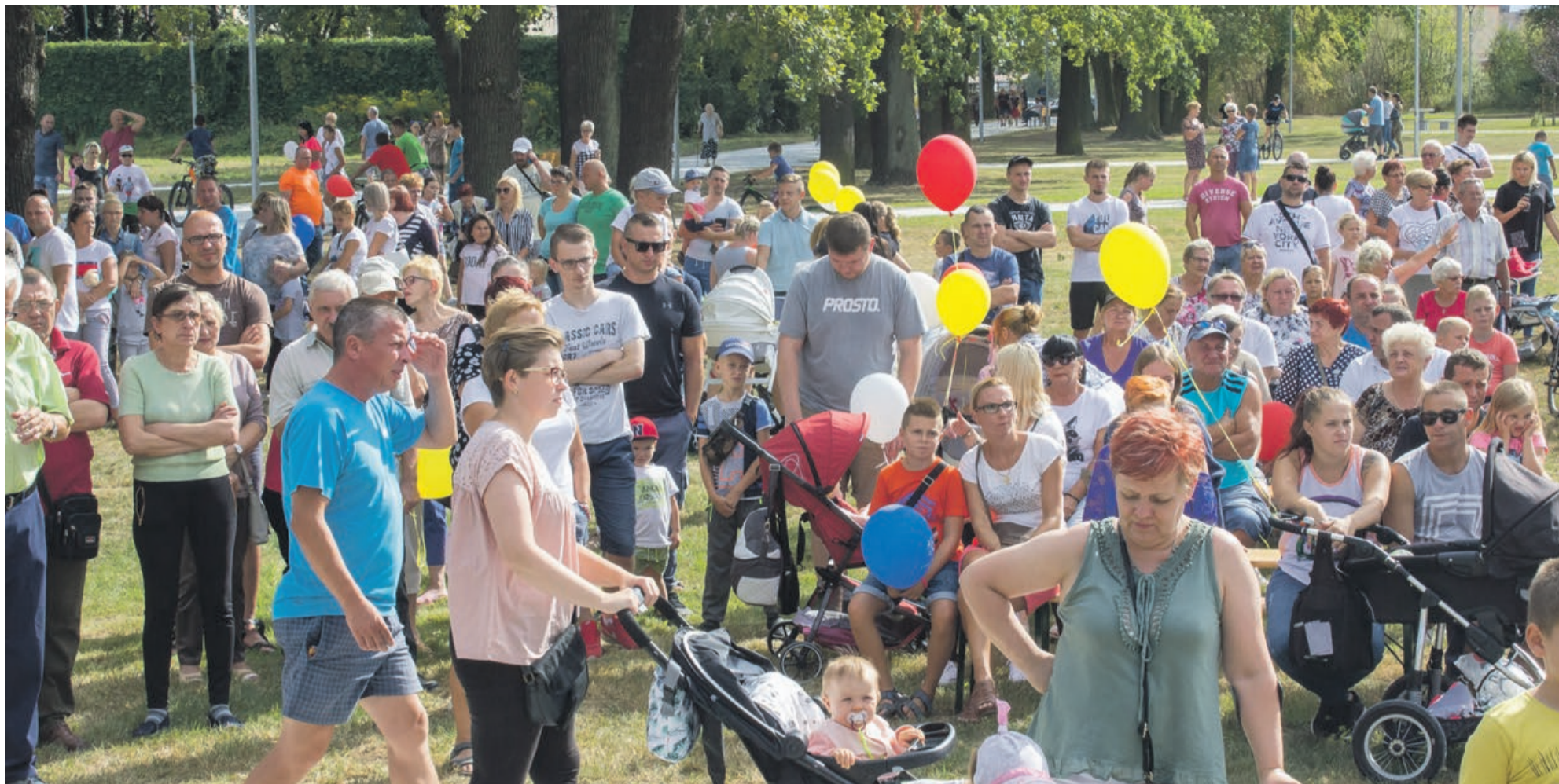
Młodszy i starszy ciekawo parkowych atrakcji