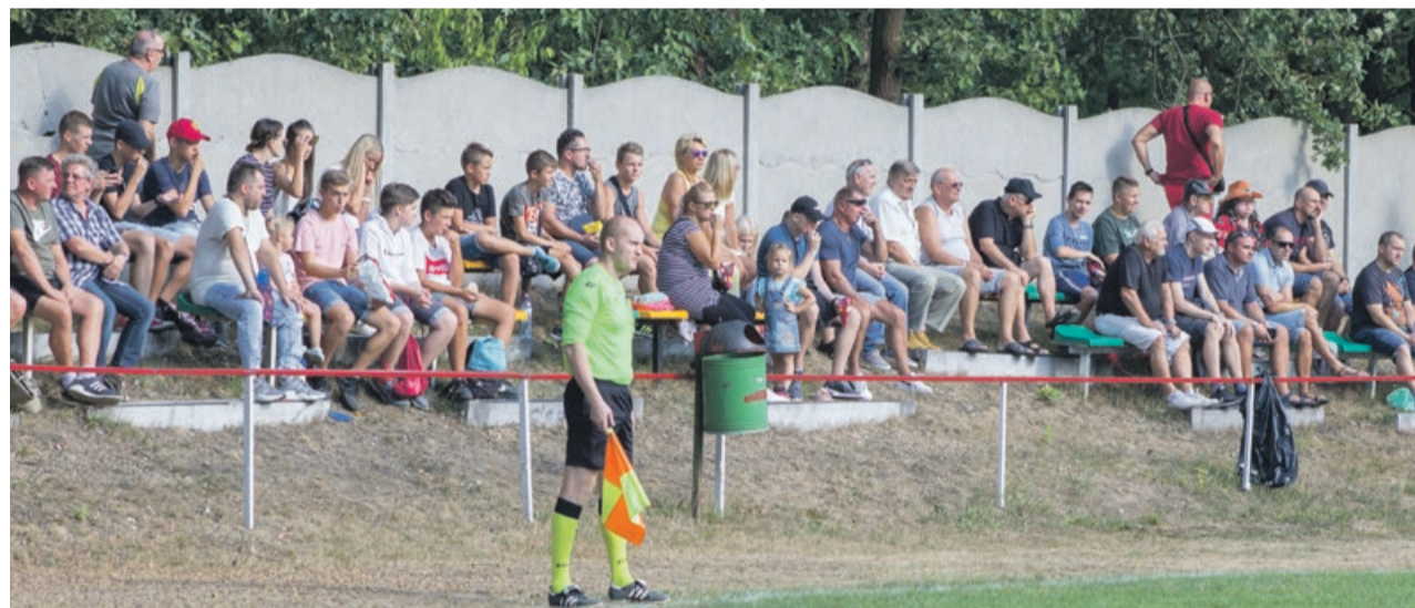
Mecz w Sieniawie cieszył się sporym zainteresowaniem