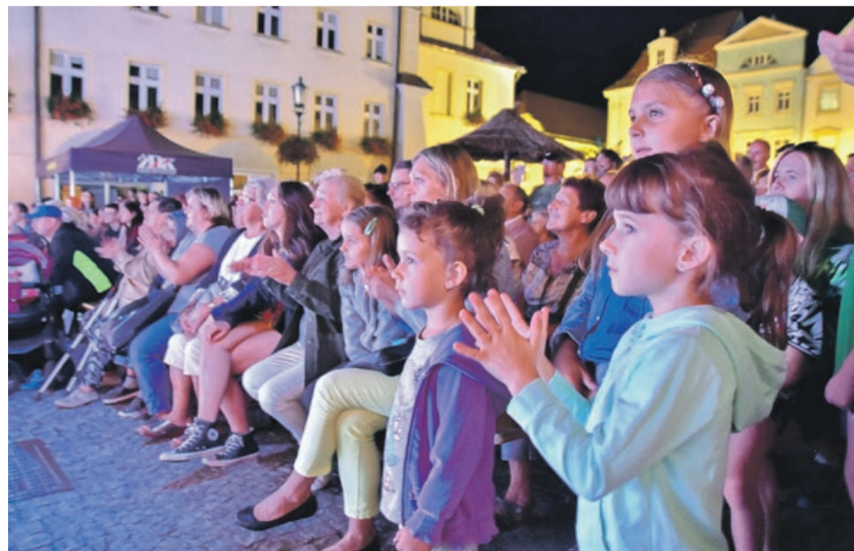
Wieczne występy cieszyły się sporą frekwencją