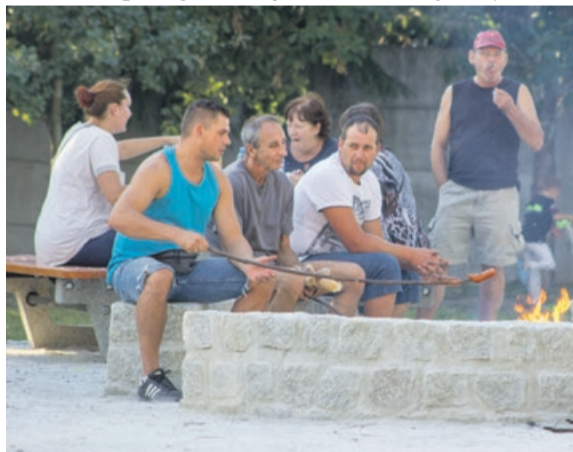
Jest też miejsce na ognisko