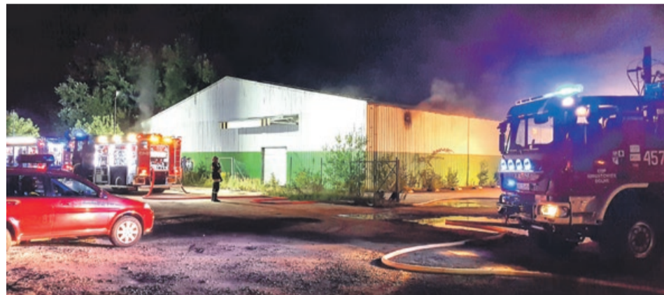
Zawodowcy i ochotnicy pracowali wspólnie

Z informacji, do których dotarła redakcja „Mojej Gazety” wynika, że prawdopodobnie na terenie dawnej hurtowni grupa bezdomnych urządziła sobie libację alkoholową. Miało dojść do kłótni. Współbiedadnicy chcieli w zemście podpalić kolegę, ten jednak uciekł. Pożar się szybko rozprzestrzenił, więc inni też uciekli. Niestety, zapomnieli, że razem z nimi biesiadował koleżanka, która upojona alkoholem usnęła.