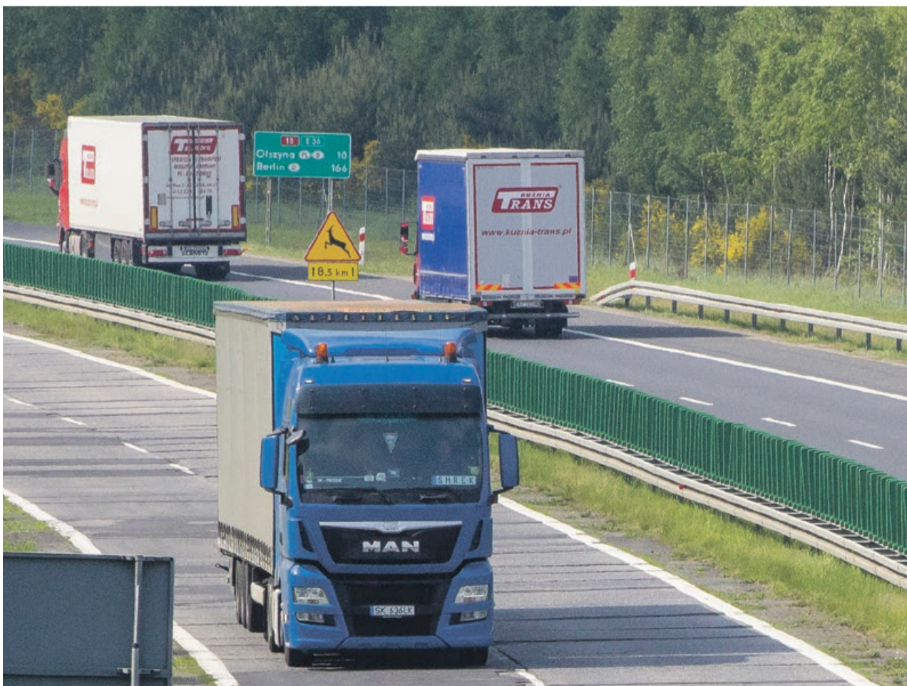
Ciężarówki, to aż 25 proc. pojazdów na lubuskich drogach krajowych

Zakaz dotyczy pojazdów o dopuszczalnej masie całkowitej przekraczającej 12 ton, z wyłączeniem autobusów, na obszarze całego kraju w dniach: w piątek (od godz. 18.00 do godz. 22.00), w sobotę (od godz. 8.00 do godz. 14.00) i w niedzielę (od godz. 8.00 do godz. 22.00)