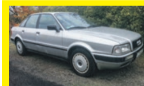
Sprzedam Audi 80 model B4, rok 1993, 2 litry benzyna, 66 kw, srebrny, szyberdach, hak, bardzo dobry stan opon, tel.519077784