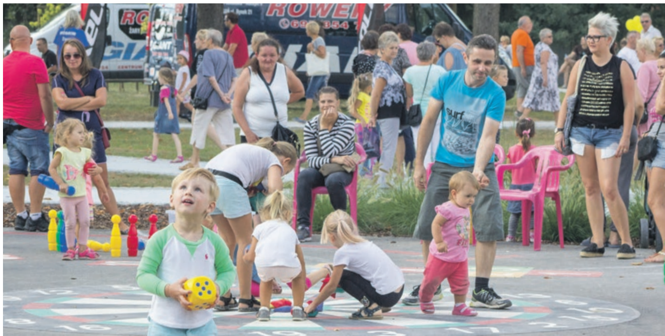
Miejsce do gier dla najmłodszych