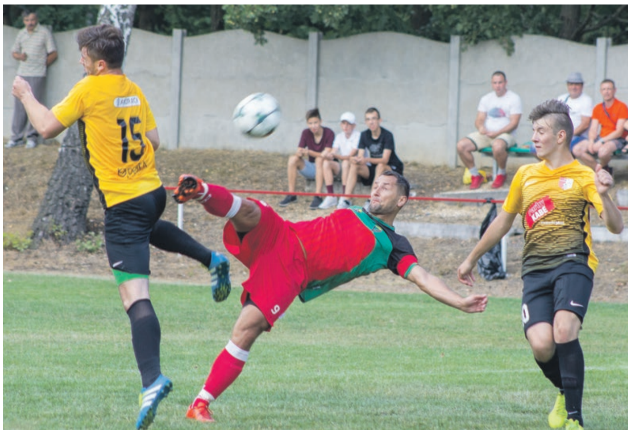
Tym razem w Sieniawie zdecydowanie wygrał Promień