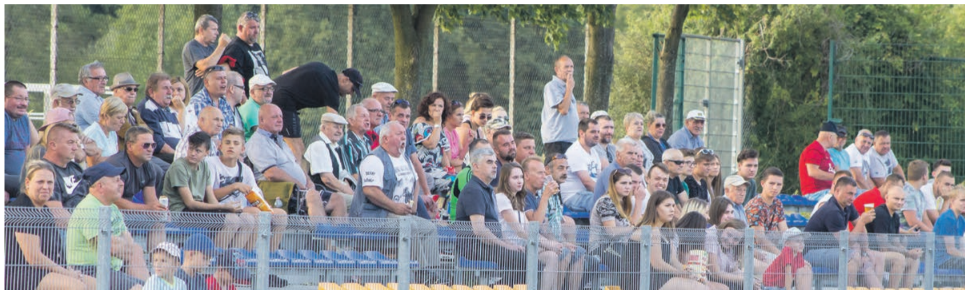
Kibice Budowlanych ciekawi nowego sezonu