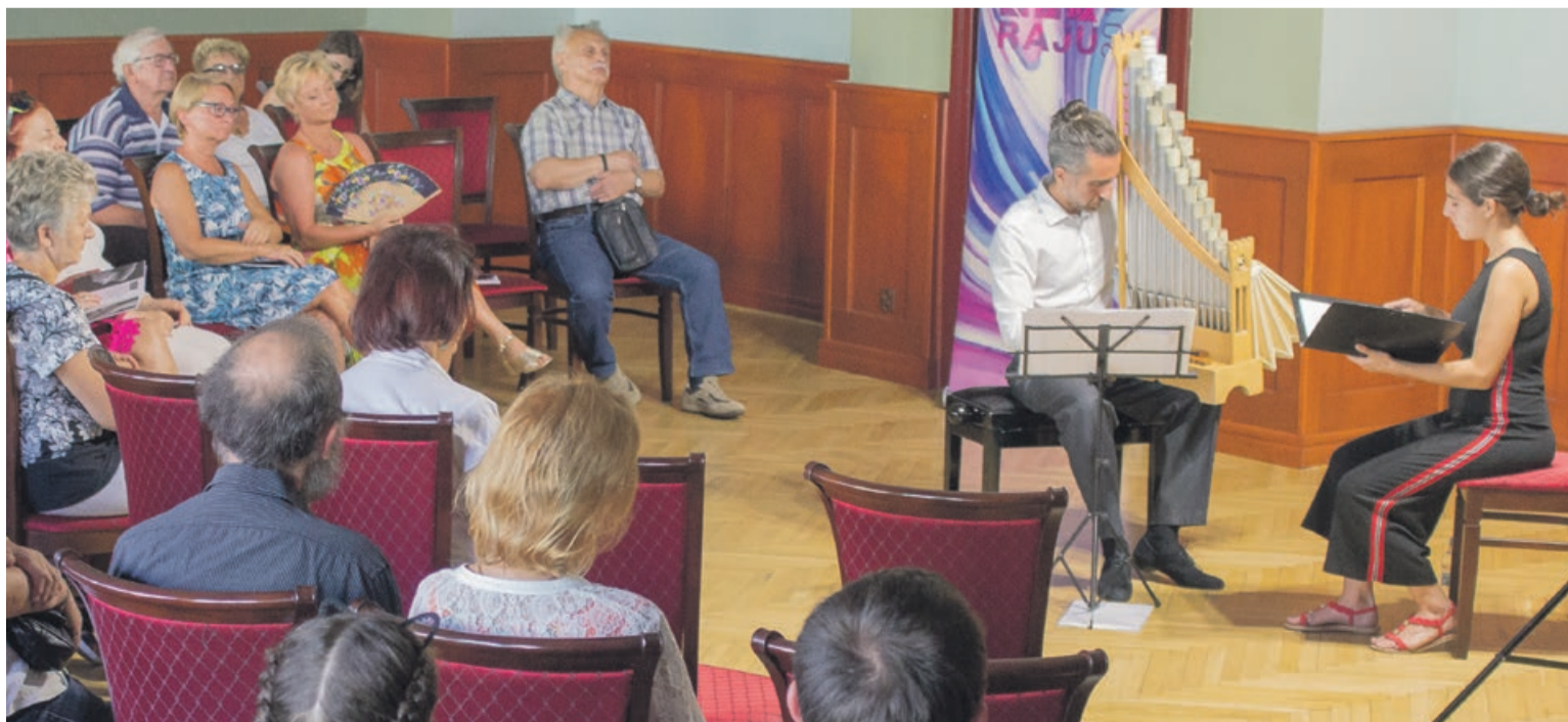
Organetto to instrument w zasadzie dziś już nie używany, ale często widoczny na obrazach, w rękach aniołów