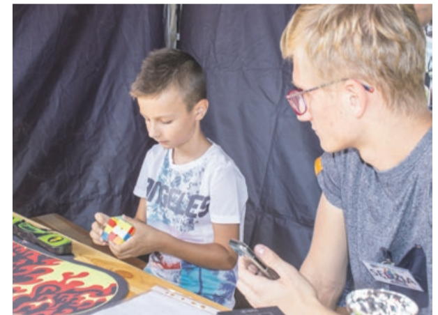
Układanie kostki Rubika na czas