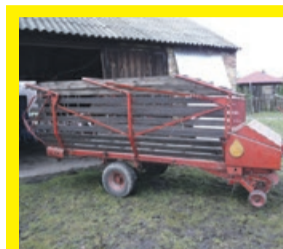
Przycepa samobierająca, rok 2001, Tel. 699-932-056

◆ Samotny pan pozna w miarę szczupłą Panią w wieku 60+ do stałego związku. Tel. 667 953 161