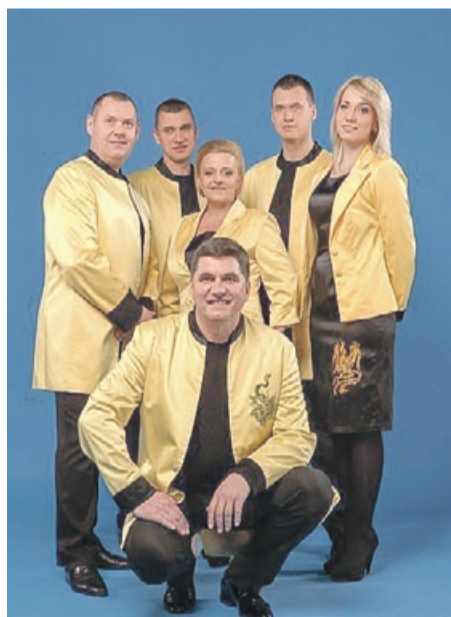
Bayer Full to weterani sceny Disco Polo