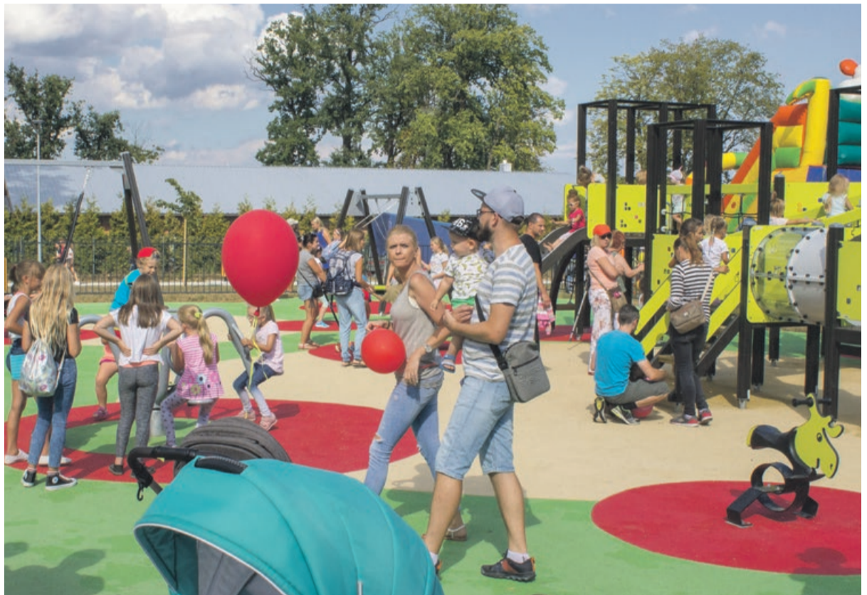
Plac zabaw przeżywał obłędnie