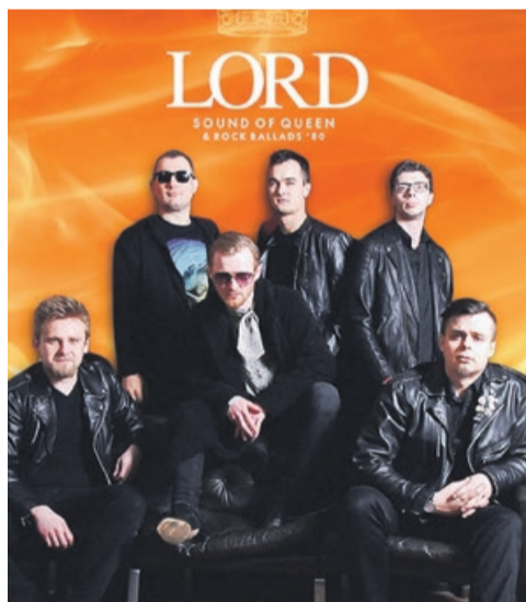
Grupa LORD wykonuje covery największych, światowych gwiazd muzyki rockowej, m.in. Queen, Scorpions, Bon Jovi, Guns 'N' Roses fot.ŻDK Żary