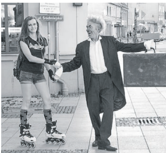
Spotkać w mieście takiego pana, to duża niespodzianka