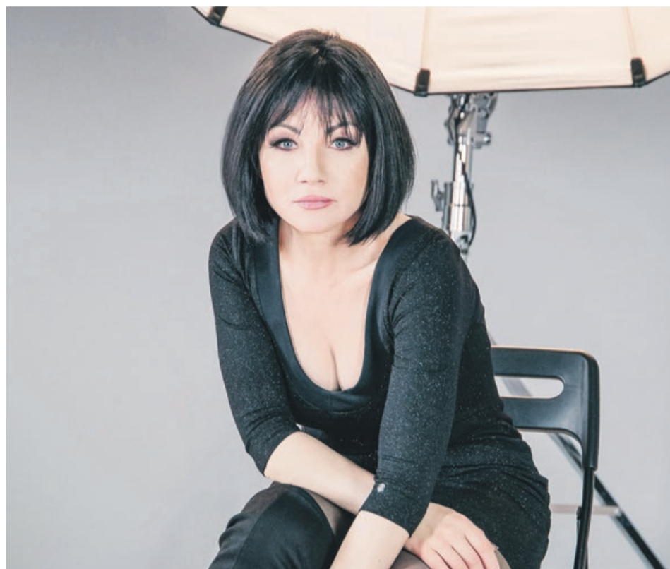
Shazza od lat utrzymuje się na muzycznym rynku