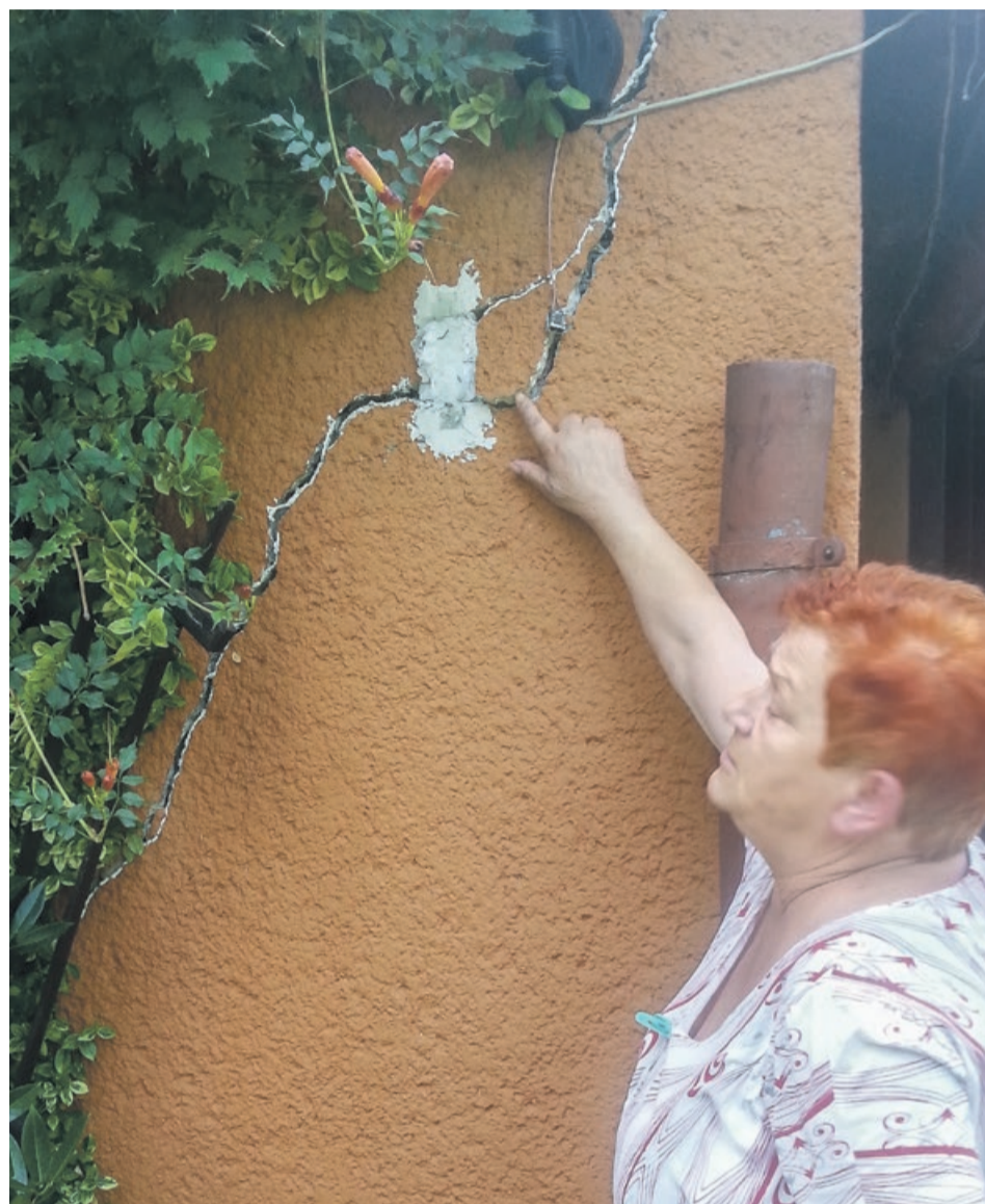
Pęknięcia na ścianie są coraz większe