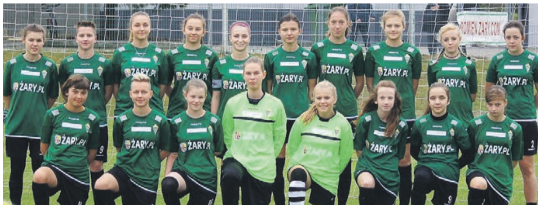
Trzecioligowe „Promyczki” na pewno radnym nie odpuszczają

Mecz będzie ciekawym widowiskiem i na pewno dobrą zabawą, zarówno dla zawodników, jak i kibiców. ATB