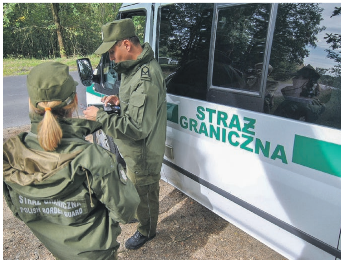
Problemów na granicach nie ubywa, strażnicy są cały czas niezbędni, aby strzec prawa

Po pozytywnie zakończonej procedurze kwalifikacyjnej (m.in. rozmowa kwalifikacyjna, testy psychologiczne, badanie wariografem, testy z wiedzy ogólnej i sprawności fizycznej) nowy szeregowy SG kierowany jest na 3,5 miesięczne szkolenie podstawowe, jednomiesięczną praktykę w macierzystej jednostce, a następnie 3,5 miesięczne szkolenie podoficerskie. PAS