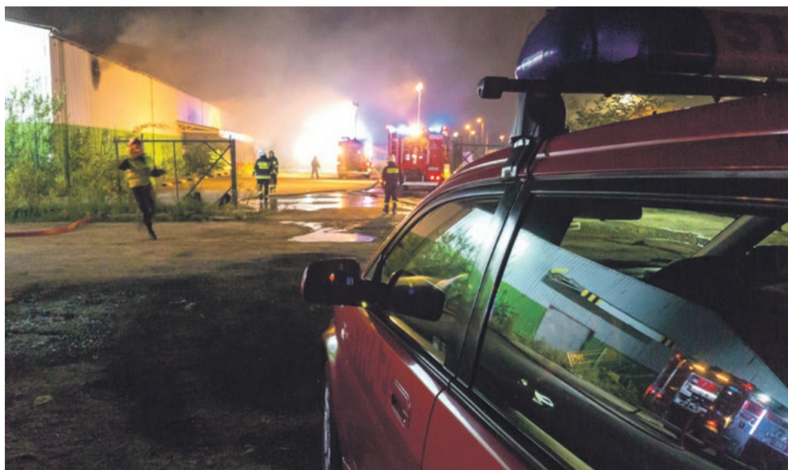
Strażacy ruszyli do pożaru w niedzielę, po zgłoszeniu o godzinie 22.14