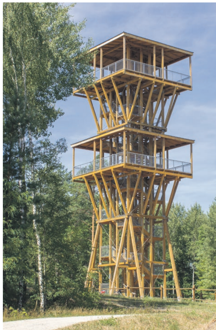
Drewniana wieża widokowa ma trasę geościeżki