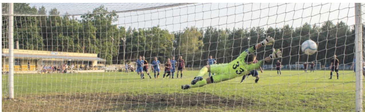
Bramkarz Stali nie poradził sobie z rzutem karnym