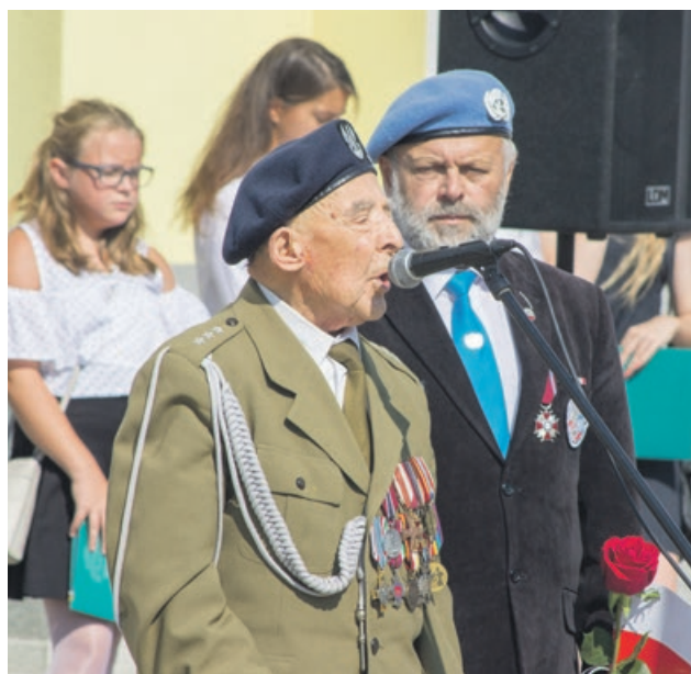
Obecność kombatantów w tym dniu była szczególnie wymowna