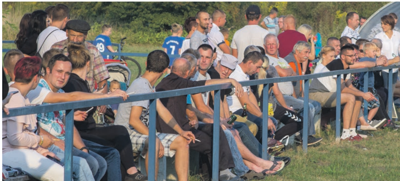
Całkiem możliwe, że za rok w Bieniowie będzie już A-klasa