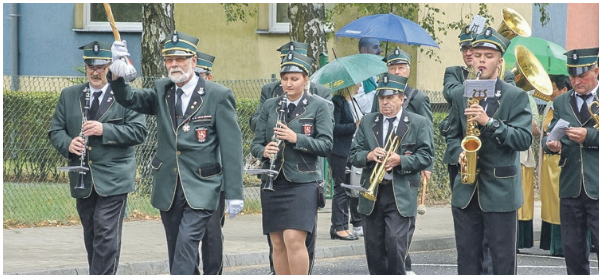
Przemarsz korowodu dożynkowego uświetniła orkiestra z Iłowej