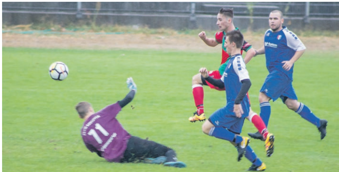
Bramkarz Zrywu kapitulował dwukrotnie