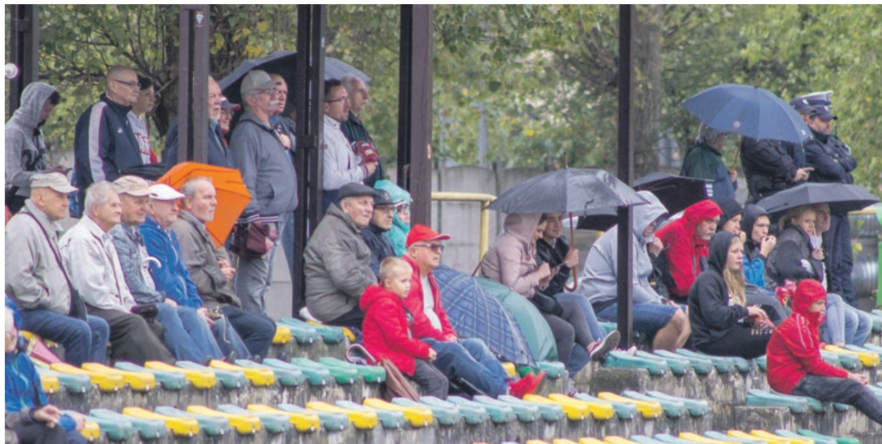
Deszcz odstraszył część kibiców, ale wielu przyszło na mecz, jak zawsze