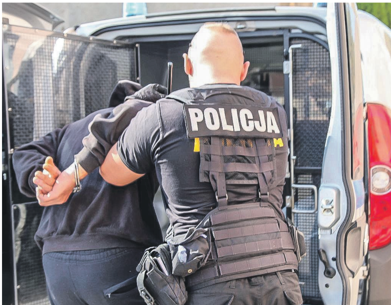
Włamać się nie udało. Policjanci skutecznie interweniowali

- Za tego typu przestępstwo 58-latkowi może grozić do piętnastu lat pozbawienia wolności z uwagi na działanie w warunkach recydywy. Mężczyzna z powrotem trafił do aresztu. - informuje kom. Aneta Berestecka, oficer prasowy KPP w Żarach. PAS