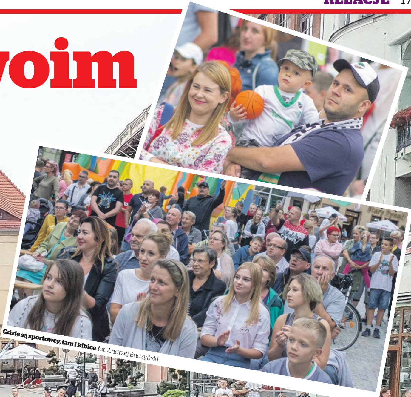
Gdzie są sportowcy, tam i kibice