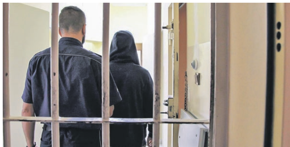
Mężczyzna usłyszał już zarzuty. Grozi mu nawet trzy lata pozbawienia wolności