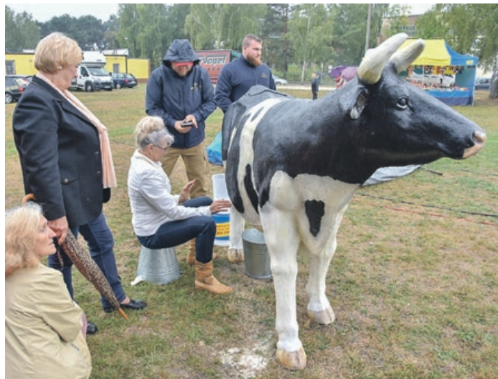
Doimy, doimy! Nie ociągamy się!