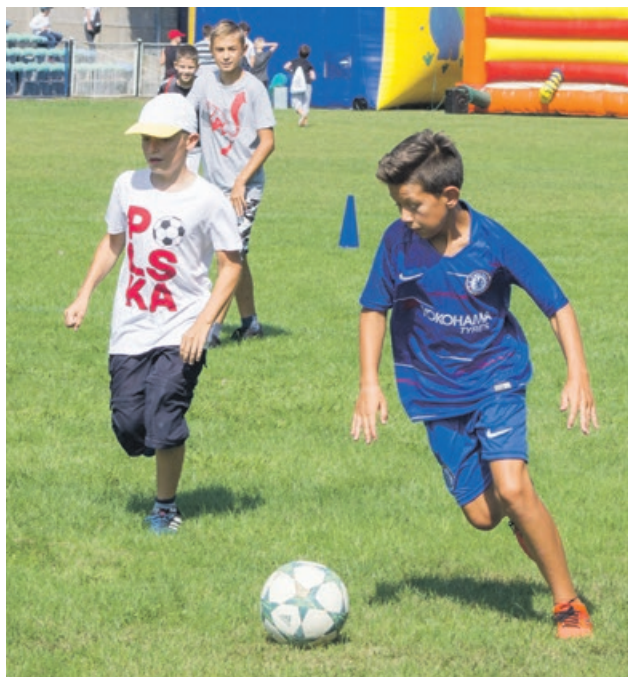
Na boisku musi te być piłka