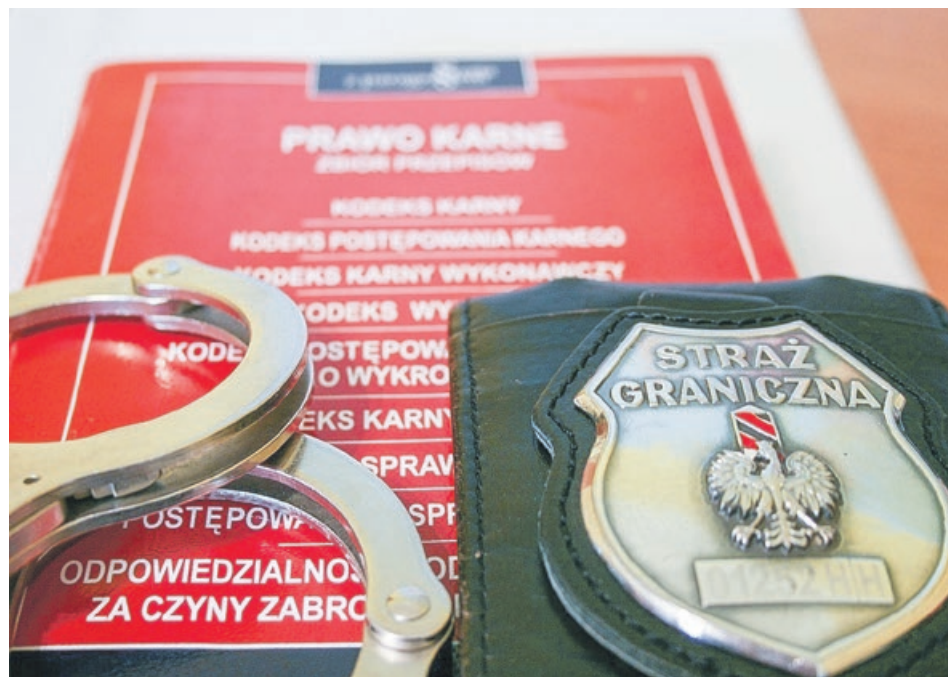
Sprytny podstęp został rozszyfrowany przez funkcjonariuszy Straży Granicznej

Każdy z obcokrajowców przyznał się do zarzucanych czynów oraz dobrowolnie poddał się karze pięciu miesięcy pozbawienia wolności w zawieszaniu na jeden rok. Wszczęte w stosunku do cudzoziemców postępowania administracyjne zakończyły się we wszystkich przypadkach unieważnieniem cudzoziemcom wiz oraz wydaniem decyzji zobowiązujących ich do powrotu. Orzeczono również wobec nich czasowy zakaz wjazdu do Polski. PAS