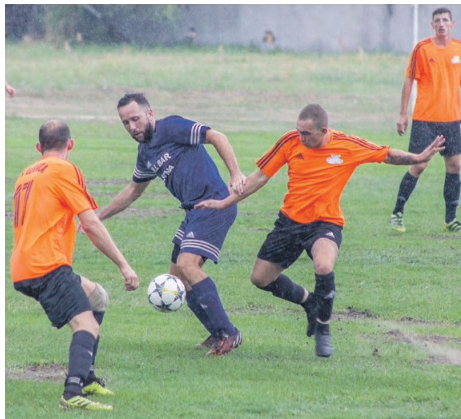
Mecz w Łęknicy przypominał chwilami taniec w deszczu

W pierwszej kolejce rundy jesiennej ŁKS pokonał LZS KS Tomaszowo 10:0. Kolejny mecz to wysoka wygrana z Kwisą Trzebów - 11:1. Tym razem łęczniczanie zdobyli tylko 3 bramki, przy okazji tracąc jedną. Albo przeciwnik był zbyt wymagający, albo ŁKS nie lubi grać w deszczu. Ostatecznie jednak inkasuje kolejne 3 punkty, natomiast Granica Żarki Wielkie wróciła do domu z pierwszą porażką w tym sezonie. ATB