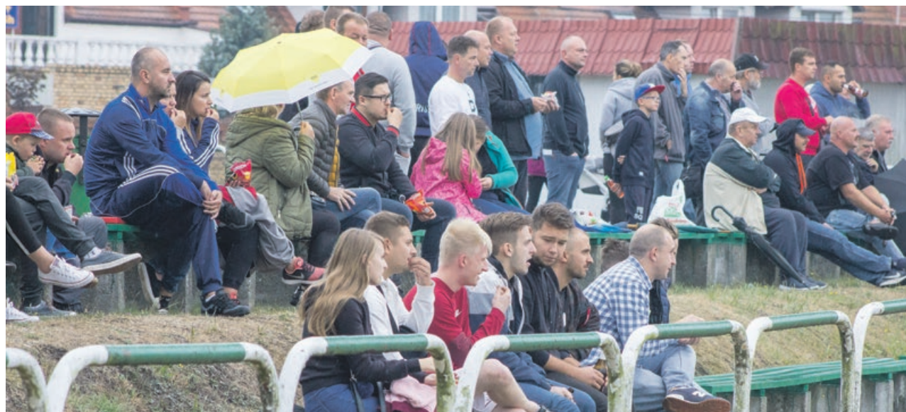
Pogoda nie przeszkadza, kiedy drużyna wygrywa