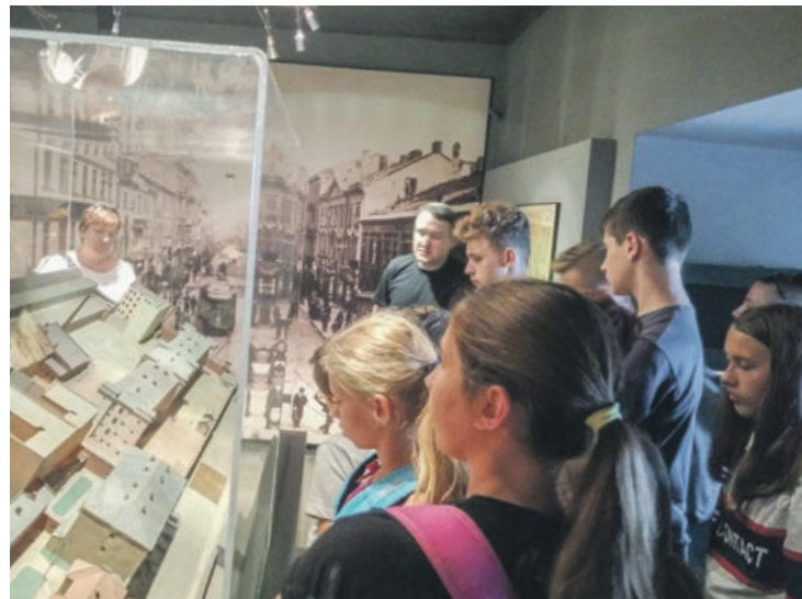
W Muzeum Powstania Warszawskiego