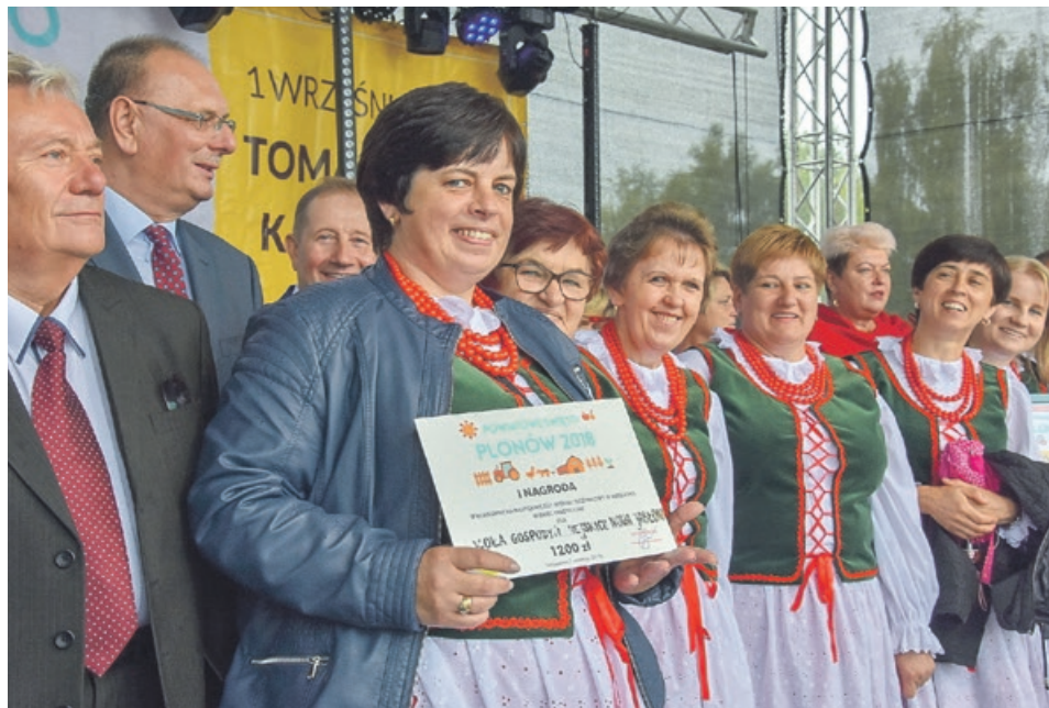
Najpiękniejszy wieniec wykonały panie z najpiękniejszymi uśmiechami