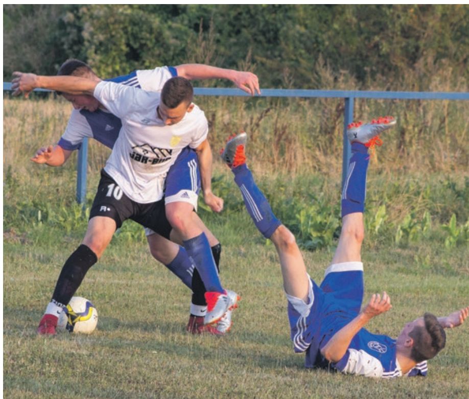
WKS Łaz prowadził do przerwy 2:1, jednak 6 bramek, które padły w drugiej części meczu, dały w rezultacie 3 punkty piłkarzom z Bieniowa

W drugiej kolejce FAX zmierzył się z drużyną WKS Łaz. Raz wygrywali jedni, raz drudzy, ale ostatecznie na boisku w Bieniowie to gospodarze okazali się lepsi zdobywając 6 bramek. Gościom zaś udało się strzelić 3. ATB