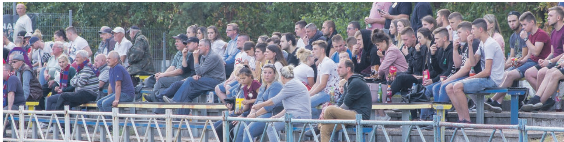
Do Jasienia przyjechała liczna grupa kibiców z Górzyna