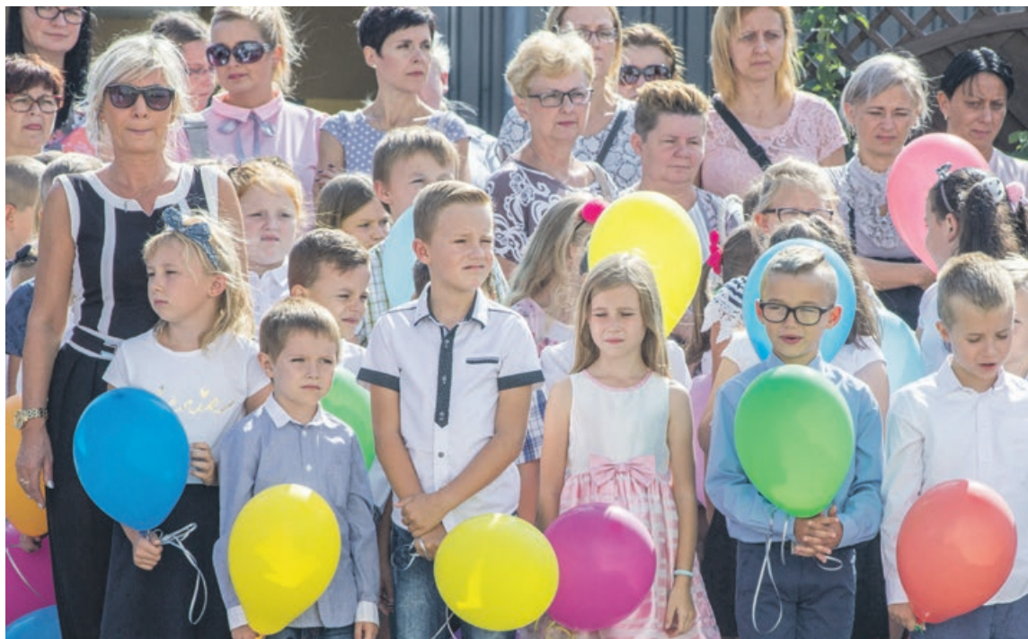
Już wkrótce przekonają się, co przyniesie nowy rok szkolny