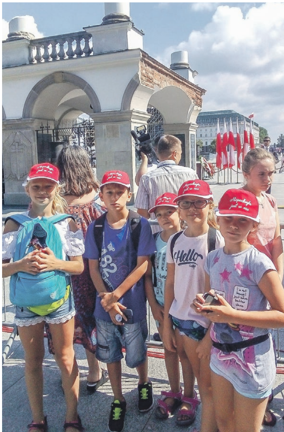
Pod Grobem Nieznanego Żołnierza