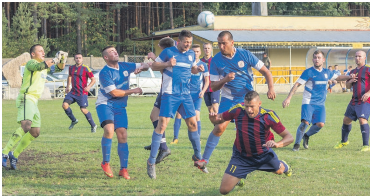
Przewinienie w polu karnym i sędzia odgwizduje jedenastkę