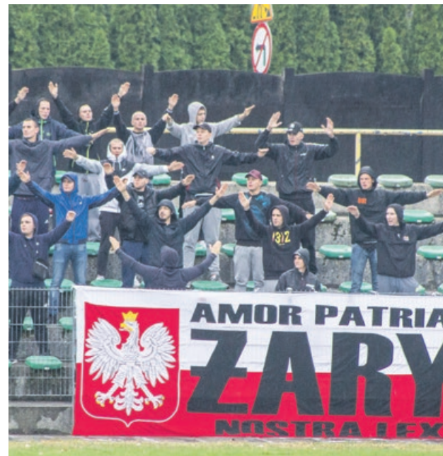
Ten sektor zawsze pełny