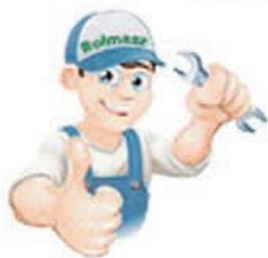
Redlica agregatu podor. serc. Waryński