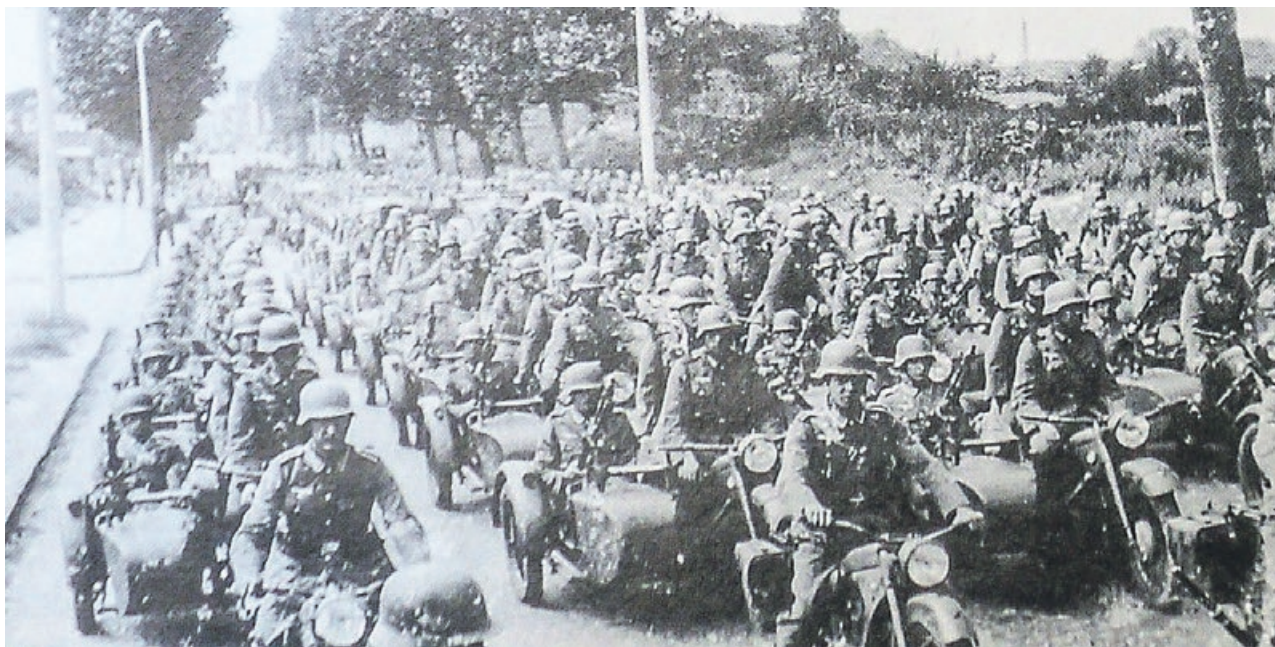
Zwiadowcy motocyklowi z 9.KSR na dzisiejszej Alei Wojska Polskiego

Był pogodny, wczesnojesienny dzień - sobota 7 października 1939 roku. Przy wtórze szumiącego wśród okolicznych sosen wiatru i głuchego dudnienia werbli przeszedł uliczkami koszar ku bramie głównej kondukt pogrzebowy ze szczątkami poległego ósmego dnia wojny dowódcy garnizonu w Sorau pułkownika Wilhelma-Dietricha von Dittfurth'a. Na drodze przejazdu zaprzęgniętego w cztery konie karawanu ciągnął się aż po bramę główną szpaler żołnierzy Wehrmachtu. Wieść o śmierci dowódcy 9. Pułku Strzelców Ka-