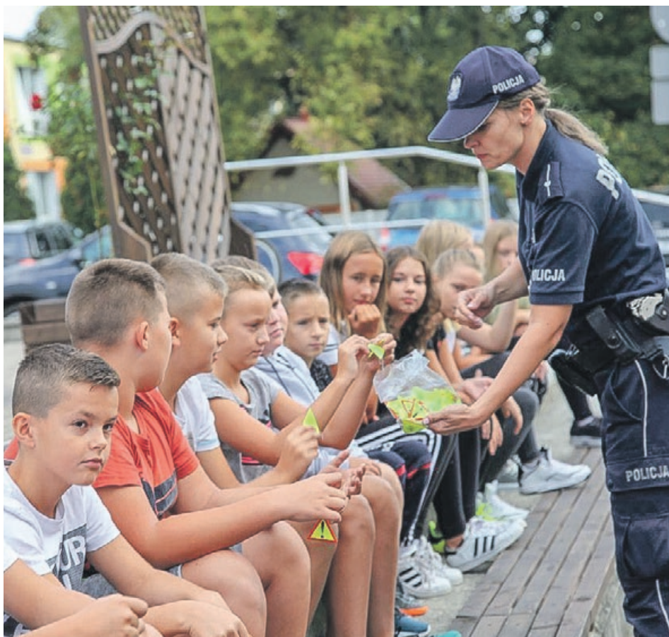
Policjanci rozdawali odblaski

Z nowym rokiem szkolnym policjanci z żarskiej jednostki rozpoczęli akcję „Bezpieczna droga do szkoły”. W ramach prowadzonych działań funkcjonariusze kontrolują rejon placówek oświatowych, sprawdzają stan techniczny gimbusów przewożących