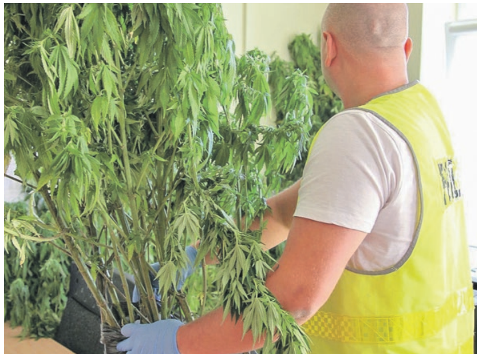
Niektóre krzewy miały ponad 120 cm wysokości

- Zwalczanie nielegalnego procederu związanego z uprawą i handlem marihwaną to jedno z zadań funkcjonariuszy żarskiej jednostki. Policjanci wykonują szereg działań w tym celu, aby każdy rodzaj i ilość nielegalnych środków wyeliminować z rynku. - informuje kom. Aneta Berestecka, oficer prasowy KPP w Żarach. PAS