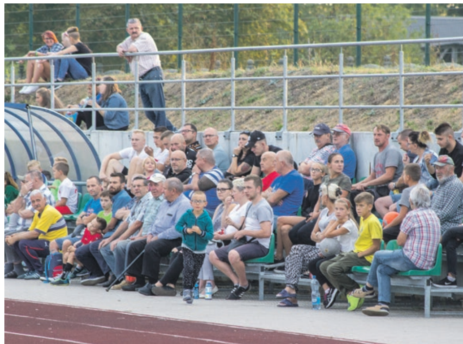
Kobieca piłka nożna cieszy się w Żarach coraz większym zainteresowaniem