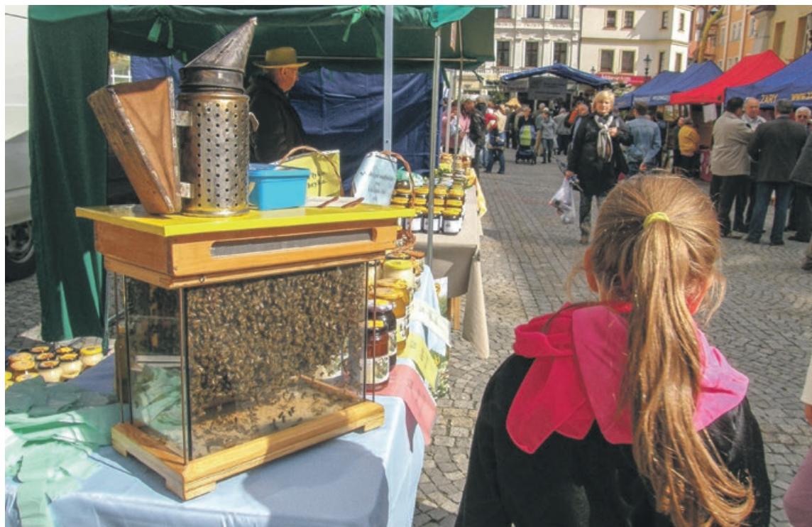
Jarmark Miodu i Wina na stałe wpisał się w krajobraz miasta

W ramach oficjalnej wizyty węgierskich gości, dzień wcześniej,