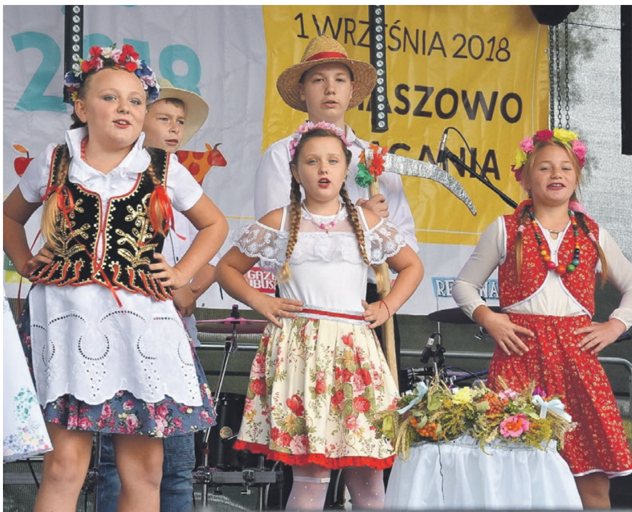
Występy młodzieży wszystkim się podobały