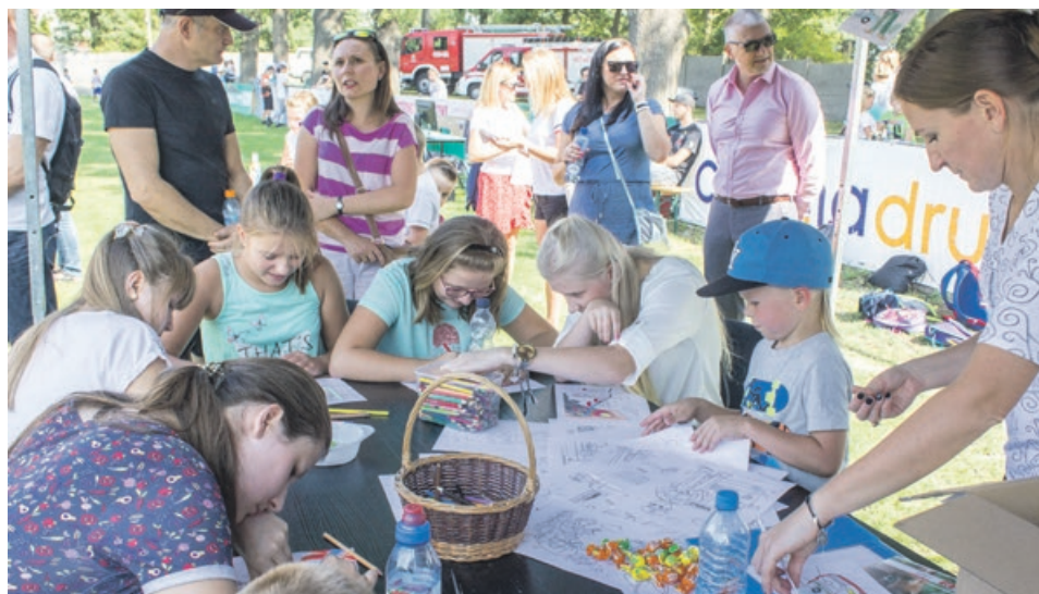
Namiot plastyczny też miał wzięcie