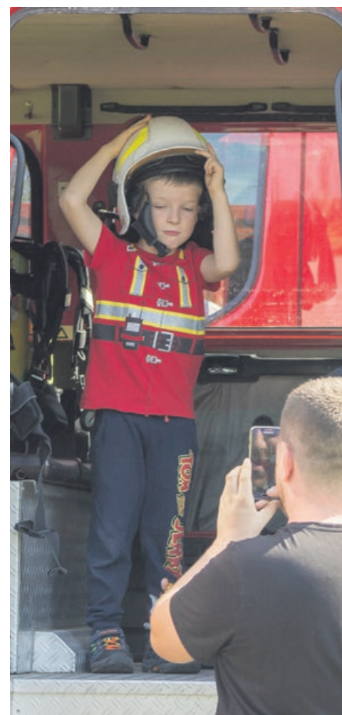
Zwiedzanie wozu strażackiego to niezła frajda fot. Andrzej Buczyński

Może to nie ostatnie zetknięcie ze strażackim rzemiosłem fot. Andrzej Buczyński