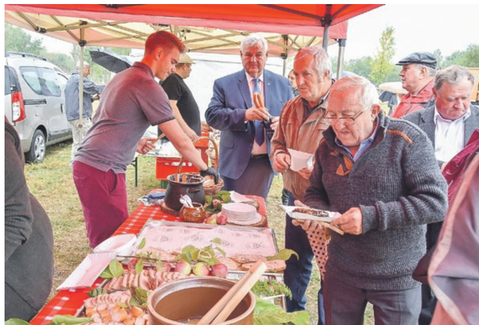
Do degustowania pysznych wyrobów nie brakowało chętnych