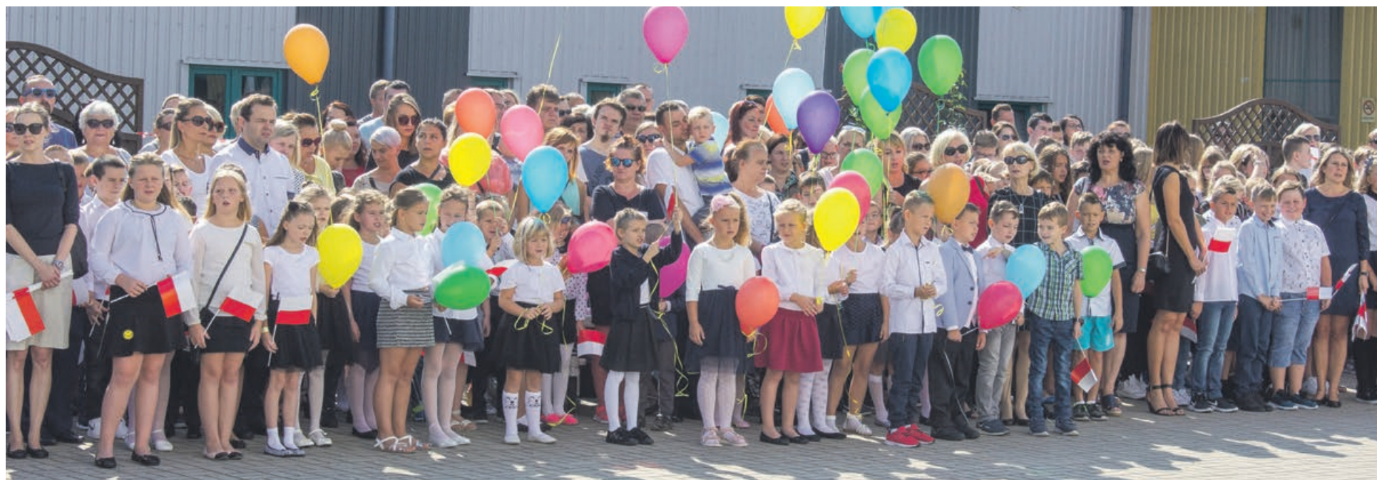
Minał czas wakacji. Witaj szkoło!