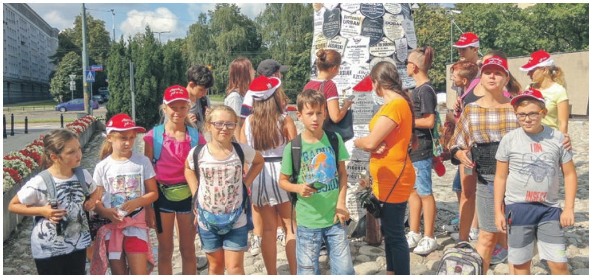
Zwiedzanie więzienia na Pawiaku było ważnym elementem wycieczki