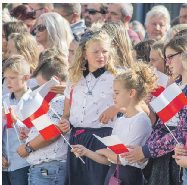
Szacunek dla barw narodowych trzeba wpajać od najmłodszych lat