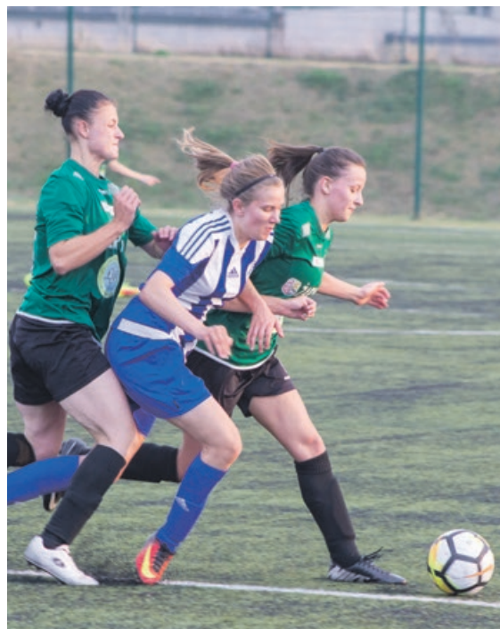
Ciekawych sytuacji nie brakowało

Co ciekawe, wszystkie 6 bramek dla zielonogórzeńki strzeliła Patrycja Zięba. Ciekawe też, jak potoczyłoby się spotkanie, gdyby tej piłkarki zabrakło na boisku. ATB