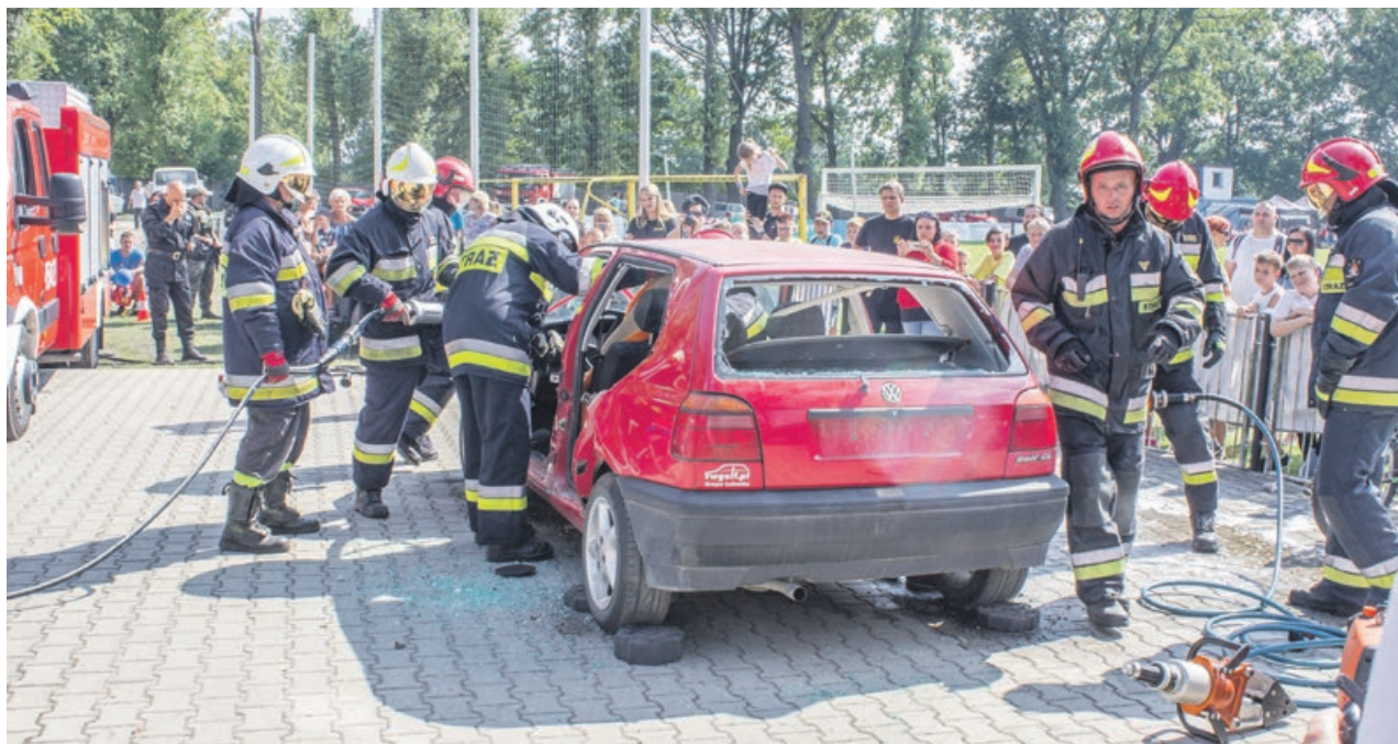
Strażacki sprzęt i umiejętności ratują życie i zdrowie poszkodowanym w wypadkach