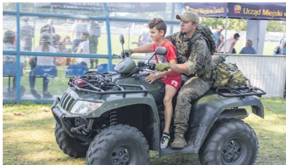
Do wojskowych pojazdów ustawiała się kolejka