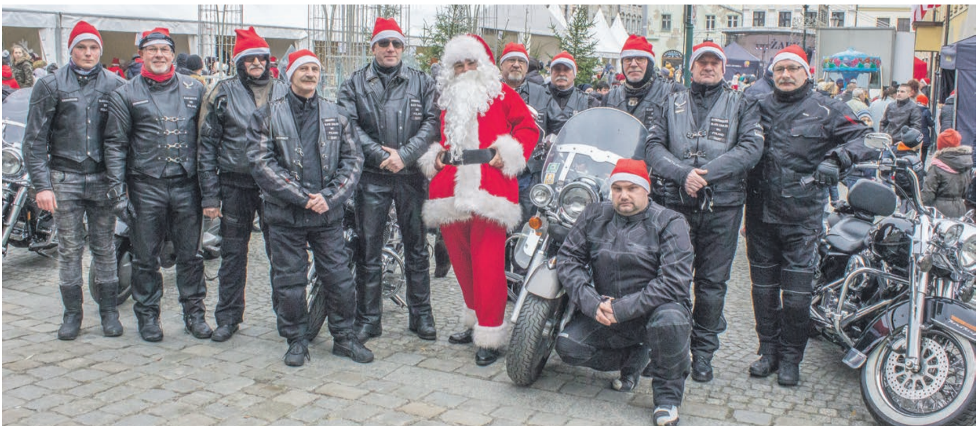
Ekipa Świętego Mikołaja