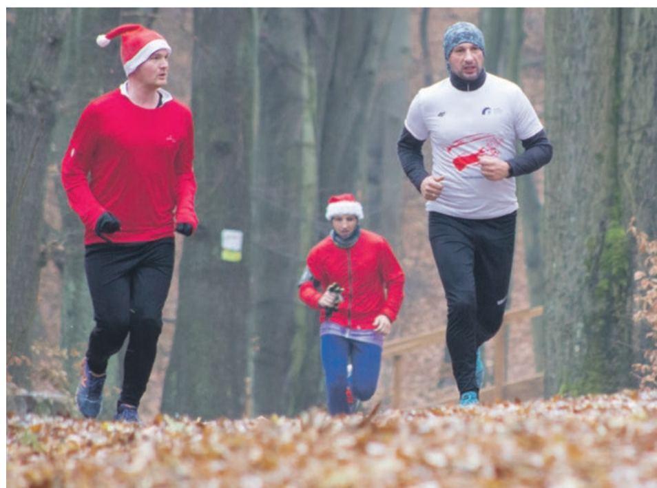
W grudniu Mikołaje są wszędzie