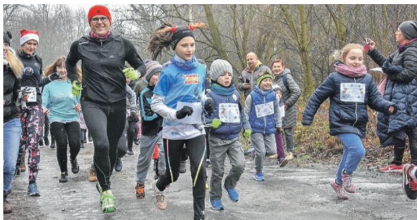
fot. Jan Mazur