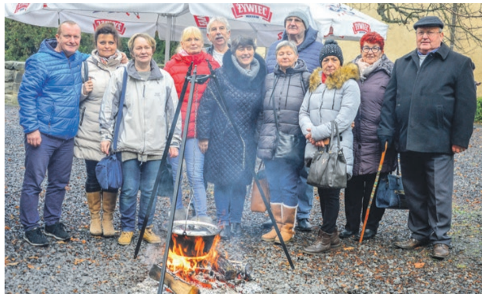
Przy ognisku, przy ognisku