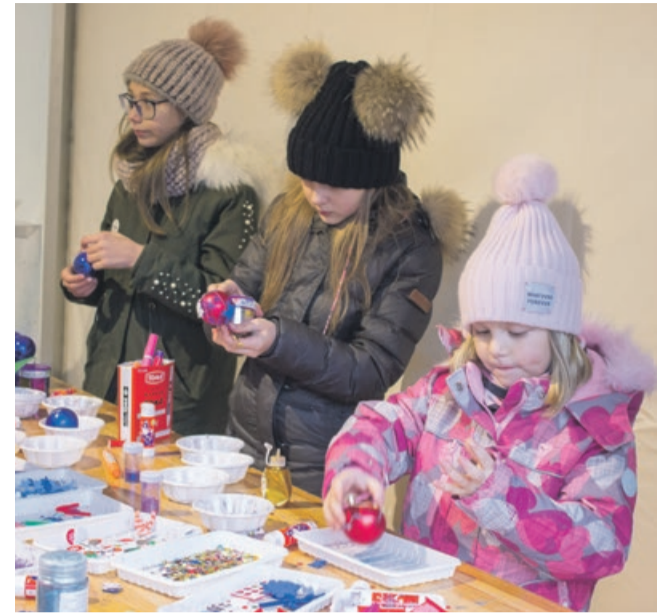
Powstało wiele nowych ozdób na choinki