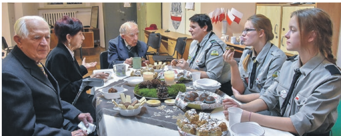
Integracja przy stole