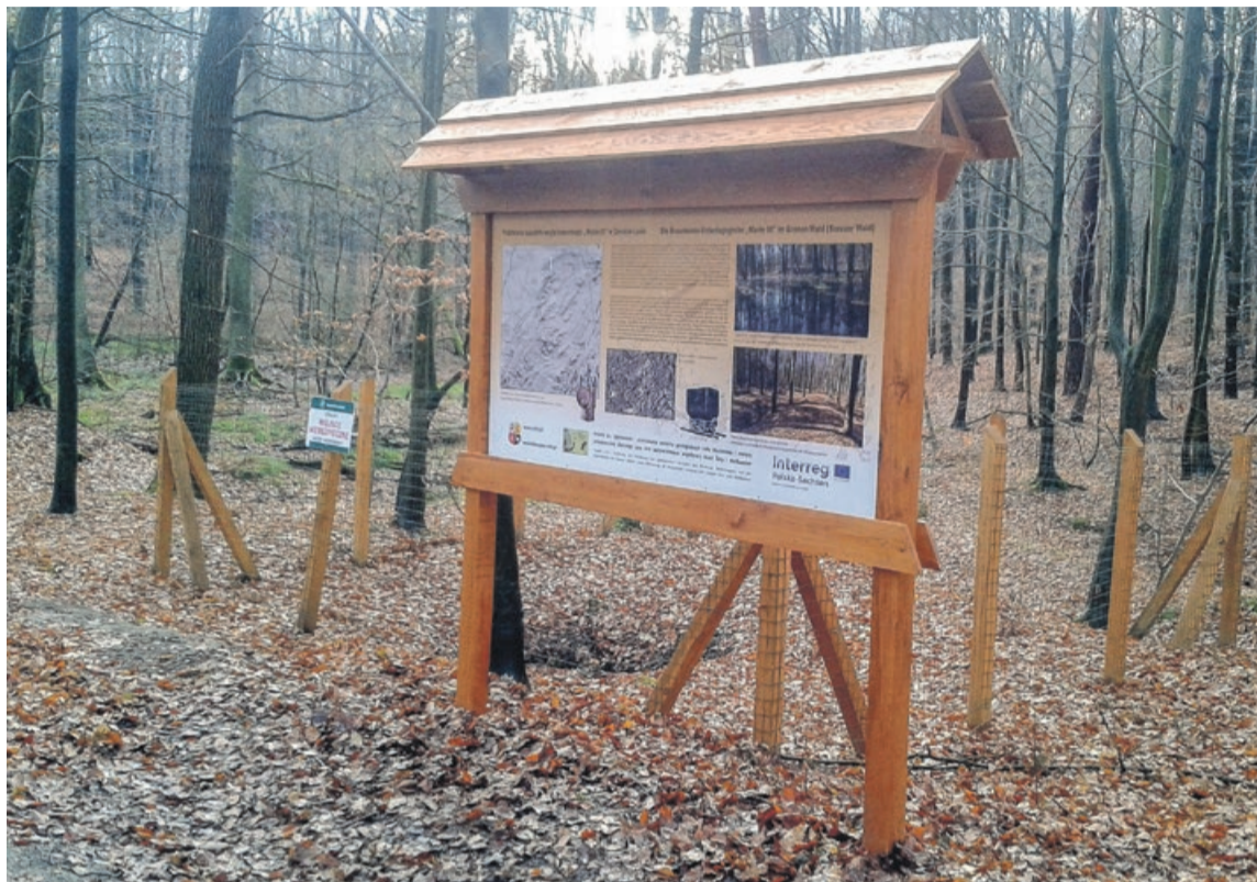
Spacerując po Zielonym Lesie będzie można przy okazji dowiedzieć się wielu ciekawych rzeczy

Dzięki takim inwestycjom w infrastrukturę, wzrasta atrakcyjność Zielonego Lasu, nie tylko pod względem turystycznym, ale i rekreacyjnym. ATB