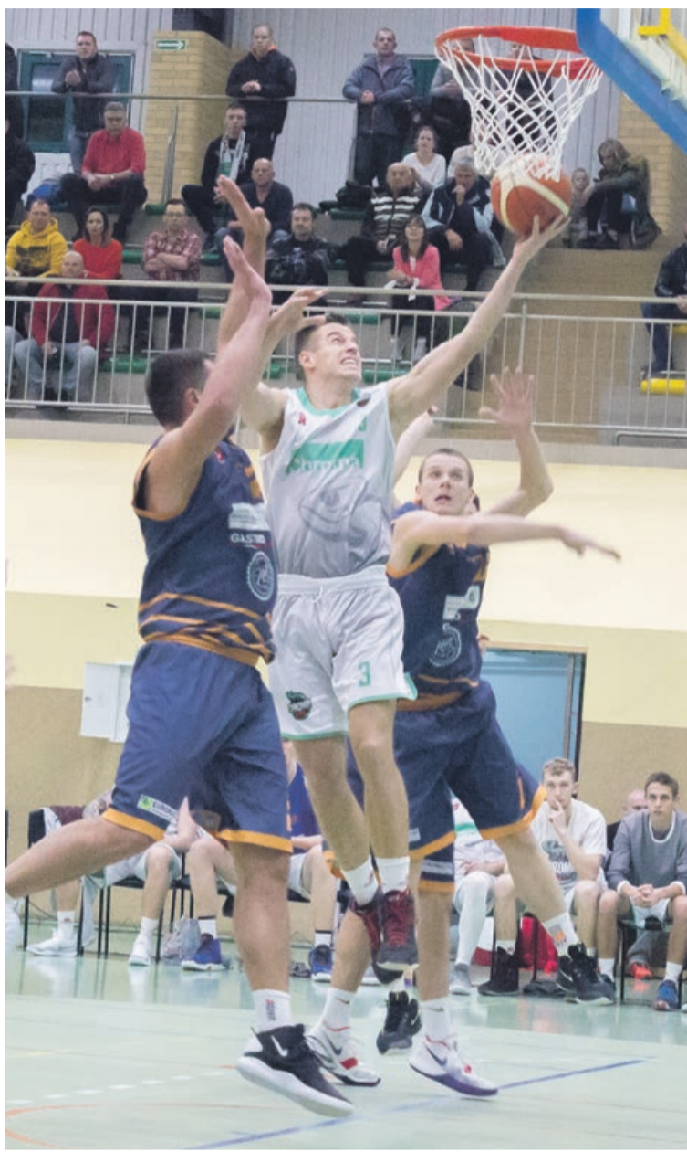
Po pierwszej przegranej w sezonie, rehabilitacja przed własną publicznością

W sobotę, 1 grudnia, żaranie z bilansem 8:0 pojechali do Wrocławia, by zmierzyć się z rezerwami Śląska. Nieoczekiwanie górą była miejscowa młodzież, która wysoko wygrała ten pojedynek 106:76. - Wiedzieliśmy, że taki mecz musi w końcu nadejść. Zagramy słabo, a rywal rozegrał fenomenalne zawody. Przegraliśmy zasłużenie. Byliśmy słabsi na desce, raziliśmy nieskutecznością. W końcówce mając w zanadru zaległy pojedynek z KS Sudetami nieco, odpu-