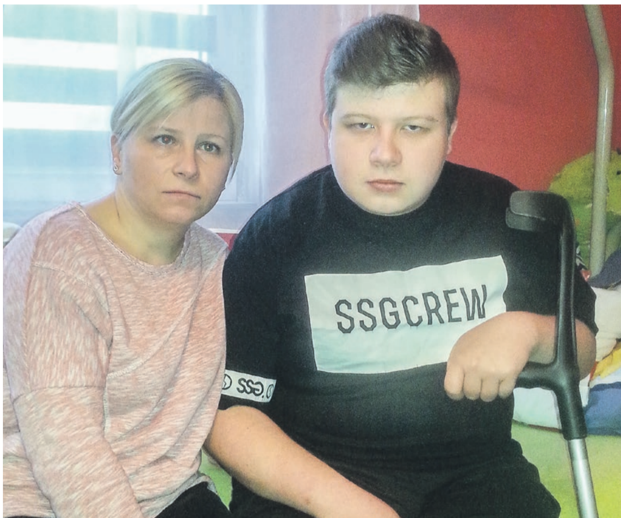
Mama wspiera swojego syna w chorobie, jak tylko może