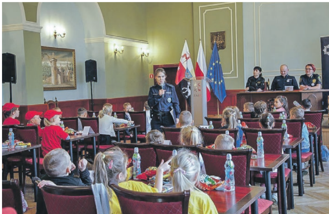
Konkurs jest dobrą formą edukacji najmłodszych

Na turniej, po raz dwunasty zorganizowany przez policjantów z Komendy Powiatowej Policji, licznie przybyły dzieci z całego powiatu żarskiego. Łącznie udział w zawodach wzięły 23 trzyosobowe drużyny. Dzieci walczyły w konkurencjach dotyczących bezpiecznych zachowań zarówno w domu jak i na drodze. Przedszkolaki jak co roku, prezentowały bardzo wysoki poziom