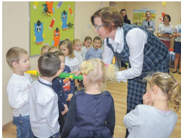
To ważna i wyjątkowa chwila

czyście pasowani na przedszkolaków. Emocji było co nie miara, bo to w końcu był jeden z ważniejszych dni w życiu kilkuletnich pociech. Wszyscy pasowani z dumą mogą teraz o sobie powiedzieć, że są pełnoprawnymi przedszkolakami. PAS