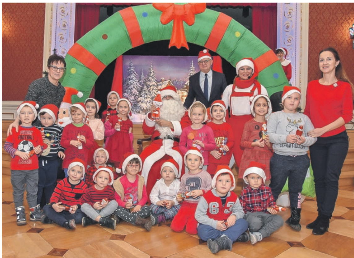
Mamy wspólne zdjęcie z Mikołajem, to teraz musimy być grzeczni