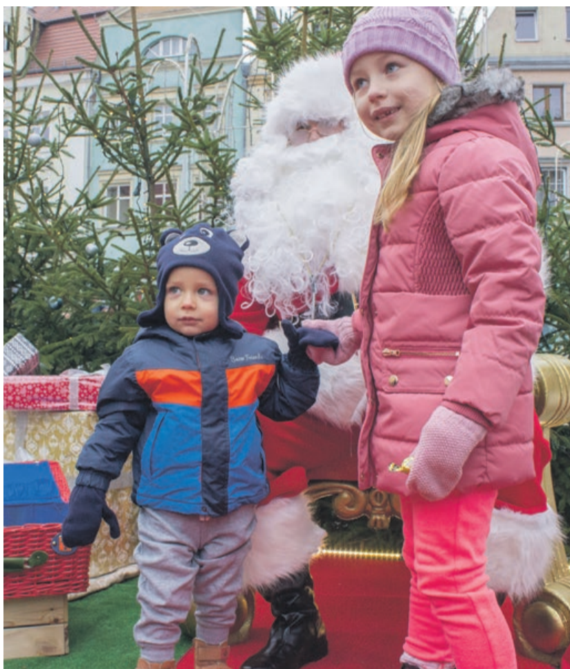
Kolejka do Mikołaja była bardzo długa

Do wszystkich przygotowanych atrakcji ustawiały się długie kolejki. Konkursy z nagrodami, zabawy, karuzele, przejażdżki ciuchcią, zajęcia plastyczne... było z czego wybierać. ATB