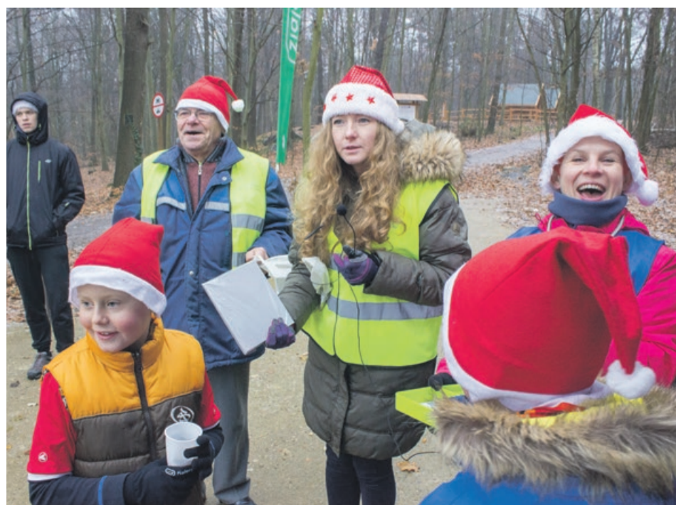
Przy odrobinie szczęścia każdy mógł wylosować upominek