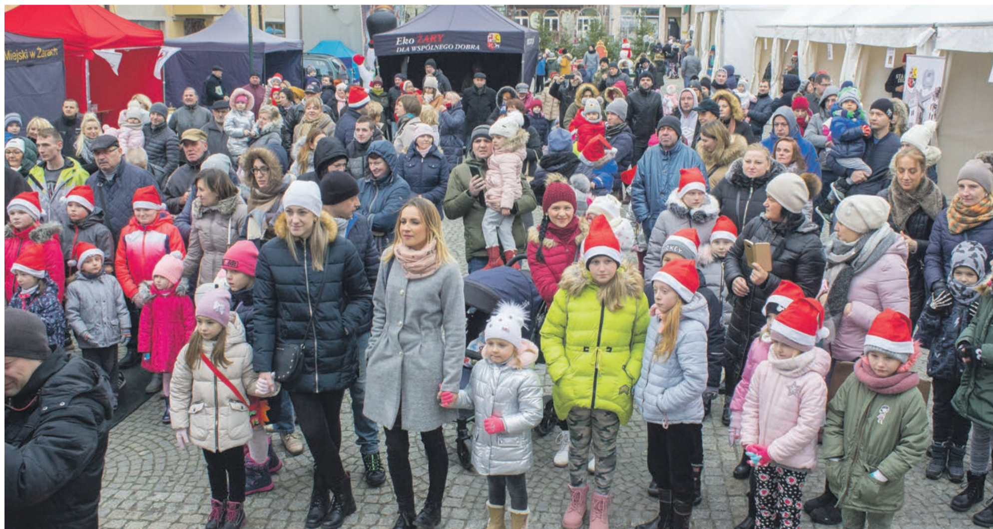
Pomimo zimna, na żarski Rynek przyszło sporo mieszkańców ciekawych mikołajkowej imprezy