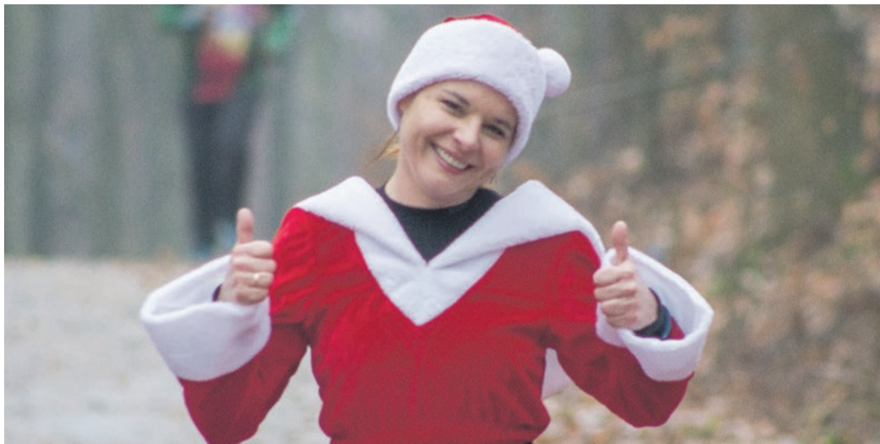
Mikołajkowy klimat na trasie