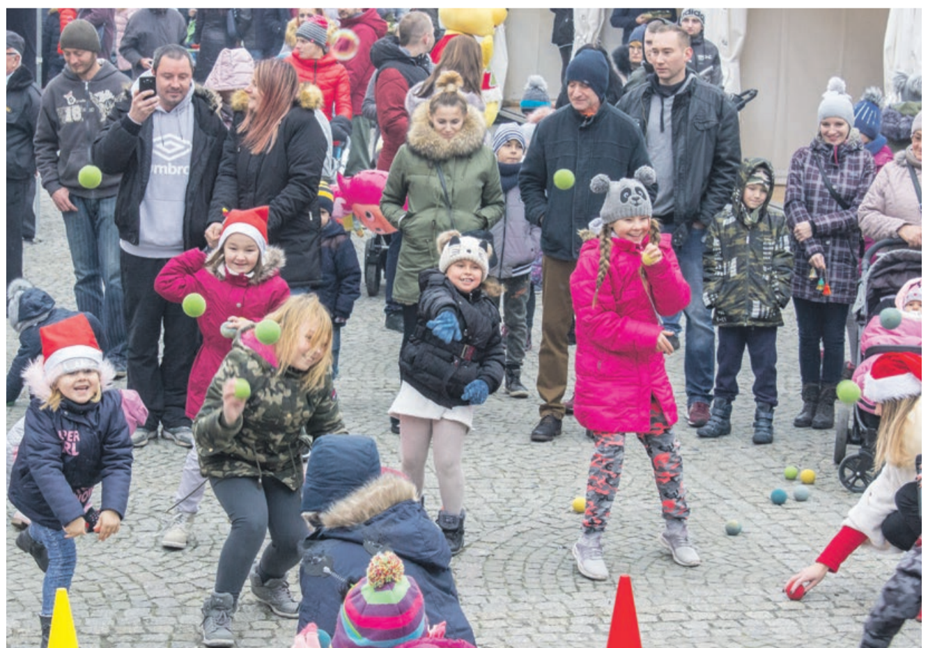
Kolorowe śnieżki z gąbki świetnie zastąpiły te prawdziwe