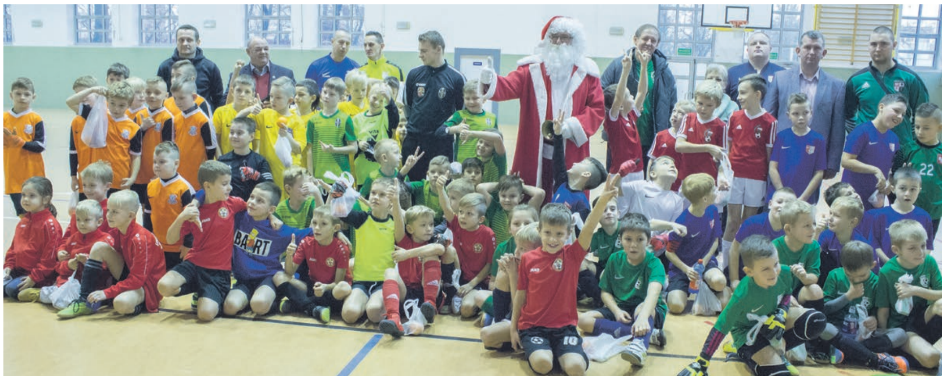
Oprócz emocji sportowych, atrakcją turnieju była wizyta Mikołaja