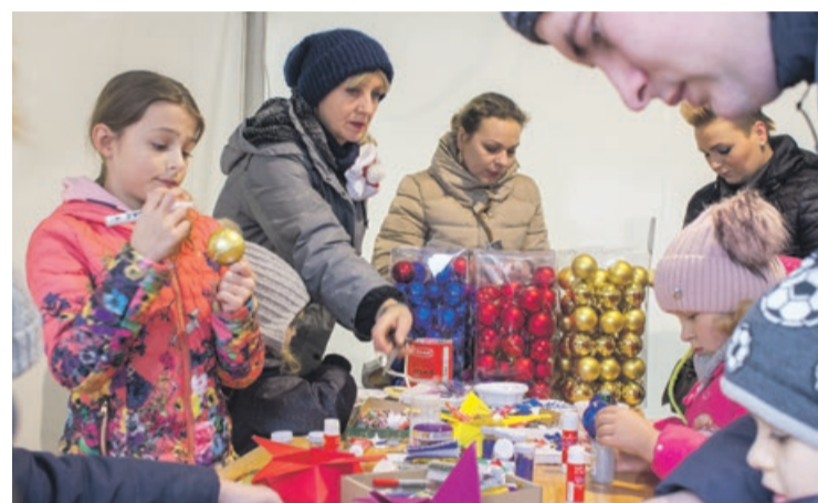
Taka choinkowa ozdoba będzie pamiątką na lata