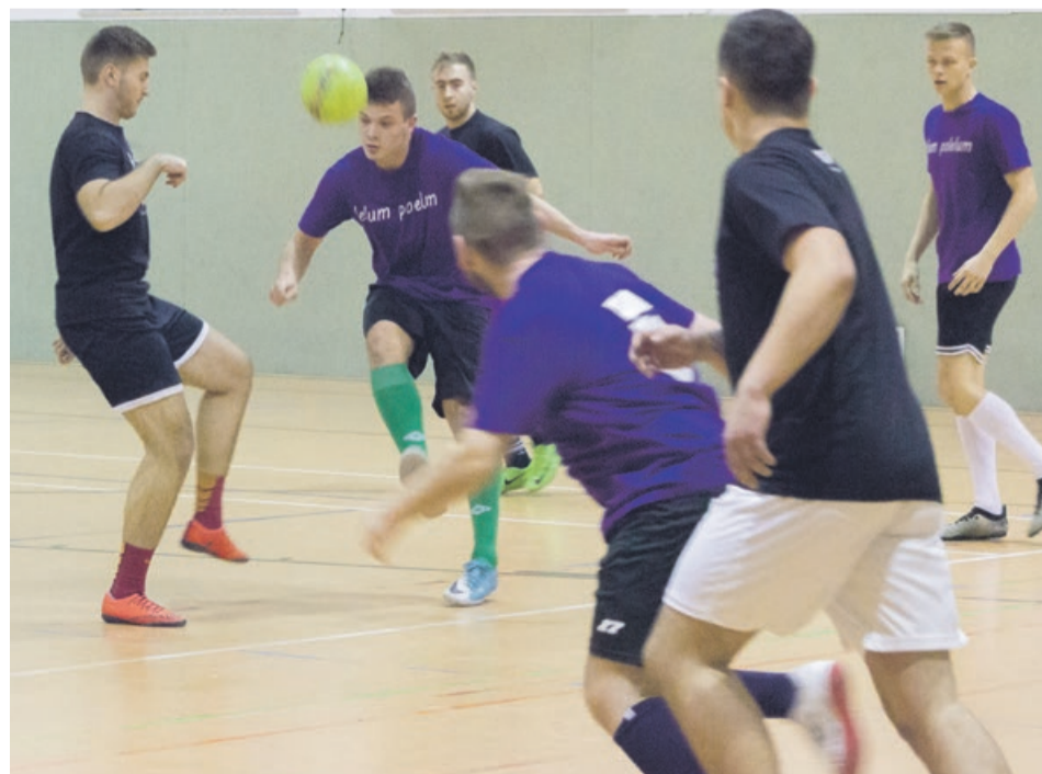
Lellum Polelum 1:1 ŻKSW