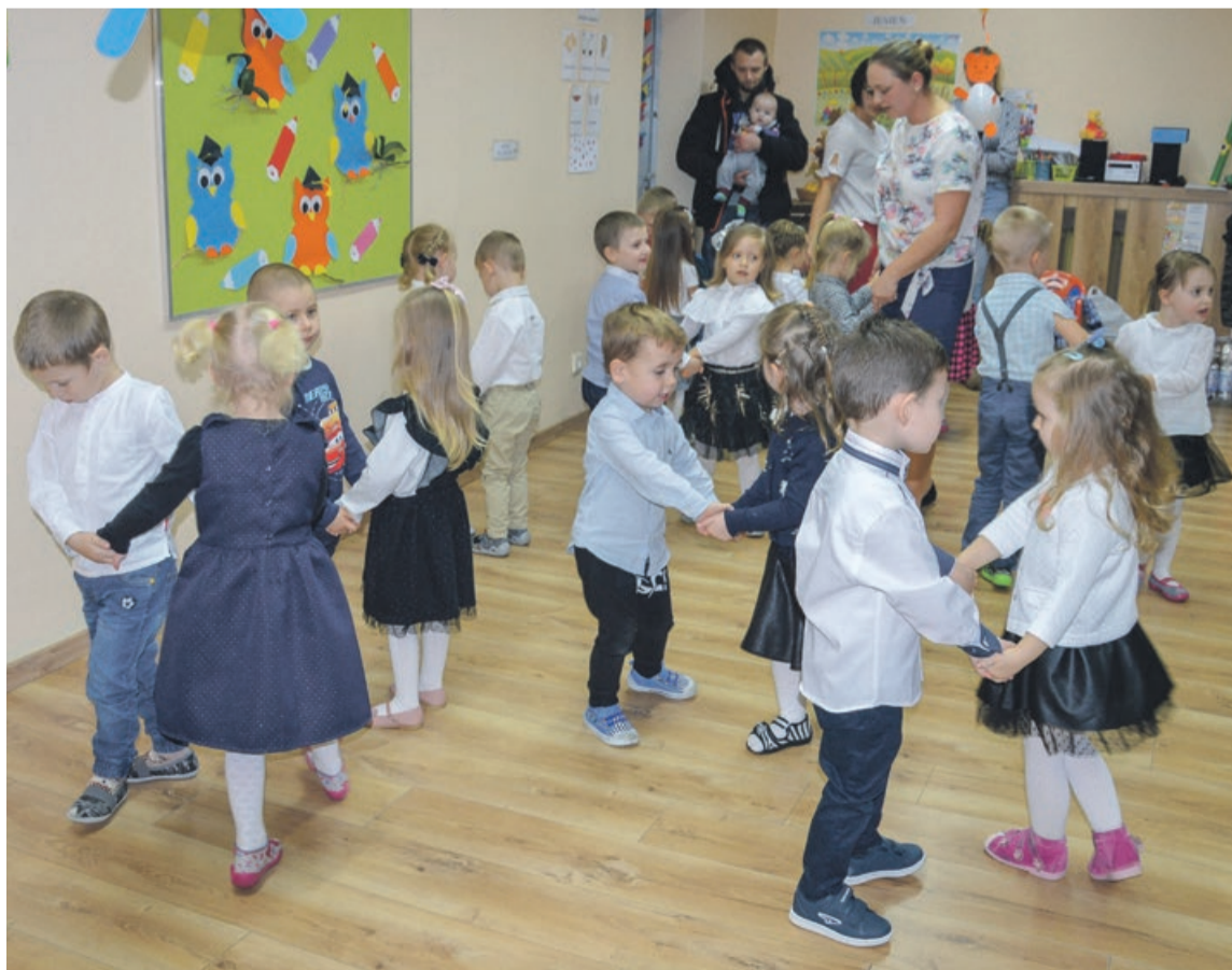
A zaraz po pasowaniu - tańce