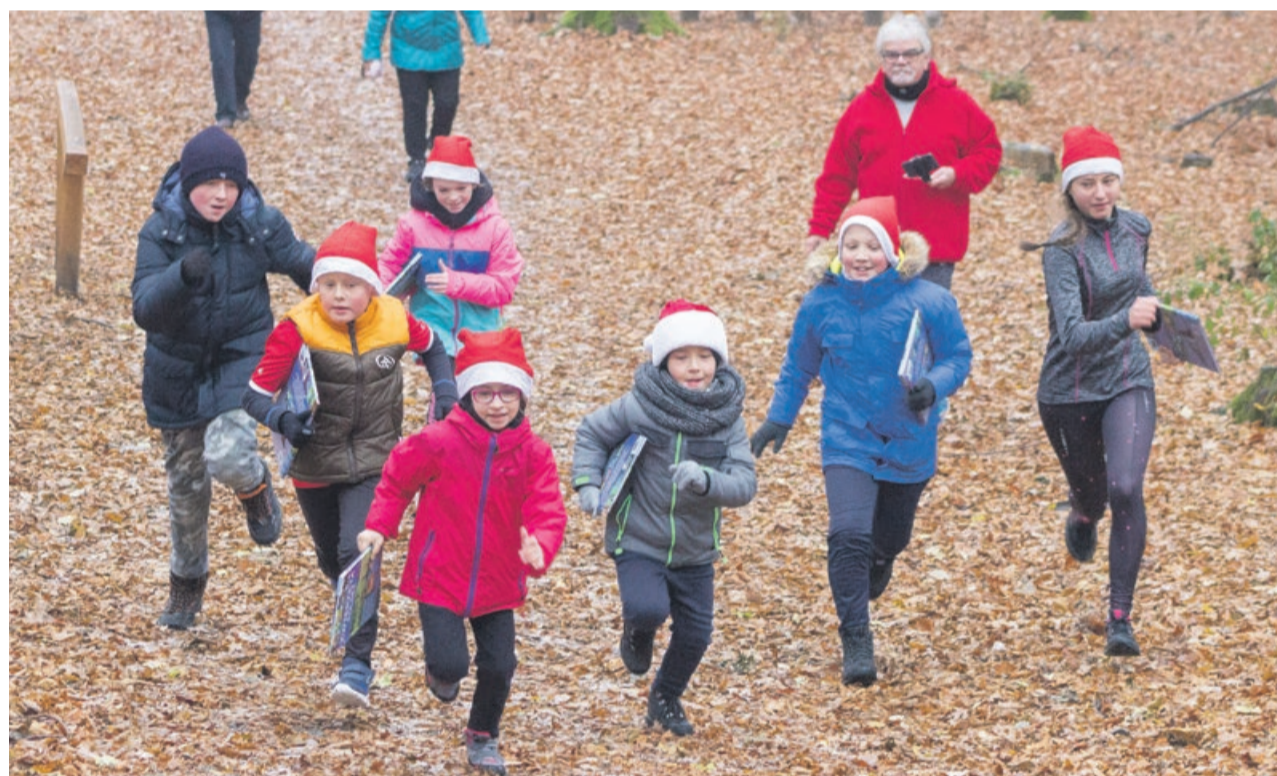
Dzieciaki dostały prezenty