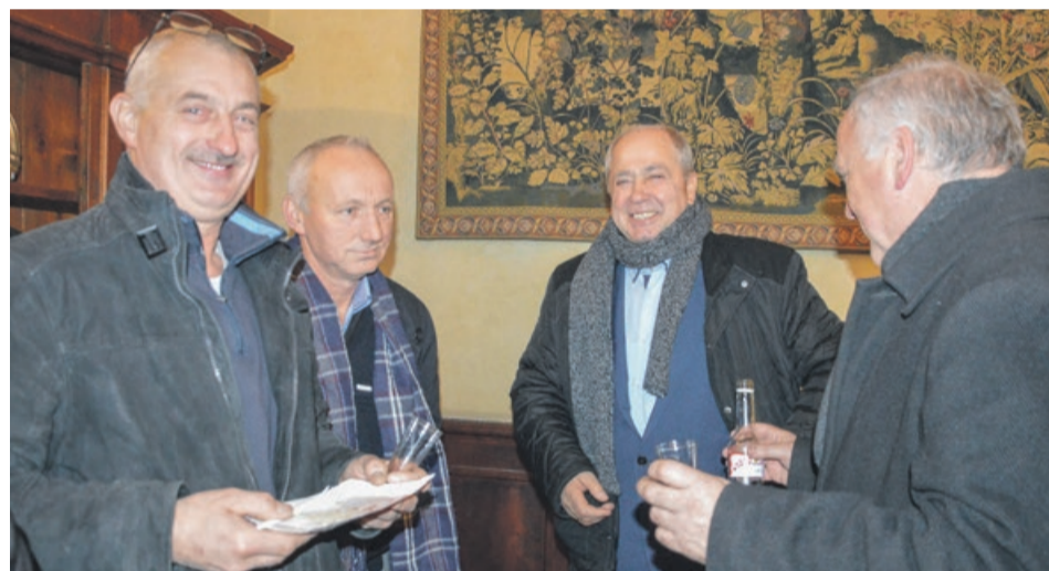
Spotkanie dobrych znajomych