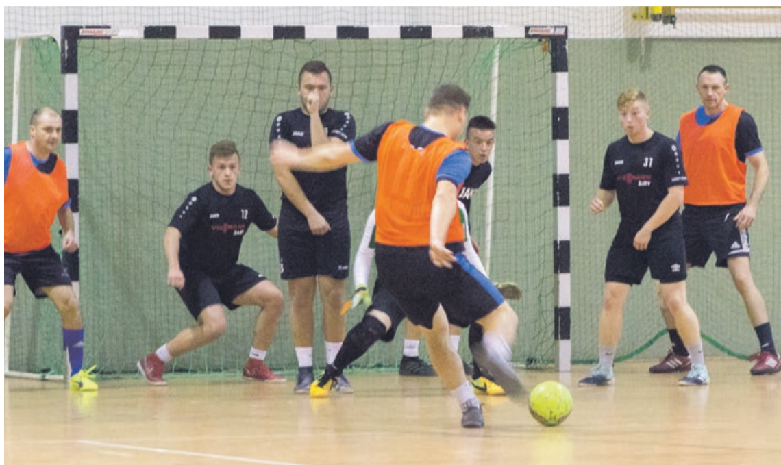
Viessmann Team wygrał mecz z MMalu 8:2