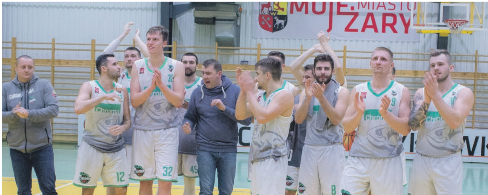
Ta ekipa jest na pewno sensacją II ligi