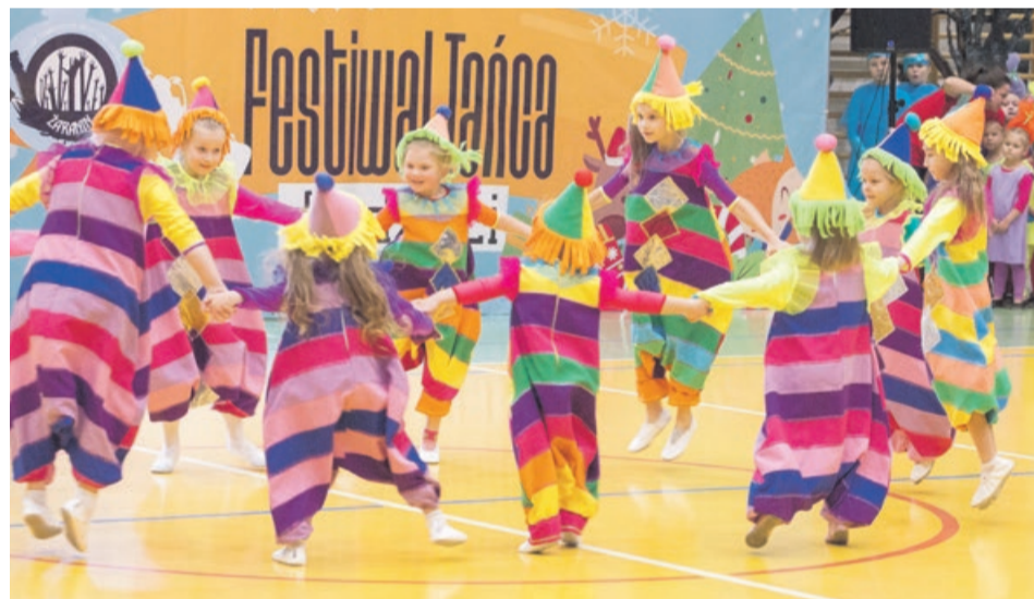
Kolorowo i wesoło - tak było właśnie na tym festiwalu