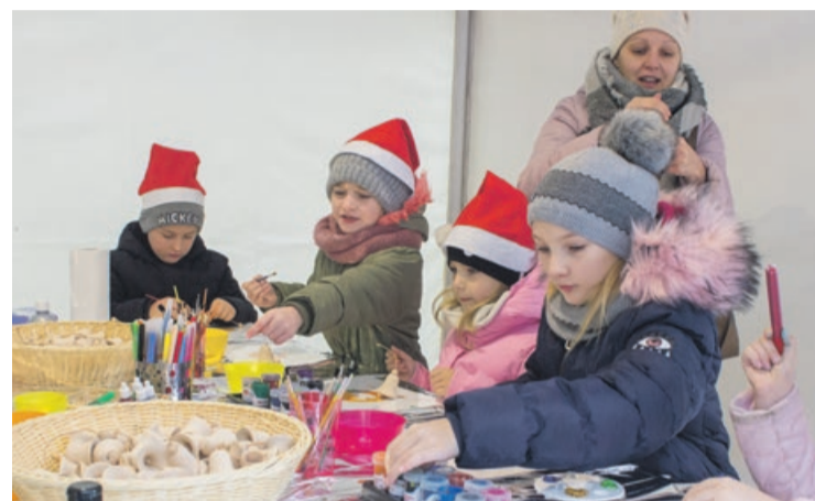
Dla dzieci przygotowano różne atrakcje