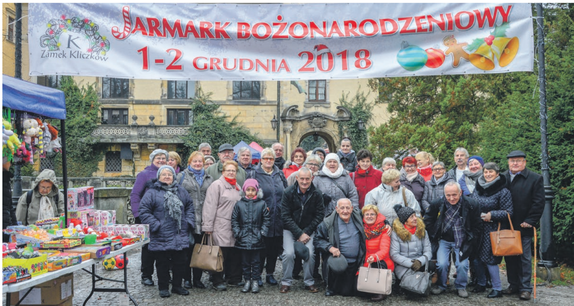
Wyjazd do Kliczkowa był bardzo udany