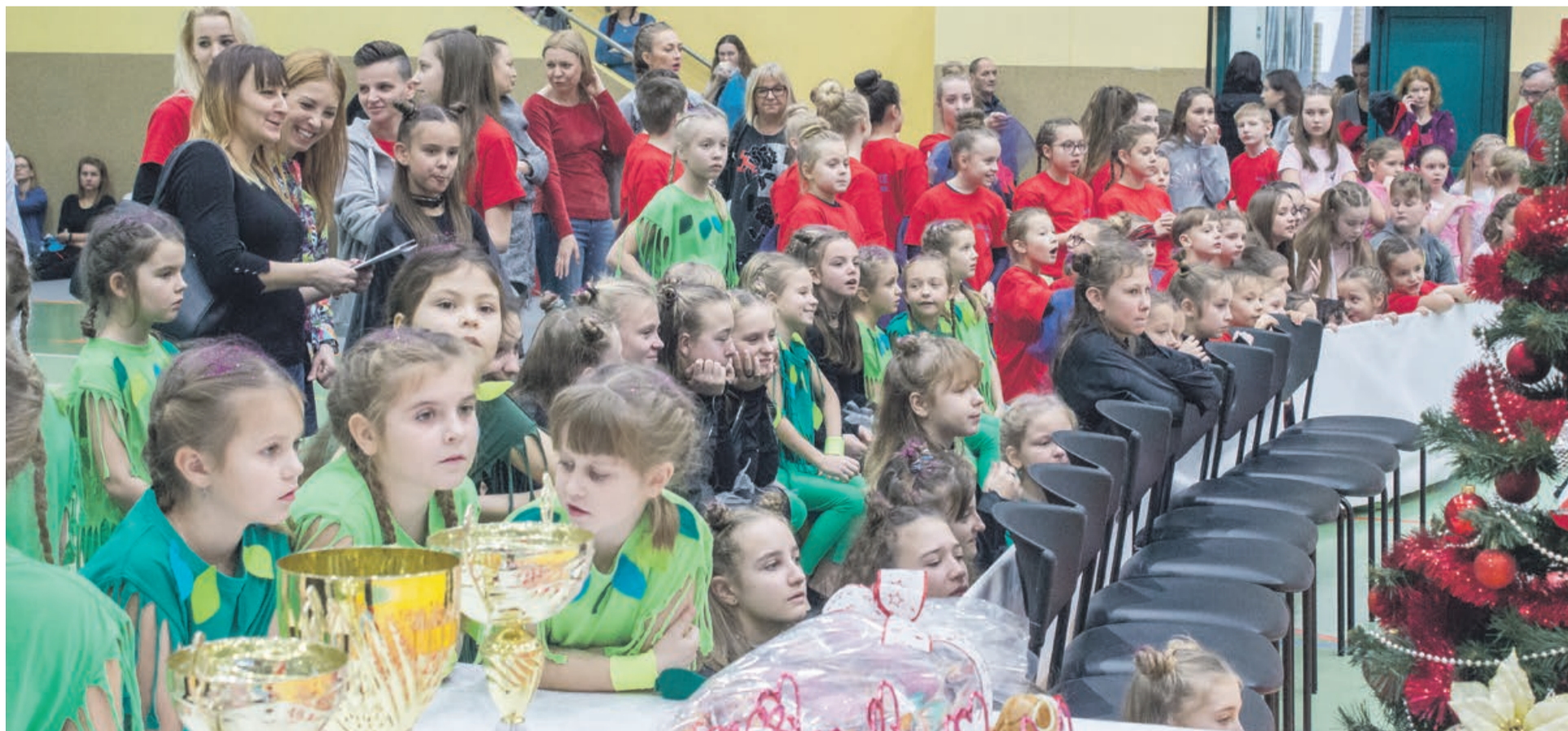
Oglądając występy koleżanek i kolegów z innych zespołów zawsze można się czegoś nauczyć