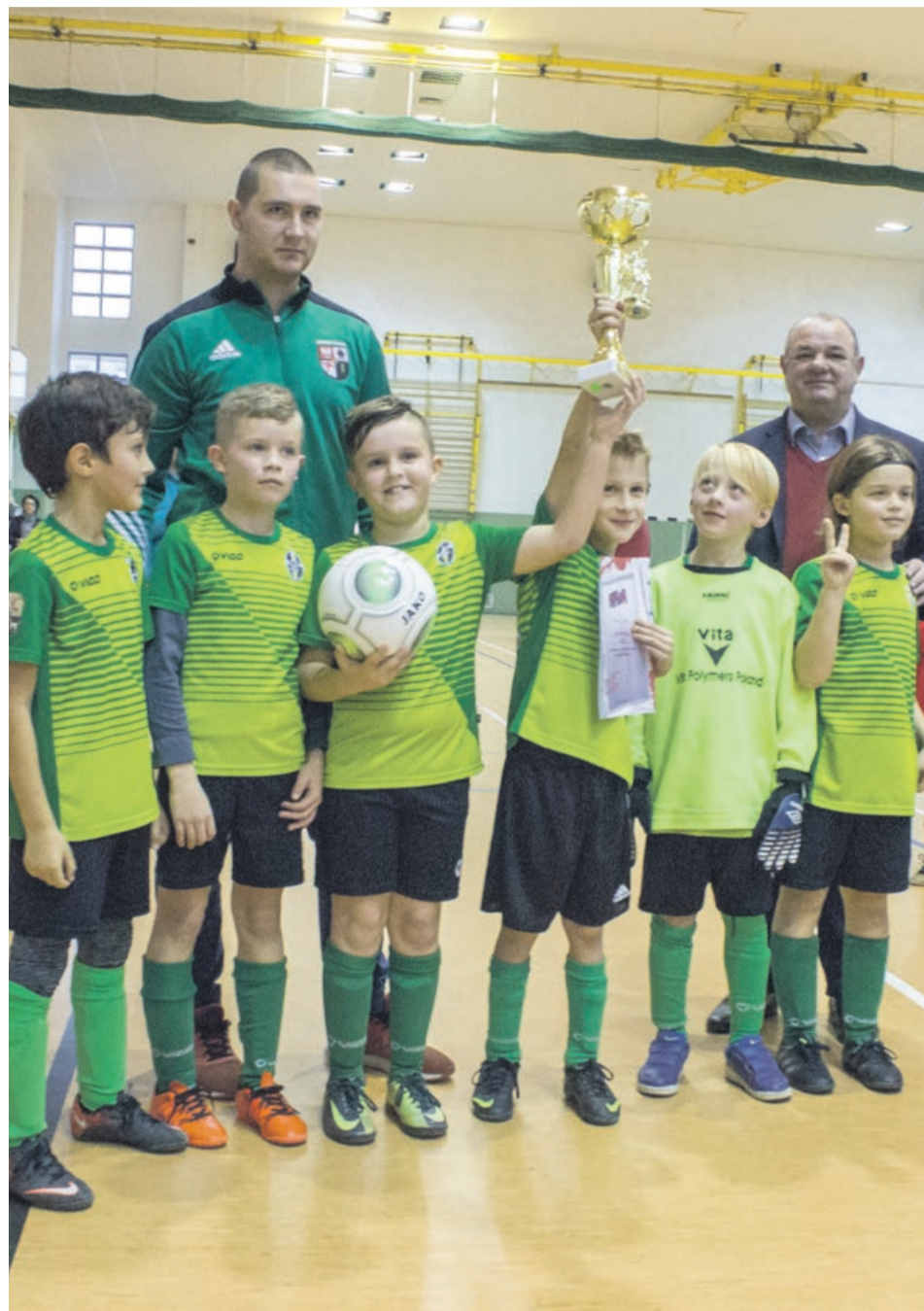
Radość z pucharu rekompensuje trudy turniejowych zmagañ