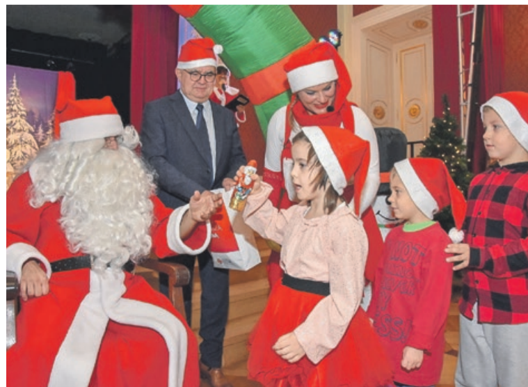
Dostać prezent od samego św. Mikołaja to jest coś

ści i uśmiechu na twarzach miłośników. Dzieci chętnie uczestniczyły we wspólnej zabawie podczas przedstawienia „Na ratunek św. Mikołaja”. Na zakończenie gość obdarował dzieci słodkimi prezentami i pozował do wspólnej fotografii. JM