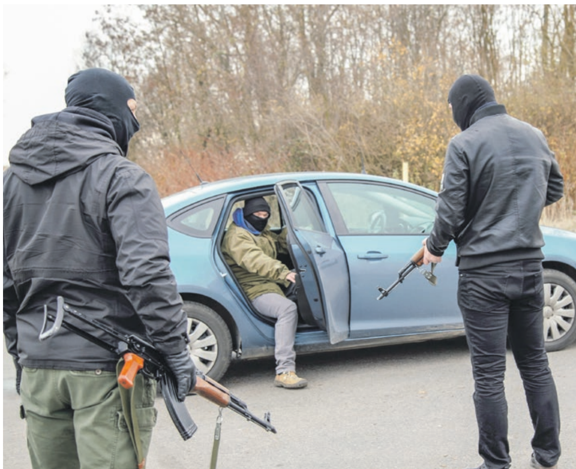
Zamaskowani napastnicy odbili z konwoju cudzoziemca