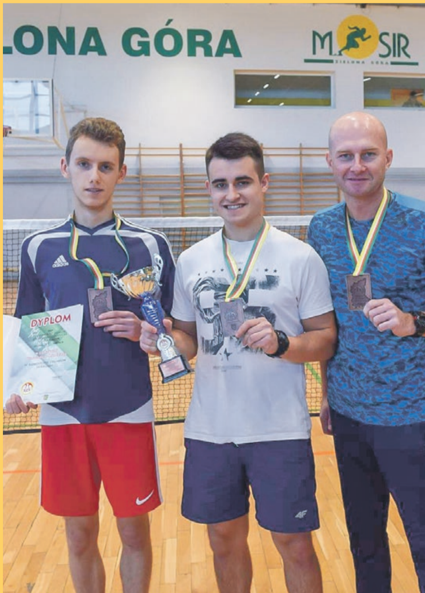
Takiego sukcesu w tej dyscyplinie jeszcze nie było

VII - IX miejsce CKZiU Nowa Sól, I ZS Wschowa, CKZiU Międzyrzecz, TG