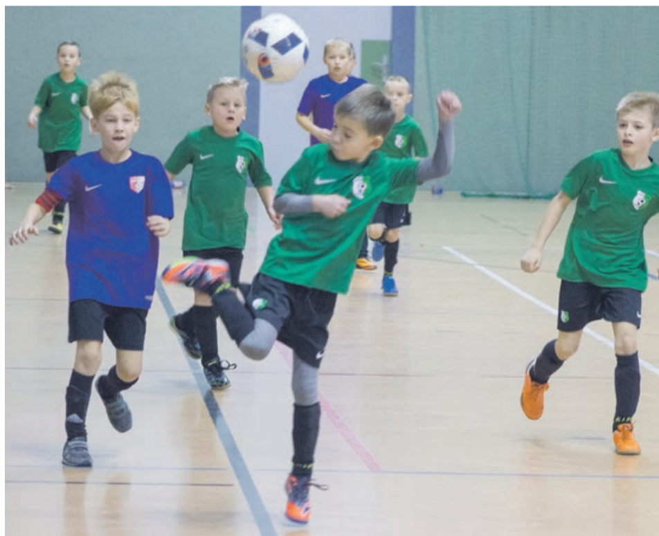
Każdy piłkarz na boisku dawał z siebie wszystko