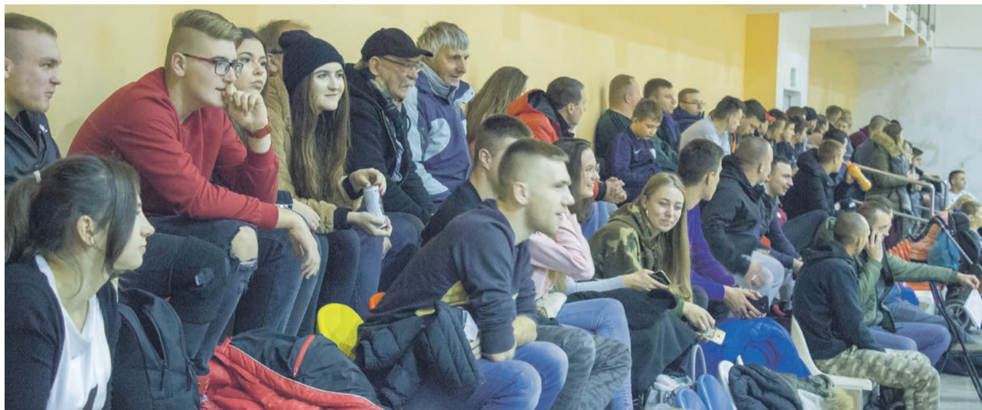
Na trybunach bywa tłoczno