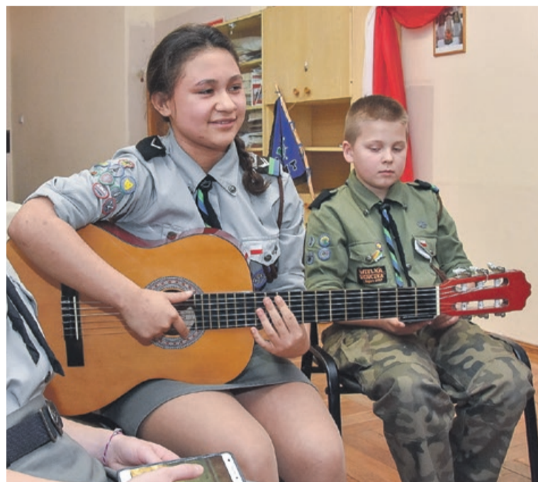
Harcerze przygotowali program artystyczny

nym organizacjach strzeleckich, frontowych szlakach kombatantów i losach osadników przybyłych w 1945 roku do Żagania i Żar. Relacje historyczne przybyłych gości zrobiły ogromne wrażenie na młodych słuchaczach. Harcerze przygotowali kilka piosenek i wierszy. Wspólne śpiewanie sprawiło wszystkim wiele radości. Była to niecodzienna lekcja historii i patriotyzmu. JM