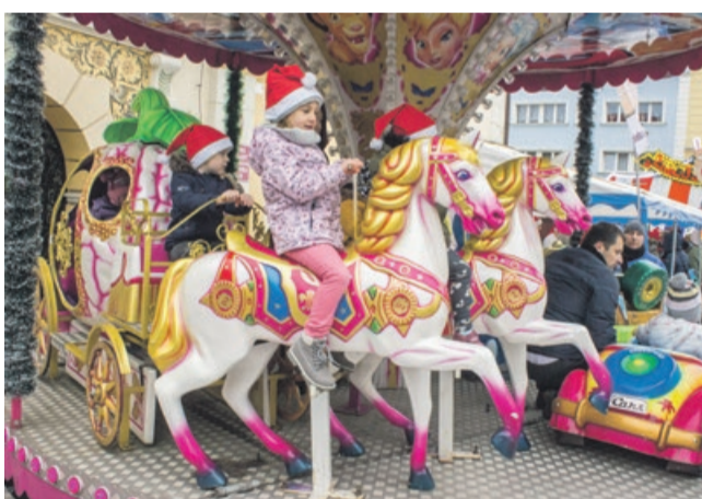
Karuzela nigdy się nie znudzi