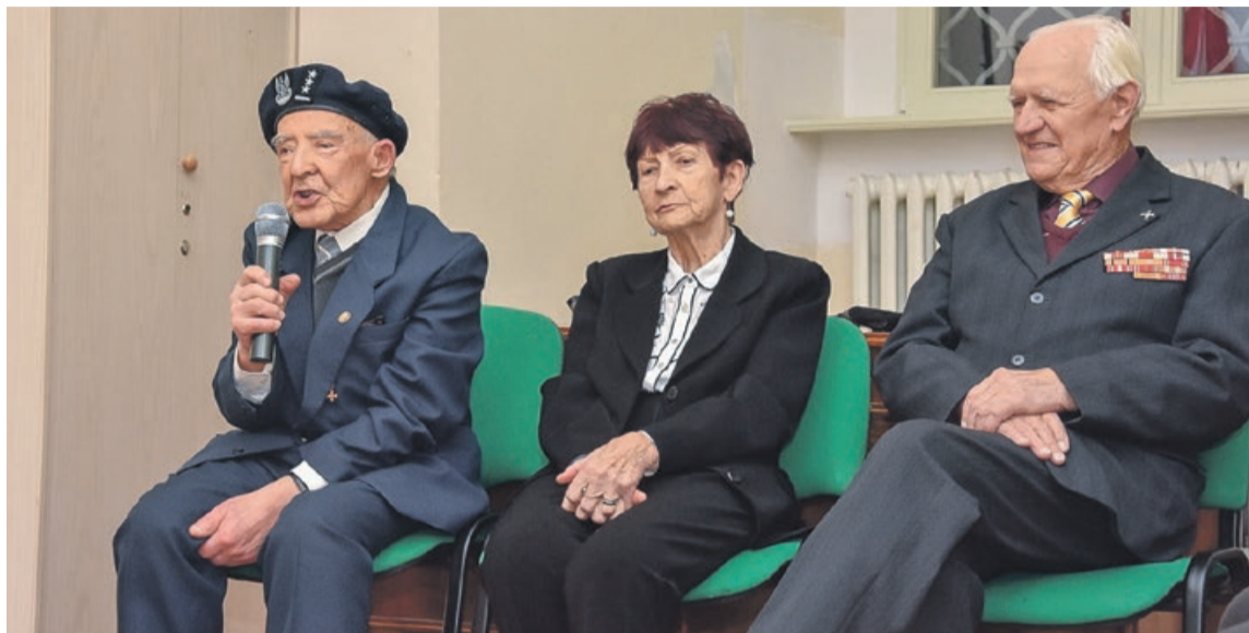
Kombatanci żywo opowiadali o historii