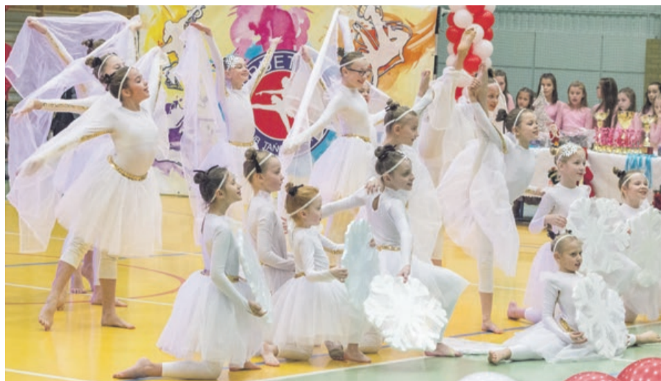
Niektóre prezentacje były bardzo widowiskowe