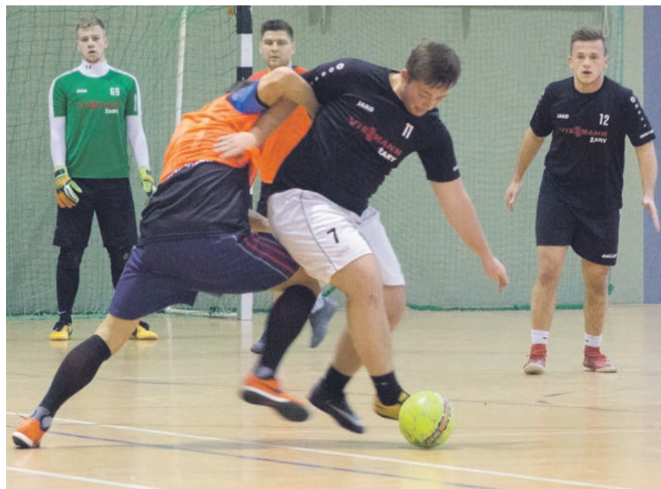
Tu nikt tanio skóry nie sprzedaje