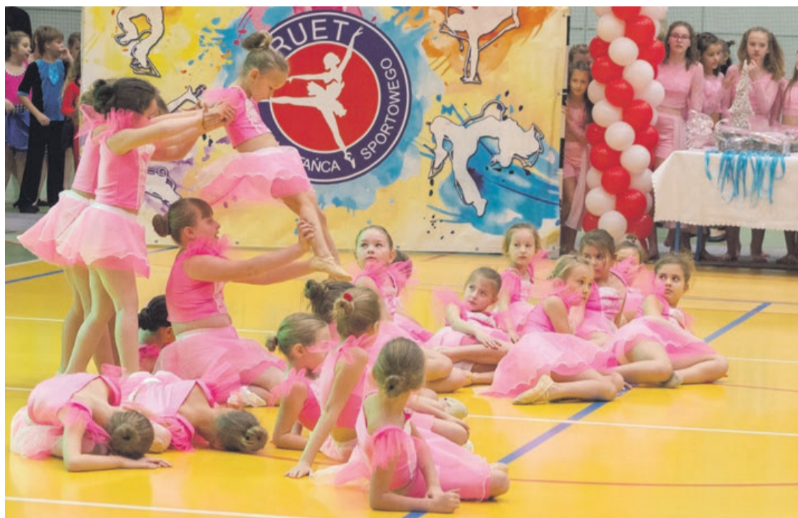
Choreografia każdego występu przygotowana była bardzo starannie

Nagrodę Grand Prix otrzymał zespół „Ferwor Trans” z Lipiek Wielkich za całokształt, zaś Nagrodę Specjalną „Trans 3” z Sulęcina za choreografię „Złote Rybki”. ATB