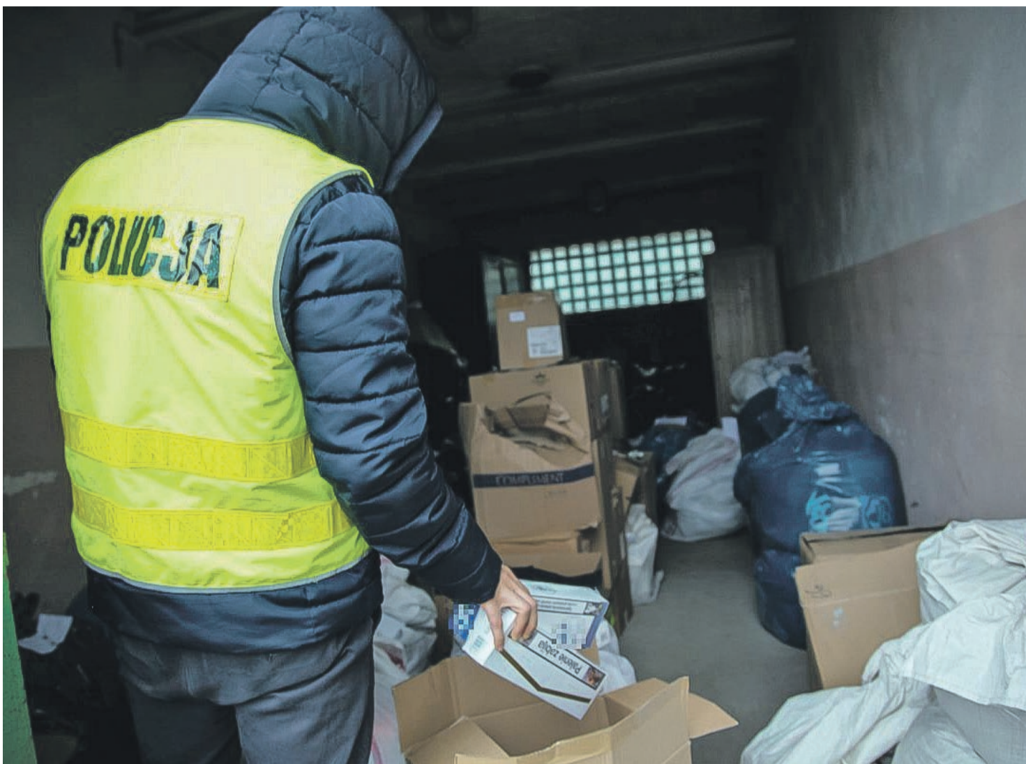
Papierosy nie trafiają już do Niemiec

- Wartość kontrabandy to blisko 60 tys. złotych. Jak ustalili policjanci nielegalne papierosy miały trafić do Niemiec. Młody mężczyzna odpowie teraz za przestępstwo skarbowe, 23-latkowi grozi kara grzywny - informuje kom. Aneta Berestecka, oficer prasowy KPP w Żarach. PAS