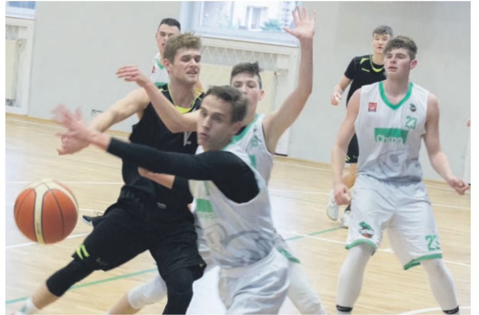
Koszykarze ze Zgorzelca wyjechali z Żar z porażką

nali reprezentację Turów Zgorzelec wynikiem 118:80. Wysoką przewagę w tym spotkaniu zaznaczyli już na koniec pierwszej połowy, kiedy to różnica punktów wynosiła 26 na korzyść żarskiego Chromika. ATB