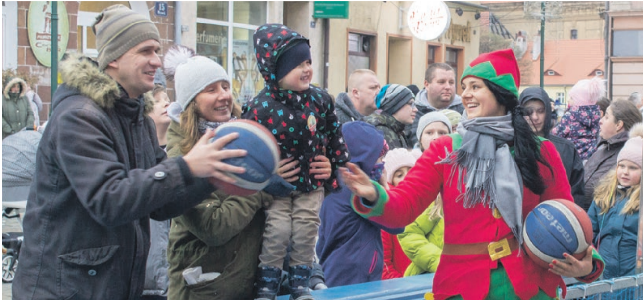
Bawiły się nie tylko dzieci