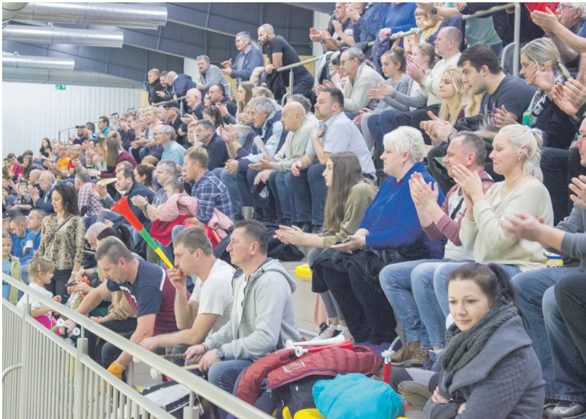
Takich kibiców wszyscy mogą Żarom zazdrościć