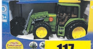
Traktor John Deere 6920 z ładowaczem