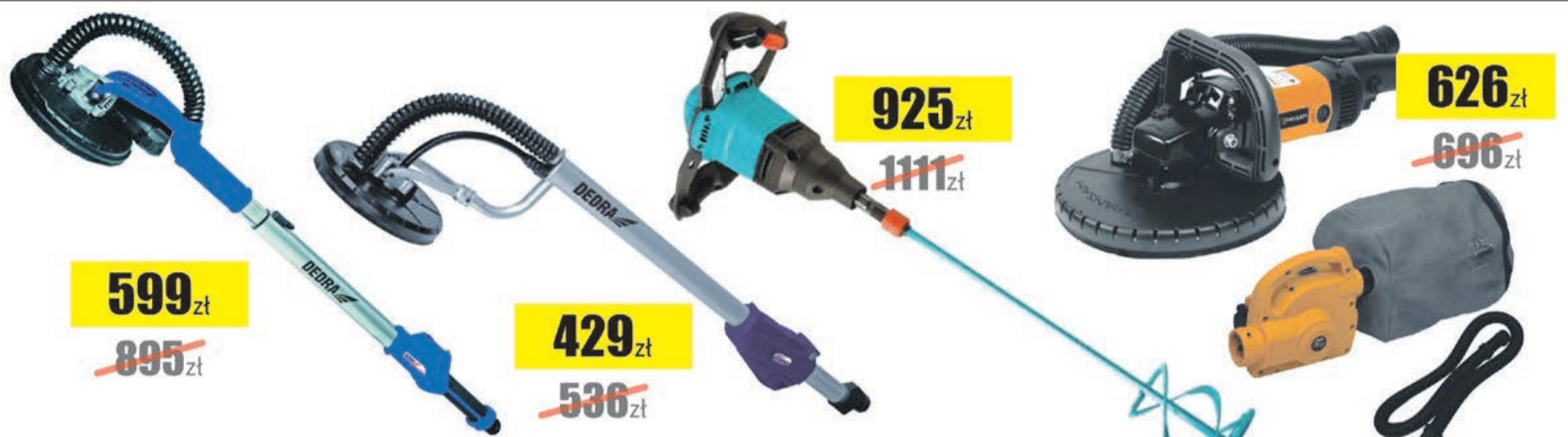
Szlifierka 710W do pow. gips. z przekładnią Dedra