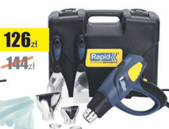
Opalarka Thermal 1800W walizka+akcesoria Rapid