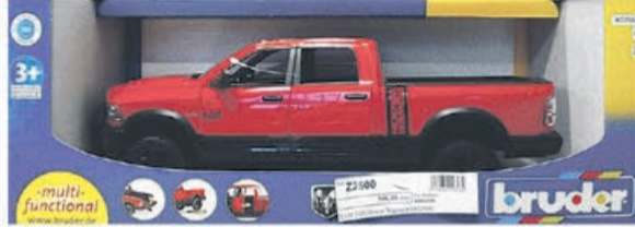
RAM 2500 Power Wagon