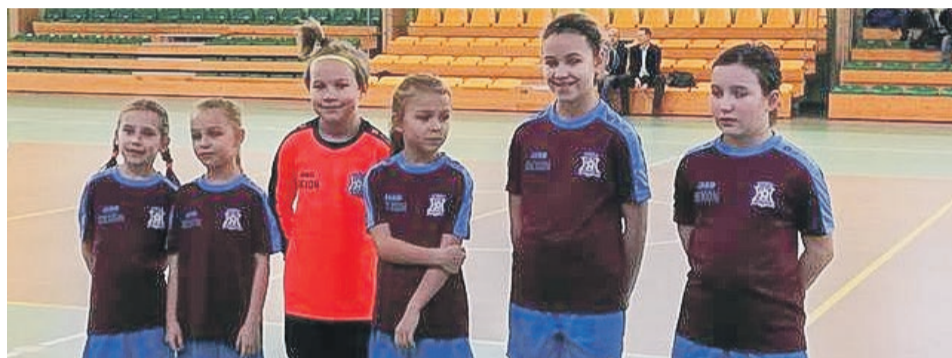
Reprezentantki Hat-Trick Lubsko zaprezentowały się znakomicie

tacje z roczników 2008, 2009 i 2010. Dla tych zawodniczek był to turniejowy debiut i jak na pierwszy raz, poszło im całkiem nieźle. Promyczki zajęły trzecie i czwarte miejsce. Tryumfatorkami były młode piłkarki z Lubska reprezentujące MUKS Hat-Trick. Wygrały wszystkie mecze zdobywając komplet punktów. ATB