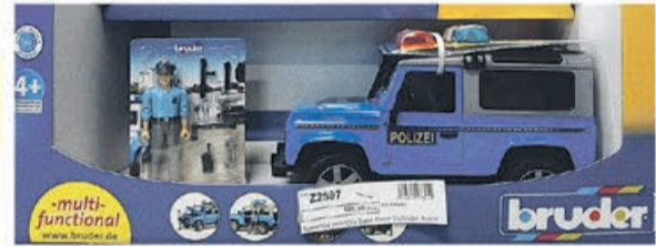
Samochód policyjny Land Rover Defender Station z figurką