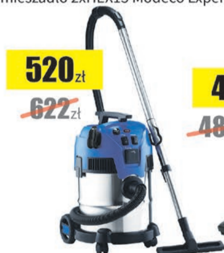
Odkurzacz Multi II 22 inox EU Nilfisk