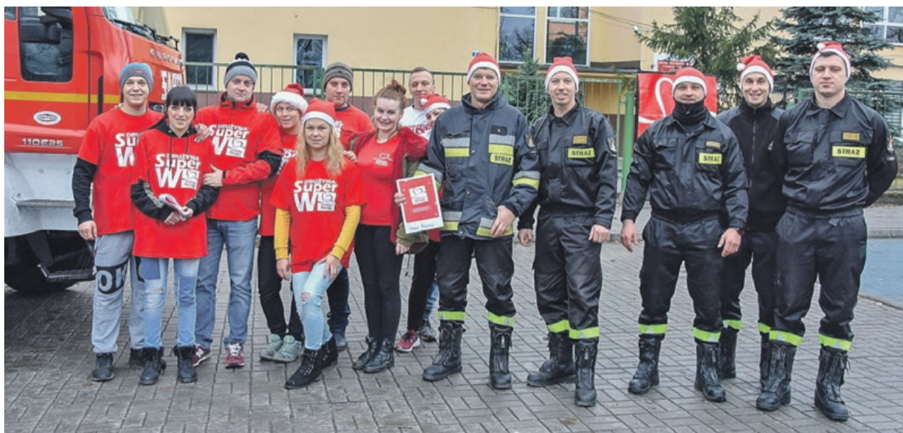
Razem ze strażakami działamy na rzecz innych