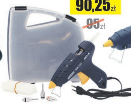
Pistolet do kleju EG250 w walizce PCV Rapid