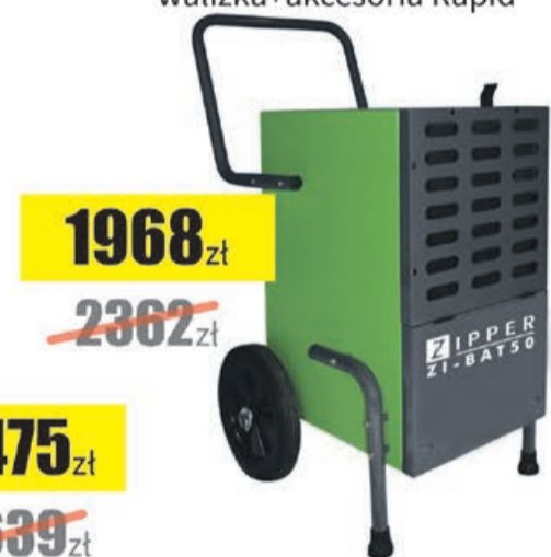
Budowlany osuszacz powietrza Zipper