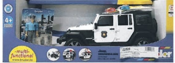
Samochód policyjny Jeep Wrangler Unlimited Rubicon z figurką policjanta