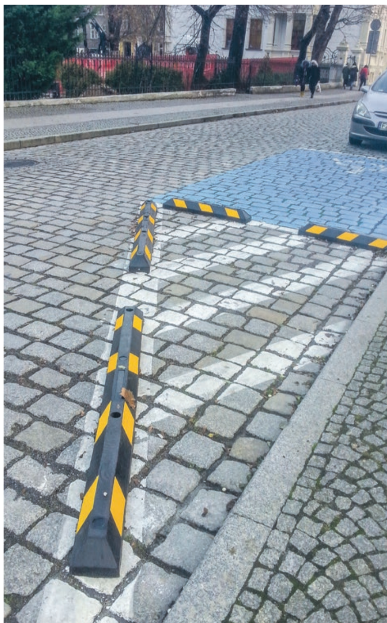
Parkujący na niebieskiej kopercie często nie ma wyjścia. Jeżeli ktoś zaparkuje za nim, to może jechać tylko do przodu - po pachołkach