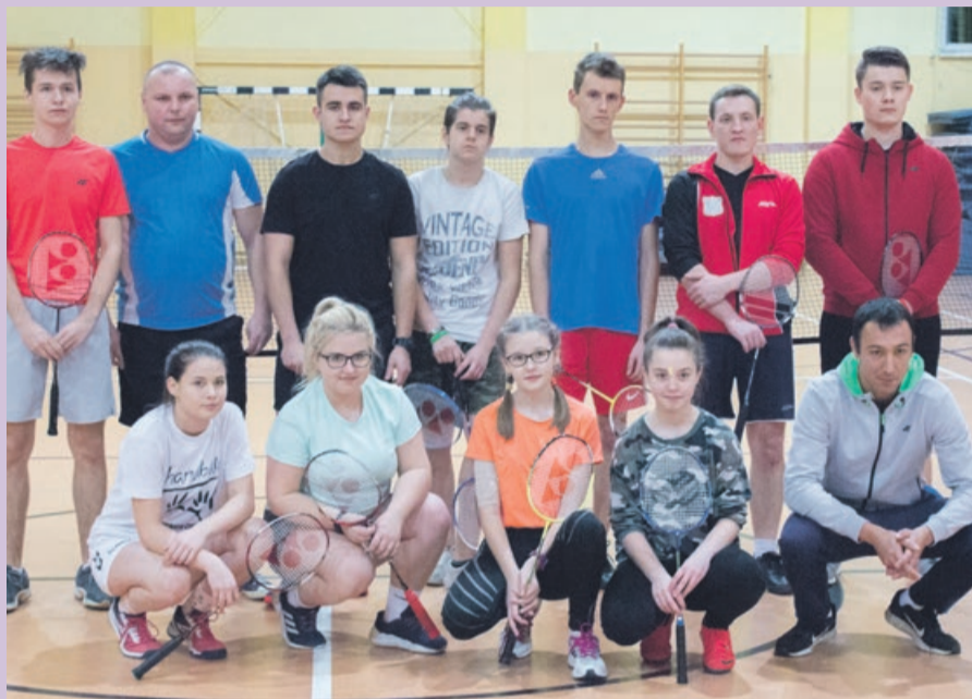
Turniej w Lipinkach Łużyckich rozegrano w trzech kategoriach

BADMINTON Turniej rozegrano w nieco świątecznej scenerii. Równoległe, obok hali sportowej trwał kiermasz bożonarodzeniowy.