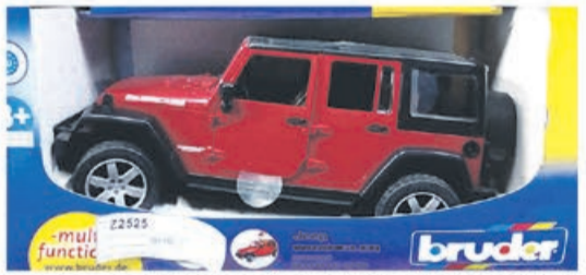
Bruder Jeep Wrangler Unlimited Rubicon