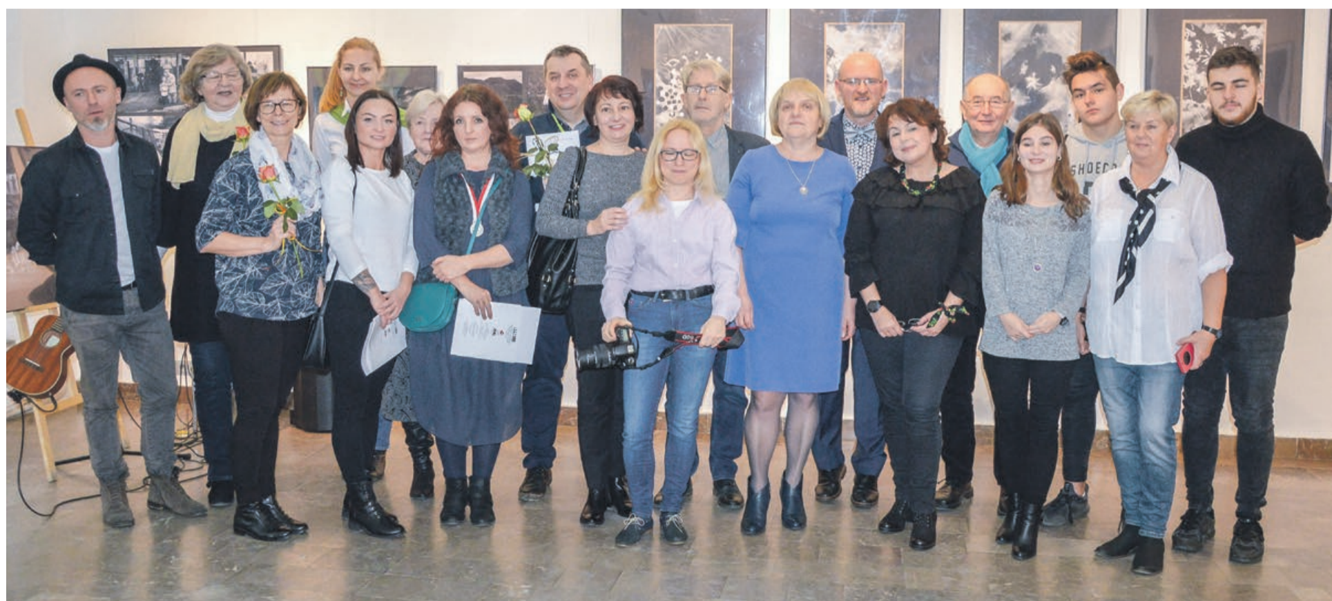
Chociaż na wernisażu zabrakło wielu nagrodzonych autorów, to członkowie jury podkreślali, że na konkurs co roku trafiają prace na wysokim poziomie