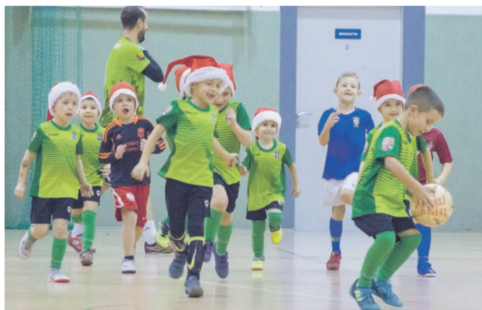
Piłka sprawia im radość