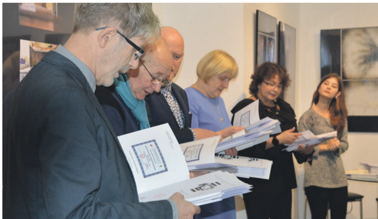
Organizatorzy przygotowali okolicznościowe dyplomy i katalogi