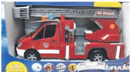
Wóz strażacki z drabiną i sygnałem