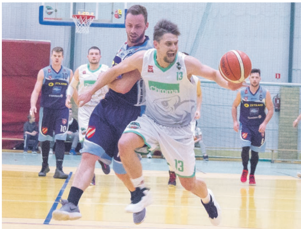
Jest walka, są wyniki