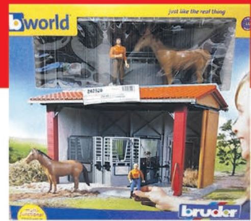
Zestaw stajnia, konik i figurka kobiety