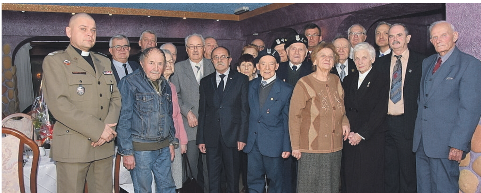
Spotkanie jest zawsze okazją do wspomnień

Spotkanie jest okazją do wspólnych wspomnień z okresu wojny, zesłania na Sybir, ale również do podsumowania działalności organizacji kombatanckich w mijającym roku. Kombatancki zostali uhonorowani dyplomami i upominkami. Było dzielenie się opłatkami, śpiewanie kolęd, życzenia zdrowia i wspólnego spotkania w przyszłym roku. JM