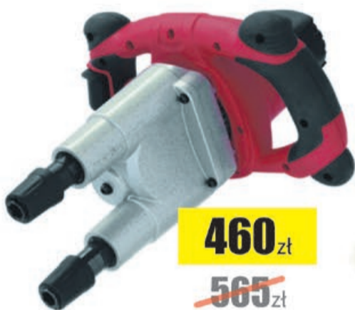
Mieszarka 1600W, 2 biegi, mieszadło 2xHEX13 Modeco Expert