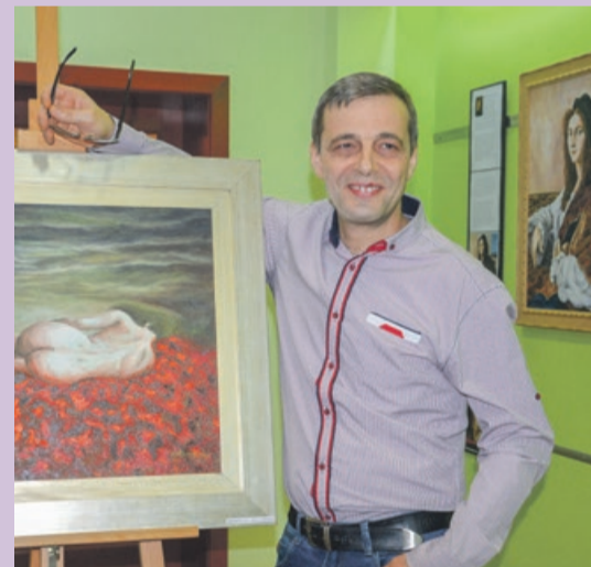
Kopie obrazów wielkich mistrzów, portrety i kobiece akty. Mirosław Janiszewski tworzy prace o różnej tematyce, stosując różne techniki malarskie