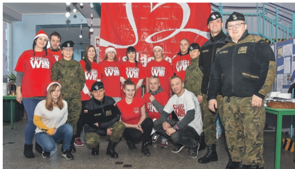
Wspólnie osiągniemy więcej