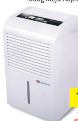
Osuszacz powietrza 900W 50L/24H zbiornik 8L Dedra