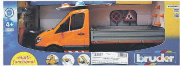
Bruder MB Sprinter "Pomoc drogowa"