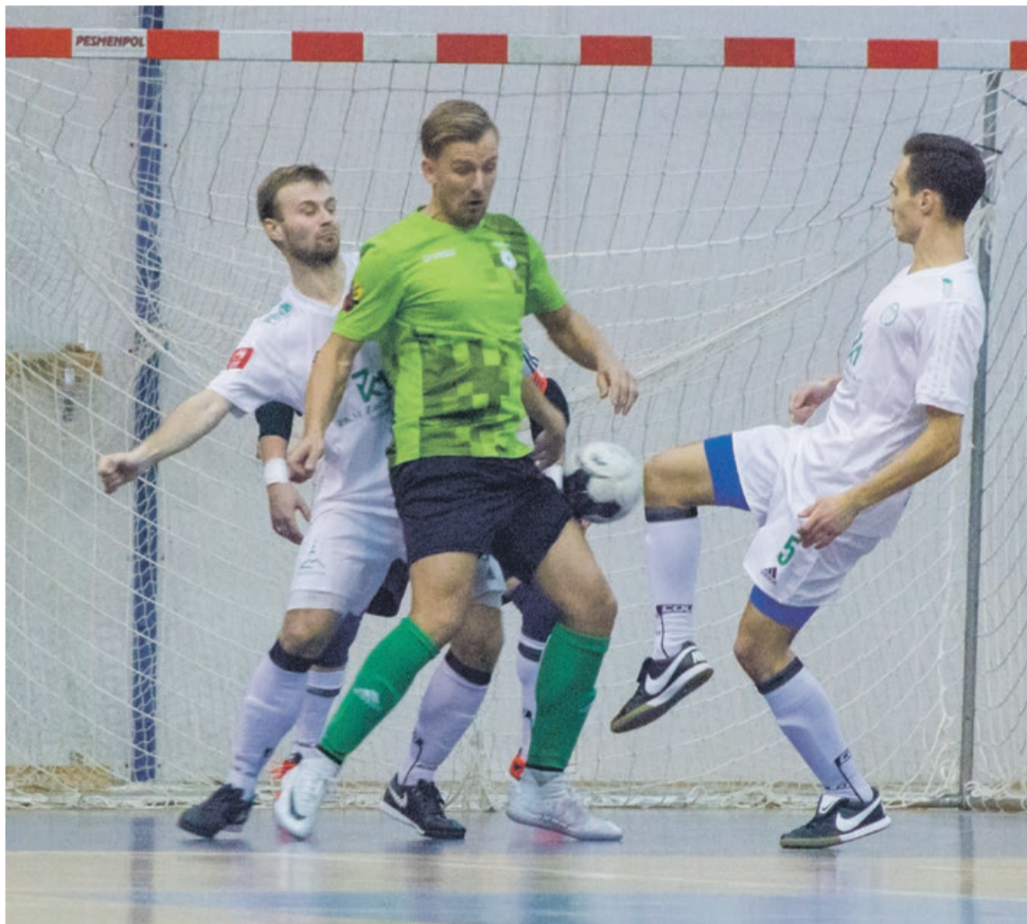
Zielonogórzanie skutecznie bronili dostępu do swojej bramki