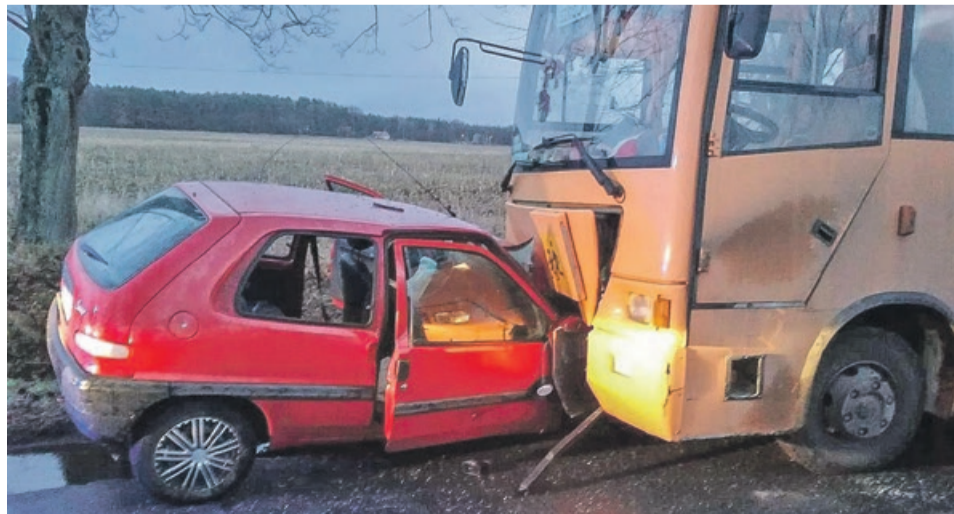
Kolizja wyglądała groźnie

Autokar przewoził dzieci. Przed przyjazdem patrolu zostały one już zabrane przez opiekunów i rodziców. Jak ustalili policjanci nikt nie ucierpiał, prócz kierowcy citroena. 24-latek, mieszkaniec pow. zielonogórskiego został zabrany do szpitala na badania. Według ustaleń wynika że, mężczyzna ściał zakręt, doprowadzając do czołowego zderzenia. Kierujący obu pojazdami byli trzeźwi. PAS