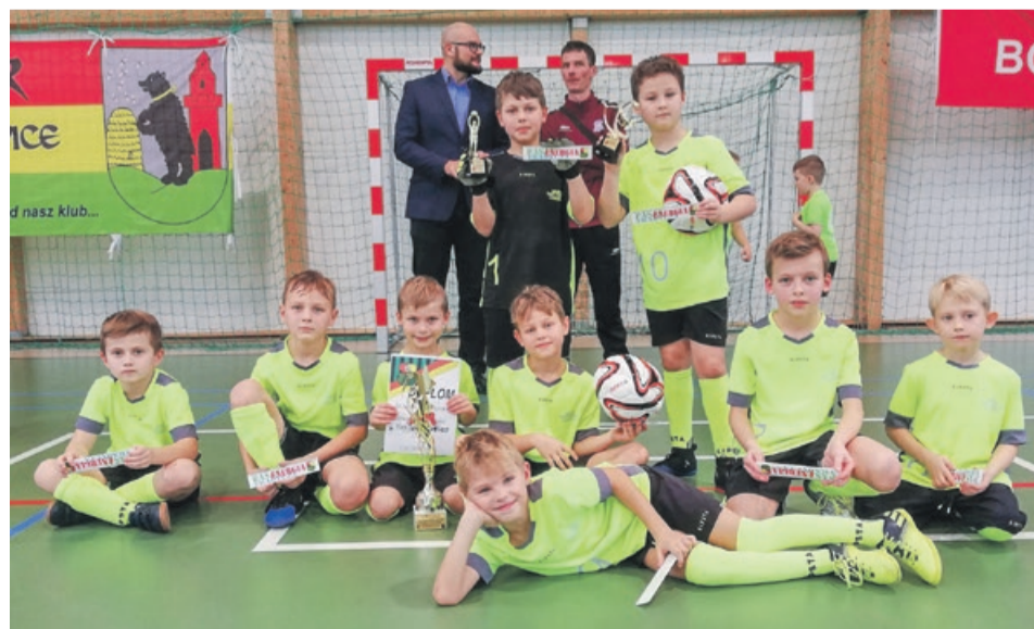
Zwycięska ekipa żaków z Lubaska