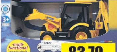
Koparko-ładowarka JCB MIDI CX