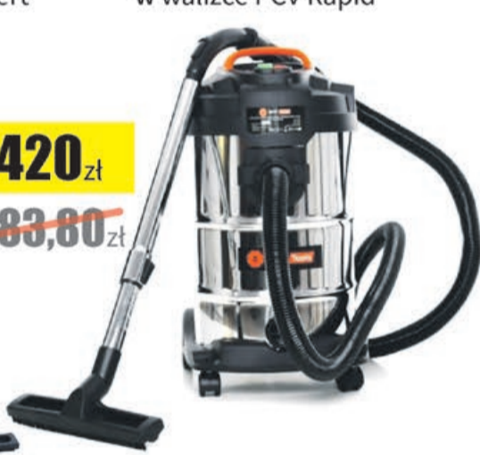
Odkurzacz wielofunkcyjny OW1230AOF Best Tools