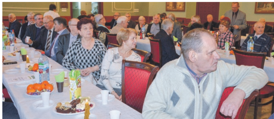
Zebrani w skupieniu wysłuchali okolicznościowych życzeń