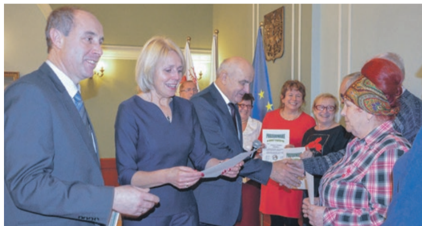
Spotkanie było okazją do wręczenia nagród i podziękowań