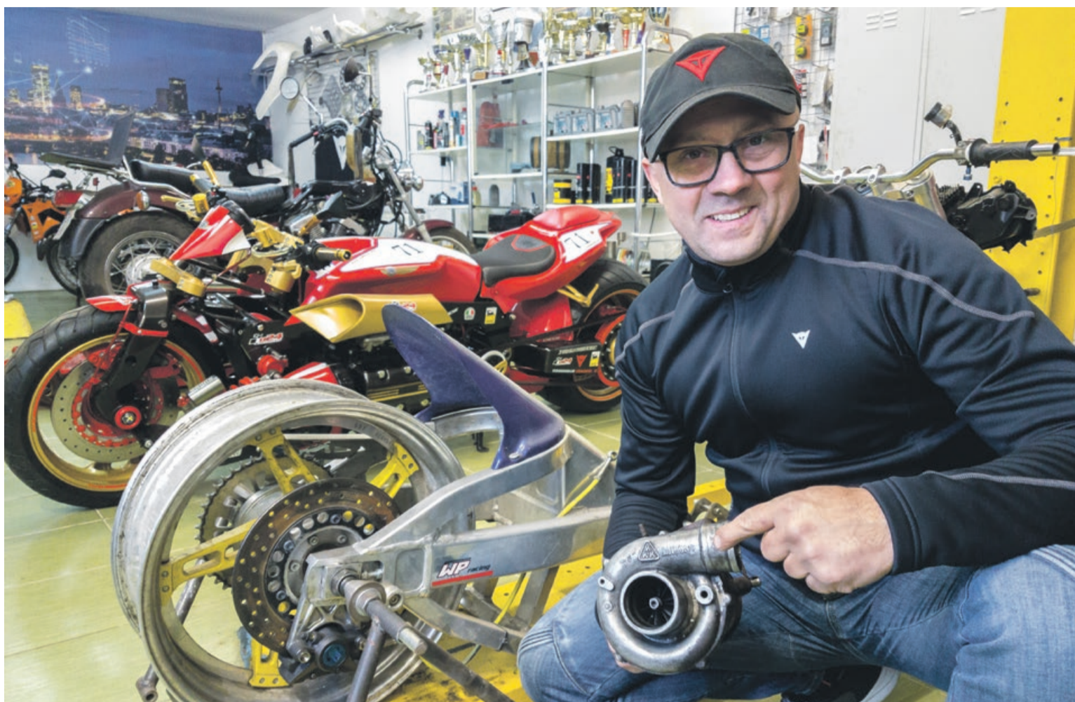
Kolejny motocykl „Szajby” będzie wyposażony w turbodoładowanie. Szykuje się piękna i szybka maszyna

- Z tym obecnym, który zdobył nagrodę publiczności na ostatnich Mistrzostwach Świata w Niemczech, chciałbym jeszcze pojechać na Mistrzostwa Polski oraz Mistrzostwa Europy do Czech.