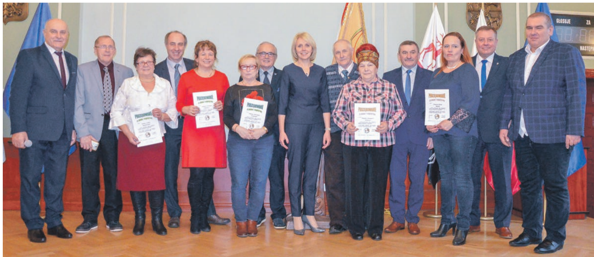
Spotkanie miało uroczysty charakter