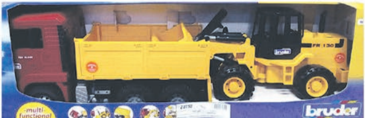
Wywrotka z ładowarką MAN TGA