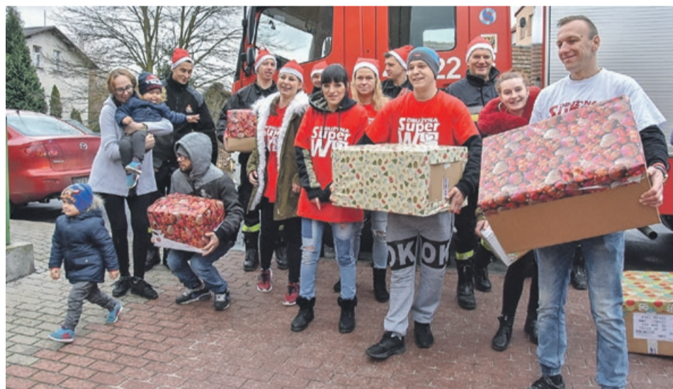
Paczki trafiają do potrzebujących