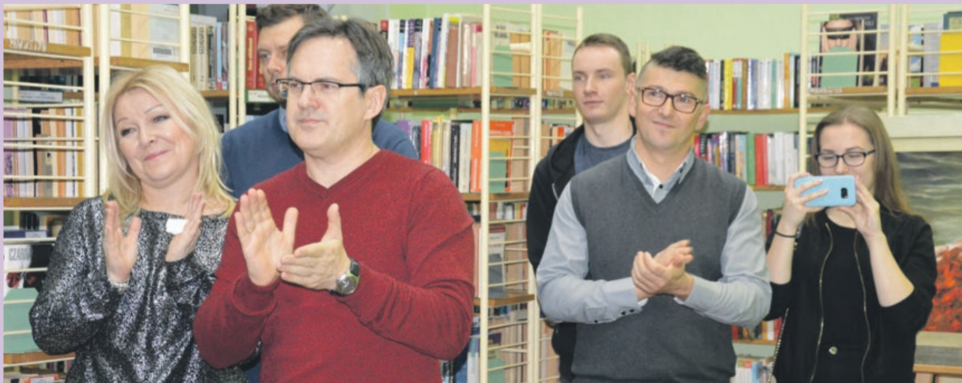
Brawa dla twórcy były najlepszym podsumowaniem otwarcia wystawy