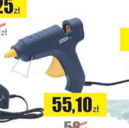
Pistolet do kleju EG111 +500g kleju Rapid