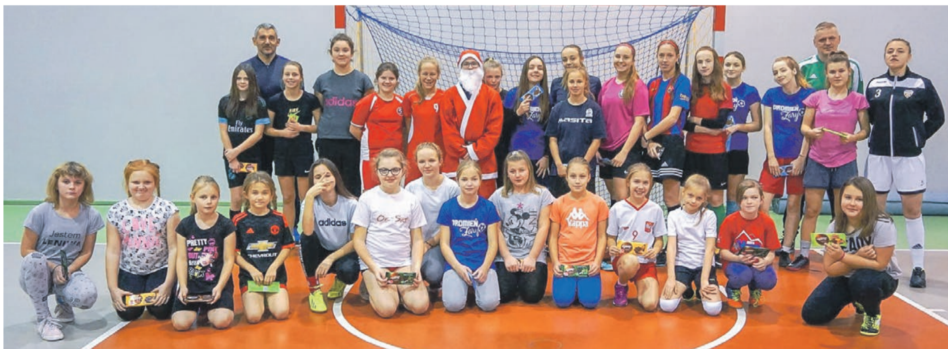
ŻARY | Podczas treningu do piłkarek Promienia Żary zawitał Mikołaj, choć pewne źródła podają, że była to Mikołajka. Tak czy siak, słodczyce były na pewno