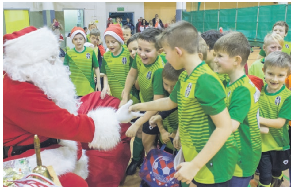
Na ten moment czekali wszyscy

Mundial prowadzi dwie grupy wiekowe - żaków i orlików. W treningach bierze udział około 40. młodych piłkarzy. ATB