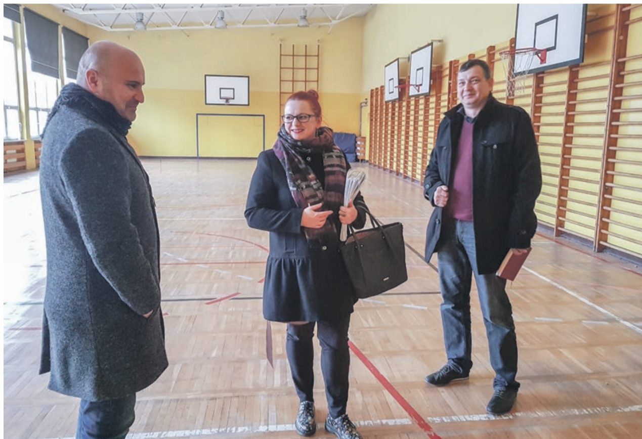
Sala sportowa służyć będzie zarówno seniorom, jak i młodym sportowcom

- To dobre miejsce dla tej instytucji, centrum miasta, jest dobry dojazd, parking, blisko centrum przesiadkowego - wylicza Olaf Napiórkowski, wiceburmistrz Żar. - W końcu ta in-