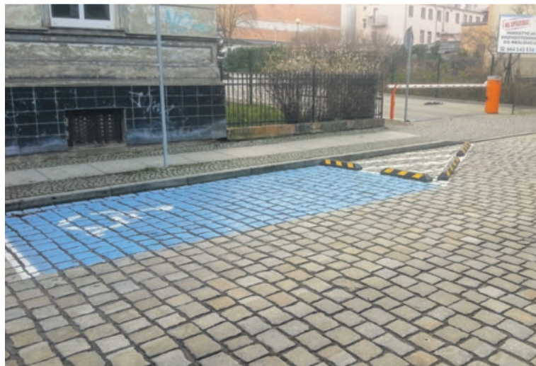
Niektórzy kierowcy próbują uparczywie zaparkować przed niebieską kopertą. To stwarza problemy dla wjeżdżających i wyjeżdżających mieszkańców bloku mieszkalnego