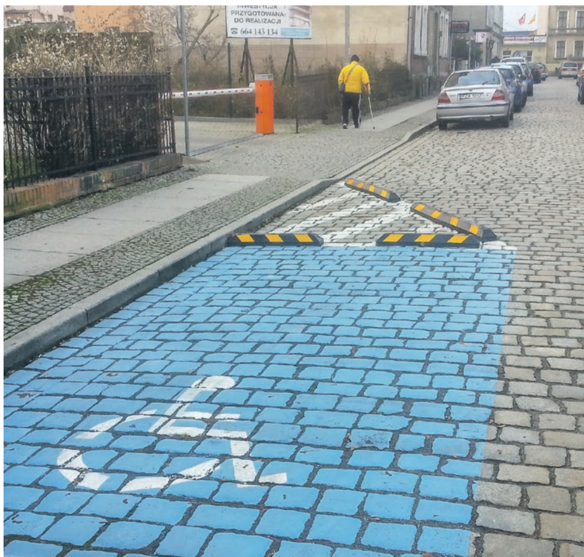
Może lepszym rozwiązaniem byłoby przesunięcie niebieskiej koperty za wjazd?