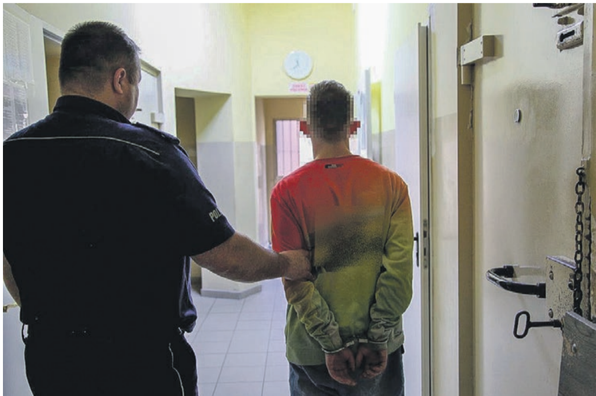
Młody mężczyzna znalazł sobie sposób na zarobienie pieniędzy

- Sąd przychylił się do wniosku Prokuratury Rejonowej w Żarach i aresztował mężczyznę na trzy miesiące. Grozi mu kara do 10 lat pozbawienia wolności.- informuje kom. Aneta Berestecka, oficer prasowy KPP w Żarach. PAS