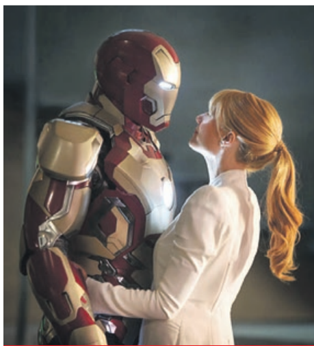
Iron Man 3 TVN, niedziela, godz. 21:35