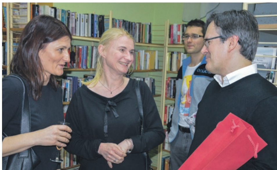
Rozmowom przy znakomitym cieście i winie nie było końca