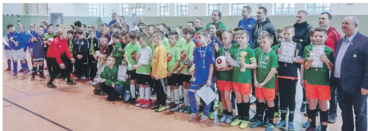
Zawody rozegrano w hali Powiatowego Centrum Sportu w Żarach

Sędzia piłkarski w latach 1978-1998, który sędziował około 1000 meczy. Był również trenerem drużyny LZS Bieniów, a jako nauczyciel wychowania fizycznego szkolił miejscową i okoliczną młodzież.