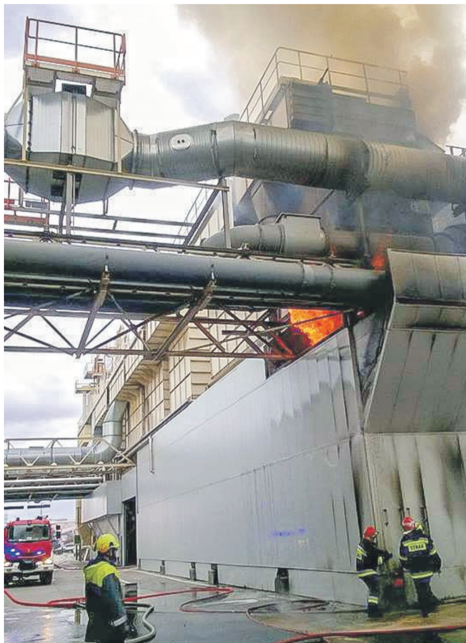
Strażacy podawali pianę i wodę ze stanowisk gaśniczych z poziomu terenu, z podnośnika hydraulicznego oraz pomostów technologicznych. Wodą schładzali sąsiadujące z pożarem silosy filtrów

Pożar ugaszono po 6 godzinach akcji. Żaden strażak ani pracownik firmy nie został poszkodowany. Trwa szacowanie strat. PAS