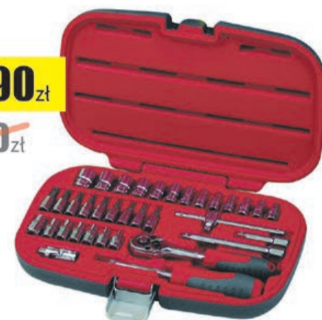
Zestaw 35 szt. nasadek i końcówek 1/4" Proline