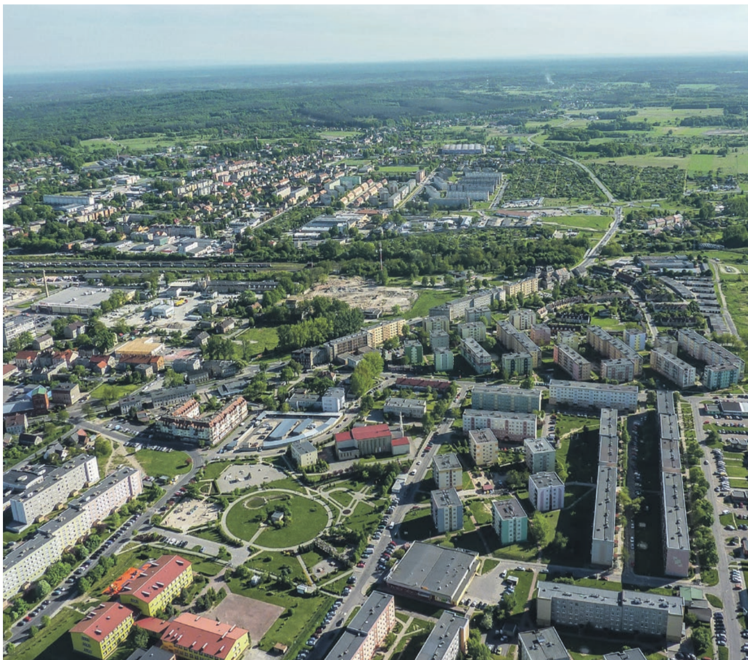
Osiedle Moniuszki I i II, popularnie zwane osiedlem muzyków. Na dalszym planie osiedle Zwycięzców

- Myślę, że spółdzielnia jest dobrze oceniana przez naszych