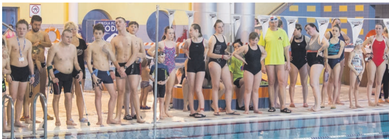
Amatorzy pływania spotkali się w Żarach na dorocznej Otyliadzie