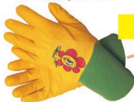
Rękawice dziecięce DRAGO KIDS (żółte, niebieskie)