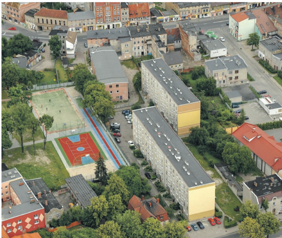
Bloki spółdzielni przy ul. Artylerzystów

- W działalności spółdzielni duży nacisk kładziemy na samokształcenie i dokształcanie. Nasi pracownicy odbywają około dwudziestu szkoleń rocznie. Uważam, że na naukę nigdy nie jest za późno, a każda wiedza zapośredniczona z korzyścią dla naszych mieszkańców. Posiadamy stosowne certyfikaty, ale cały czas się uczymy.