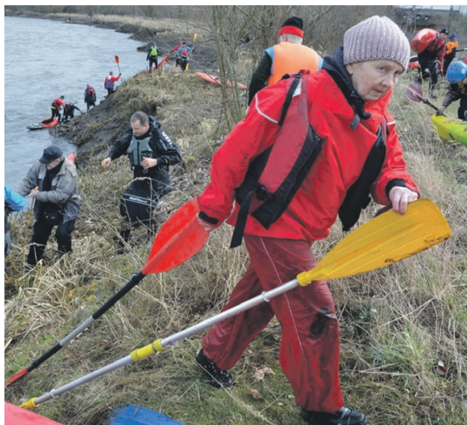
Nie tylko płyniemy, kajaki i sprzęt często trzeba przenosić ładem

spływu przez trzy dni przeplłynęli 62 kilometry wybranych odcinków Kwisy, Bobru i Czernej. Kolejny zimowy spływ pozostawił dla uczestników niezapomniane wrażenia a zarazem promocję walorów krajoznawczych okolic Żagania. JM