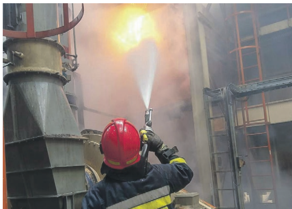
Na szczęście udało się opanować i nie dopuścić do rozprzestrzenienia się ognia