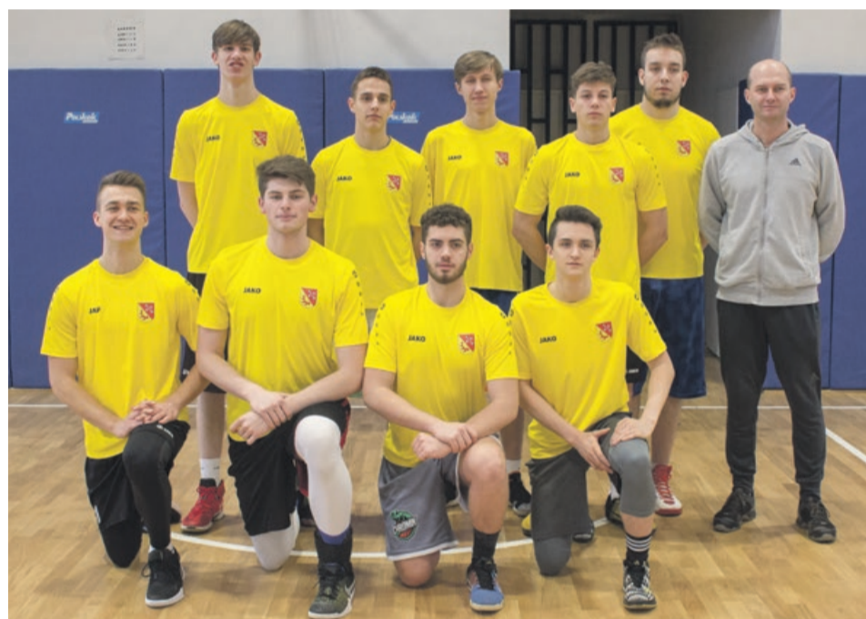
Ekonomik w dobrej formie

Półfinały z udziałem Ekonomika rozegrane zostaną w Żarach 29 marca. Turniej rozpocznie się o godz. 9.00 w hali sportowej przy ul. Zwycięzców. TG, ATB