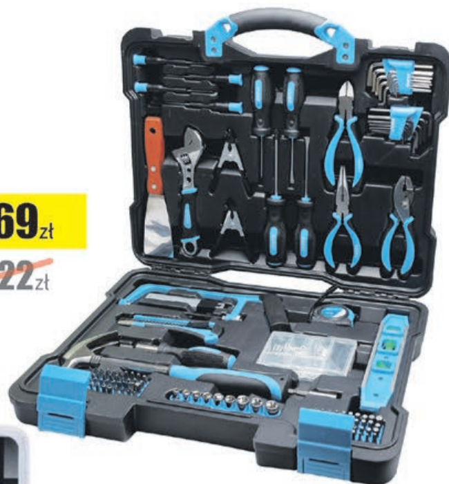
Zestaw narzędzi 144 szt. Mega Proline