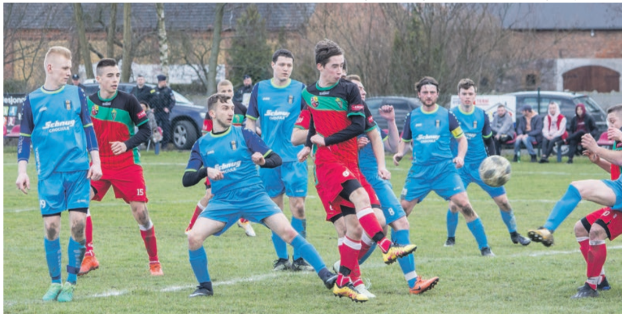
W Chociulach niespodzianki nie było