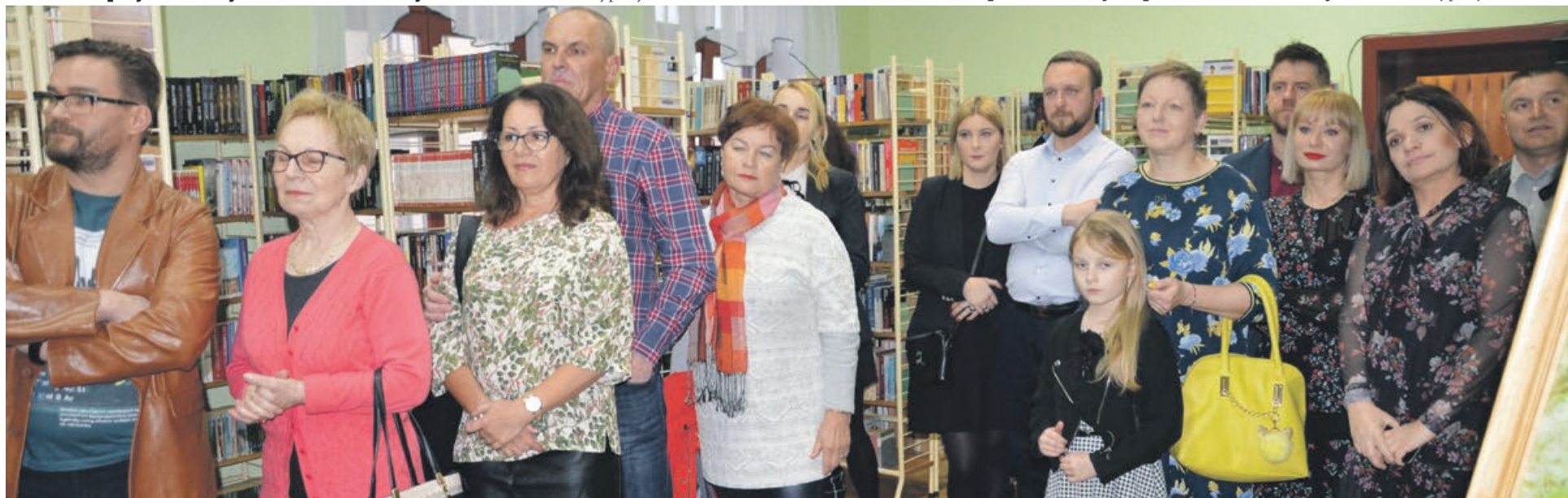
Na wernisażu nie zabrakło rodziny, przyjaciół i zaproszonych gości