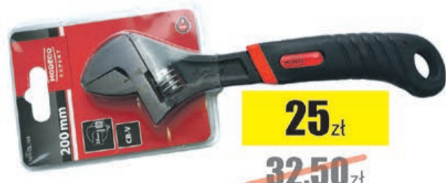
Klucz nastawny ślimak. 200 mm Modeco