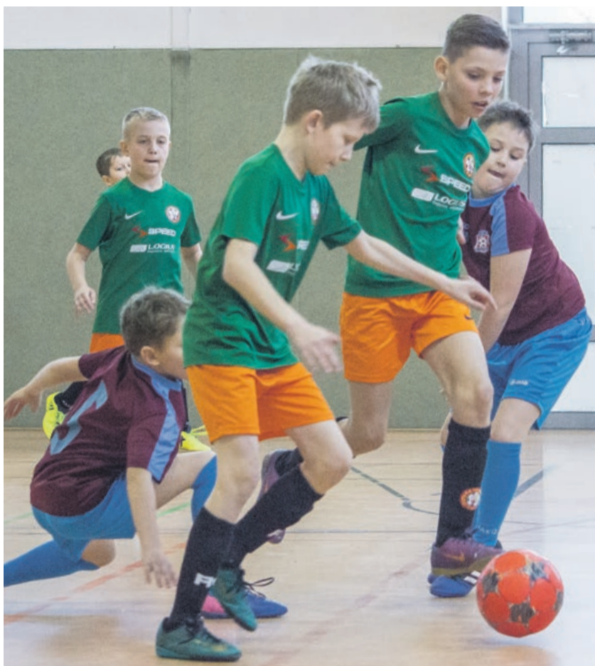
UKS Promień Żary najlepszą drużyną turnieju orlików

Najlepszym strzelcem turnieju został Misza Iwanov (UKS Promień Żary), najlepszym bramkarzem – Borys Zankiewicz (UKS Promień), najlepszym zawodnikiem – Dawid Salamon (ŁKS Łęknica). ATB