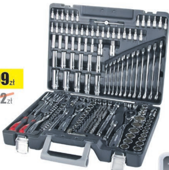
Zestaw 217szt. nasadki bity 1/4", 3/4" Proline