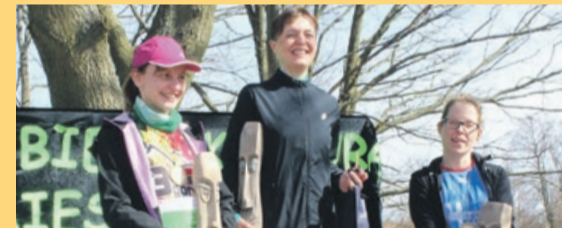
Tryumfatorki kategorii open kobiet