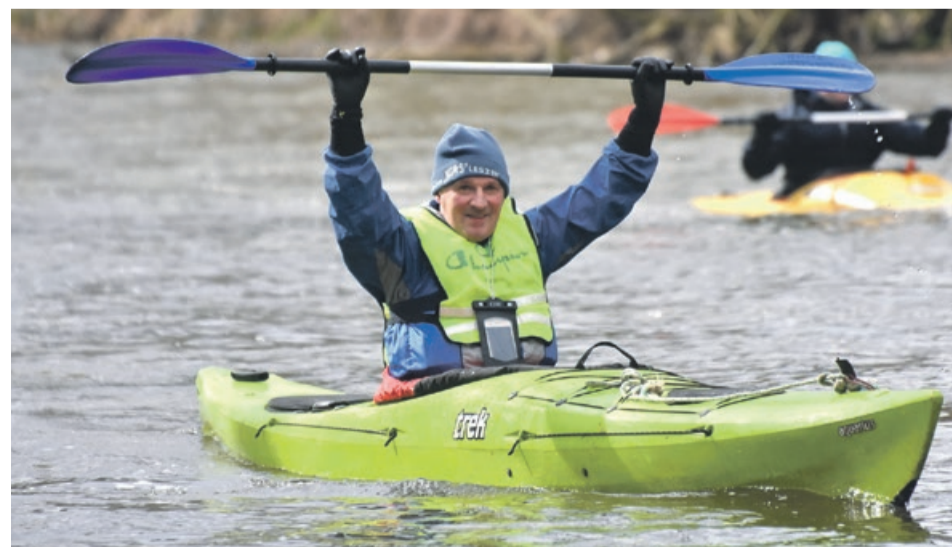
Ach, jak przyjemnie kołysać się wśród fal