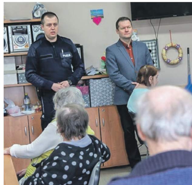
Celem spotkań jest podniesienie poziomu bezpieczeństwa i ograniczenie liczby przestępstw popełnianych na szkodę seniorów

Podczas spotkania dzielnicowy przypomniał o zasadach bezpiecznego poruszania się po drodze i rozdał opaski odbłaskowe, a także tematyczne ulotki. PAS