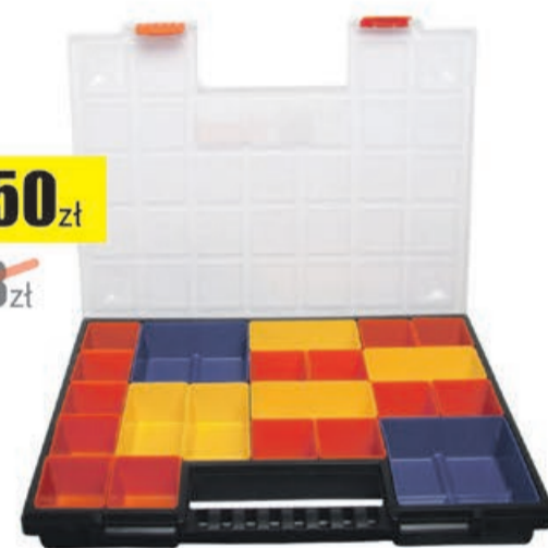
Organizer 21 przegród 390x303x50 Proline