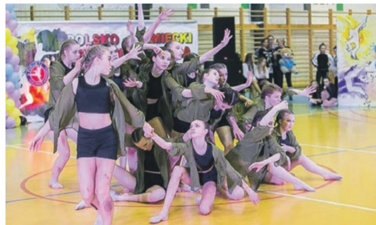
Zespoły taneczne z Żar niejednokrotnie udowodniły, że prezentują wysoki poziom techniczny i artystyczny

Życzymy powodzenia i zapraszamy na festiwal nie tylko miłośników tańca. PAS