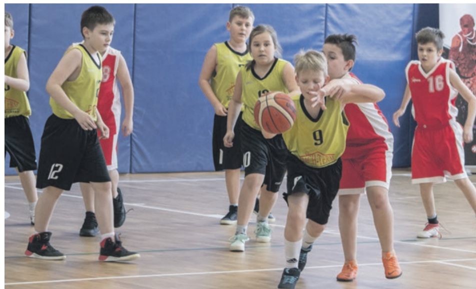
KOSZYKÓWKA Reprezentacje pięciu szkół podstawowych z Żar oraz jedna z Lubuska wzięły udział w 11. edycji Żarskiej Basketmanii, organizowanej przez żarski klub koszykarski. W ten sposób BC Swiss Krono ma możliwość wyłapywania młodych talentów, które później mogą rozwijać swoje umiejętności już pod klubowymi skrzydłami