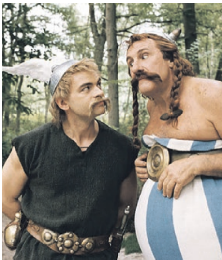
Asterix na olimpiadzie POLSAT, niedziela, godz. 8:45