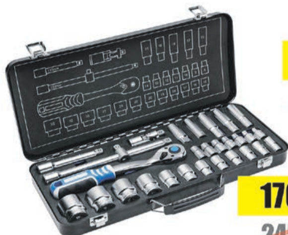
Zestaw nasadek i grzechotka 29 szt.