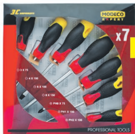
Kpl. wkręteków 7 szt. 3C Modeco