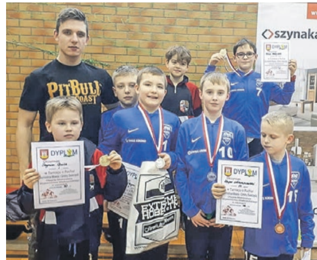
Młodzi gladiatorzy Agrosu