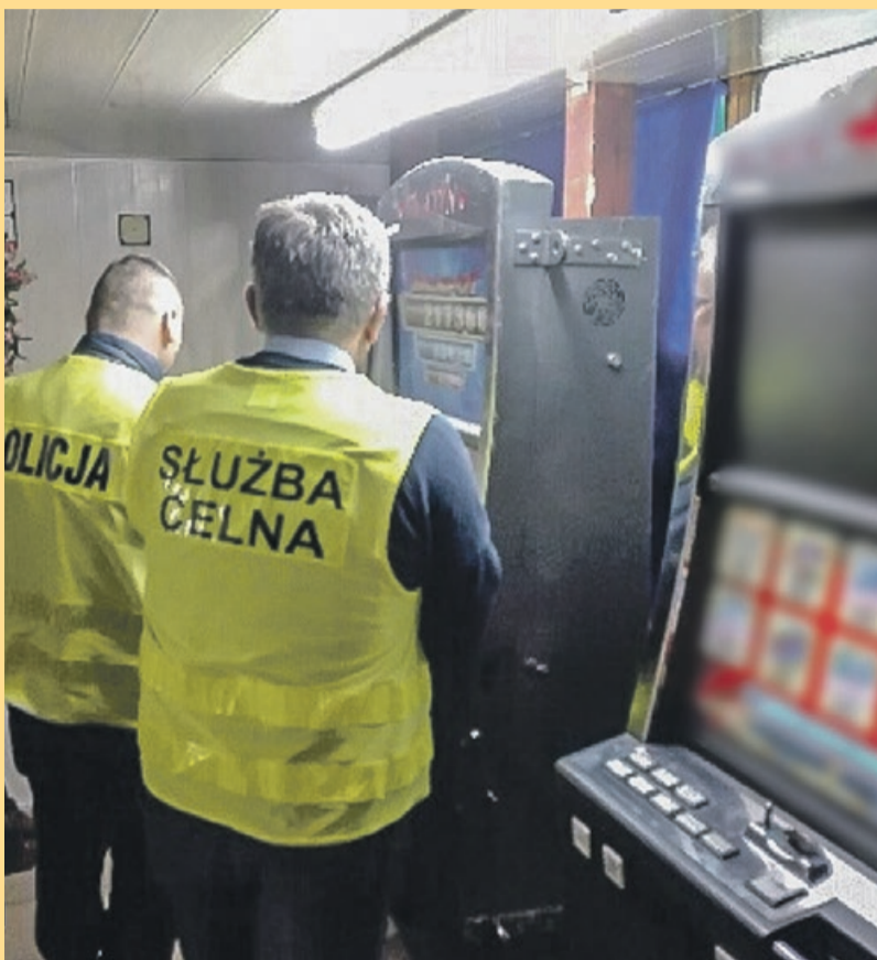
W powiecie żarskim i żagańskim trwają akcje mające na celu walkę z nielegalnym hazardem

Pracownicy lokali zostali przesłuchani. Były to kolejne skuteczne działania obu służb. W styczniu br. podczas wspólnych