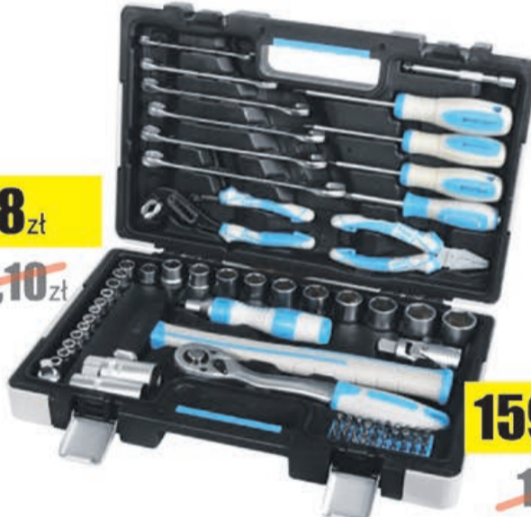
Zestaw narzędzi 75 szt.