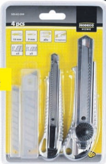
Zestaw noży 18 i 9 mm z ostrzami Modeco