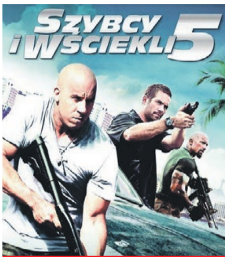
Szybcy i wściekli 5 TVN, piątek, godz. 20:00