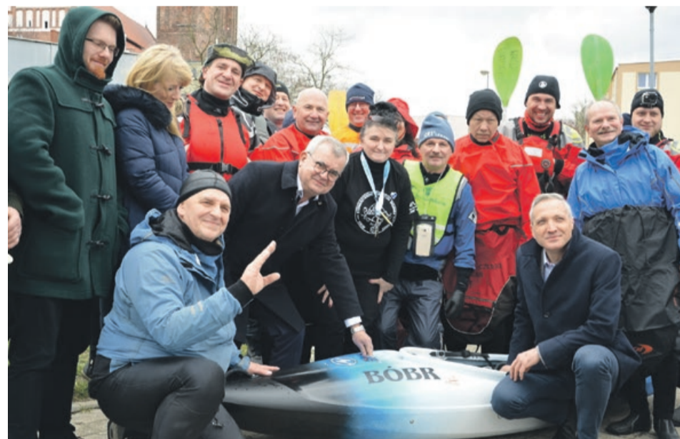
Woda to nasz żywioł, ale bez dobrego sprzętu ani rusz