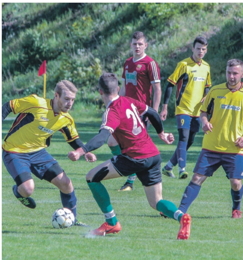
Piłkarze z Górzyna odnieśli swoje 17. zwycięstwo na 21. kolejek

Tymczasem w 21. kolejce piłkarze z Górzyna podejmowali niżej notowaną drużynę Start Ziel-Bruk Płoty, pewnie wygrywając 3:0. Strzelcami bramek byli: Erwin Mróz w 29. minucie, Patryk Poprawski w 70. minucie oraz Michał Galik w 75. minucie spotkania. ATB