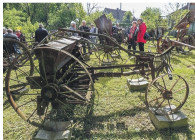
Takie maszyny, to dzisiaj prawdziwy, muzealny skarb

Stowarzyszenie „Łaz – Zielony Las” zaprosiło swoich członków i sympatyków na wycieczkę edukacyjną, zorganizowaną w ramach akcji