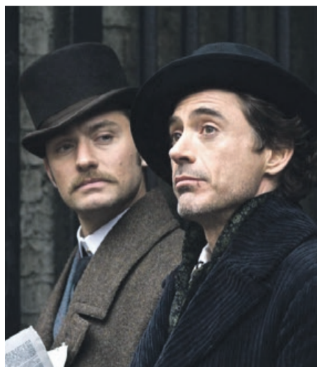
Sherlock Holmes TVN, niedziela, godz. 20:00