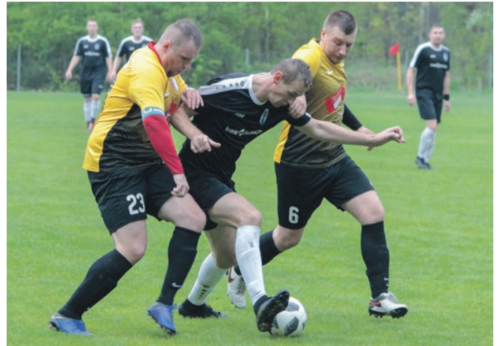
Delta Sieniawa Żarska wygrywa na własnym boisku

Delta po 25. kolejkach zajmuje obecnie ósme miejsce w tabeli. Ma jednak jeden zaległy mecz z Unią Kunice. ATB