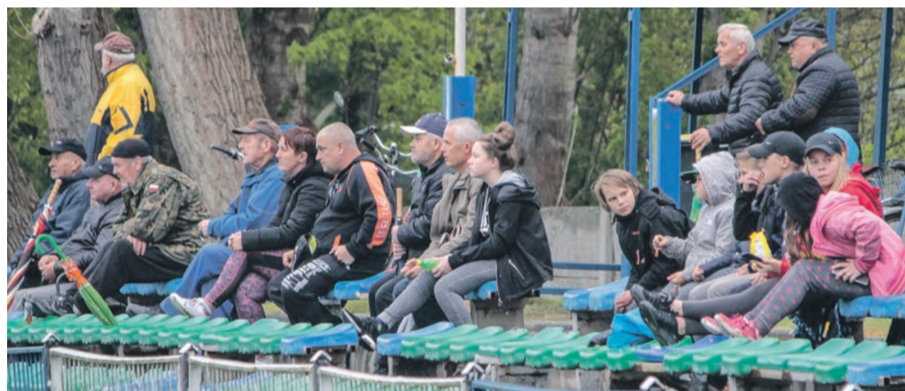
Są w Lubsku kibice na dobre i na złe