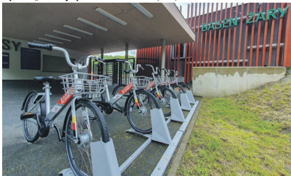
Przy wejściu na basen - ul. Źródłana