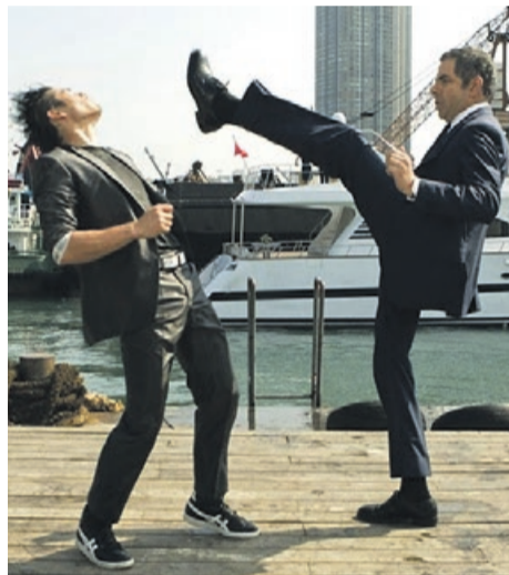
Johnny English Reaktywacja TVN 7, niedziela, godz. 17:55