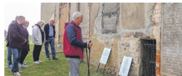
Kościół są świadectwem historii