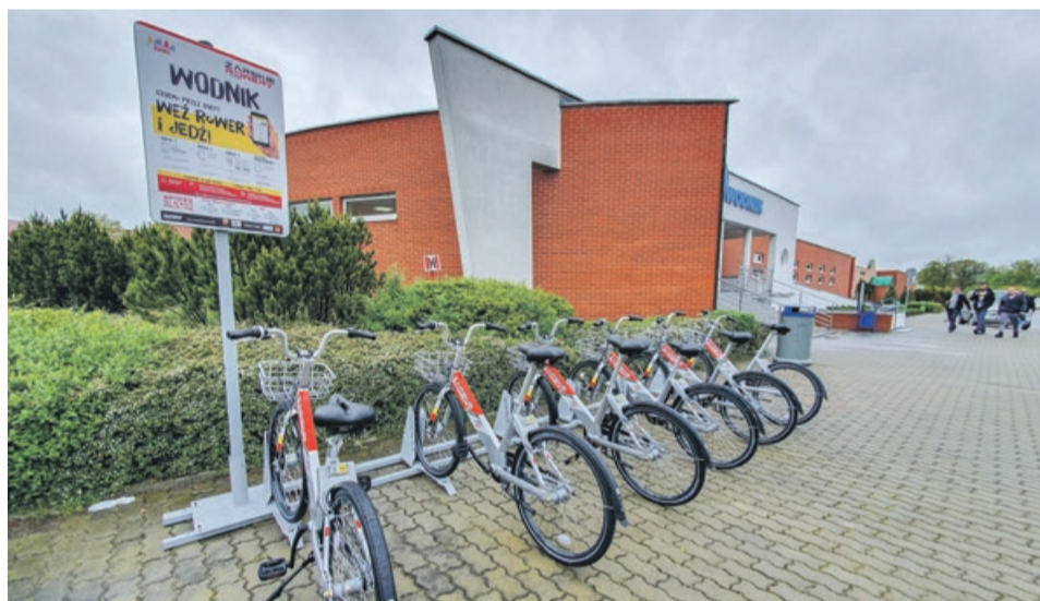
Pływalnia „Wodnik” przy ul. Telemanna