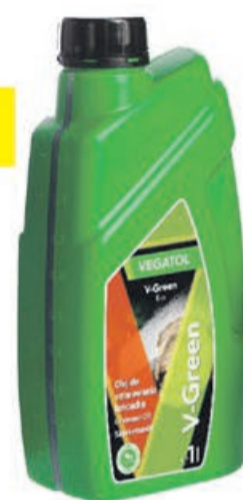
Olej EKO Green 1l