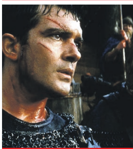
Trzynasty wojownik TVN7, niedziela, godz. 23:25