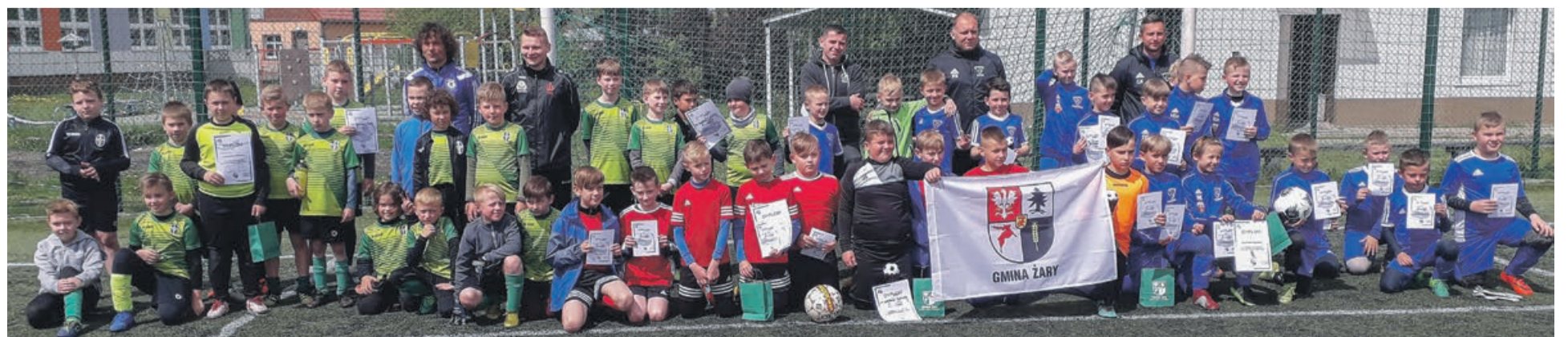
Pamiętkowe zdjęcie na zakończenie turnieju w Mirostowicach Dolnych