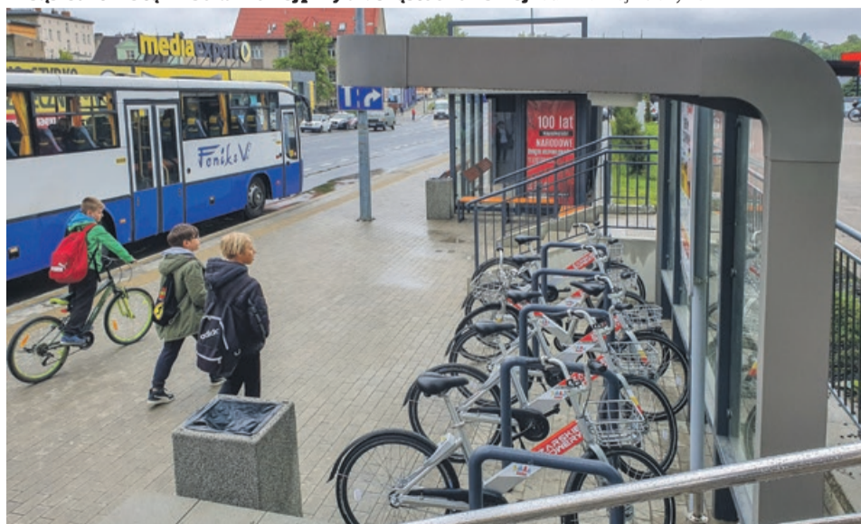
Wiata rowerowa przy centrum przesiadkowym na ul. Ułańskiej