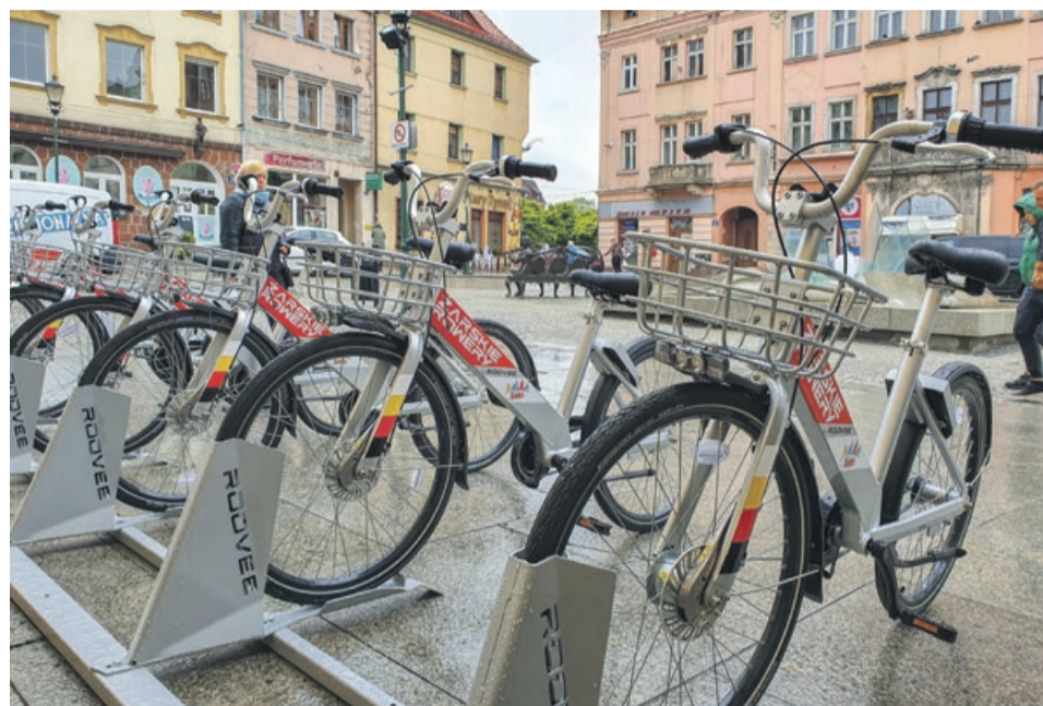
Miejsce postojowe przy żarskim ratuszu

- Zapraszamy do korzystania z żarskich rowerów i liczymy na to, że przyjmą się w naszym mieście - mówi wiceburmistrz Żar Olaf Napiórkowski - Jeśli tak, to będziemy nadal rozwijać ten system o kolejne rejony miasta, a docelowo chcemy mieć w Żarach ponad sto ro-