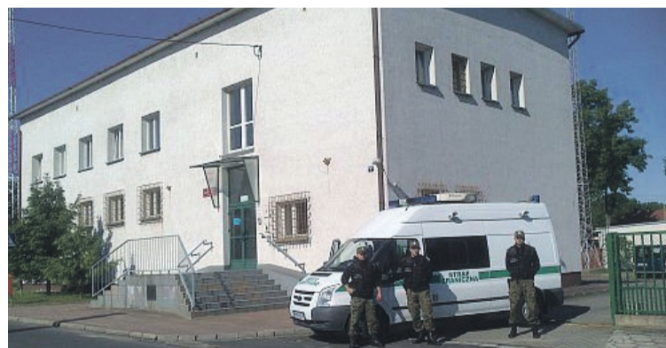
Placówka SG w Tuplicach

W tym roku funkcjonariusze i pracownicy Nadodrzańskiego Oddziału SG swoje święto obchodzić będą 31 maja. Uroczystość odbędzie się na terenie Komendy Nadodrzańskiego Oddziału Straży Granicznej w Krośnie Odrzańskim. Msza św. zaplanowana jest na godz. 12:00, a uroczysty apel rozpocznie się o godz. 13:30. W trakcie uroczystości wręczone zostaną awanse na kolejne stopnie służbowe i odznaczenia. PAS