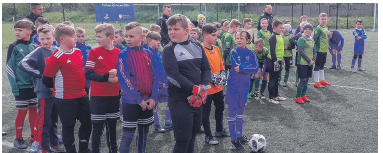
W turnieju zagrały drużyny z Tuplic, Żar, Żagania i Bolesławca fot. nadesłane

Turniej na Orliku w Mirostowicach Dolnych zorganizowali animatorzy Radomir Roztock i Jarosław Rusak, sponsorem zaś - gmina Żary. ATB