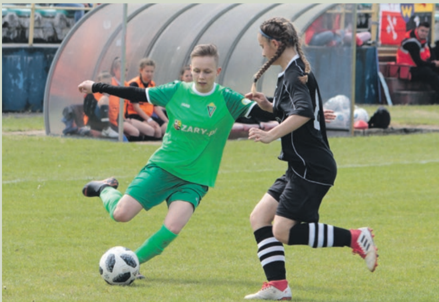
Mecz z gorzowiankami zakończył się remisem

Kolejne ligowe spotkanie Promyczek już w niedzielę, 19 maja o godzinie 14.00. Tym razem do Żar przyjadą piłkarki z Lubuska. ATB