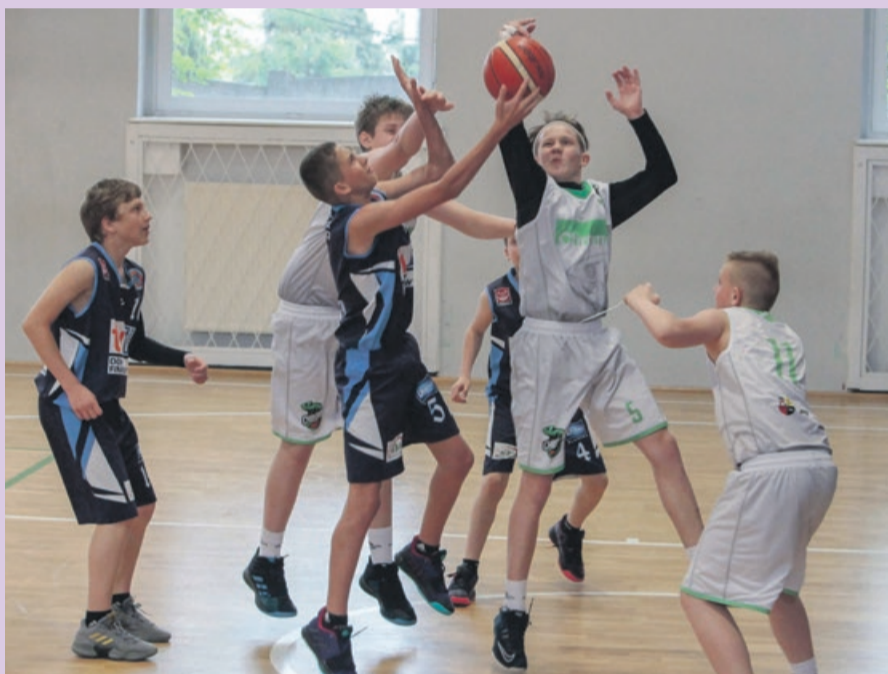
Turniej w Żarach zakończył się zgodnie z oczekiwaniami

To jednak jeszcze nie gwarantuje żarskiej drużynie czwartego miejsca, które premiowane jest możliwością zagrania w finałach. Wszystko rozstrzygnie się w sobotę, 18 maja, po turnieju, z udziałem drużyny Green Star Zielona Góra. Jeśli zielonogórzanie wygrają dwa mecze, wejdą do finałów z czwartego miejsca, a BC Swiss Krono zakończy rozgrywki ligowe na piątej pozycji. W tym momencie to już nie od nich zależy. ATB