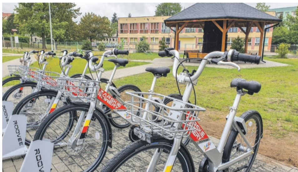
W sąsiedztwie tętni solankowej przy ul. Częstochowskiej