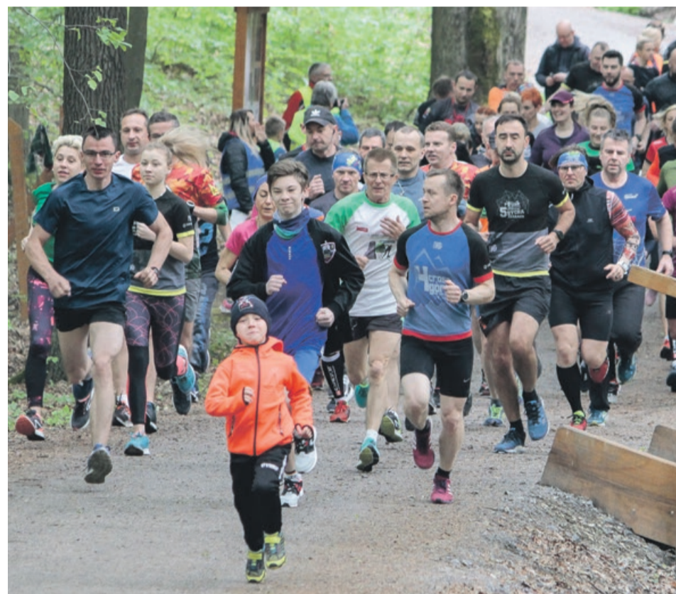
Niespełna dwa miesiące pozostały do trzysetnej edycji parkrunu