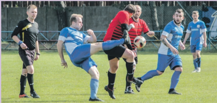
Stal remisuje ze Zniczem

Pod względem emocji, to widowisko mogło się podobać, a gospodarze mogli wygrać. Mówi się na trybunach, że dzięki nowemu sponsorowi może w końcu w Stali będzie trochę lepiej. Kibice nie mają nic przeciwko temu. ATB