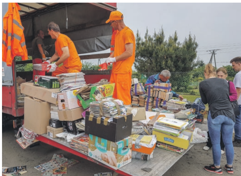
W ubiegłym roku zebrano ponad 12 ton makulatury