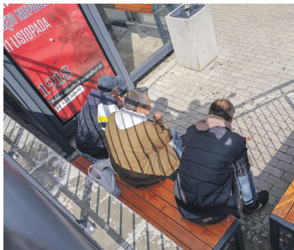
Miłośnicy przesiadywania pożywają się, palą papierosy, resztki chleba rzucają ptactwu. Miejsce w środku miasta, a jednak jest zaciszne, murek za ławkami sprawia, że wiatr nie zawiewa po plecach