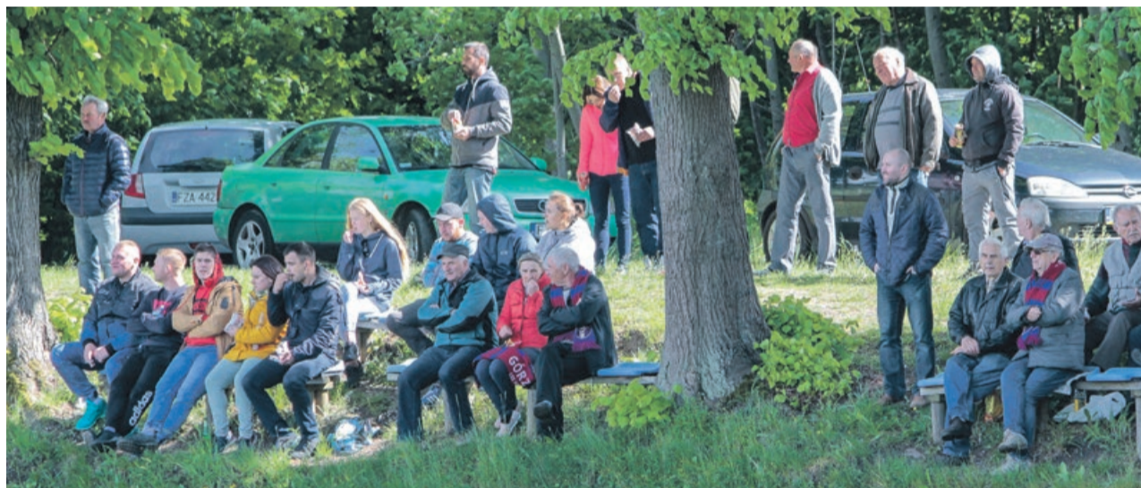
Całkiem możliwe, że kibice w Górzynie tegoroczną piłkarską jesień będą oglądać już na poziomie okręgówki