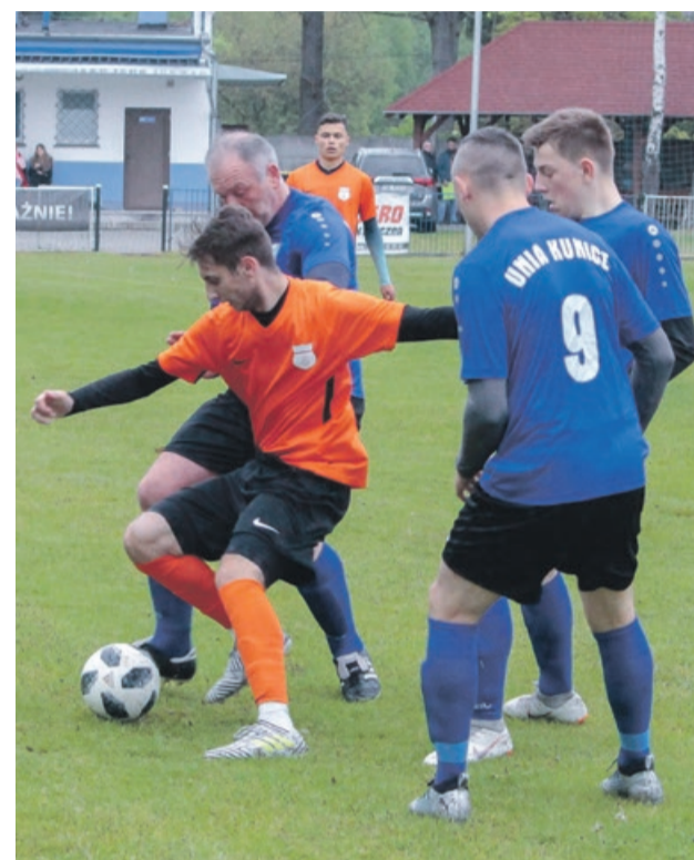
W meczu Unii z Budowlanymi padło 9 goli