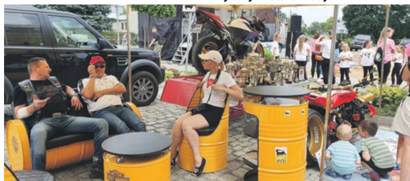
Stoisko firmy Szajba's Garage przyciągało wszystkich