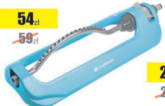
Zraszacz wahadkowy TURBO IDEAL LINE Cellfast