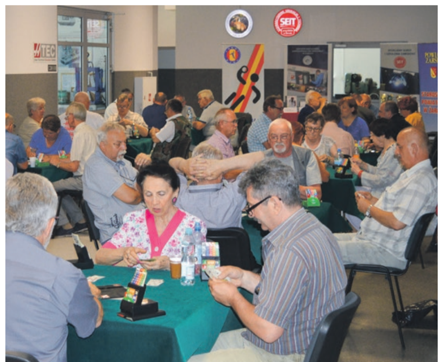
Przy zielonych stolikach zasiadło tym razem 36. graczy