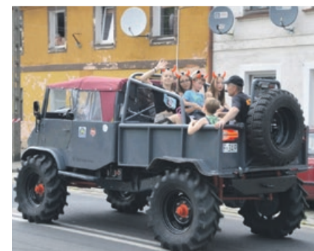
Takie przejażdżki miały wielu chętnych