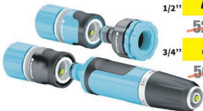
Zestaw ERGO ze zraszaczem prostym Cellfast