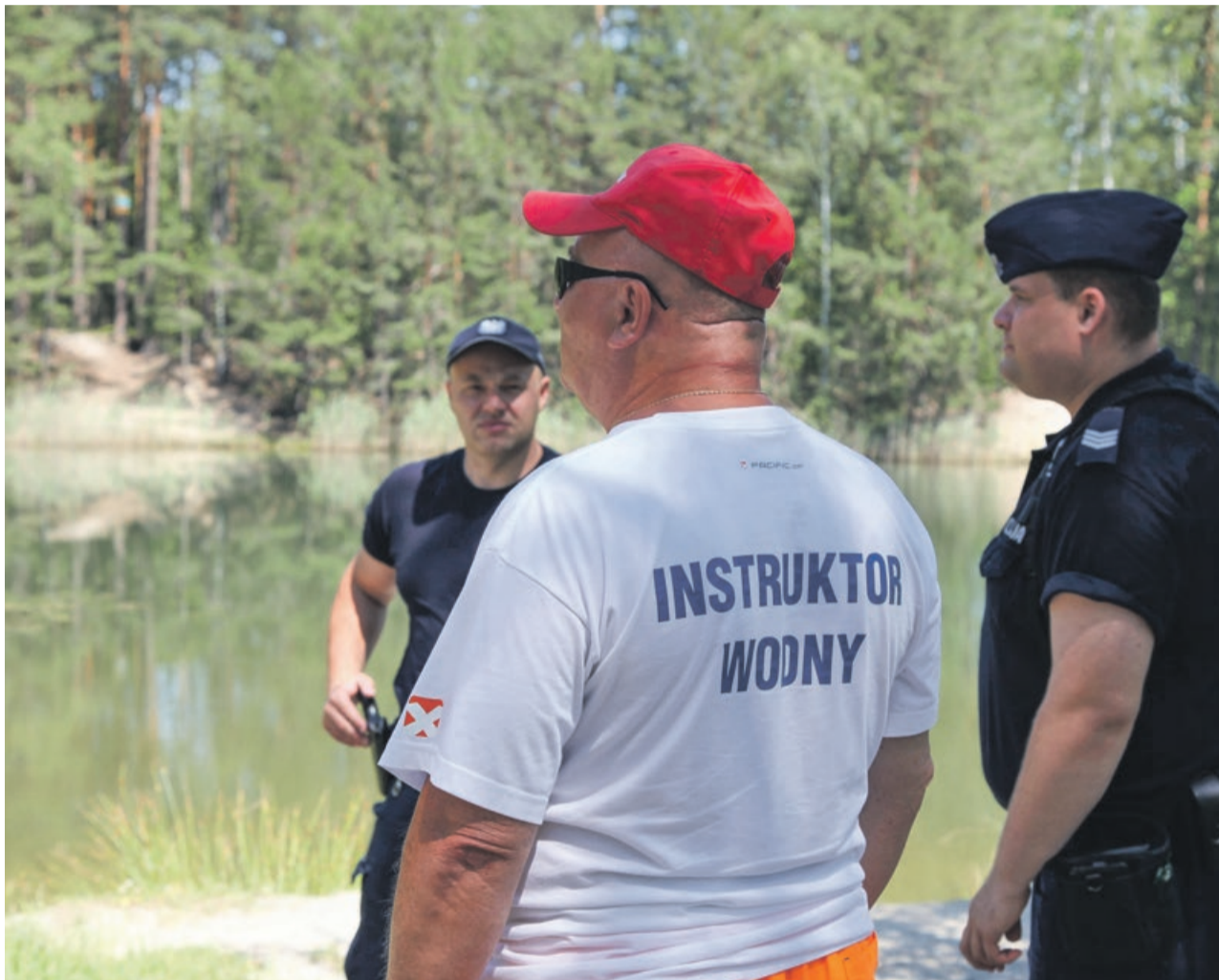
Najbezpieczniej korzystać z kąpielisk strzeżonych

Policjanci z żarskiej jednostki wspólnie z innymi służbami rozpoczęli już kontrole w rejonach zbiorników wodnych zarówno strzeżonych jak i niestrzeżonych. Sprawdzają, czy