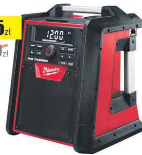
Radio M18 RC-0 Milwaukee