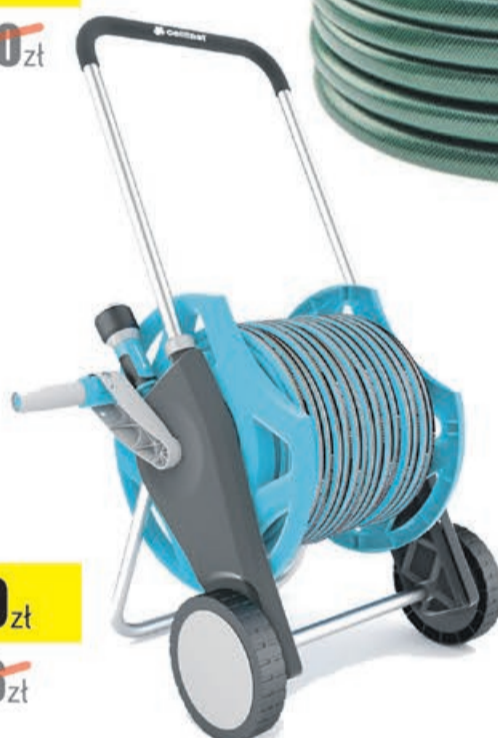
Zestaw DISCOVER 1/2" 25mb ERGO Cellfast