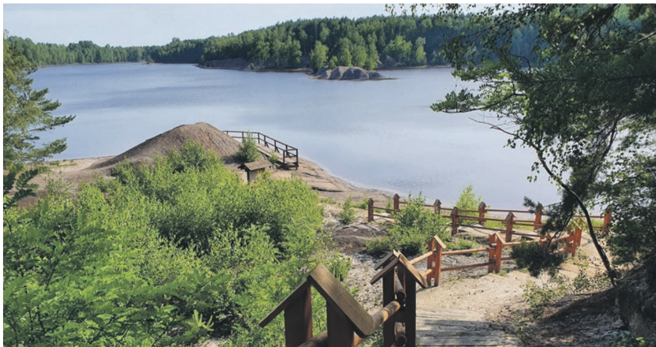
Ścieżka geoturystyczna zapewnia kontakt z piękną przyrodą