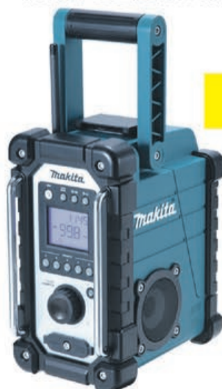
Radio akumulatorowe DMR 107 Makita