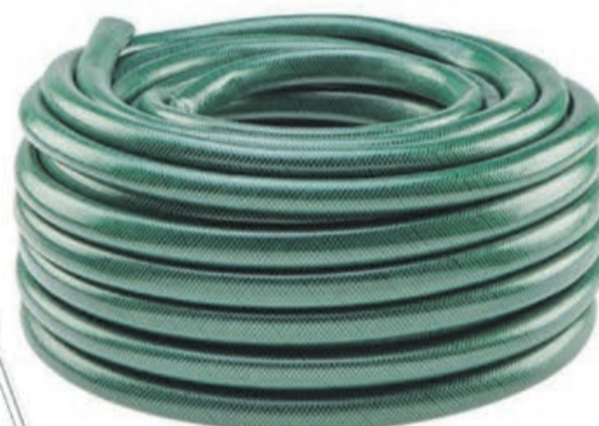
Wąż do zraszania gleby