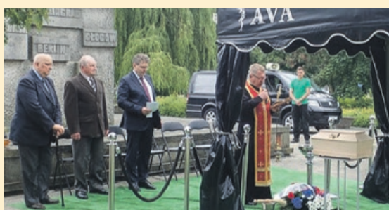
Ponowny pochówek na cmentarzu w Żarach