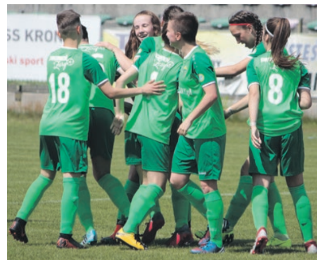
Promyczki mistrzyniami III ligi

Początki były jako takie, bo jakież inne mogłyby być? Jednak z czasem dało się zauważyć postępy. Panowanie nad piłką, technika, gra zespołowa. Treningi zapoczątkowały efektami w postaci wygranych spotkań. A dziś czas już tylko i wyłącznie na zasłużone gratulacje. ATB