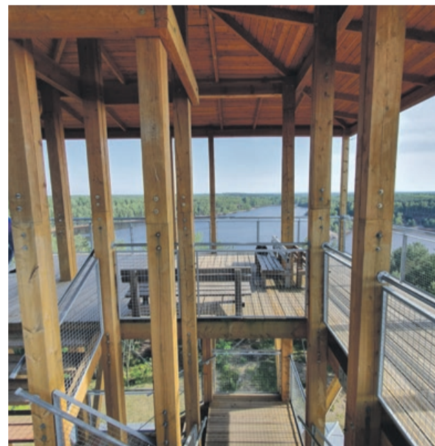
Tarasy widokowe wysoko ponad drzewami okolicznych lasów

Pokonując pięciokilometrową trasę geościeżki można zwiedzić wiele bardzo malowniczych miejsc. Najlepiej wybrać się tam rowerem, tym bardziej teraz, gdy pogoda sprzyja wycieczkom. Wejścia na trasę znajdują się w Nowych Czaplach oraz przy obwodnicy Łęknicy. ATB