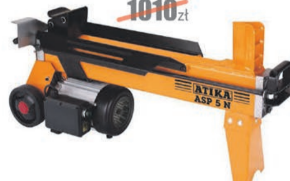
Łuparka hydrauliczna ASP5N ATIKA