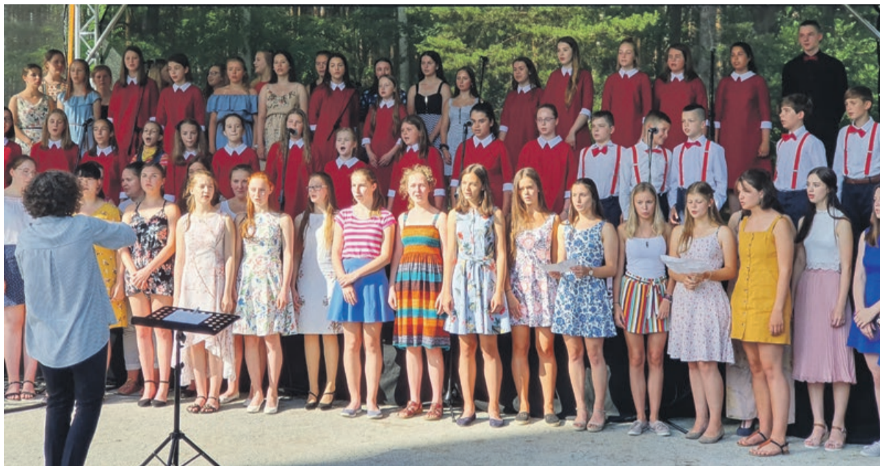
Młodzież z Polski i Niemiec razem na scenie

ŁĘKNICA / NOWE CZAPLE Geościeżka „Dawna Kopalnia Babina” stała się na chwilę sceną dla wspólnego koncertu polskich i niemieckich chórów młodzieżowych.