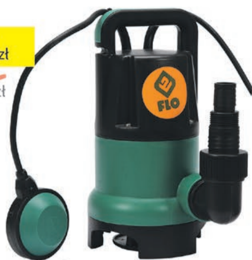
Pompa zanurzeniowa do wody brudnej 550W Flo