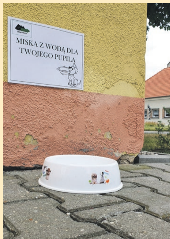
ŻARY Upał zelżał, ale inicjatywa ciągle aktualna i godna pochwały