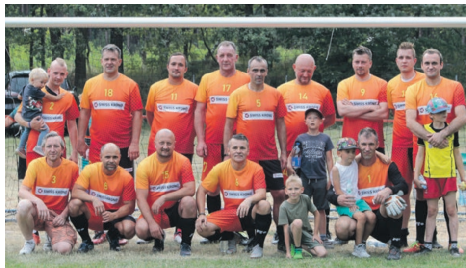
IV miejsce - Produkcja