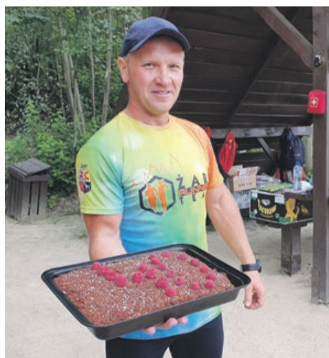
Malinowa czterdziestka