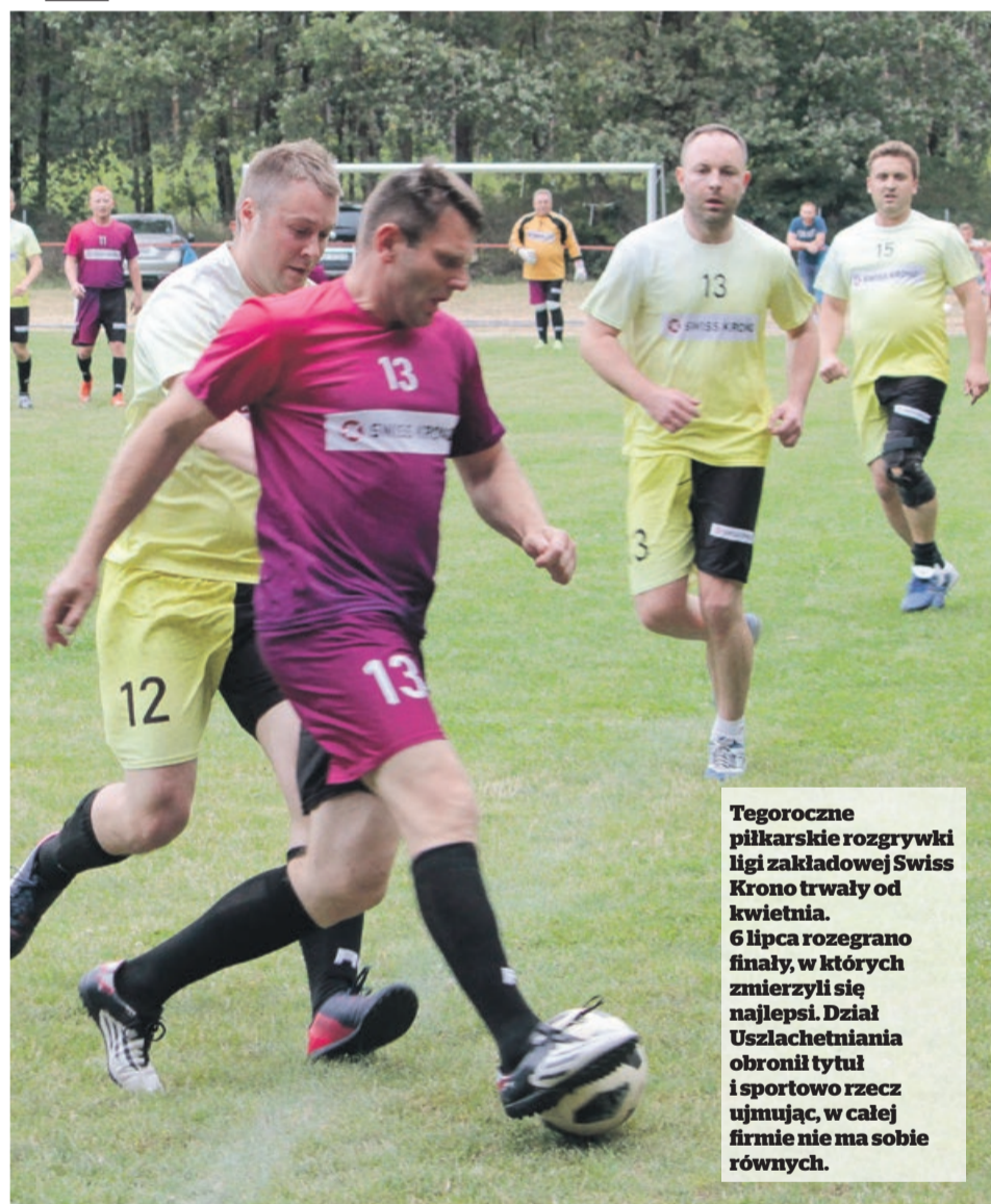
Finałowe starcie o największy puchar