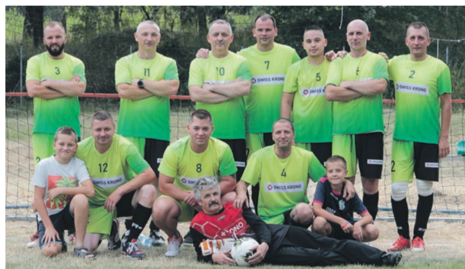
III miejsce - Magazyn Wyrobów Gotowych