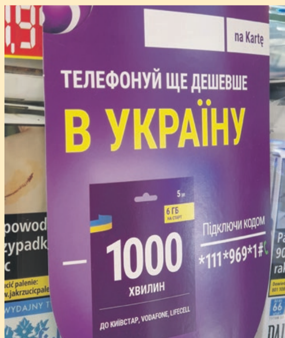
ŻARY Znak czasów. W jednym z osiedlowych sklepów