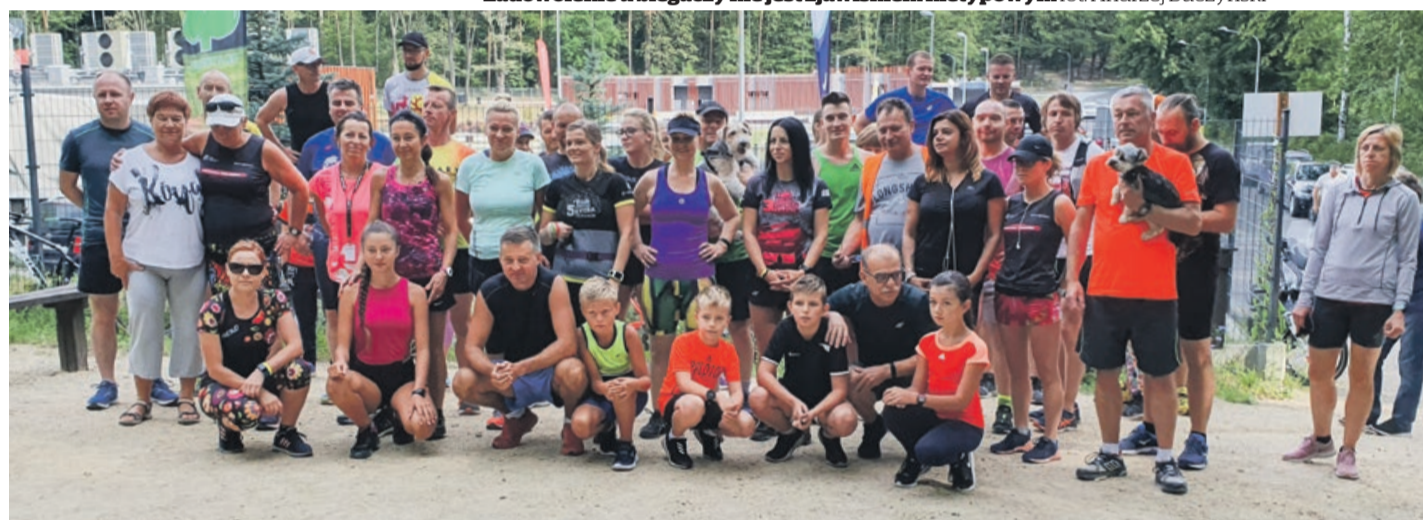
301. parkrun ukończyło 76 osób