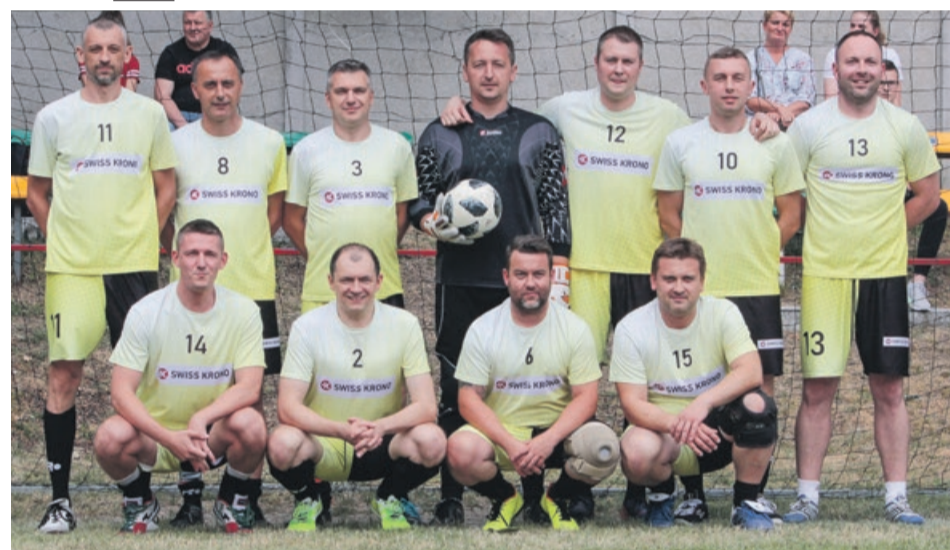
II miejsce - Administracja