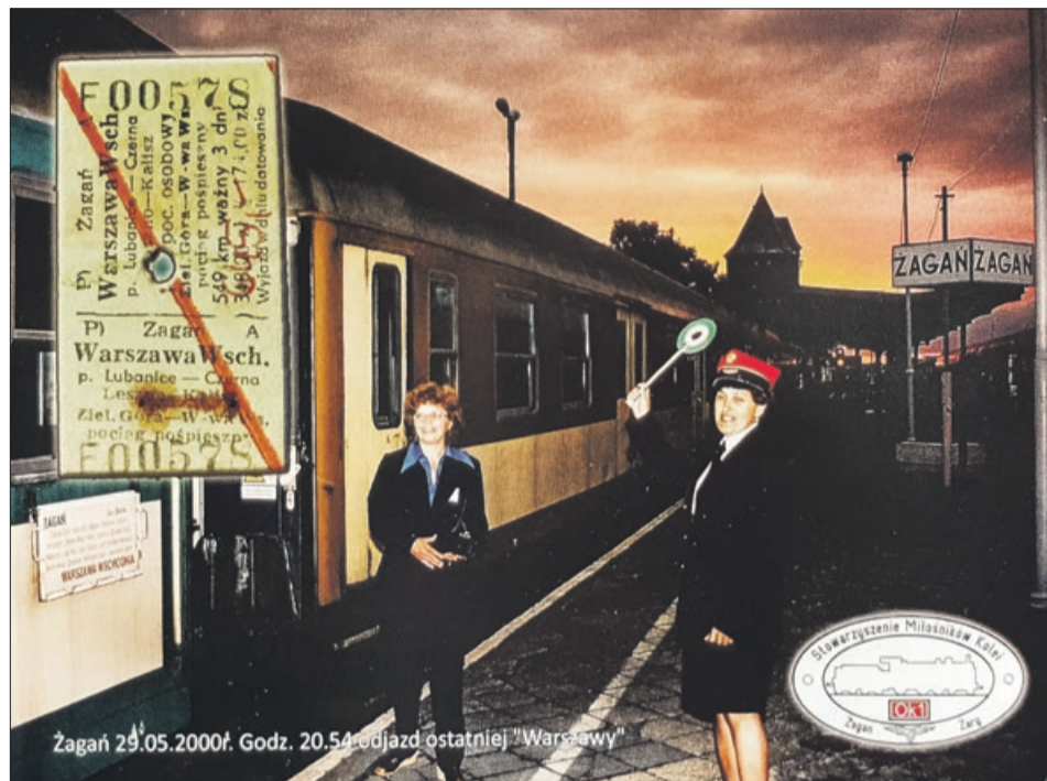
Żagań 29.05.2000r. Godz. 20.54 odjazd ostatniej "Warszawy"

Czy to możliwe, że miasto, które jest siedzibą jednego z największych polskich garnizonów wojskowych i bazą sił amerykańskich, nie ma bezpośredniego połączenia ze stolicą naszego kraju? Niestety tak jest od 19 lat, gdy 29 maja 2000r. o godz. 20.54 odjechał ostatni pociąg relacji Żagań - Warszawa Wschodnia. Połączenie to cieszyło się ogromną popularnością, a jednak zostało zlikwidowane i póki, co decydenci są głusi na argumenty mieszkańców, nie tylko Żagania ale też Żar, czy Nowogrodu Bobrzańskiego. Czas to zmienić. Jako stowarzyszenie walczymy o przedłużenie relacji pociągu TLK „Zielonogórczanin”, tak by zaczynał i kończył swój bieg w Żaganiu. Według obecnego rozkładu jazdy, pociąg ten odjeżdża z Zielonej Góry o godz. 5.51, uważamy, że mógłby wyjeżdżać o godz. 4.30 z Żagania, a wracać o godz. 1.15.