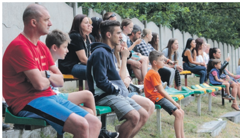
Ostatnie dwa mecze ligi rozegrano na boisku w Sieniawie Żarskiej