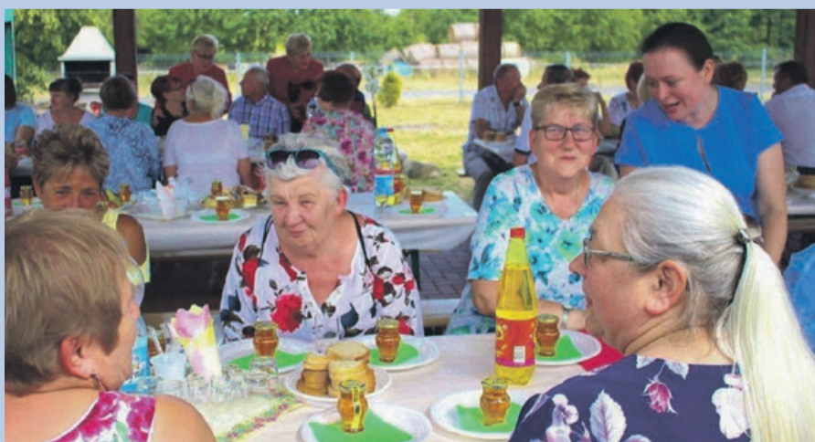
LUBANICE 25-lecie zespołu Czerwona Jarzębina