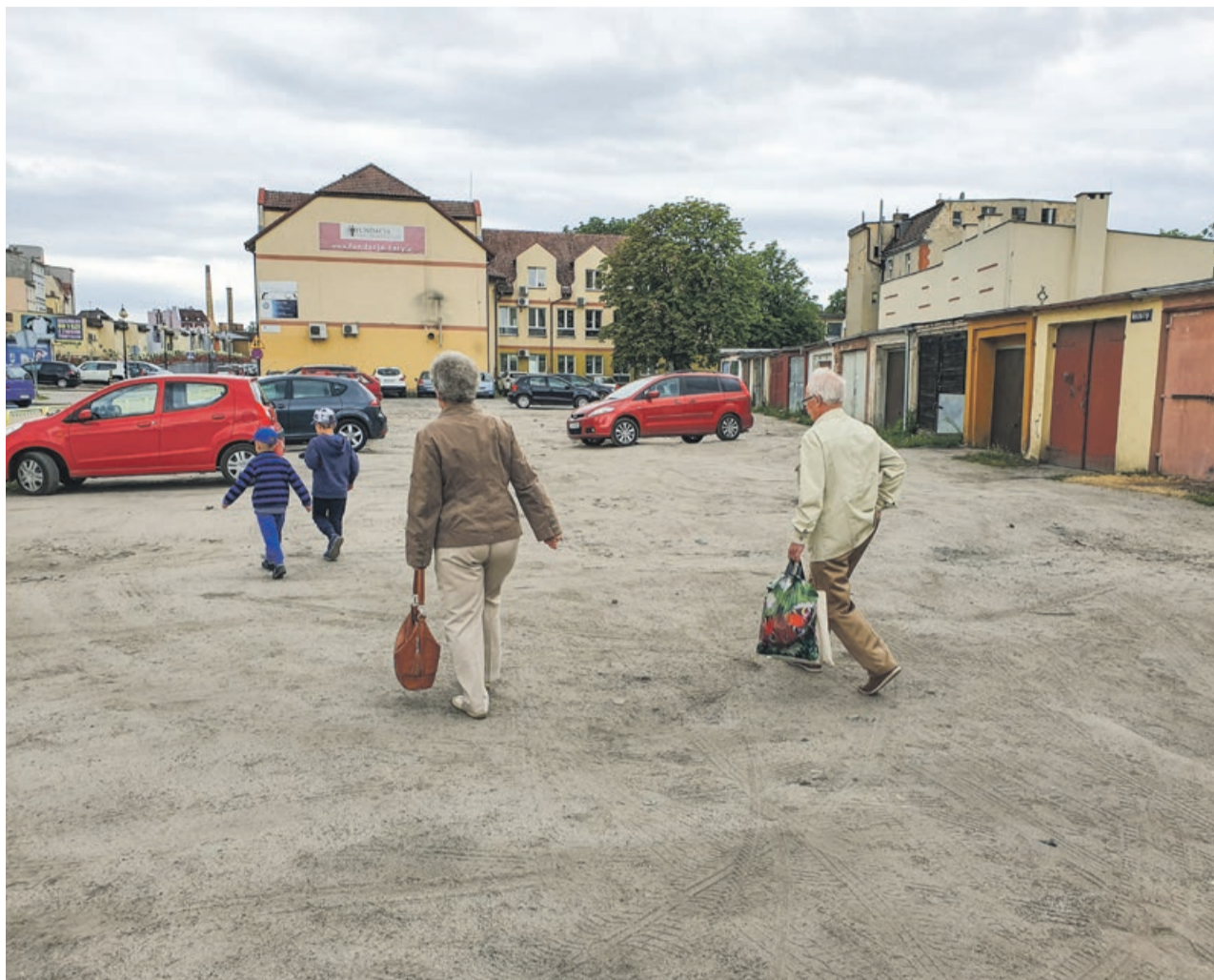
Za kilka miesięcy będzie tu równo i elegancko