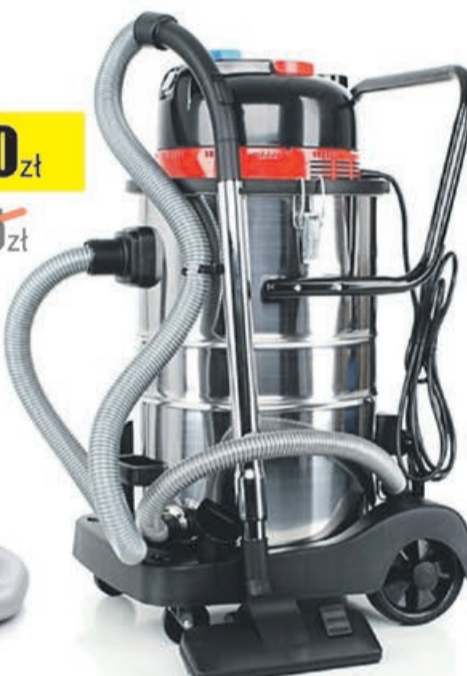
Odkurzacz warsztatowy 50L Best Tools