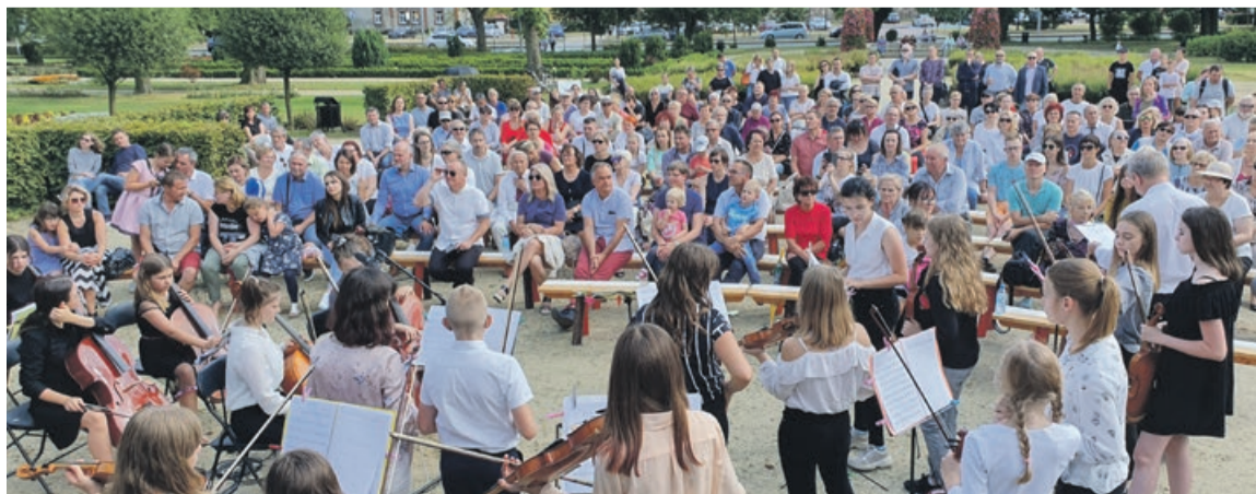
Ostatni koncert w parku przy Al. Jana Pawła II zgromadził sporą widownię

O godz. 17.00 do pałacu przybędzie król August II Mocny, a pół godziny później wysłuchać będzie można opery Telemanna „Pimpinone” w znakomitym wykonaniu Krakowskiej Opery Kameralnej. Coś takiego nie zdarza się na co dzień, więc na pewno warto wybrać się do pałacu w sobotnie popołudnie. Bramy zamkną się o godz. 19.00. ATB