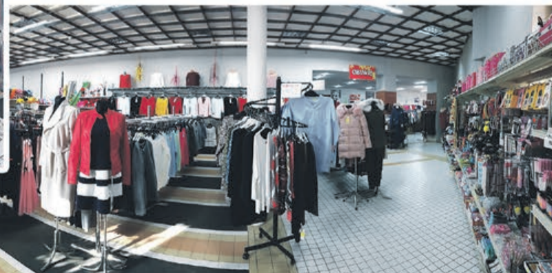
CHIŃSKIE CENTRUM HANDLOWE

BOGATA OFERTA DYWANÓW, WYKŁADZIN I CHODNIKÓW TEL. 515 514 231, SKLEP@HAYDUK.PL