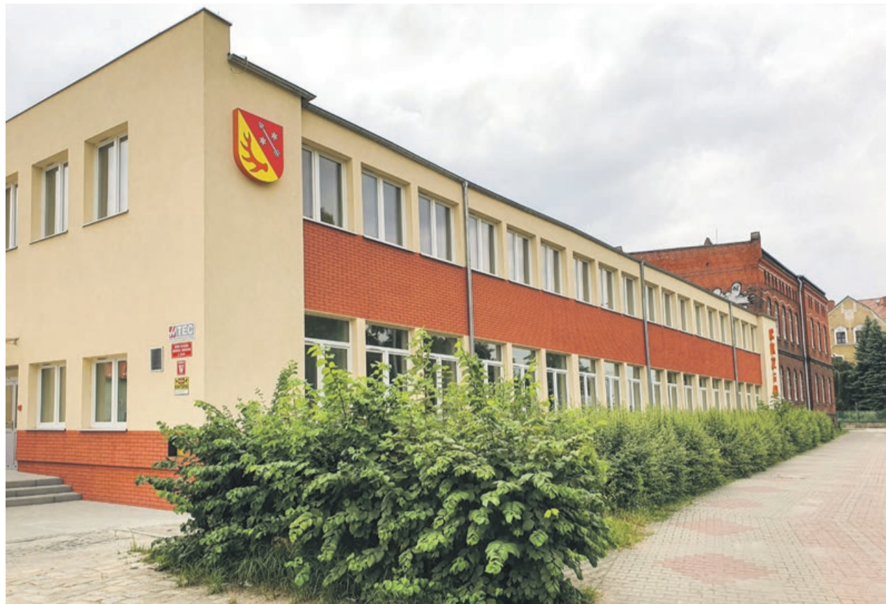
W żarskim Centrum Kształcenia Zawodowego i Ustawicznego nie będą kształceni operatorzy obrabiarek skrawających. Nie było chętnych na ten nowy kierunek

Trwają nabory do szkół średnich. Są już wstępne wyniki pokazujące najpopularniejsze kierunki kształcenia, a także kilka takich, które nie wzbudziły zainteresowania wśród absolwentów podstawówek i gimnazjów.