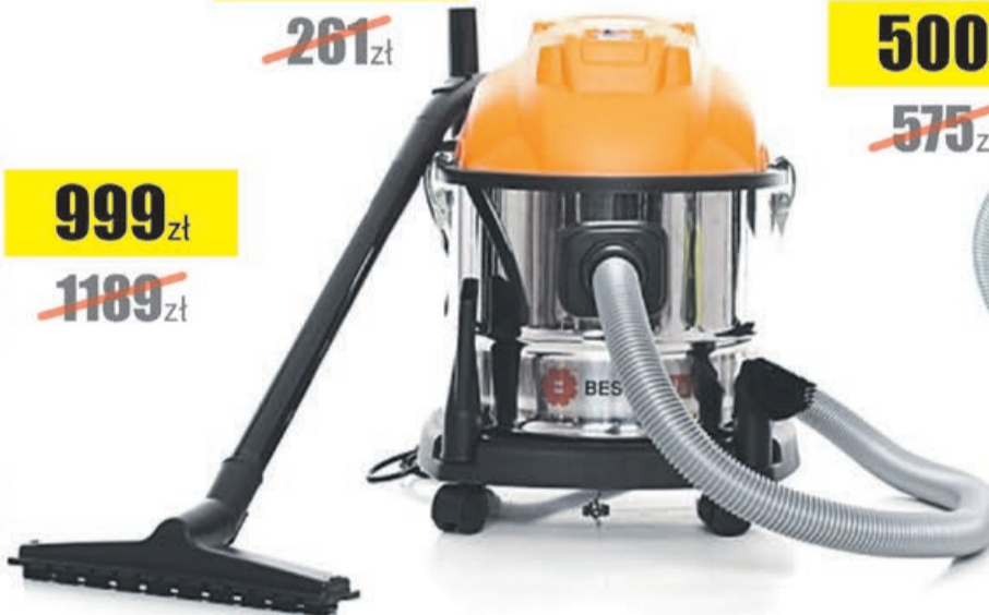
Odkurzacz wielofunkcyjny 15L Best Tools