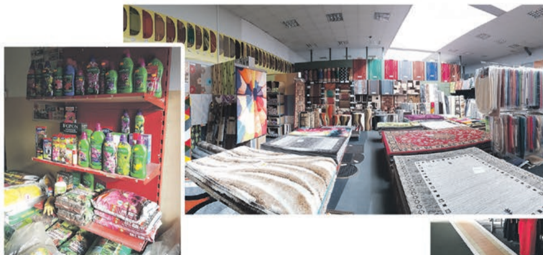
SKLEP LUBCENAS NAWOZY, NASIONA, PASZE TEL. 68 363 97 23