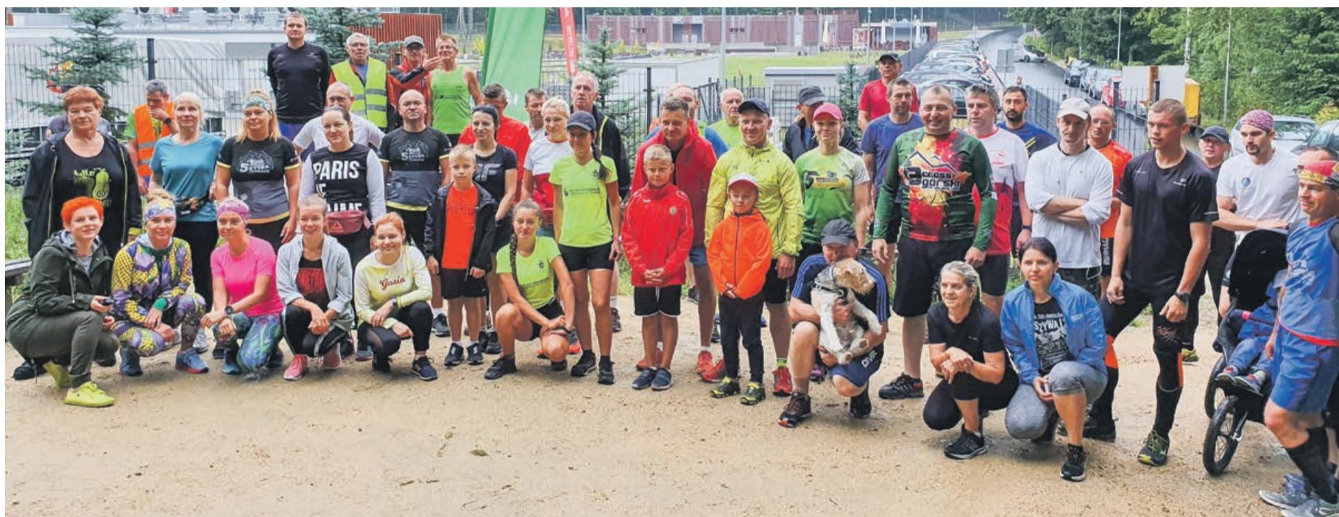
Tuż przed godziną 9.00, tuż przed startem kolejnego parkrunu