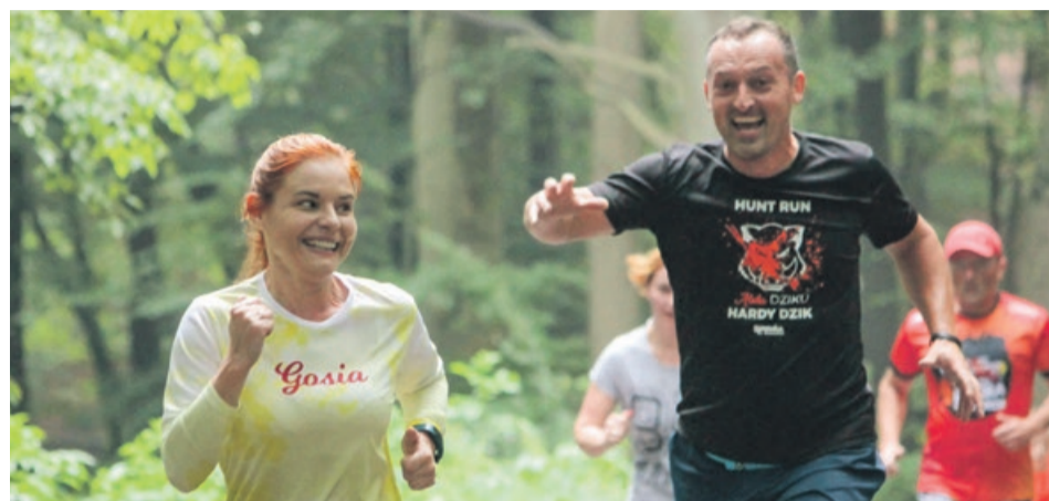
Wesołe bieganie po Zielonym Lesie

A w sobotę następną edycją żarskiego parkrunu, tym razem o numerze 303. Bieg jest darmowy i każdy może spróbować, bo nie czas jest tu najwspanialszy. ATB