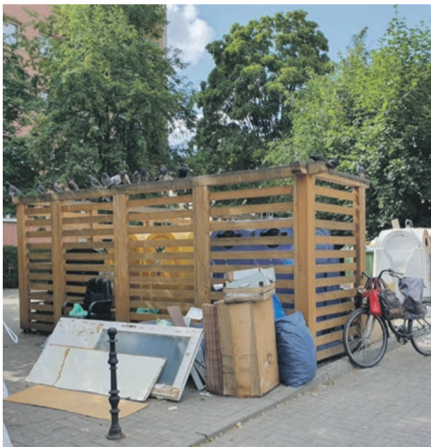
Śmietnik w samym centrum miasta. Są dni, w których z pewnością nie jest wizytówką zabytkowego sąsiedztwa Żar

Każdy ten problem odpycha od siebie. A jeszcze raz powtórzę - wystarczyłaby jedna kamera.