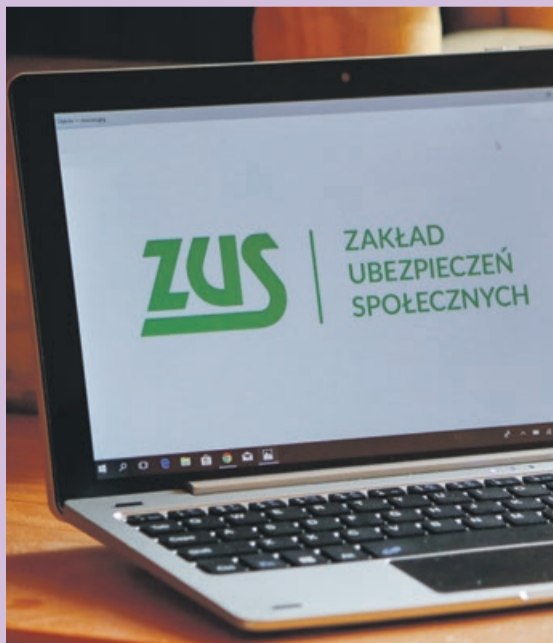
Do każdej korespondencji w skrzynce odbiorczej należy podchodzić ostrożnie

Agata Muchowska regionalny rzecznik prasowy ZUS województwa lubuskiego