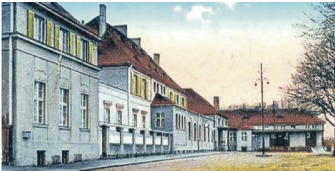
Z perspektywy tej samej ulicy po modernizacji w latach 20.

szoplanowym. Jednakże na jego całościową historyczną potęgę składała się cała sieć dodatkowych obiektów i urządzeń zapewniająca jego sprawne funkcjonowanie. Jednym z tych elementów był system zaopatrzenia stacji w wodę, zorientowany przede wszystkim w kierunku nawodniania parowozów, które przecież przez całą 150-letnią epokę kolejnictwa w Lubsku, nie pełniły pierwszoplanowej roli jedynie przez ostatnie trzy, cztery lata. Ostatni kursowy pociąg w relacji Żagań-Lubsko-Żagań, prowadzony przez żagańską Ol49-63 pojawił się na stacji 31 maja 1991 r.