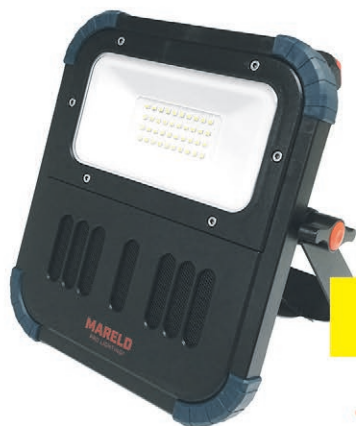
Lampa AURA 1800 RE