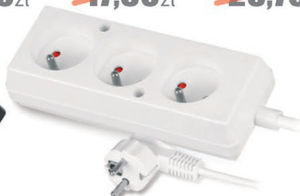
Przedłużacz 3 gniazda z/u