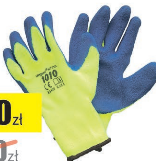
Rękawice ocieplane URGENT