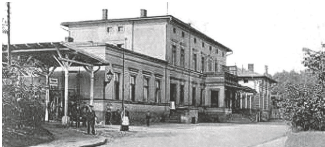
Dworzec kolejowy w Lubsku w 1907 r. od ul. Dworcowej fot. zbiory Wydziału Inwestycji i Promocji UM Lubsko

Patrząc z dzisiejszej perspektywy na możliwości techniczne i eksploatacyjne lubskiego węzła, to potężnie rozbudowany układ torowy stacji jest zagadnieniem pierw-