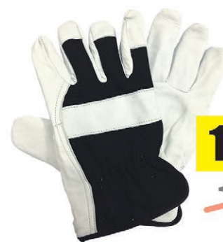
Rękawice ocieplane BOA