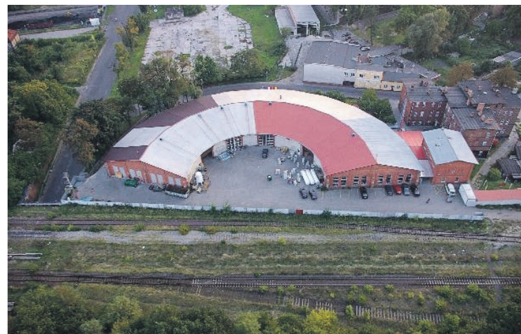
Widok z lotu ptaka na drugą lubuską parowozownię przy ul. Lubuskiej, w której mieści się firma Caleg (wcześniej Calesa). Obok budynku przetrwały lubski armagedon tor dojazdowy do składu opału nr 110 i w dolnej części tor szlakowy do Żagania. Pomiędzy nimi widoczne starotorza torów 102 i 104, a także przebiegi świeżo zlikwidowanych torów; szlakowego do Tuplic oraz zewnętrznego od strony miasta toru nr 5.