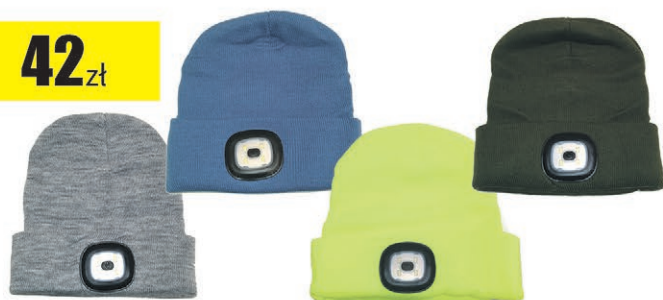
Czapka z diodą LED 45lm EXTOL (różne kolory)