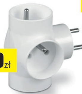
Rozgałęźnik 3 gniazda z/u