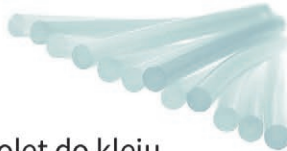
Pistolet do kleju EG111 + 500g kleju Rapid