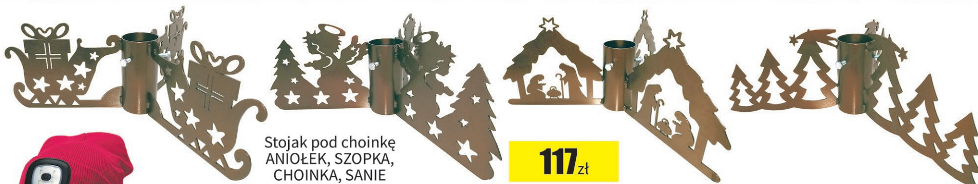
Stojak pod choinkę ANIOŁEK, SZOPKA, CHOINKA, SANIE