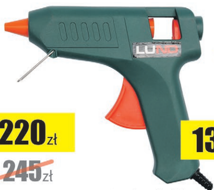
Pistolet do kleju 11mm 12(72)W LUND