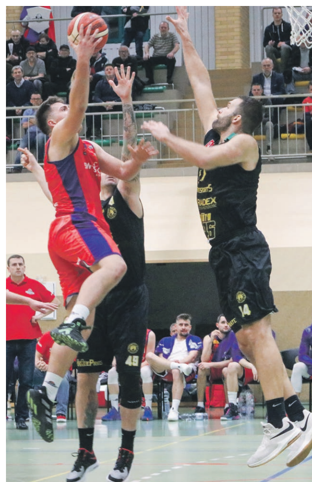
To były dwie całkiem różne połowy meczu