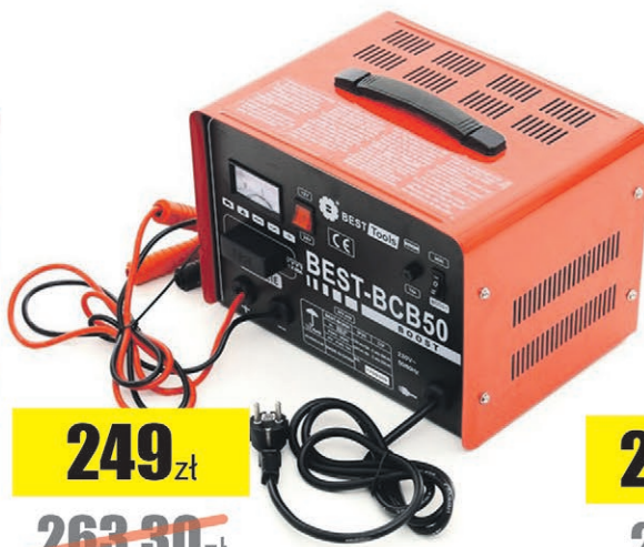
Prostownik 12V/24V 1000W Best Tools