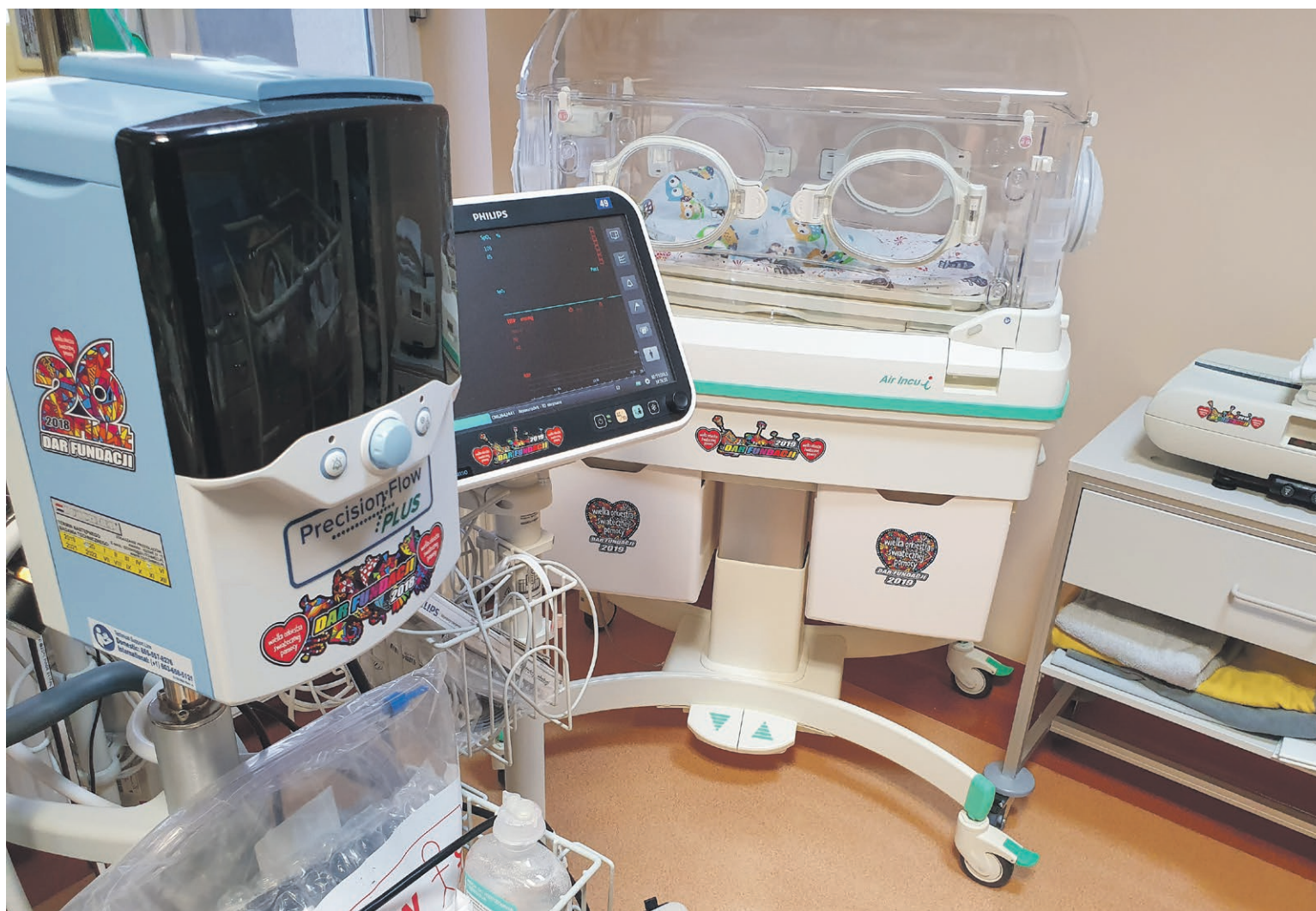
Nowoczesna aparatura medyczna to większe bezpieczeństwo i komfort maluszków na oddziale noworodkowym

Kiedyś pracownia USG była w innym budynku i trzeba