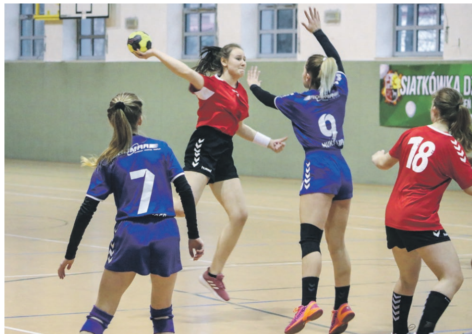
PIĘKA RĘCZNA Sokół Żary 13:24 Lider Świebodzin. Młode Sokolanki wprawdzie mecz przegrały, ale widać, że ta drużyna zaczyna grać coraz lepiej. Trening, trening, a potem trening. Wyniki przyjdą w swoim czasie