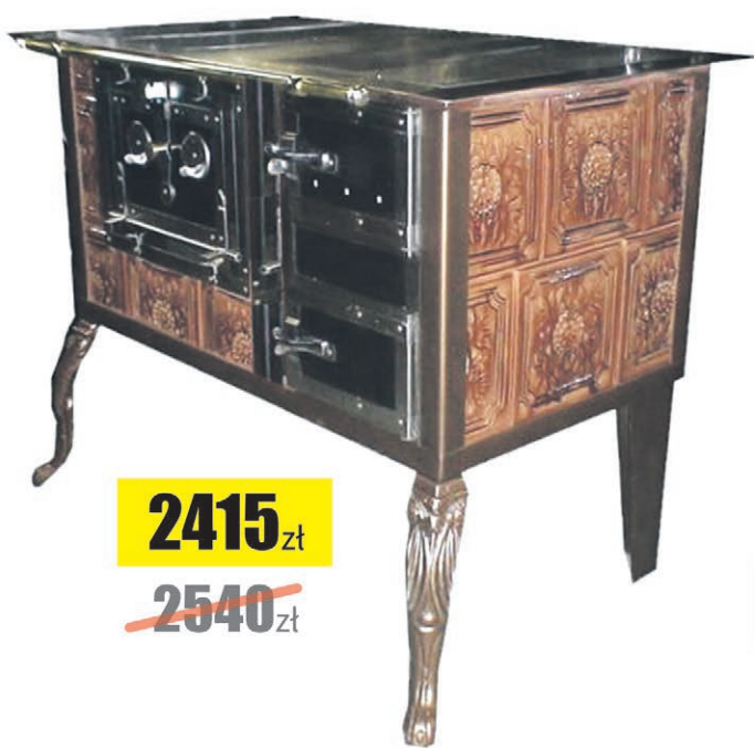
Kuchnia DOMINIKA RETRO