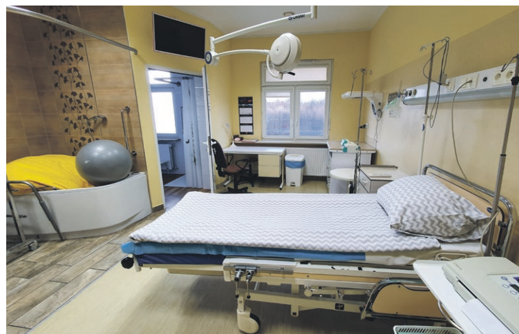
W Szpitalu na Wyspie w Żarach rodzi się prawie tysiąc dzieci rocznie