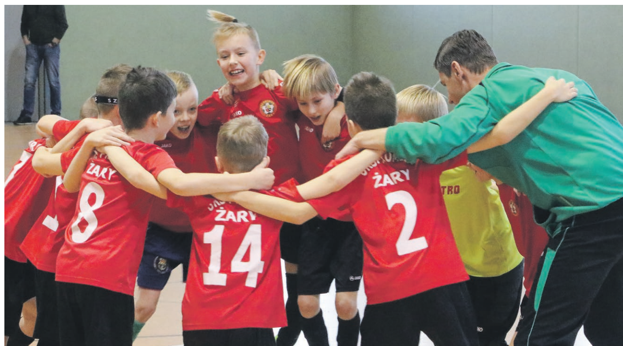
UKS Promień Żary (2010) po wygranym 10:3 meczu z Czarnymi Żagań