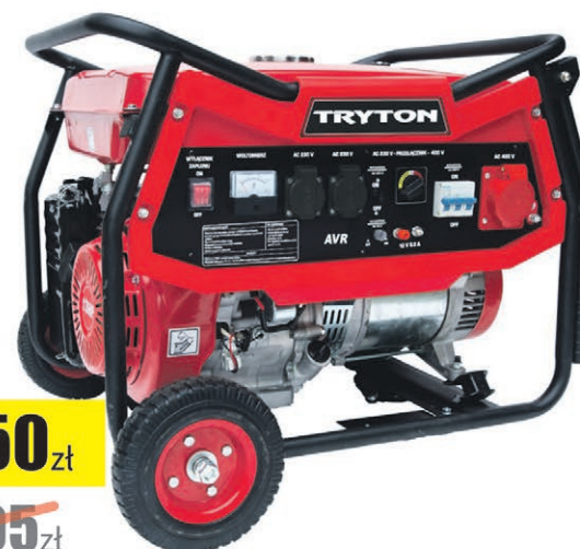
Agregat prądotwórczy 5000W Tryton