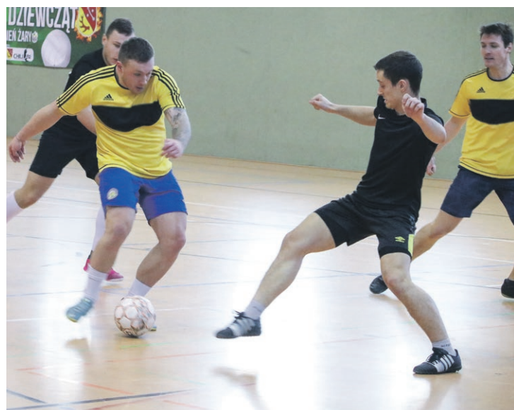
Wybrzeże Klatki Schodowej - Crips 3:10

13:00 Crips - ŻKSW 13:50 ZZO Marszów - Wybrzeże Klatki Schodowej 14:40 MMalu - Magicy 15:30 Mirostowiczanka - Endorfina & Brunetka 16:20 Kaczy Team - Yakotakokiwa 17:10 Red Devils Katalonia - Libero 18:00 ŁKS Łęknica - Hart Szkło 18:50 Tiki Taka - Hooligans