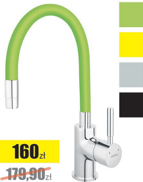
Bateria zlewozmywakowa Zumba z elastyczną wylewką Ferro (różne kolory)