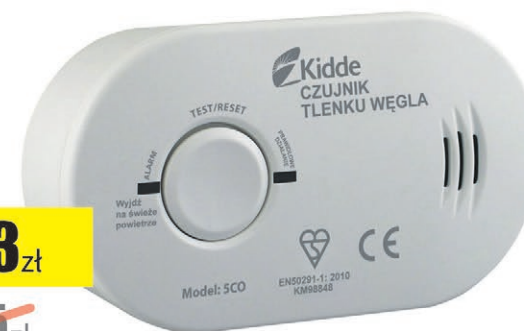
Czujnik tlenku węgla Compact + baterie Kidde