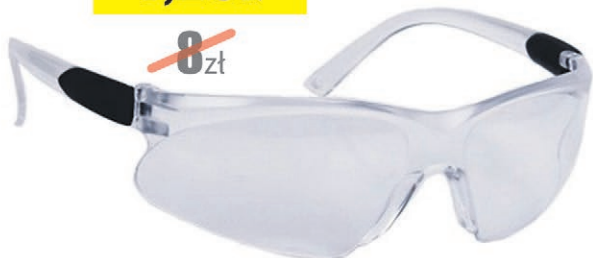
Okulary Worksafe Jaguar