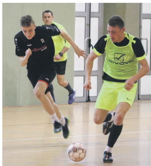
Tiki Taka - Hart Szkło 3:3