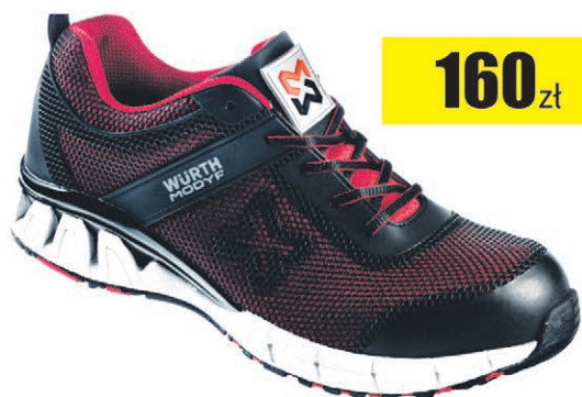
Nowość Buty siatkowe czerwone Active S1 Würth