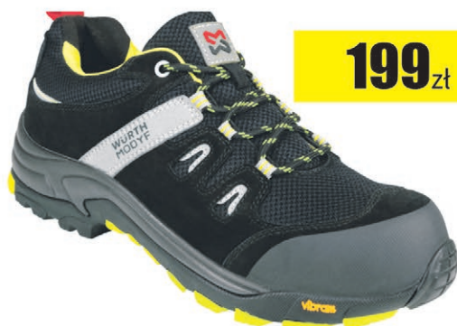
Nowość Półbut Vibram Libra S3 Würth