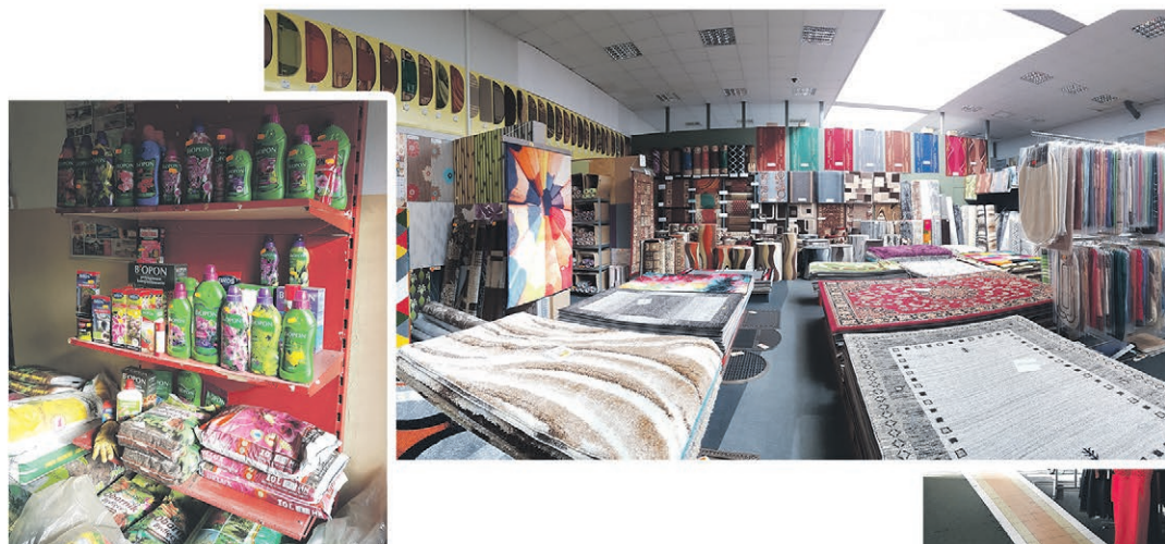
SKLEP LUBCENAS NAWOZY, NASIONA, PASZE TEL. 68 363 97 23