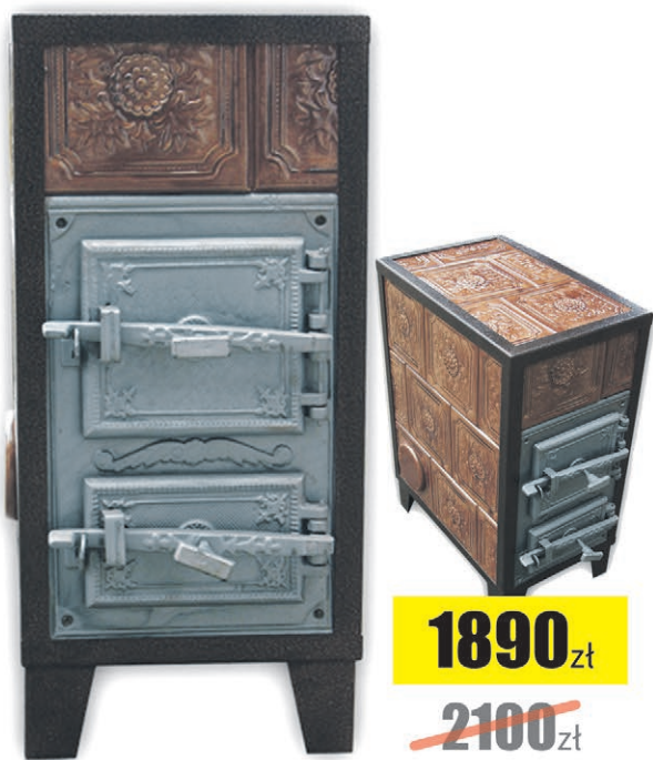
Piec grzewczy 8kW pokojowy RETRO