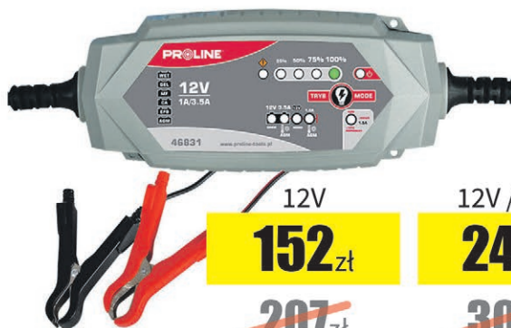
Prostownik inwertorowy Proline

12V 152 zł 207 zł 12V / 24V 243 zł 308 zł