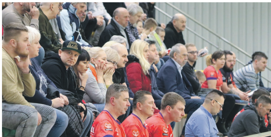
W pierwszej połowie nie było powodów do radości, ale doping nie ustawał

Następny mecz już w niedzielę 19 stycznia o godz. 16.00. Ponownie w Żarach. Przeciwnikiem będzie Röben Gimbasket Wrocław. ATB