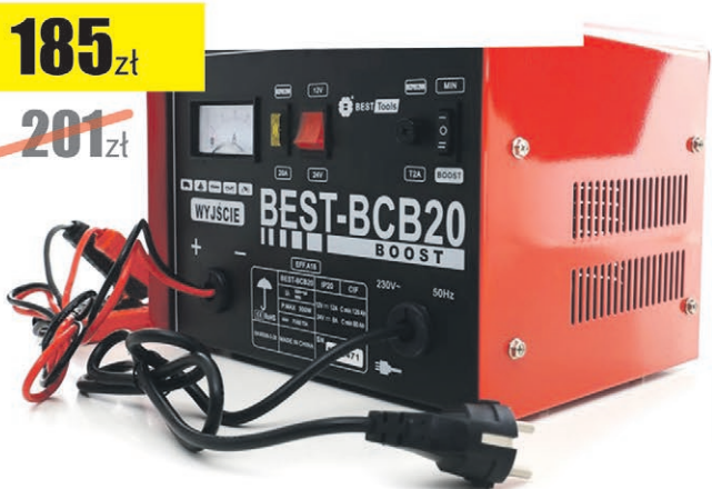
Prostownik 12V/24V 200W Best Tools