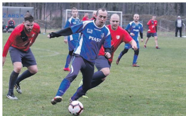
Delta Sieniawa 8:2 Piast Lubanice