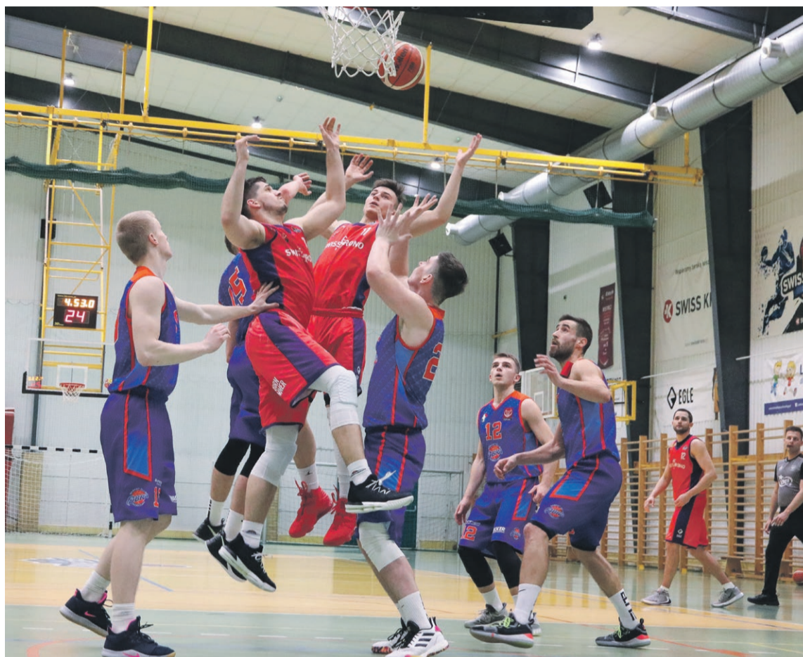
BC Swiss Krono po raz kolejny wygrywa na własnym parkiecie

BC Swiss Krono Żary zajmuje trzecie miejsce w tabeli i tym samym szykuje się do fazy play-off. ATB