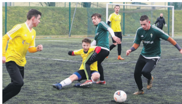
Promień Żary 3:1 TS Przylep