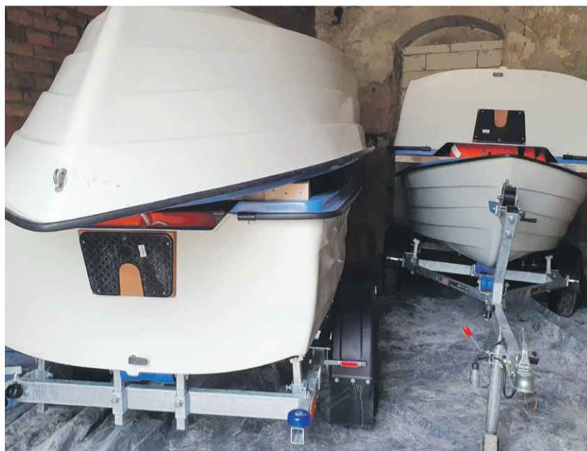
Cztery łódki już czekają

Będzie można coś zjeść, popływać łódkami po parkowym stawie. Nie będzie kajaków, ale płaskodenne czteroosobowe łódki. Cztery takie już zakupiono. Przewidziano różnego rodzaju zajęcia dla