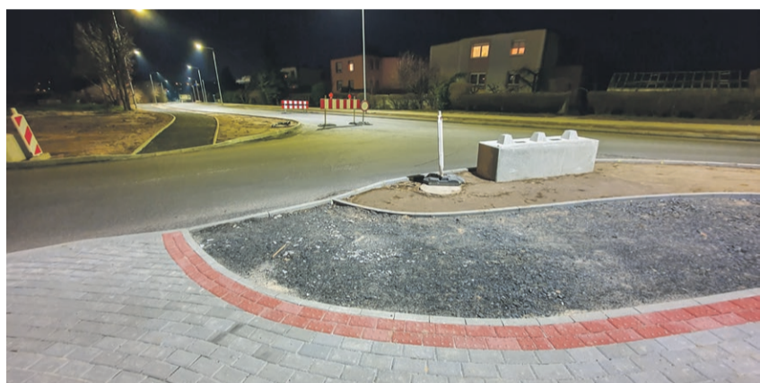
Skrzyżowanie Zielonogórskiej z Poznańską