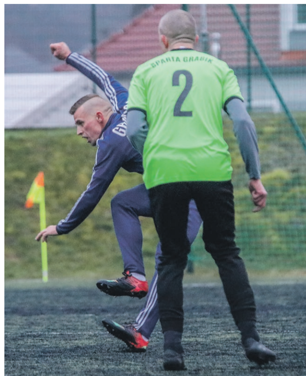
Sparta Grabik 2:3 Granica Żarki Wielkie

DAR-BOL ALFA JAROMIROWICE - SPROTAVIA SZPOTAWA MIESZKO KONOTOP - LZS KADO GÓRZYN UNIA KUNICE ŻARY - PROMIEŃ ŻARY