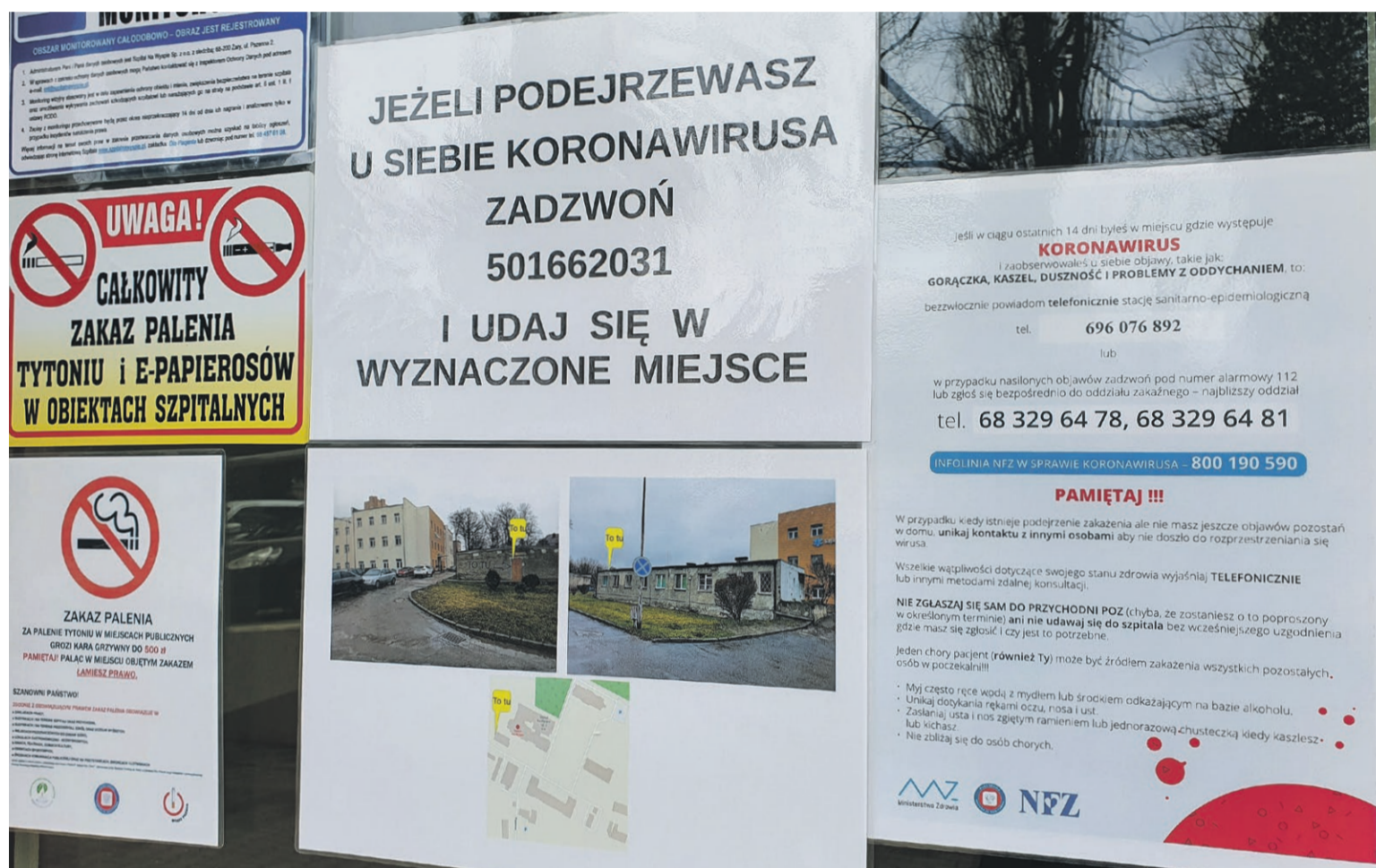
Ostrzeżenia i zalecenia, do których należy się bezwzględnie stosować

Przy wejściu do szpitala pracownik placówki przeprowadza wstępny wywiad z pacjentem, który na przykład przyszedł do szpitala ze skierowaniem. Osoby odbierające wyniki badań, przy wejściu kierowane są od razu do dozownika, aby zdezynfekować ręce.