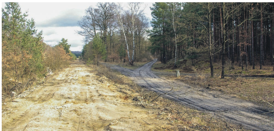
W tym miejscu, po prawej stronie starotorza w przeszłości funkcjonował przystanek osobowy Graniczno