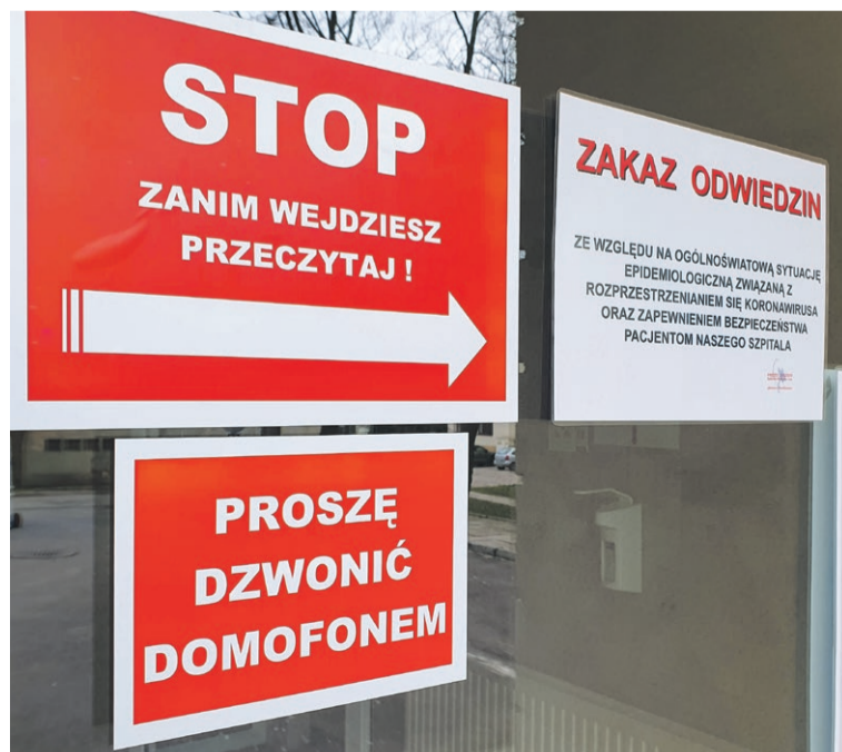
Zakaz odwiedzin dotyczy wszystkich oddziałów

- Musimy zwiększyć zatrudnienie, bo tych pacjentek będzie zdecydowanie więcej - mówi Jolanta Dankiewicz.