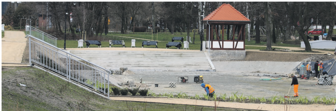
Po latach znów będzie tu można popływać łódkami

ŻARY Druga część parku przy Al. Jana Pawła II ma być gotowa w już kwietniu. Jednak oficjalne otwarcie zaplanowano nieco później, przy okazji Święta Parku.