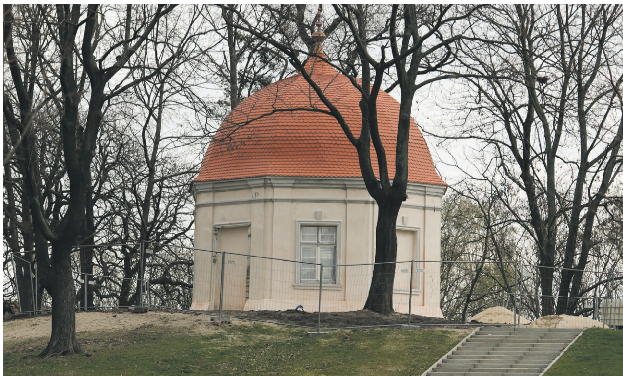
Altana na wzgórzu, jak na dawnych pocztówkach

ale już teraz warto sobie ten weekend zarezerwować na pozostanie w naszym mieście i przyjscie do parku. Na pewno warto będzie zajrzeć do budynku pofolwarcznego. Zapewne niewielu mieszkańców widziało, jak on wyglądał wcześniej, a tym bardziej po remoncie. Będzie to naprawdę bardzo fajne miejsce do organizacji różnego rodzaju spotkań i integracji naszych mieszkańców - dodaje. ATB