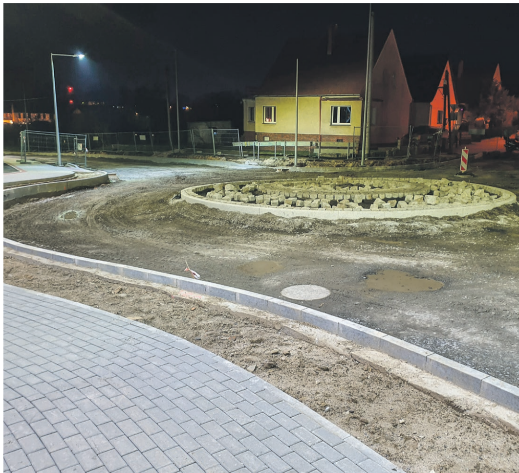
Nowe rondo na Zielonogórskiej

Kolejne zmiany zobaczymy na rondzie łączącym ulice Zielonogórską, Żabikowską, Podchorążych oraz Aleję Jana Pawła II. Będą prawoskrętne z Podchorążych w Aleję i z Alei w Zielonogórską. Prace na rondzie oraz odcinku do ul. Skarbowej rozpoczną się po zakończeniu tych trwających obecnie. ATB