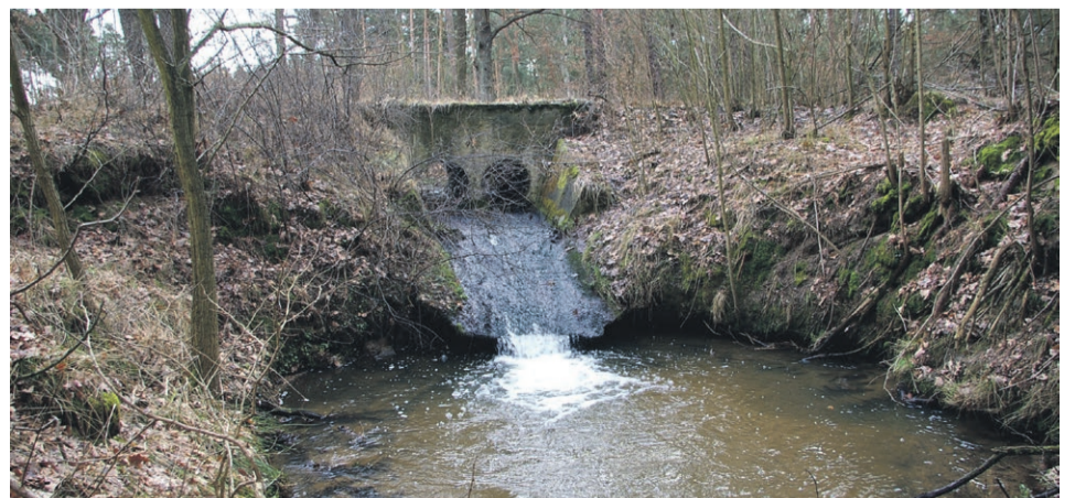
Dwukomorowy przepust bezimiennego strumienia zasilającego wody Tymnicy przechodzący pod dawną linią kolejową na odcinku Graniczno-Świbinki