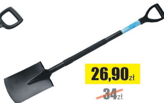
Szpadel prosty IDEAL PRO 1200mm Cellfast + wąż