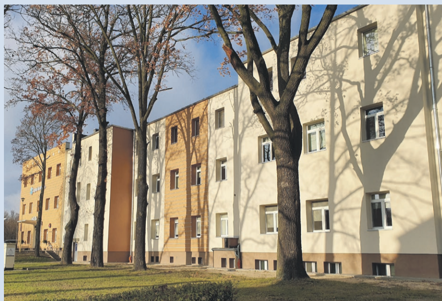
Szpital na Wyspie

Komunikat dotyczący ograniczeń w działalności Szpitala Na Wyspie w Żarach wynikających z sytuacji epidemicznej w kraju, związanej z zapobieganiem, przeciwdziałaniem i zwalczaniem COVID-19