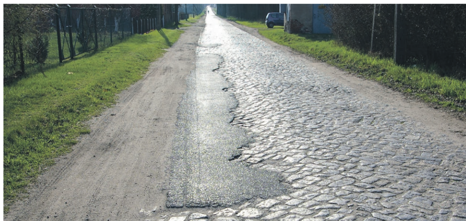
Wzdłużne rysy na drodze powiatowej do Drzeniowa są pamiątką po transporcie Lyntogów na plac gdzie funkcjonowała wagonowa świetlica