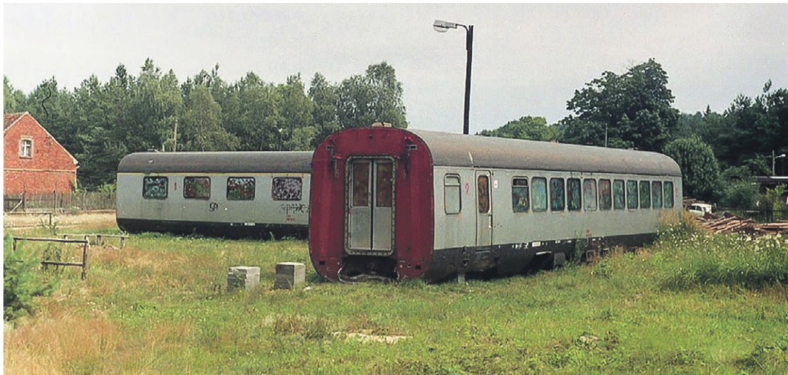
Dzielnie opierająca się zmianom cywilizacyjnym świetlica-kawiarnia w Nowej Roli. W drugiej połowie lat 90. wielki ośrodek kulturalny tworzyły trzy wagony dawnej Lubuskiej Kolei Regionalnej

Dawny tor kolejowy opuszczając zbudowania Świbinek, prowadził dalej do oddalonej tylko o kilometr Nowej Roli. Na skraju wsi znajdował się jeszcze nieustrzeżony przejazd z drogą asfaltową spinającą obie miejscowości. Już bliżej Nowej Roli, szosa ta przybliżyła się do starotorza i biegnie wzdłuż niego aż do skrzy-