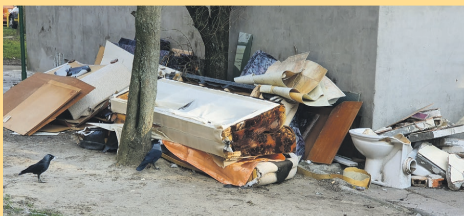
Za coś takiego należy się grzywna

Od 16 marca nie można więc zawieźć tam i oddać nieodpłatnie na przykład starej wersalki. Nie oznacza to jed-