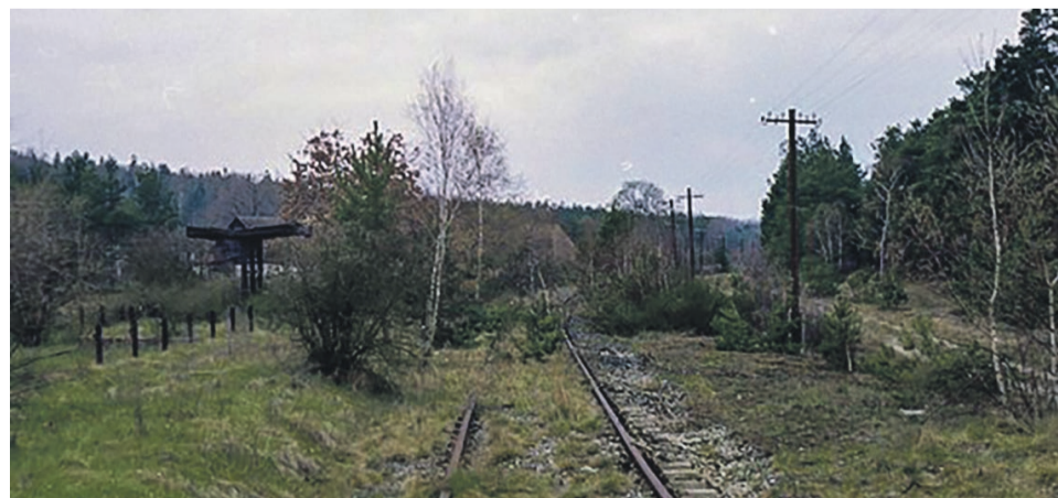
Wiata przystanku osobowego w Świbinkach w krańcowym okresie istnienia toru do Tuplic