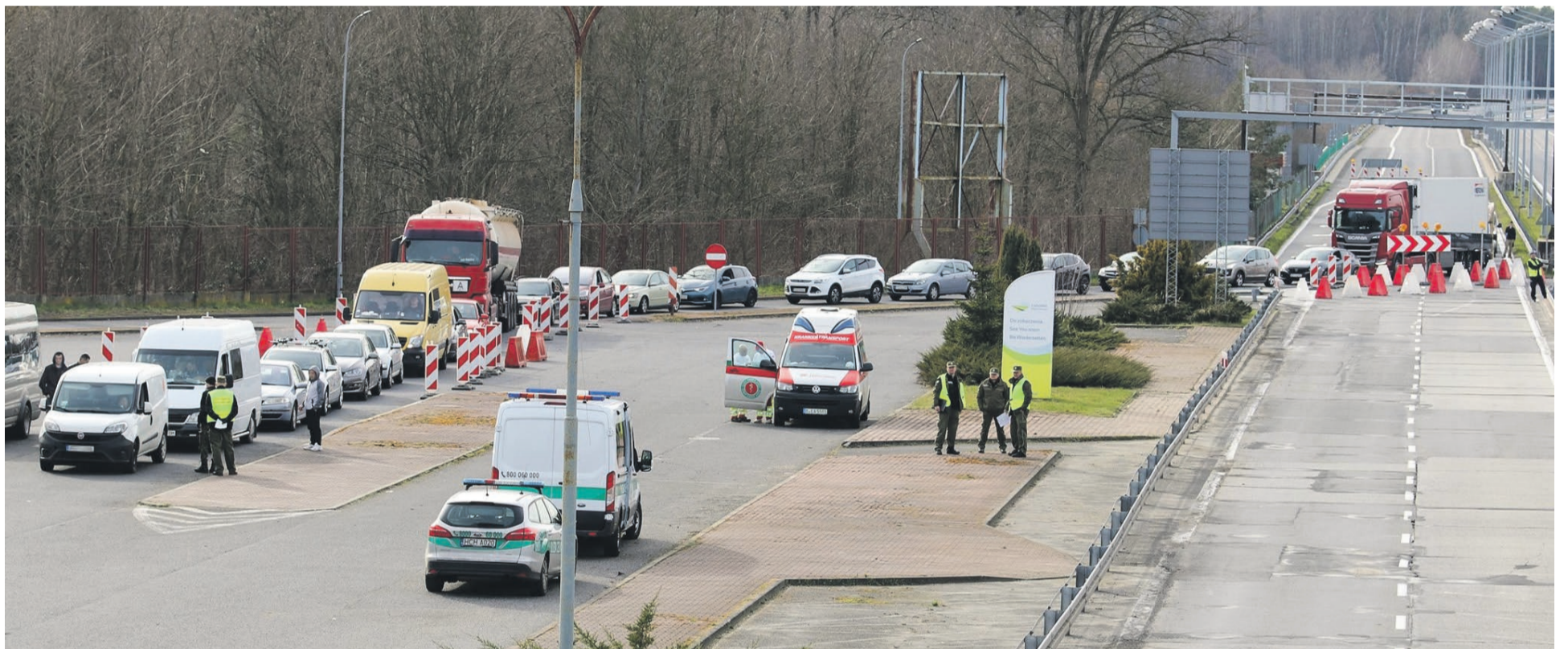
15 marca - Olszyna. Kolejka była jeszcze krótka, ale z każdym dniem się wydłużała

POWIAT ŻARSKI W niedzielę 15 marca zamknięte zostały przejścia graniczne. W powiecie żarskim w miejscowościach Przewóz, Łęknica, Siedlec, Zasięki. Ruch graniczny, z pewnymi zastrzeżeniami, odbywał się już tylko w Olszynie.