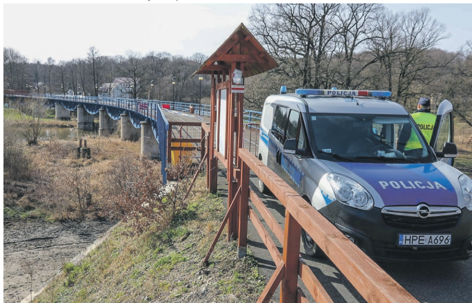
15 marca - dawny most kolejowy w Łęknicy

Od wtorku 17 marca br. od godziny 8.00, żołnierze 11 Lubuskiej Dywizji Kawalerii Pancerniej (11LDKPan) rozpoczęli realizację zadania wsparcia działań Straży Granicznej w województwach lubuskim i dolnośląskim.