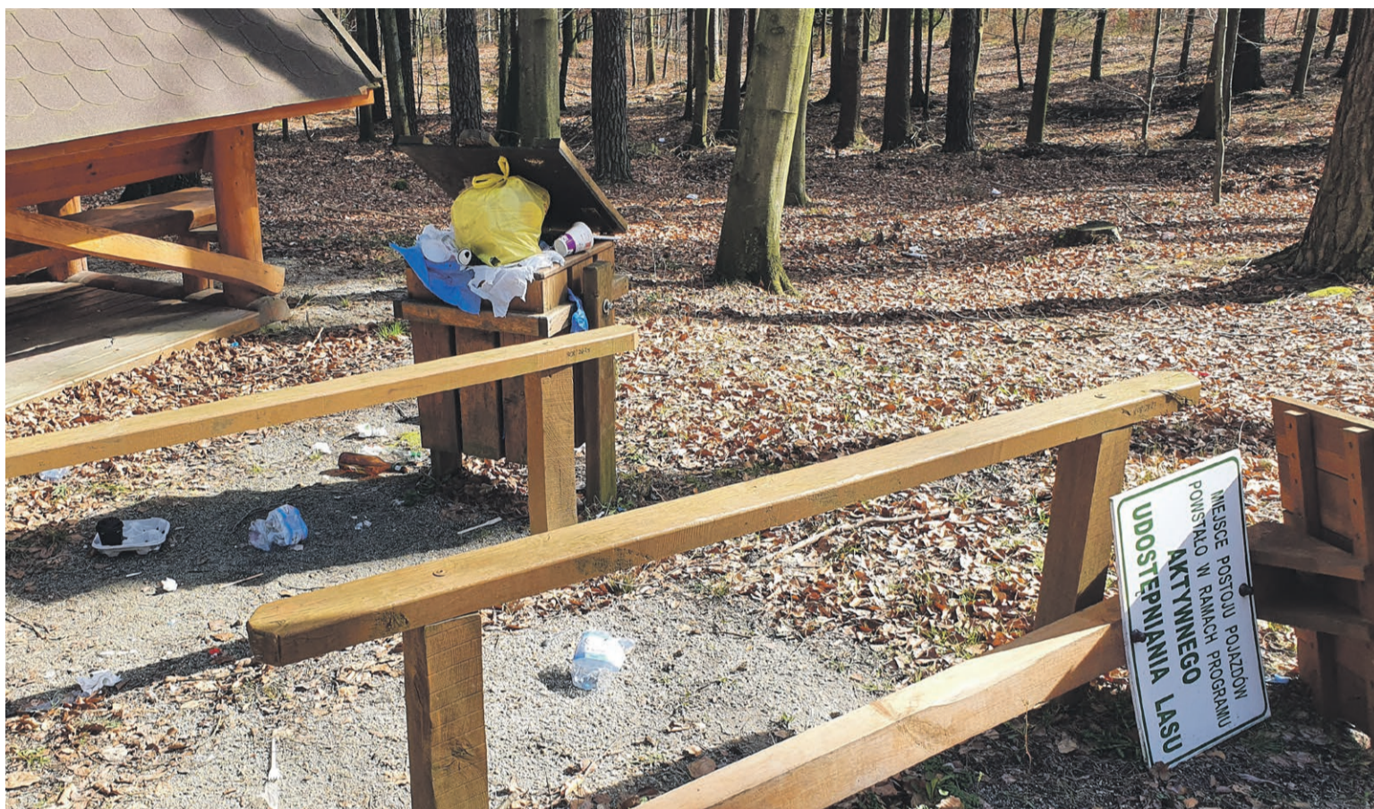
Sezon na śmiecenie w lesie trwa ciągle

Druga kategoria śmieciarzy leśnych to „impresowicze” i konserwy fastfoodów. Słyną z tego, że przywiezą jedzenie do lasu, zjedzą w pięknych okolicznościach przyrody, ale resztek i opakowań już ze sobą nie zabiorą. To chyba zbyt trudne. Być może po jedzeniu siły opuszczają i ciężko dźwignąć pusty kartonik po hamburgerze, albo kubek po kawie. To wszystko niestety zostaje w lesie.