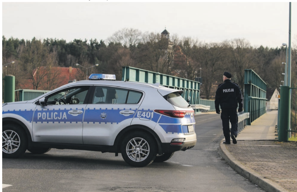
15 marca - Przewóz