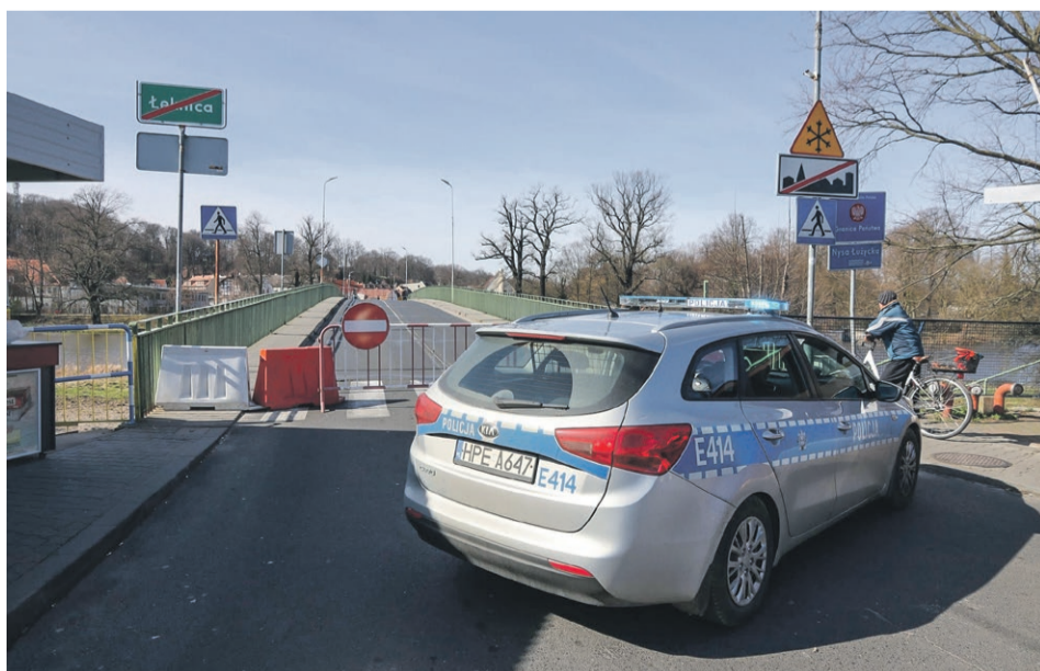
15 marca - most przy bazarze w Łęknicy