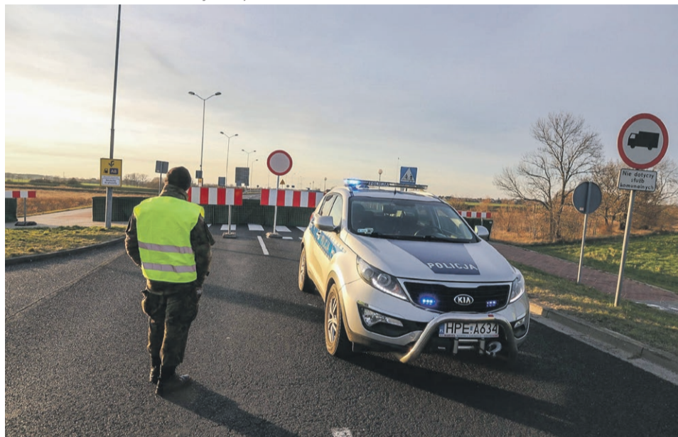
15 marca - Zasięki