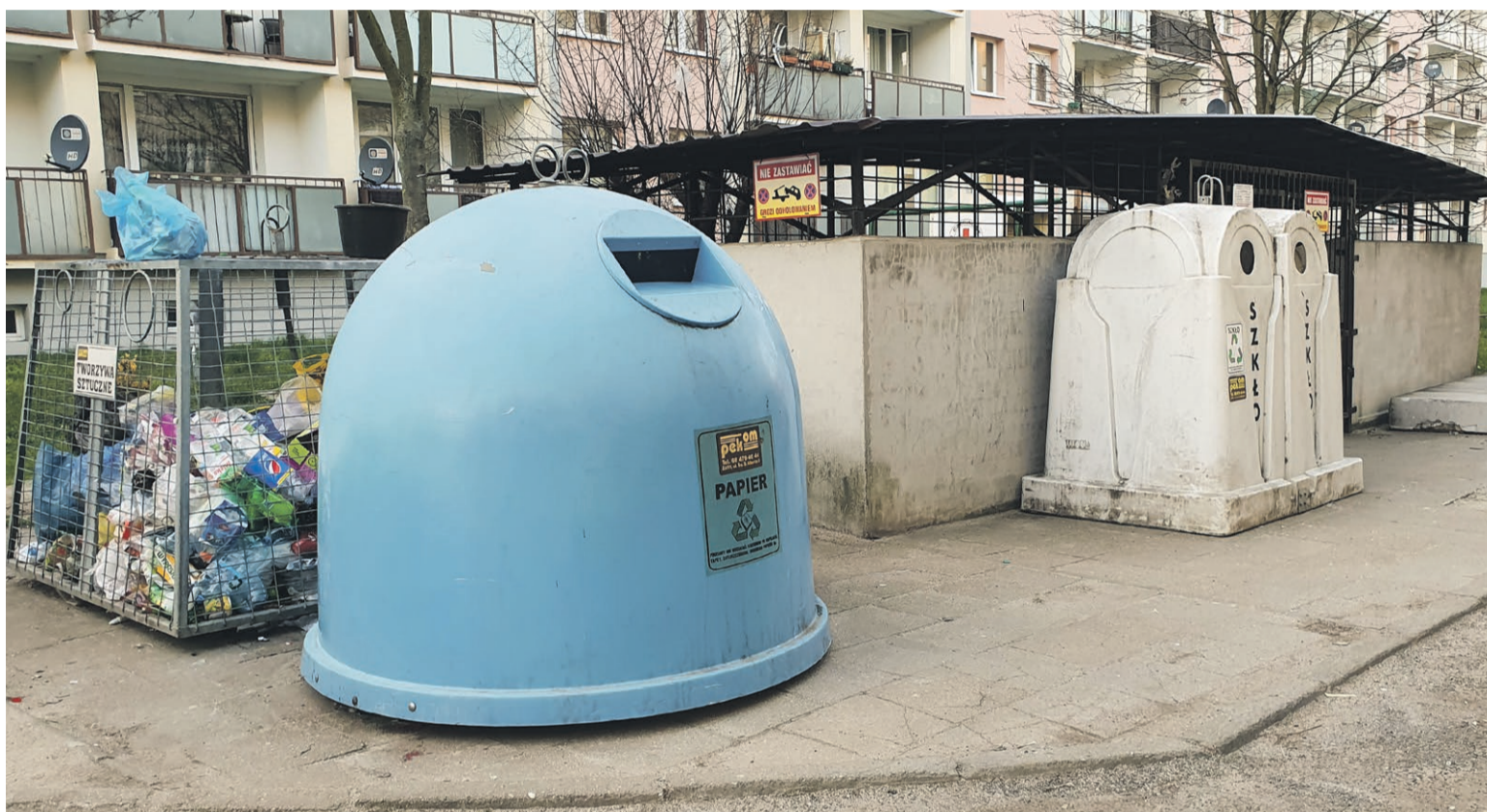
We wrześniu rusza mała rewolucja śmieciowa

Już też są pewne przymiarki do wzrostu kosztów za przyjmowanie odpadów zmieszanych.