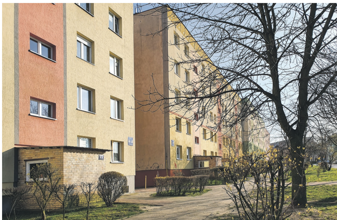
Mieszkańcy czekają na zaświadczenia

Jak się okazało, takich spraw w samych Żarach jest kilkanaście tysięcy. Urząd nie otrzymał z tego tytułu dodatkowych środków na przeprowadzenie całej akcji. Musieli się tym zająć urzędnicy, którzy już wcześniej mieli co robić. W efekcie, nie było to fizycznie możliwe, aby wszystkie zaświadczenia zostały wystawione do końca grudnia.