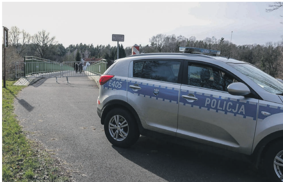
15 marca - Siedlec