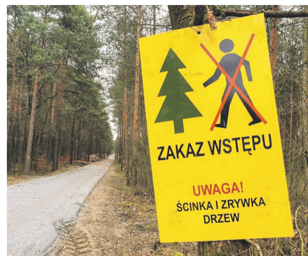
Takie miejsca należy omijać

- Są to czasowe zakazy wstępu do lasu wprowadzane na wypadek prac le-