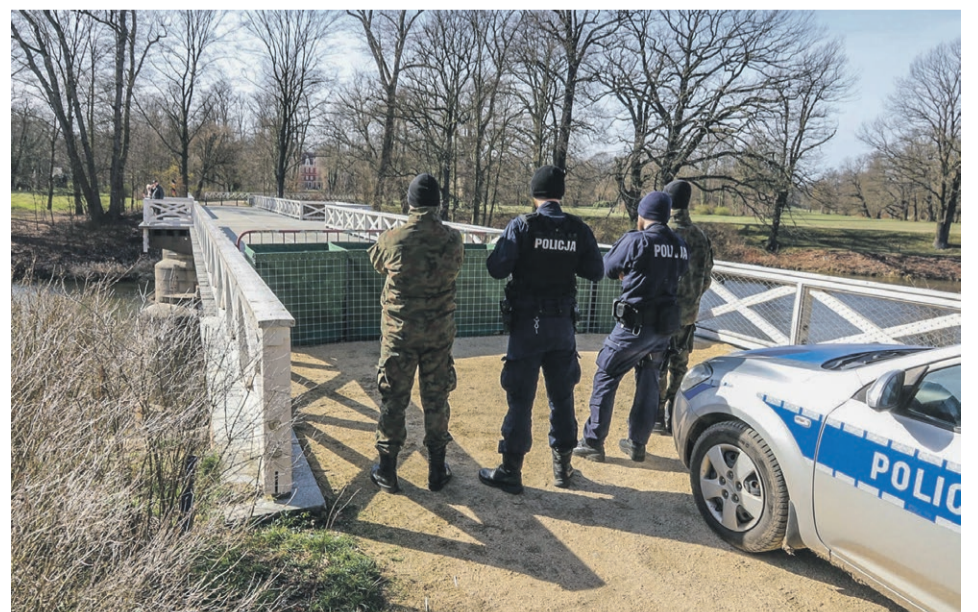
15 marca - most w Parku Mużakowskim w Łęknicy