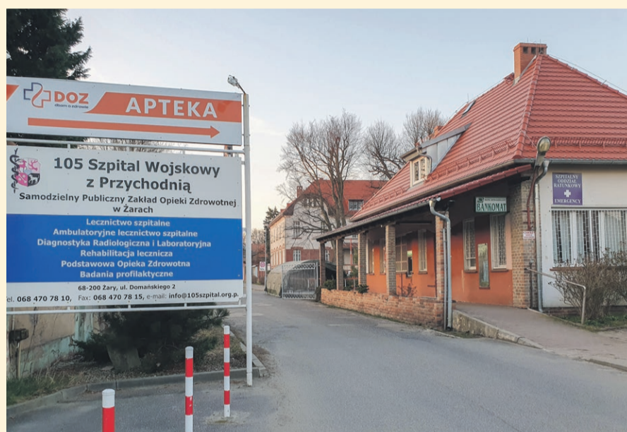
105. Szpital Wojskowy

Komunikat dotyczący ograniczeń w działalności 105. Kresowego Szpitala Wojskowego z Przychodnią SP ZOZ wynikający z sytuacji epidemicznej w skali krajowej związanej z zapobieganiem, przeciwdziałaniem i zwalczaniem COVID - 19