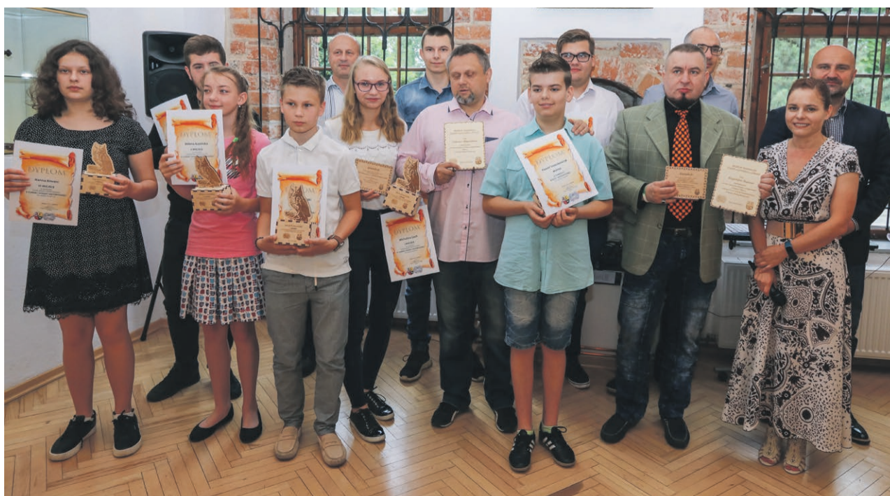
Podsumowanie V edycji konkursu zorganizowano 5 lipca

Kolejna, szósta edycja konkursu już w następnym roku szkolnym. ATB