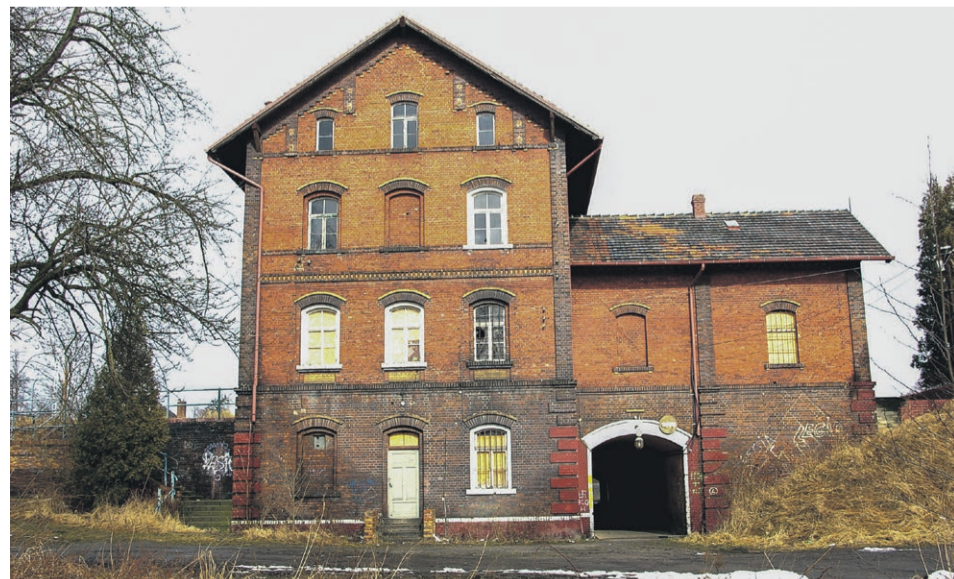
Dworzec Kolei Łużyckiej, pełniący od okresu powojennego funkcję stacji PKP w Tuplicach