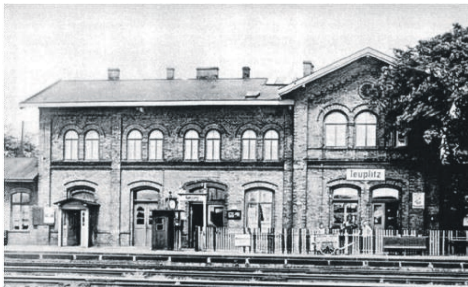
Zlikwidowany w okresie powojennym dworzec państwowej kolei Halle-Żary w Tuplicach