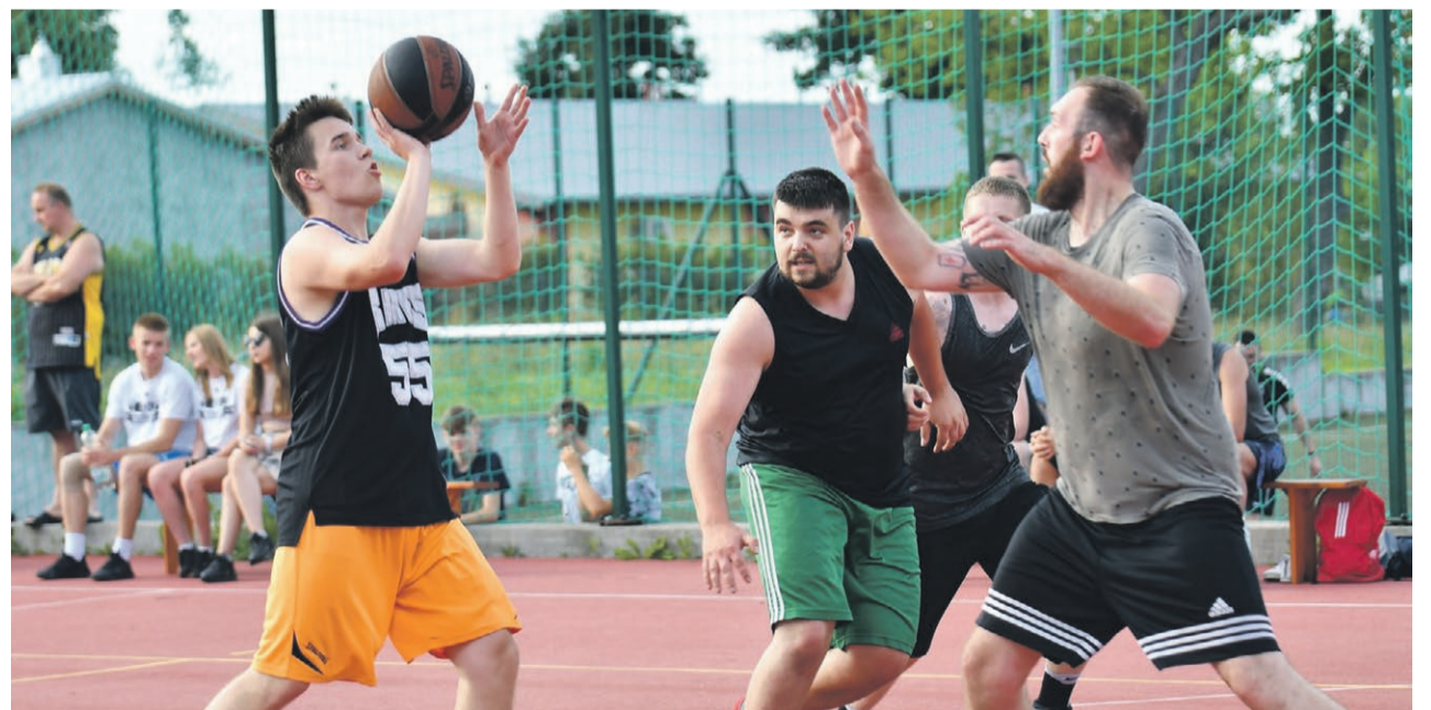
Sporto koszykówki będzie można obejrzeć przez całe wakacje na Orliku przy ul. Paderewskiego

18:00 White Nuggets - ZajaceHasajacePoŁace 17:15 18:15 Team Rekuś - Basket Squad 6:11 18:30 Space Dżem - Balasy 13:11 18:45 Ultras Żary - Ciavo Destroyers 3:12 19:00 ZajaceHasajacePoŁace - Balasy 19:11 19:15 Haracze - Team Rekuś 19:13 19:30 Basket Squad - White Nuggets 7:22 19:45 Space Dżem - ZajaceHasajacePoŁace 10:22 20:00 Żary Bulls - Ultras Żary 17-5 20:15 The Fyooters - ZajaceHASajacePoŁace 9:15 20:30 Ultras Żary - Space Dżem 5:9