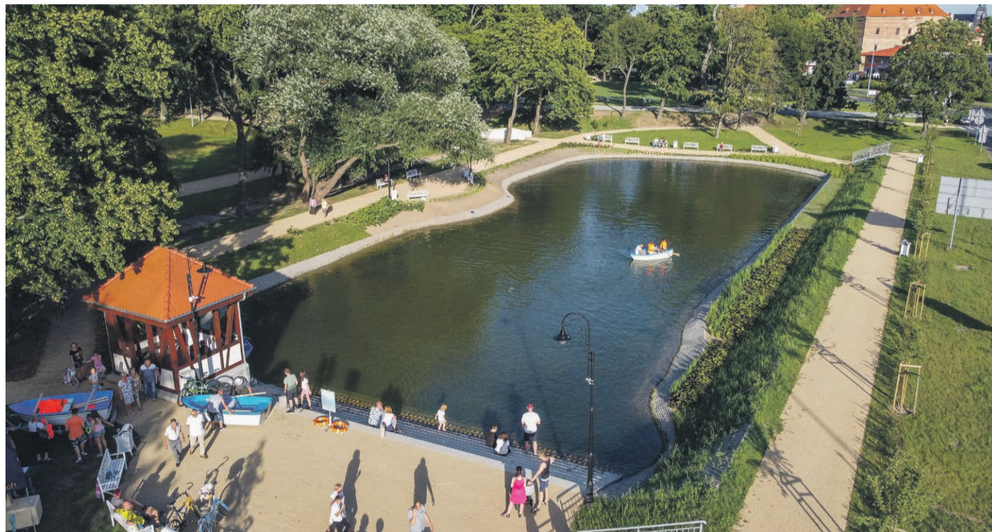
Ostatnią łódkę wyciągnięto z wody o godz. 19.00

Najbardziej oczywiście podoba się to dzieciakom. Łódki będą pływać po stawie w każdą niedzielę. ATB