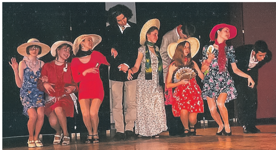
Premiera - 27 marca 1996 roku

„Jedynym wyjściem z sytuacji staje się eliminacja „bezformia”, które psuje dobrze działający, niemal rytualny, mechanizm dworski. Książę całuje się więc z damą dworu Izą, ale robi to po to, by zerwać z Iwoną i tym samym, w istocie, ją unicestwić. Król, Królowa i Książę polują na Iwonę. Nikt nie ma wątpliwości - Iwonę trzeba zabić. Ale i tutaj pojawiają się problemy. Nie można przecież zabić tak po prostu, bez procedury czy protokołu, trzeba znaleźć „formalne” uzasadnienie morderstwa zgodne z etykietą i zasadami cywilizowanego państwa prawa. Czyli zabić obłudnie. Iwona ginie więc jakby przez przypadek podczas precyzyjnie wyreżyserowanej uczty, kiedy na skutek własnej niezgrabności dławi się rybią ością. Wówczas wszyscy