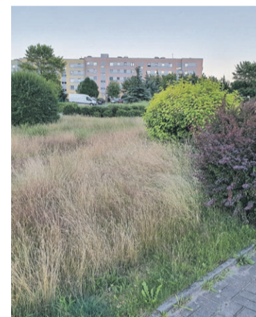
Kwietna łąka przy ul. Szymanowskiego