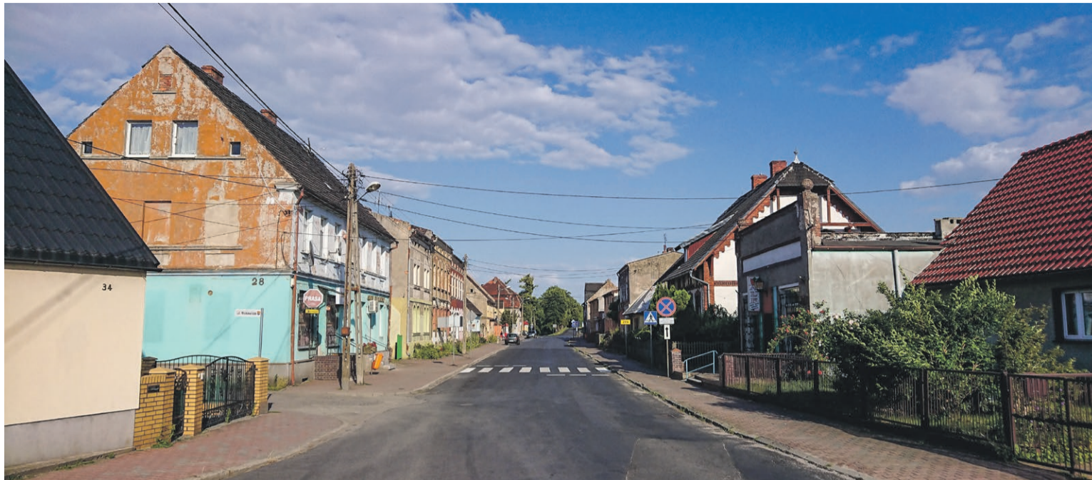
Widok na ulicę ul. Mickiewicza w Tuplicach - trzon rozwojowy dawnych Małych Tuplic oraz symbol przemian dziejowych (z czasów niemieckich Bahnhof StraÙe i ul. Lenina w okresie PRL)

W takich okolicznościach tuplicki węzeł kolejowy zaczął wyraźnie dominować zarówno w przestrzeni gospodarczej, społecznej jak i krajobrazowej.