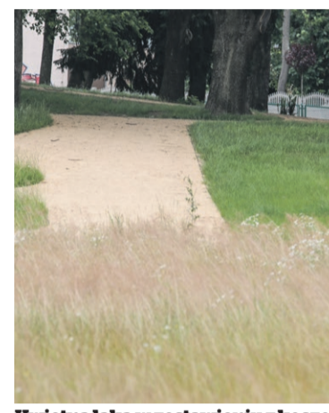
Kwietna łąka w zestawieniu z kosownym trawnikiem w parku przy Alei Jana Pawła II

Kończy się na szczęście pierdolamento przedwyborcze. Znaczą, kampania. Z internetu wylewają się strumieniami, a nawet rwącymi górskimi rzekami, wszystkie możliwe negatywne emocje. Za chwilę będzie można odetchnąć. A swoją drogą, ciekawe, jak wyglądałaby kampania wyborcza, każda, nie tylko prezydencka, gdyby wprowadzić ustawy zakaz mówienia źle o kandydatach. Gdyby można było tylko zachęcać do głosowania programem, planami, osobowością i dokonaniem. Przecież powinniśmy wybrać to, co naszym zdaniem jest lepsze, a nie to, bo tamto jest gorsze. Czego byśmy nie wybrali w niedzielę, zrobi się trochę spokojniej internecie, tylko pierdolamenciarze mogą poczuć się nieswojo. Zaczną może dostrzegać jaśniejsze strony życia?