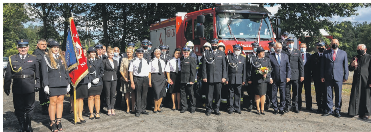
Przekazanie auta miało bardzo uroczysty charakter