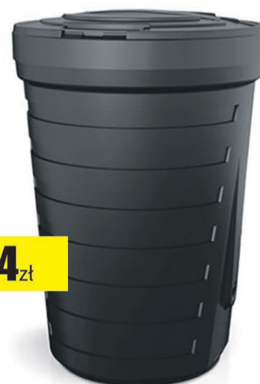
Pojemnik na deszczówkę Raincan 210L czarny