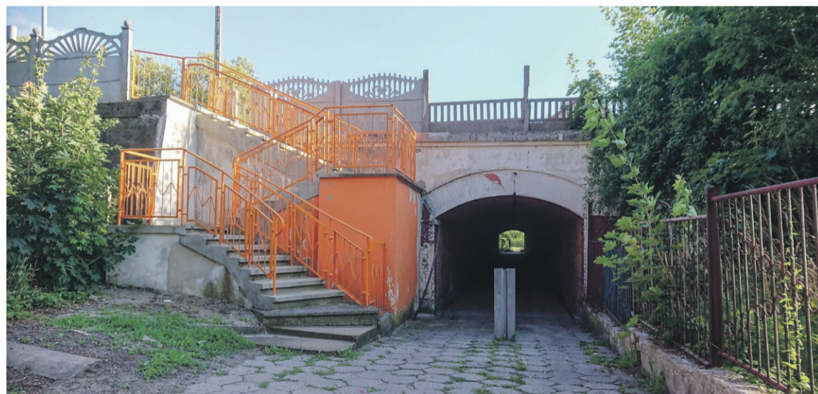
Wlot do podziemnego przejścia pod torowiskiem od ul. Mickiewicza. Z przodu schody prowadzące na perony 3 i 4.