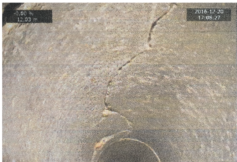
Fragment rurociągu pod ul. Kujawską