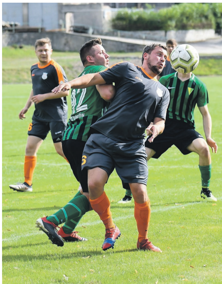
Budowlani Lubusko 1:1 Pogoni Przyborów