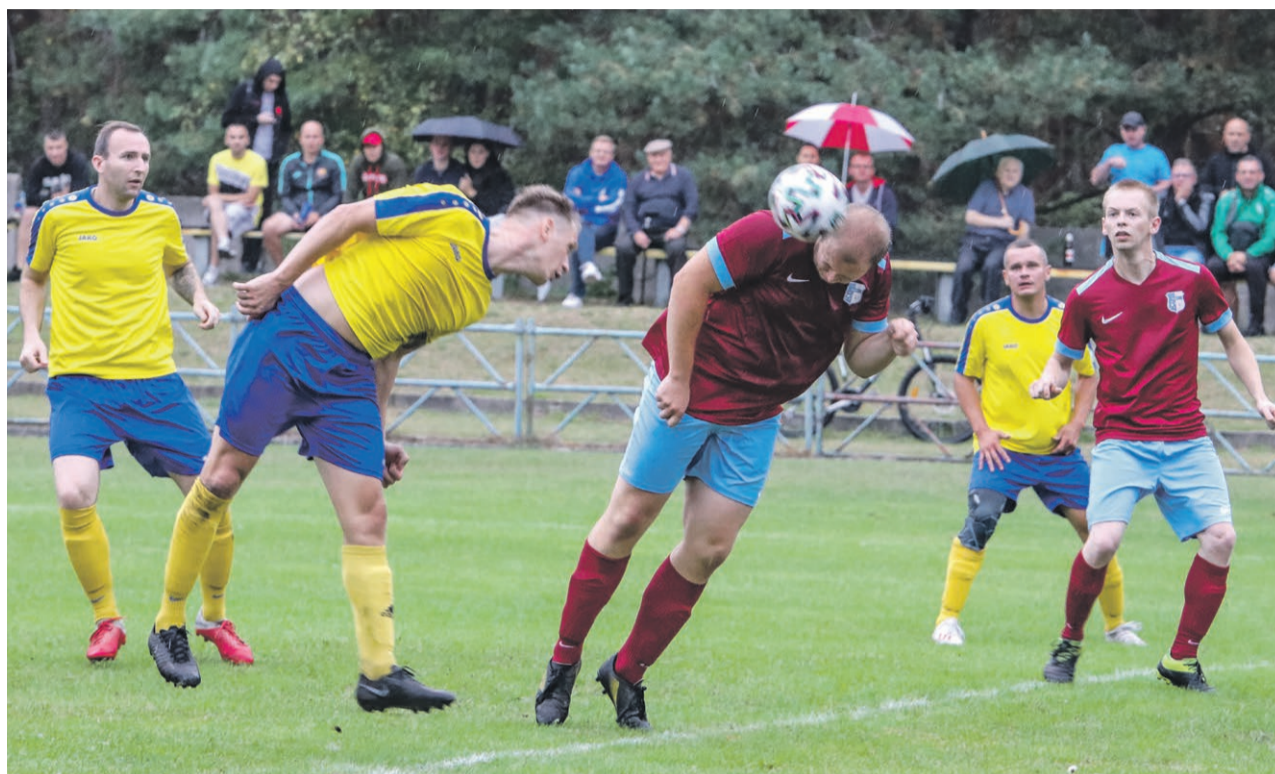
Stal Jasień 7:2 Piast Lubanice