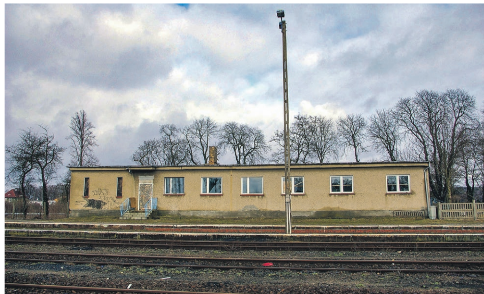
Istniejący do dzisiaj budynek gospodarczy przy peronie 4 wybudowany w latach 70. przez pracowników oddziału wagonowni