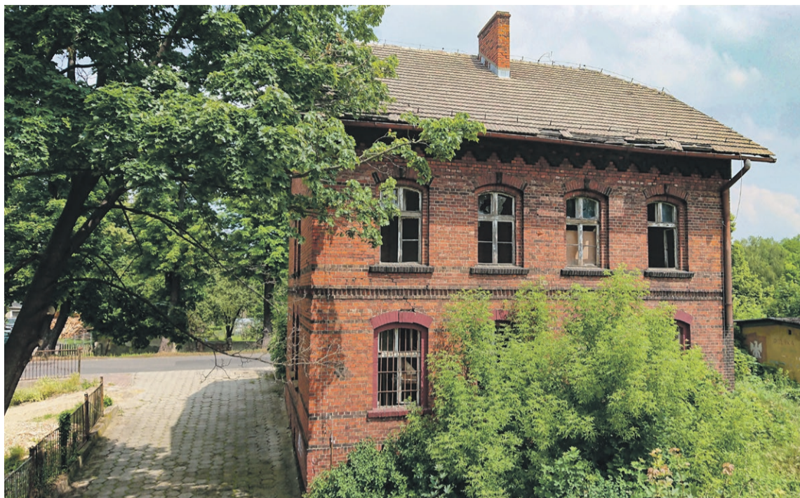
Opuszczony i odchodzący w zapomnienie biurowiec kolejowy przy ul. Mickiewicza w Tuplicach

Plac po drugiej stronie łącznika obu dawnych dworców, został zajęty przez wielofunkcyjny trzykondygnacyjny, podpiwniczony biurowiec kolejowy z charakterystycznej czerwonej cegły. Na jego parterze, jeszcze w latach