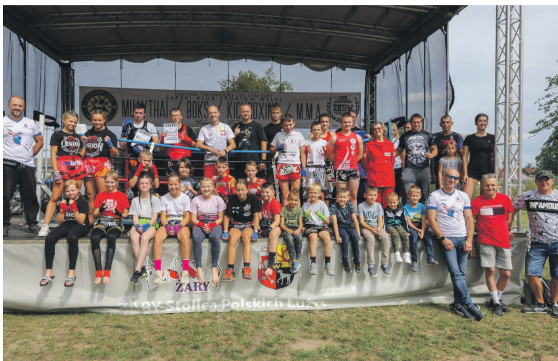
Młodzi wojownicy na turnieju w Żarach

W turnieju uczestniczyli zawodnicy z Łodzi, Kalisza, Głogowa, Szprotawy i Żar. Była to również ostatnia okazja startu przed zbliżającymi się Mistrzostwami Polski Muaythai. ATB