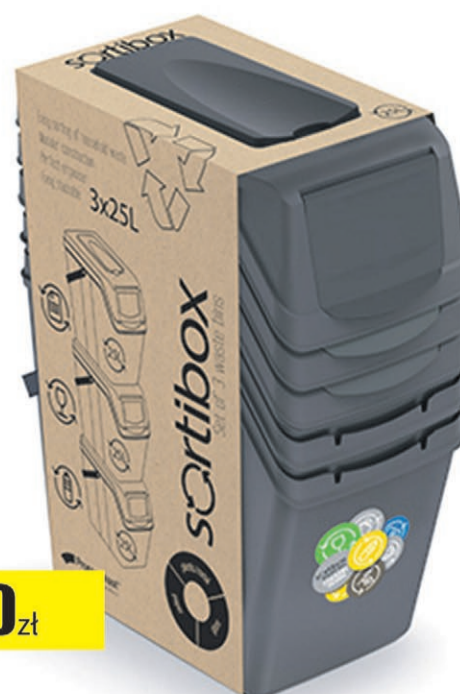
Kosz na śmieci SORTIBOX antracytowy 25L 3-cz.