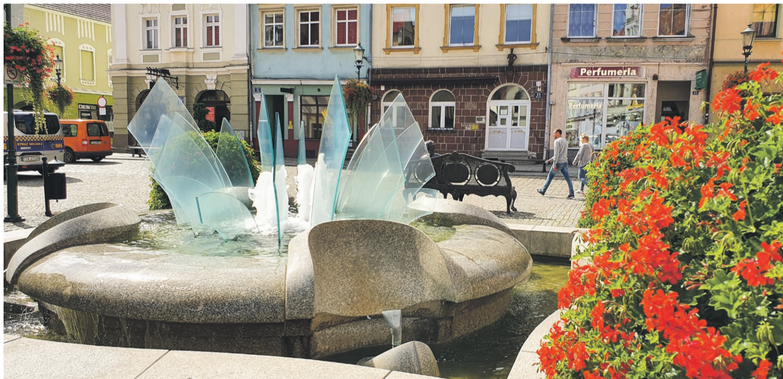
Do basenów miasto dopłaca. Do kwiatów i fontann też

Czy można powiedzieć, że baseny przynoszą straty, bo miasto do nich dokłada? Powiedzieć można, jeśli bierzemy pod uwagę aspekt wyłącznie ekonomiczny, a nie kwestię zaspokajania potrzeb mieszkańców. A ludzie chcą korzystać z basenów i niekoniecznie płacić dwa razy więcej za bilety. Podobnych przypadków jest sporo.