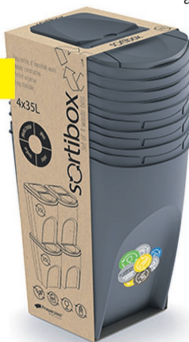
Kosz na śmieci SORTIBOX antracytowy 35L 4-cz.