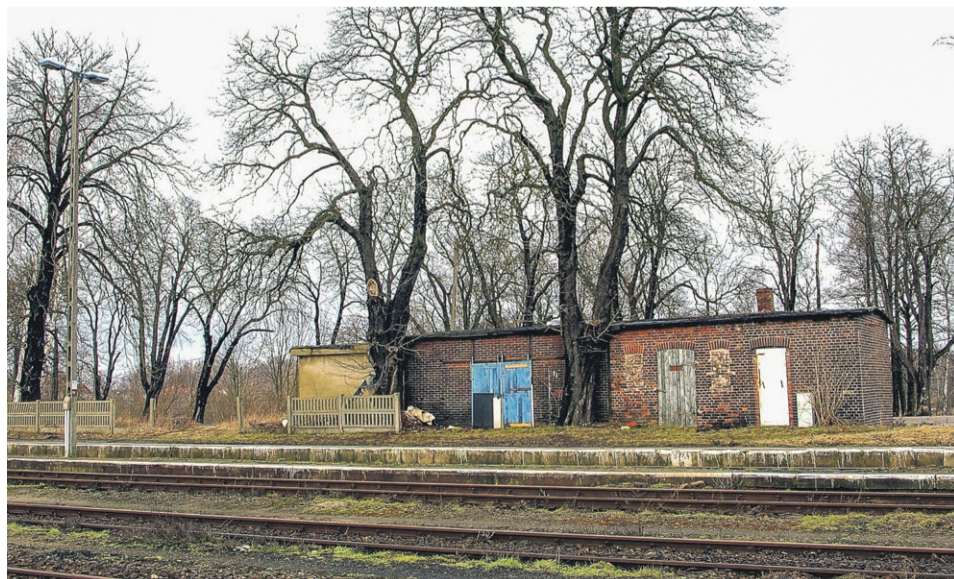
Plac po zlikwidowanym dworcu państwowym kolei Halle-Żary został zajęty w epoce PRL przez magazyn zwiadowcy stacji i garaż wózków akumulatorowych. Oba obiekty wyburzono w 2018 r.