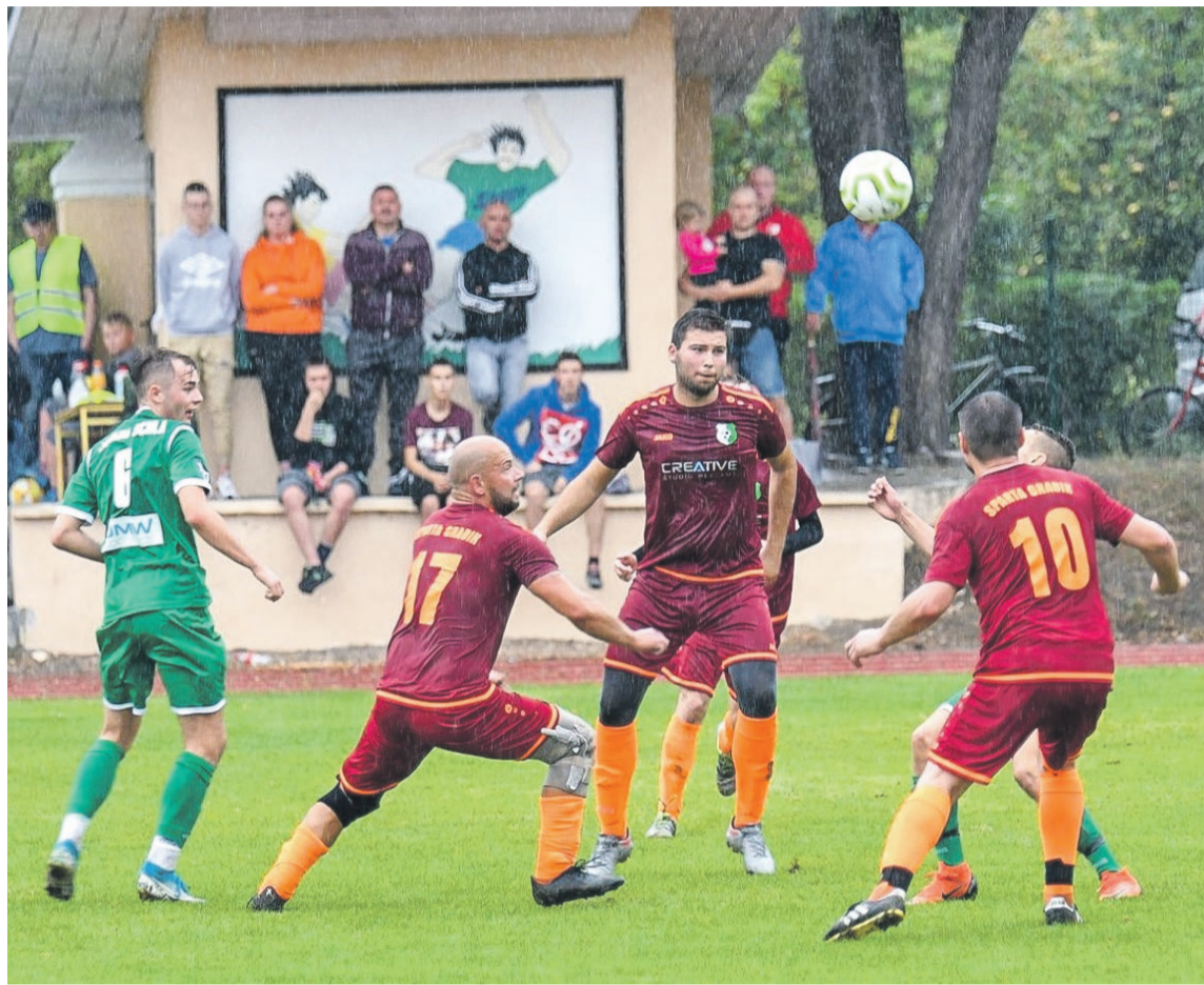
Sparta Grabik 1:4 Zorza Ochla

Obie drużyny najpierw musiały przyzwyczaić się do trudnych warunków. Białozielona kula często grzęzła w błocie lub niespodziewanie przyspieszała po próbie podania. Nogi stawały się z minuty na minutę coraz cięższe na mokrej nawierzchni,