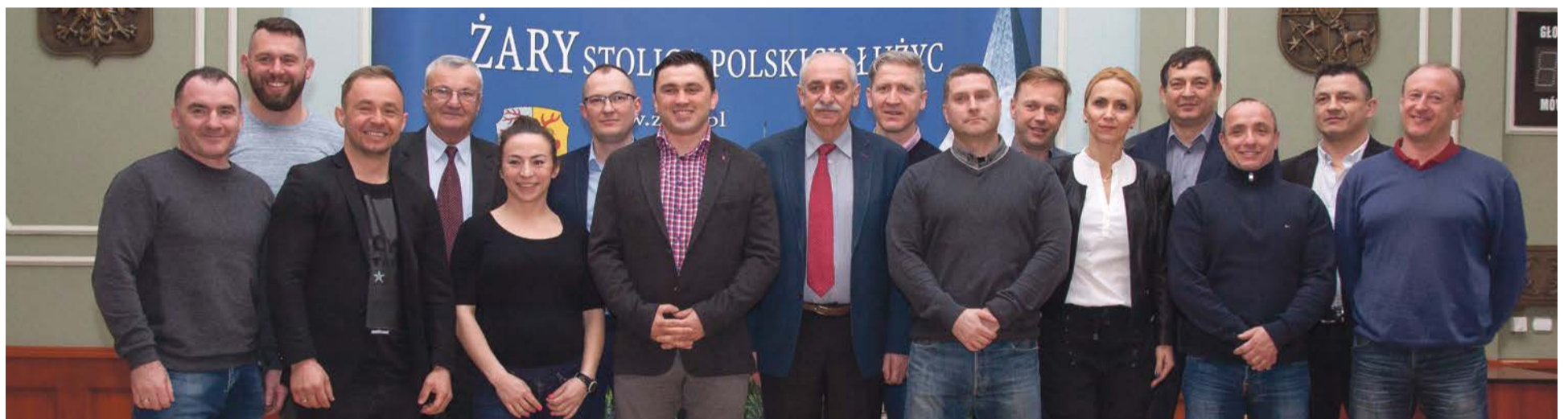
Twarze Agrosu, czyli starsze i młodsze pokolenia klubowych działaczy