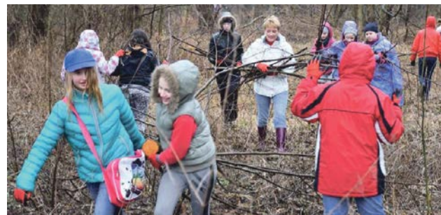
Park miejski wygląda coraz lepiej

Wydano blisko 200 par rękawiczek jednorazowych. W porządkowaniu parku, zbieraniu śmieci, usuwaniu krzaków i gałęzi oprócz