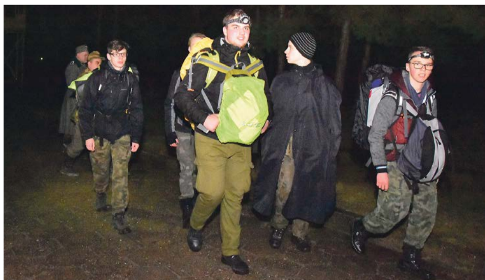
Harcerstwo to nie tylko przygoda, ale i dobra szkoła życia, połączona z edukacją