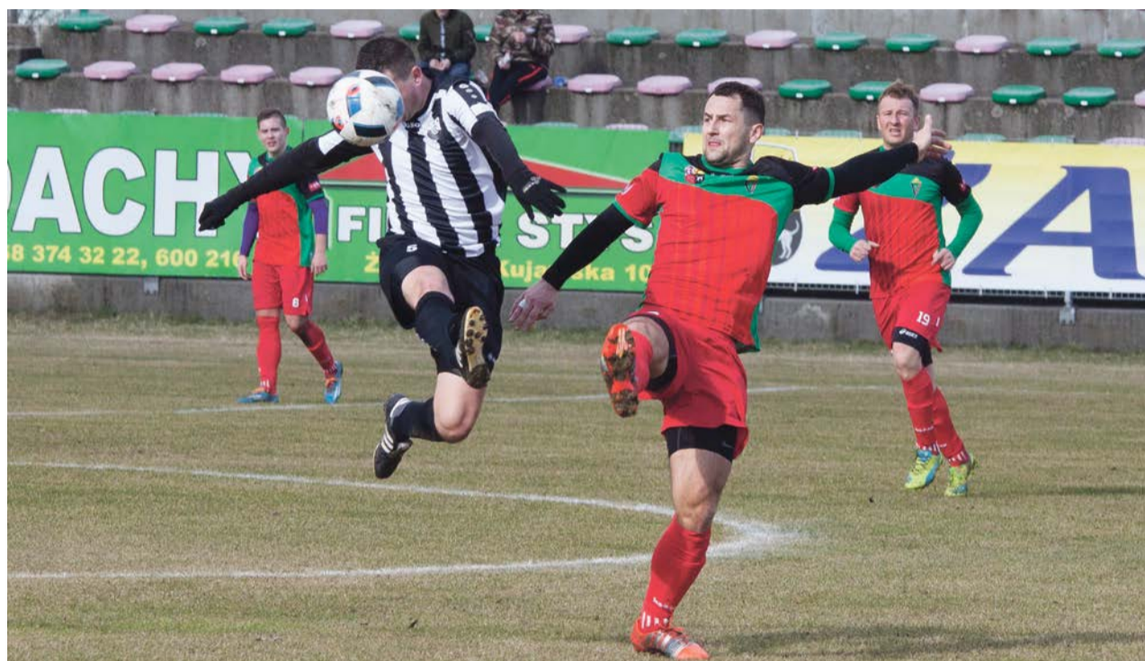
Oprócz zawodników swój mecz na boisku rozgrywał wiatr