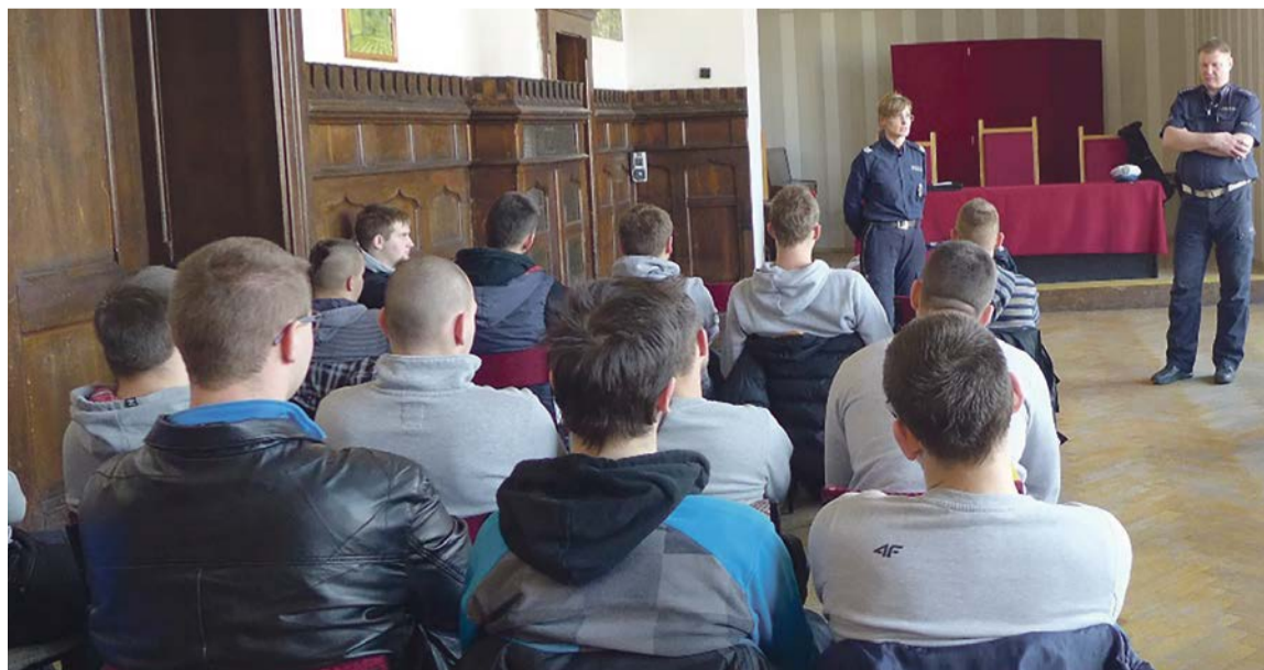
Szczegółowe informacje dotyczące przebiegu etapów rekrutacyjnych dostępne są w „Informatorze dla kandydatów” http://praca.policja.pl/pwp/rekrutacja/informator-dla-kandydatow

Podczas spotkania poruszono temat odpowiedzialności prawnej i demoralizacji wśród młodzieży, szczególnie to, jak spożywanie alkoholu, zażywanie narkotyków czy dopalaczy, rzutuje później na dalsze życie. PAS