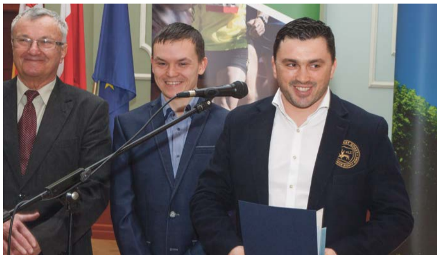
Andrzej Buczyński Damian Fedorowicz odebrał nagrodę specjalną fot. Andrzej Buczyński