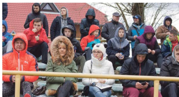
Inauguracja rundy wiosennej była raczej chłodna