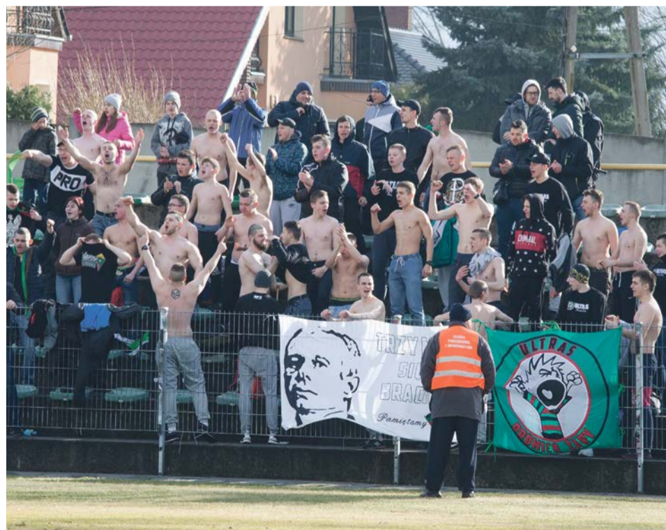
Bramka dla Promienia dosłownie rozgrzała kibiców