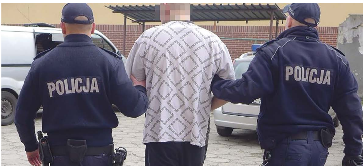
Po przeszło ośmiu miesiącach ukrywania się, złodziej został ujęty

Praca operacyjna funkcjonariuszy służby kryminalnej z Komisariatu Policji w Lubsku przyniosła efekt. W Jasieniu zatrzymany został 24-letni mieszkaniec powiatu żarskiego. Mężczyzna ukrywał się przed wymiarem sprawiedliwości od lipca ubiegłego roku. Poszukiwany był listem gończym za kradzieże. Teraz na blisko pół roku trafi do więzienia. Dodatkowo podczas zatrzymania funkcjonariusze znaleźli przy mężczyźnie narkotyki. Odpowie on więc także za ich posiadanie. PAS