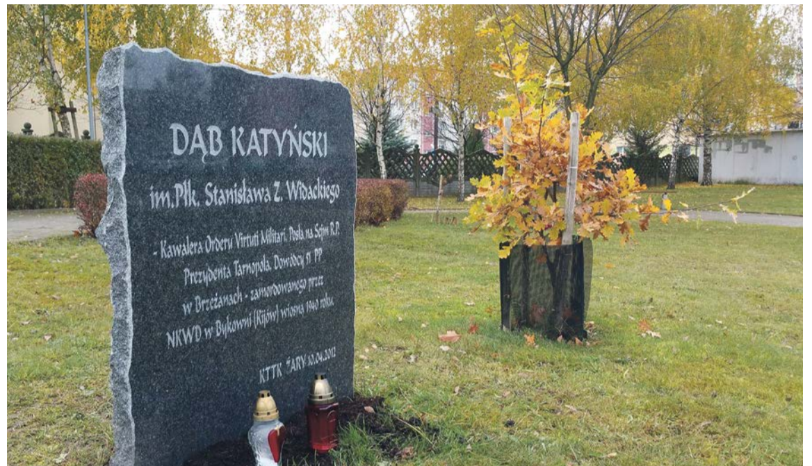
Każde drzewo powinno być posadzone w odpowiednim miejscu

leć drzewa poświęcone osobom lub upamiętniające pewne rocznice. Dąb prezydenta, dąb pamięci ofiar, dąb papieski... Inicjatorzy takich nasadzeń mają jak najbardziej szlachetne intencje i zapewne wszyscy chcieliby posadzić drzewa w jak najbardziej wyeksponowanych miejscach. W tym wypadku również warto skontaktować się z urzędnikami w gminie, którzy odpowiadają za zielen. Lokalizacja to jedno, ale może się okazać, że dąb posadzony