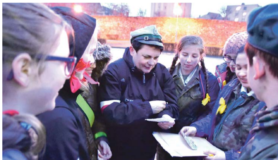
Przed nami sporo zadań. Poradzimy sobie z uśmiechem na twarzy