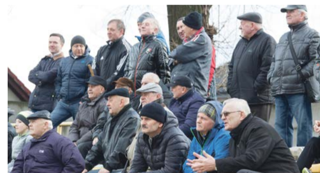
Na trybunach można spotkać osoby, które o piłce wiedzą wszystko