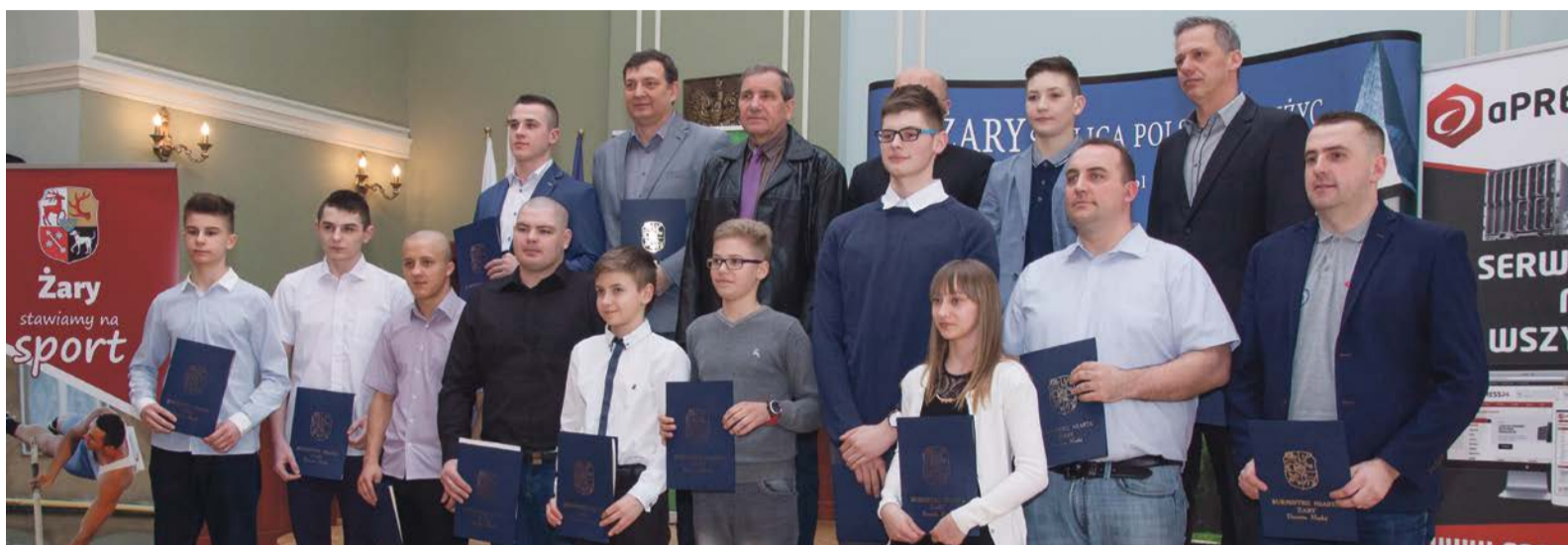
Różnią się wiekiem i dyscyplinami - łączy ich zamiłowanie do sportu

Uroczyste wręczenie nagród odbyło się w sali konferencyjnej żarskiego ratusza. Wszystkich nagrodzonych w plebiscycie, a także zdjęcia prezentujące żarskie kluby sportowe obejrzeć można na plan-szach ustawionych przed głównym wejściem do urzędu miejskiego.