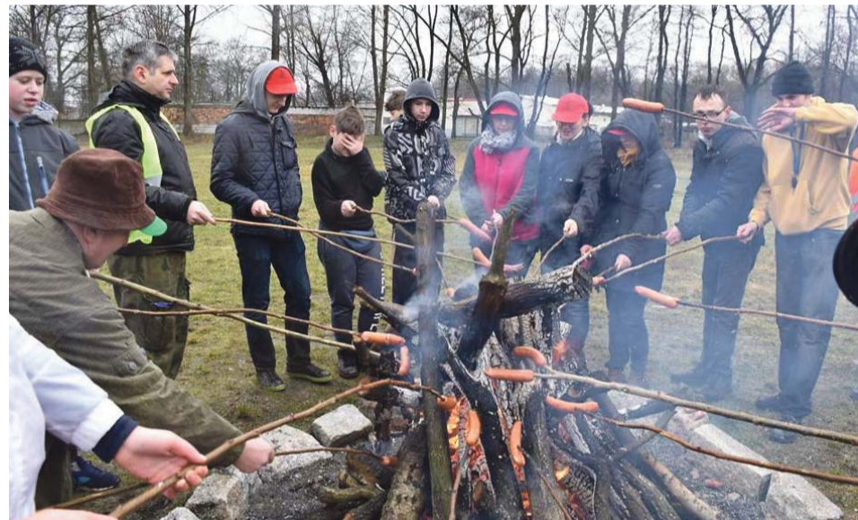
Wspólne spędzanie czasu to ważny element całej akcji

Teren przez wiele lat zaniedbany, będący niemalże wysypiskiem śmieci, dziś powoli staje się miejscem bardziej przyjaznym. Burmistrza cieszy również to, że dzięki takim akcjom udaje się wyciągnąć ludzi z domów, nie tylko po to by razem popracowali, ale przede wszystkim spędzili ze sobą czas. ATB