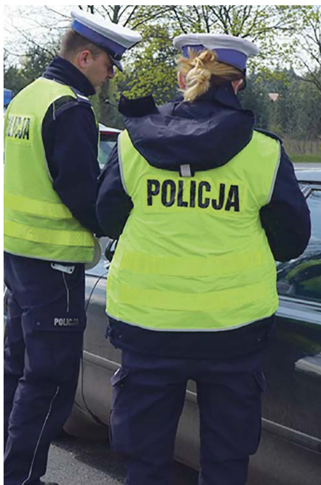
Pomimo ciągłych kontroli kolejni kierowcy przylapywani są podczas jazdy po spożyciu alkoholu lub środka odurzającego

Podczas ostatniego weekendu policjanci ruchu drogowego żarskiej komendy zatrzymali i nie dopuścili do dalszej jazdy sześciu kierujących, spośród których dwóch było pod wpływem narkotyków, jeden był nietrzeźwy, a jeden po użyciu alkoholu. Wśród kontrolowanych, aż czterech kierowców miało cofnięte uprawnienia do kierowania pojazdami.