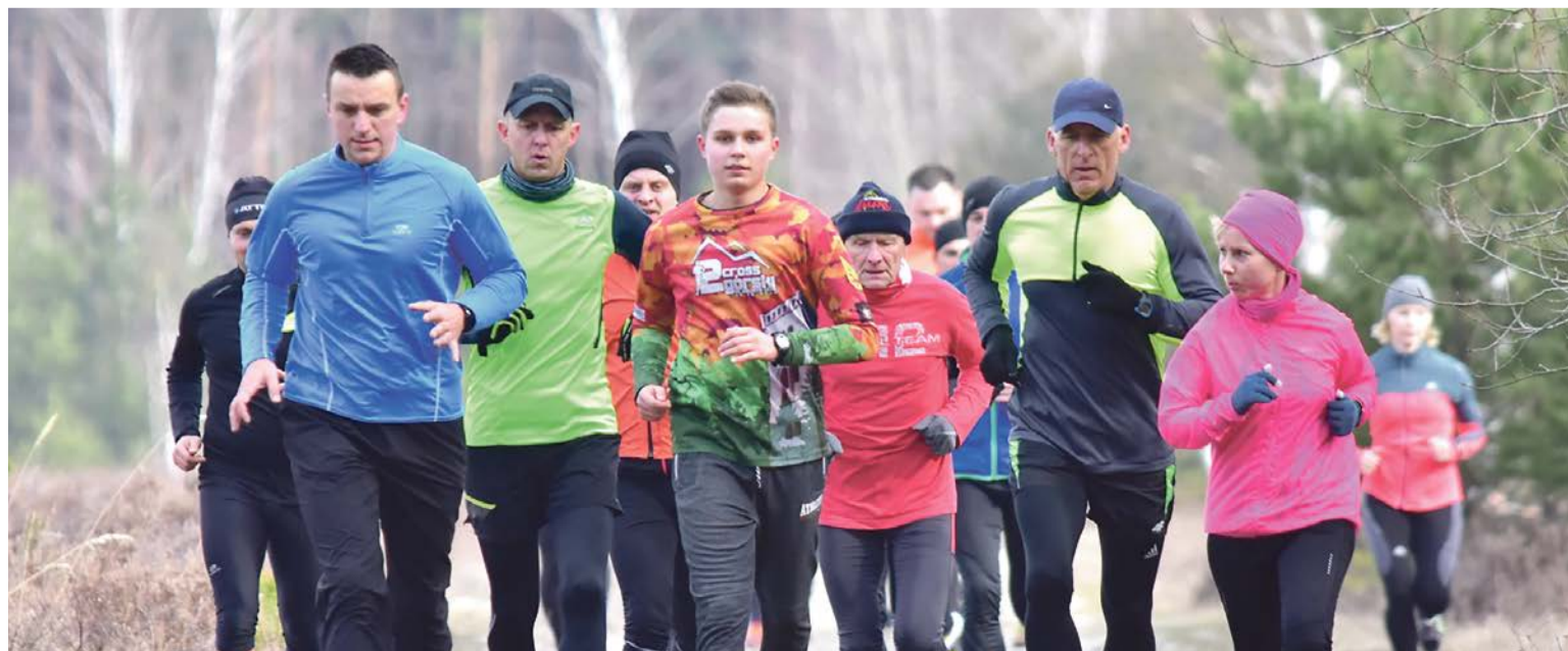
Trzeba sprawdzić formę przed oficjalnym startem

Przypomnijmy. Już w sobotę, 25 marca, ruszy 43. Cross Żagański o Puchar Wielkiej Ucieczki. W programie między innymi Bieg Sztafetowy, Bieg Dzieci i Młodzieży i najważniejszy - Bieg Główny na dziesięć kilometrów. JM