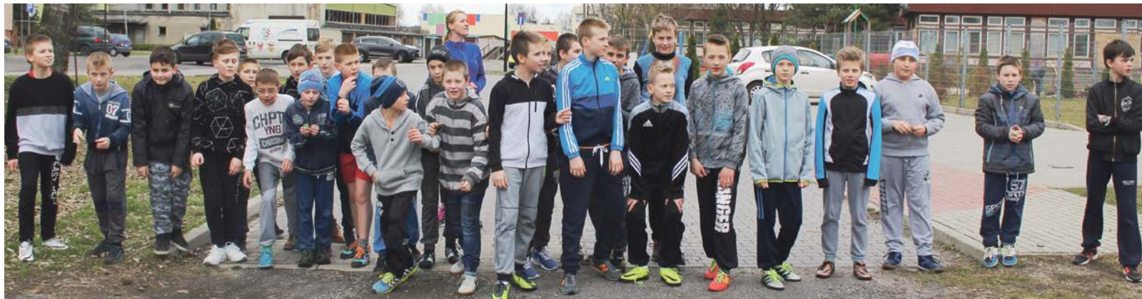
Wszystkie wyniki biegów będą zamieszczone na tablicy informacyjnej, na sali gimnastycznej