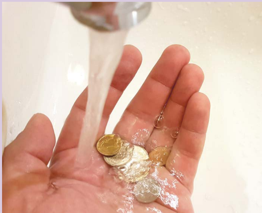
Odkręcenie kranu będzie kosztować więcej