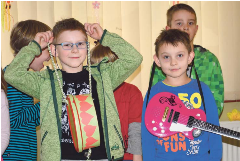
Nie ma co, ale taki zespół musi zrobić furorę