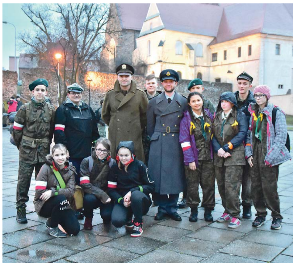
W historycznych i patriotycznych klimatach

rze podnosili swoją sprawność fizyczną i wiedzę o bohaterach Wielkiej Ucieczki. Najlepszym okazał się patrol „Szwadron” z Osiecznicy. Wszyscy uczestnicy rajdu, pomimo zmęczenia, rozstali się z nadzieją, że już w przyszłym roku spotkają się na jubileuszowym Rajdzie Wielkiej Ucieczki. JM