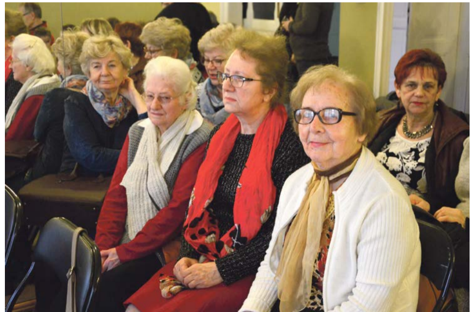
Patrzymy, słuchamy, oklaskujemy