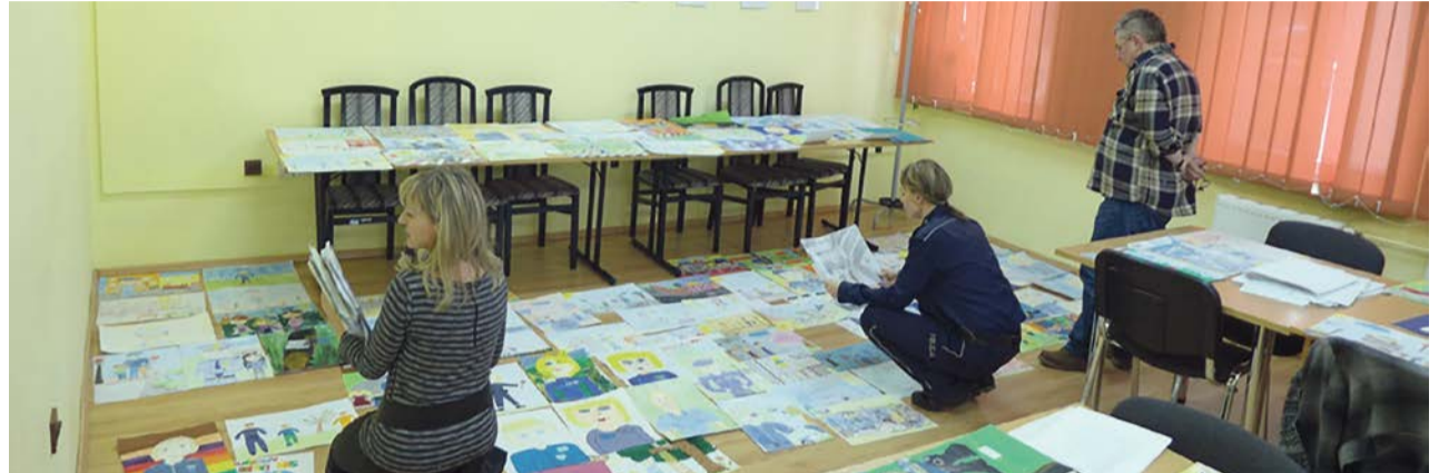
Było co oceniać. Wybór był trudny. Spośród trzystu nadesłanych prac, członkowie Komisji konkursowej mogli wybrać jedynie dziesięć

Organizatorem konkursu jest Wydział Komunikacji Społecznej KWP w Gorzowie Wlkp., a współorganizatorem Wydział Prewencji KWP w Gorzowie Wlkp. oraz Fundacja Contra Crimen. Tematem przedsięwzięcia jest wizerunek dzielnicowego, a zorganizowany został w związku z nowym programem MSWiA „Dzielnicowy bliżej nas”. Celem konkursu jest promowanie wizerunku dzielnicowego, jako przyjaznego policjanta, a także kształtowanie pozytywnego wizerunku Policji wśród dzieci, jako instytucji godnej zaufania. PAS