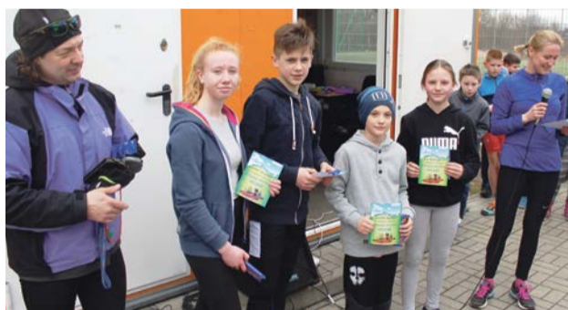
Dyplomy na pamiątkę i wafle w czekoladzie na regenerację sił. Zwycięzcy biorą wszystko

Na każdego biegacza czekał na mecie soczek, a na zwycięzców dyplomy i słodycze. Dodatkowo 20 punktowanych biegaczy otrzymuje darmową wejściówkę na basen w uzgodnionym terminie. Jest o co walczyć. PAS