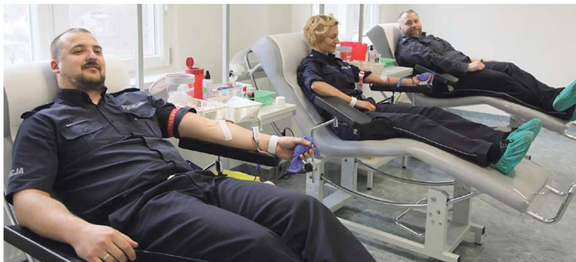
Krew jest bezcennym darem, ratującym życie i zdrowie ludzkie. To lek, którego nie można wyprodukować, a może pomóc wielu potrzebującym

Policjanci z Komendy Powiatowej w Żarach oddali już krew w Oddziale Terenowym Regionalnego Centrum Krwiodawstwa i Krwiolecznictwa przy ul. Skarbowej. PAS