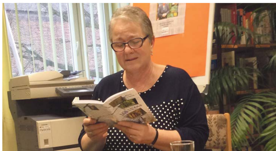
Autorka osobiście czytała swoje wiersze

Podczas spotkania nie brakowało wątków humorystycznych i sytuacyjnych. Uczestnicy mieli też okazję nabyć wiersze poetki wraz z autografem. PAS