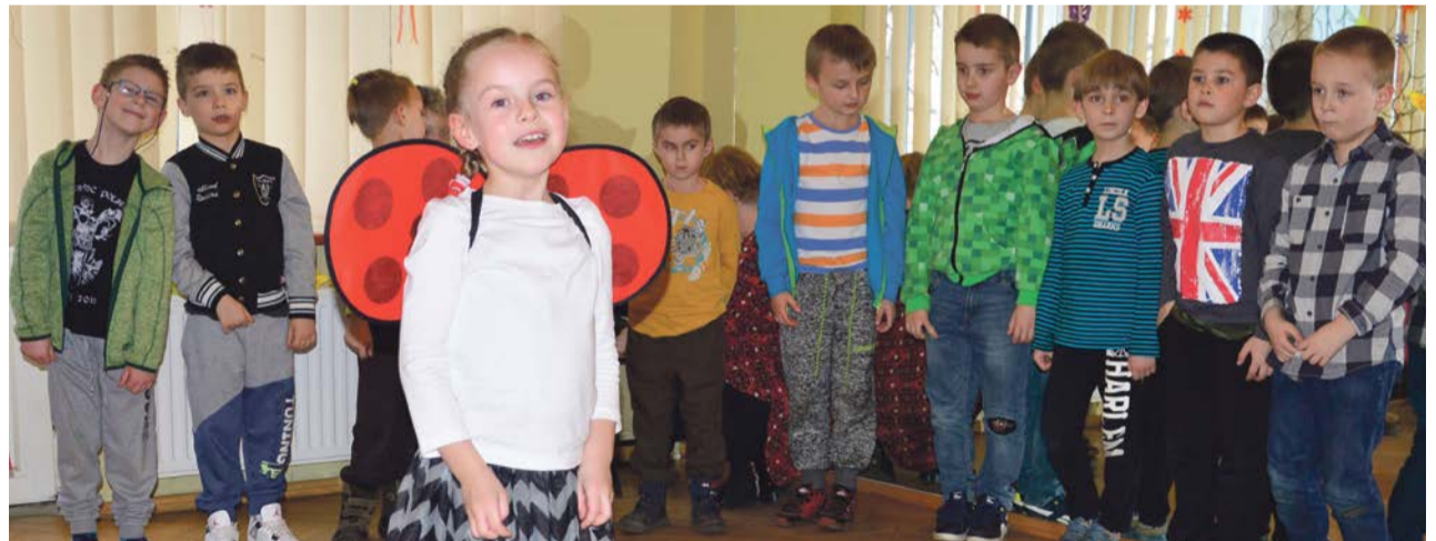
Występ połączony z odpowiednią kreacją musi się spodobać

Występy wywołały niejedną uśmiech i gromkie oklaski widzów. Nie mogło zabraknąć słodkiego poczęstunku. PAS