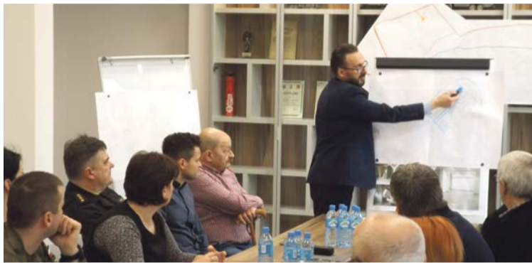
Na posiedzeniu Powiatowego Zespołu Zarządzania Kryzysowego uczestnicy uzgodnili plan działań w sprawie rozwiązania problemu pożarzyska w Brożku

Problemem mogą być niewybuchy. W Brożku funkcjonowała fabryka amunicji, stąd obawy. W przypadku odkrycia niewybuchów będzie musiał wkroczyć patrol saperów. To spowolni prace. Piasek można by dowozić i wówczas uniknąć ewentualnego niebezpieczeństwa, związanego z niewybuchami. To jednak kosztuje, a piasek jest przecież na miejscu.