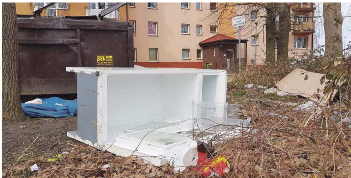
Stare lodówki czy inne odpady porzucone przy osiedlowych śmietnikach sprawiają, że okoliczni mieszkańcy muszą żyć prawie jak na wysypisku

Druga sprawa to podrzucanie śmieci. Nic prostszego - mogłoby się wydawać - jak tylko pod osłoną nocy pojechać na dowolne osiedle i wywalić tam starą lodówkę. Bo oczywiście na osiedlu domków jednorodzinnych nikt tego nie zrobi. Osiedla stały się wysypiskami dla kombinatorów. A jest prostsze rozwiązanie, tylko