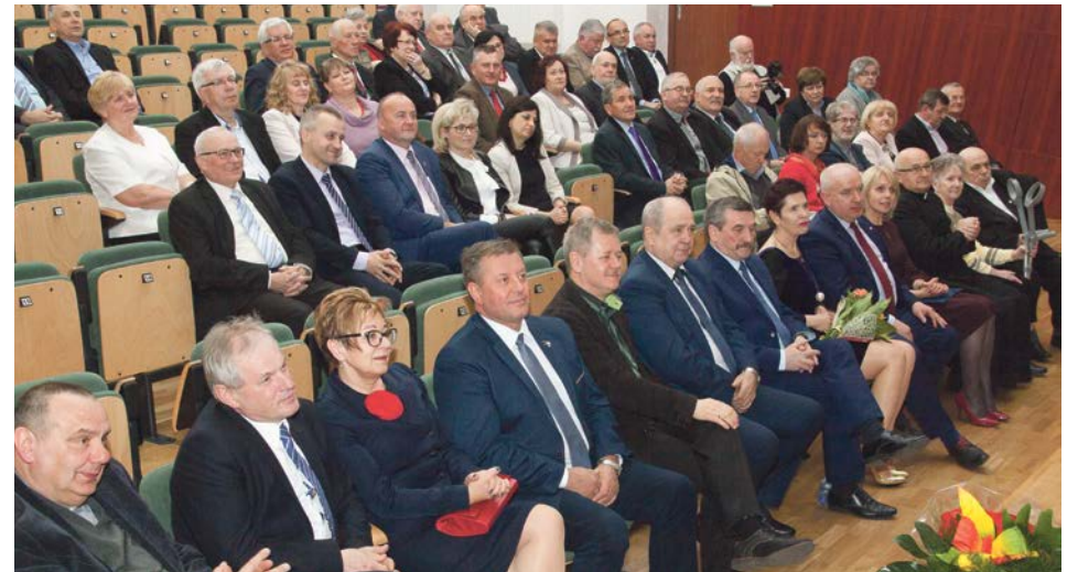
Założyciele, członkowie, sympatycy Forum Samorządowego, a także zaproszeni goście wspominali historię samorządności lokalnej

Na kolejnym spotkaniu w listopadzie, już w szerszym gronie, rozmawiano o formie organiza-