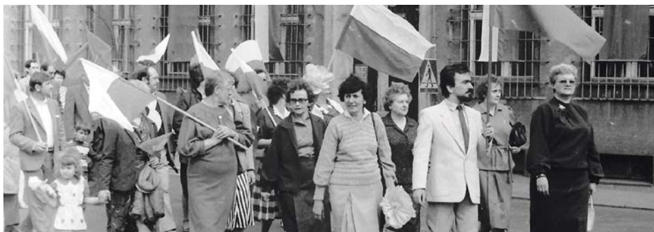
Z czerwoną szturmówką w dłoni, ale też i z polskimi flagami narodowymi