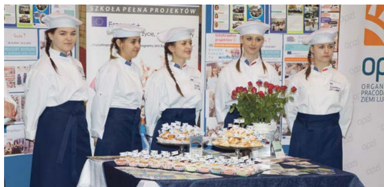
Kolorowo i kulinarnie na stoisku Zespołu Szkół Technicznych z Lubska