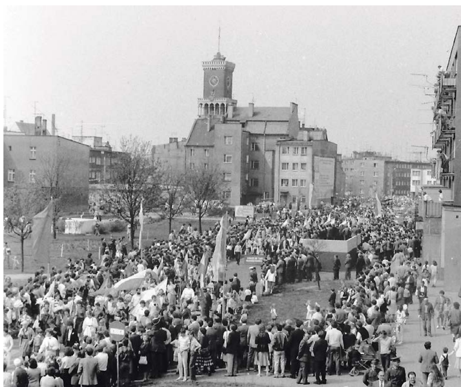
Pełna trybuna w centrum miasta, tłumy na pochodzie