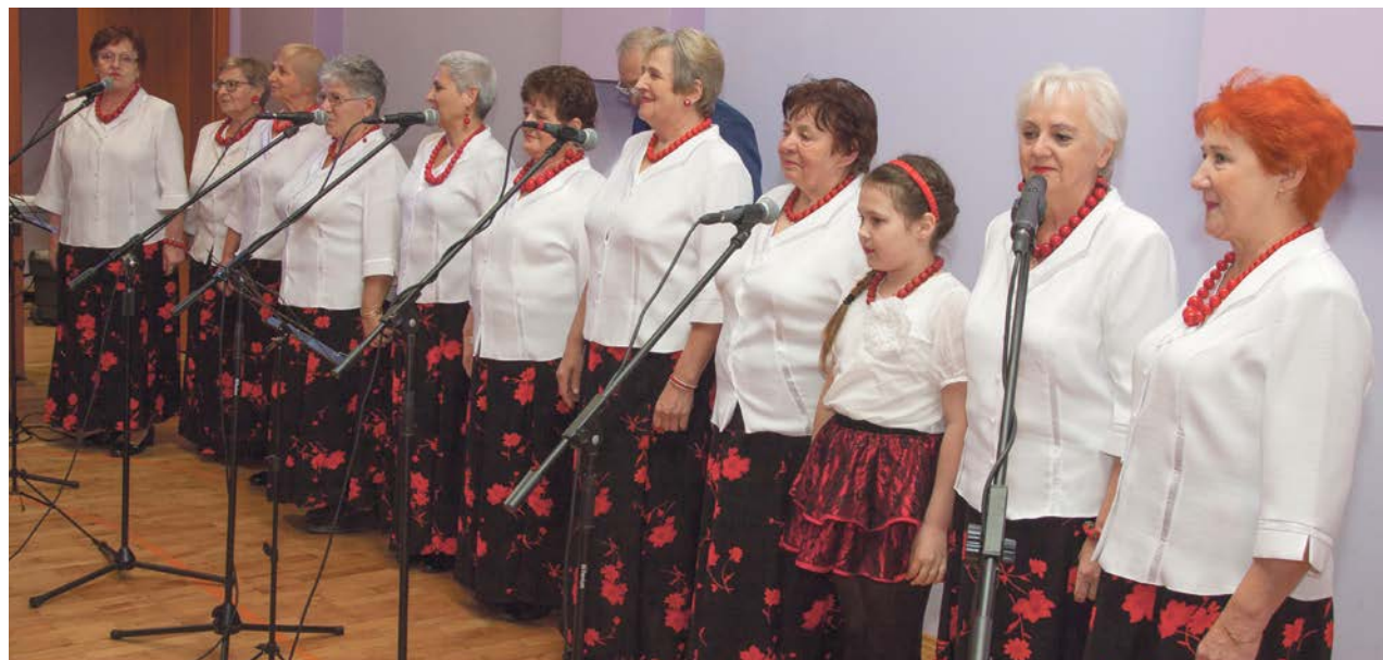
Warsztat i obycie ze sceną. To widać i słychać