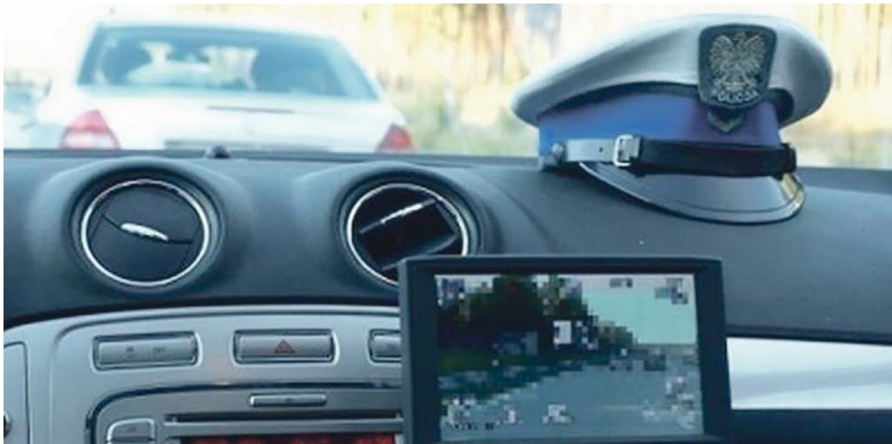
Kontrole i kary na nic się nie zdają. Nieodpowiedzialni kierowcy ciągle zagrażają zdrowiu i życiu innych

Za kierowanie w stanie nietrzeźwości grozi utrata prawa jazdy, grzywna i do dwóch lat pozbawienia wolności. PAS