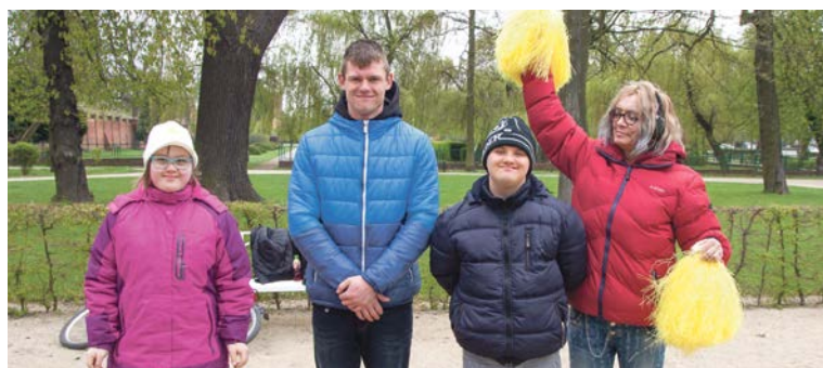
Reprezentacja Zespołu Szkół Specjalnych