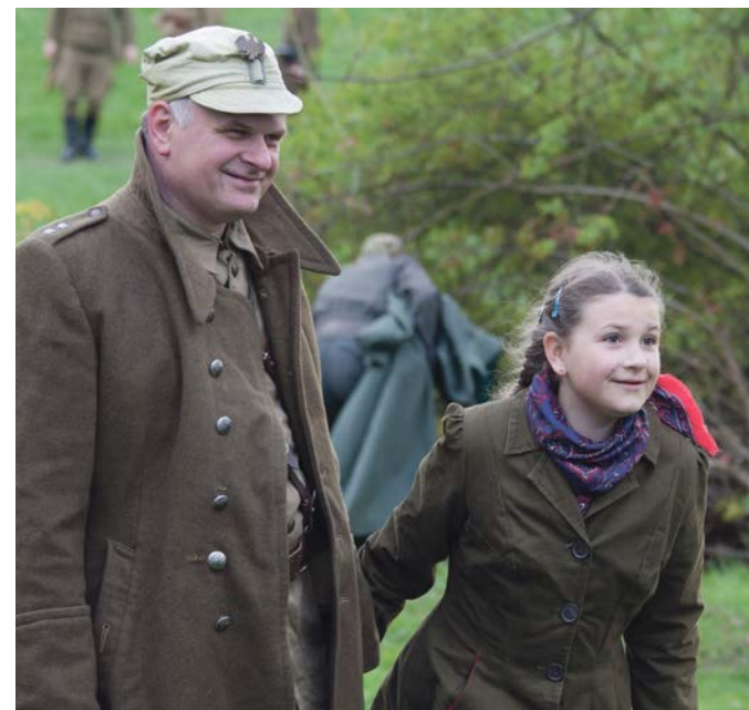
Dwa pokolenia we wspomnieniach