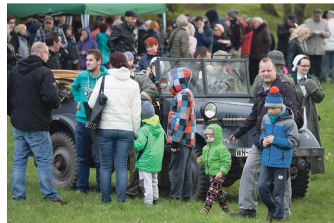
Sprzęt z czasów wojny to niecodzienny widok