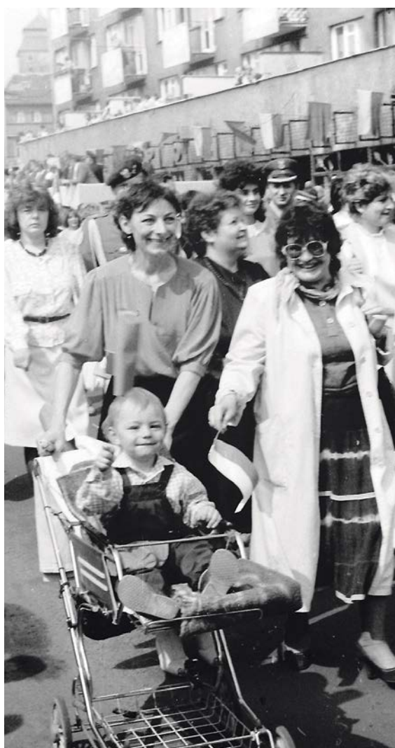
Dzień wolny od pracy. Przy ładnej pogodzie można więc udział w pochodzie potraktować jako spacer dla zdrowia

W maju 1987 roku ulice miasta przybrały odświętny wystrój. Wszyscy zgromadzili się na płycie stadionu przy ul. Kochanowskiego. Barwny pochód z powiewającymi biało - czerwonymi flagami przemaszerował ulicami miasta na starówkę, gdzie przy ul. Brackiej była postawiona trybuna. Choć radość majowego święta była wymuszona, to dzisiaj wracamy z sentymentem do tych dni. W końcu, czy tego chcemy czy nie, czy nam się to podoba czy nie, to jest to nasza historia i nasze życie. JM