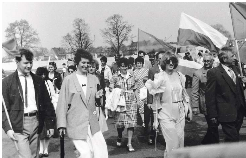
Pochód łączył różne środowiska zawodowe. Pomimo presji na udział w pochodzie ze strony lokalnych władz oraz szefów zakładów pracy, placówek oświaty i kultury, ludzie w 1987 r. zupełnie inaczej postrzegali rzeczywistość, niż jeszcze dziesięć lat wstecz