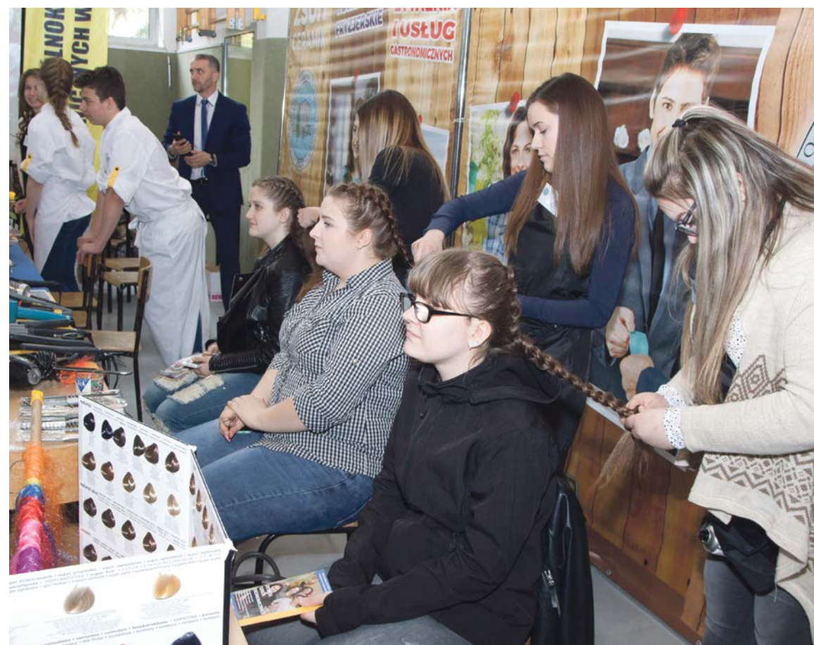
Swoje umiejętności prezentowały uczennice Zespołu Szkół Ogólnokształcących i Technicznych