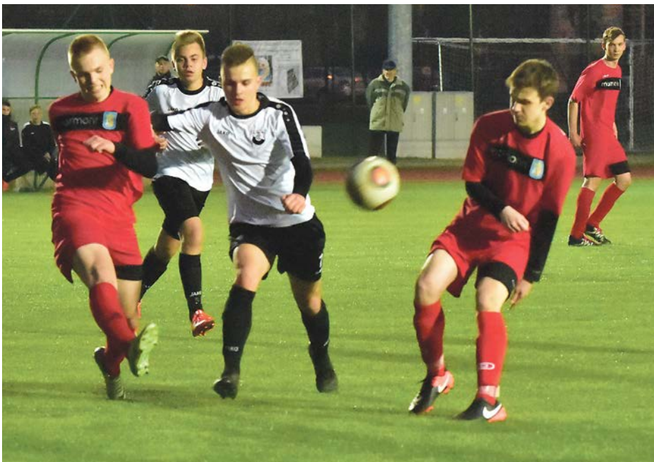
Walka o każdą piłkę i sportowa zaciętość dały Czarnym wygraną