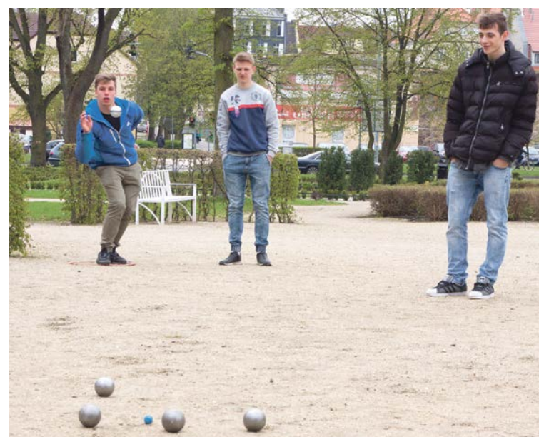
Parkowe alejki są dobrym miejscem do gry w bule

- Chciałbym, żeby tam postawiono tablice rysunkowe z informacją, jak w to grać - mówi Przemysław Kaźmierski. - W innych miastach są takie tablice przy bulodromach, a dzięki temu bardzo szybko można zapoznać się