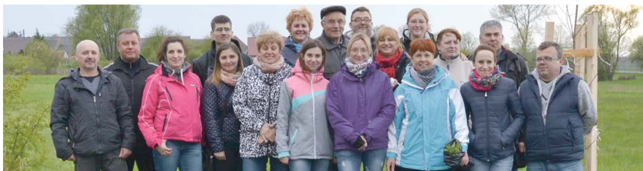
Nowe drzewa posadzono we Włostowie