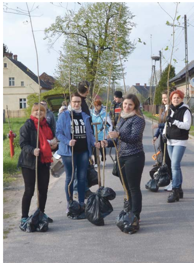
Młode klony zastąpiły wycięte lipy