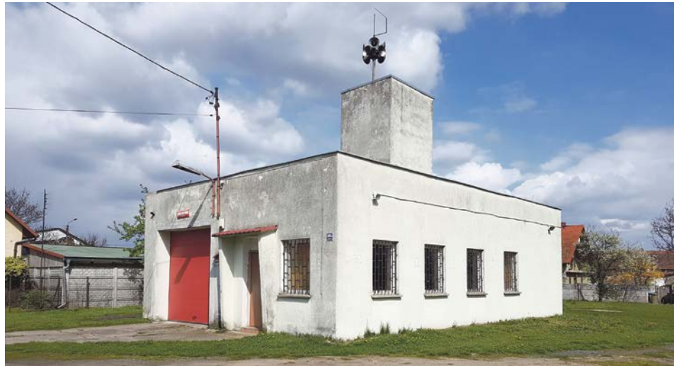
W obecnej remizie nawet wóz strażacki ledwo się mieści

Nie można budować na działce rolnej III klasy. Jednak to co jest w papierach, niekoniecznie ma odzwierciedlenie w rzeczywistości i takie sprawy należy zaktualizować. Na tym gruncie jest boisko, plac zabaw, nie ma żadnej produkcji rolnej. 5 września ubiegłego roku burmistrz Lubaska poinformował starostę o możliwości przeprowadzenia prac kwalifikacyjnych gruntu przez jednego z najbardziej doświadczonych fachowców w województwie. Po przeszło miesiącu starosta wydał upoważnienie do tych prac, w międzyczasie starając się podważyć kompetencje fa-