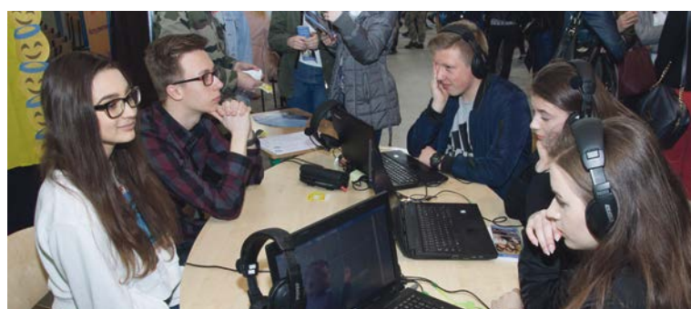
Katolickie liceum zachęcało multimedialnie