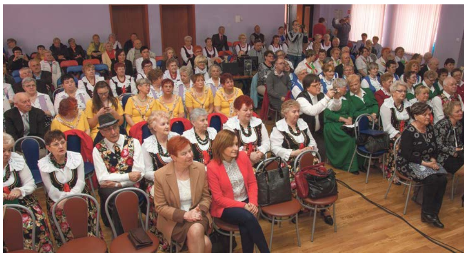
Było dużo oklasków i wspólne śpiewanie