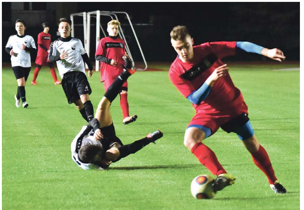
Zawodnicy dali z siebie „wszystko”