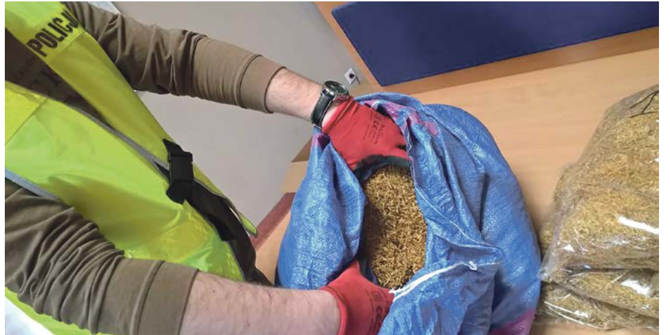
Przeszukanie domu dało efekt. Podejrzenia okazały się słuszne

- Kobieta odpowie przed sądem za przestępstwo karne skarbowe. Za przestępstwo posiadania wyrobów tytoniowych bez polskich znaków akcyzy grozi wysoka kara grzywny - informuje Sylwia Woroniec, oficer prasowy KPP w Żaganiu. PAS