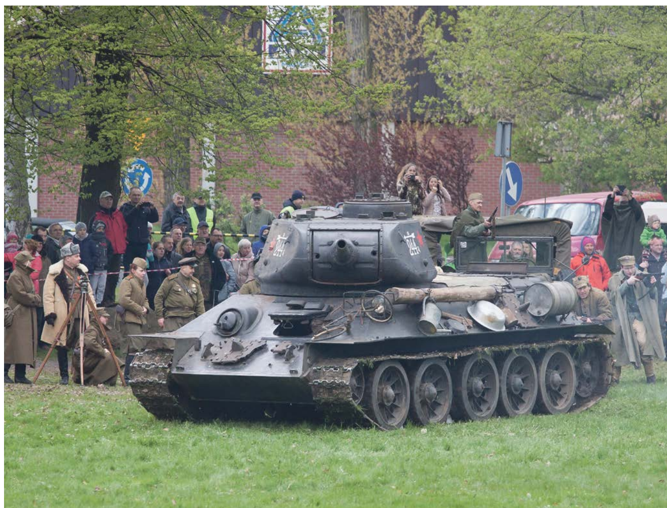
Serialowego „Rudego” każdy zna