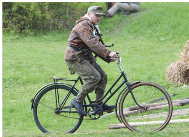
Lepiej tak, niż maszerować