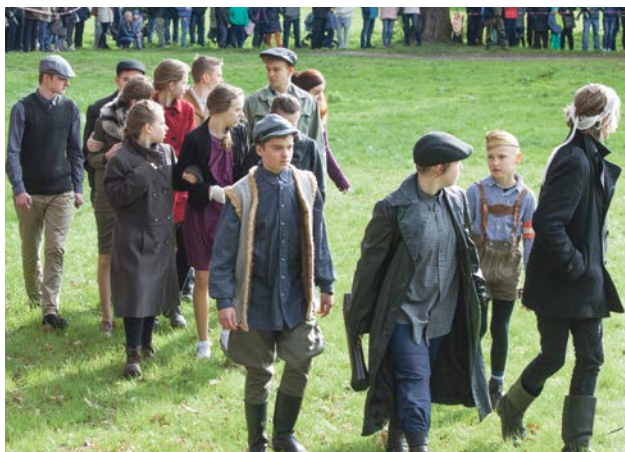
Niemieccy cywile uciekali w pośpiechu