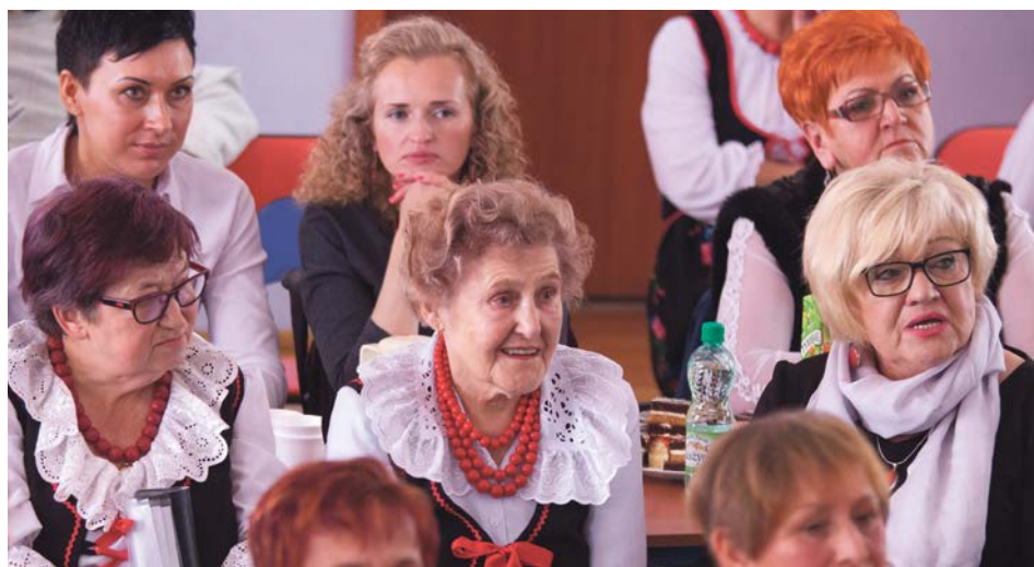
Muzyka jest pasją tak młodych, jak i seniorów