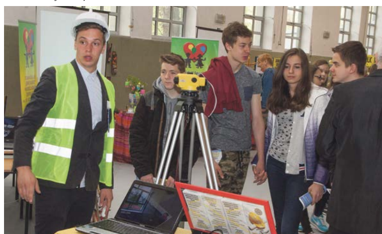
Nie ma wątpliwości, że to stoisko „Budowlanki”