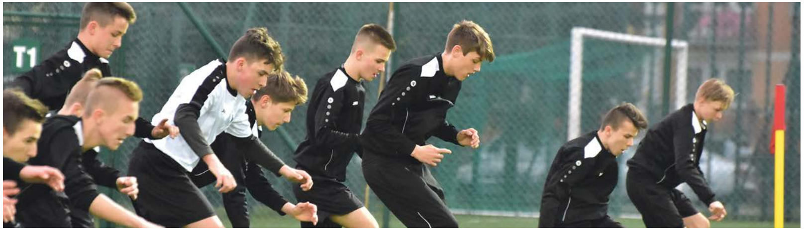
Dobra rozgrzewka i koncentracja pozwalają dobrze wejść w mecz

Mecz odbył się w ramach I Ligi Wojewódzkiej. Na stadionie żagańskiej Areny juniorzy nie dali szans swoim przeciwnikom. Pokonali wschowski team 5:1. Bramki dla gospodarzy zdobyli: Leszek Jagodziński-2, Oliwier Pytel, Tomek Jakubas i Marek Maciołek. PAS