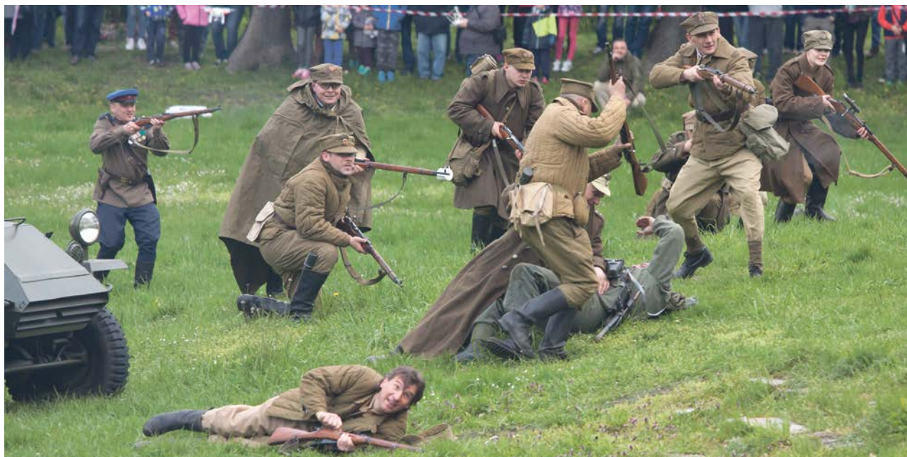
Polskie wojska na szlaku bojowym w kierunku Berlina