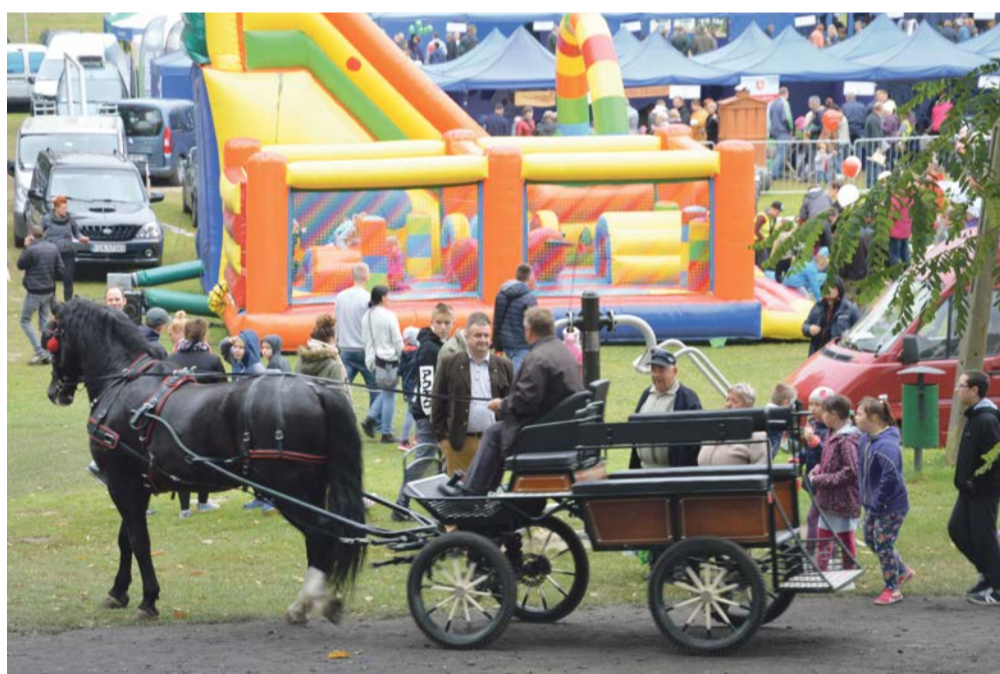
Impreza miała duży rozmach