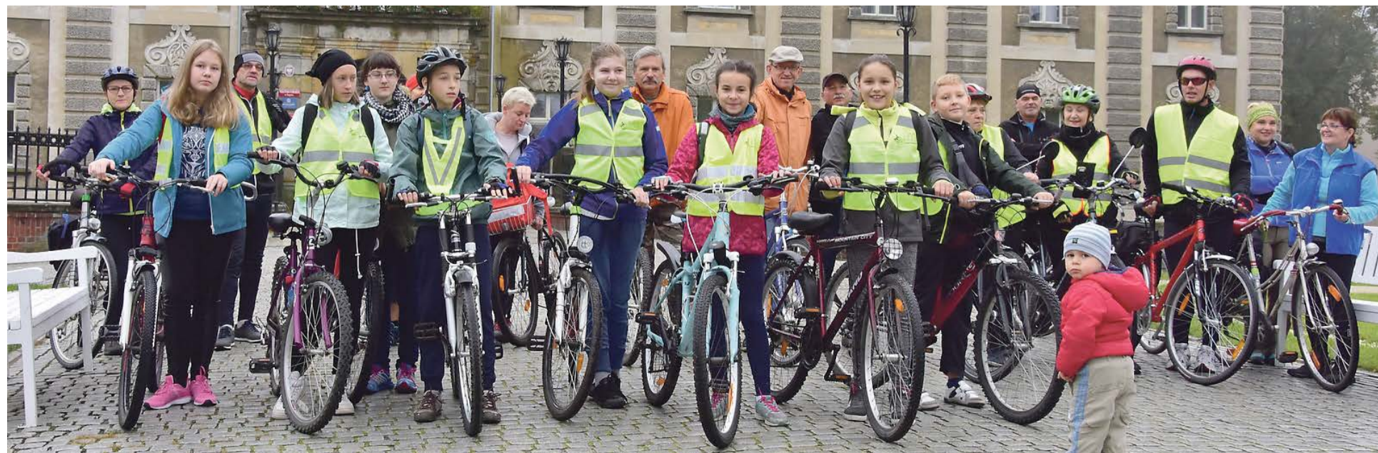
Okolicznościowa wycieczka przyciągnęła sporą grupę miłośników dwóch kółek