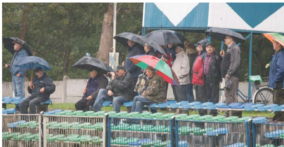
Niezależnie od pogody kibice przyjdą na mecz swojej drużyny