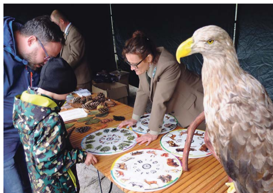
Konkursy, warsztaty, stoiska edukacyjne