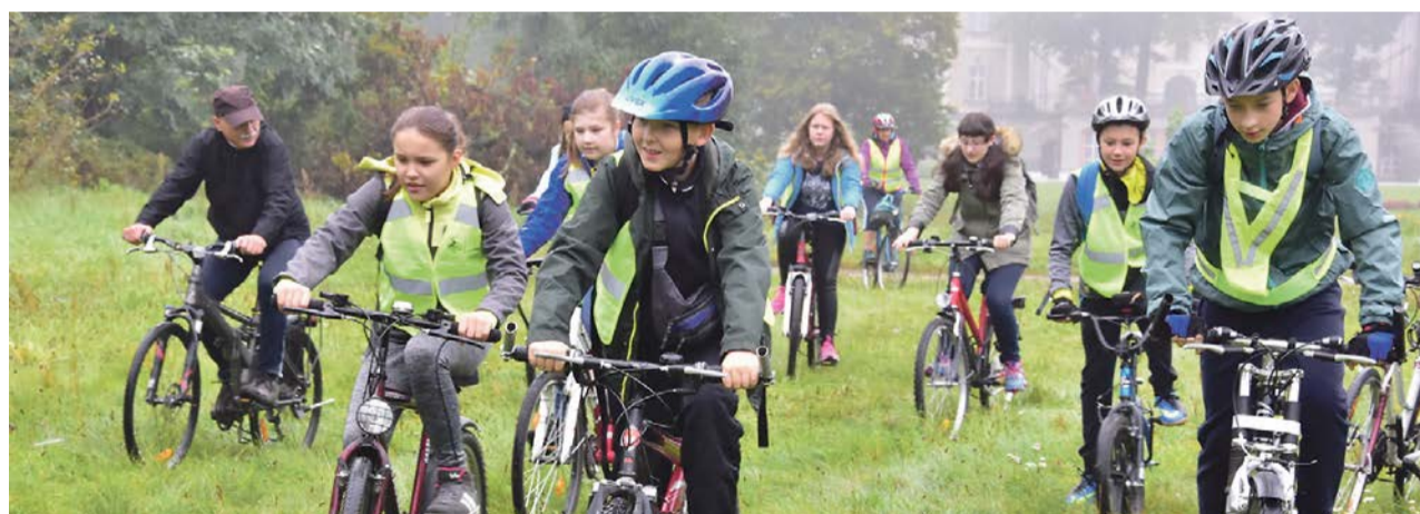
Teraz jedziemy, biesiadować będziemy później

Dla uczestników przygotowano zawody turystyczno-sprawnościowe i konkursy krajoznawcze. Uroczystości zakończyły się wspólnym ogniskiem z poczęstunkiem. JM