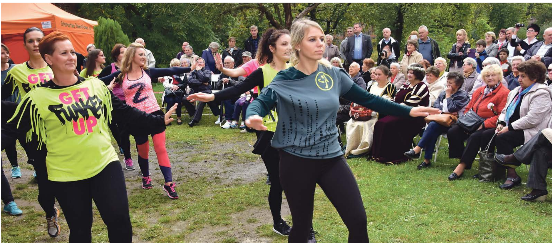
Zumba jest dobra na wszystko