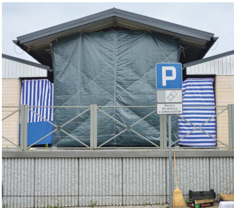
Handlujący robią, co mogą, żeby uchronić się przed wiatrem, deszczem i słońcem

Handlujący na targowisku robią co mogą, żeby uchronić się przed skutkami warunków atmosferycznych. Wiejące od zachodu wiatry i zacinający deszcz utrudniają im handel. Winą ma być fatalny projekt odremontowanego targowiska - brak jakichkolwiek osłon i za krótkie dachy. Wieszają więc plandeki, które osłaniają zarówno towar jak i ich samych oraz klientów nie tylko przed wiatrem i deszczem, ale też przed słońcem.