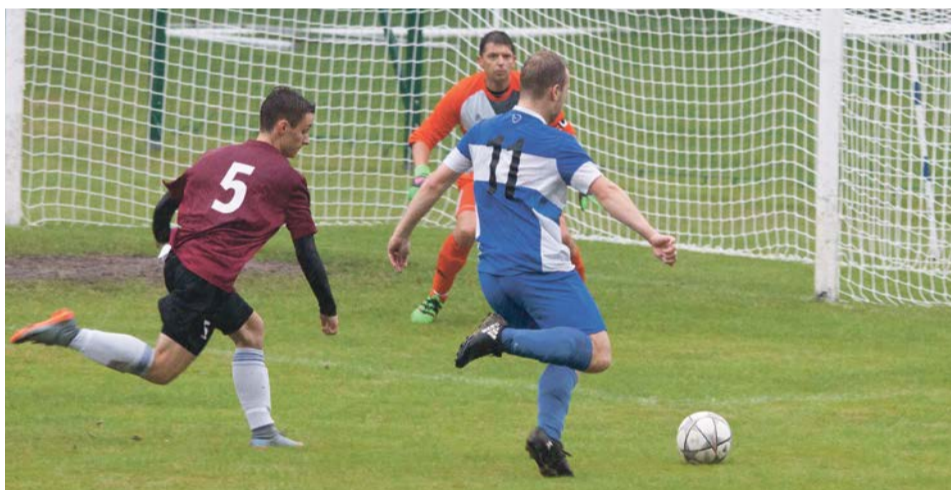
Stal Jasień prowadziła przez całe spotkanie