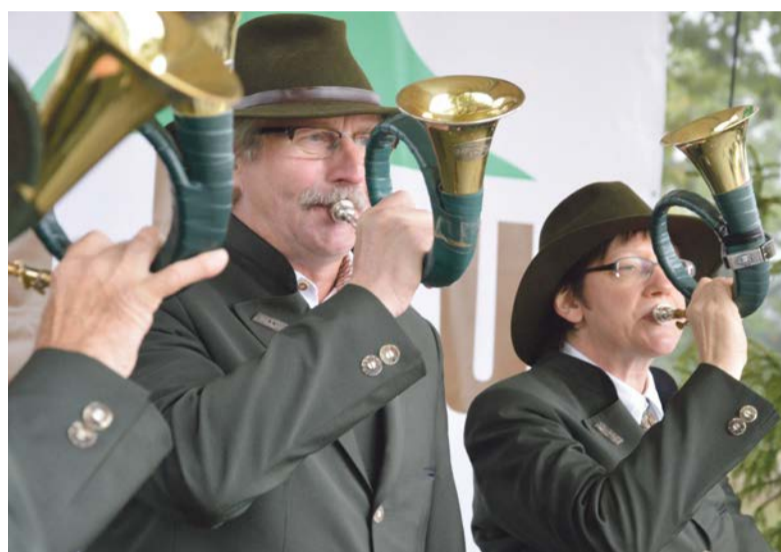
Sygnaliści na start