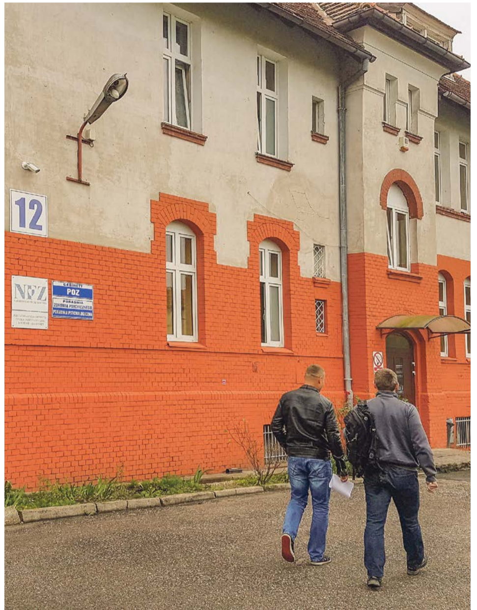
Jak do tej pory, nocna i świąteczna opieka medyczna będzie świadczona w budynku nr 12 w 105 Szpitalu w Żarach