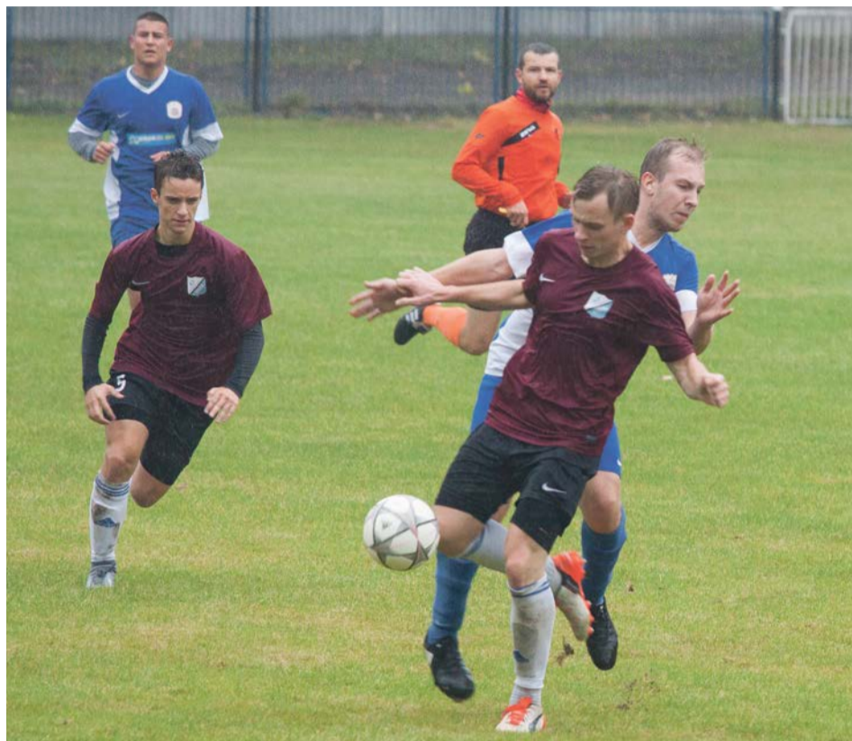
Padający deszcz nie pomagał zawodnikom

WYNIKI 8. KOLEJKI: KORONA WSCHOWA 1:4 ZORZA OCHLA BŁĘKITNI OŁOBOK 0:3 AMATOR BOBROWNIKI SCHNUG CHOCIULE 0:5 CARINA GUBIN PIAST CZERWIEŃSK 0:2 PIAST IŁOWA UNIA KUNICE ŻARY 3:3 STAL JASIEŃ ZRYW RZECZYCA 1:4 PROMIEŃ ŻARY UKS „CZARNI” ŻAGAŃ 2:2 Odra NIETKÓW MIESZKO KONOTOP 5:2 DELTA SIENIAWA ŻARSKA