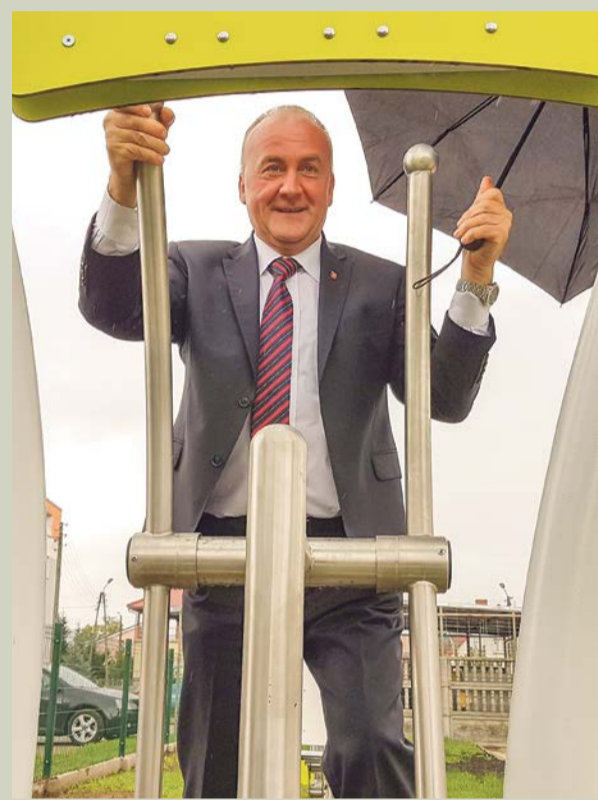
Burmistrz sam najpierw sprawdził wszystkie urządzenia do ćwiczeń

Zaczynamy inwestować, można powiedzieć, że po dwóch latach „posuchy”. Patrzymy do przodu. Ale nie tylko na place zabaw. Jest projekt sześćdziesięciu przydomowych oczyszczalni. Jest dwuetapowość kanalizacji miasta. Zrobiony wodociąg w Lipsku Żarskim - to była ostatnia wieś, która nie