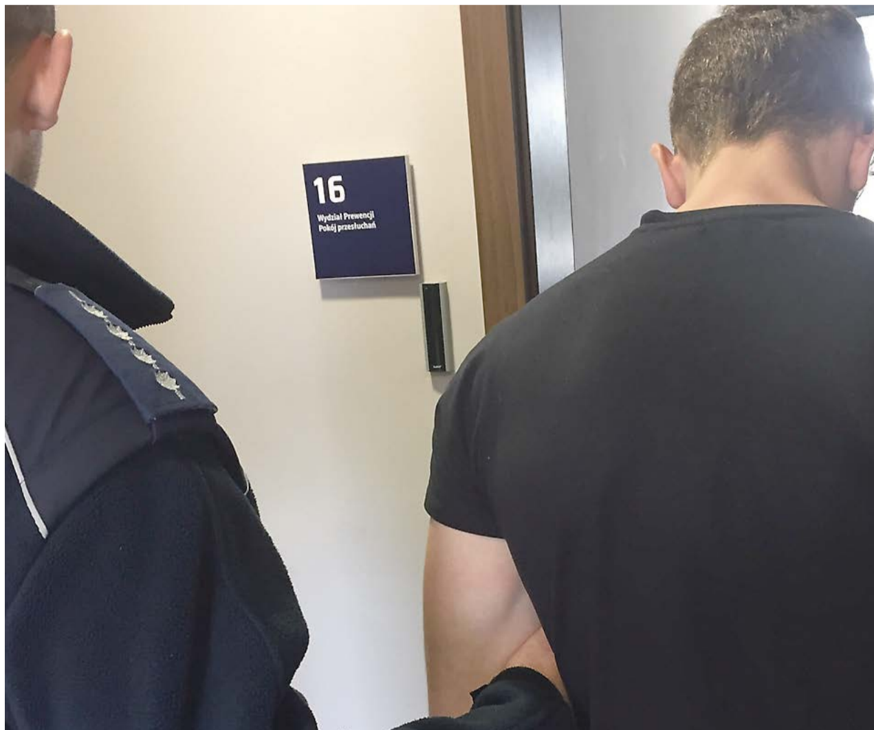
Napastnicy trafili do aresztu. Grozi im surowy wyrok

Dyżurny jednostki policji w Międzyrzeczu otrzymał zgłoszenie o pobiciu. Na miejscu policjanci ustalili, że dwóch mężczyzn siłą wtargnęło do domu. Doszło do krótkiej kłótni z domownikami po czym napastnicy zaatakowali ich gazem łzawiącym, a później maczetami. W momencie, kiedy jednemu z pokrzywdzonych udało się uciec z domu i powiadomić służby ratunkowe, napastnicy uciekli. W efekcie jeden z pokrzywdzonych mężczyzna doznał licznych niegroź-