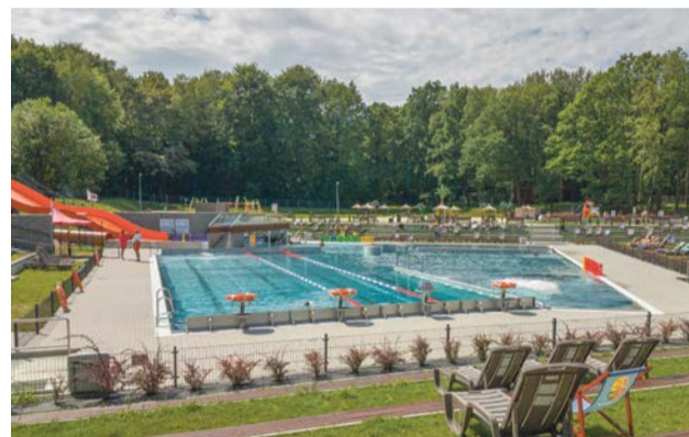
Nagrodę zdobył żarski basen wraz ze wszystkimi dodatkowymi atrakcjami

dynego w swoim rodzaju miejsca wypoczynku i rekreacji. Projekt zapoczątkowany jeszcze w ubiegłej kadencji samorządu, został niedawno rozbudowany o plac zabaw, wiatę z grillem, boisko do siatkówki. Zmodernizowano drogę dojazdową, powstały miejsca parkingowe. Ale to nie koniec, bo władze miasta mają pomysły na kolejne atrakcje.