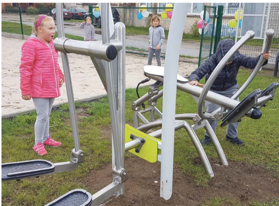
Dzieci z zainteresowaniem przyglądały się urządzeniom zamontowanym na nowym placu zabaw