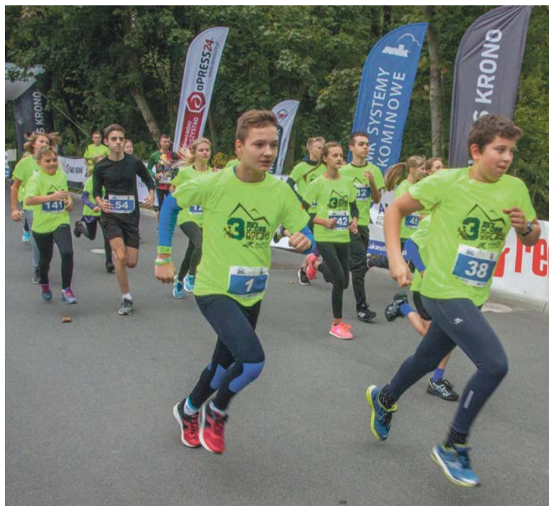
Młodzi też biegali

Kolejna impreza - czwarta Dycha po Żarach zaplanowana jest na drugą połowę kwietnia, a z zapisami ruszymy pewnie już w styczniu.