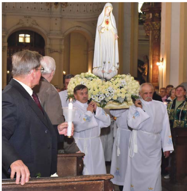
Figura peregrynuje po różnych krajach

Po uroczystym powitaniu i wprowadzeniu figury do świątyni, wierni uczestniczyli w modlitwie różańcowej i liturgii mszy św. Zwieńczeniem uroczystości była procesja fatimska i całonocna adoracja figury. Jubileuszową peregrynację figury prowadzi Międzynarodowe Przymierze Świętej Rodziny. Do tej pory figura była między innymi w Rosji, Anglii i Austrii. JM