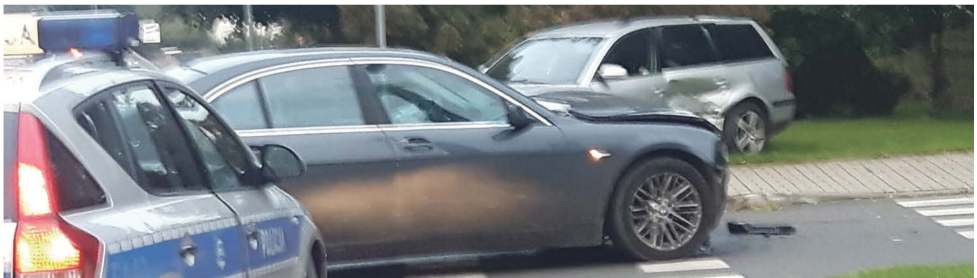
Skrzyżowanie ul. Kujawskiej i Tatrzańskiej jest jednym z najbardziej niebezpiecznych w mieście