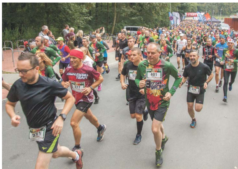
Setki biegaczy na starcie crossu