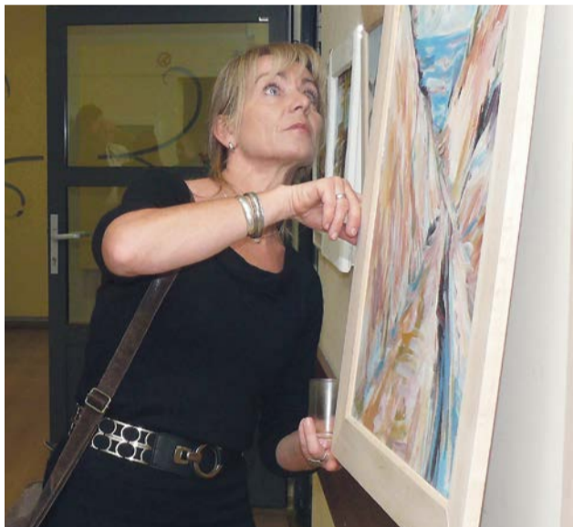
Z drugiej strony jednak niczego nie ma