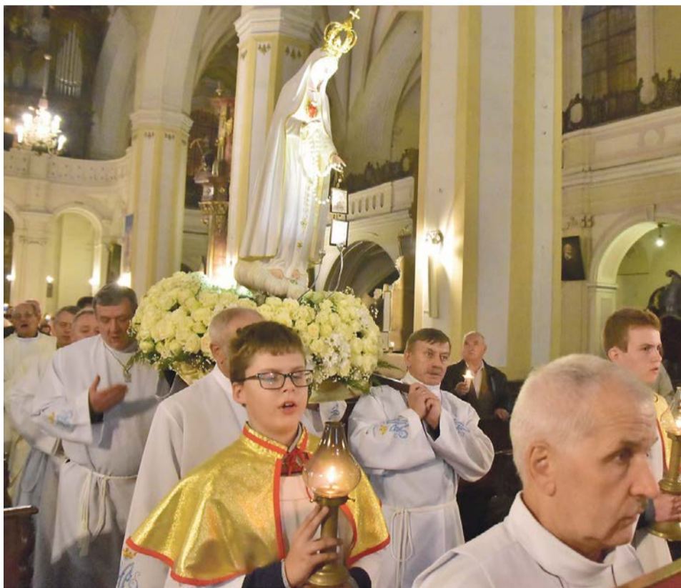
Wierni mieli możliwość uczestniczenia w wyjątkowej uroczystości religijnej