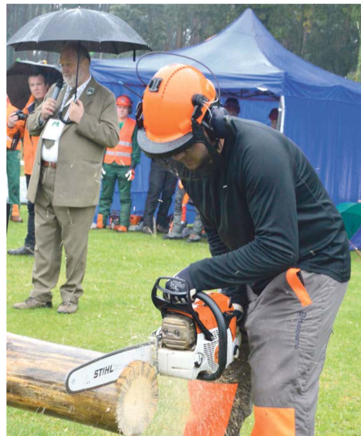
Jak Święto Lasu, to drwale muszą być