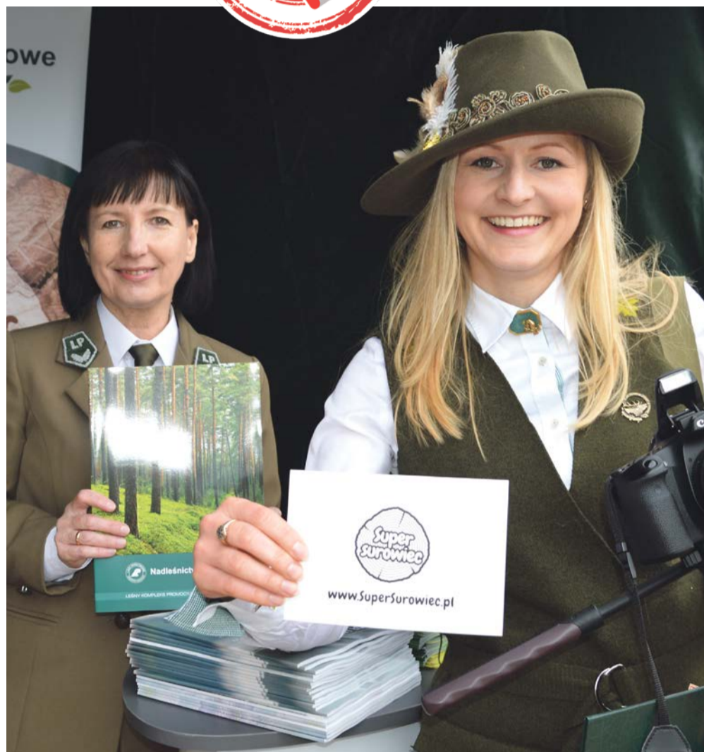
Regionalna Dyrekcja Lasów Państwowych w Zielonej Górze miała piękną reprezentację