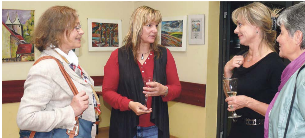
W miłej atmosferze to i miło pogawędzić