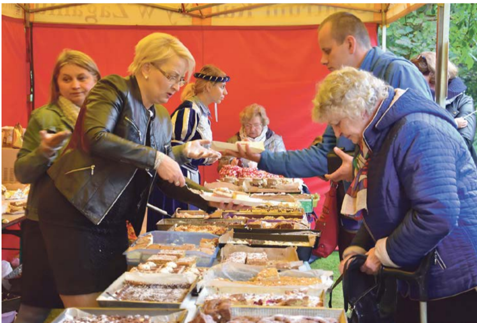
Przepyszne ciasta. Nic tylko korzystać