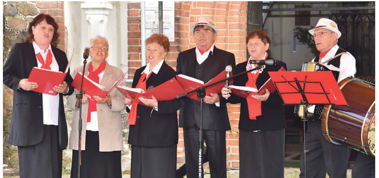
Nie ma festynu bez dobrej muzyki