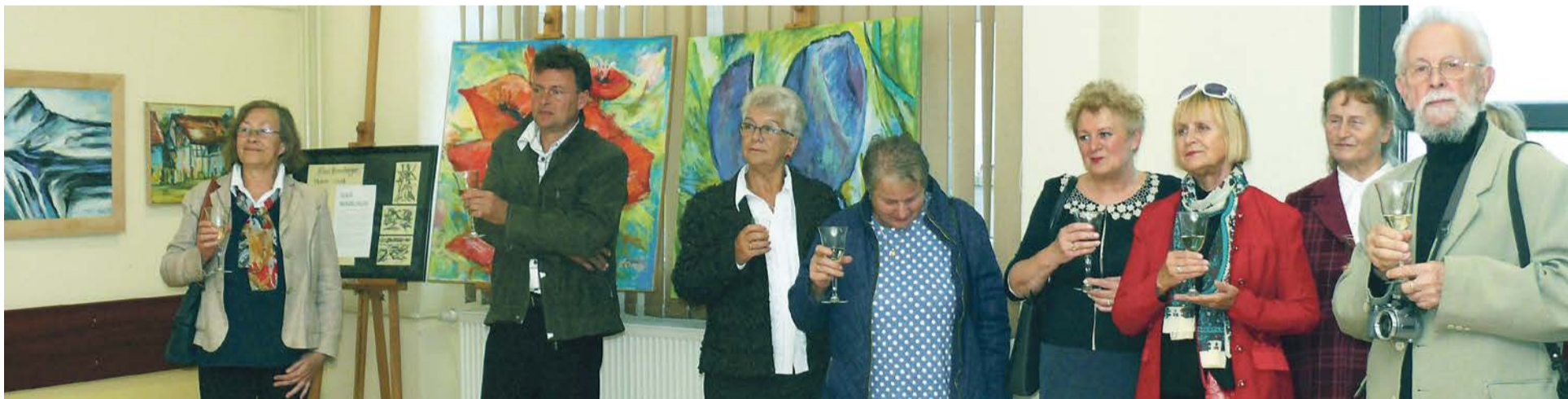
Wernisaż zaszczylicili goście z Polski i z Niemiec