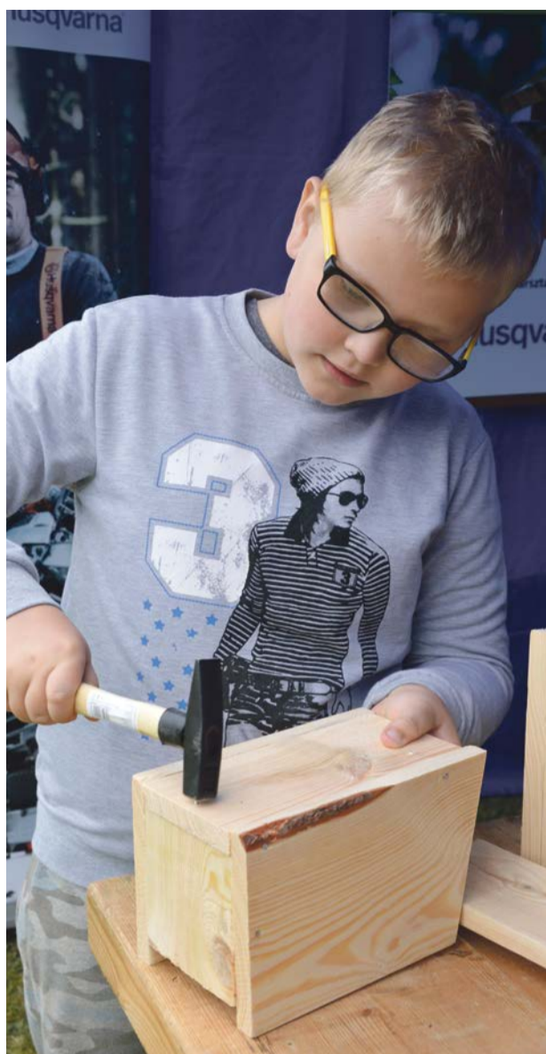
Zbijanie budek legowych nie jest takie trudne