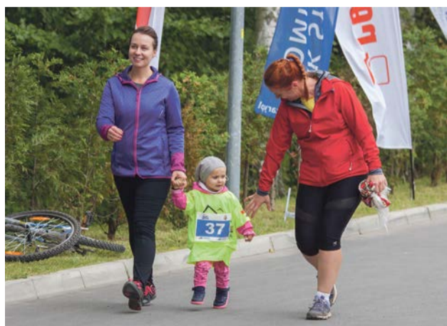
Czym skorupka za miodu...