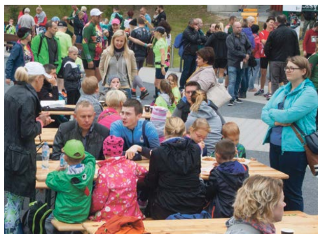
A po biegu - piknik