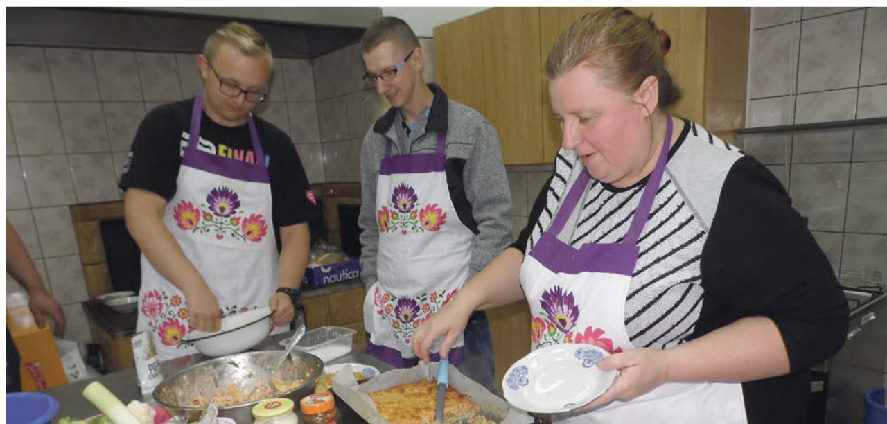
Wszyscy zainteresowani mogą sprawdzić swoje umiejętności kulinarne fot. nadesłane