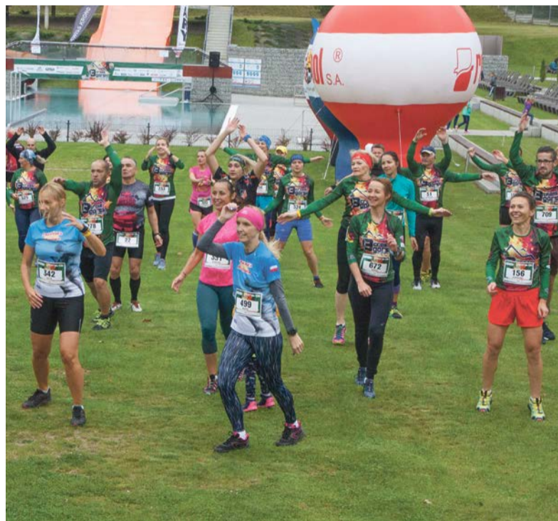
Bez rozgrzewki nie ma biegania