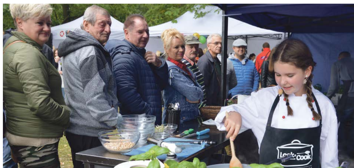
Warto posmakować, jak potrawy pichcą twarze znane z ekranów telewizyjnych