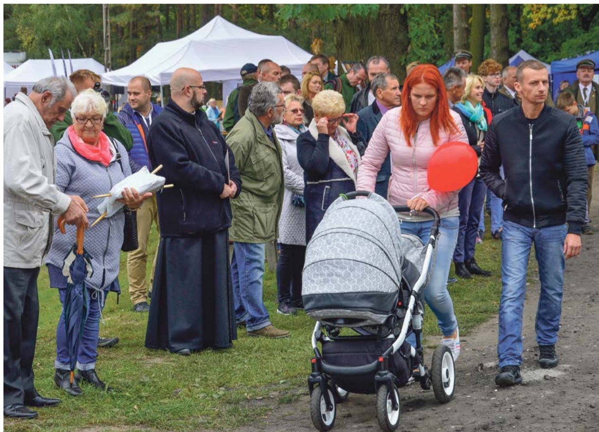
Nie brakowało gości i mieszkańców, którzy przychodzili całymi rodzinami