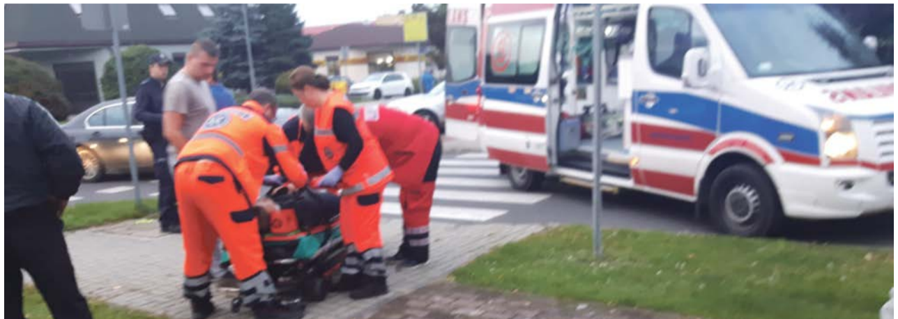
Jednego z uczestników kolizji trzeba było przetransportować do szpitala

przejazdu jadącemu ulicą Kujawską bmw, w wyniku czego doszło do silnego zderzenia pojazdów. Siła zderzenia obróciła volkswagena i wyrzuciła go do pobliskiego ogrodu. Na miejsce zdarzenia wezwano pogotowie. Najbardziej ucierpiał pasażer bmw, który z silnym bólem kręgosłupa został przytransportowany na SOR. Pozostali uczestnicy wypadku nie doznali obrażeń. MK