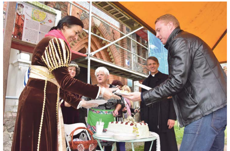
Burmistrz wie, jak kroić torta