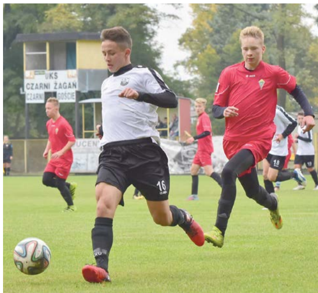
Czarni zdeklasowali Promień

W sobotę na murawie stadionu przy ul. Karpińskiego rozegrano mecz piłki nożnej w ramach I Ligi Wojewódzkiej Junior Młodszy. Zawodnicy UKS Czarnych Żagań pokonali zdecydowanie Promień Żary wynikiem 6:0. Bramki dla gospodarzy zdobyli: 4 - Leszek Jagodziński, 1 - Maciej Cizmiński, 1 - Kornel Irski. JM