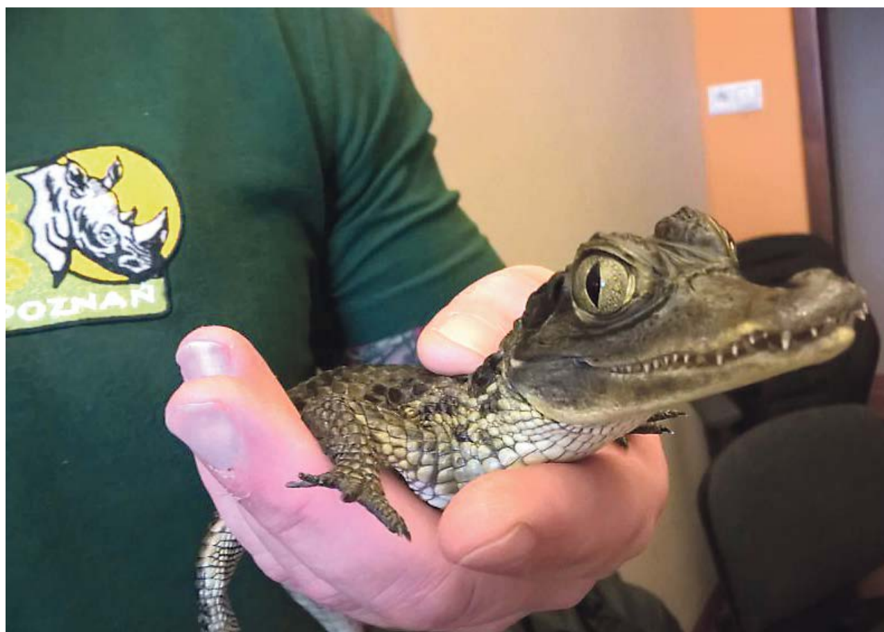
Egzotyczny gad trafił do poznańskiego ZOO

Policjanci wyjaśniają wszystkie okoliczności tej sprawy pod kątem złamania przez młodego mężczyznę przepisów ustawy o ochronie przyrody i ustawy o ochronie zwierząt. PAS