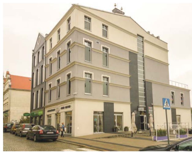
Docenione dzieło żarskiej firmy budowlanej M&J, znajdujące się przy ul. Osadników Wojskowych