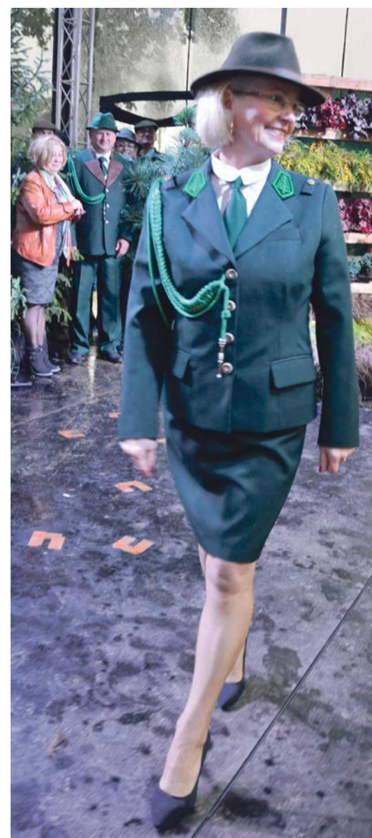
Moda, moda, leśna moda