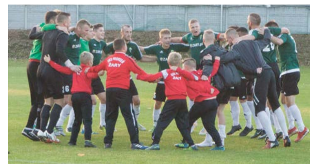
Zwycięstwo to zwycięstwo. Można świętować