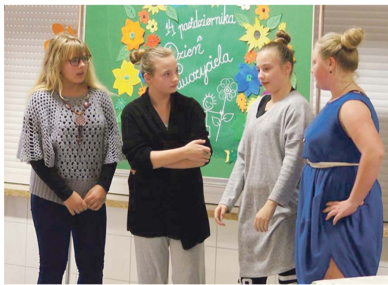
Zrozumieć nauczycielski trud