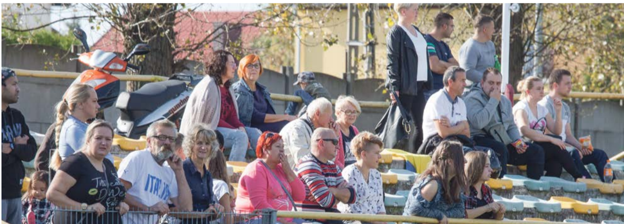
Andrzej Buczyński Kobieca piłka nożna też może się podobać fot. Andrzej Buczyński