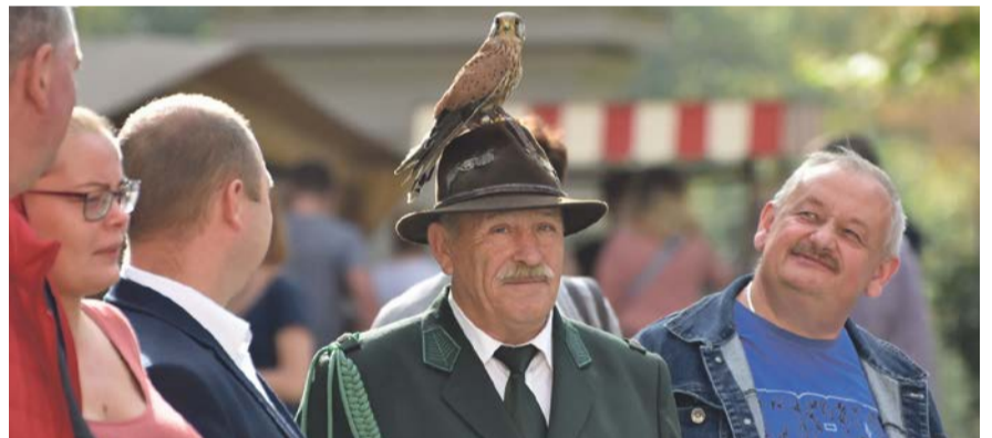
To ci dopiero myśliwski ptaszek