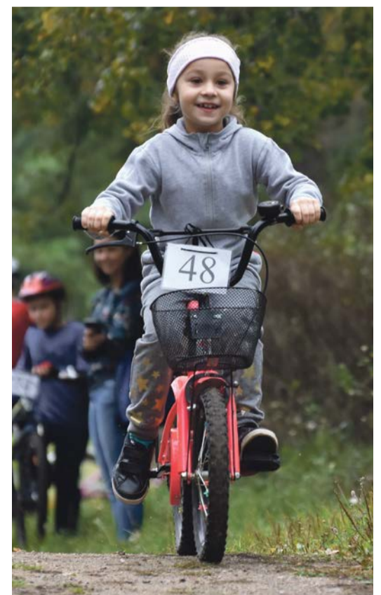
Ja też jadę, a co!