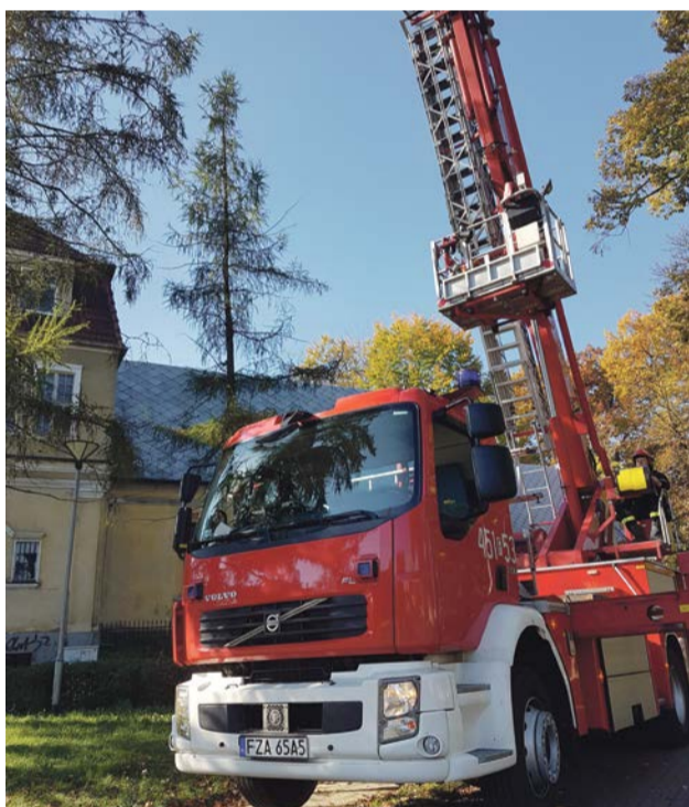
Taki specjalistyczny pojazd potrzebuje miejsca, aby swobodnie dojechać i działać na miejscu zdarzenia