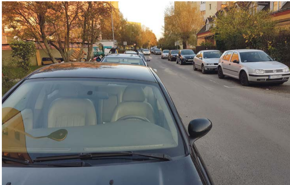
Ulica Kurpińskiego w Żarach. Bardzo często znalezienie tu wolnego miejsca parkingowego graniczy z cudem. Niektórzy kierowcy decydują się na parkowanie niezgodnie z przepisami

- Jeżeli na drogach dojazdowych stoją samochody, których kierowcy ignorują