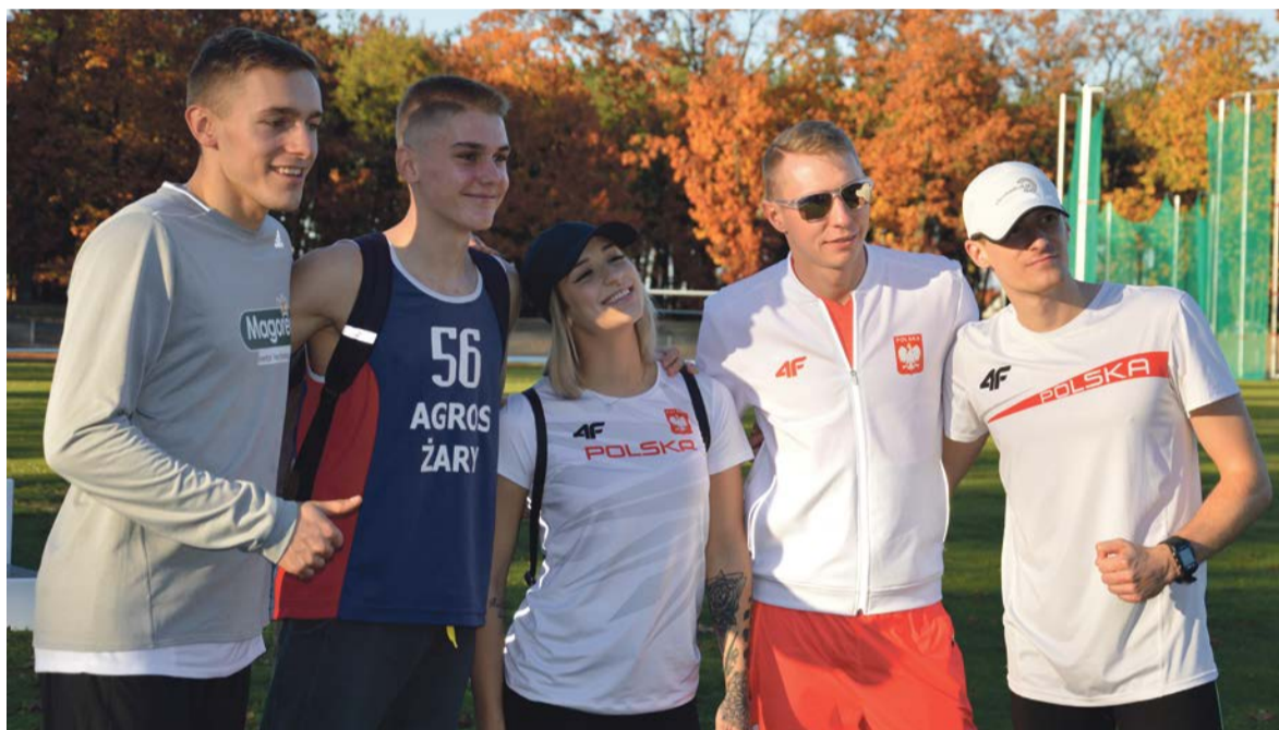
Do Żar zjechali znani lekkoatleci