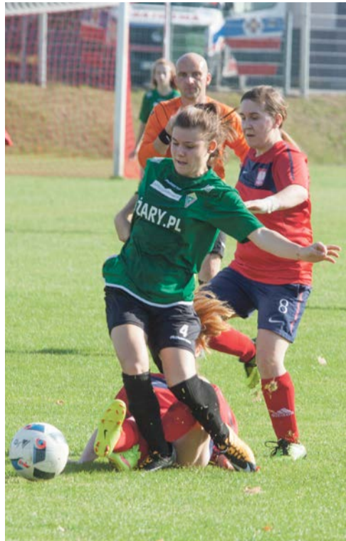
Andrzej Buczyński O piłkę trzeba powalczyć

Był to drugi ligowy sprawdzian żarskiej reprezentacji. Pierwszy mecz z Budowlanymi Lubsko Promień również zakończył sukcesem.