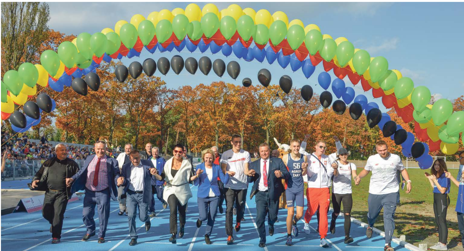
Wszyscy razem wbiegli na metę. To się nazywa otwarcie!