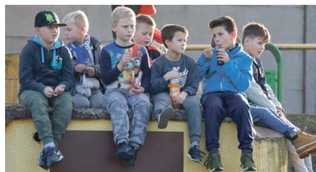
Młodsza ekipa kibiców