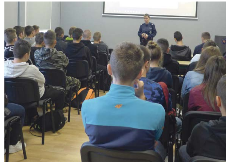
Wyjazd za granicę to szansa na nowe możliwości, ale także ryzyko