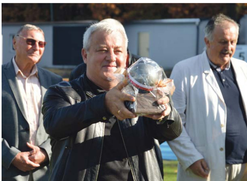
Kula w nagrodę, ale nie do pchnięcia