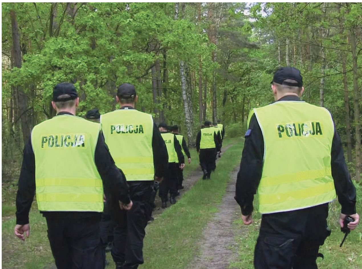
Poszukiwania utrudniał zmrok. Przeprowadzona akcja była jednak sprawna i zaginiony został szybko odnaleziony

- Tym razem historia zakończyła się szczęśliwie. Co roku odnotowujemy zaginięcia osób w kompleksach leśnych. Przestrzegajmy kilku podstawowych zasad zapewniających nam bezpieczny powrót do domu, a szczególną uwagę zwróćmy na dzieci i osoby starsze - przypomina podkom. Aneta Berestecka, oficer prasowy KPP w Żarach. PAS