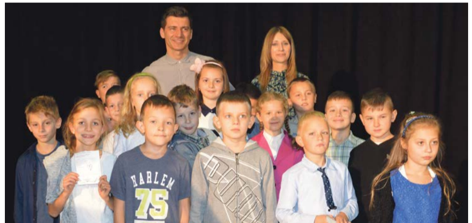
A na zakończenie wspólne zdjęcie z klasą 3b i wychowawczynią