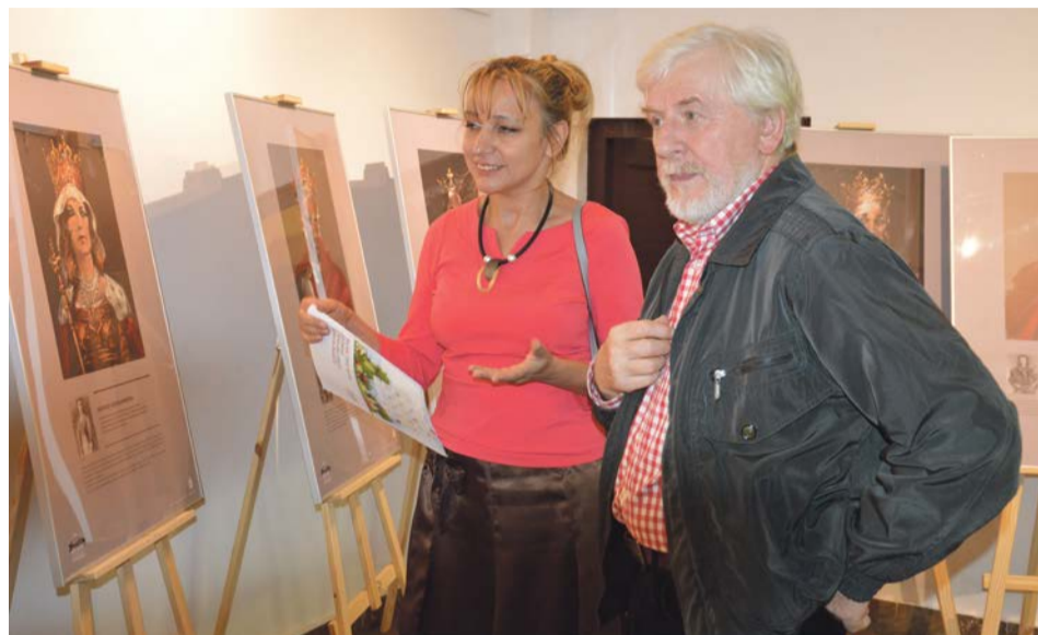
Władcy na portretach przypominają współczesnych ludzi. Czasem przypominają gwiazdy muzyki rockowej czy piłki nożnej