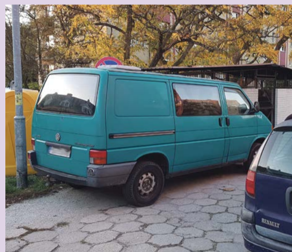
W przypadku pożaru śmietnika, tak zaparkowany samochód może spłonąć