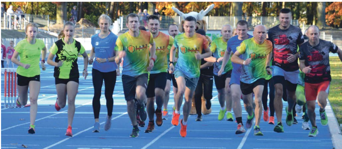
Biegniemy. Jedna mila przed nami