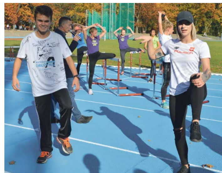
Rozgrzewka to podstawa