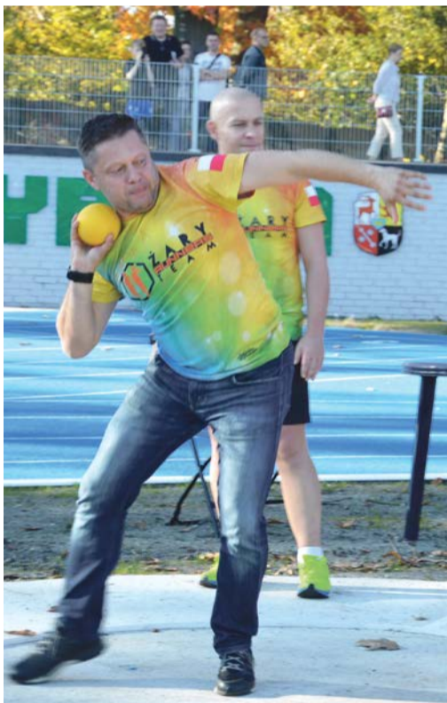
Pchamy ile sił