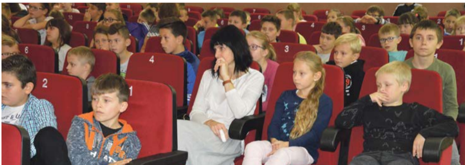
Wszyscy z zainteresowaniem słuchali prelegenta