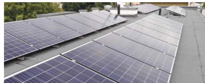
Fragment instalacji do wytwarzania prądu