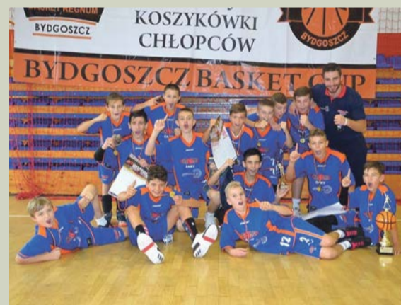
Chromik w Bydgoszczy był niepokonany