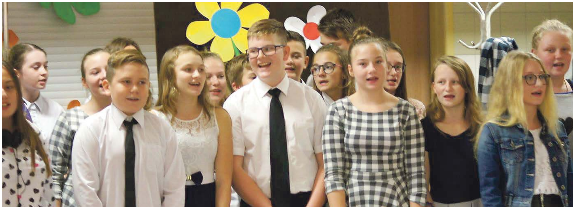
Dobry humor, zabawa i integracja, ale i podziękowanie za pracę nauczycieli