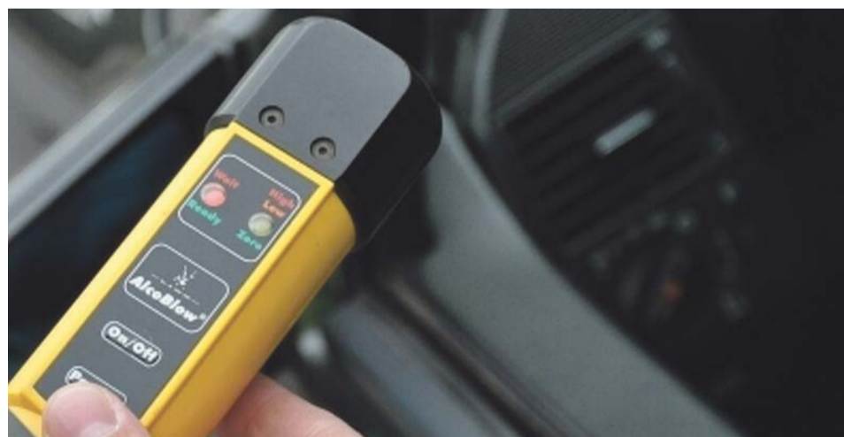
Wyrywkowe kontrole i zorganizowane akcje w celu sprawdzenia stanu trzeźwości są prowadzone po to, aby wyeliminować z ruchu drogowego zagrożenie jakim są nietrzeźwi kierujący

Z piątku na sobotę, 14 października, przed drugą w nocy na ul. Moniuszki w Żarach funkcjonariusze zatrzymali do kontroli drogowej kierowcę chevroleta. Jak się okazało po sprawdzeniu stanu trzeźwości,