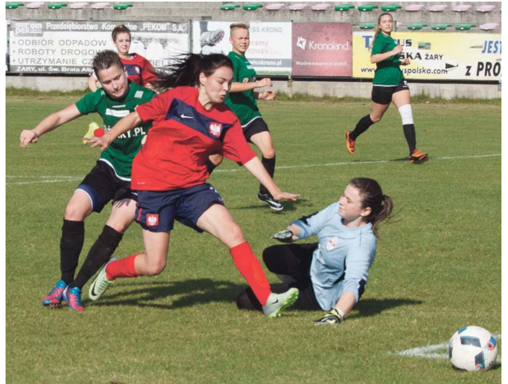
Andrzej Buczyński Determinacji dziewczynom nie brakuje