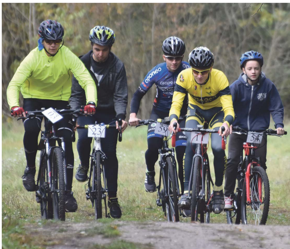
Rywalizacja była zacięta

Sportowa rywalizacja zakończyła się wspólnym ogniskiem z kiełbaskami. JM