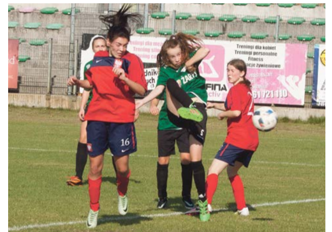
Andrzej Buczyński Tak się strzela bramki dla Promienia fot. Andrzej Buczyński