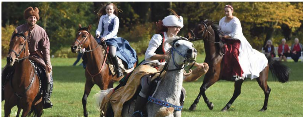
Dogonić lisa nie jest łatwo