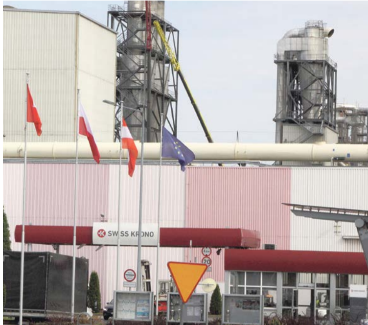
Okoliczności wypadku bada prokuratura i Państwowa Inspekcja Pracy

Niestety, w tym czasie na bocznicę kolejowej trwały prace