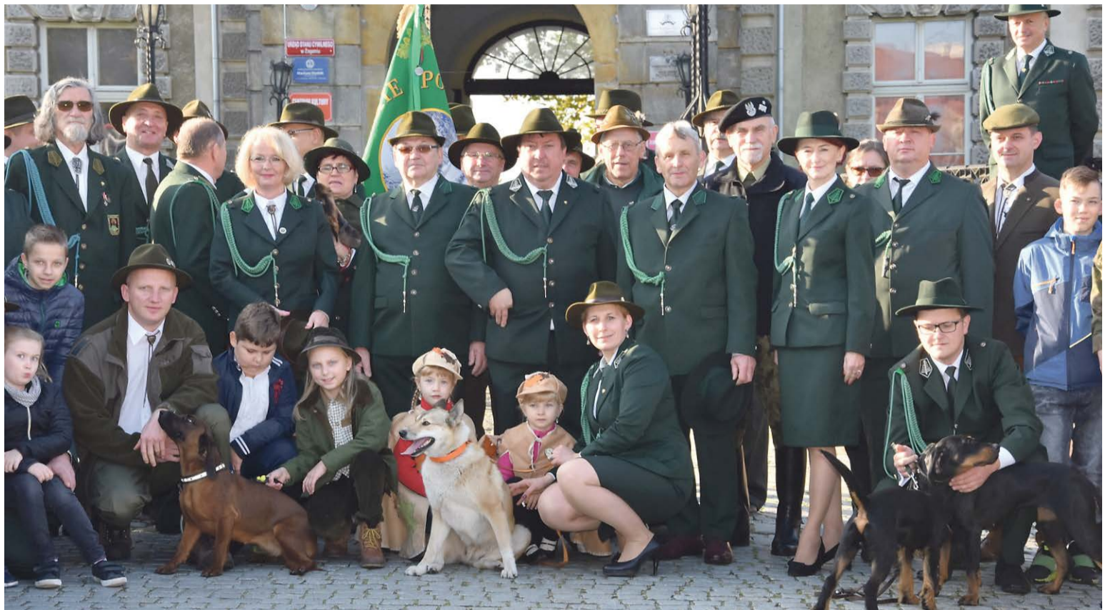
Tradycje łowieckie łączą pokolenia