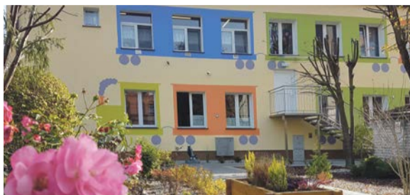
Wygląd elewacji to pomysł dzieci