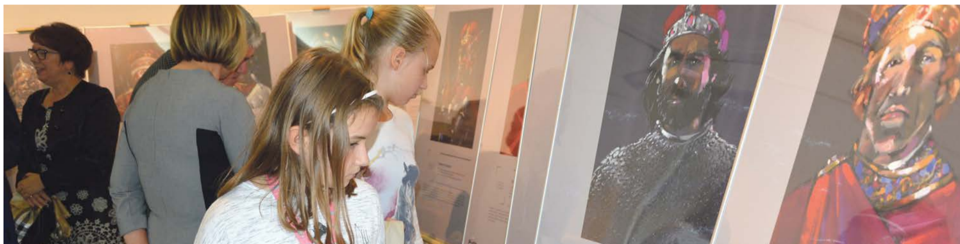
Wystawa to znakomita możliwość edukacji i „żywej lekcji historii”