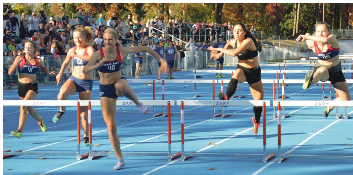
Stadion nie jeden raz będzie świadkiem takich biegów