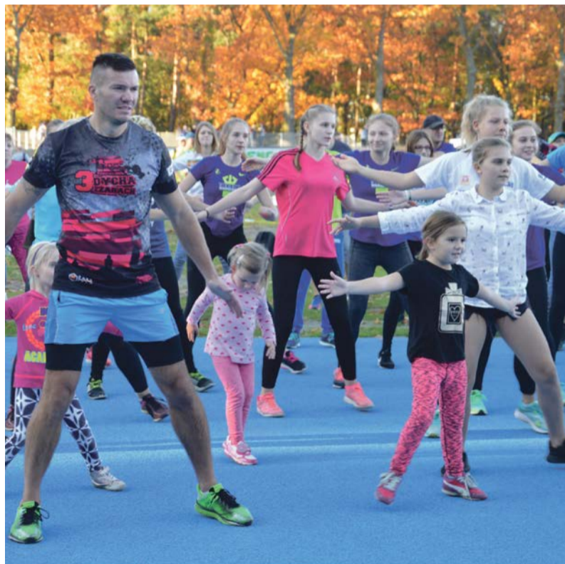
Czy tu świecą przyszli mistrzowie?