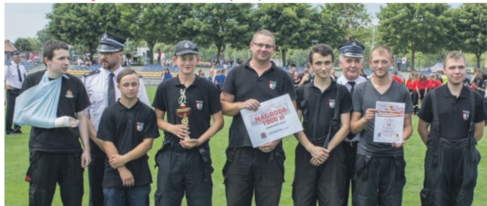
SENIORZY - III miejsce - OSP Łęknica