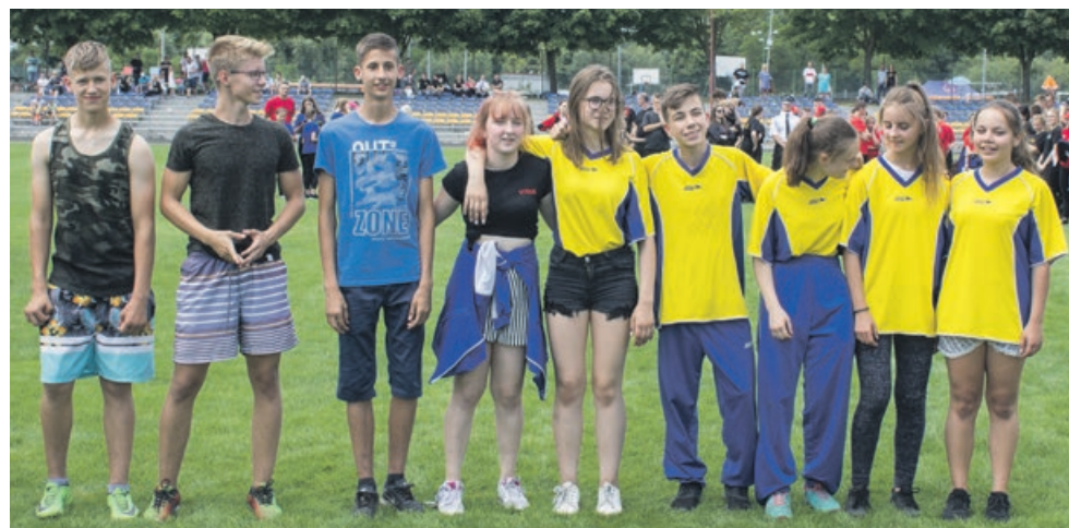
MDP CHŁOPCÓW - I miejsce - OSP Brody