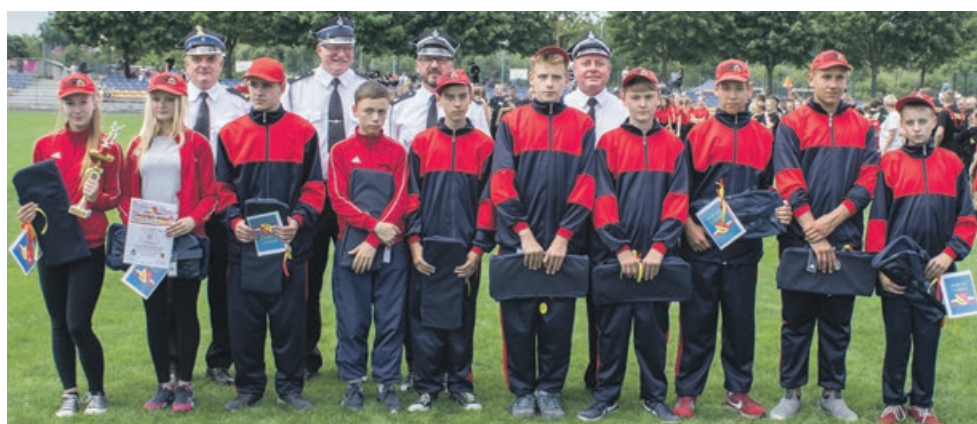
MDP CHŁOPCÓW - II miejsce - OSP Sieniawa Żarska