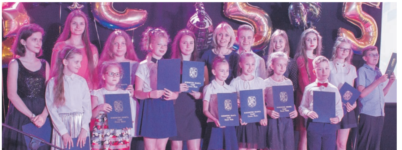
Nagrody przyznane zostały zarówno w kategoriach indywidualnych, jak i zespołowych