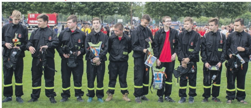
MDP CHŁOPCÓW - III miejsce - OSP Jasień