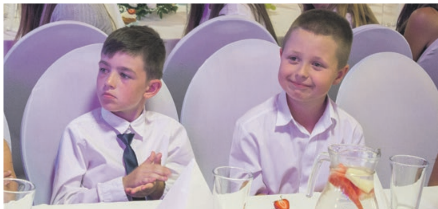
Odświeżone stroje w odświeżonej scenerii