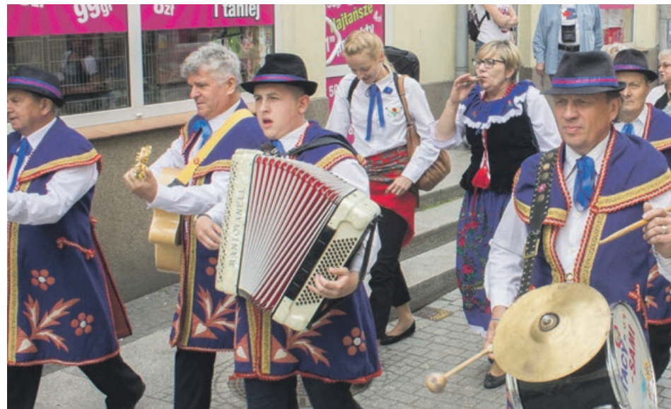
Śpiew, instrumenty i stroje nadają imprezie specyficznego klimatu

nej, obsługa, służby porządkowe czy medyczne. Nikt nie bierze za to ani złotówki. To chyba potrzeba serca. Nawet byśmy się wstydzieli, gdyby ktoś proponował, że nam za to zapłaci. Czujemy inną motywację do tego, żeby to robić. Ale wolontariusze nie podałiby z organizacją takiego przedsięwzięcia, gdyby nie życzliwość otoczenia. Z tą życzliwością w Żarach zawsze się spotykamy. Wspierają nas władze miejskie, Żarski Dom Kultury, Miejski Ośrodek Sportu, Rekreacji i Wypoczynku. Nawiasem mówiąc, mobilna scena, na której występują festiwalowi artyści, jest plonem budżetu obywatelskiego. Kresowianie zbierali podpisy, żeby miasto ją zakupiło, na wszelkie imprezy, chociaż myśleliśmy głównie o naszym festiwalu.