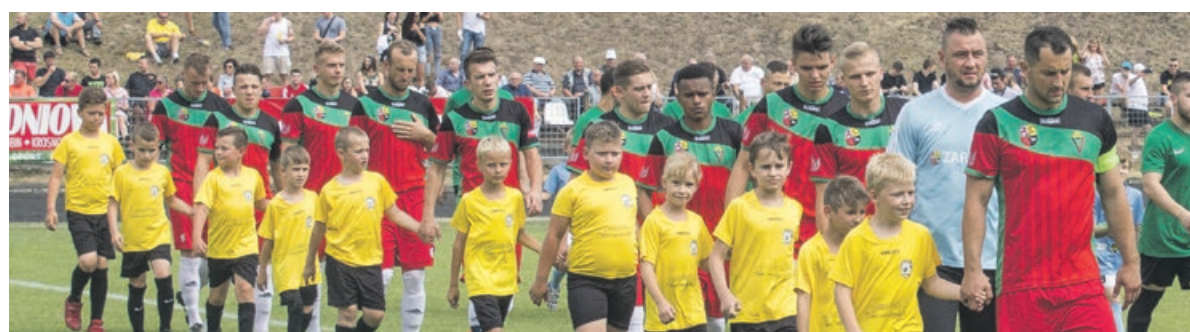
Reprezentacja żarskiego Promienia o włos od awansu do IV ligi fot. Andrzej Buczyński

W ostatniej kolejce Carina Gubin pokonuje Promień Żary 1:0 fot. Andrzej Buczyński