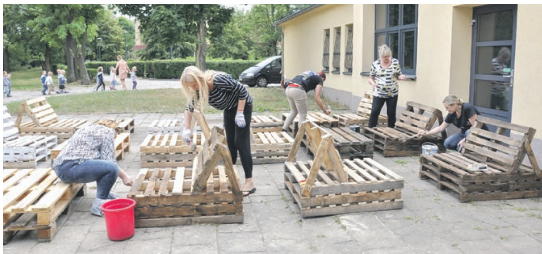
Prace przy ogródku kawiarnianym, niczym czyn społeczny. To miejsce ożyje fot.LDK