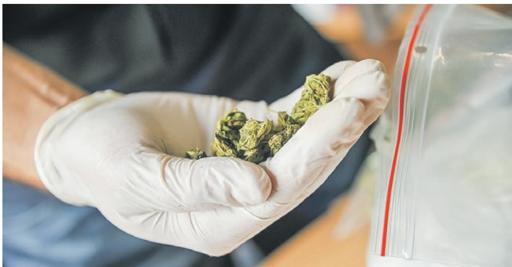
Posiadanie marihuany jest surowo karalne

Mężczyzna został zatrzymany i złożył już wyjaśnienia. Usłyszał zarzuty posiadania znacznej ilości narkotyków, za które zgodnie z prawem grozi nawet do dziesięciu lat pozbawienia wolności. PAS