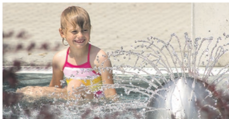
Zabawy w wodzie to wielka frajda dla najmłodszych