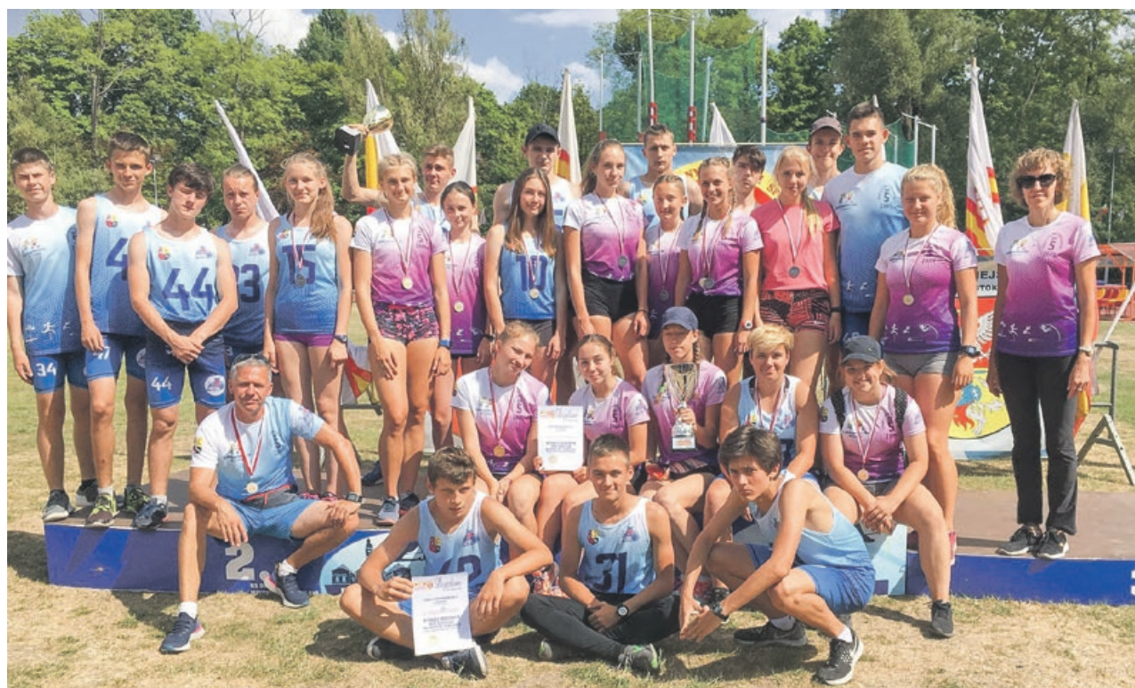
Żarska ekipa ma powody do zadowolenia. Szczególnie dziewczęta