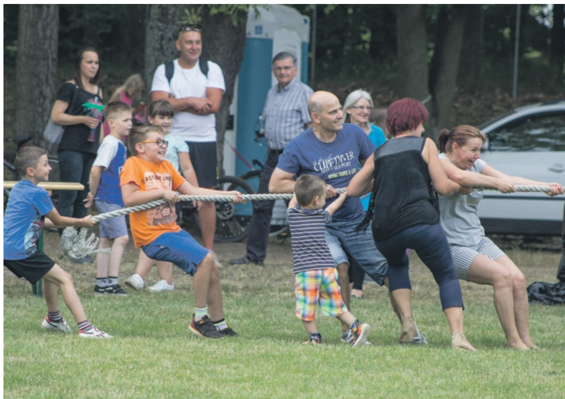
Impreza była okazją do zabawy dla wszystkich, i starszych, i młodszych

W tym sezonie Delta, po awansie z A-klasy do okręgówki, zaskoczyła w pierwszym meczu rundy jesiennej wygrywając z Promieniem Żary. Na 30 kolejek, Delta zwyciężyła 15 razy. Ma na swoim koncie 14 porażek i 1 remis. Na 16 drużyn w tej klasie, dało to Delcie siódmą pozycję w tabeli, co niewątpliwie można uznać za sukces. ATB