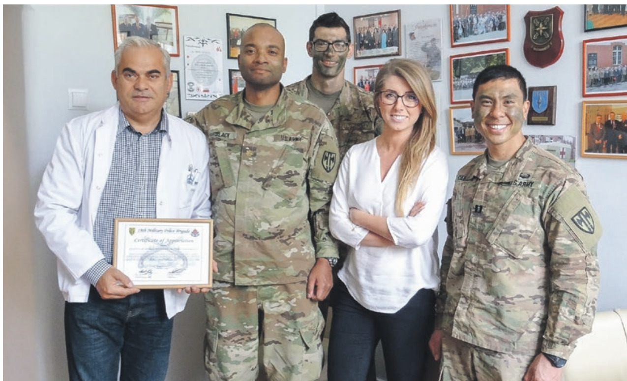
Personel 105. Kresowego Szpitala Wojskowego nie pierwszy raz zabezpiecza od strony medycznej ćwiczenia wojsk sojusznicych

Amerykańscy wojskowi podkreślali również, że to do 105. szpitala wracali najchętniej, a za okazaną pomoc, w imieniu wszystkich żołnierzy uczestniczących w międzynarodowym szkoleniu, serdecznie dziękują. PAS