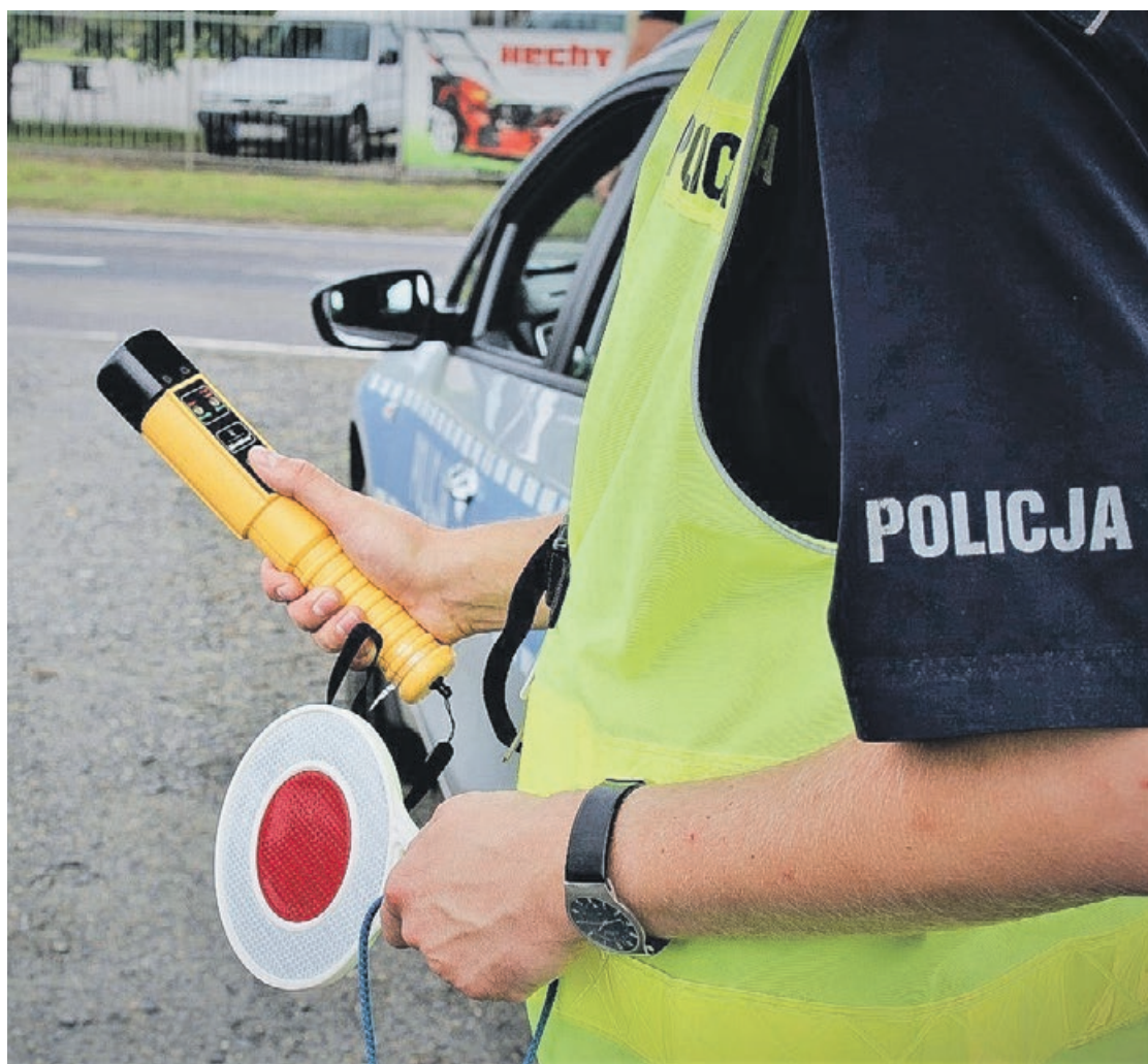
W takiej sytuacji liczy się każda minuta i szybka reakcja policjantów