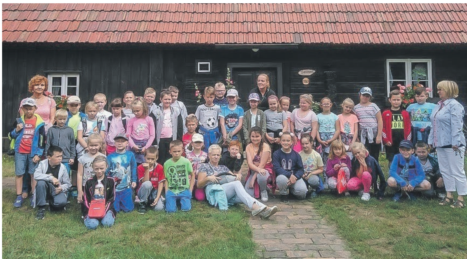
Uczniowie klas: 3a, 3c i 2a będą mile wspominać czas spędzony na wycieczce do Niemiec fot.nadesłane