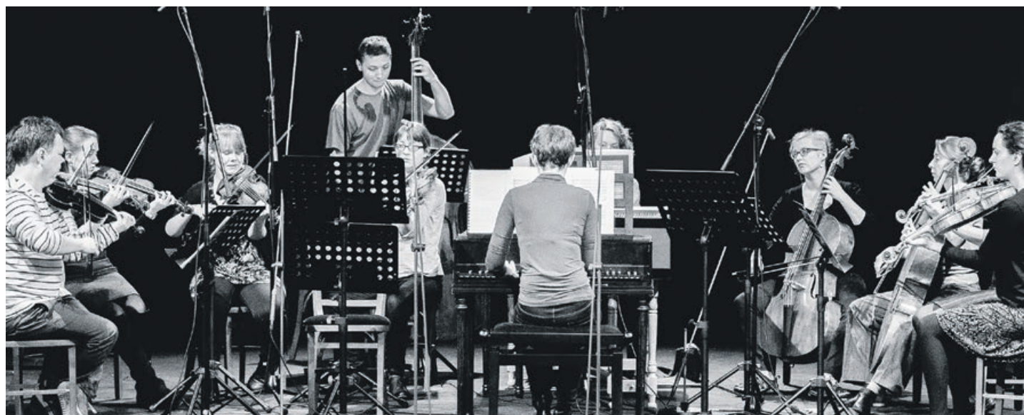
Międzynarodowa orkiestra barokowa Kore zaprezentuje się melomanom w kościele pw. Wniebowzięcia NMP

„Nasz Telemann” to odbywający się od roku 2017 projekt poświęcony polskim inspiracjom w muzyce artystycznej XVII i XVIII wieku prezentowanym w szerokiej perspektywie estetycznej i stylistycznej ówczesnej kultury europejskiej. Symbolicznym patronem i jednym z głównych bohaterów cyklu koncertów i małych festiwalu odbywających się na terenie województw: lubuskiego, dolnośląskiego i wielkopolskiego jest Jerzy Filip Telemann, kompozytor zafascynowany kulturą muzyczną Polski i Europy Środkowej, dokumentujący ją w swoich kompozycjach i popularyzujący ją poprzez włączanie idiomu polskiego do utworów utrzymanych w najpopularniejszych wówczas stylach muzycznych: włoskim i francuskim. Projekt odbywa się m.in. w regionach