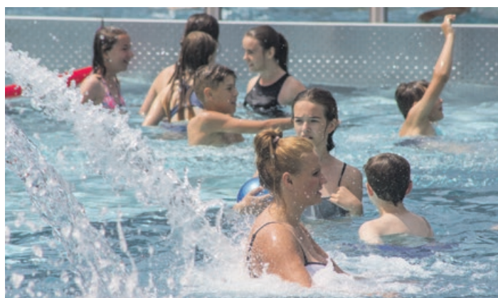
Ciepła woda zachęca do kąpeli

KARTA DUŻEJ RODZINY - dzieci i młodzież - od poniedziałku do piątku 2,50 zł, w weekendy 3 zł; dorośli - od poniedziałku do piątku 4 zł, w weekendy 5 zł.