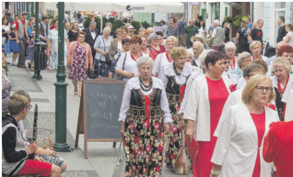
Festiwalowy korowód to tradycja Wielkiego Bałakania