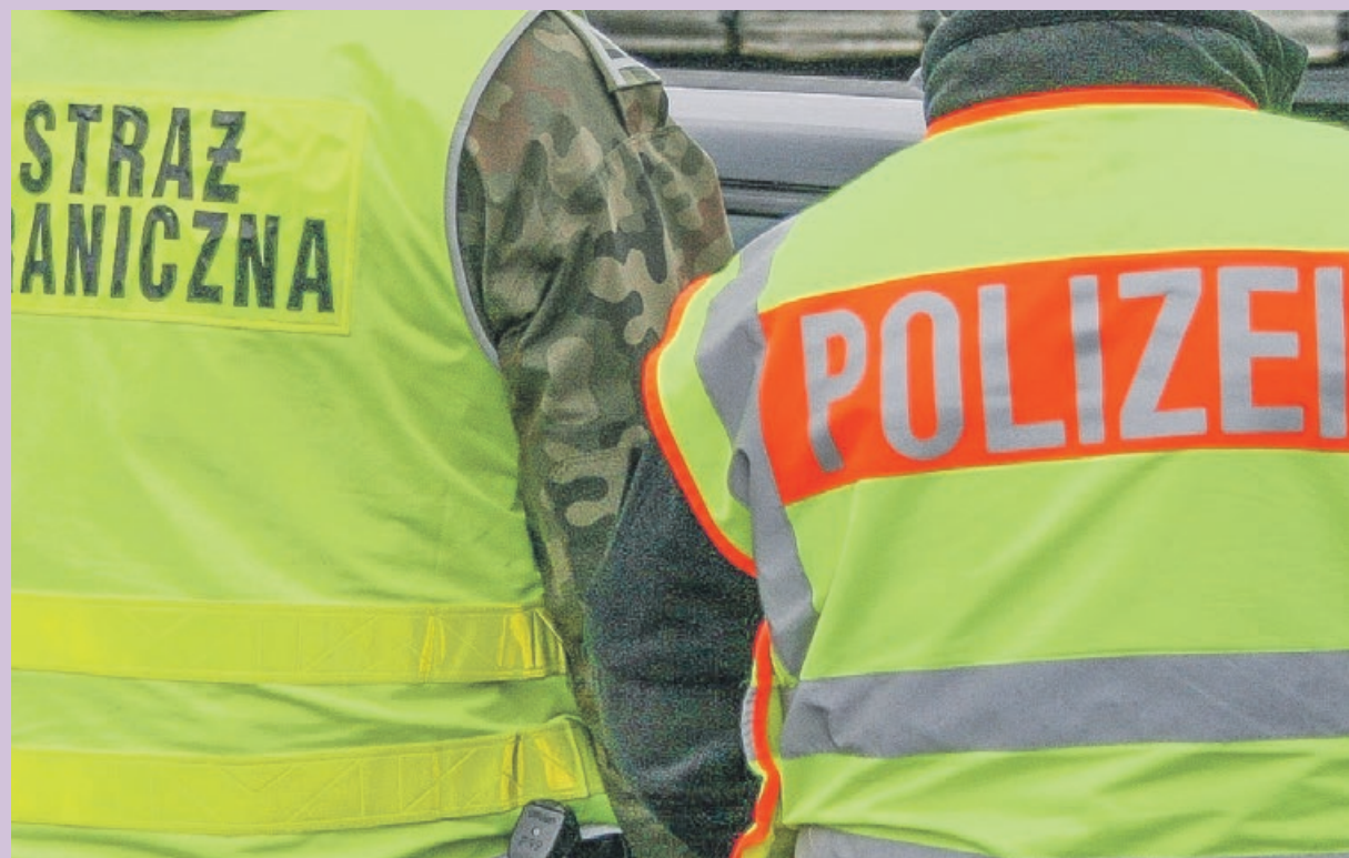
Kolumbijczyk relacje z mundialu w Rosji będzie mógł obejrzeć jedynie w telewizji

cy 31-letniego obywatela Kolumbii stwierdzono, że przebywa on nielegalnie na terytorium Polski, ponieważ przeterminował pobyt na terytorium państw grupy Schengen. Mężczyzna oświadczył, że udaje się do Rosji na mistrzostwa w piłce nożnej. Obywatel Kolumbii w związku z nielegalnym przekroczeniem granicy oraz nielegalnym pobytom na terytorium naszego kraju został zatrzymany. Trwają czynności zmierzające do przekazania cudzoziemca stronie niemieckiej w ramach re-admisji uproszczonej. PAS