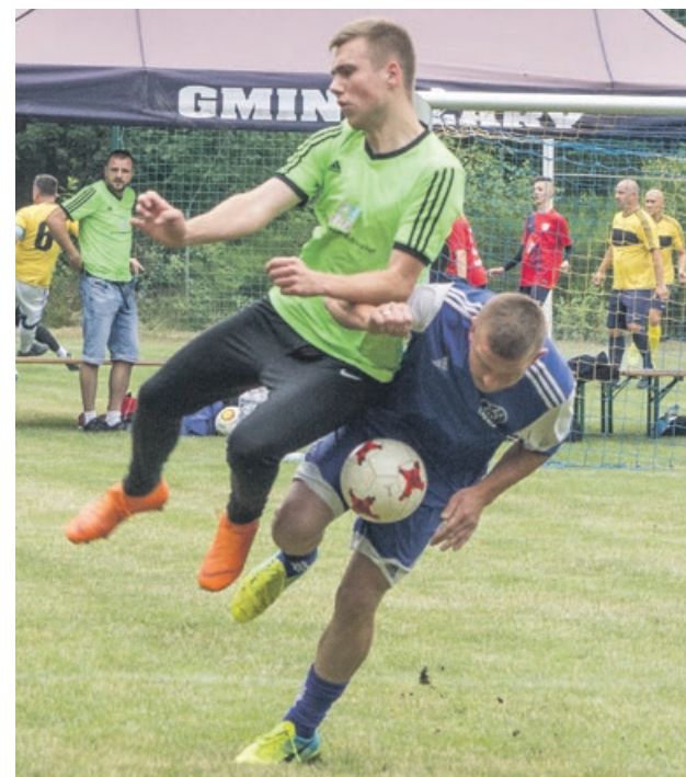
Rywalizacja była zacięta