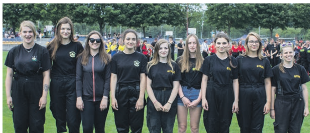
KOBIETY - II miejsce - OSP Żary - Kunice