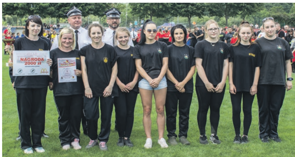
KOBIETY - I miejsce - OSP Złotnik