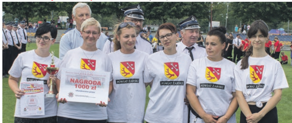
KOBIETY - III miejsce - OSP Dębinka