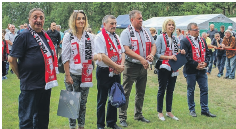
Klubowa wdzięczność wyrażona na sportowo - szalikami Delty