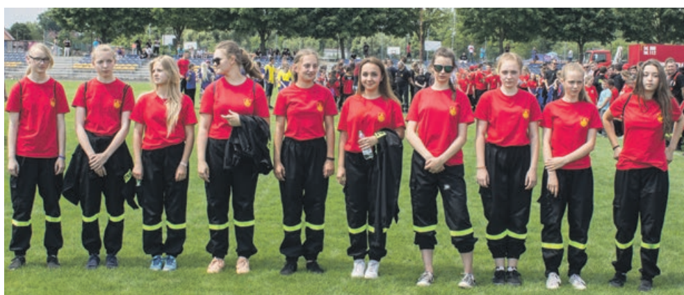
MDP DZIEWCZĄT - II miejsce - OSP Jasień