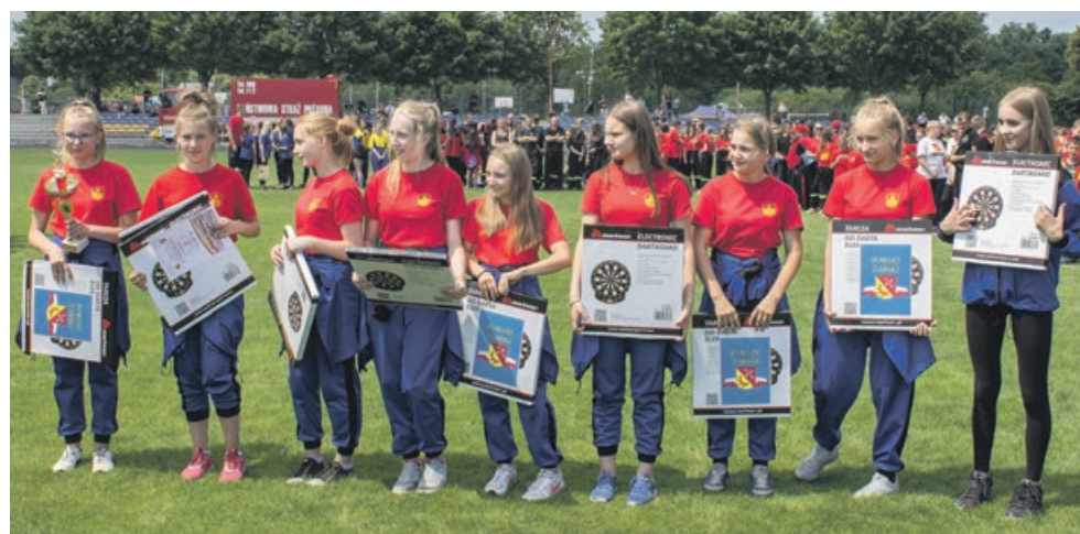
MDP DZIEWCZĄT - I miejsce - OSP Złotnik