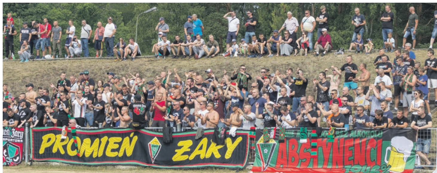
Żarskim piłkarzom dopingu nie brakowało, do Gubina przyjechała spora grupa kibiców