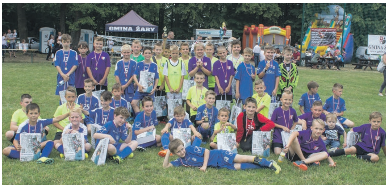
W Sieniawie teżrosną kolejne pokolenia polskiej piłki nożnej