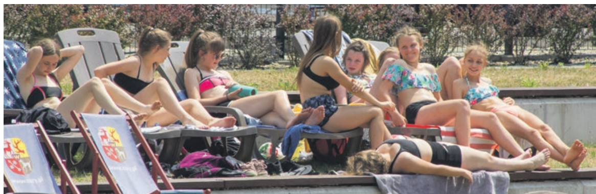
Czas popracować nad wakacyjną opalenizną. Na amatorów kąpeli słonecznych czekają leżaki