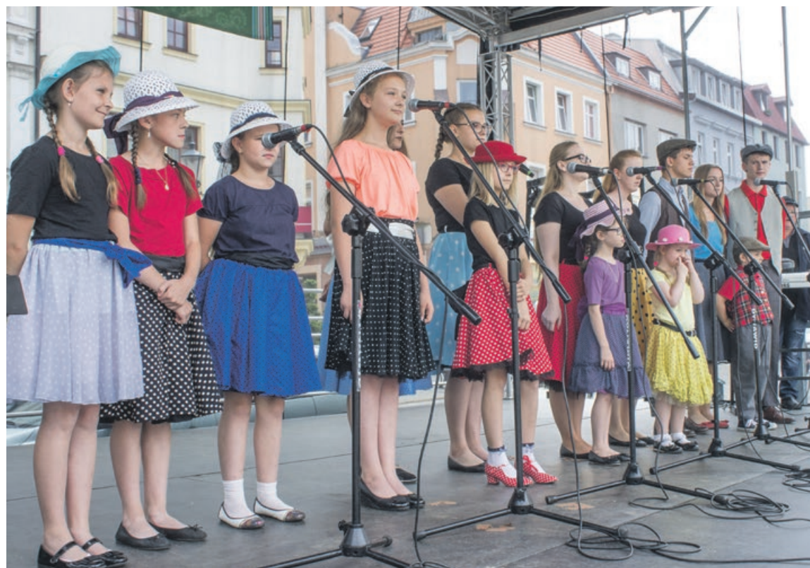
Mała Tęcza z Olbrachtowa to młode pokolenie piosenki ludowej

- Specyfiką naszego festiwalu jest to, że wszystko organizowane jest przez wolontariuszy - wszystkie służby festiwalowe, ci, którzy organizują plac festiwalowy, członkowie rady artystycz-