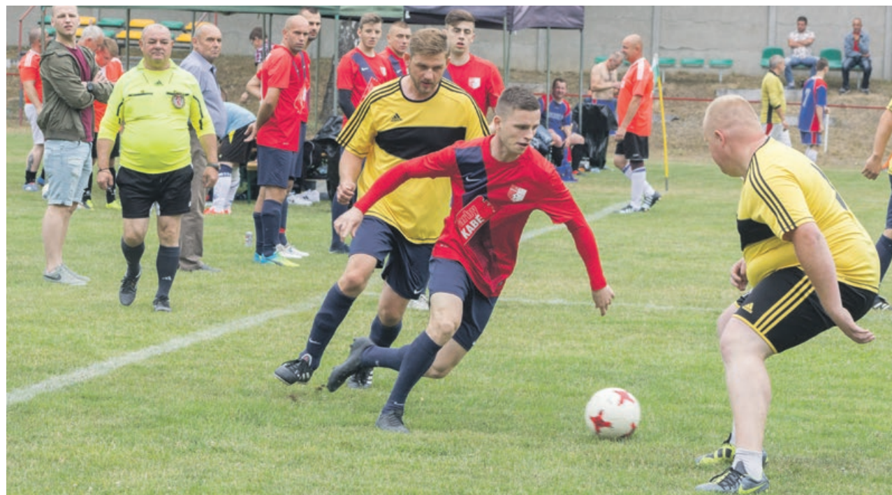
Turniej rozgrywano równolegle na dwóch boiskach