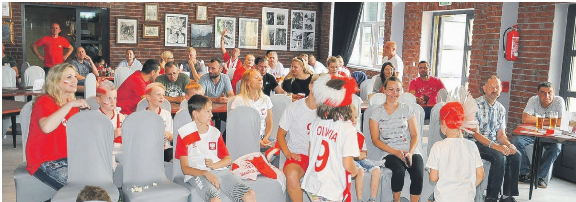
Z racji rozgrywanego właśnie Mundialu, kawiarnia zamienia się czasem w strefę kibica