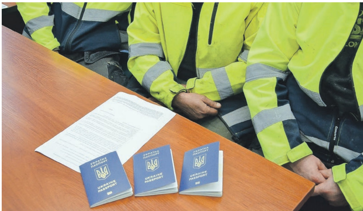
Jak się okazało wszyscy pracowali nielegalnie na rzecz firmy, której właścicielem był również obywatel Ukrainy

Wobec obywateli Ukrainy wszczęto postępowanie administracyjne w sprawie zobowiązania cudzoziemca do powrotu. Odpowiedzialność poniesie również pracodawca, który nielegalnie zatrudnił cudzoziemców. Za naruszenie przepisów ustawy o promocji zatrudnienia i instytucjach rynku pracy grozi mu kara grzywny nawet do 30 tys. zł. PAS