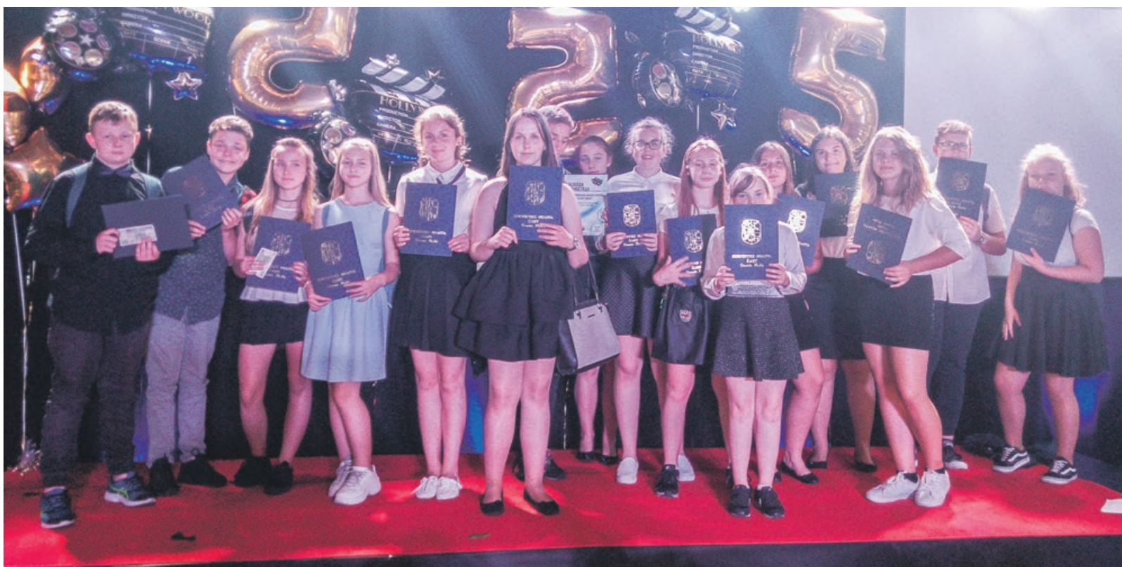
Młodzi dziennikarze „Kuriera Dwójki” mogą poszczycić się już wieloma sukcesami

W konkursie zorganizowanym przez Wojewódzki Ośrodek Metodyczny w Gorzowie Wielkopolskim pod patronatem Lubuskiego Kuratora Oświaty wzięły udział szkolne redakcje z całego województwa. Członkowie jury oceniali m.in. „lokalność” gazetki, warsztat dziennikarski: stosowanie różnych form wypowiedzi dzien-