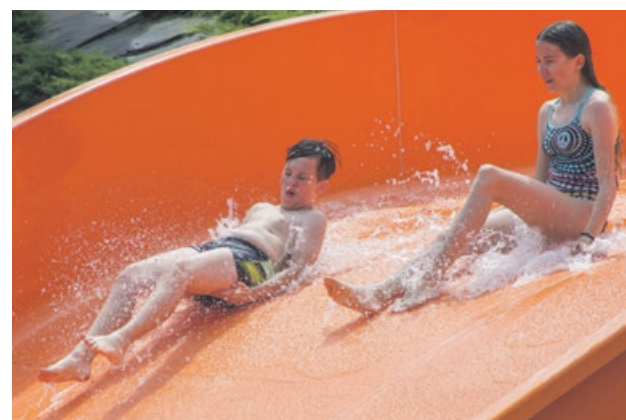
Jest zjeżdżalnia - jest zabawa