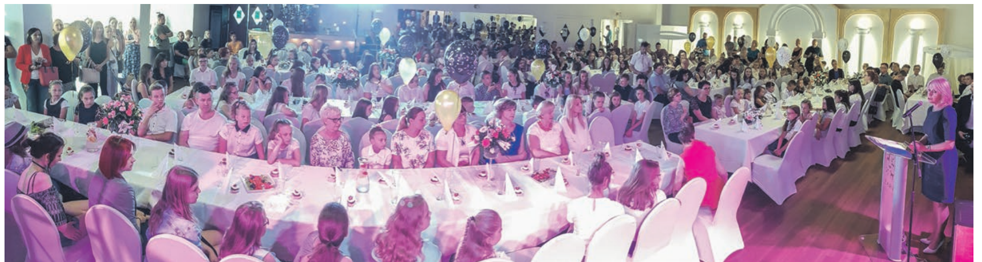
Zdolnych uczniów jest w Żarach tylu, że ceremonię wręczenia nagród trzeba było podzielić na trzy części