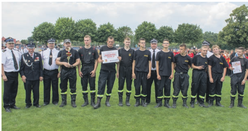
SENIORZY - I miejsce - OSP Złotnik