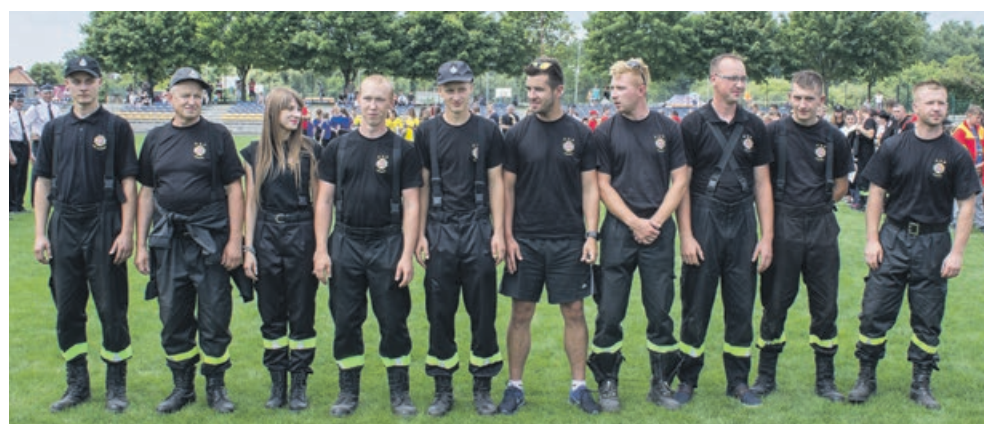
SENIORZY - II miejsce - OSP Chocicz fot. Andrzej Buczyński

Bezkonkurencyjna w tym roku ekipa ze Złotnika w gminie Żary fot. Andrzej Buczyński