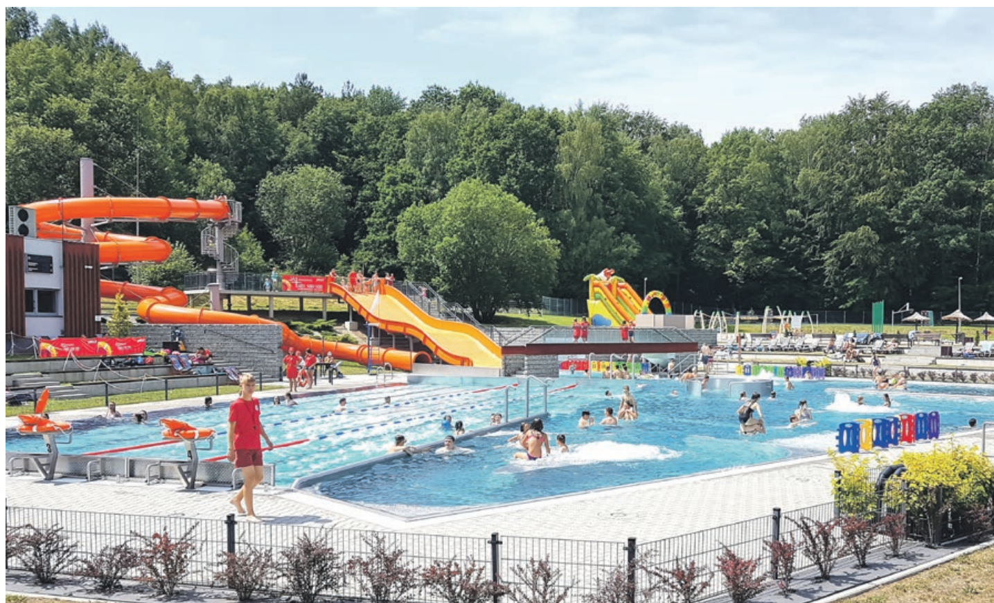
Basen czynny jest codziennie w godzinach od 10 do 20

Poza wieloma znanymi już wodnymi atrakcjami, piaszczystą plażą, placem zabaw dla dzieci oraz barem z przekąskami i napojami, w tym roku pojawiło się boisko wielofunkcyjne o sztucznej nawierzchni. W przerwach między kąpielą i plażowaniem można tam pograć w piłkę nożną lub porzucać do kosza. A jeśli słońce za bardzo przypiecze, każdy znajdzie chwilę wytchnienia w cieniu pod dużą wiatą. ATB