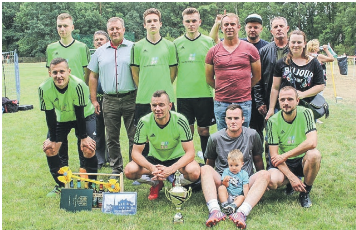
Tegoroczni zwycięzcy pucharu wójta gminy Żary