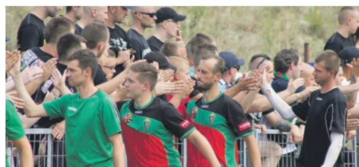
Podziękowania za grę, podziękowania za doping