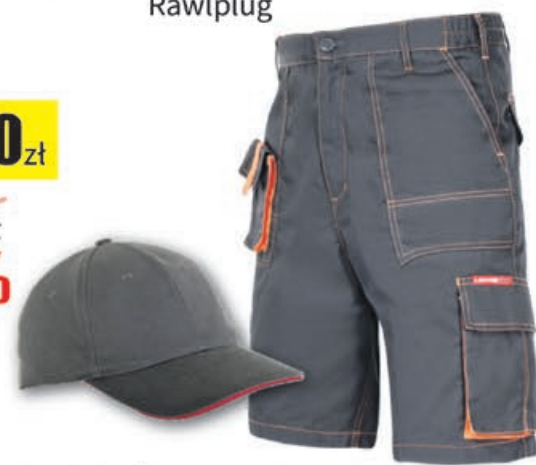
Spodenki krótkie + czapka z daszkiem