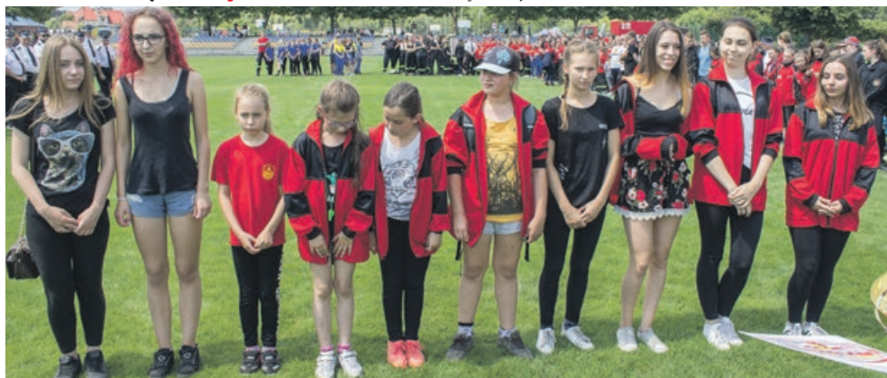
MDP DZIEWCZĄT - III miejsce - OSP Tuplice