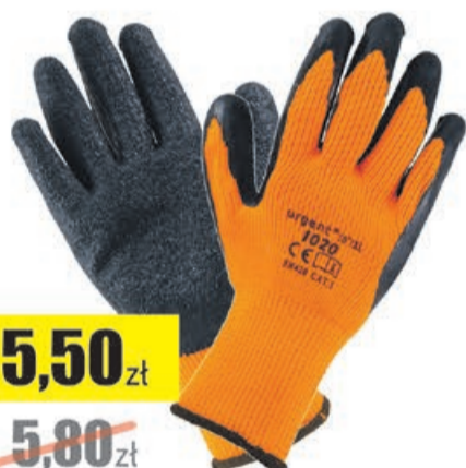
Rękawice ocieplane WINTER 1020 Urgent