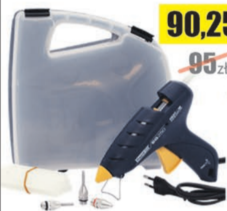
Pistolet do kleju EG250 w walizce PCV Rapid