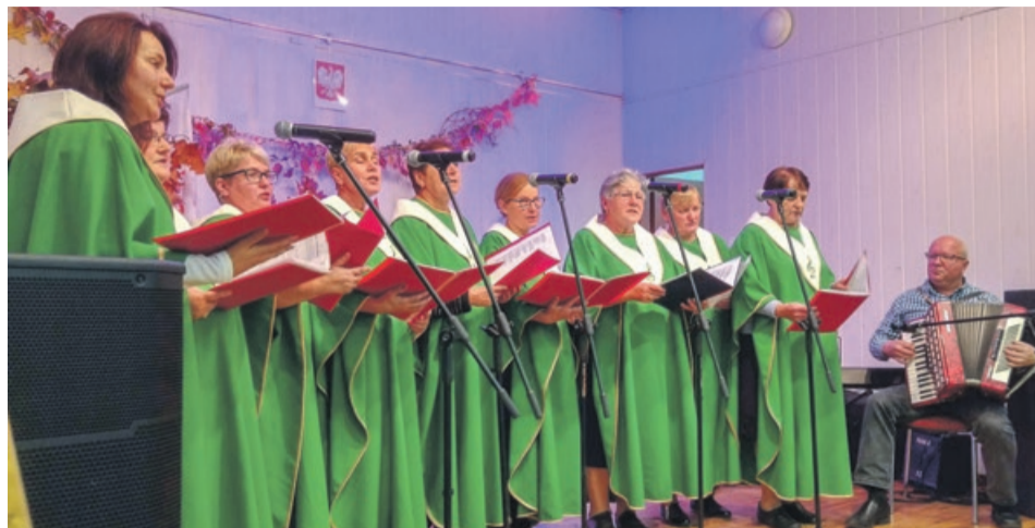
Chór Pięknolesie przeciera artystyczne szlaki

Seniorzy Patriotycznie Rozśpiewani to Przegląd Pieśni Patriotycznej mający na celu wzmocnienie poczucia patriotycznych w społeczności małych miejscowości: Sieniawy Żarskiej li-