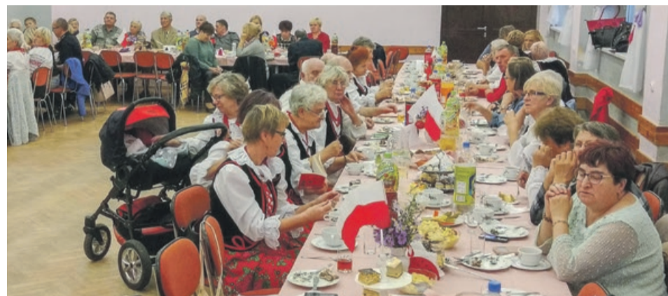
Wspólne biesiadowanie i wspólne śpiewanie, to dobry sposób na integrację

czącej około 1100 mieszkańców oraz Gościeszowic liczących około 1000 mieszkańców. Drugim celem zadania to wzmocnienie zaangażowania społecznego uczestników, integracja lokalnych społeczności oraz seniorów lubiących muzykowanie przekraczająca granice powiatu, trzeci program i krzewienie wolontariatu. Zaproszone do realizacji zespoły upamięt-