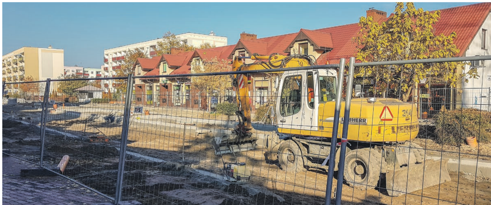
Główne prace zbliżają się do końca odcinka remontowanej ulicy