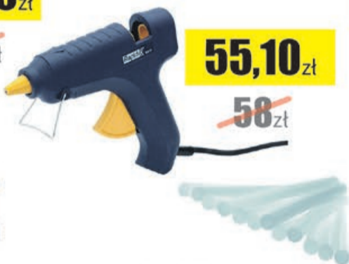
Pistolet do kleju EG111 +500g kleju Rapid