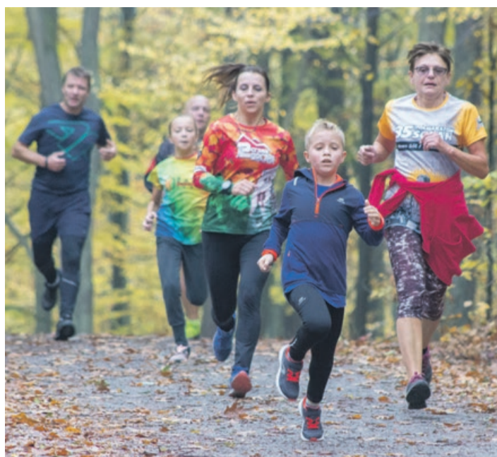
Parkrun to bieg dla każdego