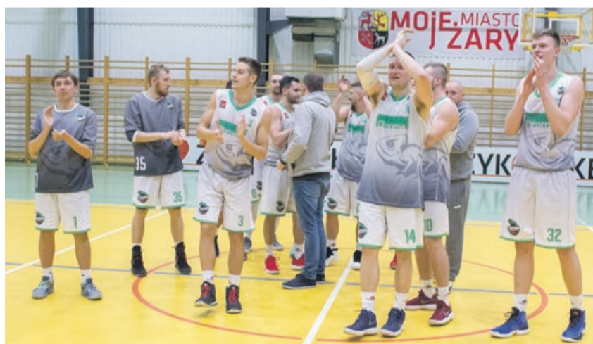
Jest drużyna, są wyniki