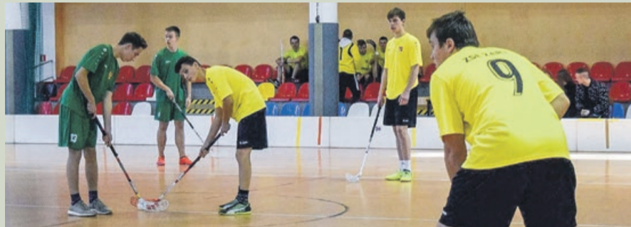
W unihokeja gra się w Żarach od wielu lat