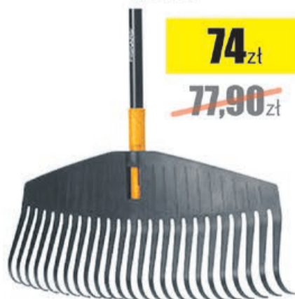
Grabie do liści SOLID L Fiskars