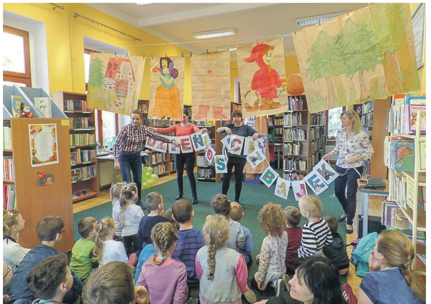
Postaci z bajek żyją w wyobraźni