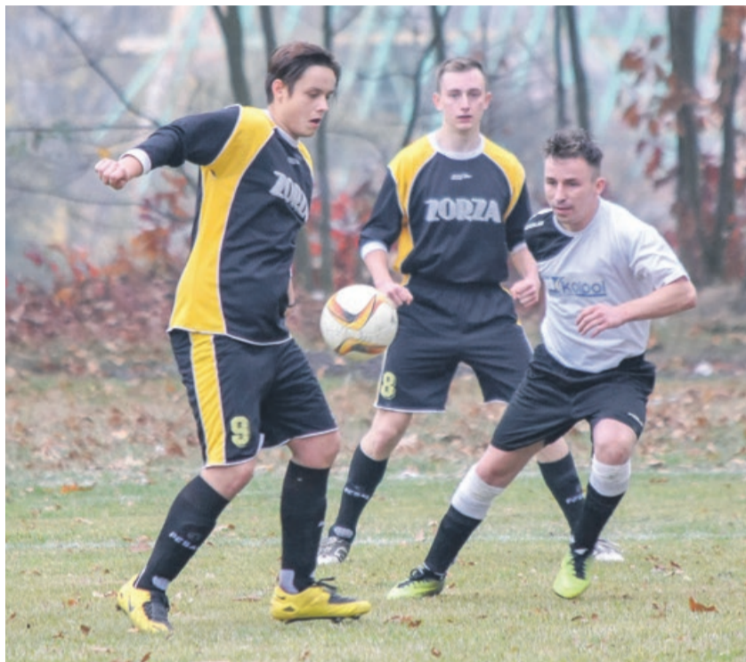
Zorza Kadłubie przegrała wszystkie mecze w tej rundzie, a ostatni z Nysą Trzebiel zakończył się rezultatem 0:7

Nie wpłynie to już na układ w czołówce tabeli. Piłkarską jesień w żarskiej klasie B na pierwszym miejscu kończą Budowlani II Lubsko. Z taką samą liczbą punktów drugą pozycję objął KS Lipna. Z trzema punktami straty do prowadzących, na trzecim miejscu jest FAX Bieniów ATB