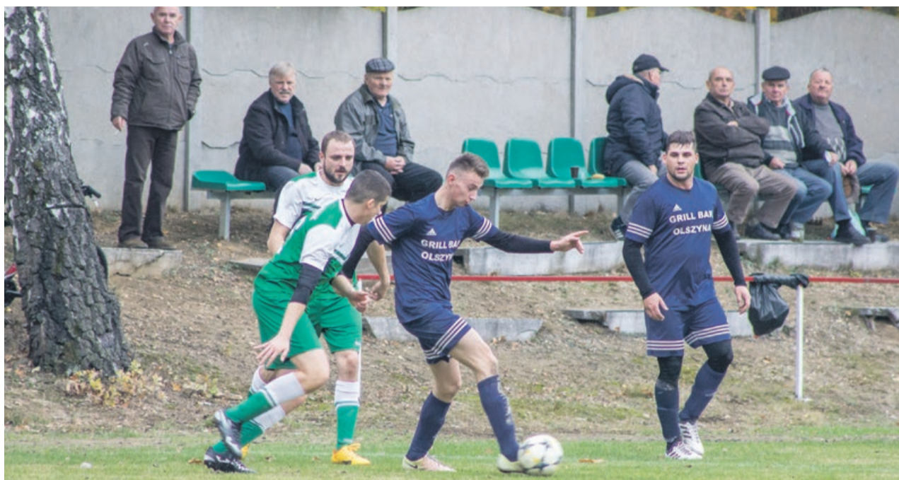
Granicza Żarki Wielkie nie pozwoliła Sparcie na strzelenie gola

Granica z Żarek Wielkich zajmuje obecnie trzecie miejsce w tabeli z sześciopunktową stratą do Sparty. Teoretycznie ta drużyna również może powalczyć o awans. Runda wiosenna zapowiada się na pewno ciekawie ATB