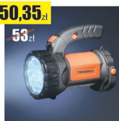
Latarka TS-1871 Tiross