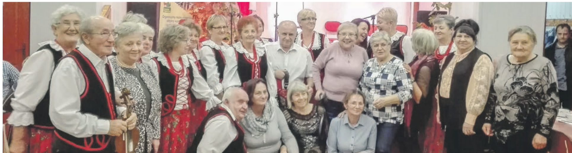
Miło mieć pamiątkowe zdjęcie z takiego spotkania

Łącznie w projekcie udział wzięło około 200 osób w tym: Chór Pięknolesie, Zespół Jarzębina, Zespół Gościeszanki, Kabaret Oj, Tam, Oj, Tam. PAS