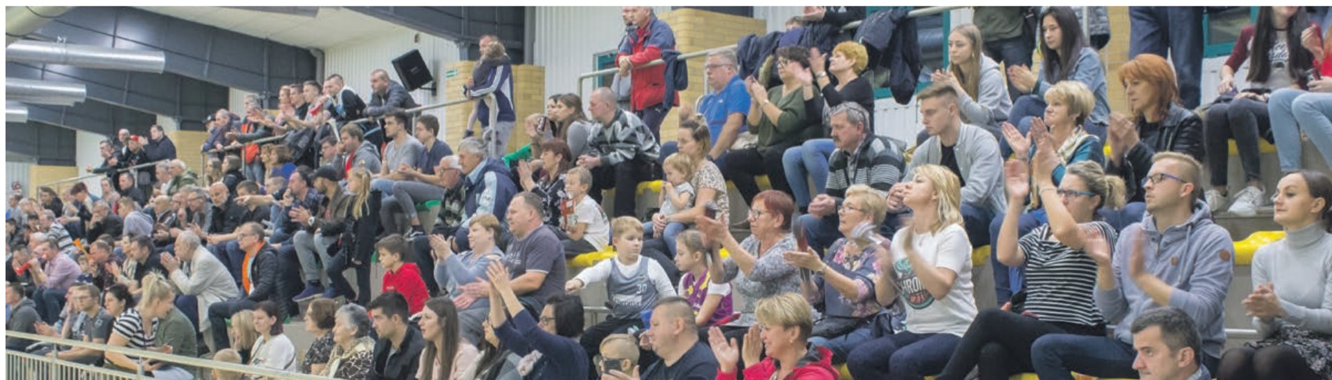
Najlepsza żarska publiczność