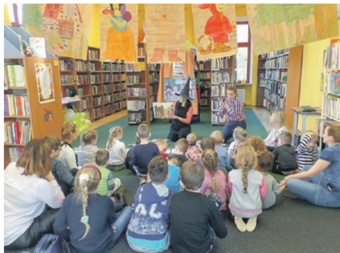
Postaci z bajek żyją w wyobraźni

Dzieci zostały przywitane piosenką pt. „Witajcie w naszej bajce”, po czym odbyła się pogadanka na temat ulubionych postaci z bajek, poznanych w przedszkolu i w domu. Następnie uczestnicy za-