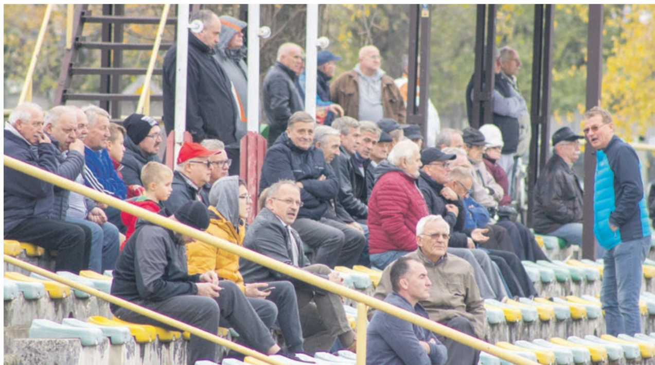
Taki mecz warto obejrzeć