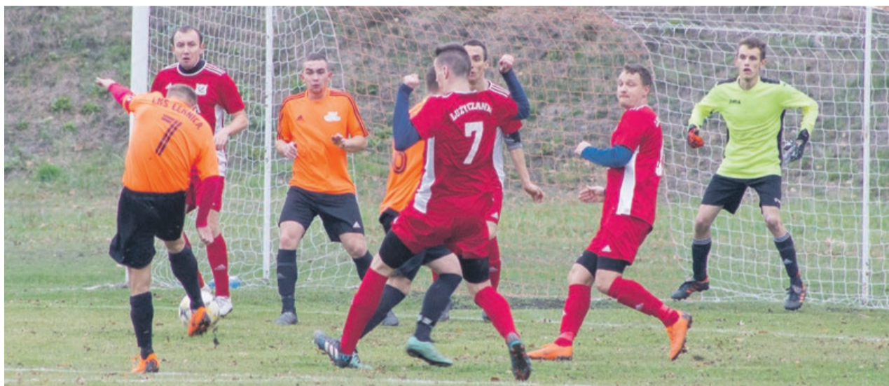
Pierwsza z jedenastu podbramkowych sytuacji, które zakończyły się golem

W ostatnim meczu dołożyli kolejne do ogólnego bilansu, wygrywając z Łużyczanką Lipinki Łużyckie 11:0.