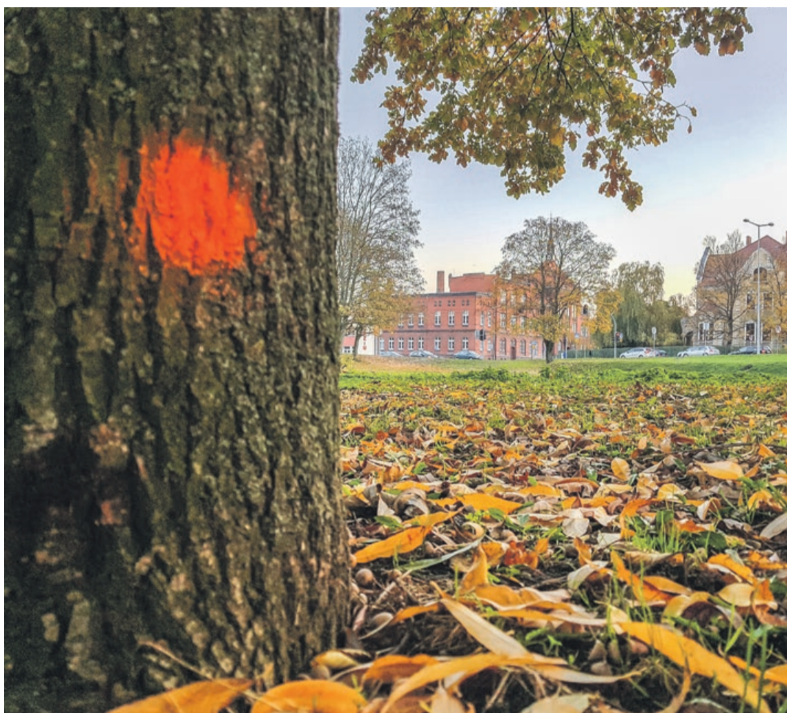
Konieczność wycinki każdego drzewa będzie analizowana indywidualnie

Przez lata pojawiło się wiele tak zwanych samosiejek. Młode drzewka zaczęły rosnać, gdzie popadnie, a nikt tego na bieżąco nie pielęgnował. Zapewne wiele osób pamięta jeszcze dzikie