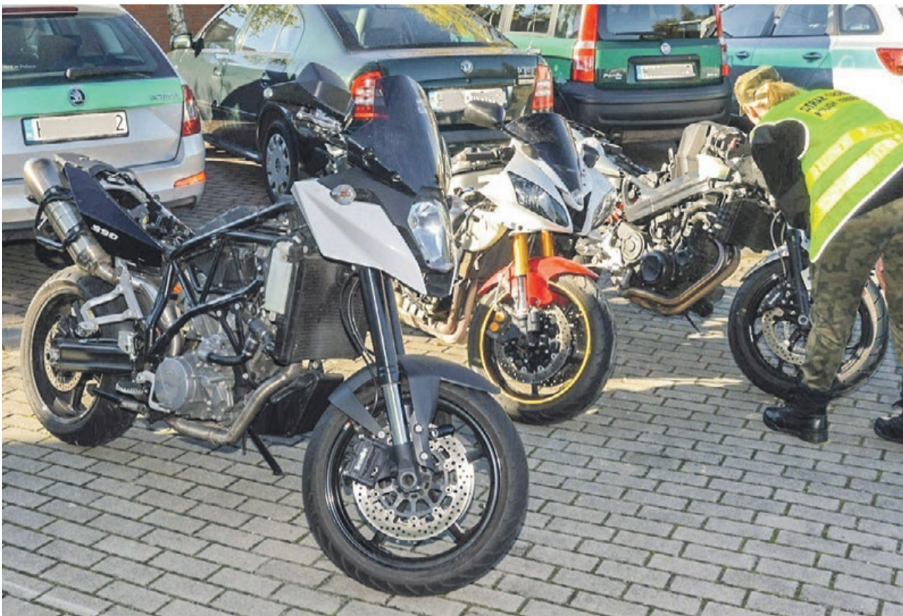
Skradzione jednoślady nie trafią na paserski rynek

kowej ujawniono 3 motocykle oraz 3 rowery. Kierujący pojazdem nie posiadał przy sobie dokumentów przewożonych jednośladów. Po dokonanych kolejnych sprawdzeniach ustalono, iż motocykle marki Yamaha, BMW i KTM 990 Supermoto skradziono na terytorium Niemiec. Kierowca tłumaczył funkcjonariuszom, że samochód, motocykle oraz rowery kupił w Niemczech. Wartość szacunkowa zatrzymanych motocykli to prawie 50 tysięcy złotych, a wartość rowerów to 26 tysięcy. Cudzoziemiec został zatrzymany w związku z podejrzeniem kradzieży motorów i rowerów. Dalsze czynności w tej sprawie prowadzą funkcjonariusze Policji z Żar. Mężczyźnie grozi do 5 lat pozbawienia wolności. PAS