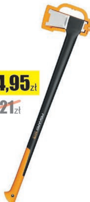
Siekiera rozłupująca X27-XXL Fiskars