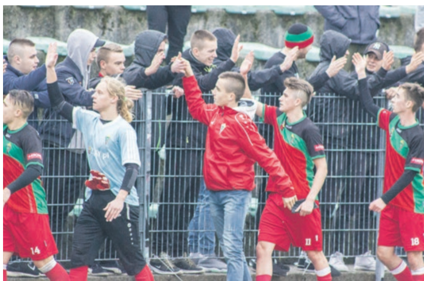
Zasłużone gratulacje od kibiców