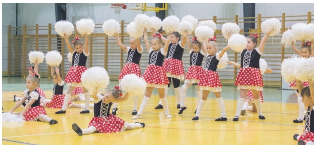
Czy można nie wygrać przy takim dopingiu?