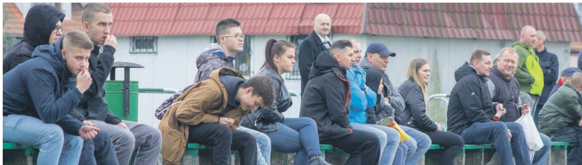
Czy kibice w Łęknicy zobaczą u siebie klasę okręgową?

Jeśli będą grać tak nadal, to mają szansę powalczyć ze Spartą Grabik o awans do klasy okręgowej. Dziś ŁKS zajmuje drugie miejsce w tabeli z czteropunktową stratą. ATB