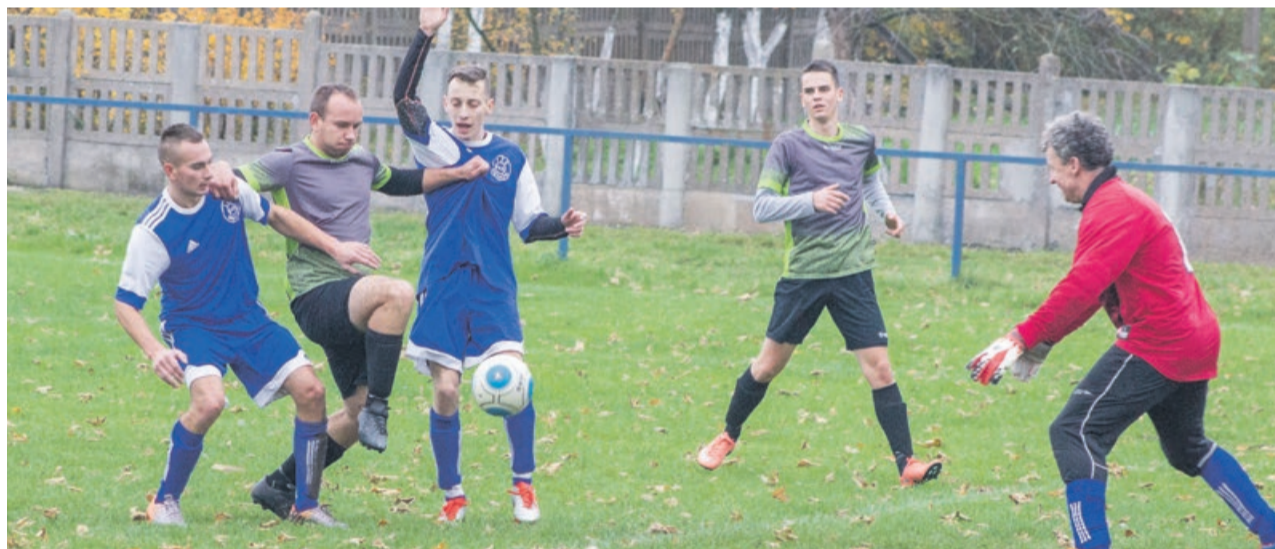
FAX Bieniów wygrał u siebie z Zielonymi Drożków 7:3 i kończy rundę na 3. miejscu