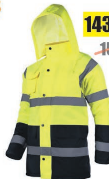
Kurtka ostrzegawcza zimowa żółta Lahti Pro