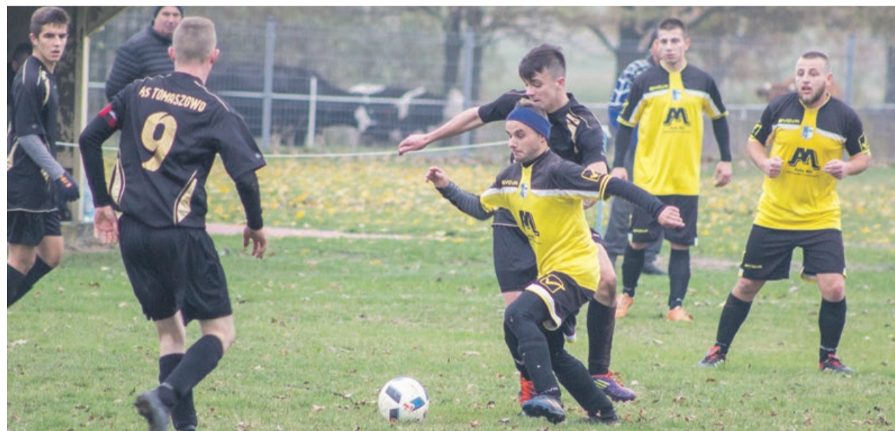
Ostatnie spotkanie tej rundy Piast rozegra w Trzebowie