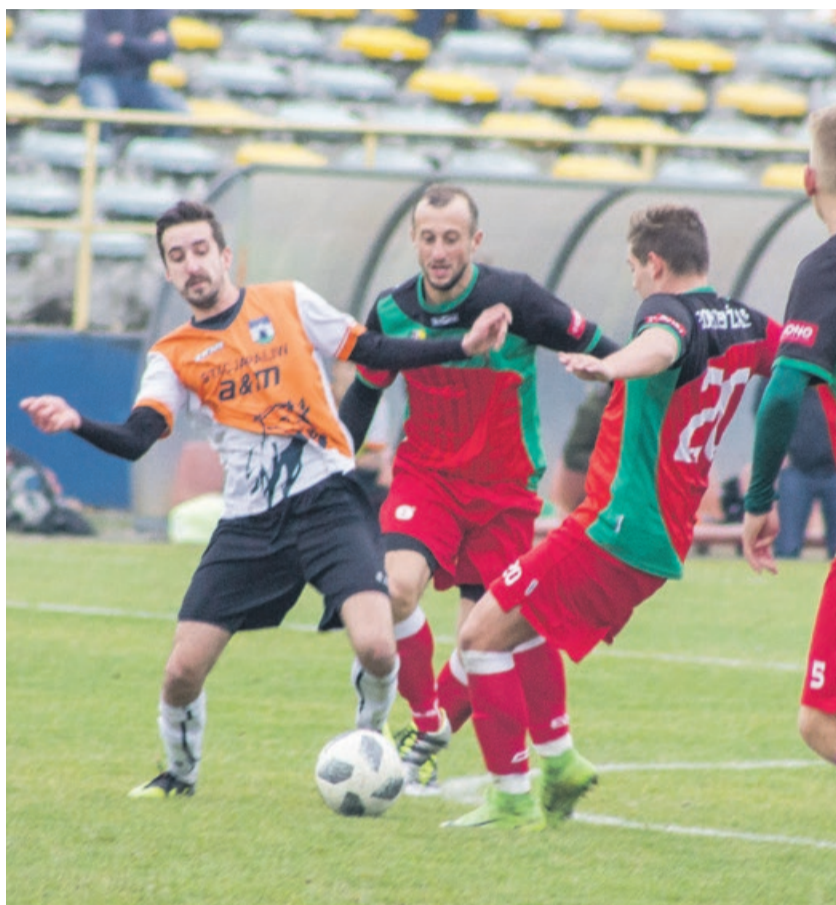
O takim zwycięstwie nikt nie powie, że zostało wymęczone