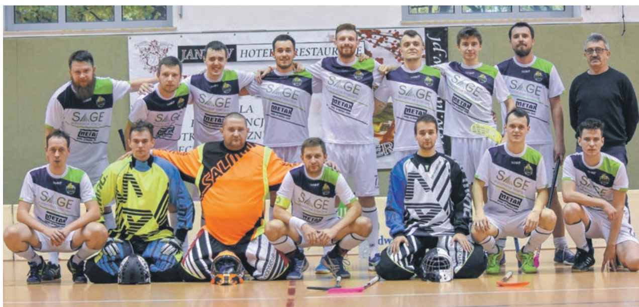
Ekstraligowy UKS Prus Żary

W klasyfikacji końcowej ubiegły sezon Prus zakończył na 11. miejscu. ATB