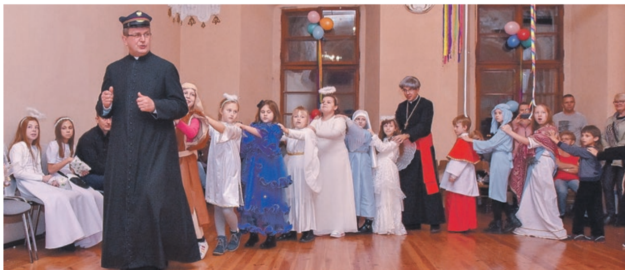
Jedzie pociąg z daleka, ze wszystkimi świętymi

Oj, działo się, działo. Na balu pojawili się święci: Franciszek, Dominik, Karol, Jadwiga, Elżbieta, Jan Paweł II i inni. Pierwszy bal Wszystkich Świętych przy