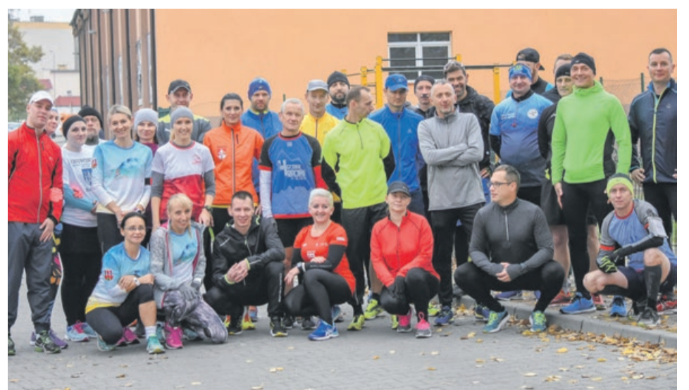
Trening przed Biegiem Niepodległości w Żaganiu

BIEGI Amatorzy biegania uczczą setną rocznicę odzyskania niepodległości w sposób najbardziej im odpowiedni, czyli po prostu biegając. Imprez jest sporo.