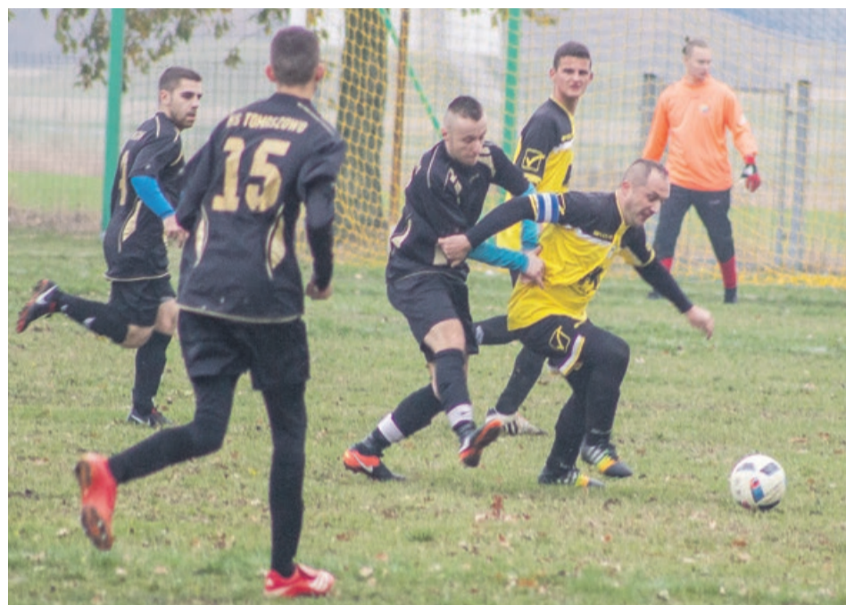
Dla Piasta Lubanice mecz z LZS KS Tomaszowo zakończył się wygraną 5:1

W meczu z Tomaszowem bramki dla Piasta strzelał trzykrotnie Szymon Myśków oraz dwukrotnie Dariusz Kmiecik. ATB