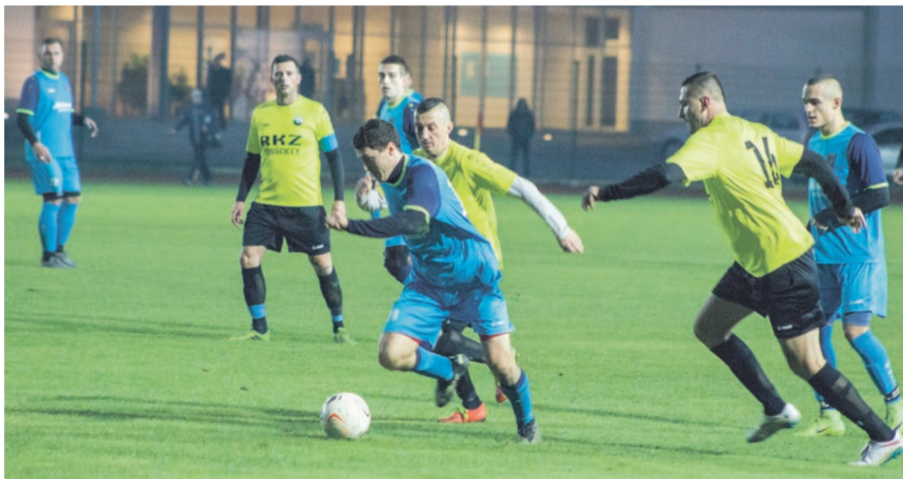
Czarni rozprawili się ze Schnugiem Chociule 5:2, ale nie był to bardzo wymagający przeciwnik

Wygląda na to, że Żary mogą walczyć z Żaganiem ramię w ramię o czwartoligowy awans i tylko jedno miasto wygra. No chyba, że Iłowa przestanie nagle grać w piłkę i zacznie wszystko przegrywać. Tylko jakoś trudno to w ogóle brać pod uwagę. ATB