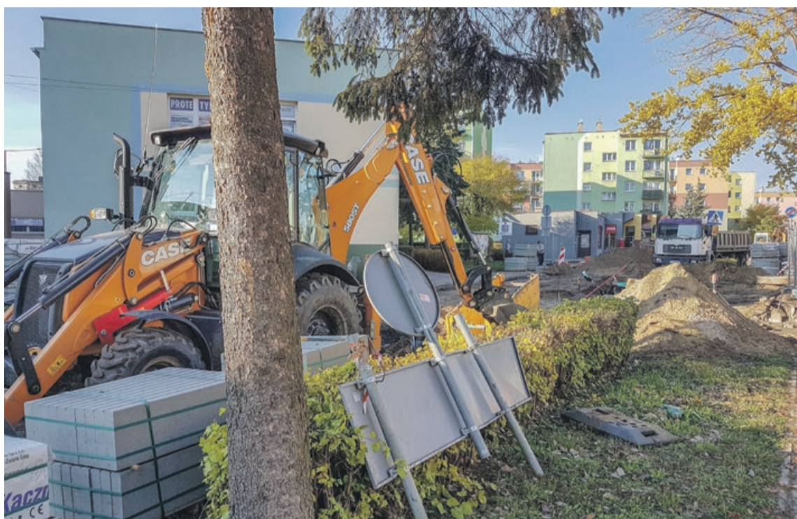
Do końca prac pozostał niespełna miesiąc

- Ubolewam nad tym i przepraszam mieszkańców za te przedłużające się niedogodności, ale mam nadzieję, że wszystkie nasze zabiegi i działania spowodują, że droga będzie jak najbardziej funkcjonalna i spełni oczekiwania użytkowników - dodaje Rafał Fularski. ATB