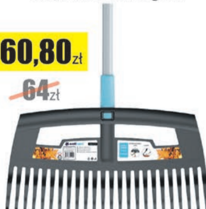
Grabie małe do liści 430 Cellfast