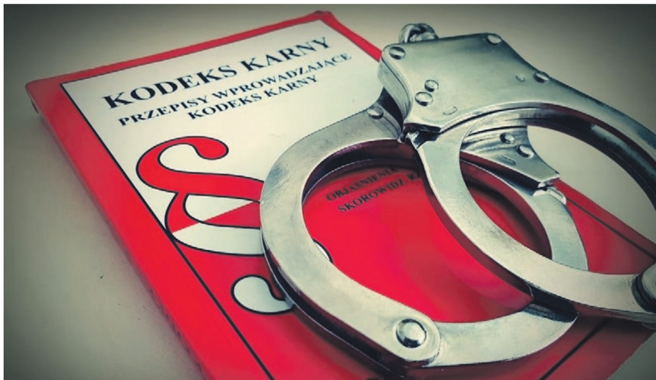
Z rozbju grozi nawet 12 lat więzienia

Policja po raz kolejny apeluje do starszych, samotnie mieszkających osób o czujność, rozsądek i rozwagę. Przestępcy bezwzględnie wykorzystują gościnność seniorów, chęć niesienia pomocy innym. Policja prosi, aby starsze osoby nie wpuszczały do domu obcych osób oraz nie wykonywały przelewów bankowych na wskazane przez oszustów telefonicznych konta. PAS