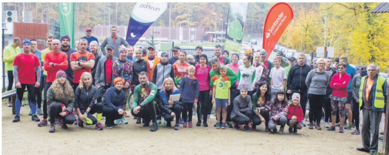
W ostatniej edycji żarskiego parkrunu po Zielonym Lesie wzięła udział prawie setka biegaczy