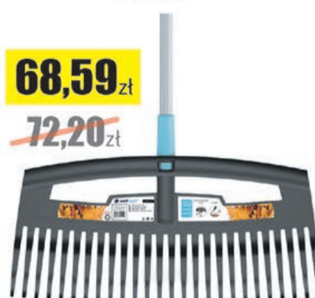
Grabie duże do liści 525 Cellfast