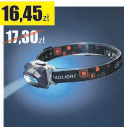
Latarka czołowa TS-1867 Tiross