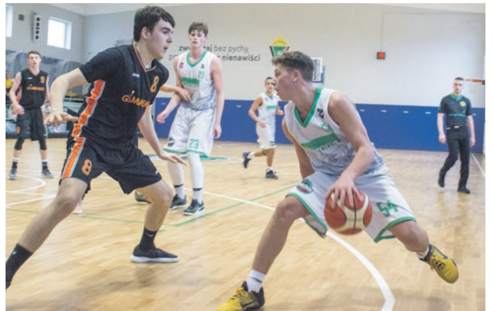
W sali przy ul. Zwycięzców też można obejrzyć ciekawe sportowe zmagania

KOSZYKÓWKA W Żarach rozegrano kolejny mecz w ramach dolnośląsko-lubuskiej ligi juniorów.