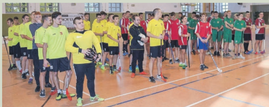
Do zawodów stanęło pięć reprezentacji poszczególnych szkół średnich

ZSO ŻARY - ZSB ŻARY 0:2 ZSE ŻARY - KLO ŻARY 6:0 ZSOiT ŻARY - ZSO ŻARY 1:4 ZSB ŻARY - ZSE ŻARY 3:1 KLO ŻARY - ZSOiT ŻARY 1:2 ZSO ŻARY - ZSE ŻARY 1:3 ZSOiT ŻARY - ZSB ŻARY 1:7 ZSO ŻARY - KLO ŻARY 2:4 ZSE ŻARY - ZSOiT ŻARY 3:0 ZSB ŻARY - KLO ŻARY 4:1 ATB