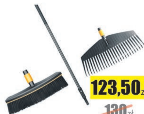
Zestaw szczotka + grabie + trzonek Fiskars