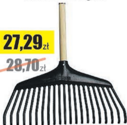
Grabie plastikowe SOLID L23 Fiskars