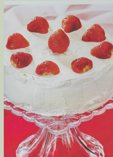
Torcik możemy udekorować kolorowymi owocami

Można jeść od razu lub schłodzić przed podaniem.