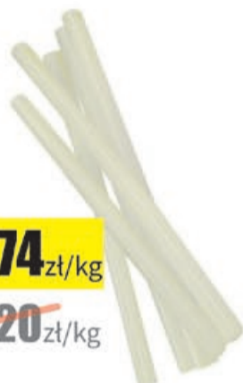
Klej do pistoletu uniwersalny Modeco