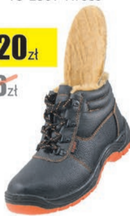
Trzewiki ocieplane 106, TEXAS BOA Urgent