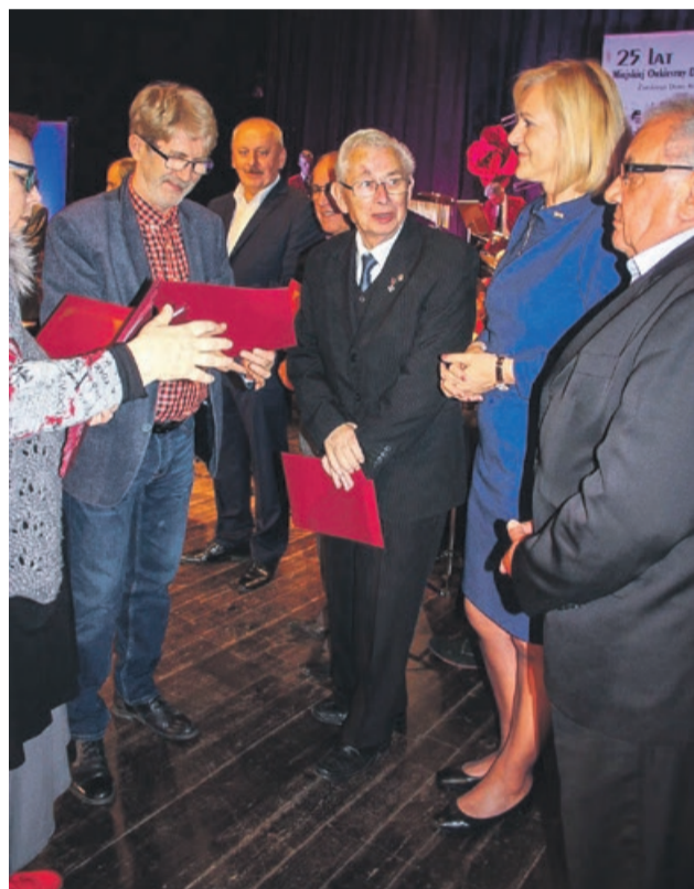
Podziękowania, rozmowy, wspomnienia