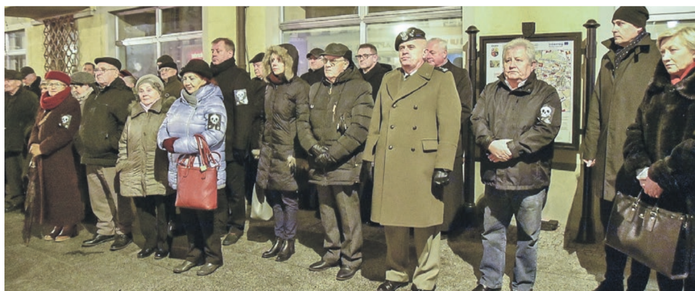
W Rynku licznie stawili się mieszkańcy