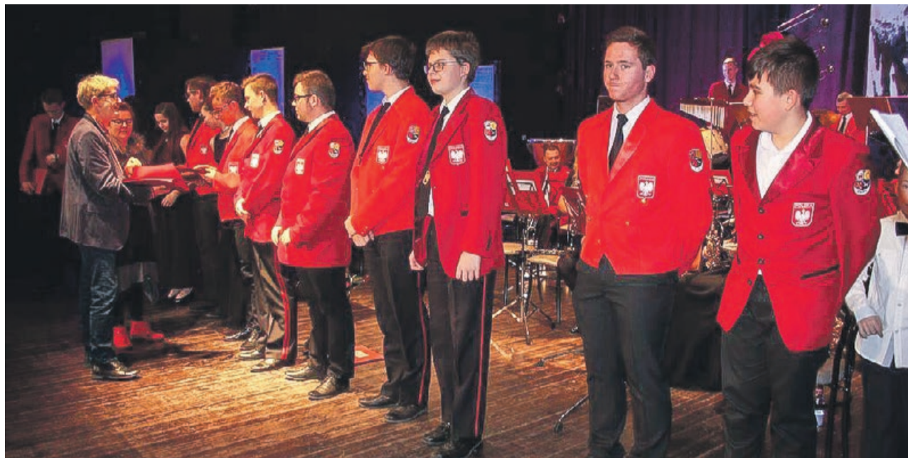
Młodzi muzycy to przyszłość zespołu