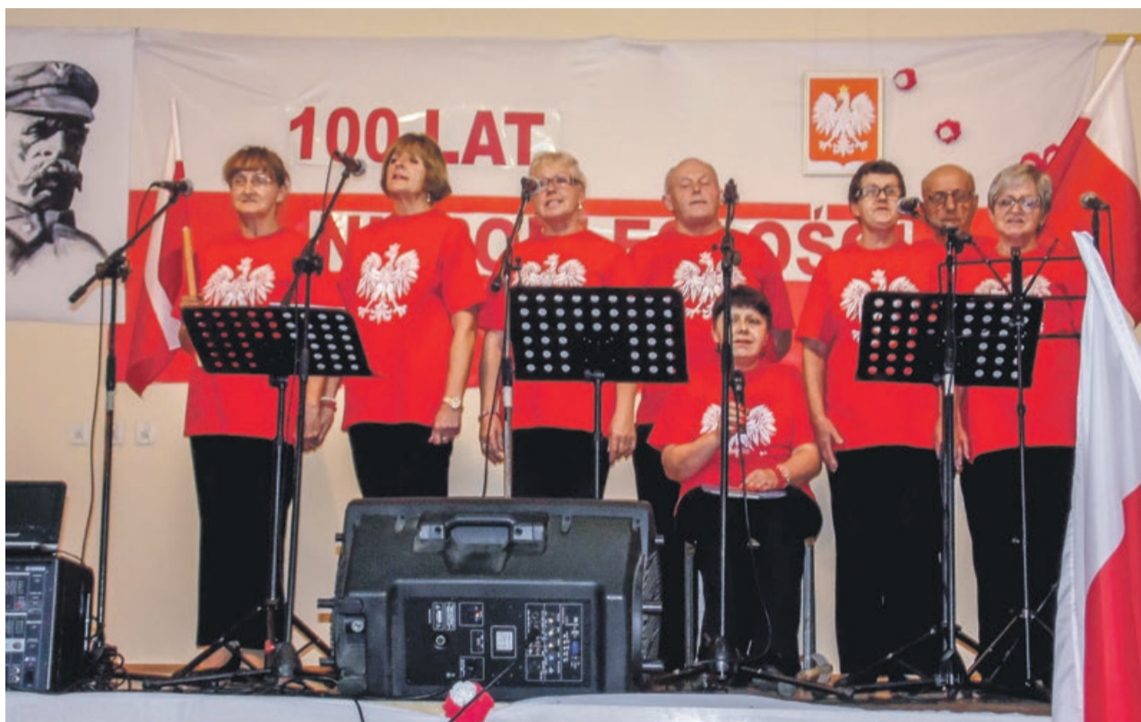
Karolinki z Grabika w patriotycznych barwach