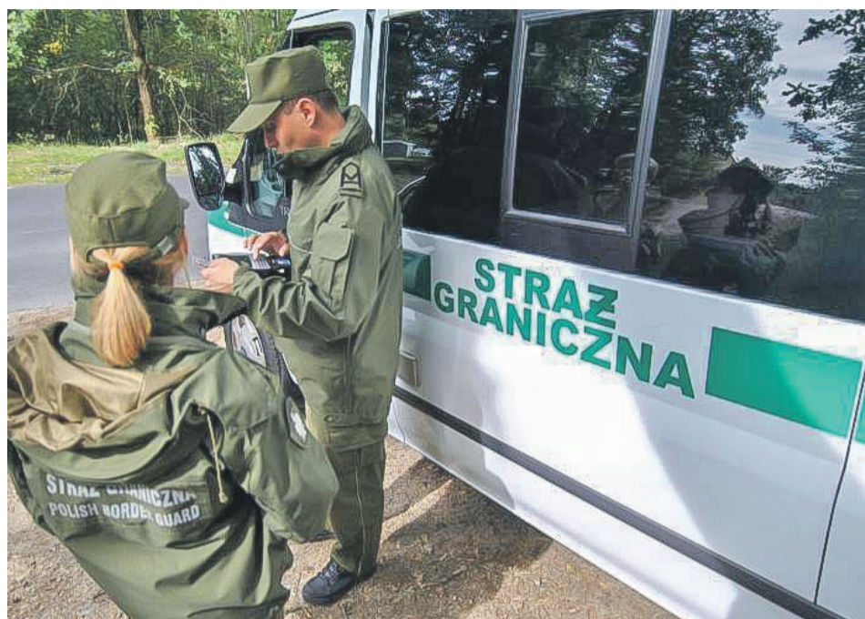
Kontroli mogą się spodziewać wjeżdżający do Polski

Kontrola została przywrócona w czwartek, 22 listopada i potrwa do 16 grudnia. Nie oznacza to jednak powrotu przejść granicznych i szlabanów. Kontrola realizowana jest w oparciu o patrole Straży Granicznej z wykorzystaniem specjalistycznego sprzętu, czyli mobilnych terminali i tzw. schengenbusów. Pojazdy te mają wyposażenie umożliwiające funkcjonariuszom SG przeprowadzenie kontroli granicznej poza przejściem granicznym. Kontrolowane są jedynie osoby wjeżdżające do Polski. Odbywa się to w sposób wyrywko-