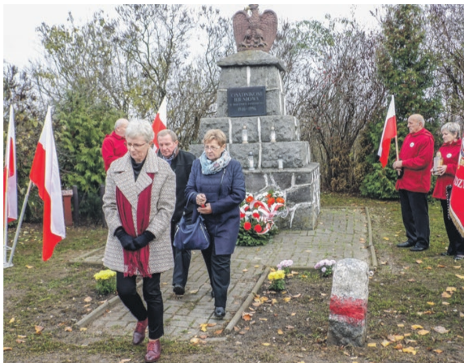
W tym wyjątkowym czasie nie mogło zabraknąć kwiatów dla tych, którzy po wojnie osiedlili się w Bieniowie