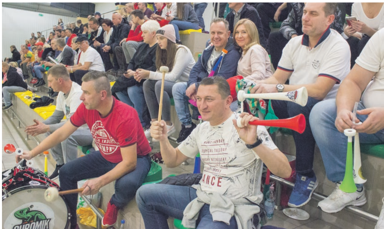
Przy takim dopingu wygrywa się łatwiej