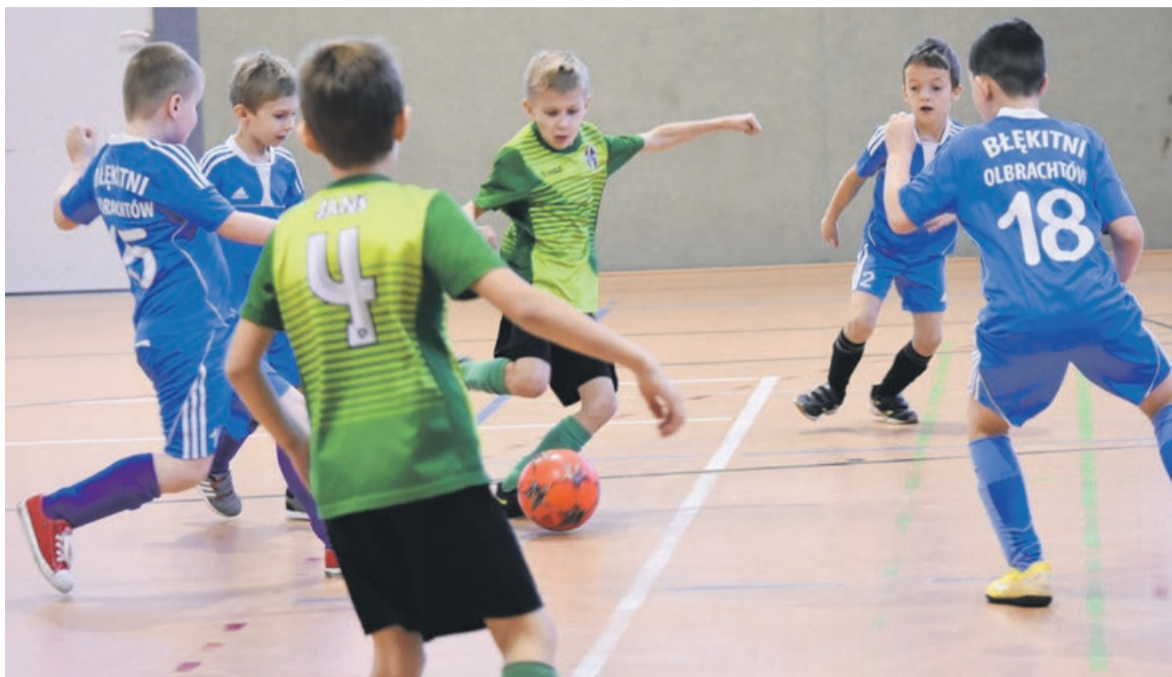
Młodzi piłkarze przyjechali na turniej z wielu miejscowości