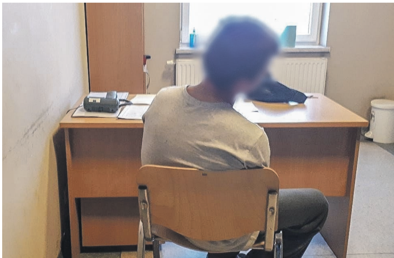
Zatrzymany nie przyznawał się do posiadania narkotyków

Mieszkaniec powiatu żagańskiego został przesłuchany przez śledczych. Narkotyki zostały zabezpieczone. Za posiadanie narkotyków zgodnie z ustawą grozi kara pozbawienia wolności do 3 lat. PAS