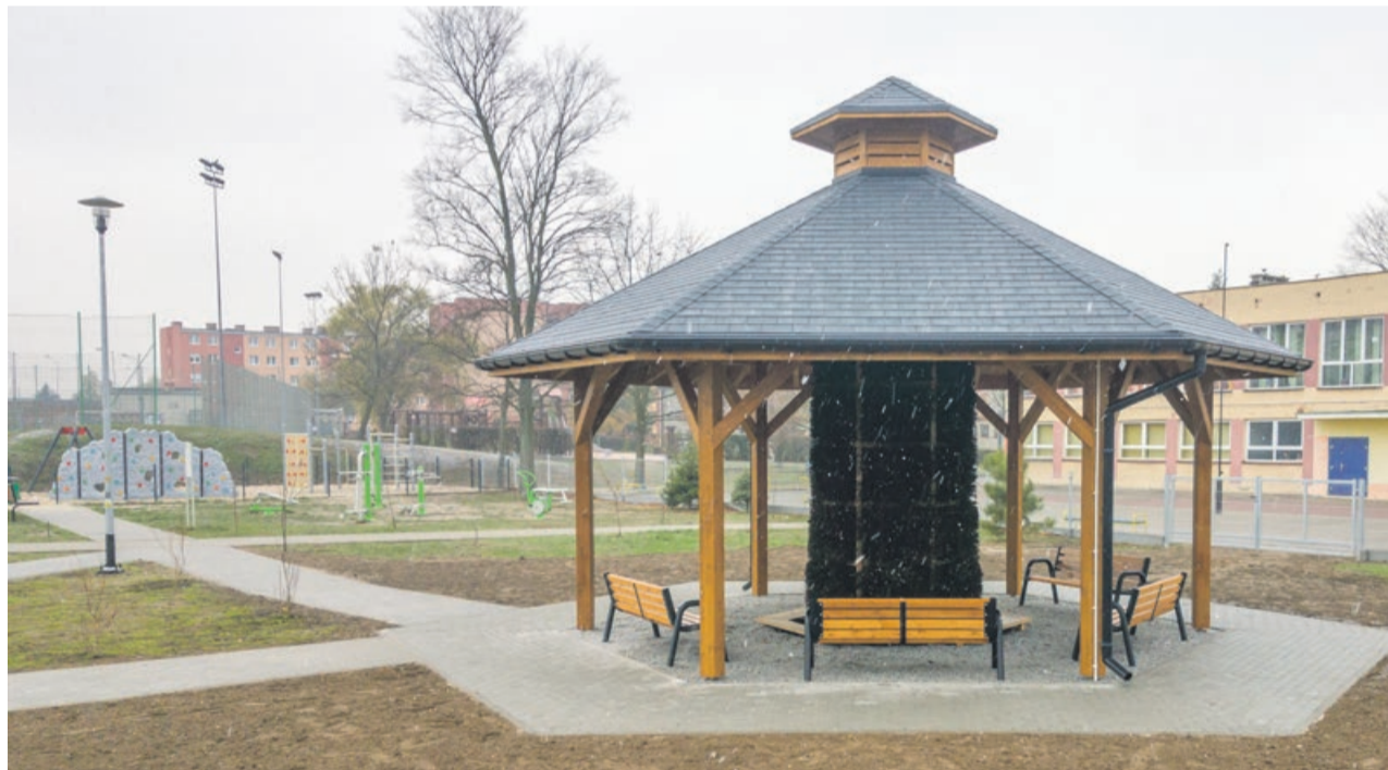
Tężnia solankowa przy ul. Zwycięzców uruchomiona zostanie 1 kwietnia 2019 roku