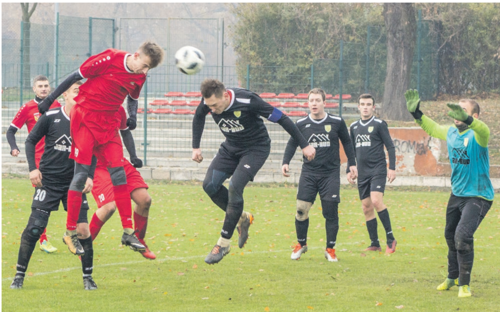
Budowlani II przypieczętowali swoją pozycję w tabeli wygrywając z WKS Łaz 6:1

W ostatnim meczu bramki dla Budowlanych strzelali: Patryk Kozioł (x2), Tomasz Bahyrycz, Tymoteusz Dynowski (x2) oraz Dawid Urban. Strzelcem honorowej bramki dla WKS był Kacper Jurkiewicz. ATB