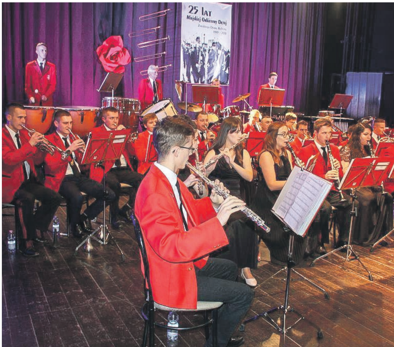
Szyk, prezencja, umiejętności