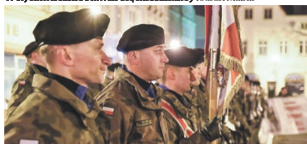
Uroczystość przebiegła w asyście honorowej żołnierzy 11. Lubuskiej Dywizji Kawalerii Pancerniej im. Króla Jana III Sobieskiego