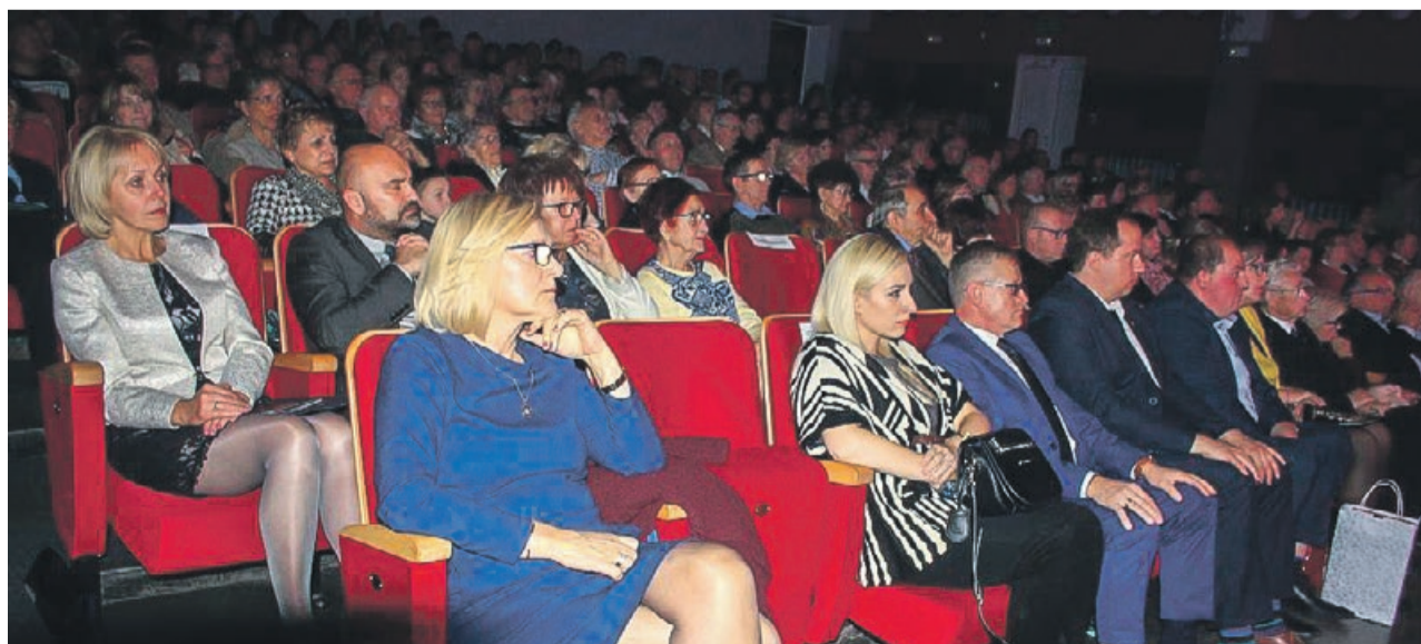
Przyjaciół orkiestry nie brakuje