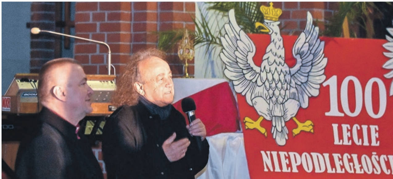
Rocznica 100-lecia odzyskania niepodległości była wyjątkową okazją na zorganizowanie koncertu

Tytuł koncertu „Zmartwychwstanie” w bezpośredni sposób nawiązywał do 100. rocznicy odzyskania Niepodległości Państwa Polskiego. Józef Skrzek w swojej muzyce zapre-