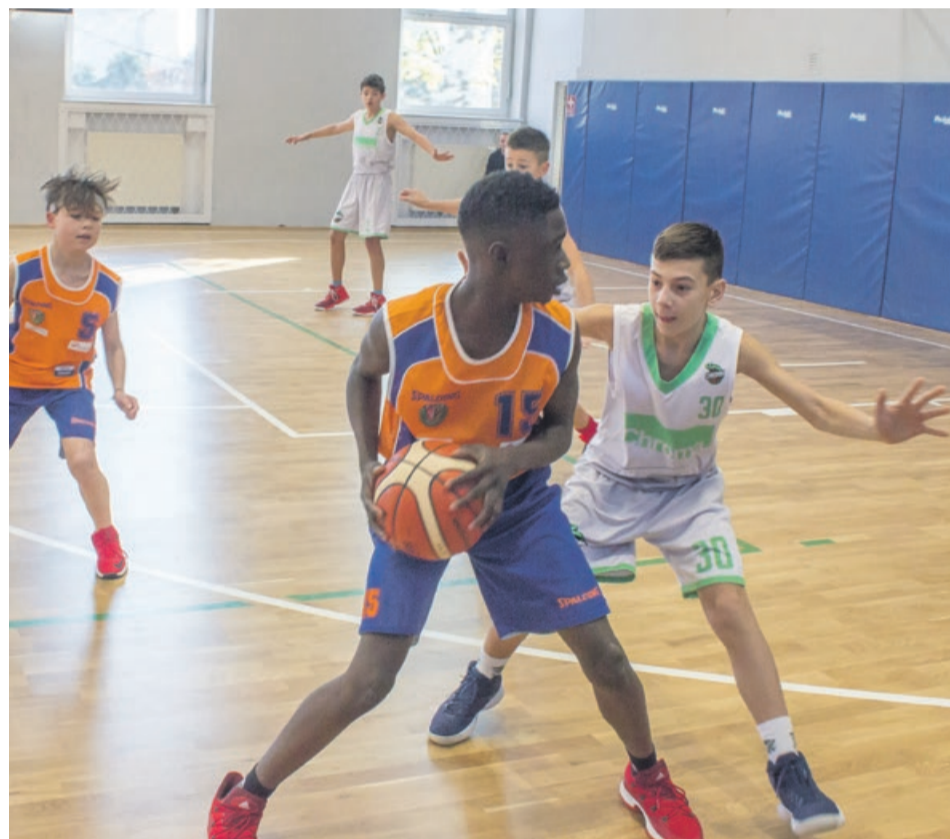
Młodych koszykarzy można oglądać w sali przy ul. Zwycięzców w Żarach

Mniej szczęścia mieli zawodnicy rocznika 2007 i młodsi, którzy zainaugurowali sezon na wyjeździe. W konfrontacji z WKK I Wrocław przegrywają 62:22, natomiast mecz z WKK II Wrocław zakończył się przegraną 45:58. ATB