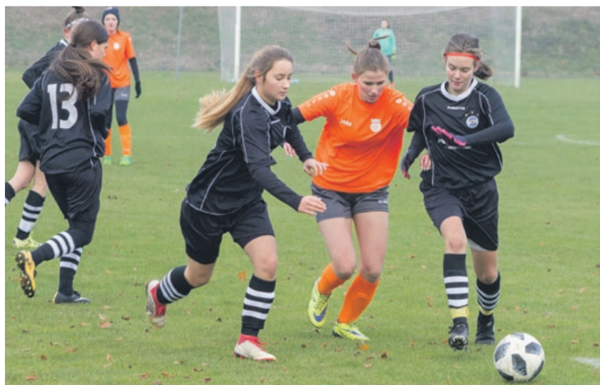
Lubsko przegrało z Gorzowem 1:5

Liderkami są piłkarki KKP Warta - Maks z Gorzowa Wielkopolskiego. Drugą pozycję zajmują reprezentantki żarskiego Promienia. ATB