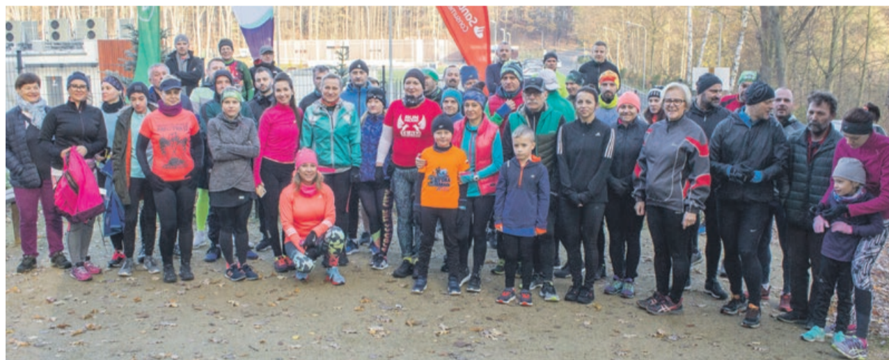
Tradycyjne zdjęcie przed startem