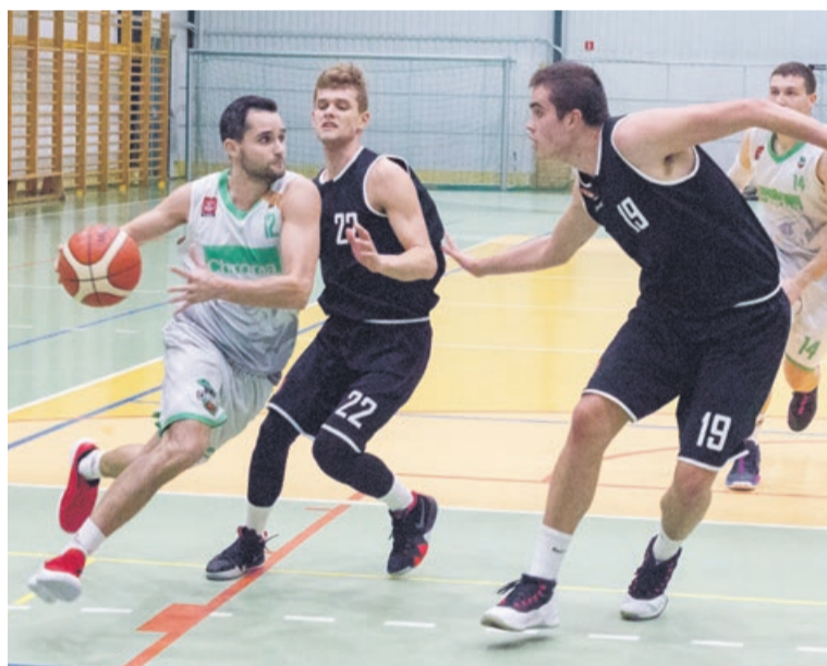
Każdy mecz Chromy to dynamiczne i widowiskowe wydarzenie sportowe