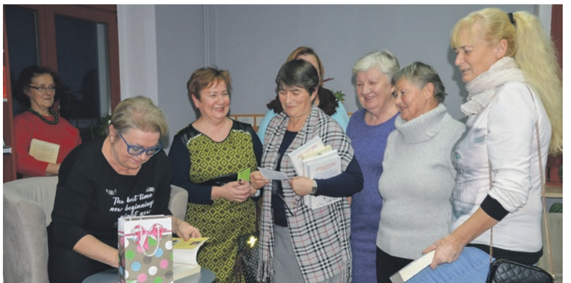
Zainteresowanych otrzymaniem autografu nie brakowało

nad rozlewiskiem” cieszy się dużą popularnością, ale sama autorka dystansuje się od telewizyjnej produkcji, która nie do końca spełniła pokładane w niej nadzieje i oczekiwania autorki. Sporą część spotkania autorka poświęciła swoim podróżom po świecie, w szczególności sposób zwracając uwagę na państwa azjatyckie - Koreę Południową i Japonię. W Korei jakiś czas swojego życia mieszkała, jest zafascynowana kulturą i kuchnią tego kraju. Ciekawe i żywe spotkanie zakończyło się obłędzeniem autorki, ponieważ zainteresowanych uzyskaniem autografu nie brakowało. PAS