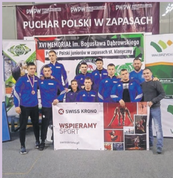
Żarski klub w Wałbrzychu