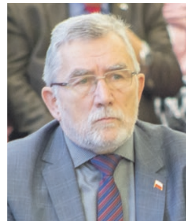
Tadeusz Płóciennik nie otrzymał żadnej funkcji