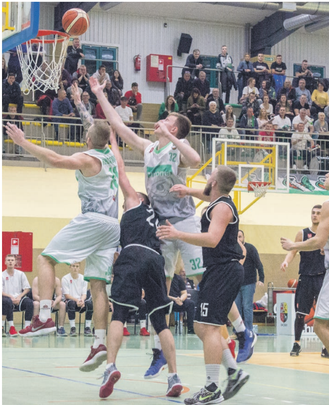
Dotychczasowe mecze ligowe pokazały, że do poziomu Chromy ciężko doskoczyć