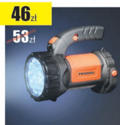
Latarka akumulatorowa TS-1871 Tiross