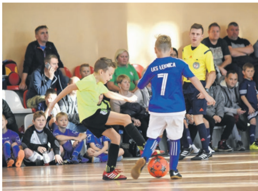
Piłkarskie zmagania były bardzo zacięte