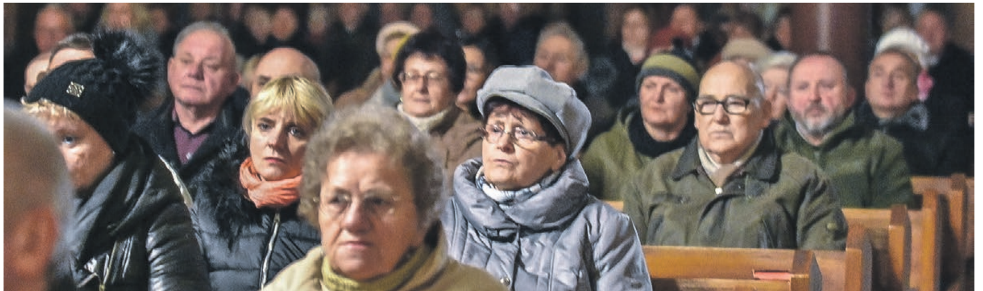
Publiczność w skupieniu wysłuchiwała koncertu