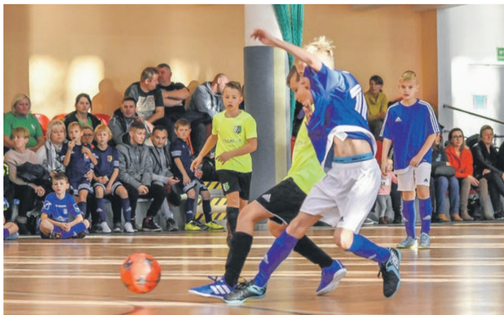
Zawodnikom towarzyszyło liczne grono rodziców fot. nadesłane