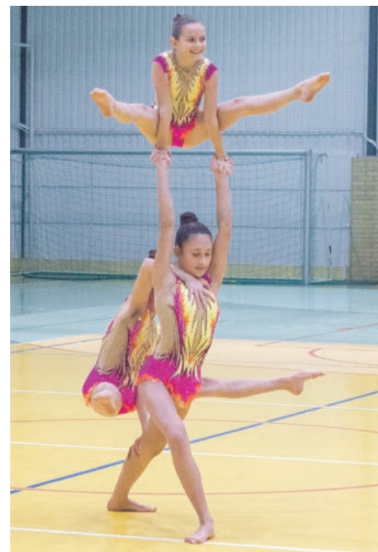
Dodatkowa atrakcja w przerwie. Swoje umiejętności zaprezentowała „Piramida”