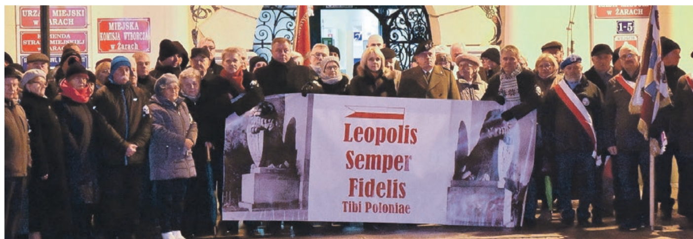
Zawsze wierni