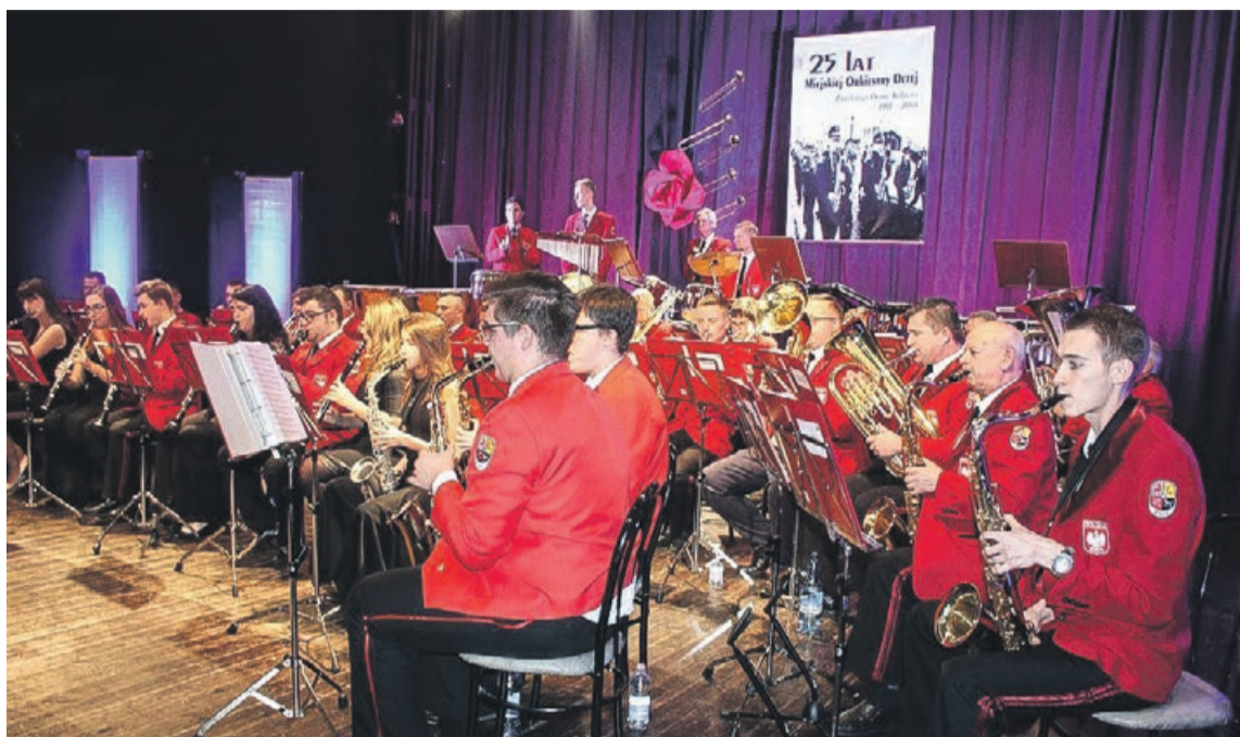
Orkiestra w pełnym szyku

Orkiestra skupia młodzież z Żar i okolic, która edukuje się w szkołach podstawowych, średnich, a nawet na wyższych uczelniach. Uczniowie nabywają od podstaw umiejętności muzycznych pod kierunkiem instruktorów. Poglębiają wiedzę z zakresu teorii muzyki, a przede wszystkim uczą się pracy w zespole. Po kilku miesiącach intensywn-