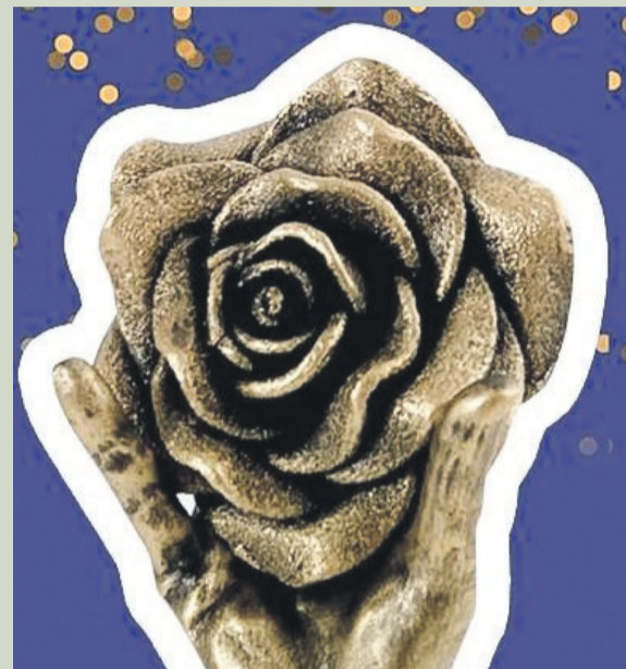
Laureaci otrzymają statuetki

ŻARY Do 8 grudnia można zgłaszać kandydatury do nagrody „Żarskiej Róży Biznesu”. Nagrody gospodarcze Społecznej Rady Przedsiębiorców i Burmistrza Miasta Żary będą wręczane już po raz czwarty.