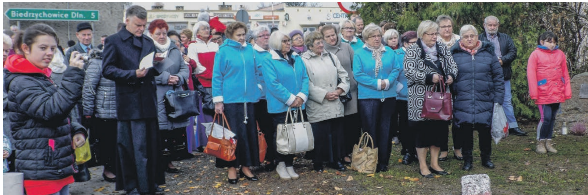
Mieszkańcy, goście i uczestnicy festiwalu, po mszy udali się pod pomnik Osadników Bieniowa