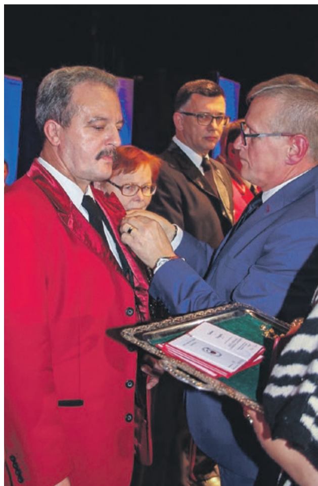
Zasłużeni dla orkiestry