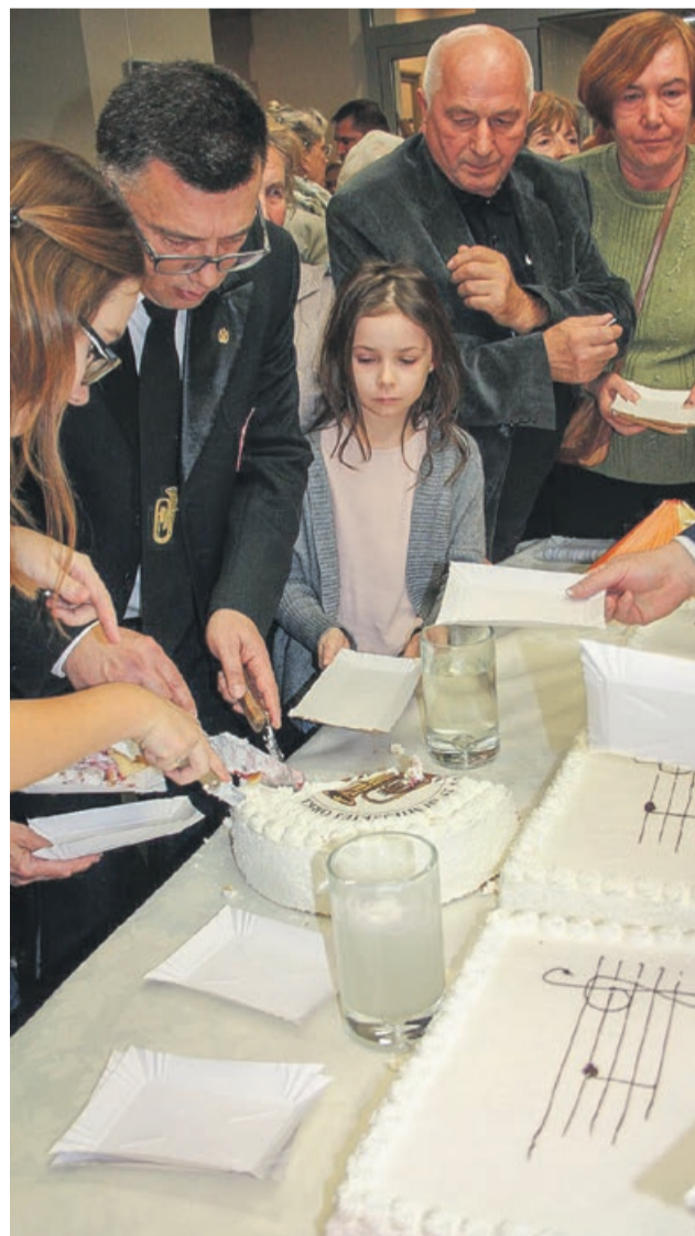
Przy krojeniu tortu też ktoś musi dyrygować

Orkiestrze wypada życzyć kolejnego, udanego ćwierćwiecza. oprac. PAS