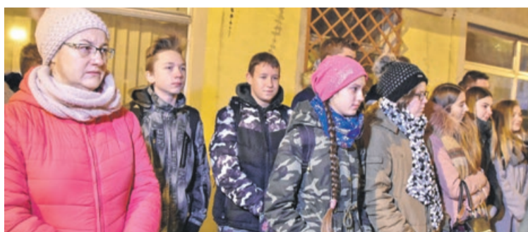
Nie zabrakło młodzieży