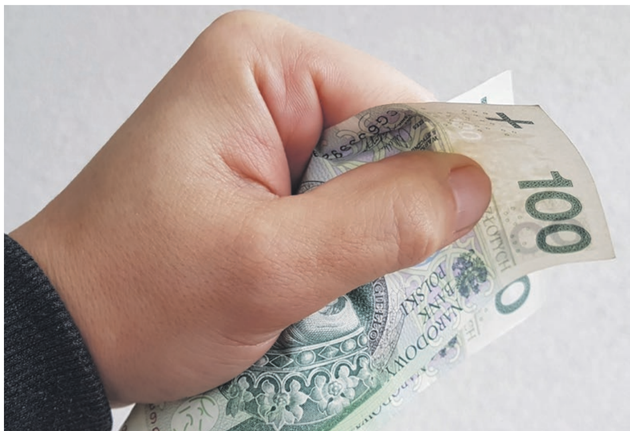
Poszkodowani mogą liczyć na większe kwoty odszkodowań

Za każdy procent trwałego lub długotrwałego uszczerbku na zdrowiu Zakład Ubezpieczeń Społecznych wypłaci 917 złotych, a nie jak dotąd 854 złote. Jednorazowe odszkodowanie związane z wypadkiem przy pracy lub chorobą zawodową przysługuje osobom objętym ubezpieczeniem wypadkowym. Uszczerbek na zdrowiu musi być stały albo długotrwały. Stały oznacza takie naruszenie sprawności organizmu, które nie rokuje szans na jakąkolwiek po-