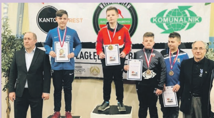
Agros zaprezentował się z bardzo dobrej strony