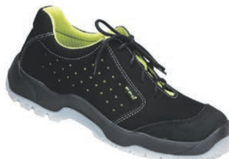
Półbuty ochronne Lime Line 682 PPO