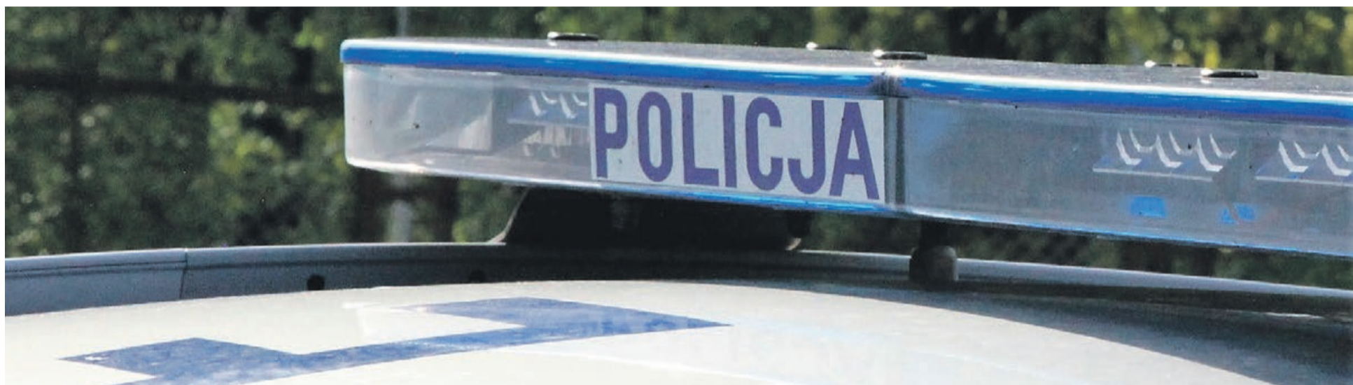
Alkohol sprawił, że poszukiwany wpadł w ręce funkcjonariuszy

zasnął i nie można było go obudzić. Wezwane na miejsce pogotowie ratunkowe w asyście policjanta przewiozło poszukiwanego na szpitalny oddział ratunkowy, gdzie stwierdzono u niego stan upojenia alkoholowego. Mężczyzna miał 5,6 promila w organizmie. Mieszkaniec pow. żarskiego pozostał w szpitalu do czasu wytrzeźwienia w asyście policjanta. Po wytrzeźwieniu trafił do aresztu. PAS