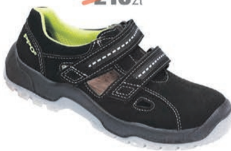
Sandały ochronne Lime Line 681 PPO