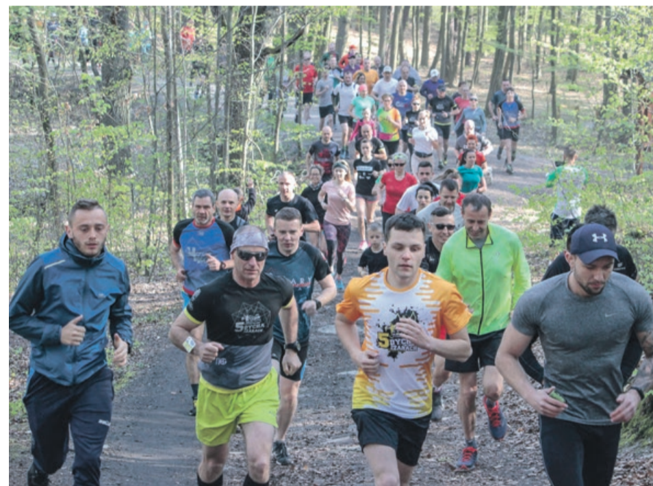
Przeszło stu biegaczy na starcie żarskiego parkrunu