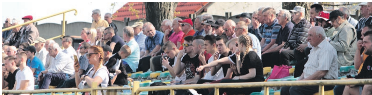
Promień zagrał tak, jak życzyli sobie tego kibice