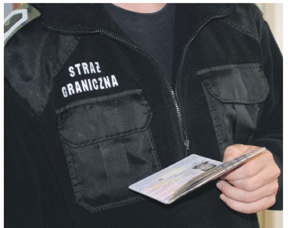
Wśród legitymowanych cudzoziemców 18 było w Polsce niezgodnie z przepisami

pobytowych. Kolejnych 6 cudzoziemców (3 obywatele Białorusi, 1 obywatela Turcji, Etiopii oraz Wietnamu) funkcjonariusze ujawnili lub zatrzymali podczas kontroli legalności pobytu. Obcokrajowcy przeterminowali swój pobyt na terytorium państw Schengen bądź nie posiadali dokumentów pobytowych, które pozwoliłyby im przekroczyć granicę i przebywać legalnie na terytorium Polski. PAS