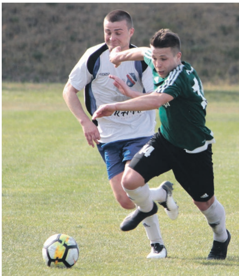
Nawet w meczu z drużyną z końca tabeli, swoje i tak trzeba wybiegać

Tymczasem Lech nagle się zrywa, pomimo agonii, i strzela gospodarzom dwie bramki. 71 i 73 minuta to było coś, co zaskoczyło chyba wszystkich. Jednak seria wyczerpała się po dwóch strzałach. 10 minut później Jakub Nowak dokada szóstą bramkę na konto Promienia i wtedy faktycznie było już po meczu. ATB