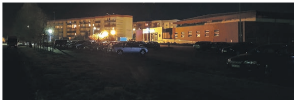
Oświetlenie ulicy Wieniawskiego nie dociera za daleko

prawiły nieco remonty ulic Moniuszki i Wieniawskiego. Jednak nowe parkingi szybko się zapełniły. Szukając wolnych miejsc, coraz więcej osób zostawia na noc swoje auta na parkingu przy pływalni Wodnik. Problemem jest jednak to, że oświetlenie tego parkingu zostaje na noc wyłączane.