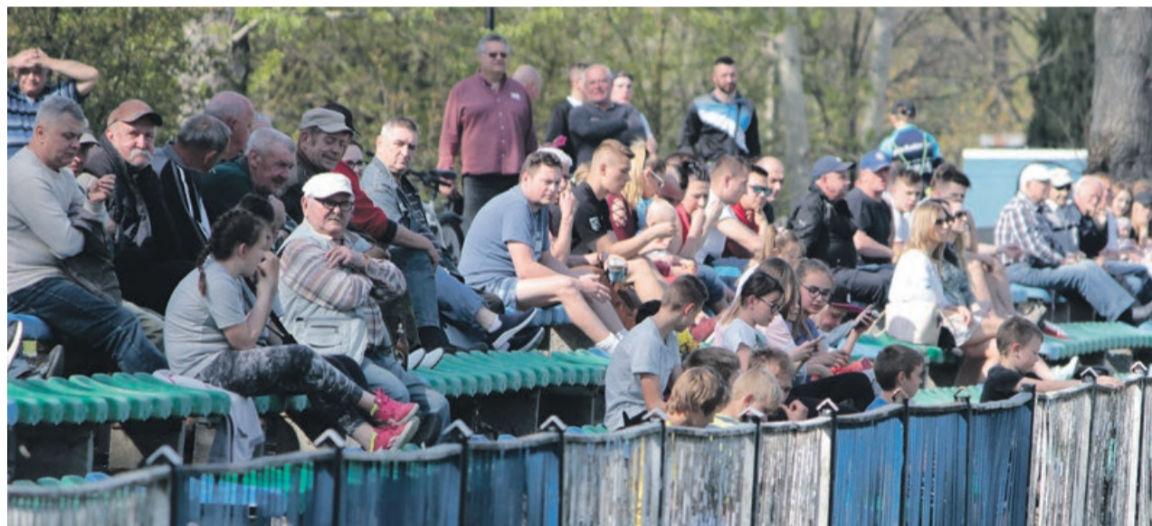
Po ubiegłorocznych kłopotach kibice Unii mają nadzieję na utrzymanie się w okręgówce