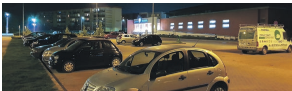
Na oświetlonym terenie każdy czuje się bezpieczniej

Miejmy nadzieję, że sprawa zostanie szybko załatwiona, zgodnie z oczekiwaniami osób korzystających z tego miejsca, a przy całonocnym oświetleniu więcej osób będzie zostawiać tam auta, bez strachu, że ciemności przyciągną wandalów i złodziei. ATB