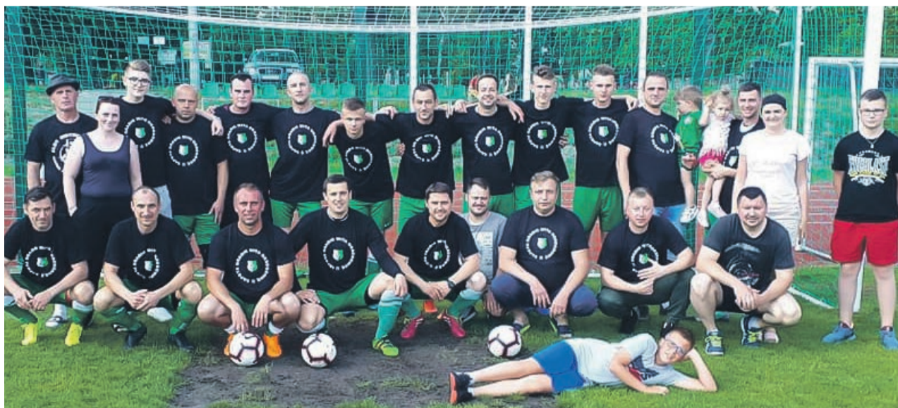
W Grabiku już świętują awans do okręgówki

Wychodzi na to, że już jesienią kibice w Grabiku zobaczą na swoim boisku między innymi takie zespoły, jak pobliski Promień Żary, sąsiednią Deltę z Sieniawy Żarskiej, czy chociażby Budowlanych z niedalekiego Lubka. Tak czy siak, w Grabiku na pewno nie muszą się wstydzić boiska. ATB