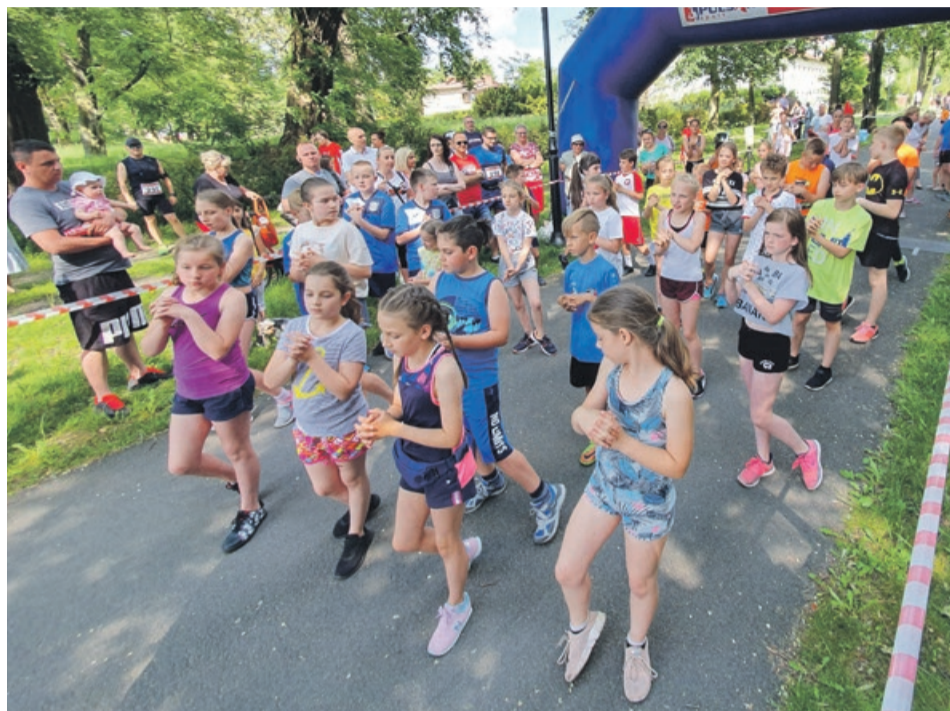
Rozgrzewka przed startem biegu dla dzieci