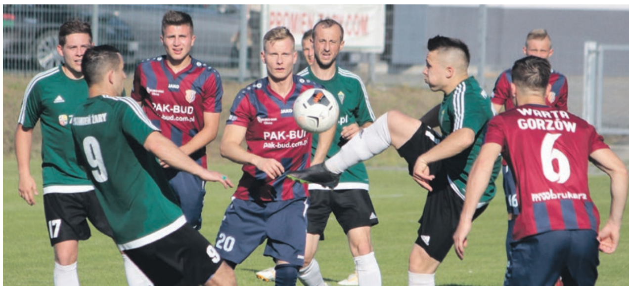
Promień zagrał w półfinałach Pucharu Polski, ale w okręgówce po raz kolejny zostaje

W klasie okręgowej Promień zajmuje obecnie trzecią lokatę i to już się nie zmienia do końca sezonu. Ani Promień nie dogoni awansujących Czarnych Żagań, ani Odra Nietków nie przegoni Promienia. ATB