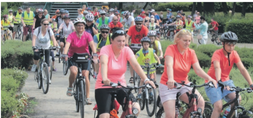
Rowerzyści wystartują z parku przy Al. Jana Pawła II

Planowany przebieg Ogólnopolskiej Akcji „Polska na rowery”: - godz.10.30 - zbiórka uczestników, omówienie trasy i warunków bezpieczeństwa, - godz.11.00 - start uczestników z parku miejskiego przy al. Jana Pawła II w Żarach, - godz.11.00-11.45 przejazd honorowy ulicami miasta Żary, - godz. 11.45-14.00 - przejazd uczestników na trasie Żary - Olbrachtów - Miłowice - Sieniawa Żarska - Górka -