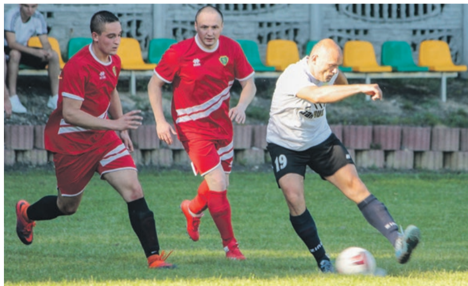
WKS Łaz 5:3 Nysa Przewóz

A na czele tabeli Budowlani II Lubsko, którzy wypracowali sobie sporą, siedmiopunktową przewagę, zapewniającą awans do klasy A. ATB