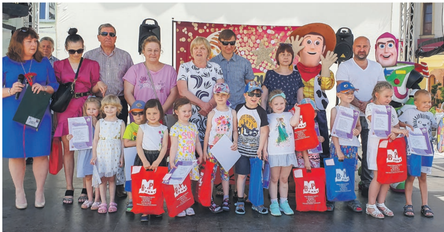
Oni dobrze wiedzą, że czytanie jest jak przygoda, którą każdy przeżywa na swój sposób