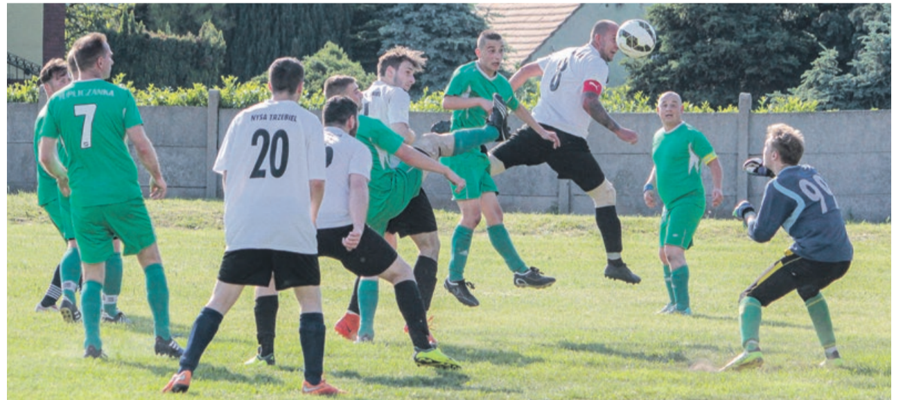
PIĘKA NOŻNA Tupliczanka Tuplice przegrała u siebie z Nysą Trzebiel 0:4