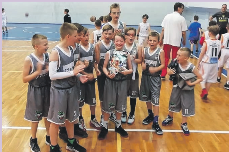
Czwarte miejsce w VII Ogólnopolskim Turnieju o Puchar Prezydenta Rudy Śląskiej w kategorii U-12