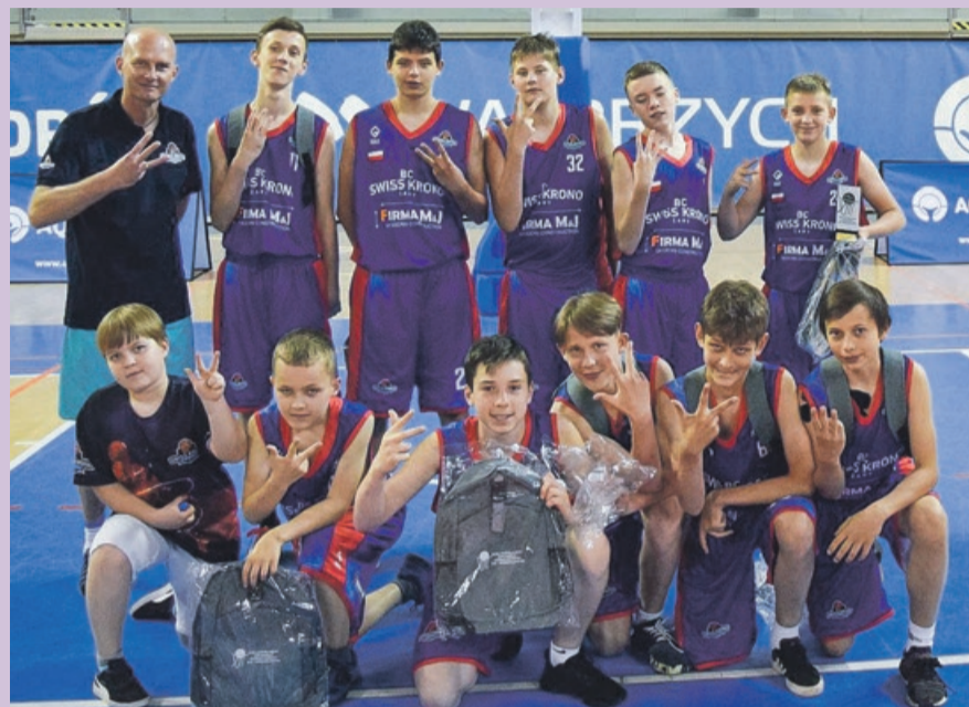
Reprezentacja BC Swiss Krono Żary trzecią drużyną dolnośląskiej ligi mini koszykówki chłopców U-13