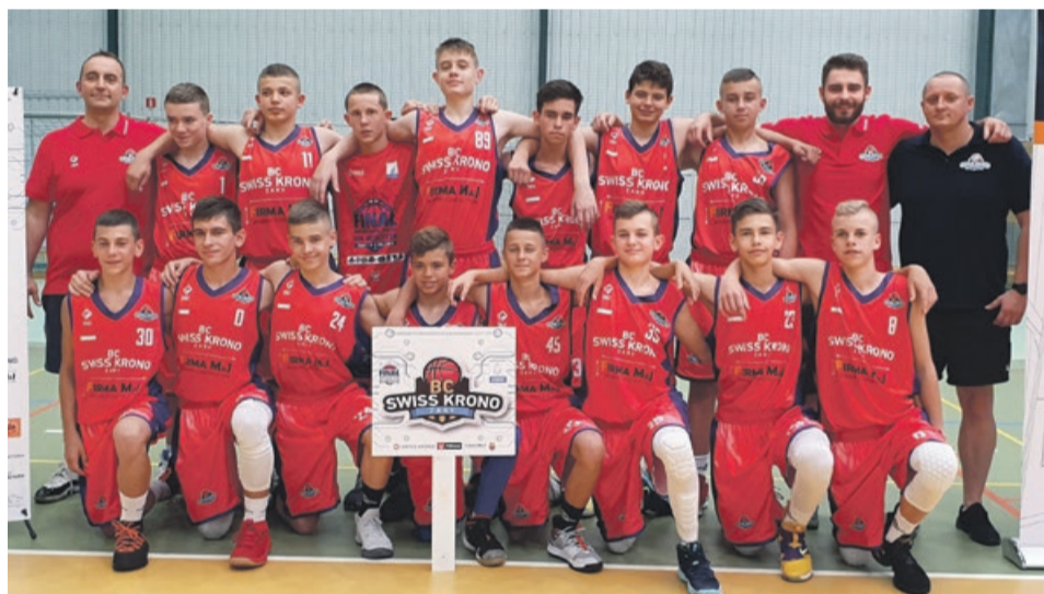
Żarski klub rywalizuje z siedmioma innymi najlepszymi drużynami w kraju