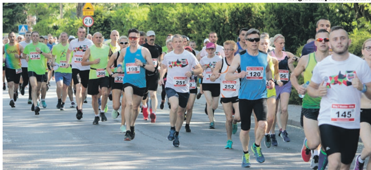
Wysoka temperatura nie pomagała biegaczom