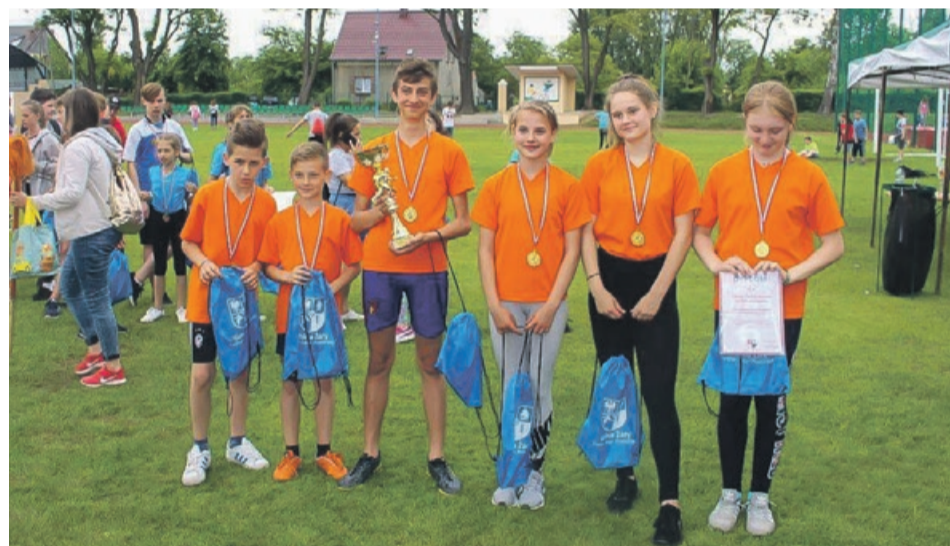
Zwycięska reprezentacja Szkoły Podstawowej w Olbrachtowie