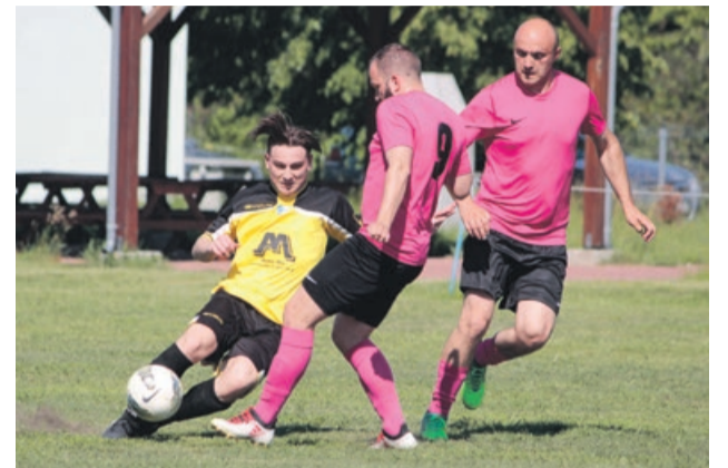
Mirostowiczanka wygrywa w Lubanicach