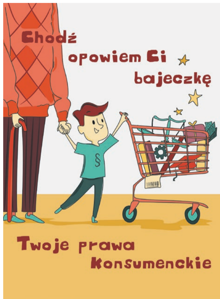
Taka wiedza przyda się nie tylko dorosłym

W ostatnim czasie Inspekcja Handlowa po raz pierwszy zbadała, czy w zabawkach elektrycznych nie ma niebezpiecznych substancji. Kontrola była częścią międzynarodowego projektu Joint Action 2016 współfinansowanego przez Komisję Europejską i koordynowanego przez organizację PROSAFE. Wzięło w nim udział 15 państw europejskich. W naszym kraju kontrola objęła 17 zabawek m.in. elektryczne