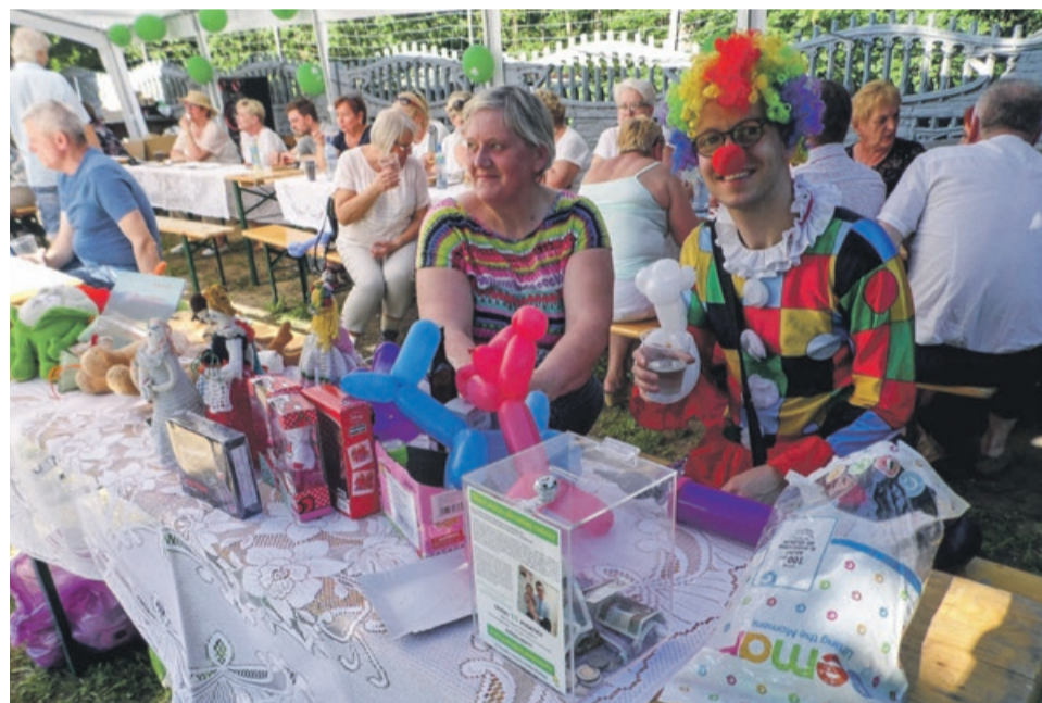
Akcja była udana, udało się zebrać 4951 zł. To będzie mała cegiełka do potrzebnej kwoty ok. 1,4 mln złotych