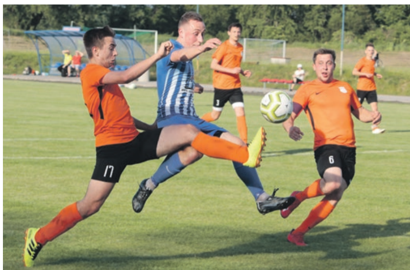
Budowlani Lubsko 0:5 Piast Iłowa

Po ostatnich zmianach regulaminu rozgrywek, w tym sezonie z okręgówki awansują dwie drużyny, a nie jedna, jak to było jeszcze w ubiegłym roku. Tak więc wraz z Piastem to klub z Żagania zagra jesienią w IV lidze. ATB