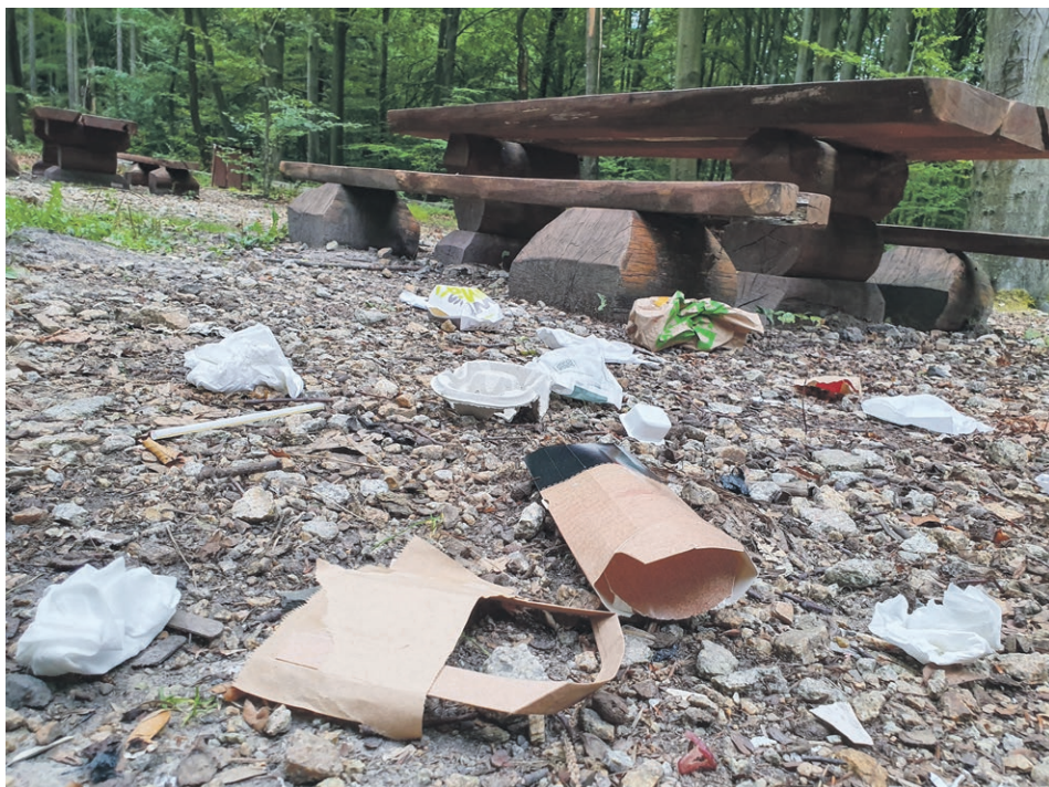
Jedno z miejsc postojowych w Zielonym Lesie

Opakowania po jedzeniu i napojach walają się na leśnych parkingach. Czy jest ktoś w stanie wytłumaczyć, dlaczego to wszystko leży na ziemi, gdy metr dalej stoi śmietnik? Czy to złośliwość, kompletny brak poszanowania wspólnego dobra, czy może zwyczajna głupota?