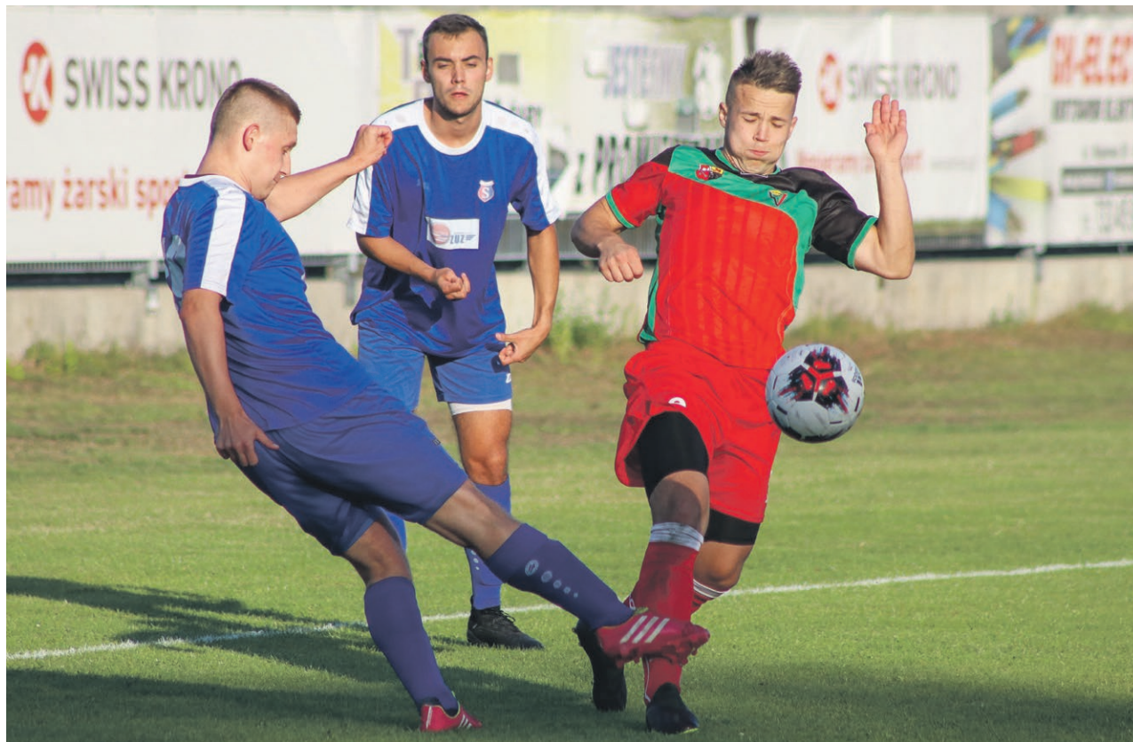
Zielonogórska klasa okręgowa