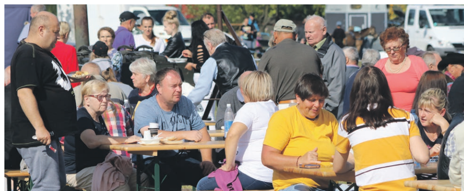
Można było pokibicować i pobiesiadować zarazem

Wszystko wskazuje na to, że za rok we wrześniu klacze śląskie pojawią się w Surowej już po raz piąty. ATB