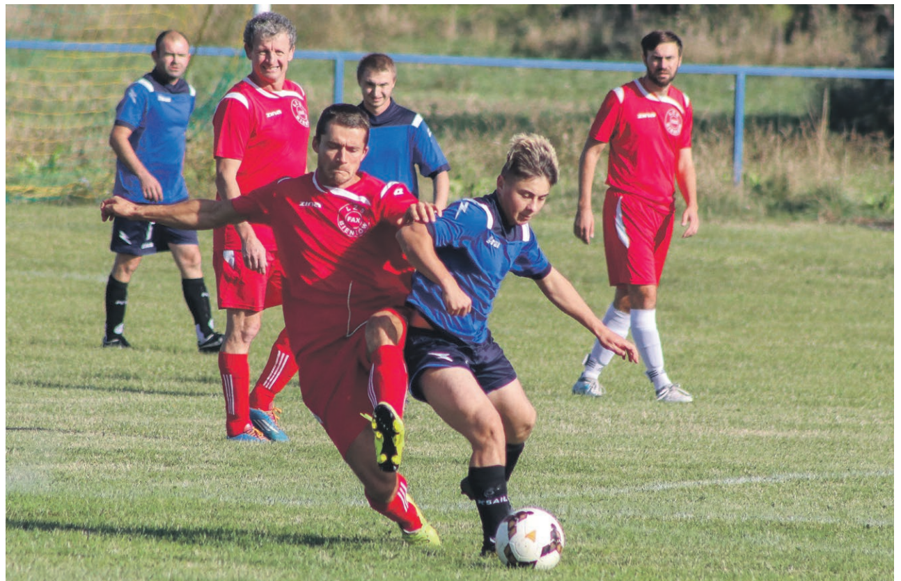
Żary: klasa B