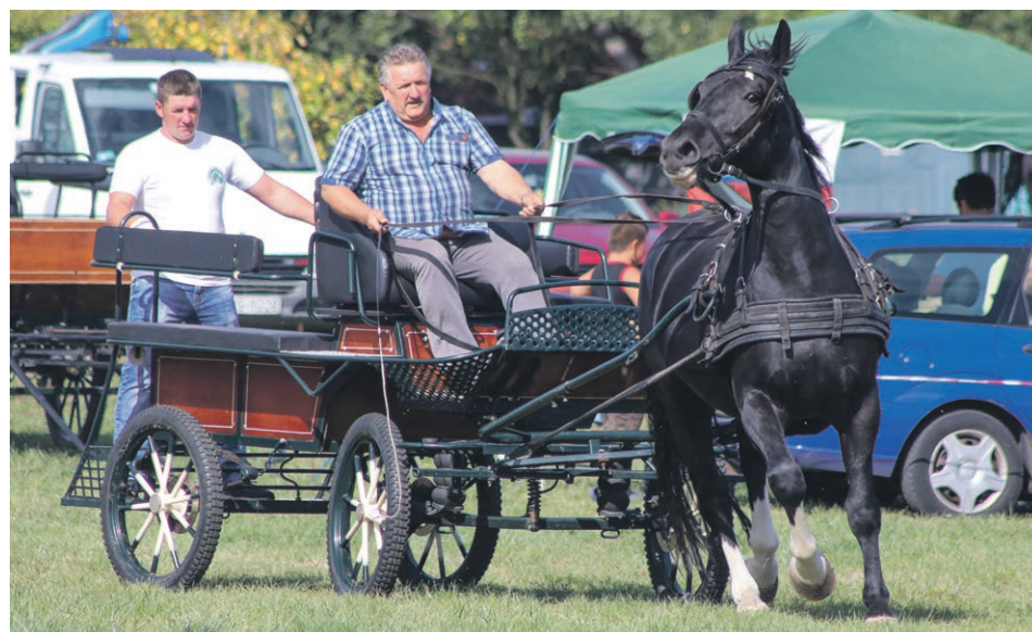
Zwycięzca podczas przejazdu konkursowego

GINA ŻARY Klacz Hili Stanisława Perczyńskiego zdobyła najwięcej punktów podczas tegorocznej, czwartej już z kolei Polowej Próby Zaprzęgowej Klaczy Śląskich w Surowej.