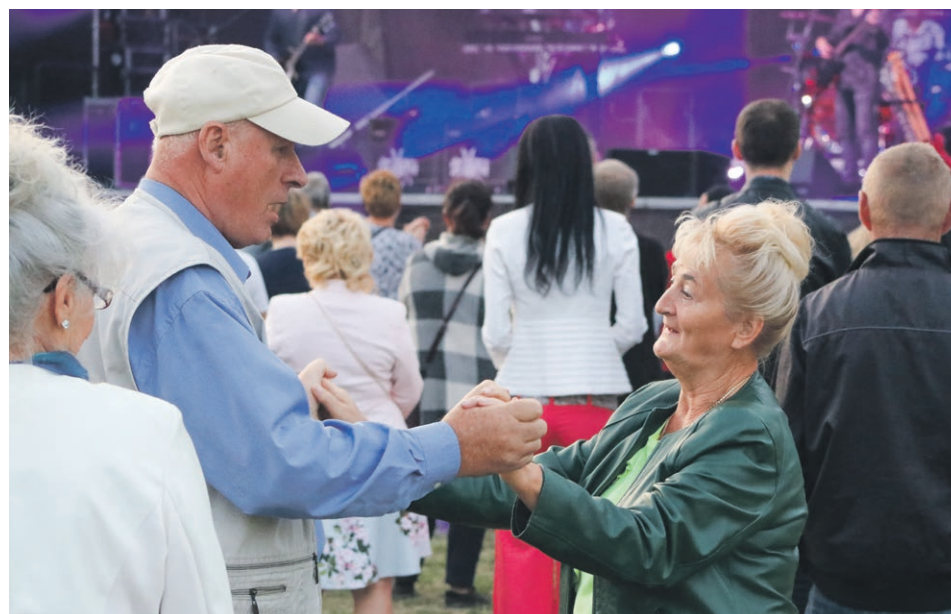
Aż się nogi rwą do tańca