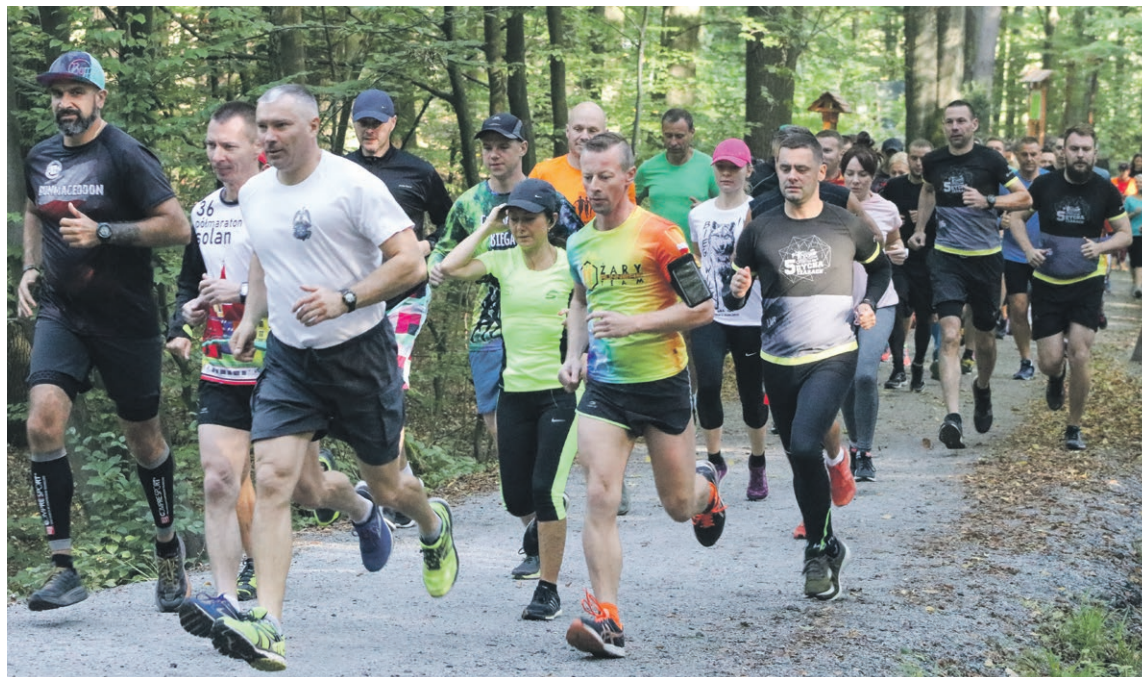
To był już 311. start żarskiego parkrunu

Parkrun to wreszcie wolontariusze, którzy co sobotę przychodzą pierwsi i wracają do domu jako ostatni. Bez nich żadnej imprezy by nie było. ATB