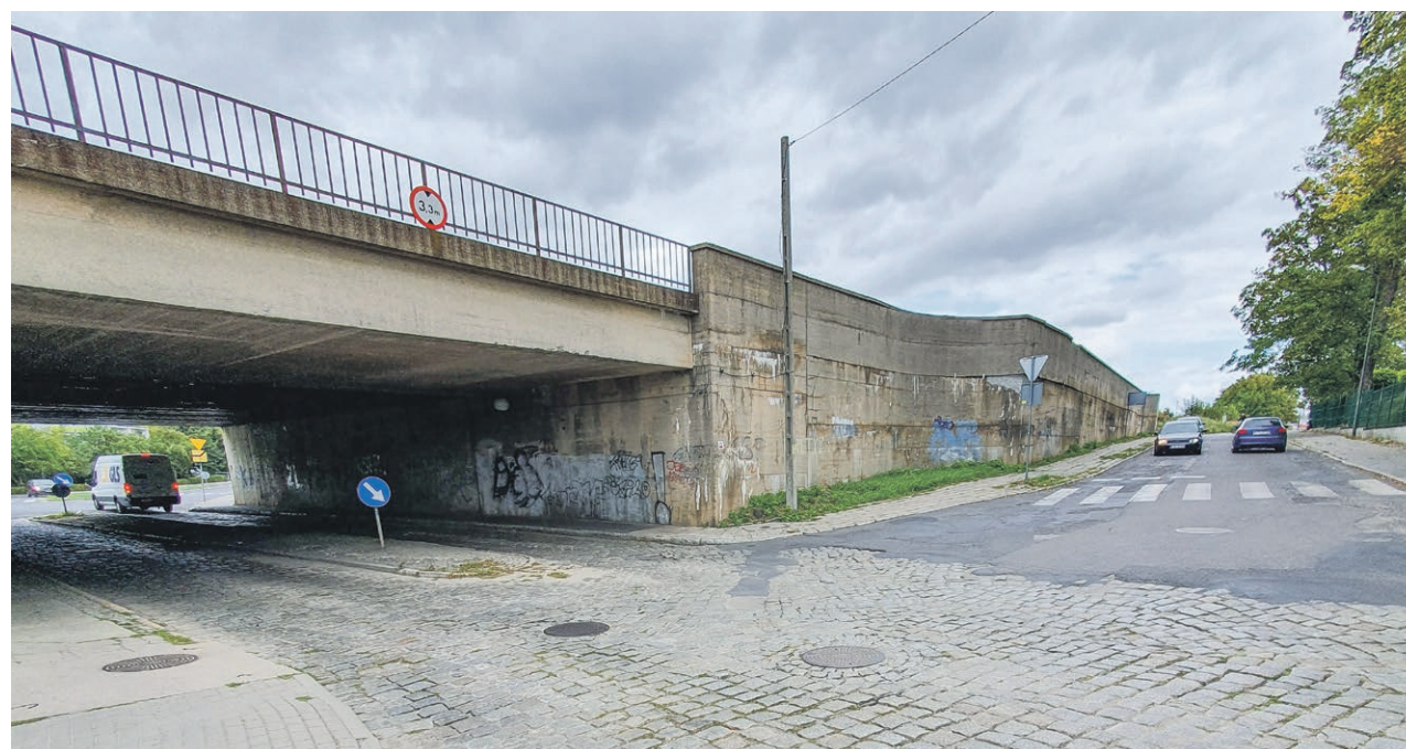
Przy okazji prac na ul. Kujawskiej wyremontowany zostanie także przejazd pod torami kolejowymi

Tak też się stało. Miasto Żary otrzymało dofinansowanie w wysokości około 8,3 miliona złotych do