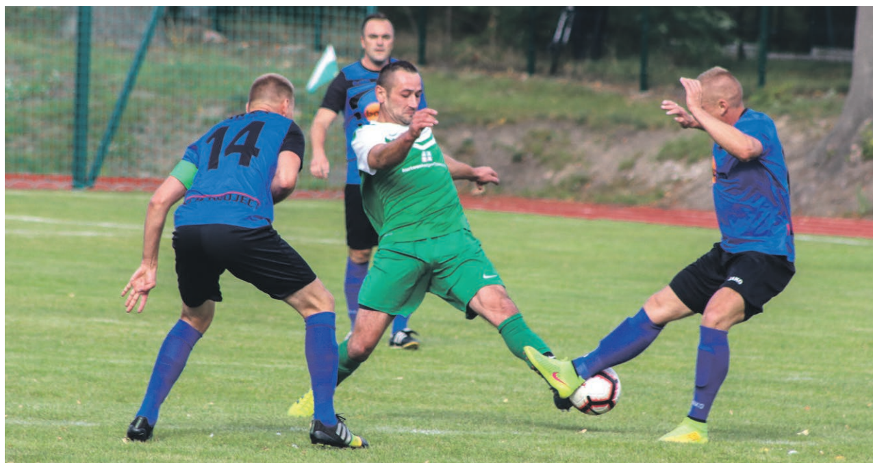
Zielonogórska klasa okręgowa