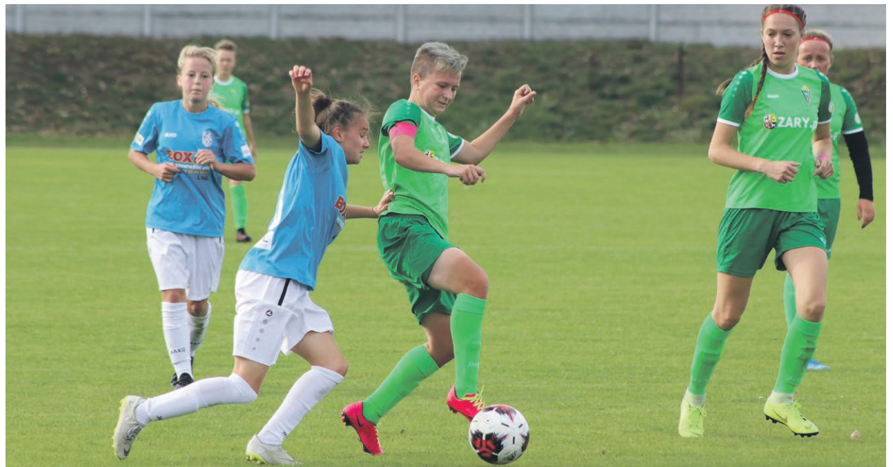
II liga kobiet