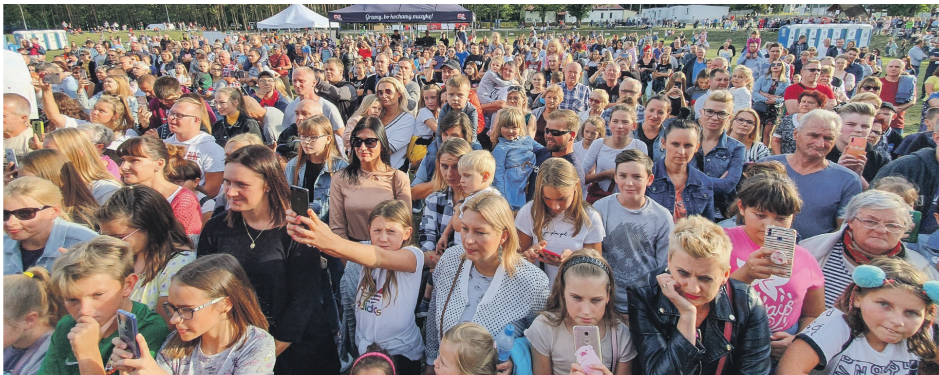
Każda gwiazda ma swoich fanów