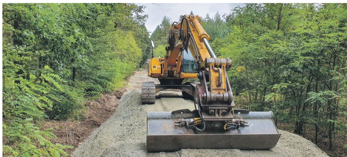
Leśne drogi utwardzane są naturalnym kruszywem

W ubiegłym roku wykonano utwardzenie odcinka pomiędzy ulicami Dziewina a Komuny Pa-