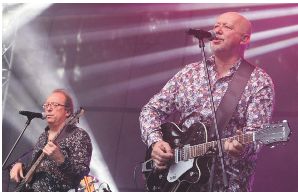
Żuki w klimacie lat sześćdziesiątych