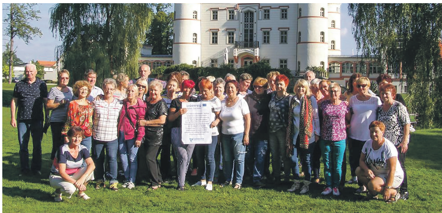
Integracja i wspólne podziwianie dolnośląskich zabytków fot. nadesłane

Skarby Muzeum Karkonoskiego, zabytki kultury sakralnej - Kościół Łaski, niezwykła uroda pałaców w Stanisławowie, Łomnicy, Wojanowie i Pakoszowie zachwyciły seniorów z Polski i Niemiec. Wydarzenie potwierdza dobrosąsiedzkie stosunki polsko-niemieckie. nadesłane