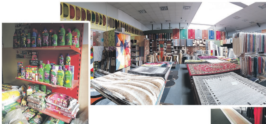
SKLEP LUBCENAS NAWOZY, NASIONA, PASZE TEL. 68 363 97 23