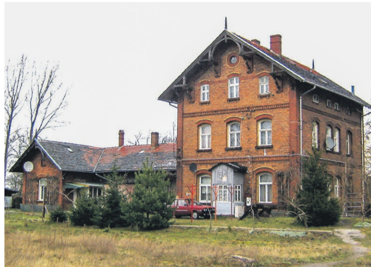
Budynek dawnego dworca bocznego od strony torowiska Kolei Łużyckiej (2009r.)

Z wyposażenia technicznego stacji Kolei Łużyckiej w Lubsku, należy przede wszystkim wyróżnić prostokątną parowozownię o mieszanej konstrukcji murowano-drewnianej. Do wnętrza parowozowni wchodził tor nr 209, zaś obok niego biegł równolegle tor oczyszczkowy nr 211. Koło budynku znajdowały się: zasilek węglowy, kilkumetrowa okrągła wieża wodna i zasilany z instalacji wodnej budynek dworca żuraw wodny. W pierwszych powojennych latach lokomotywownia była eksploatowana zgodnie ze swoim przeznaczeniem i oporzadzano tam nieznaną serię tendrak do obsługi bocznic ceramicznej. Począwszy od 1952 r. jej główną funkcją było garażowanie drezyn. Jeszcze na początku lat 80. w pomieszczeniu oporzadzano dwie drezyny serii WM5 oraz WM10, choć i niejednokrotnie nocowała w niej kultowa drezyna M20. Był to przerobiony na potrzeby transportu kolejowego (głównie do przewozów ważnych osobistości) samochód marki Warszawa, a jej charakterystyczną cechą było posiadanie własnej obrotnicy zamontowanej w podwoziu. Do budynku przylegało niewielkie pomieszczenie socjalne dla pracowników obsługi oraz magazyn, wykorzystywane