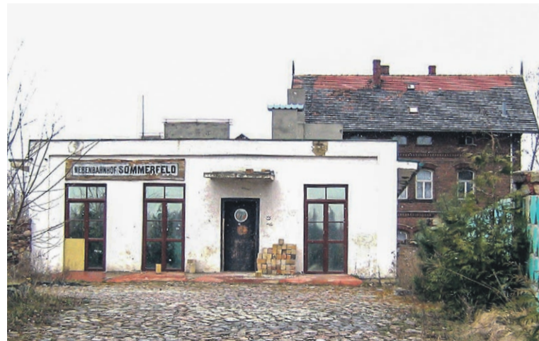
Tuż przed budynkiem dworca znajdowało się jedno z biur kolejowej „drogówki”, w którym w latach późniejszych mieścił się bar o wyjątkowej nazwie.