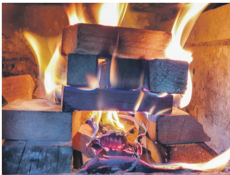
fol. Andrzej Buczyński

Koszt kwalifikowanym jest samo urządzenie grzewcze. Nie można się więc ubiegać o zwrot za wykonanie potrzebnej dokumentacji, demontaż starych kotłów, czy przygotowanie po-