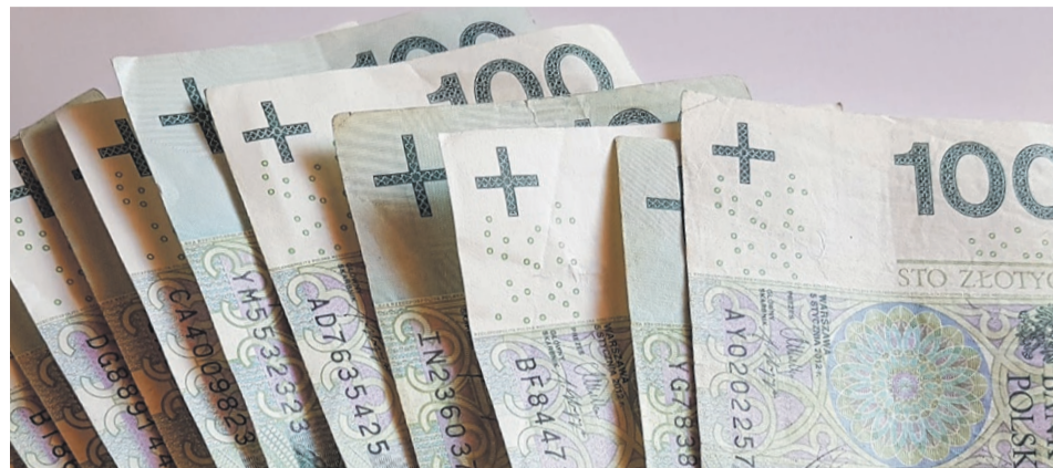
fol. Andrzej Buczyński

Poniżej publikujemy wykaz projektów, które otrzymały dofinansowanie. ATB