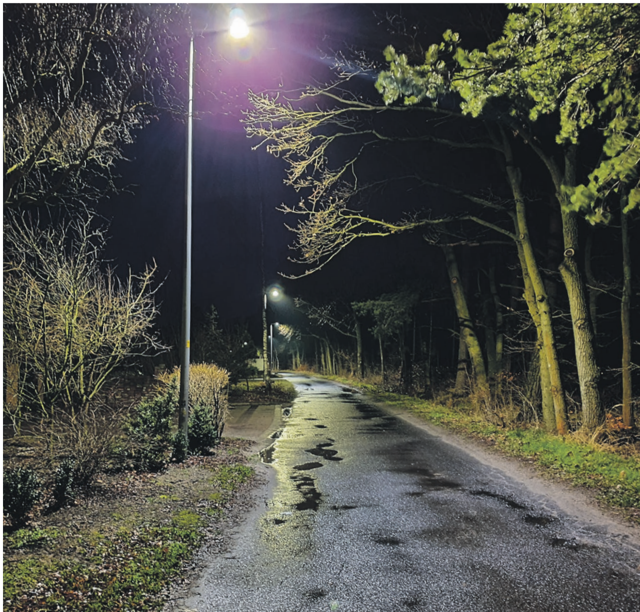
Nowoczesne oświetlenie dociera do coraz dalszych zakątków gminy

GMINA ŻARY Nocne oświetlenie dróg w miastach wydaje się czymś oczywistym. Ale na wsiach już niekoniecznie. Szczególnie na drogach dojazdowych do posesji. Wioski położone na obrzeżach miast dynamicznie się rozbudowują, pełniąc rolę sypialni. A ludzie chcą światła. Przede wszystkim dla bezpieczeństwa.