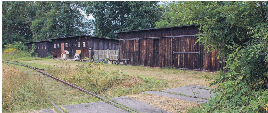
Zachowane do dziś unikatowe drewniane magazyny z czasów Kolei Łużyckiej. Na pierwszym planie droga zwrotnicowa, z której dawniej wychodziły tory 205, 207 i 209. Po torze nr 209, pociągi jeszcze 10 lat temu - wjeżdżając w fragment toru 205, docierały do placu składowego węgla