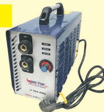
Spawarka inwertorowa VECTOR 180A