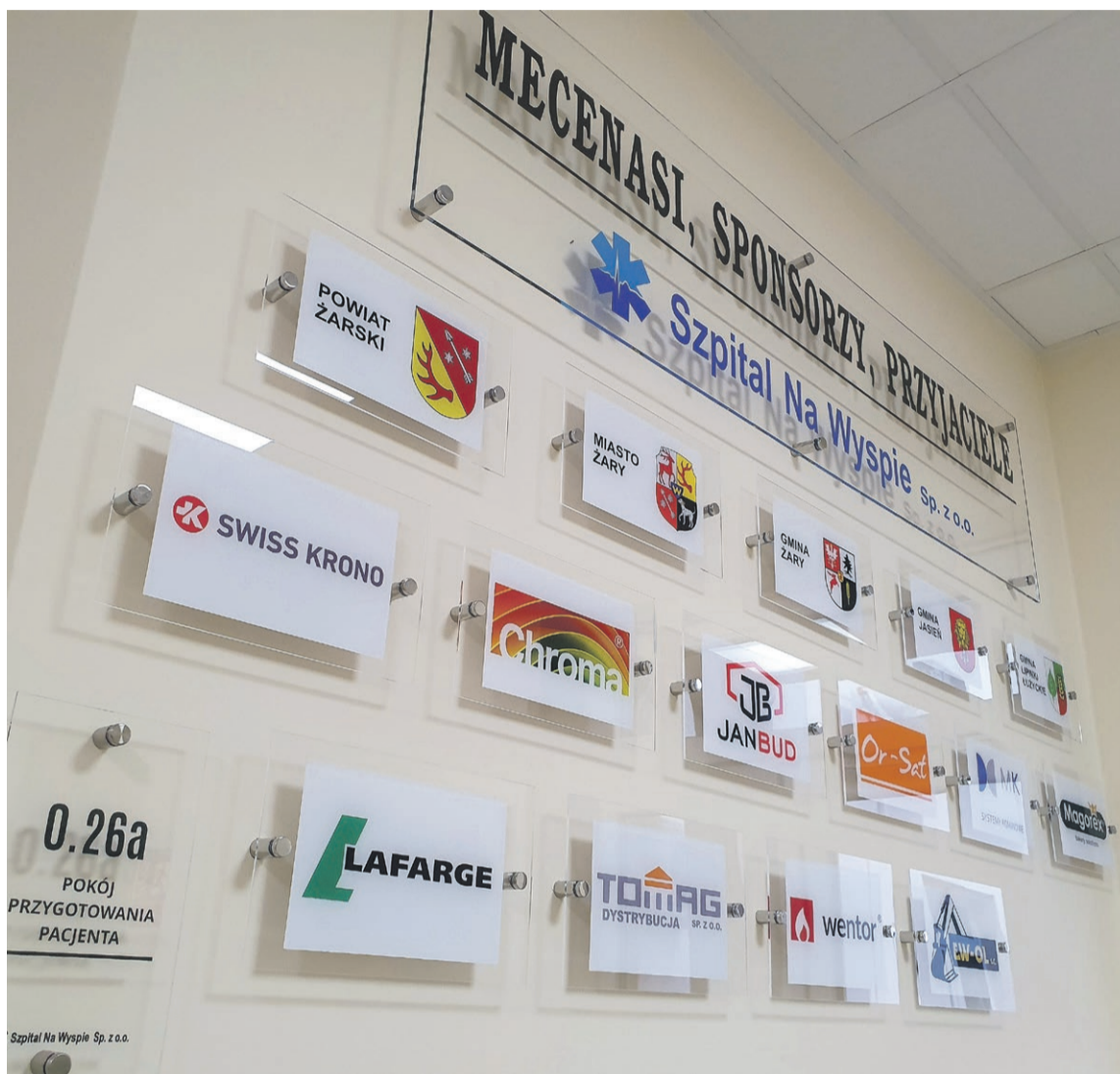
Wkrótce pojawią się kolejne tabliczki

- Przydałyby się ławki do parku przy szpitalu, aby pacjenci i odwiedzający w ciepłe dni mogli tam razem spędzić czas - mówi prezes Dankiewicz. - Musimy też dokupić część wyposażenia do sali operacyjnej. Czekamy na nowy fotel ginekologicznego. Przyda się nowe łóżko porodowe. Albo wygodne siedzenia w po-