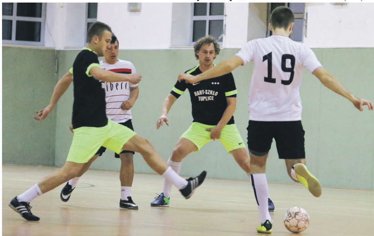
Libero - Hart Szkło 3:11

UKS Czarni Źagań - UKS Promień (2011) 5:6 Start Płoty - ŁKS Łęknica 7:4 Sprotavia Szprotawa - Promień Woman 2:1 UKS Victoria Jasień - Budowlani Lubsko 2:2 Łużyczanka Lipinki - Mundial Źary 0:15 UKS Promień 2010 - pauza