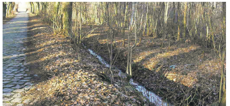
Równia torowa przebiegająca wzdłuż ul. Transportowej, na której znajdował się m.in. tor kolejowy do Tuplic w wersji do 1945r.