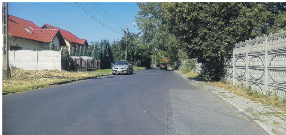
Odcinek ul. 3 Maja wybudowany w miejscu pierwszego kilometra linii tuplickiej do 1945r.