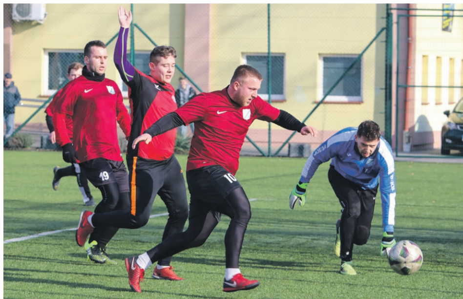
PIŁKA NOŻNA Unia Kunice pokonała Piasta Ilowa 3:2