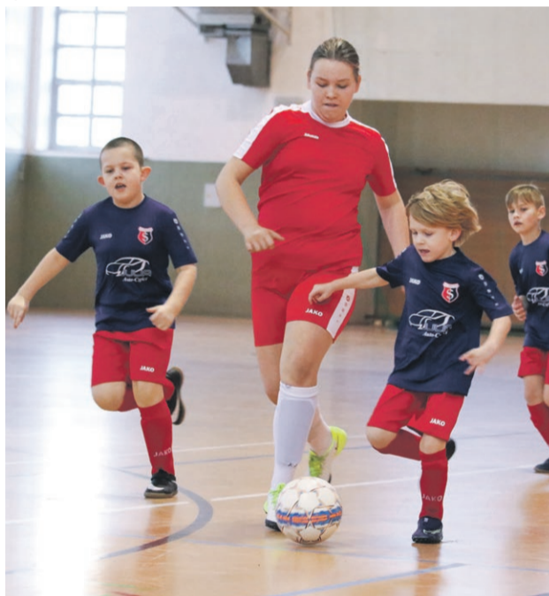
Sprotavia Szprotawa - Promień Woman 2:1

Wybrzeże Klatki Schodowej - ŹKSW 7:1 Crips - MMalu 17:1 Kaczy Team - Magicy 2:5 ZZO Marszów - Yakotakokiwa 1:8 ŁKS Łęknica - Tiki Taka 3:5 Hooligans - Miostowiczanka 5:0 (vo.) Endorfina & Brunetka - Red Devils Katalonia 5:5 Libero - Hart Szkło 3:11