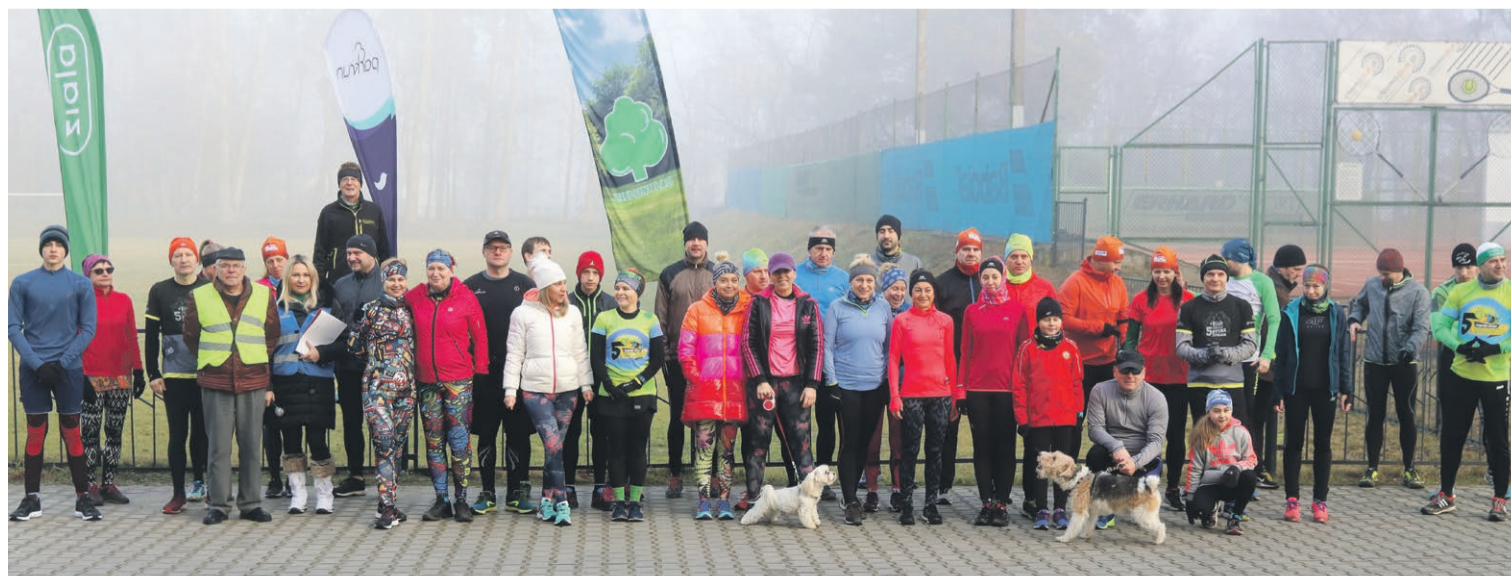
Tuż przed startem