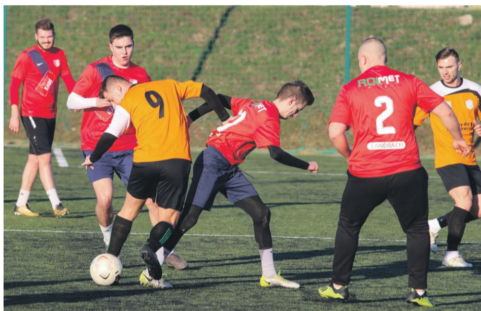
PIŁKA NOŻNA Delta Sieniawa Żarska wygrała z BKS Bolesławiec 7:3