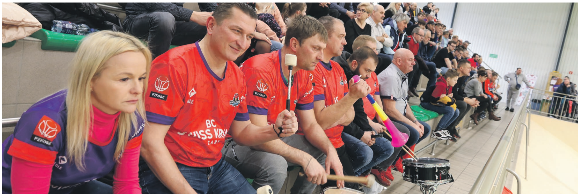
Najgłośniejsza ekipa żarskich kibiców