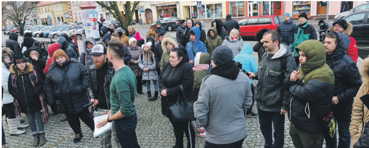
Mieszkańcy Lubuska przez dwie godziny czekali pod ratuszem. Bez skutku