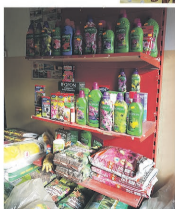
SKLEP LUBCENAS NAWOZY, NASIONA, PASZE TEL. 68 363 97 23