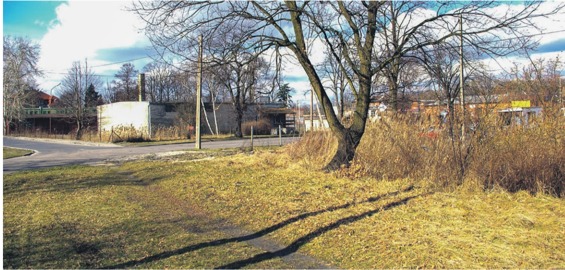
Placyk po przystanku osobowym Lubsko Hynków. Po lewej stronie zbieg ul. 3 Maja i Kilińskiego

Jedyny problem z odszukaniem pierwotnego przebiegu toru na terenie Lubska podczas zwiadu terenowego, występuje na krótkim odcinku między ulicami Transportową a Kolejową. Przyczyna jest tutaj bardzo oczywista, ponieważ w miejscu zlikwidowanego toru (poprowadzonego na planie ograniczonej z obu stron rowami odwadniającymi), w latach 60. po-