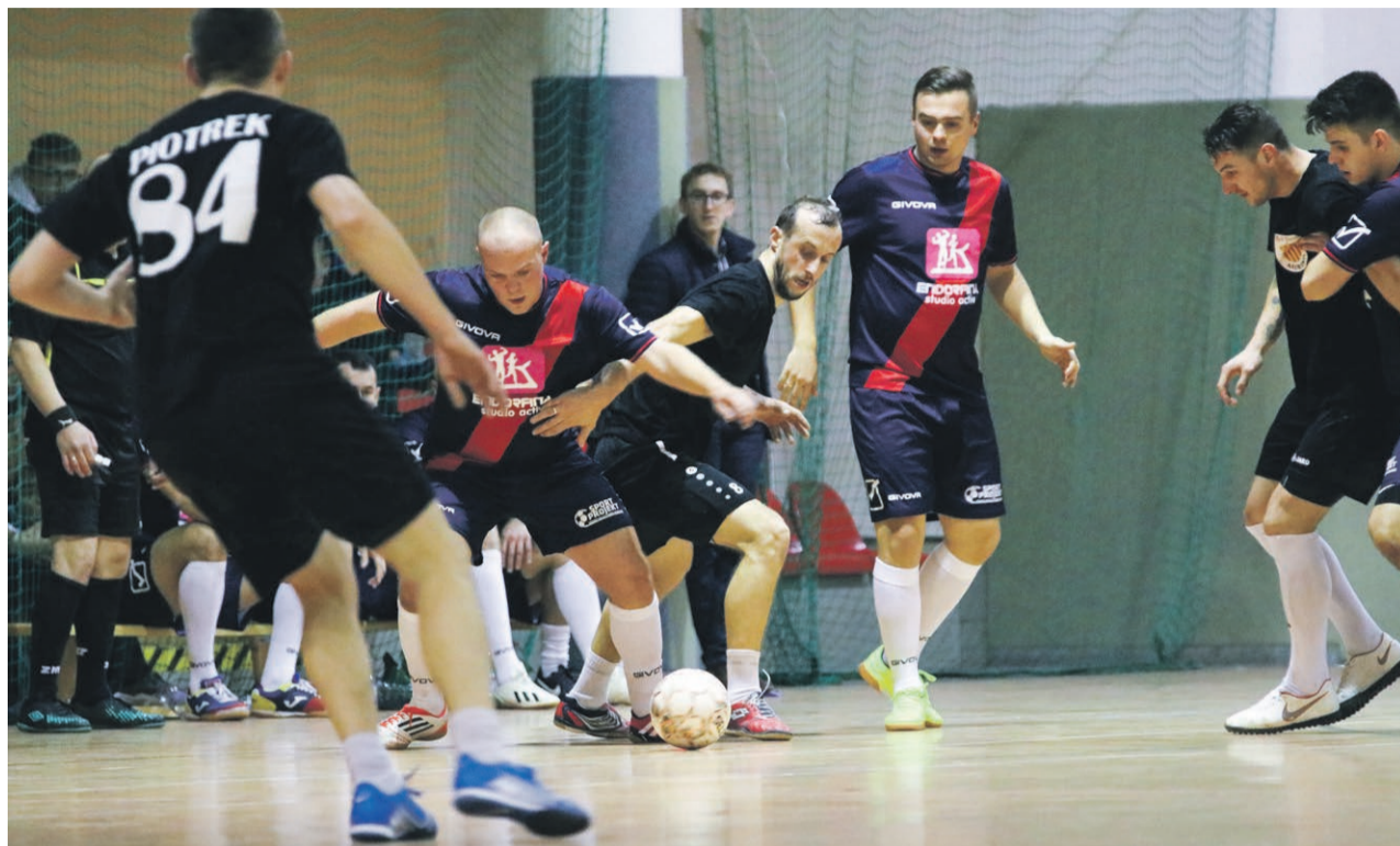
Endorfina & Brunetka - Red Devils Katalonia 5:5