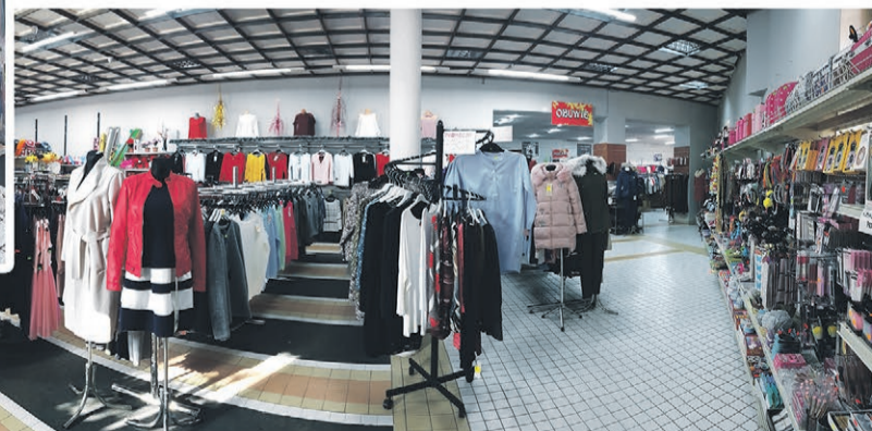
CHIŃSKIE CENTRUM HANDLOWE

Czynny od poniedziałku do soboty ŻARY, ul. Moniuszki 11 Obok targowiska miejskiego, duży parking