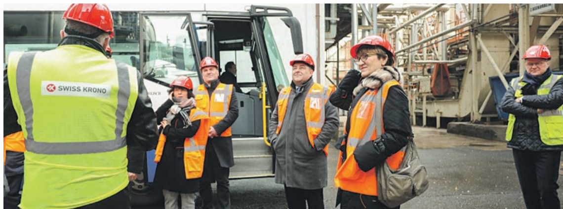
Zarząd województwa z wizytą w Swiss Krono