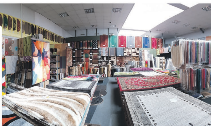
SKLEP DYWANIK BOGATA OFERTA DYWANÓW, WYKŁADZIN I CHODNIKÓW TEL. 515 514 231, SKLEP@HAYDUK.PL