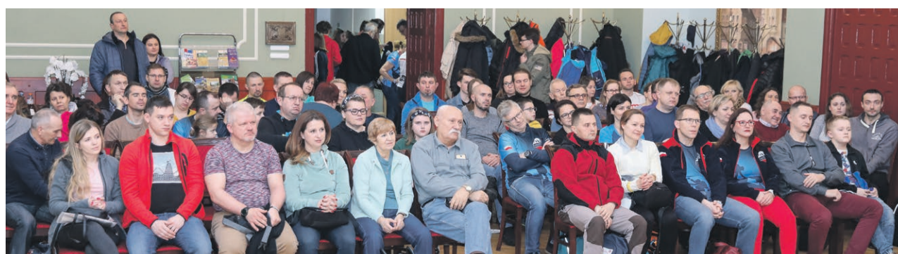
Posiedzenie Łoży Zdobyców zorganizowano w sali konferencyjnej żarskiego ratusza