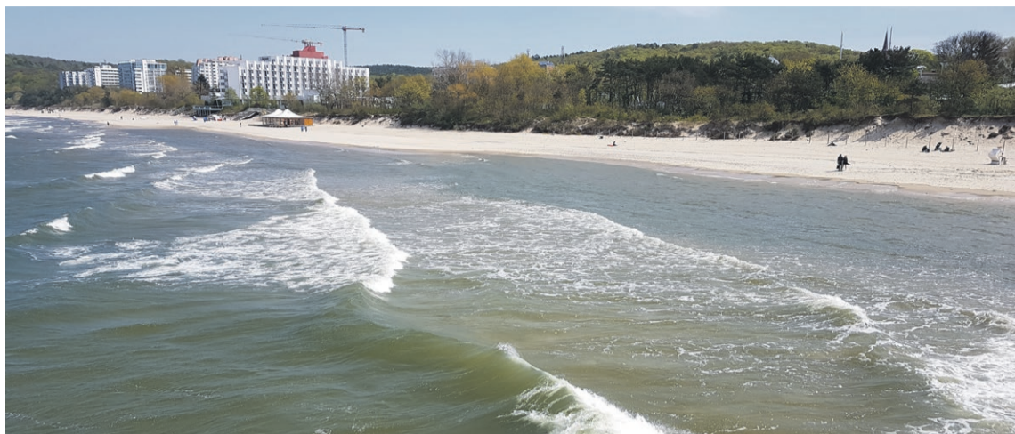
Jechać, czy nie jechać? Oto jest pytanie

W związku z wykryciem przypadków zarażenia koronawirusem w Europie wielu konsumentów za-