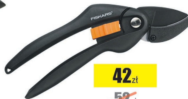
Sekator nożycowy SOLID P32 Fiskars