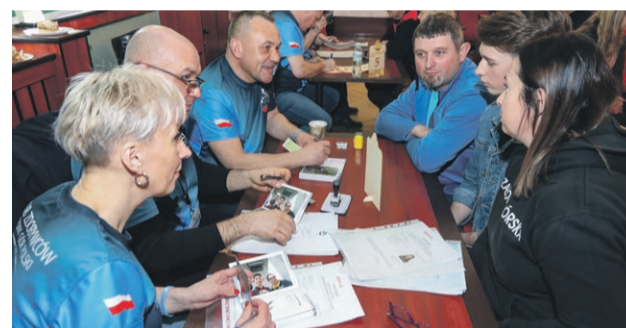
Weryfikacja kandydatów do klubu