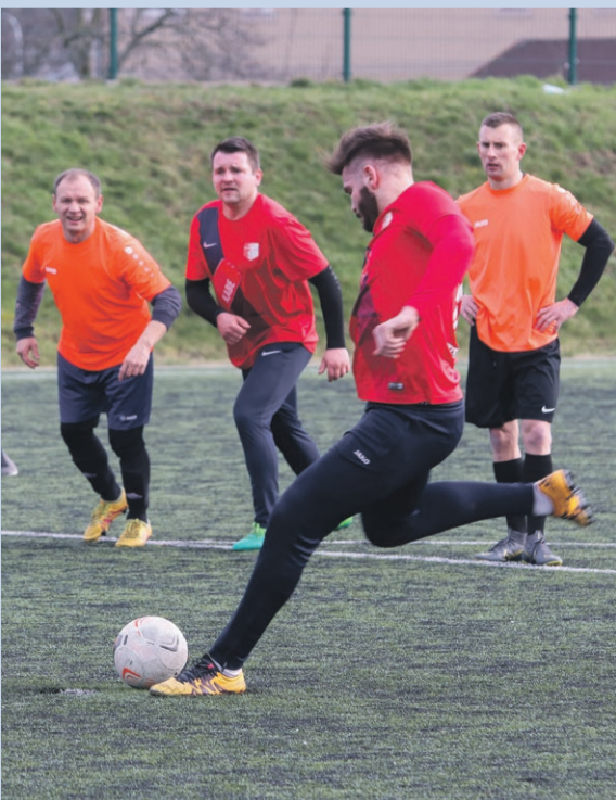
Delta Sieniawa 3:0 Relax Grabice