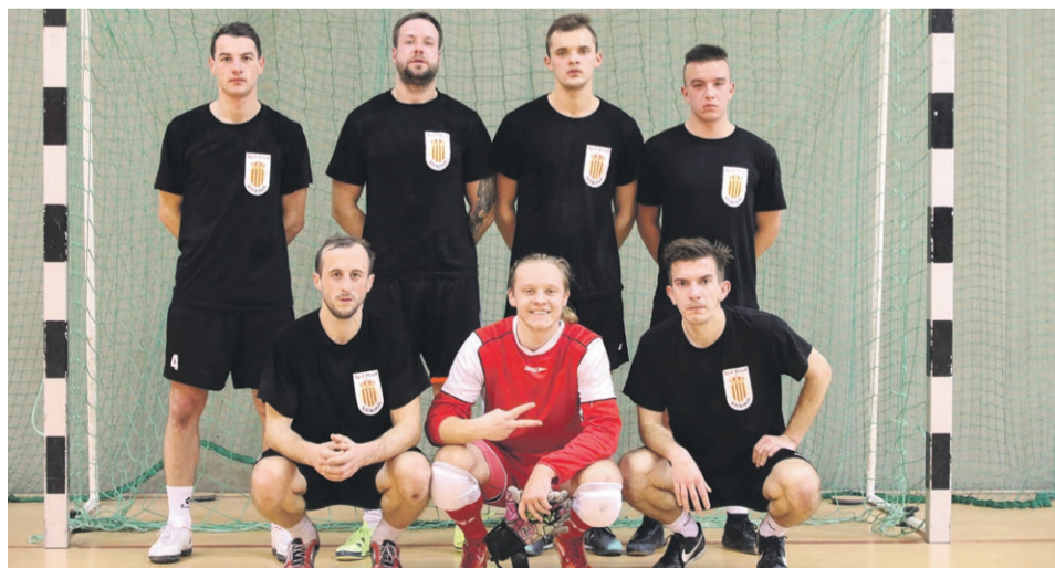
Red Devils Katalonia