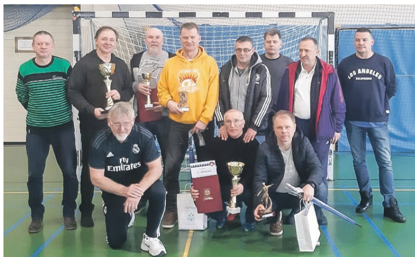
Po turnieju w Nowogrodzie Bobrzańskim