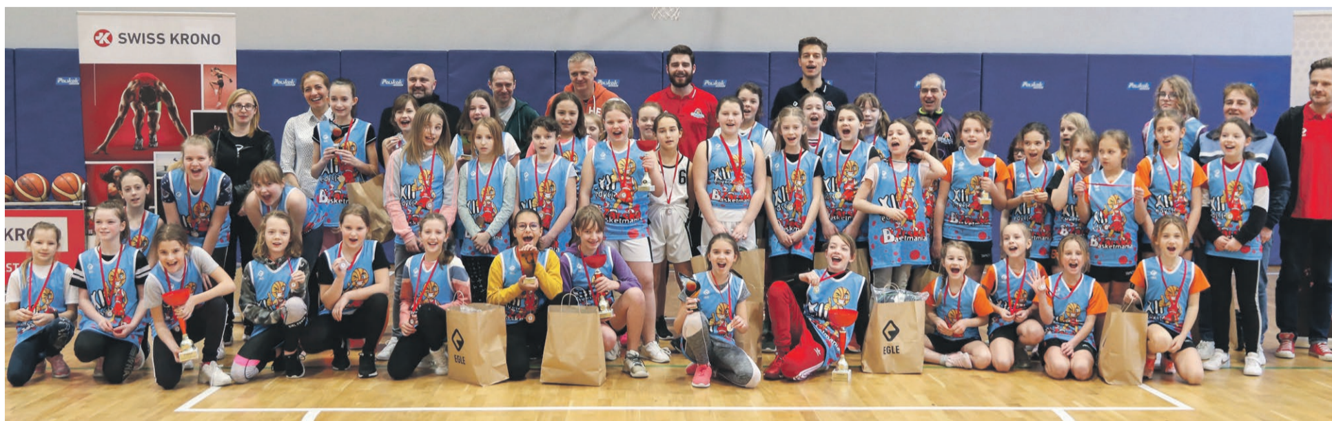
Dziewczęta z podstawówek rywalizowały 3 marca