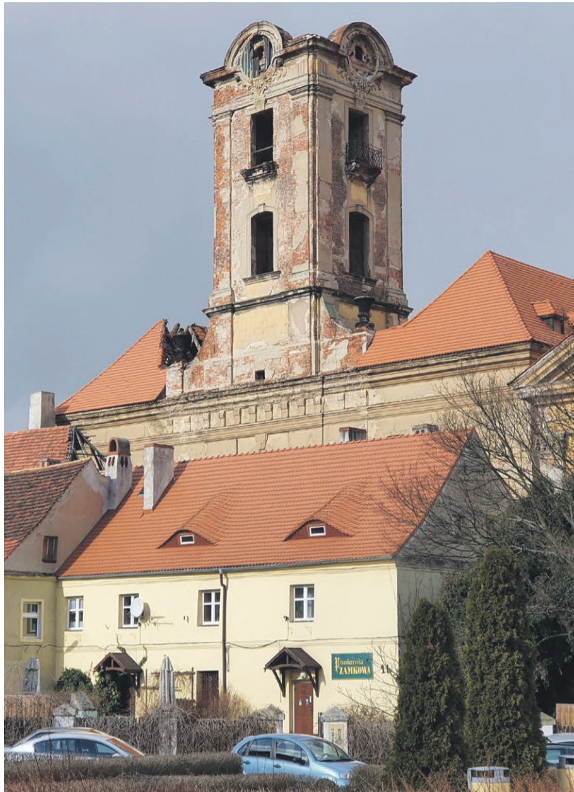
Budowlanców na wieżę możemy wypartywać już latem

Za przygotowanie dokumentacji projektowej dotyczącej remontu wieży oraz dachu uszkodzonego podczas pożaru zapłaci miasto. Projekt może być gotowy w przeciągu mie-