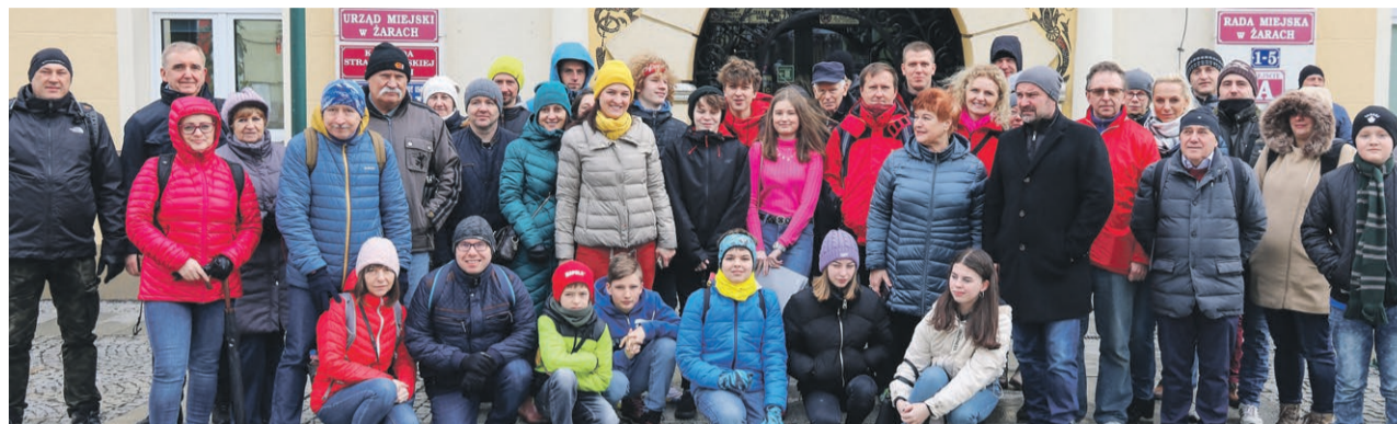
Turyści, którzy przybyli na posiedzenie Łoży Zdobyców mieli też okazję zwiedzić Żary

ŻARY Po raz pierwszy w Żarach przyznano tytuły Zdobycy Korony Gór Polski.