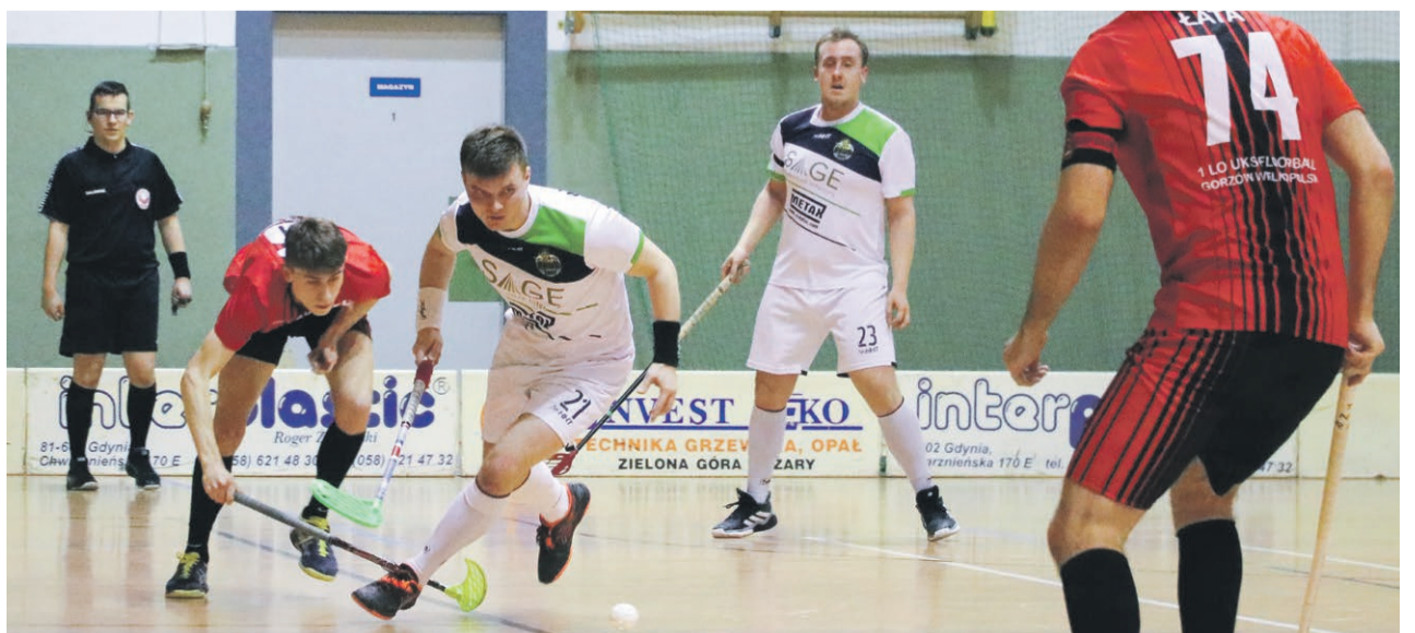
UNIHOKEJ Zawodnicy UKS Prus Żary rozegrali ostatnią kolejkę sezonu Ekstraligi Unihokeja Mężczyzn, podejmując zespół I LO UKS Floorball Górzów. Gospodarze przegrali to spotkanie 2:8 i zajmują 14. miejsce w tabeli