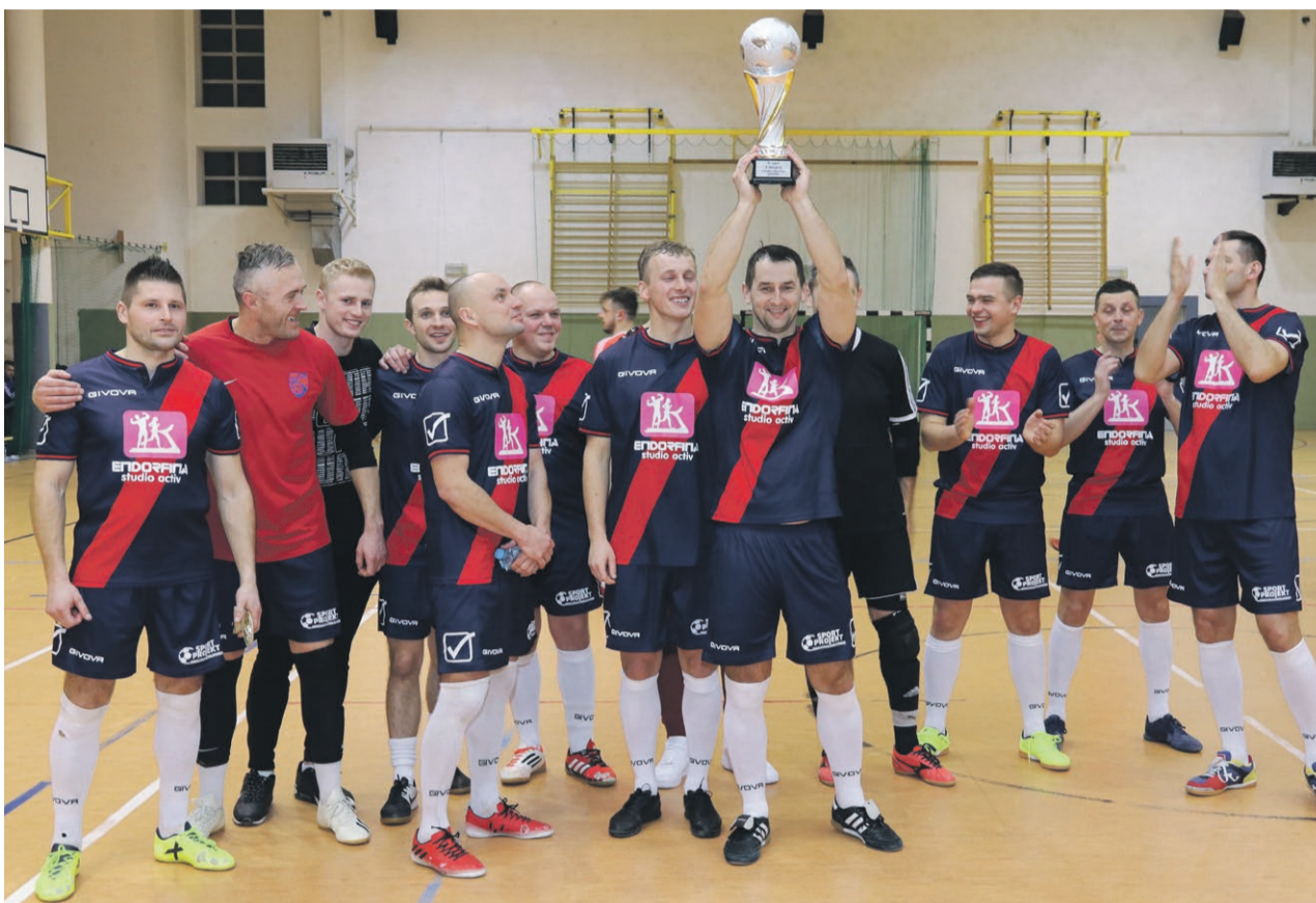
Endorfina & Brunetka nowym mistrzem ŻŁF

Finał Żarskiej Ligi Futsalu Hart Szkło - Endorfina&Brunetka 6:6, karne 1:2