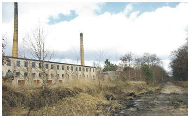
Starotorze linii kolejowej Lubsko-Tuplice. Po lewej mur rampy cegielni i dawny budynek produkcyjny (2009 r.)

Cegielnia ze wszystkich zakładów ceramicznych w tej części miasta przetrwała najdłużej. Choć jako zakład LZCB zaprzestano na produkcji na przełomie 1991/92, to bardzo szybko została sprywatyzowana, kontynuując wypalanie cegieł do 2001 r. Dzięki opiece pasjonatów ceramiki, budynki cegielni nie zostały zlikwidowane, a wewnątrz zakładu po prostu zwala z nóg. W budynku produkcyjnym znajdował się kręgowy piec Hoffmana, opięty przez układ torowiska 500 mm na planie prostokąta z obrotnicami ta-