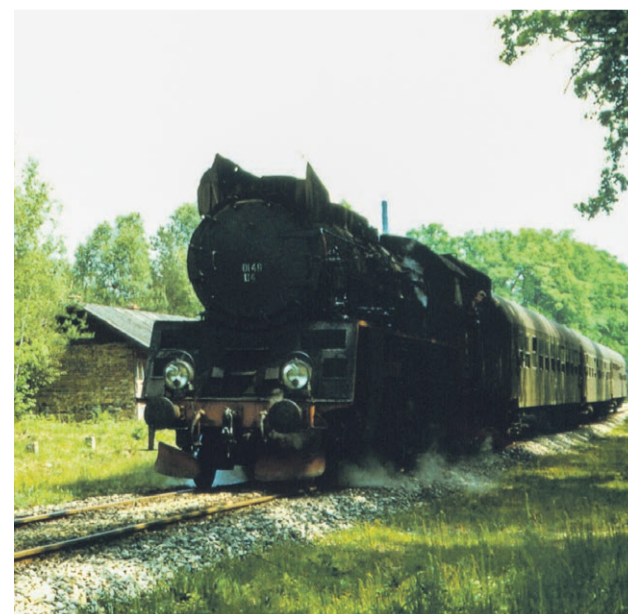
Parowóz Ol 49-104 z pociągiem osobowym nr 76331/76330 z Lubuska do Głogowa. Po lewej budka przystanku osobowego w Glince Górnej, z tyłu komin cegielni