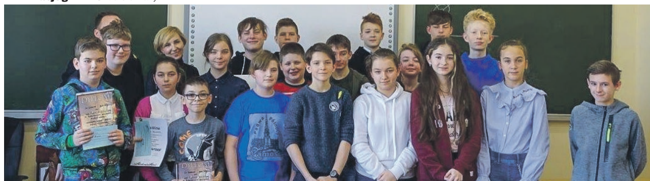
Uczestnicy konkursu miejskiego