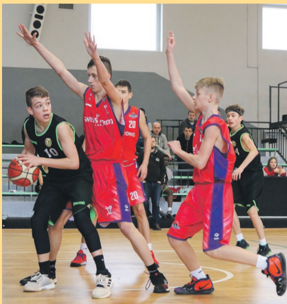
W lidze młodzików U14 podopieczni Tomasza Górskiego i Tomasza Sobczaka pokonali drużynę Exact Systems Śląsk Wrocław I wynikiem 89:69