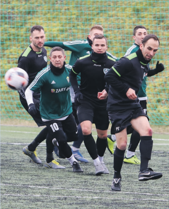
Promień Żary 0:3 Carina Gubin