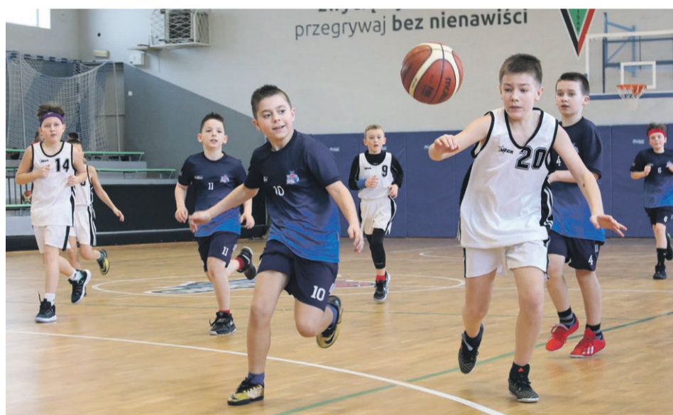
Drużyna SP 2 w białych strojach wygrała turniej chłopców

Wyróżnienia indywidualne otrzymały: Milena Kozińska, Magda Dudziń-