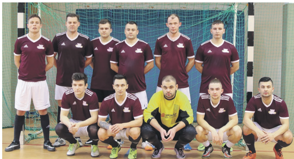
ŁKS Łęknica