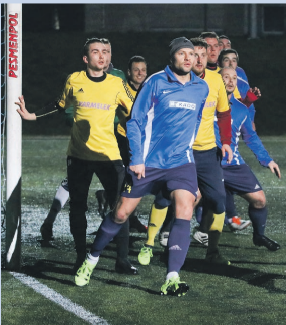
Kado Górzyn 5:2 ŁKS Łęknica