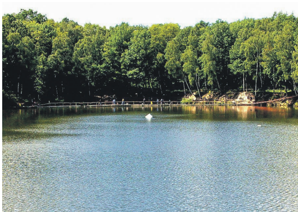
Staw Wojskowy - reliktem po kopalni odkrywkowej Elsa-Margarete, jest ulubionym miejscem aktywnych spotkań dla wielu lokalnych mistrzów wędkarstwa