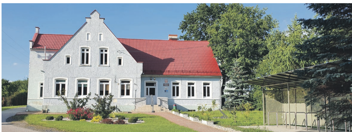
W Lubanicach uczniów coraz mniej

lata może zabraknąć miejsca dla wszystkich dzieci z rejonu, który pod nią podlega.