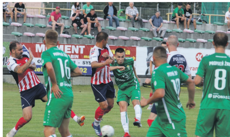
Promień Żary 0:2 Polonia Słubice

Przed Promieniem 17 kolejek rundy jesiennej, a potem jeszcze rewanżowa. Ale nadzieje na awans są zawsze. Prognozy mają taki sam sens, jak zapowiadanie zimy stulecia, bo wszystko i tak może rozstrzygnąć się w ostatnim meczu. Historia zna takie przypadki. Tak czy siak, kibice w końcu mają po co żyć i oby nic tego nie zakłóciło. ATB