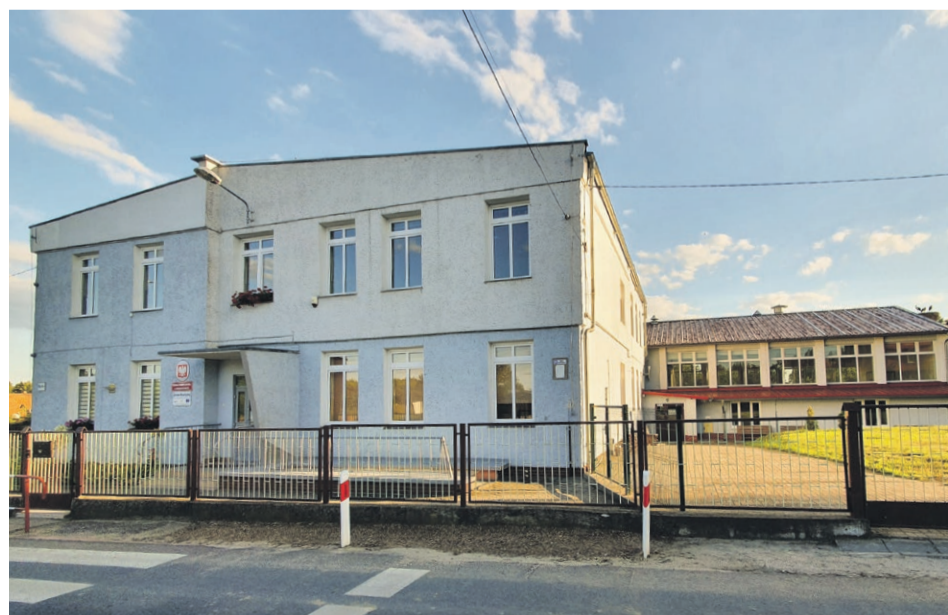
Szkoła w Olbrachtowie do rozbudowy?