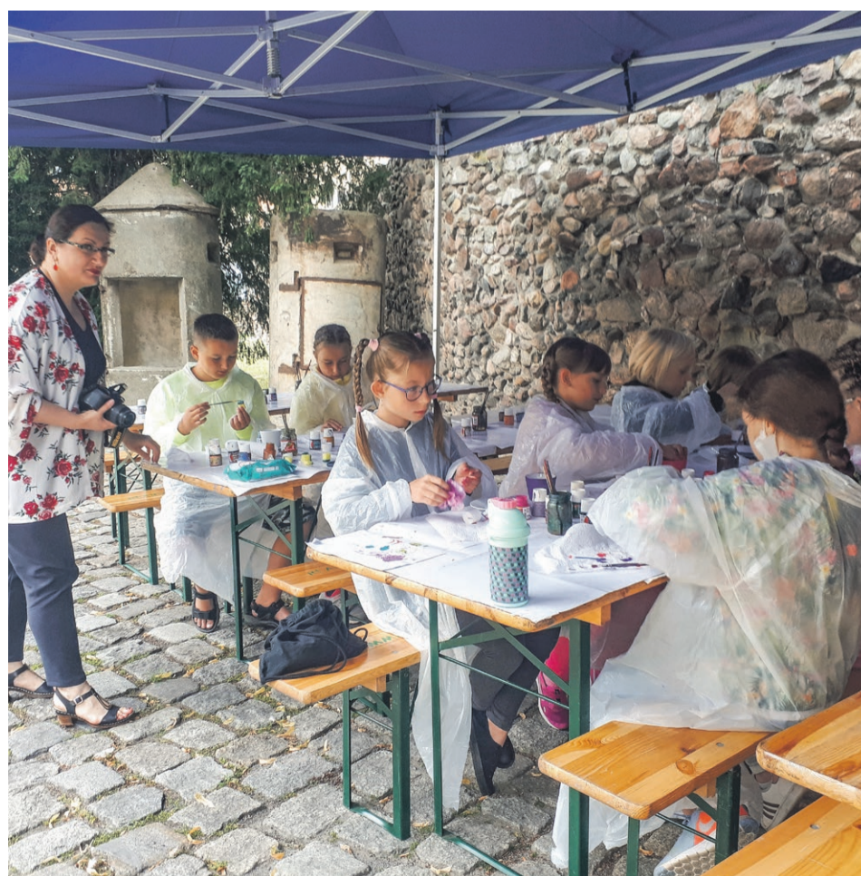
fol. Muzeum Żary