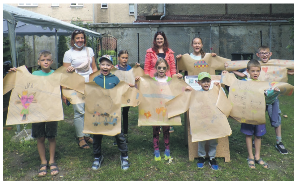
fol. MBP Żary

Więcej informacji wraz z regulaminami znaleźć można na stronach internetowych organizatorów zajęć. ATB