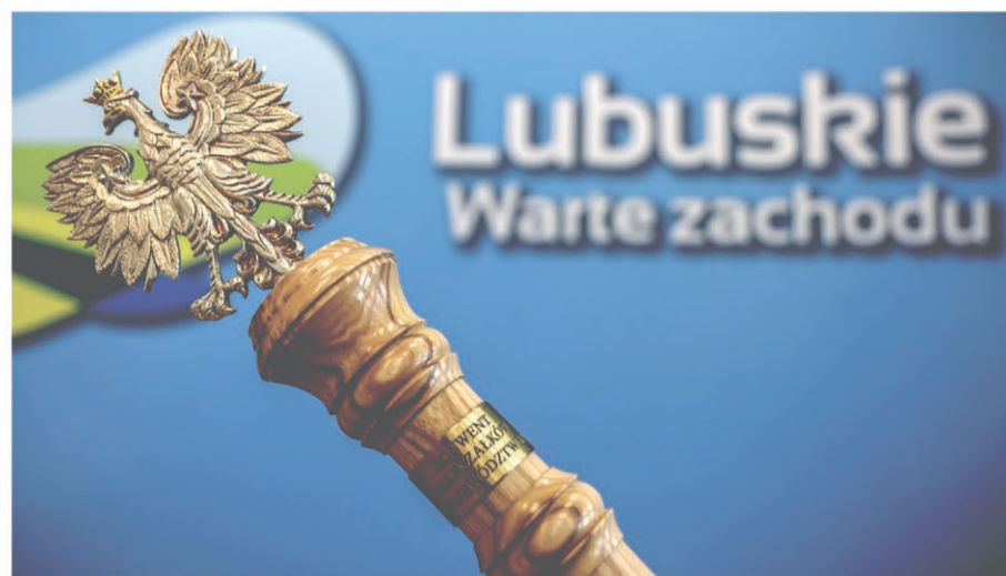
Fot. Laska Marszałkowska - symbol przewodnictwa w Konwencie Marszałków RP

Pandemia zdominuje także drugi blok obrad poświęcony ochronie zdrowia. - Pandemia odsłoniła deficyty w zakresie ochrony zdrowia. Dlatego też, trzeba