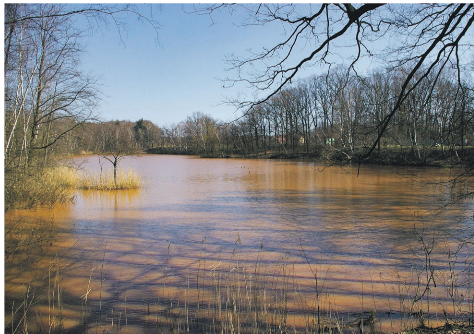
Staw Cielmowski stanowiący pamiątkę po kopalni węgla brunatnego Antonie