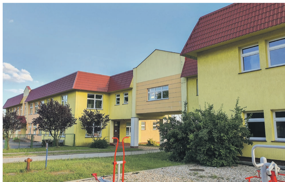
Trwa duży remont w Grabiku

- Na pewno nie dopuszczę do takiej sytuacji, jaka była kilka lat temu w Olszynie, gdzie w szkole było siedmiu nauczycieli i dziewięćdziesiąt dzieci, a roczny koszt utrzymania tej szkoły to było około 700 tysięcy - mówi wójt Mrozek. - Praca nauczyciela jest dużo łatwiejsza, gdy ma tylko kilkoro dzieci w klasie, ale w ten sposób robi się dziecku krzywdę, bo nie zna ono pojęcia rywalizacji. Takie dziecko będzie miało problemy w szkole średniej - dodaje wójt. ATB