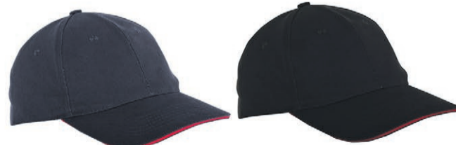
Czapka z daszkiem (różne kolory) Lahti Pro