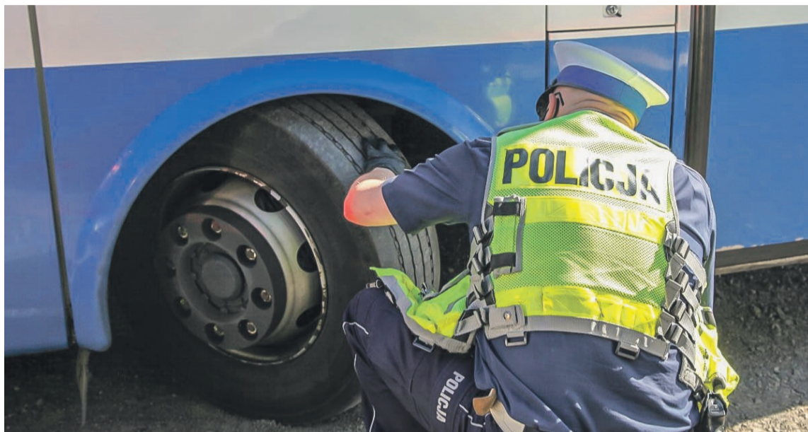
fol. Lubuska Policja

W Komendzie Powiatowej Policji w Żarach zgłoszeń takich można dokonać pod nr tel.