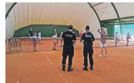
fol. KPP Żary

Podczas kontroli funkcjonariusze w ramach ogólnopolskiej akcji informacyjno-edukacyjnej pn. „Kręci mnie bezpieczeństwo nad wodą” oraz „Bezpieczne wakacje” rozmawiają z dziećmi na temat bezpiecznych zachowań nad wodą, przypominają o kluczowych zasadach korzystania z internetu, a także bezpiecznych zachowaniach na drodze. Mundurowi poruszają również ważne kwestie związane z uzależnieniami i zażywaniem środków psychoaktywnych. Na zakończenie każdy z uczestników otrzymuje drobne upominki zakupione ze środków pozyskanych z dotacji Urzędu Miejskiego, na realizację