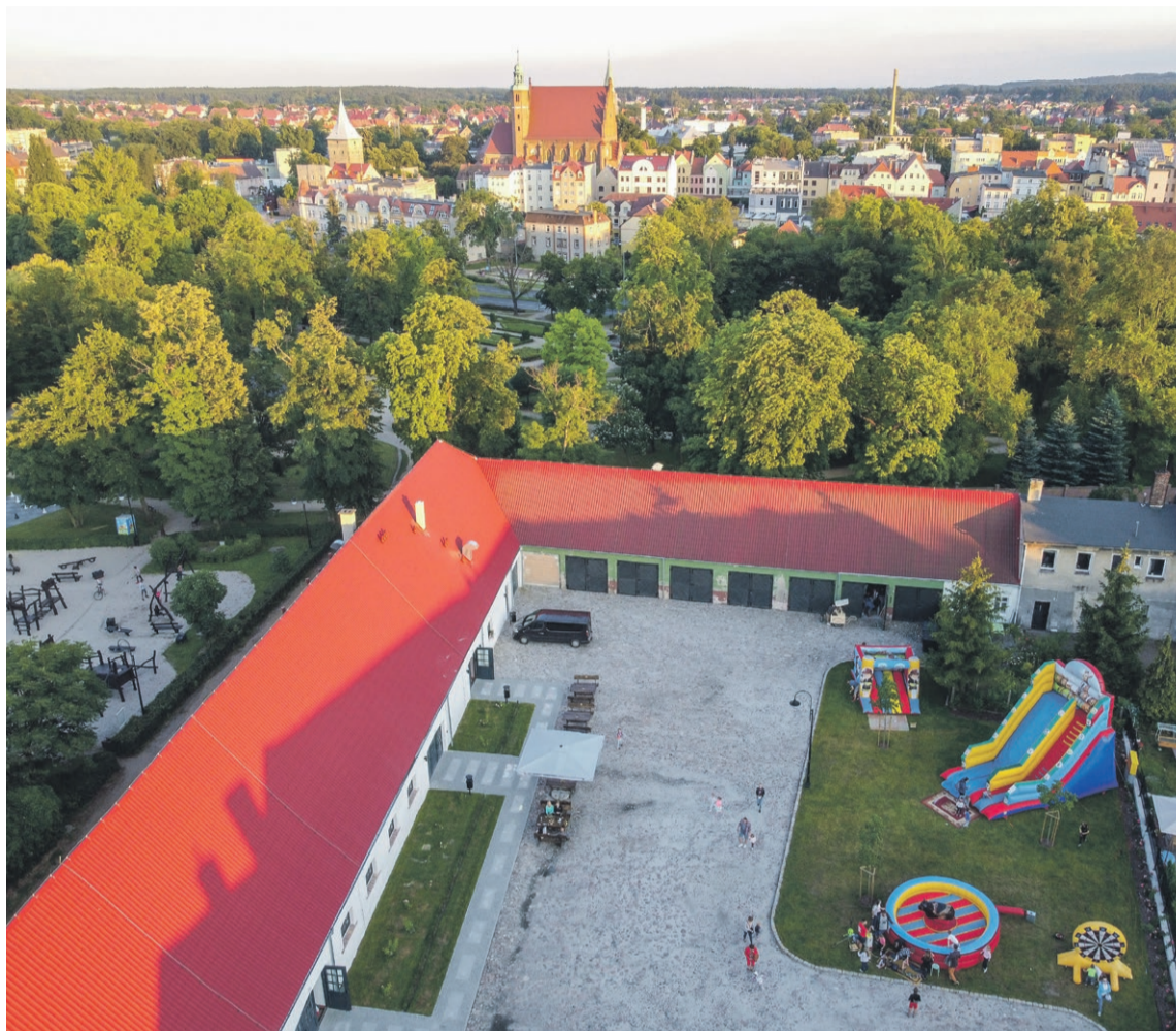
Już niedługo będzie tu można kupić różne produkty regionalne, a także spędzić czas z rodziną

- Głównym celem jest propagowanie zdrowej żywności oraz producentów, którzy z miłością podchodzą do wykonywanego rzemiosła. Chodzi nam też o to, aby stworzyć miejsce do spotkań całych rodzin. Na pewno nie zabraknie też miejsca dla najmłodszych. Będą różne atrakcje, na przykład warsztaty kulinarne. Mamy nadzieję, że będzie to fajne miejsce, które ludzie chętnie będą odwiedzać. Jeśli chodzi o produkty, które będzie można kupić na targu, to między innymi sery krowie i kozie, wędliny, chleby na zakwasie, miody, wina lubuskie, piwa regionalne, pyszne ciasta i jagodzianki, warzywa bezpośrednio od producenta, a nie z hurtowni, i wiele innych. Na targu kupimy rzeczy, których raczej w markecie się nie kupu-