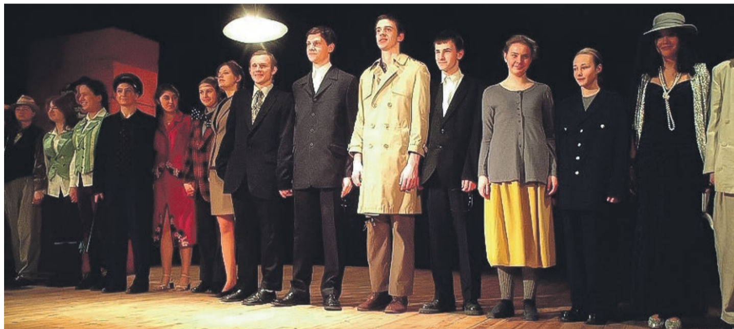
Zespół „Teatru Drewniana Kurtyna” po przedstawieniu Wizyta Starszej Pani

Pewnego dnia obywatele zubożalego szwajcarskiego miasteczka dowiadują się, że przyjedzie do nich z wizytą była mieszkanka Güllen, która jednak musiała kiedyś stąd uciekać - Klara Zachanassian. Powodem jej wyjazdu była opinia, jaką wyrobił jej człowiek,