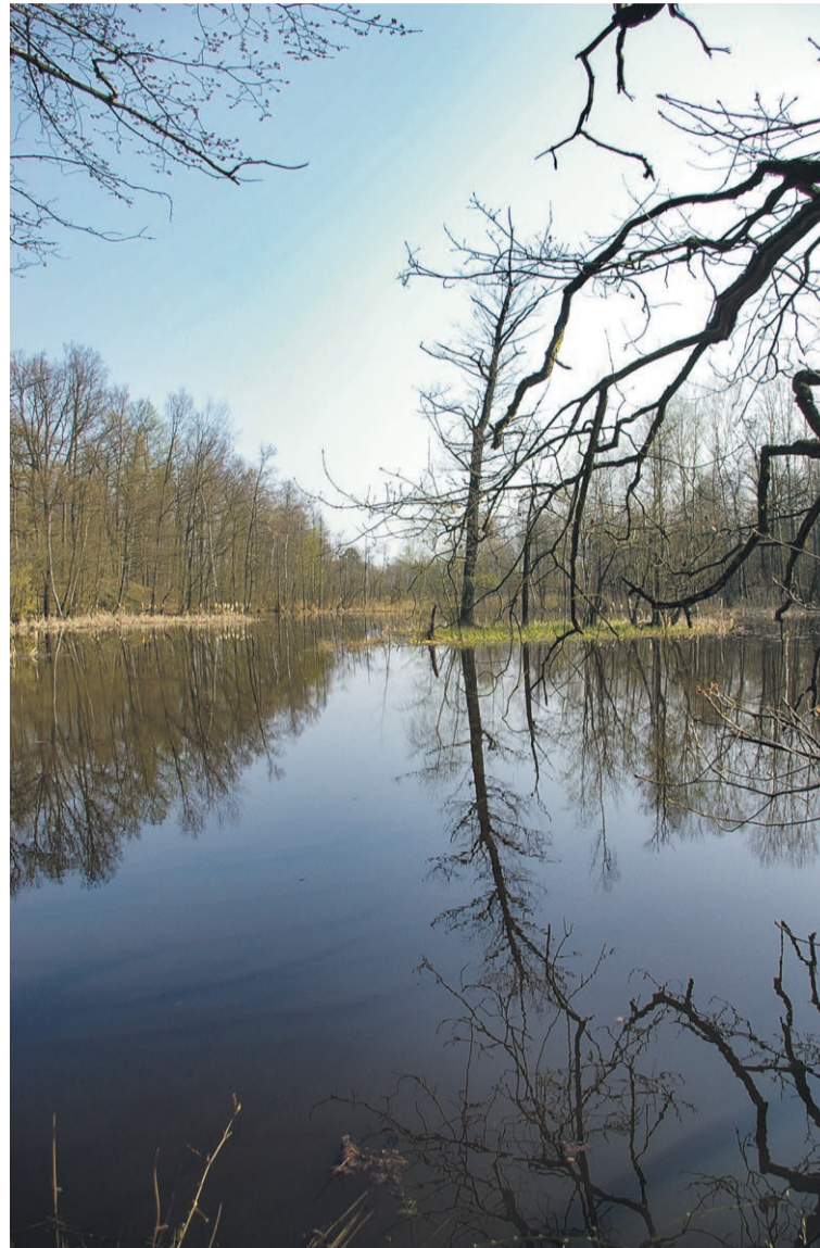
Fragment stawu Grobla, jednego z kilkunastu zbiorników w okolicach Tuplic, będących wspomnieniem po górniczej ekspansji

Po wojnie tuplickie pokłady węgla zostały włączone w rozległe złoża Babina (podzielone na cztery pola górnicze: Tuplice, Trzebiel, Pustków i Łęknica), rozpościerające się aż po rejon węglowy Łęknicy i Nowych Czapl. Pole Tuplice, wraz z polem górniczym Trzebiel, uzna-