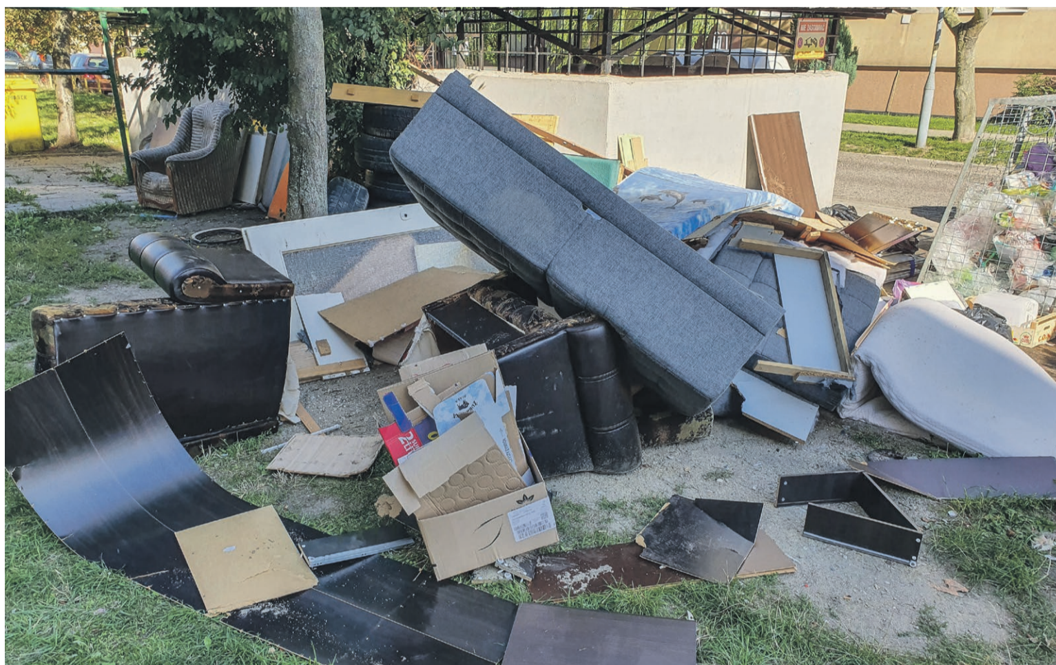
I tak poleżą jeszcze z miesiąc

Art. 10 brzmi - kto nie wykonuje obowiązków wymienio-