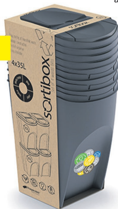
Kosz na śmieci SORTIBOX antracytowy 35L 4-cz.