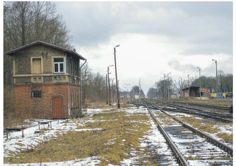
Nastawnia wykonawcza Tp1 wraz z wschodnią drogą zwrotnicową. Przy nastawni, po lewej stronie widoczne starotorze po linii kolejowej w kierunku Łęknicy, która od rozjazdu nr 5 przechodziła w tor stacyjny nr 10 (styczeń 2009 r.)