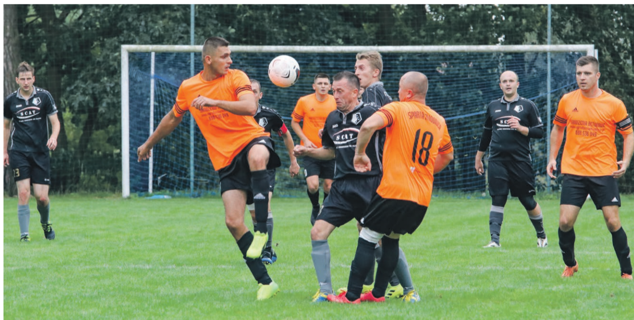
Klasa A - grupa 4