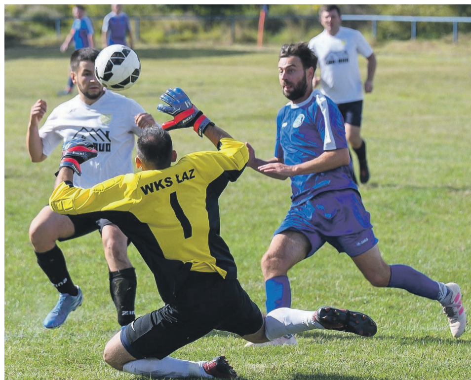
Żary: klasa B