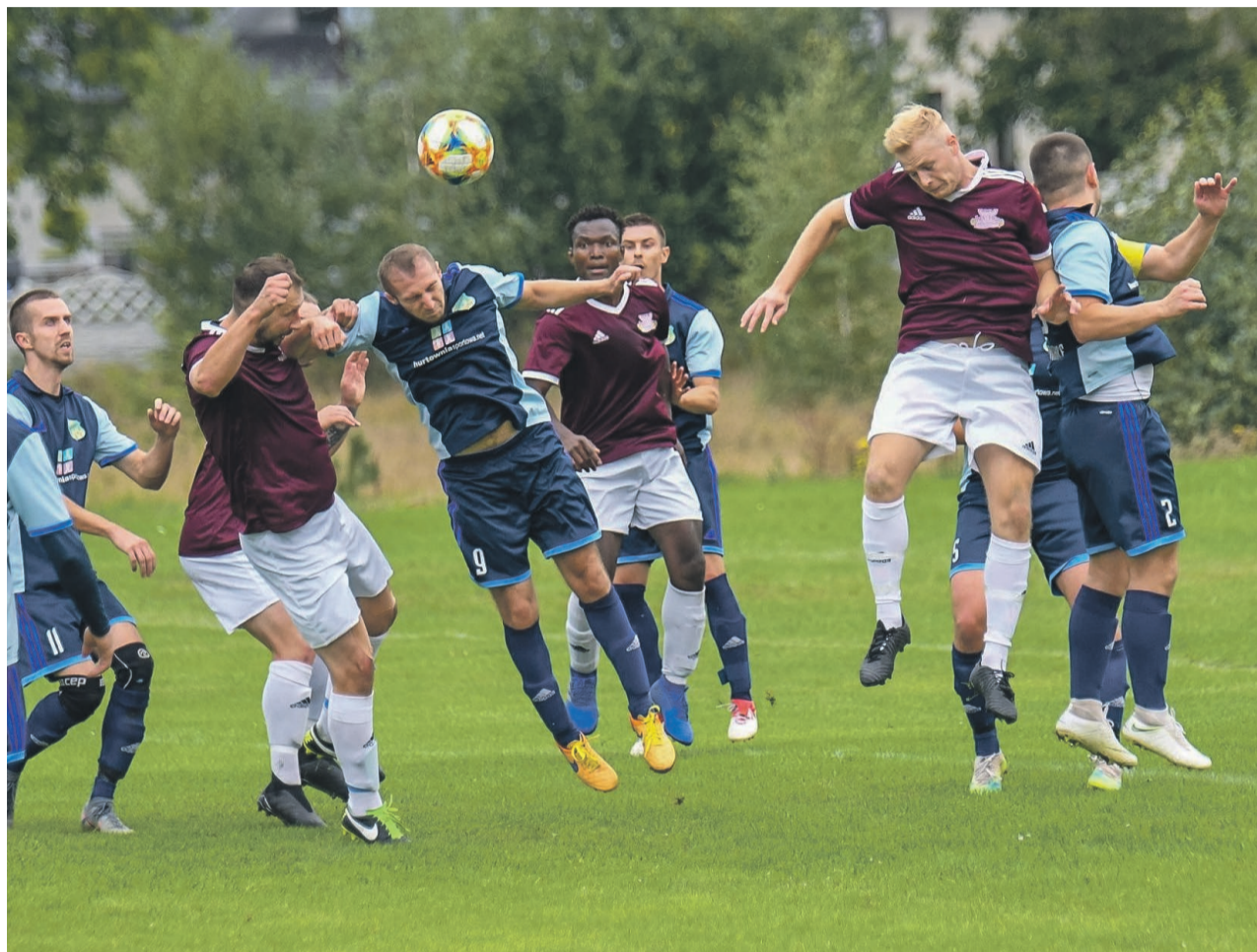
ŁKS Łęknica 5:0 Dar-Bol Alfa Jaromirowice

PIŁKA NOŻNA Po zwycięstwie z Delta Sieniawa Żarska i wskoczeniu na drugie miejsce w tabeli, premiowane awansem, podopieczni Grzegorza Tychowskiego podejmowali na własnym stadionie, w sobotę, 5 września, Alfę Jaromirowice.