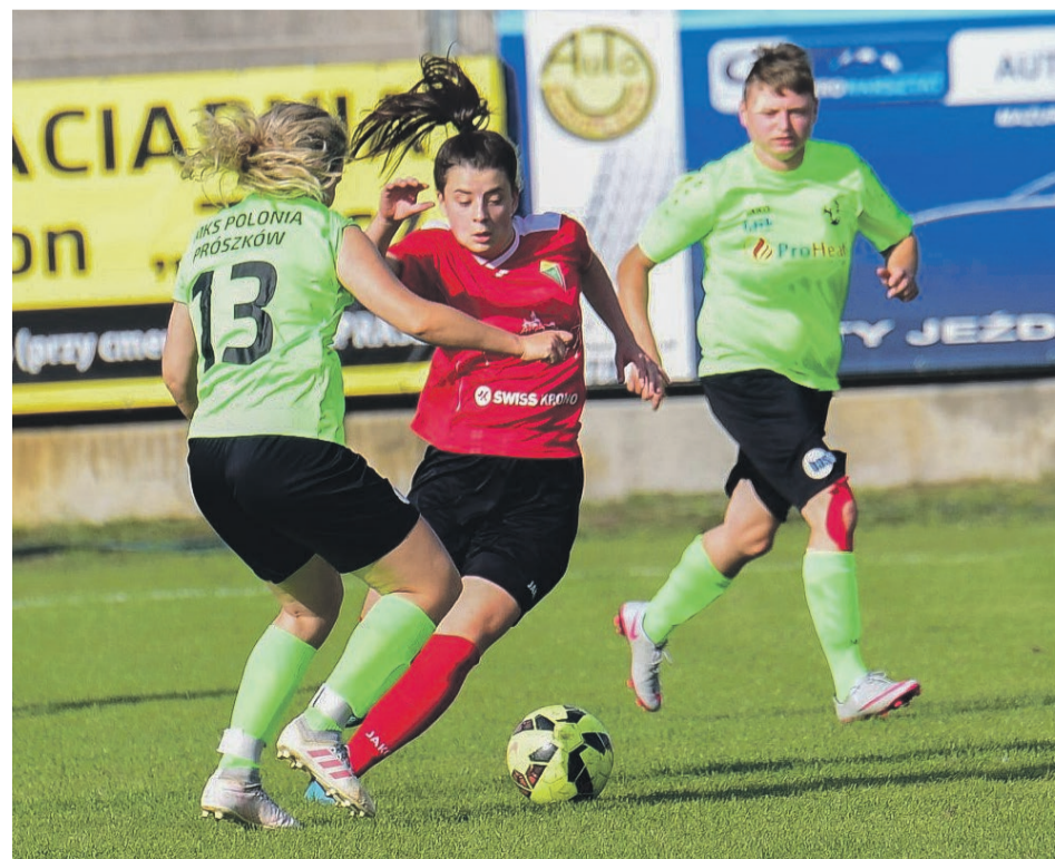
3. liga kobiet