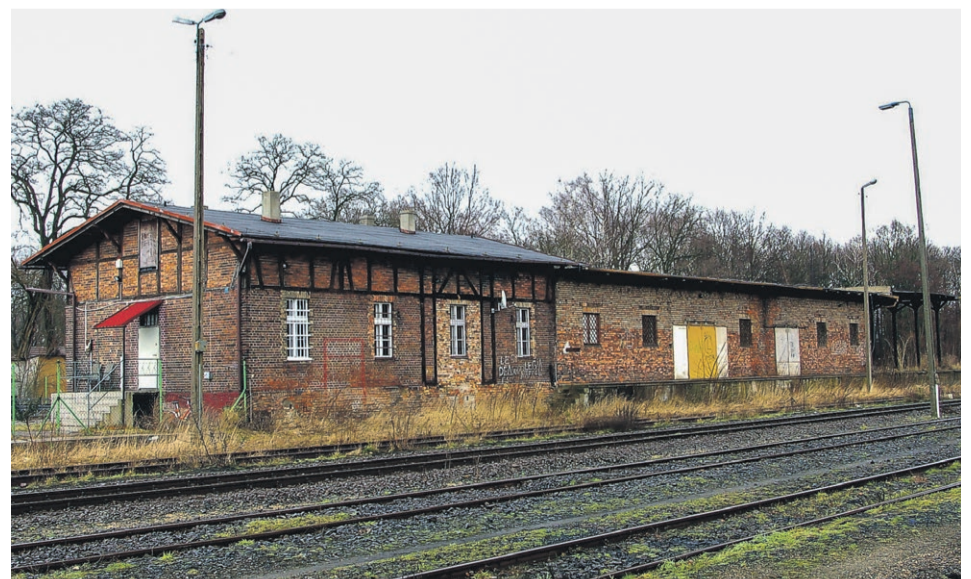
Budynek ekspedycji towarowej (styczeń 2009 r.)