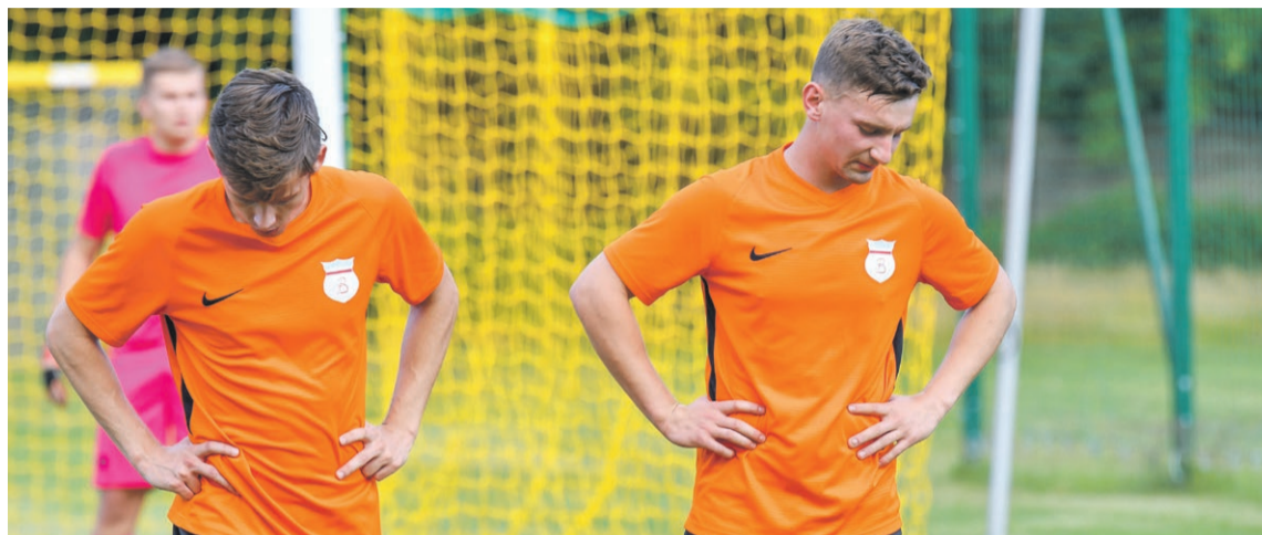
Lech Sulechów 1:4 Budowlani Lubsko

Przyjezdni od pierwszego gwizdka Macieja Domagały narzucili sulechowianom swoje tempo gry i ostry pressing, czym chcieli zmusić gospodarzy do popełnienia błędów w defensywie. Udało się już w 10. min. spotkania, gdy to po prostopadłym podaniu piłkę, z zimną krwią, wpakował do siatki