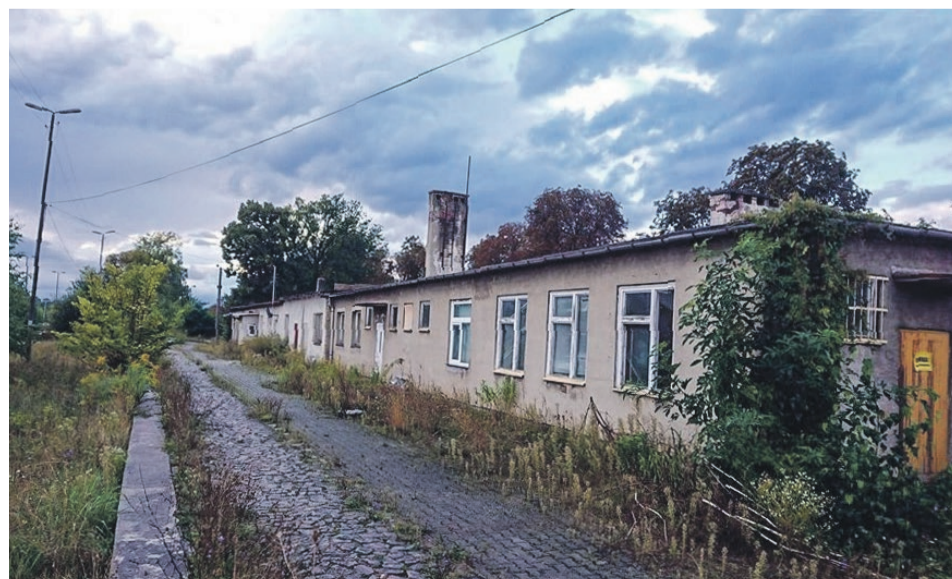
Podupadający budynek dawnych odpraw celnych w Tuplicach (lato 2020 r.)