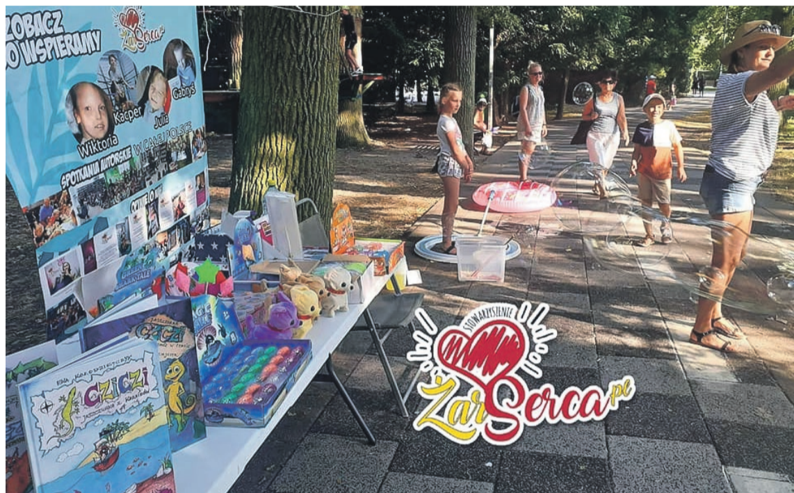
Kupując książeczkę, pomagasz chorym dzieciom