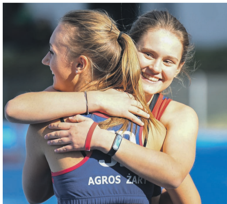
fot. Małgorzata Fudali Hakman