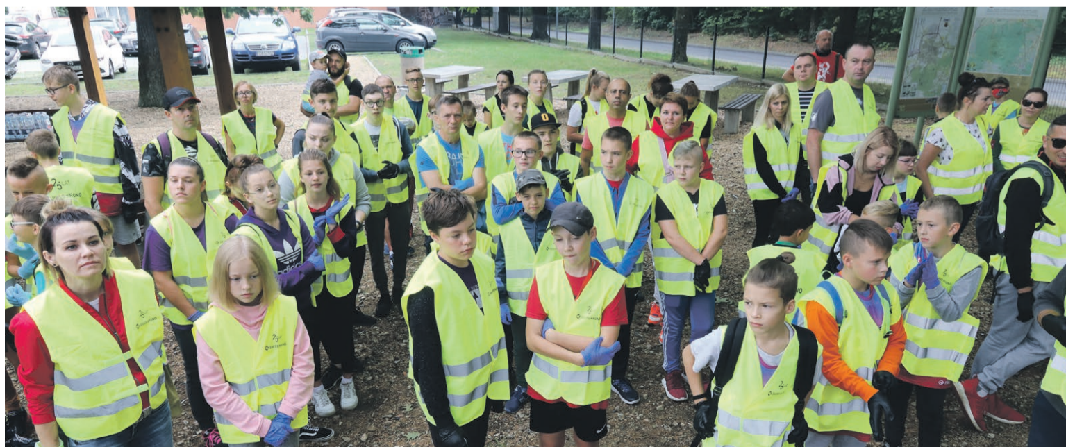
Młodzi i starsi przyszli sprzątać las

Z roku na rok akcja budzi coraz większe zainteresowanie. Dołączają się kolejne kluby sportowe, ale nie tylko. Przychodzą również rodziny z dziećmi. Wszyscy, którym zależy, aby żyć i przebywać w czystym otoczeniu. Również w lesie, z którego w celach rekreacyjnych korzysta mnóstwo osób. ATB