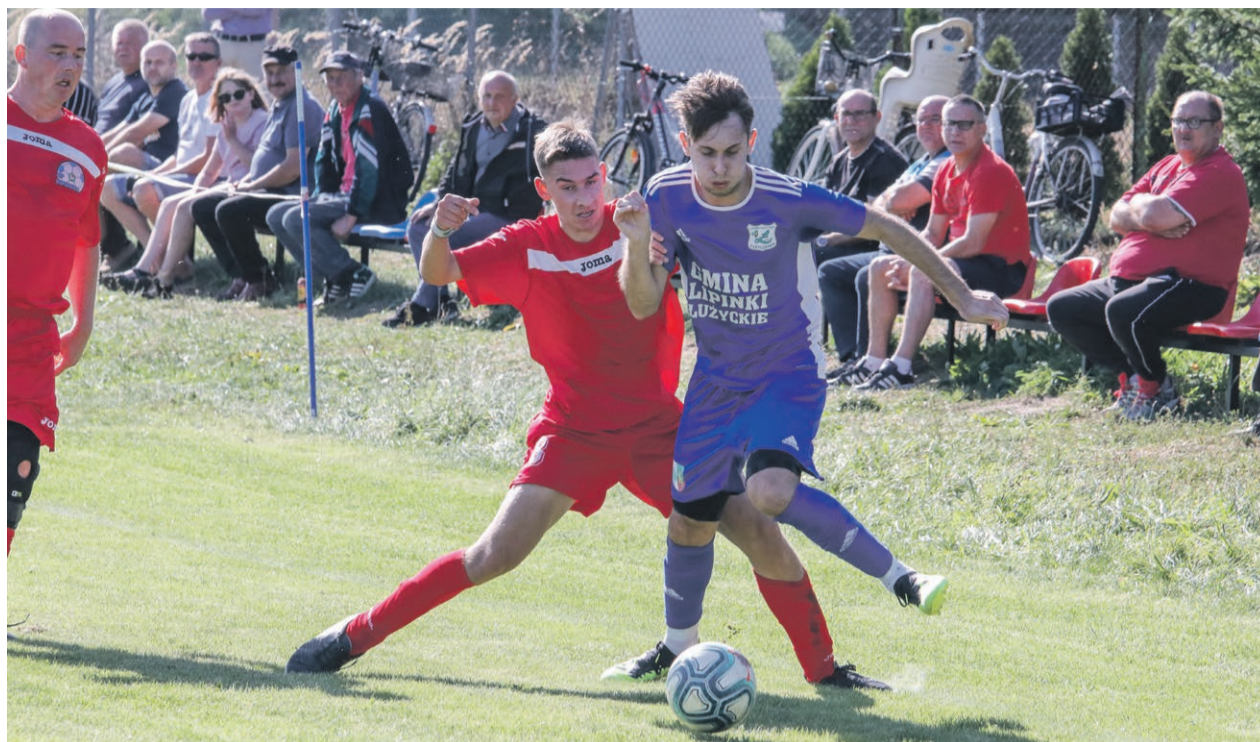
Klasa A - grupa 4