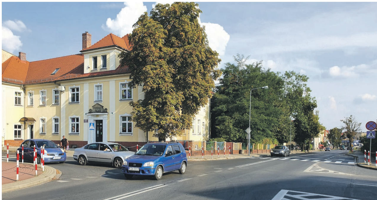
Przebudowa ul. Artylerzystów zaplanowana jest na 2022 rok

ŻARY Starostwo szykuje się do przebudowy drogi powiatowej - ulicy Artylerzystów oraz zmiany rodzaju skrzyżowania ulic Lotników, Artylerzystów i Broni Panczernej na rondo.