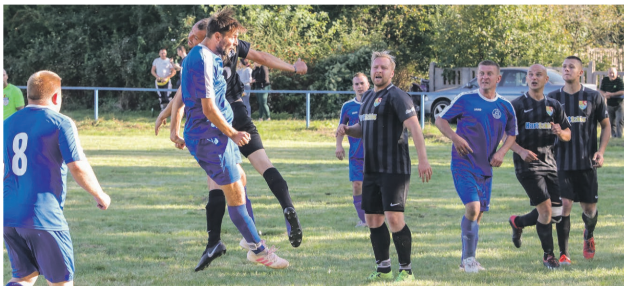
Żary - Klasa B