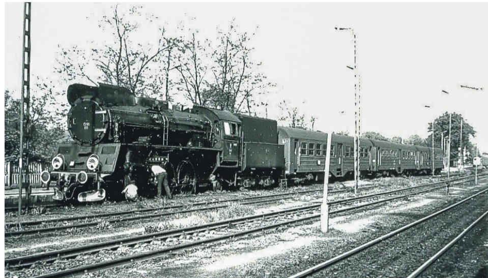
Żagańska O149-68 z pociągiem osobowym relacji Tuplice-Głogów przygotowywana do odjazdu ze stacji początkowej (11 maja 1990 r.)

POWIAT ŻARSKI W dekadzie lat 80. w systemie pasażerskiego ruchu regionalnego nie zwiększono już ilości połączeń w porównaniu do poprzedniej dekady, ale uwidoczniły się wyraźne tendencje do wydłużania relacji niektórych pociągów kursujących po linii nr 14 z lub przez Tuplice.