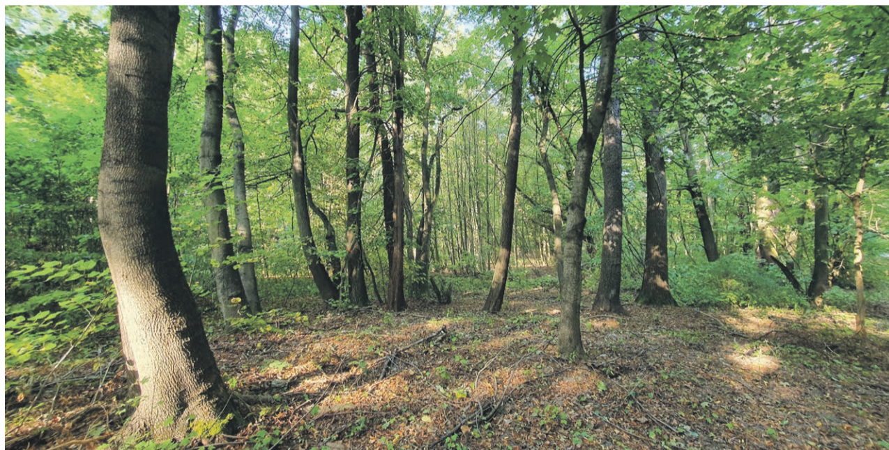
Lasek przy ul. Kaszubskiej zmieni się w zielony teren dydaktyczno-rekreacyjny