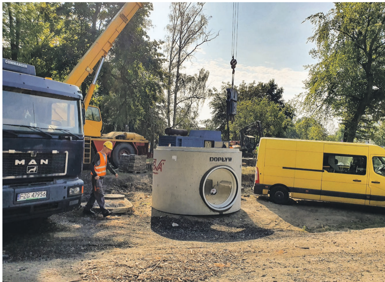
Ciężki sprzęt znów pracuje na ul. Zielonogórskiej

Po przeszło dwóch miesiącach przerwy, wykonawca wrócił na plac budowy. Prace znów idą pełną parą.