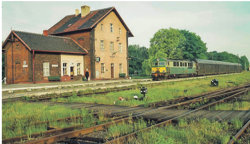
Żagański spalinowóz SU46-047 z zestawem „bipy” oczekuje na odjazd do Żagania z toru nr 20 przy peronie 1 (1998 r.)

Już po roku ilość par zmniejszono do dwóch, aczkolwiek począwszy od maja 1993 r. na trasach wychodzących z Tuplic zaplanowano eksploatację „srebr-