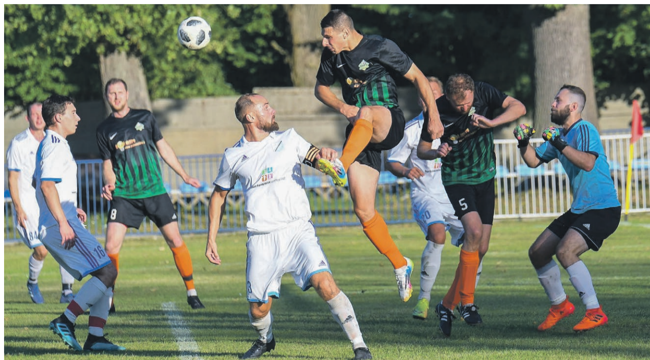
Zielonogórska klasa okręgowa