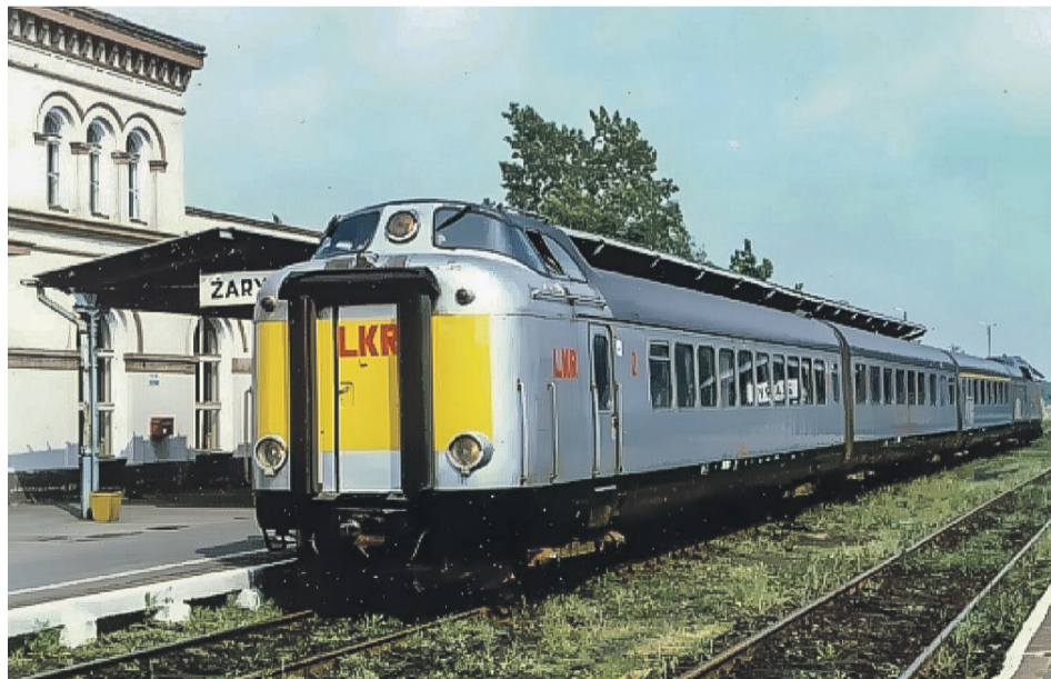
Premierowy start popołudniowego pociągu Lubuskich Kolei Regionalnych relacji Żary - Tuplice - Łęknica ze stacji początkowej (maj 1993 r.)