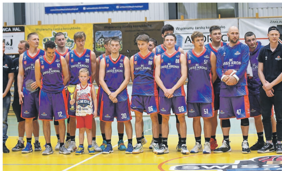
Gospodarze zwycięzcami turnieju w Żarach