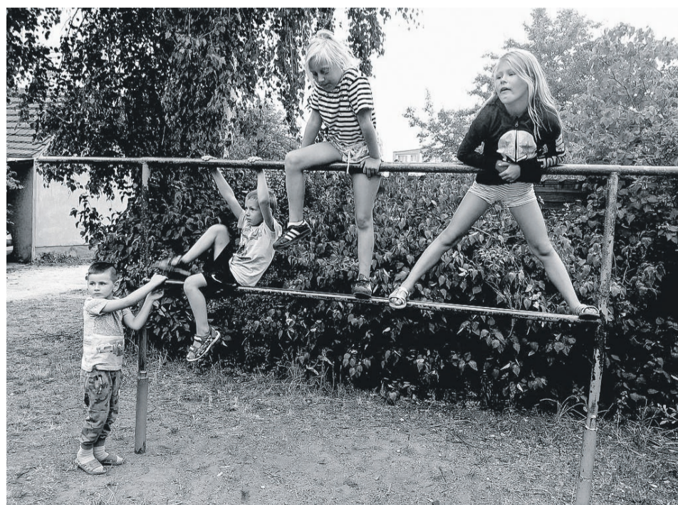
Jedna z nagrodzonych fotografii

Fotografie zakwalifikowane do wystawy można obejrzeć na deptaku przed Salonem Wystaw Artystycznych. ATB