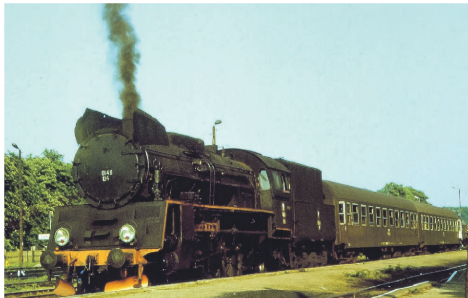
Pociąg osobowy z Tuplic do Lubuska prowadzony przez O149-104, oczekuje na odjazd z toru nr 18 przy peronie 2. (maj 1988 r.)