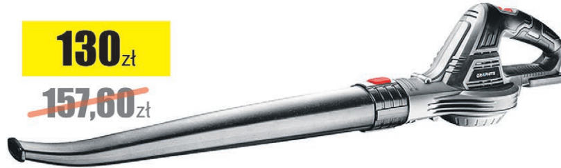
Dmuchała do liści akumulatorowa Energy+18V (bez akumulatora)