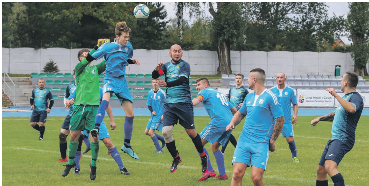
Żarska klasa B