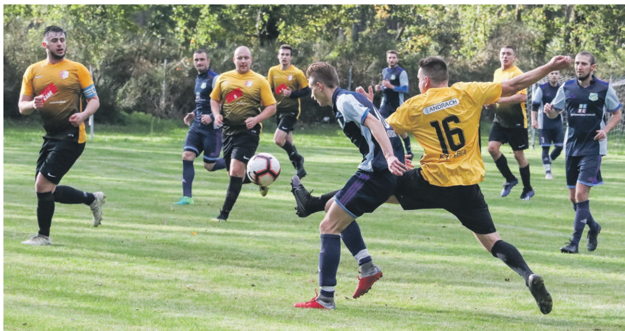
Zielonogórska klasa okręgowa