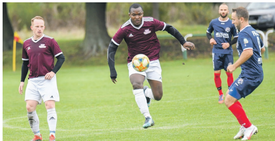
PIŁKA NOŻNA Po ostatniej kolejce ŁKS Łęknica liderem okręgowki

Więcej relacji sportowych w internecie na stronie