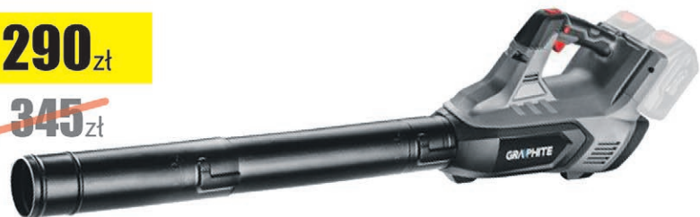
Dmuchała do liści akumulatorowa Energy +36V (bez akumulatora)