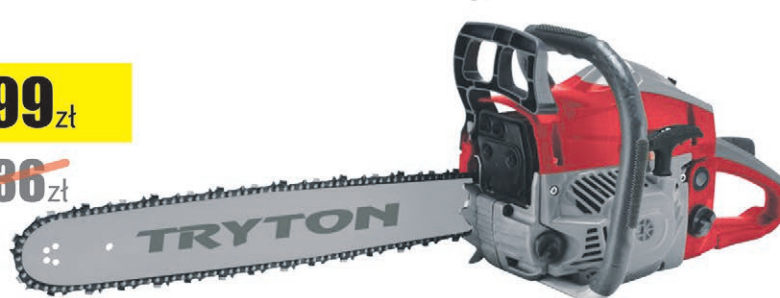
Pilarka łańcuchowa spalinowa 1.9KW TOR4945S Tryton