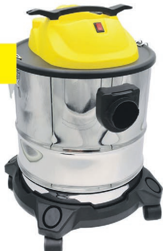
Odkurzacz do popiołu 20L 1600W z otrząsywaczem filtra