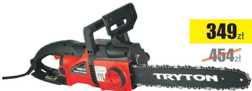
Pilarka łańcuchowa 2400W TOC40242 Tryton