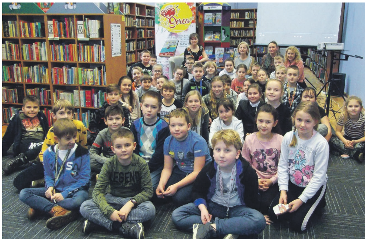
Spotkanie w bibliotece z autorką przygód jaszczurki Cziczi