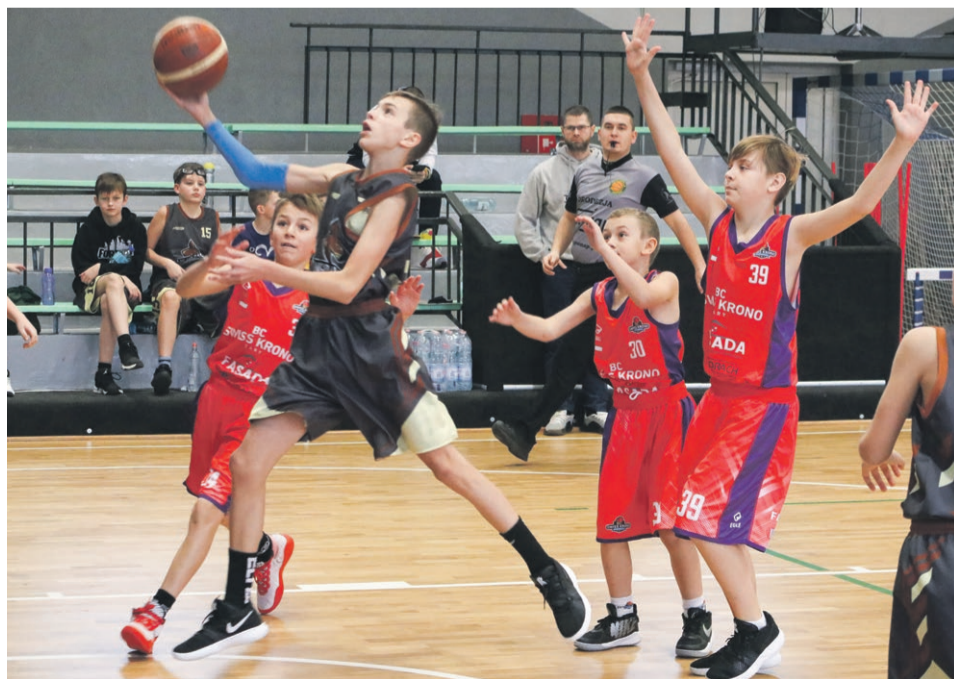
KOSZYKÓWKA 18 stycznia w Żarach drużyna BC Swiss Krono rozegrała dwa spotkania w ramach Lubuskiej Ligi Mini Kosza U12. Obydwa wygrała - z Kango II Gorzów 77:43, natomiast z Kango Gorzów 71:41