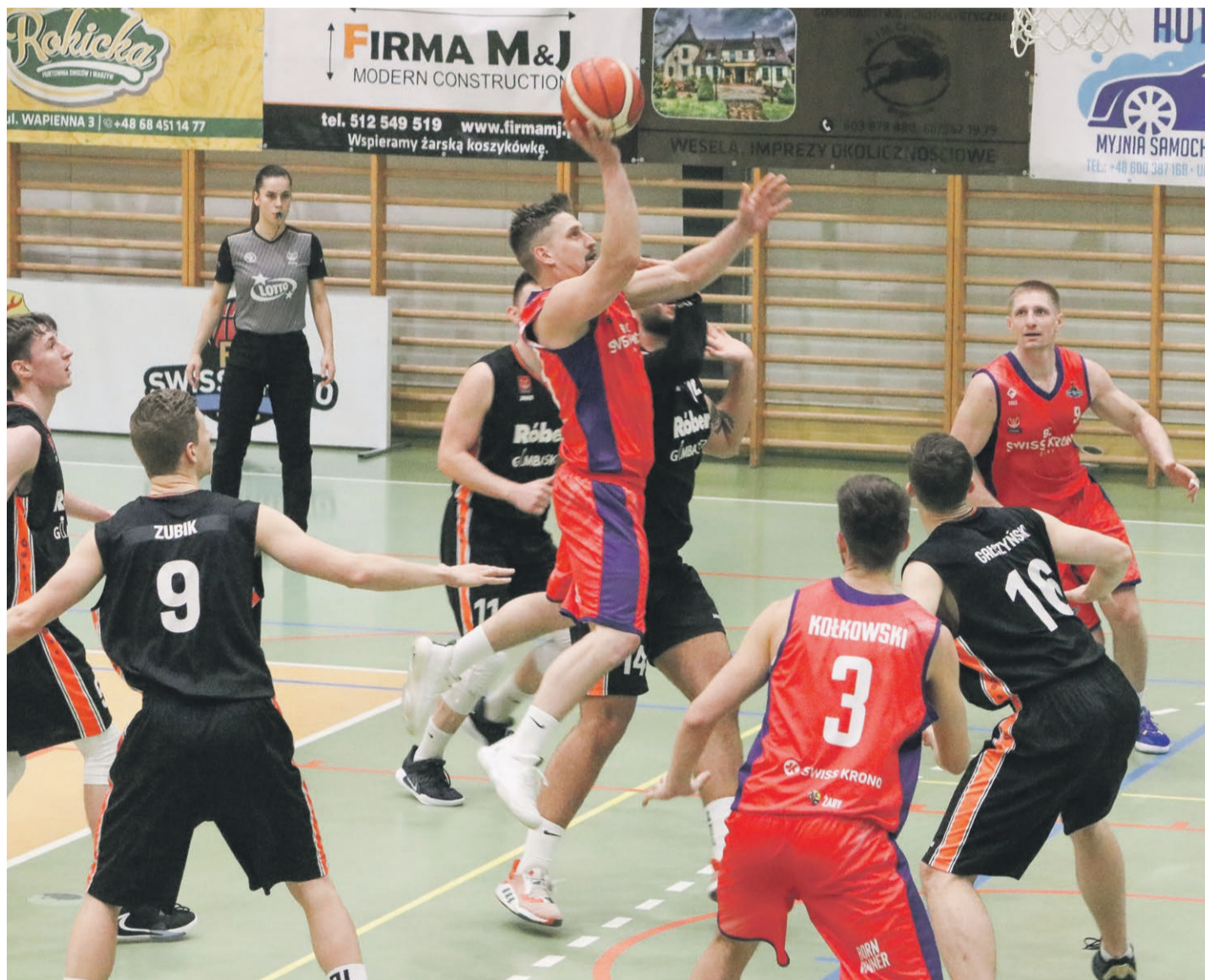
Na własnym parkiecie nie przegrali ani razu

Widać, że koszykarze BC Swiss Krono próbowali zniwelować nieco ten niekorzystny rezultat. Trochę się to udało, ale nie do końca. Tym samym obecny bilans to 13. zwycięstw oraz 4 porażki. ATB