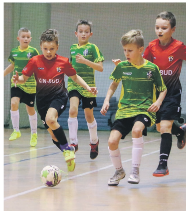
UKS Promień 2011 - Mundial Żary 5:4 fot. Andrzej Buczyński

13:00 Wybrzeże Klatki Schodowej - Magicy 13:50 ŻKSW - ZZO Marszów 14:40 Tiki Taka - Mirostowiczanka 15:30 Endorfina & Brunetka - Hart Szkło 16:20 Yakotakokiwa - Crips 17:10 Hooligans - Libero 18:00 ŁKS Łęknica - Red Devils Katalonia 18:50 MMalu - Kaczy Team