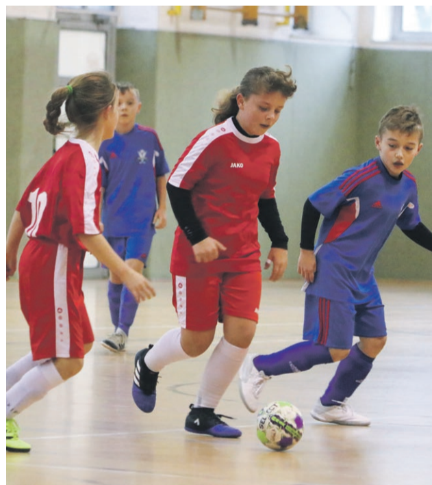
Promień Women - UKS Victoria Jasień 2:14