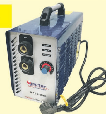
Spawarka inwertorowa VECTOR 160A