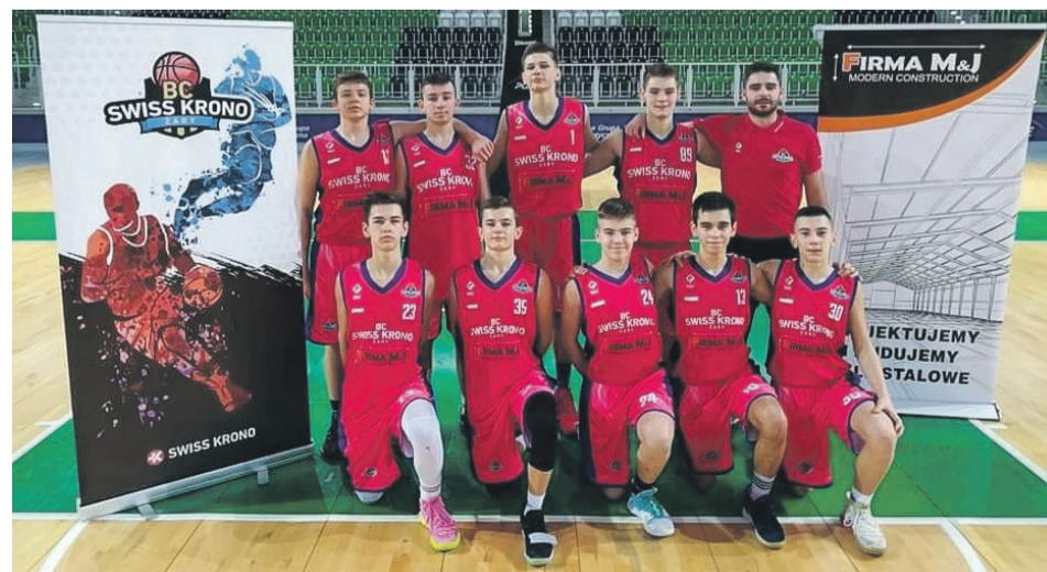
KOSZYKÓWKA Zawodnicy BC Swiss Krono Żary w kategorii wiekowej U16 rozegrali mecz wyjazdowy z PGE Turów Zgorzelec. Wygrali gospodarze 85:48