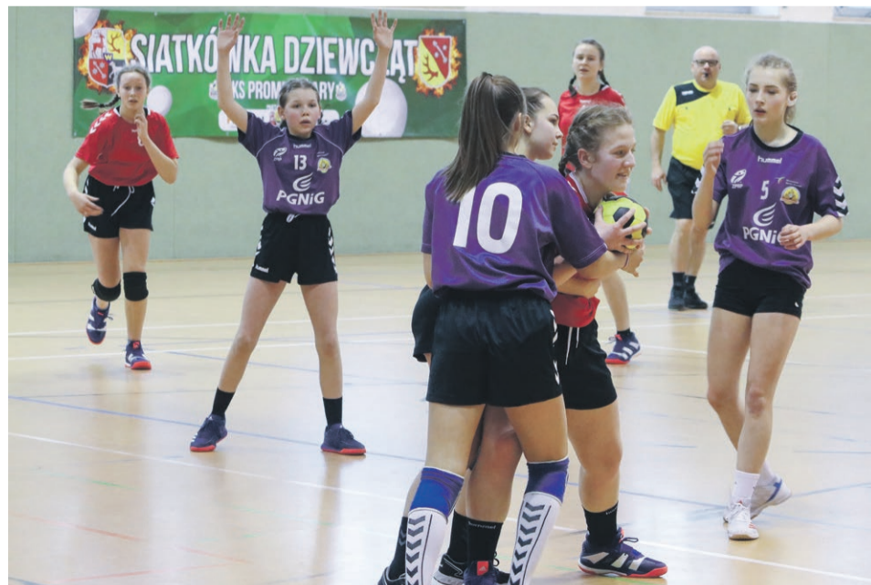
PIĘKA RĘCZNA MKS Sokół Żary 14:26 GMTS Sparta Gubin