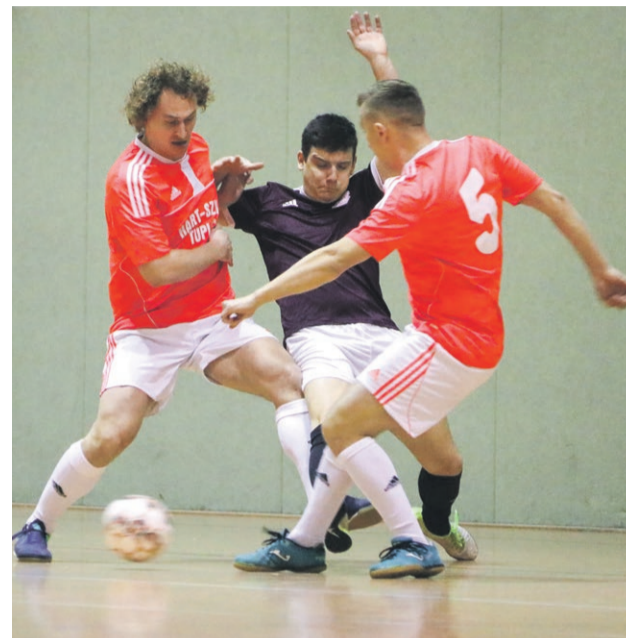
ŁKS Łęknica - Hart Szkło 3:7

Crips - ŻKSW 4:2 ZZO Marszów - Wybrzeże Klatki Schodowej 2:3 MMalu - Magicy 2:1 Mirostowiczanka - Endorfina & Brunetka 0:5 Kaczy Team - Yakotakokiwa 1:5 Red Devils Katalonia - Libero 6:2 ŁKS Łęknica - Hart Szkło 3:7 Tiki Taka - Hooligans 2:3