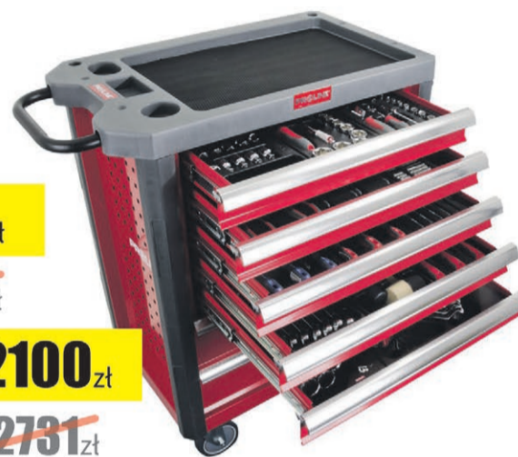
Szafka narzędziowa, 7 szuflad, z wyposażeniem 211szt. Proline