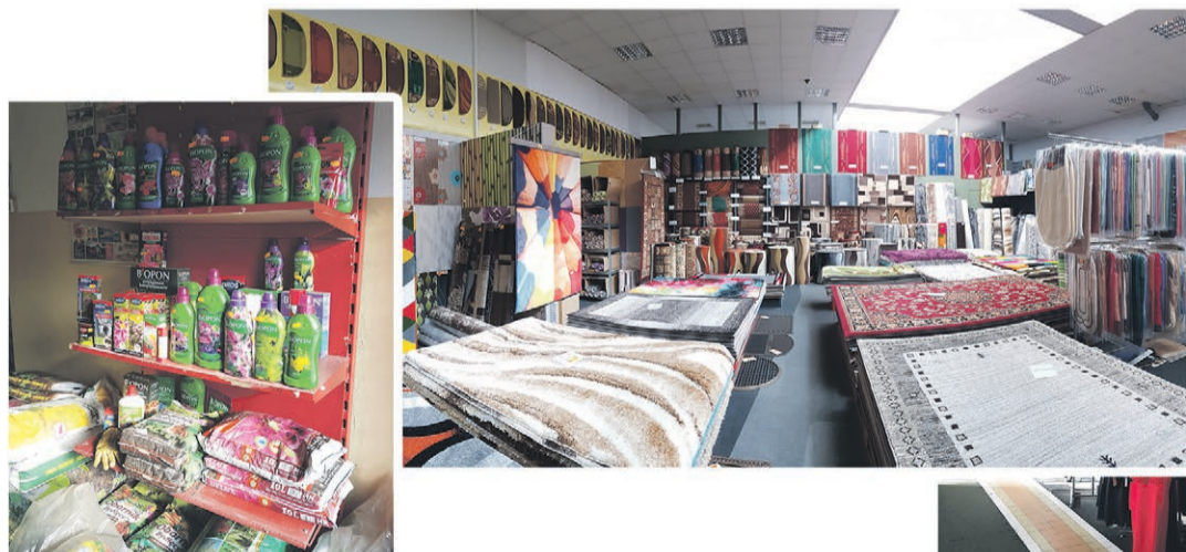
SKLEP LUBCENAS NAWOZY, NASIONA, PASZE TEL. 68 363 97 23