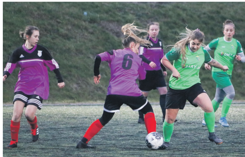
PIĘKA NOŻNA Piłkarki Promienia Żary i Budowlanych Lubsko rozegrały mecz, który był okazją do zbiórki na rzecz chorego Cypriana. Zebrano 740 zł, a spotkanie wygrały żaranki 7:2