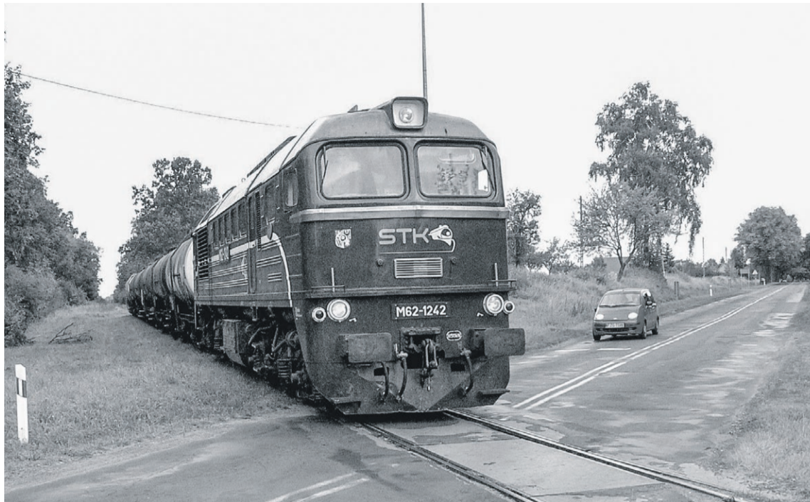
"Gagarin" przerobiony przez prywatnego przewoźnika na lokomotywę M62 z zestawem cystern z lubskiego Horexu pokonuje przejazd w okolicy Budziechowa; wrzesień 2009r. Do tego miejsca sięgał kiedyś najdłuższy tor wyciągowy (po lewej od toru szlakowego) lubskiego węzła.

gając wszystkie bocznicę na odcinku do Nowej Roli. Zaczynano od podstawienia 4-5 wagonów z węglem brunatnym na bocznicę cegielni Budych, wychodzącą na wysokości dawnego przystanku osobowego w Budziechowie. W razie potrzeb wstawiono też puste wagony na cegły na bocznicę ceramiczną wchodzącą bezpośrednio przez bramę zakładu od strony ul. Transportowej. Następnie pociąg obsługiwał tor ładunkowy cegielni w Glince Górnej i jechał dalej bezpośrednio już do Nowej Roli, gdzie podstawiano wagony do składu drewna oraz wypychano wagony z węglem lub miałem na prowadzącą pod górę bocznicę do cegielni Drzeniów. W drodze powrotnej zabierano puste wagony (ewentualnie z cegłą), a następnie łączono je ze składem z drewnem sformowanym w Nowej Roli, do którego zbierano kolejne wagony z bocznic już z terenu Lubska. W zależności o której godzinie kolejarze dotarli z pociągiem bocznicy na stację macierzystą, to odstawiono go na tor boczny lub rozpoczynano się manewry związane z formowaniem powrotnego pociągu zbiorowego do Żagania.