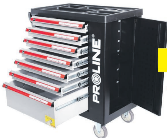
Szafka narzędziowa, 7 szuflad Proline