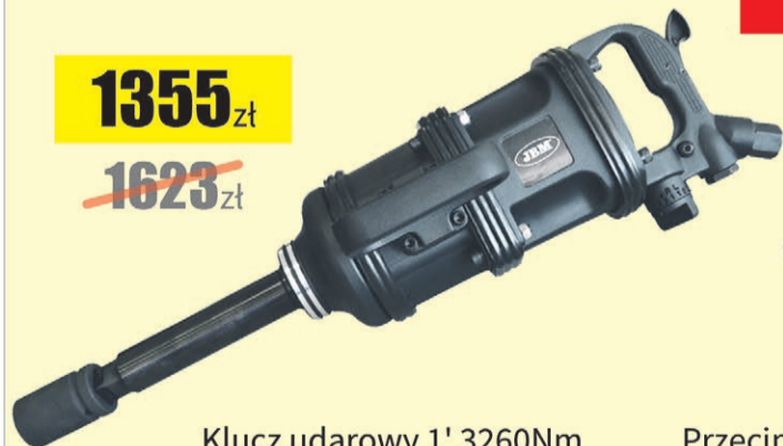
Klucz udarowy 1' 3260Nm Condor Tools