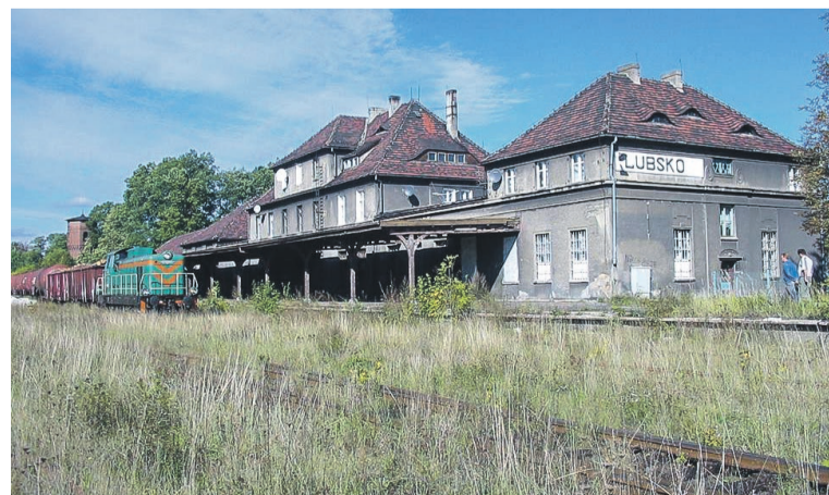
Pejzaż lubskiej stacji na początku XXIw. Przy peronach 2 i 3 nie ma już wiat, a pociągi zdawczo-odbiorcze do tej prężnej kiedyś stacji zaglądają przeważnie raz, dwa razy w tygodniu.

U progu nowego stulecia pociągi towarowe do Lubska docierały już tylko kilka razy w miesiącu, obsługując dwa składy węgla koło dworca i bazę paliw płynnych powstałą na terenie byłej cegielni Mierków. Przewozy realizowano bardzo rzadko na zasadzie tradycyjnych umów handlowych wykonywanych przez PKP lub tzw. umów komercyjnych realizowanych przez prywatnych przewoźników. Z powodów czysto handlowych, jak zmniejszenie popytu na węgiel, fatalnego stanu technicznego torów, a także wysokich cen usługi transportowej i jednocześnie długiego czasu jej realizacji, w połowie trwającej dekady całkowicie zrezygnowano z kolejowych przewozów towarowych do Lubska. Bocznicę do bazy Horexu jest w wielu miejscach zasypana i nieprzejezdna, zaś tor dojazdowy nr 110, który jako jedyny umożliwiał dojechanie pociągiem do placów składowych przy dworcu towarowym, jest już przecięty i pewnie przygotowany do kradzieży. (cdn.)