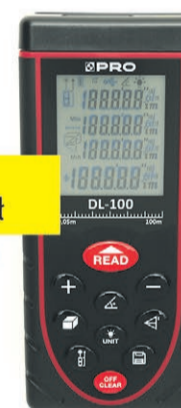
Dalmierz laserowy DL-100 PRO