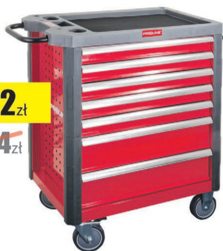
Szafka narzędziowa, 7 szuflad Proline