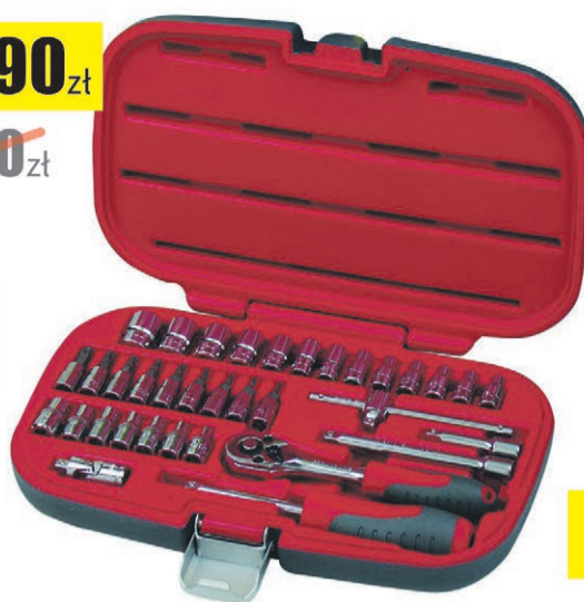
Zestaw 35szt.nasadek i końcówek 1/4" PROLINE