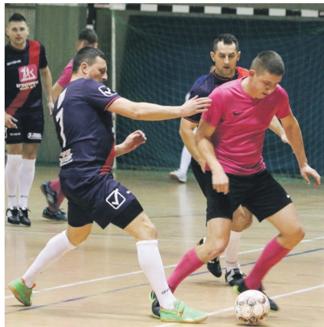
Mirostowiczanka - Endorfina & Brunetka 0:5