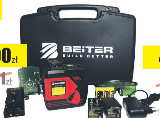
Laser krzyżowy Beiter zielony BART-3DG