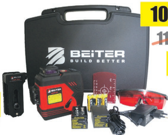
Laser krzyżowy LK-1VH PRO