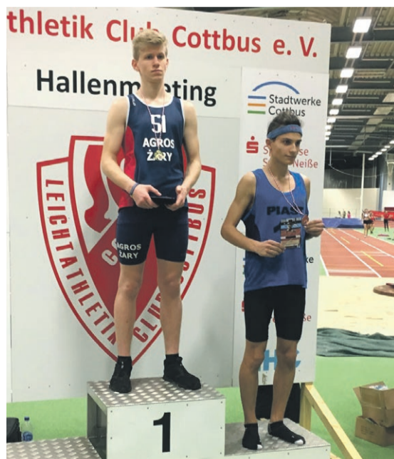
fol. Agros Żary

LEKKOATLETYKA Reprezentanci żarskiego Agrosu wzięli udział w dziesiątej edycji polsko-niemieckiego mityngu halowego w Cottbus.