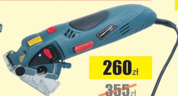
Przecinarka wielofunkcyjna 500W 54.8mm Tryton